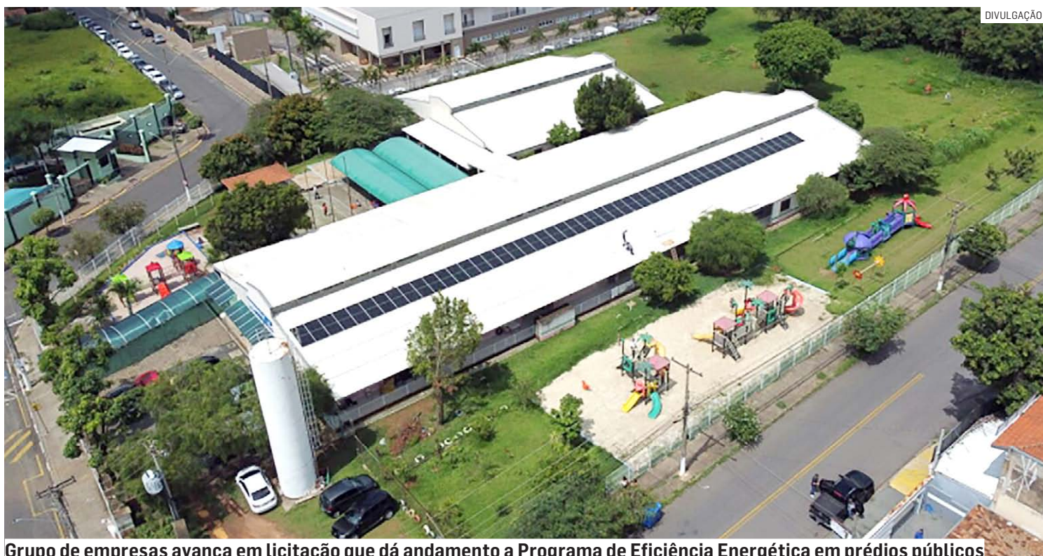
Grupo de empresas avança em licitação que dá andamento a Programa de Eficiência Energética em prédios públicos

Em dezembro, a Prefeitura informou a instalação de usinas fotovoltaicas em prédios públicos, como nas EMEFs (Escolas Municipais de Ensino Fundamental) Caio Fernando Gomes