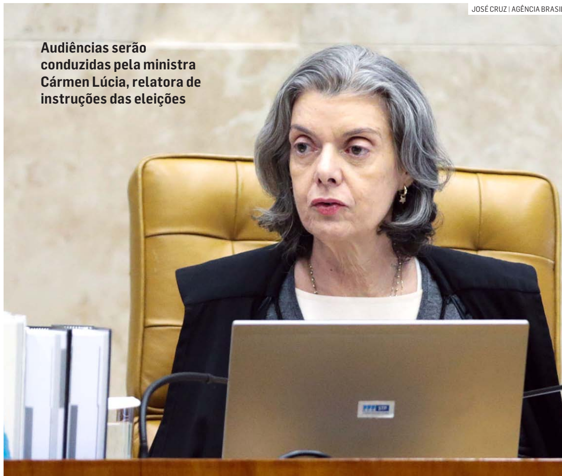
Audiências serão conduzidas pela ministra Cármen Lúcia, relatora de instruções das eleições

Entre as novidades estão a inclusão do artigo 9º-B, que traz a obrigatoriedade de informar explicitamente