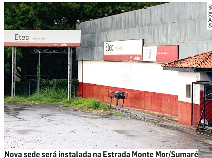
Nova sede será instalada na Estrada Monte Mor/Sumaré

Detalhes do projeto incluem salas de aula, laboratórios especializados (informática, ciência e eventos), uma Sala de Integração Criativa equipada com