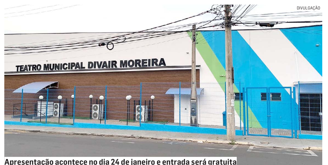
Apresentação acontece no dia 24 de janeiro e entrada será gratuita

Da Redação • NOVA ODESSA tribunaliberal@tribunaliberal.com.br