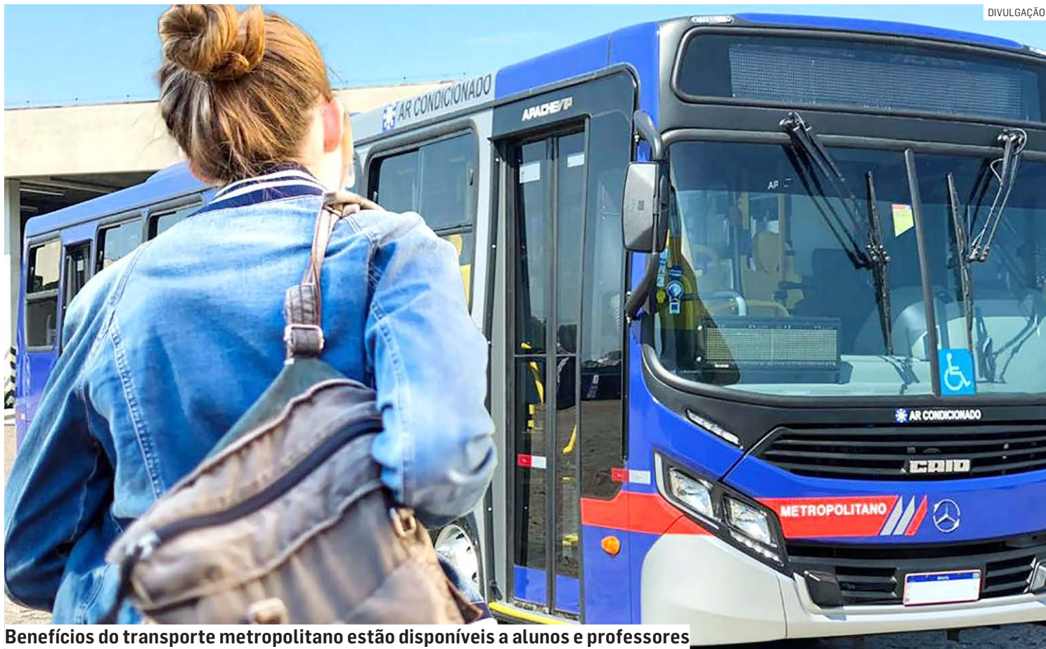
Benefícios do transporte metropolitano estão disponíveis a alunos e professores

Para quem está em situação de baixa renda, o preenchimento e envio da documentação também ficou mais objetivo, pois o envio das comprovações será por integrante familiar. O valor da taxa é R$ 26,60.