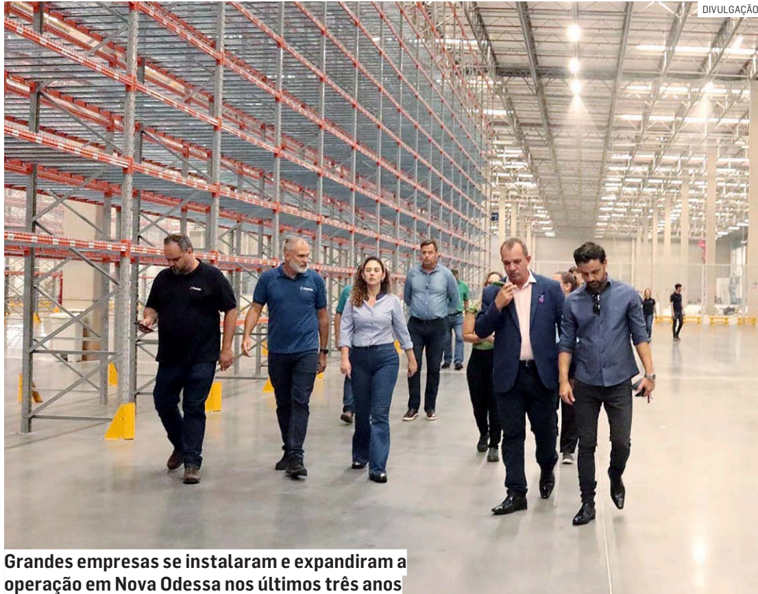
Grandes empresas se instalaram e expandiram a operação em Nova Odessa nos últimos três anos

Entre 2021 e 2023, foi anunciada a chegada do Centro de Distribuição do Grupo SC - dono das marcas Panpharma, Santa Cruz Distribuidora e Oncoprod/SAR e especialista na distribuição de medicamentos e