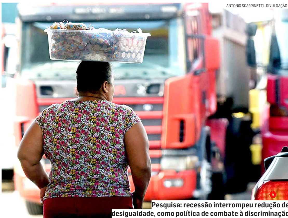
Pesquisa: recessão interrompeu redução de desigualdade, como política de combate à discriminação

De forma geral, o estudo revelou que a recessão de 2015 interrompeu o processo de redução das desigualdades relacionadas a fatores como geração de empregos formais, valorização do salário-mínimo,