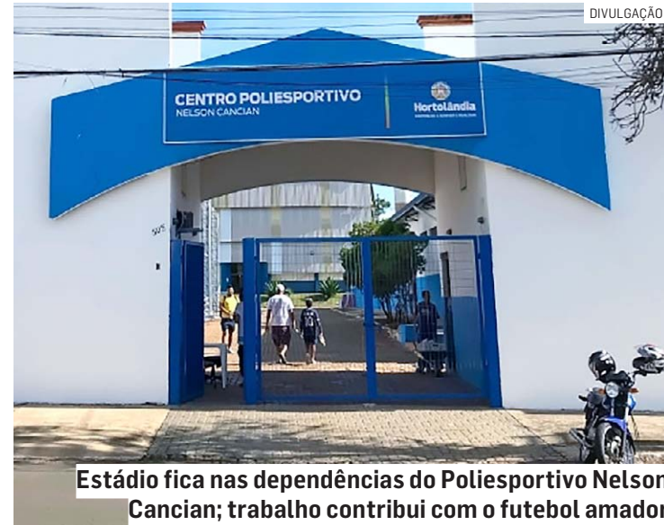
Estádio fica nas dependências do Poliesportivo Nelson Cancian; trabalho contribui com o futebol amador

"Estamos cuidando da estrutura do tão querido Estádio Tico Breda. Este local já é tradição do futebol amador de Hortolândia e, após uma primeira etapa de ações em todo o complexo poliesportivo que contribuiu para a comunidade esportiva, agora, é a vez do campo ganhar novos alambrados, melhorias visuais, melhoria no gramado, além de reforma no vestiário, inclusive nas partes hidráulicas e elétricas, oferecendo mais conforto aos jogadores e para a população. Em breve, teremos uma área to-