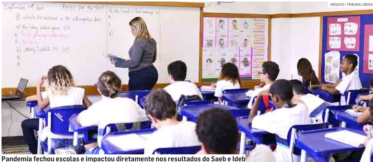
Pandemia fechou escolas e impactou diretamente nos resultados do Saeb e Ideb

O Ideb é o principal indicador da qualidade dos sistemas educacionais brasileiro. Ele é calculado com base nas médias da Prova Brasil e fluxos de aprovação, reprovação e abandono extraídos do Censo Escolar. Nova Odes-