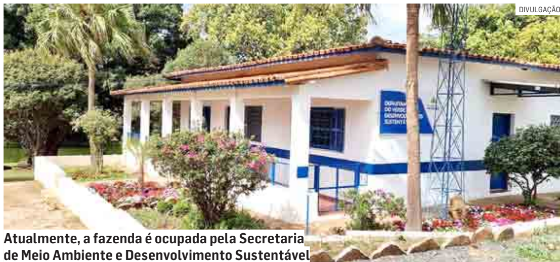
Atualmente, a fazenda é ocupada pela Secretaria de Meio Ambiente e Desenvolvimento Sustentável