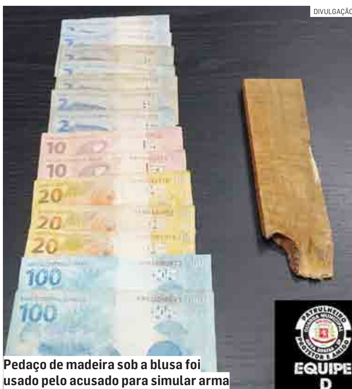
Pedaço de madeira sob a blusa foi usado pelo acusado para simular arma

O acusado recebeu voz de prisão e foi apresentado ao Plantão Policial, onde foi preso em flagrante, ficando à disposição da Justiça.