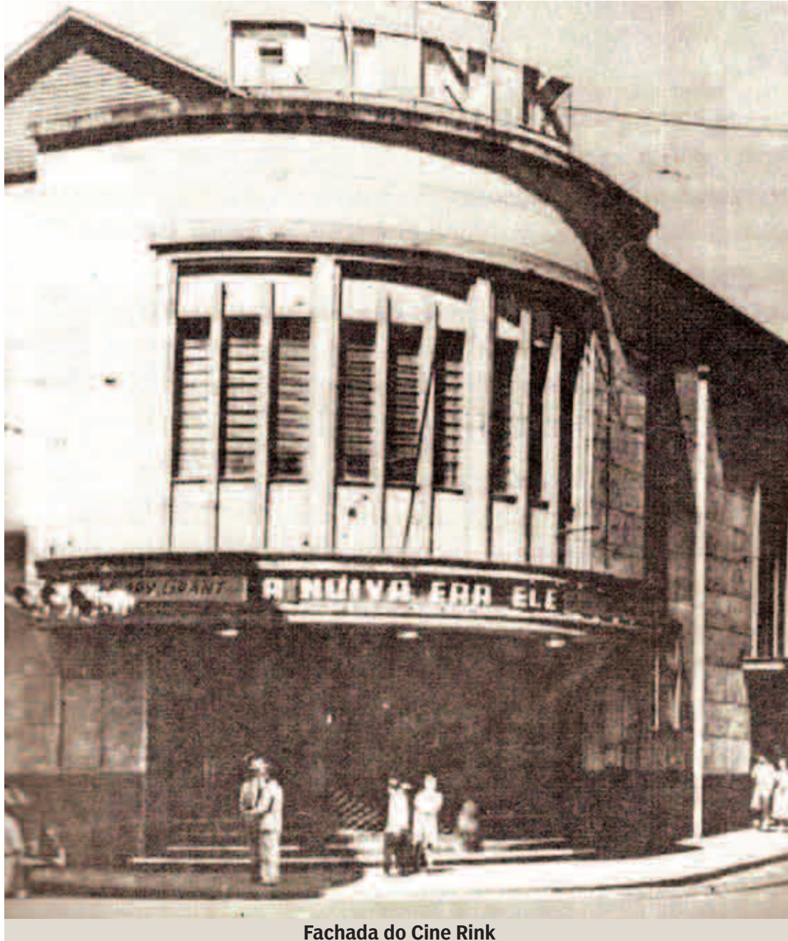
Fachada do Cine Rink

Jornalista, Escritora e Colaboradora da Associação Pró-Memória