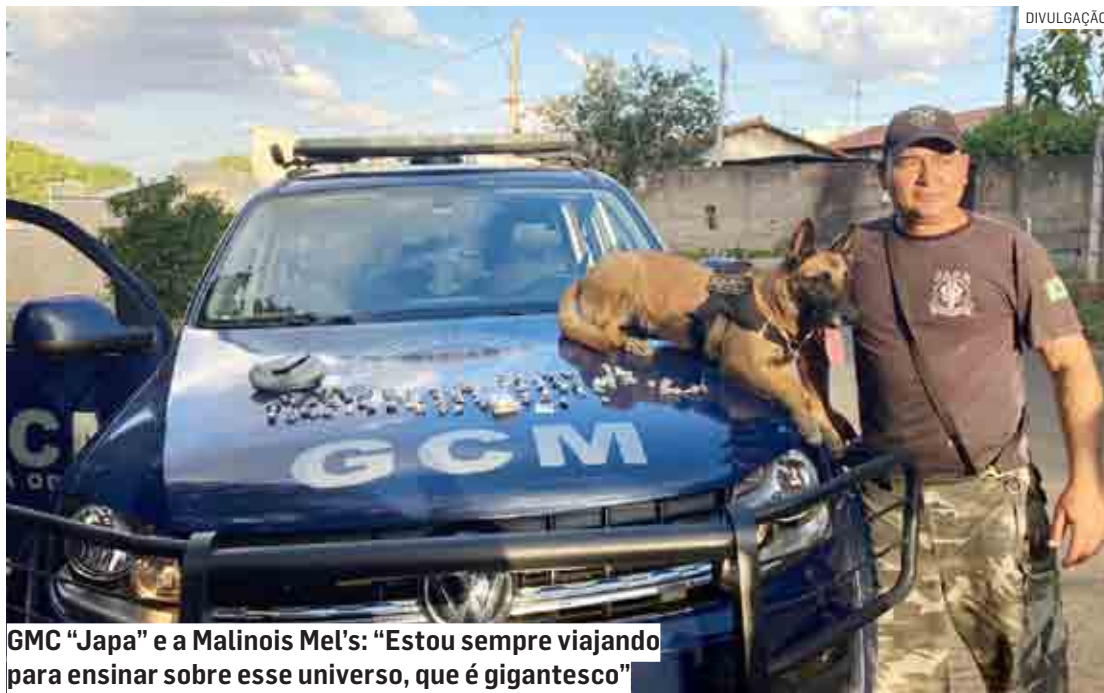
GMC "Japa" e a Malinois Mel's: "Estou sempre viajando para ensinar sobre esse universo, que é gigantesco"

Ele também já tinha montado um centro de treinamento em Nova Odessa, onde realizou diversos cursos, seminários e inclusive um torneio que juntou 150 competidores e um público de 500 pessoas. Hoje, o "Ja-