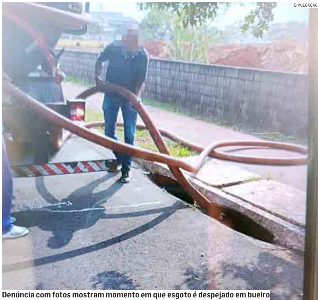
Denúncia com fotos mostram momento em que esgoto é despejado em bueiro

A Secretaria de Meio Ambiente e Desenvolvi-