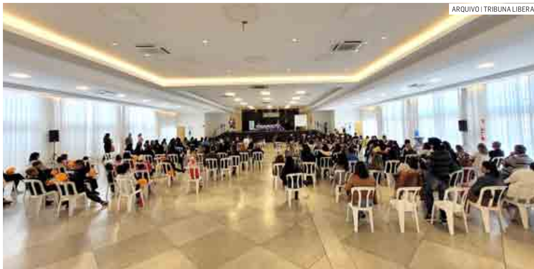
Evento deve reunir mais de 200 profissionais da área da educação no Clube Recreativo

A abertura será realizada por professor es-