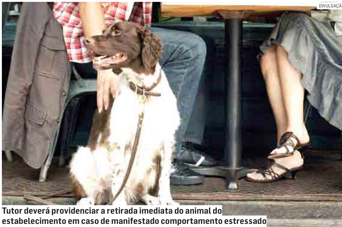
Tutor deverá providenciar a retirada imediata do animal do estabelecimento em caso de manifestado comportamento estressado

Segundo a norma, fica autorizada a presença de animais em comércio do município, que passarão a ser considerados estabelecimentos amigos dos animais. A permissão deverá ser indicada por placas informativas, com as regras para permanência dos bichos no local, que receberão ainda um selo indicando que estão ap-