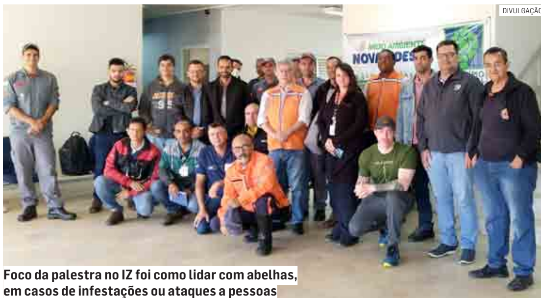
Foco da palestra no IZ foi como lidar com abelhas, em casos de infestações ou ataques a pessoas

O foco da palestra foi como lidar com abelhas, em casos de infestações ou ataques a pessoas. "Abordamos o manejo, como agir no momento de emergência e para quem ligar. No caso, a primeira coisa é isolar a área, e manter distância do enxame, depois chamar os bombeiros militares através do número de telefone, 193. Com isso será contratado um apicultor para retirar as