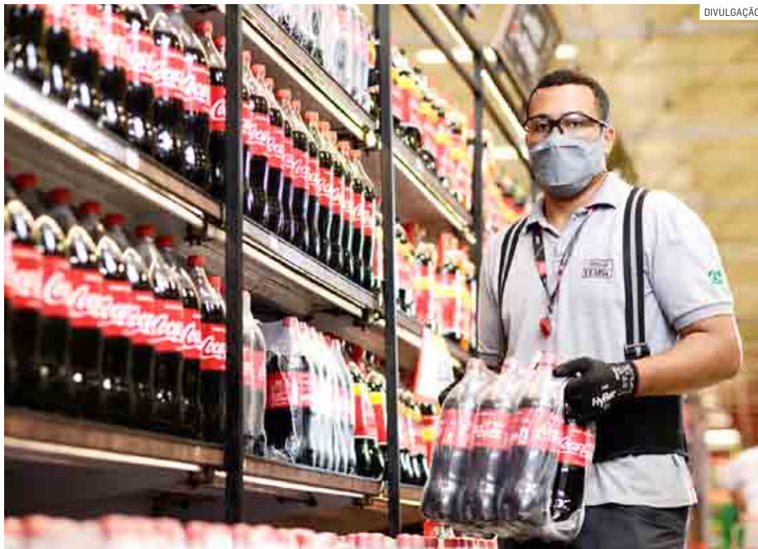
Contratados terão carteira assinada, benefícios e salários compatíveis com os do mercado.