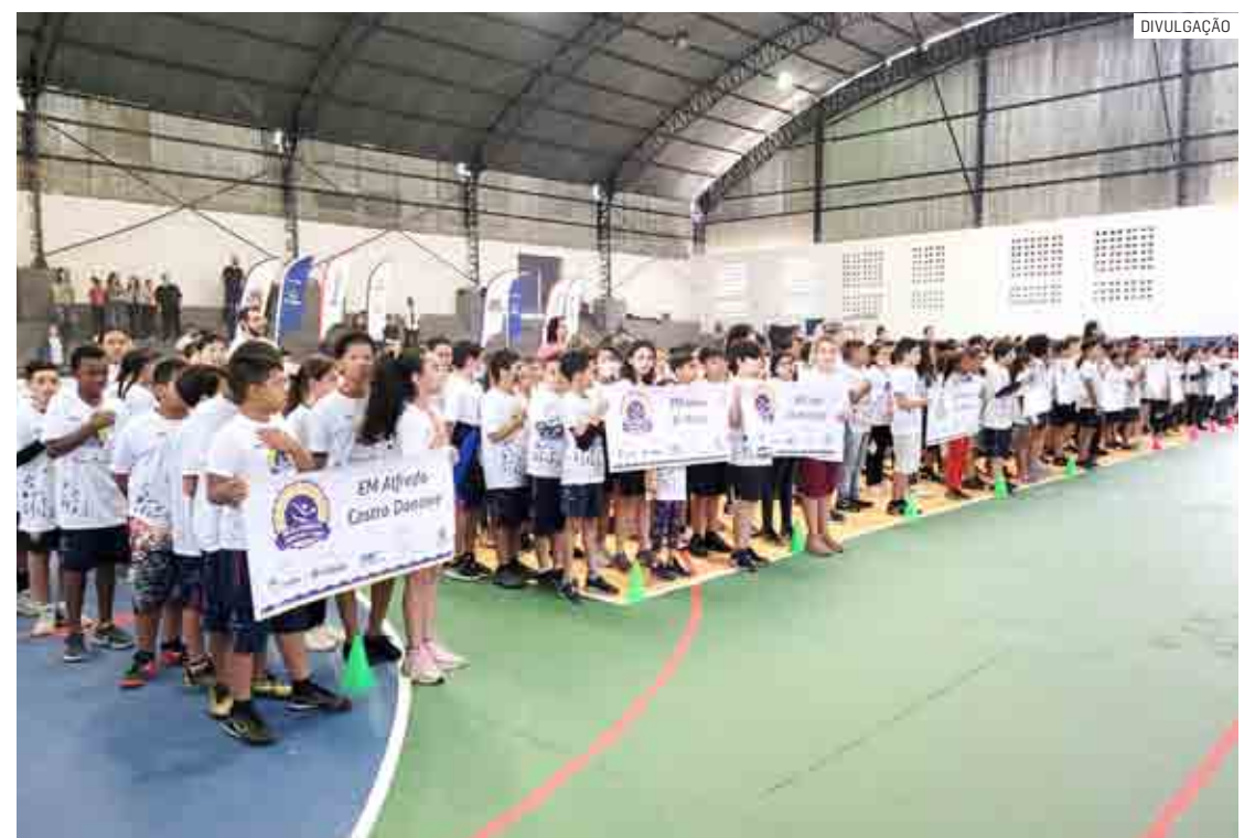
Competições dos Jogos Estudantis acontecem no Centro Esportivo Vereador “José Pereira”

“Este é um evento para estimular a prática de esportes pelos alunos que