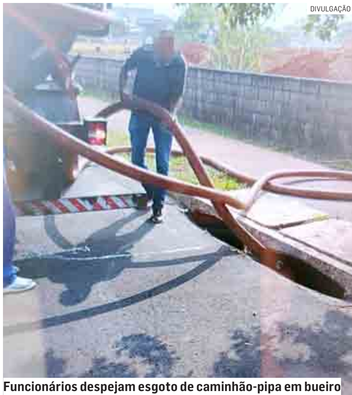
Funcionários despejam esgoto de caminhão-pipa em bueiro

Por meio de uma denúncia, a fiscalização ambiental da Prefeitura de Hortolândia flagrou um despejo irregular de esgoto por uma empresa, na região do Parque Gabriel, nesta semana. A prática é crime ambiental e resultou em emissão de multa no valor de R$ 8.000,00. A Secretaria de Meio Ambiente e Desenvolvimento Sustentável recebeu denúncia anônima com fotos de um caminhão-pipa, adequado para a coleta de esgoto (limpa-fossa), despejando resíduos em um bueiro.