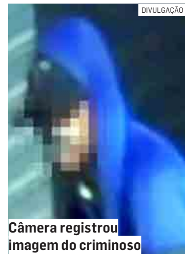
Câmera registrou imagem do criminoso

Parte da ação criminosa foi gravada por câmeras de segurança. Pelas imagens é possível identificar o criminoso saindo do comércio, ele olha para câmera antes de fugir. O assaltante conseguiu arrombar a porta do estabelecimento e invadir a loja. Para não levantar suspeitas, o homem