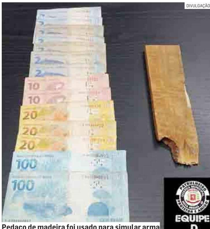
Pedaco de madeira foi usado para simular arma