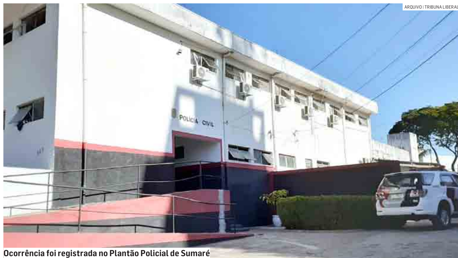
Ocorrência foi registrada no Plantão Policial de Sumaré

A vítima chegou a entrar em um bar para pedir socorro, vestindo apenas cueca e camiseta, mas foi arrastada para o local onde foi morta com pancadas na cabeça; suspeitos continuam foragidos