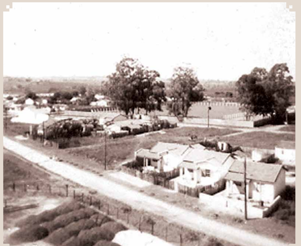
Foto da década de 1960, tirada do alto do castelo d'Água do DAE de Sumaré. Ao fundo, o Estádio Luiz Frutuoso, do Clube Recreativo Sumaré.