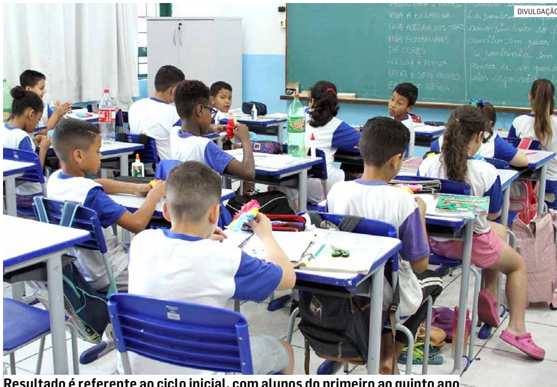
Resultado é referente ao ciclo inicial, com alunos do primeiro ao quinto ano

Na avaliação da Secretaria, Hortolândia registrou um avanço significativo. Entre os programas, as ações e as demais políticas públicas implementadas nas 28 escolas municipais participantes, que contribuíram efetivamente para este resultado, são apontados: os esforços no sentido de contribuir com a