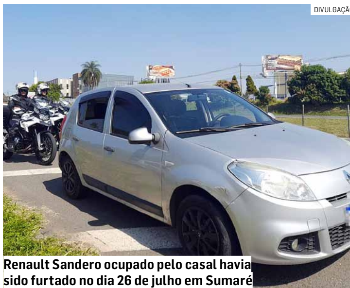
Renault Sandero ocupado pelo casal havia sido furtado no dia 26 de julho em Sumaré

Em Sumaré, um adolescente foi apreendido nesta sexta-feira (16) com um veículo furtado no Jardim Ca-