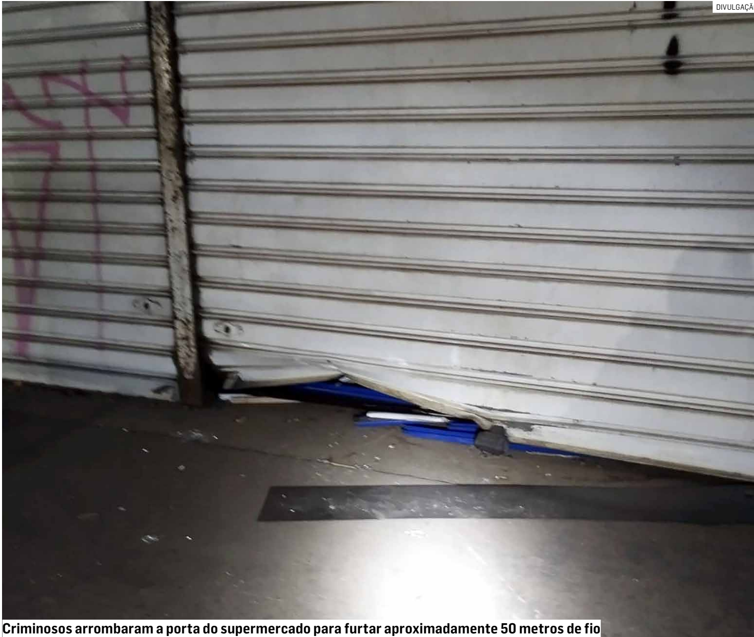
Criminosos arrombaram a porta do supermercado para furtar aproximadamente 50 metros de fio

Dois homens foram presos em flagrante pela equipe da Guarda Civil Municipal, que encontrou uma criança no veículo usado pelos suspeitos