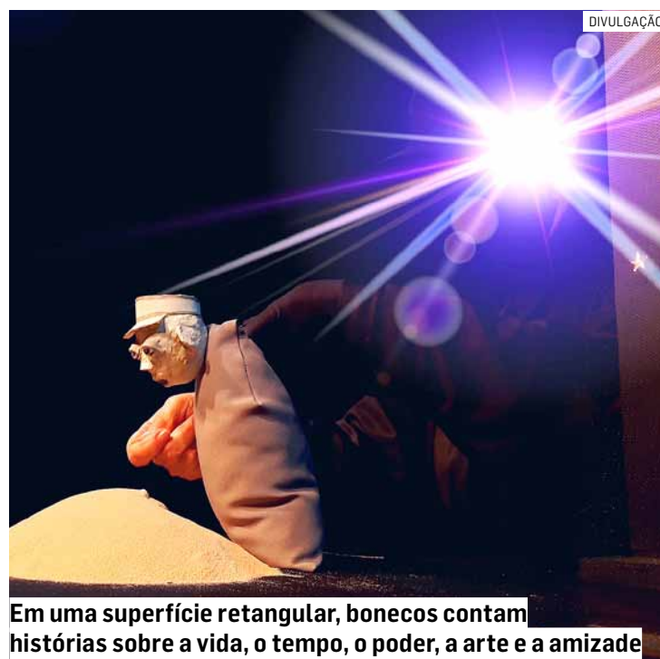
Em uma superfície retangular, bonecos contam histórias sobre a vida, o tempo, o poder, a arte e a amizade

O espetáculo é dividido e interligado por três Contos. O primeiro é o ‘Criação’, no qual uma dupla de bonecos descobre um simpático ser que surge da areia. Em seguida, o conto ‘O artista’, que mostra o impacto da arte de um ar-