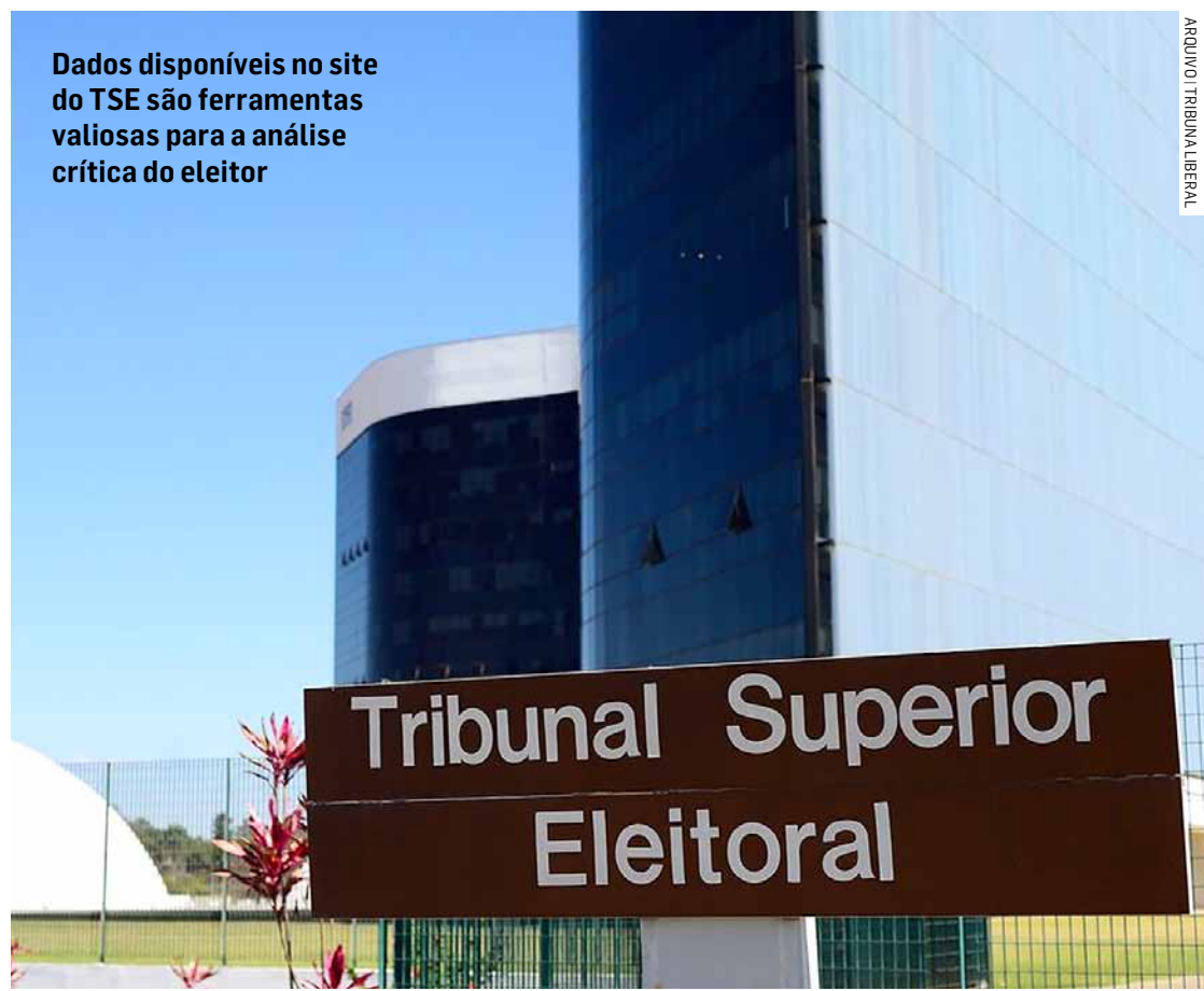
Dados disponíveis no site do TSE são ferramentas valiosas para a análise crítica do eleitor

A declaração de bens dos candidatos é um mecanismo de transparência fundamental no processo eleitoral, permitindo ao eleitorado avaliar o perfil econômico daqueles que almejam cargos públicos.