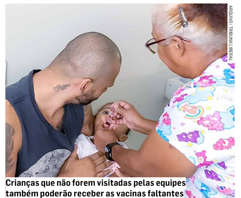
Crianças que não forem visitadas pelas equipes também poderão receber as vacinas faltantes

A ação consistirá em visitas domiciliares pelas equipes das UBSs. Os agentes vão verificar a carteira de vacinação das crianças. Caso elas estejam faltantes com as vacinas contra Poliomielite, Sarampo ou demais vacinas do Calendário Nacional de Imunização, os agentes farão a aplicação das doses. De acordo com a Secretaria de Saúde, o objetivo da ação é ampliar a cobertura vacinal das crianças, que tem registrado queda nos últimos