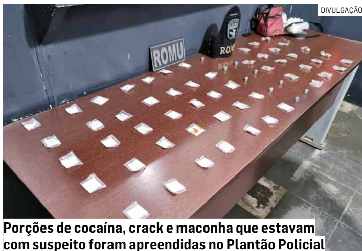
Porções de cocaína, crack e maconha que estavam com suspeito foram apreendidas no Plantão Policial

A Guarda Municipal prendeu um homem por tráfico de entorpecentes na noite desta quinta-feira (15), na rua México esquina com a rua Bolívia, no Jardim Santa Clara do Lago, em Hortolândia. Guardas municipais da Romu (Rondas Municipais) estavam em patrulhamento quando avistaram um suspeito que, ao perceber a aproximação da viatura, dispensou um maço de cigarro. Ele foi abordado e dentro da embalagem foram localizadas dez porções de cocaína, cinco embalagens de crack e uma porção de maconha.