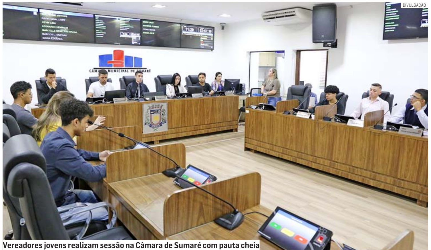
Vereadores jovens realizam sessão na Câmara de Sumaré com pauta cheia

No Legislativo sumarense, uma moção aprovada nesta semana home-