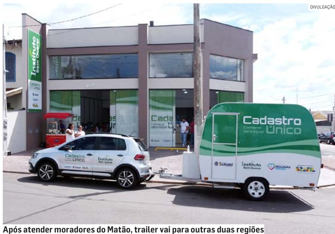
Após atender moradores do Matão, trailer vai para outras duas regiões

Da Redação • SUMARÉ tribunaliberal@tribunaliberal.com.br