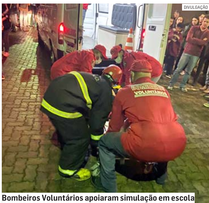
Bombeiros Voluntários apoiaram simulação em escola