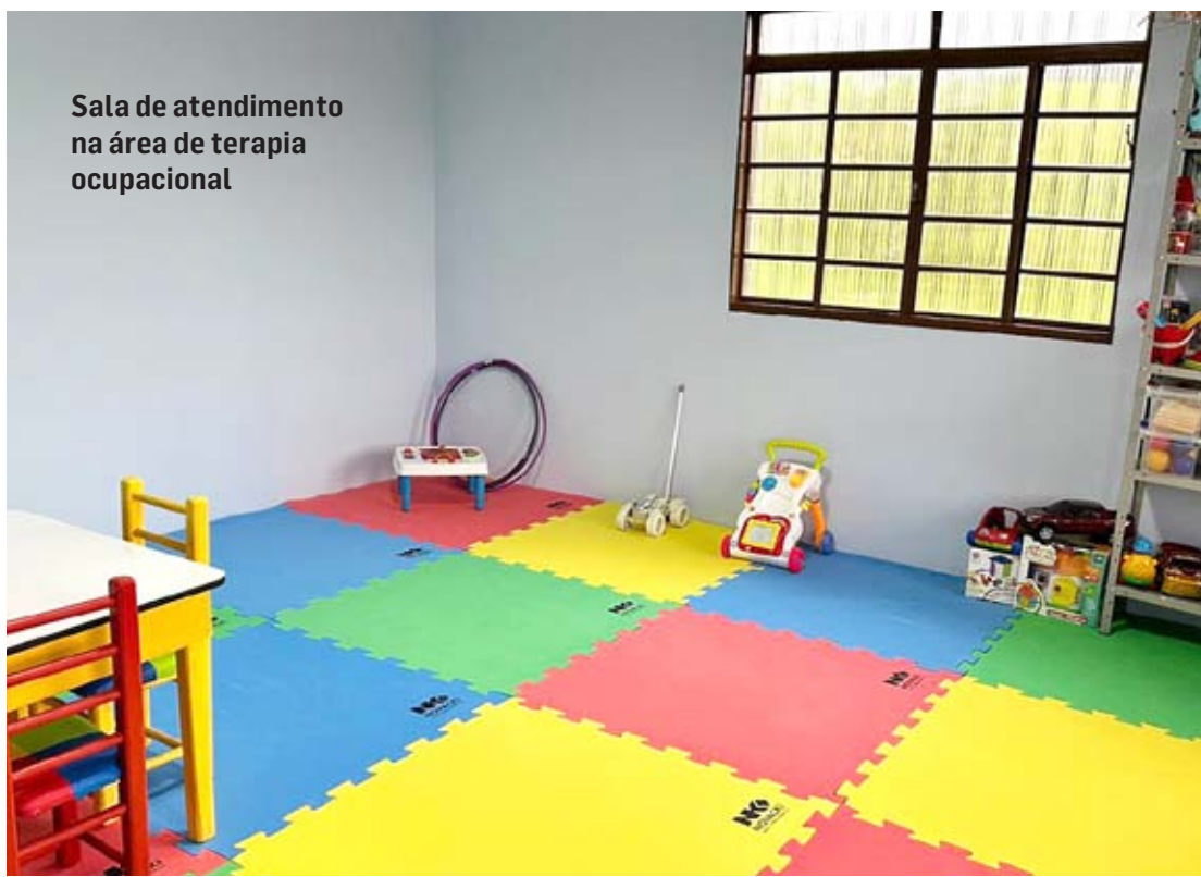
Sala de atendimento na área de terapia ocupacional