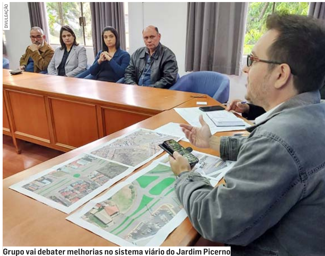
Grupo vai debater melhorias no sistema viário do Jardim Picerno

Da Redação • SUMARÉ tribunaliberal@tribunaliberal.com.br