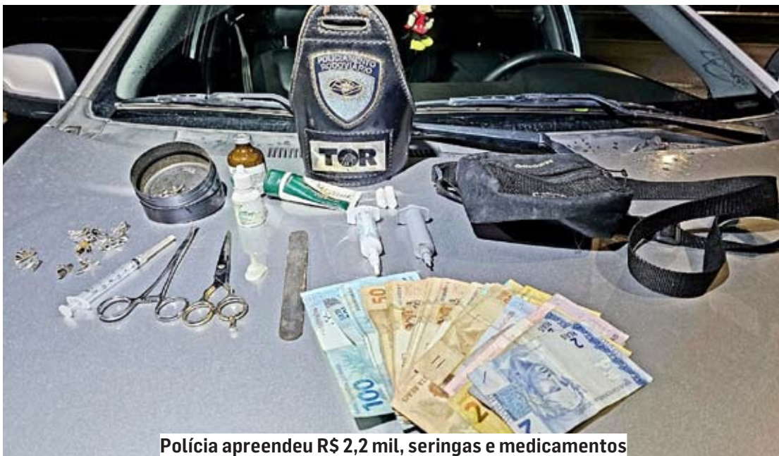
Polícia apreendeu R$ 2,2 mil, seringas e medicamentos

Cézar Oliveira • PAULÍNIA tribunaliberal@tribunaliberal.com.br