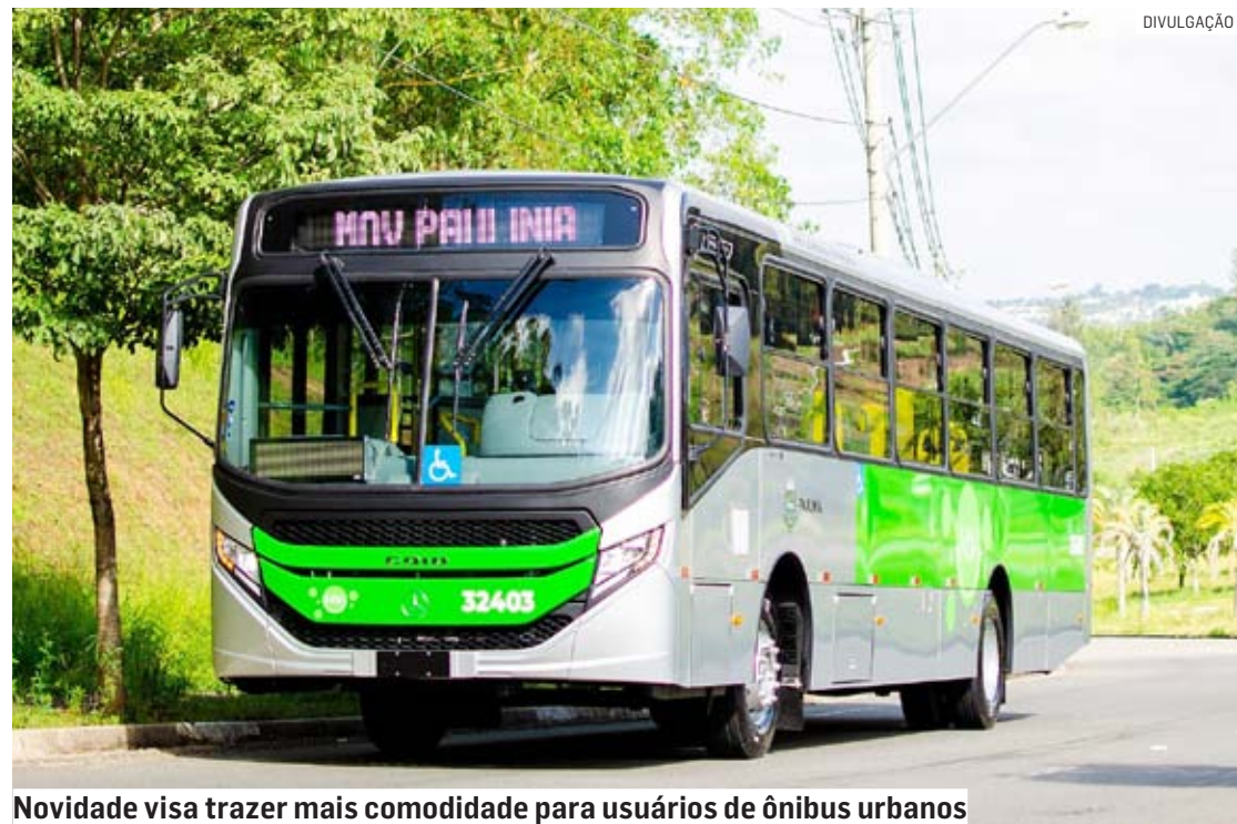
Novidade visa trazer mais comodidade para usuários de ônibus urbanos

Da Redação • PAULÍNIA tribunaliberal@tribunaliberal.com.br