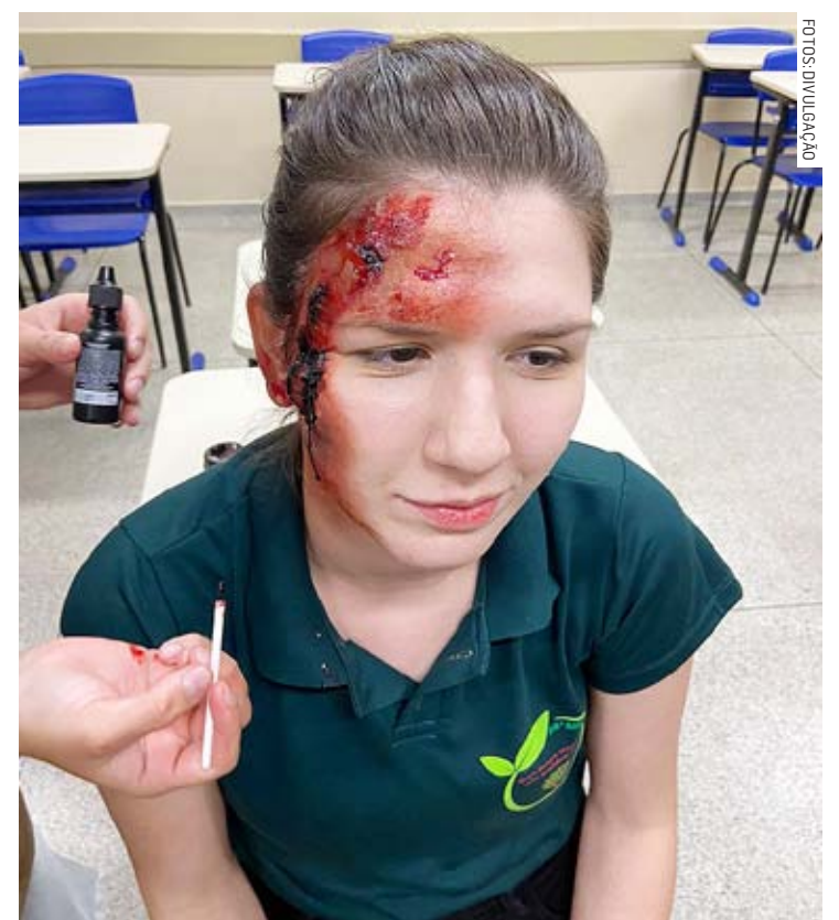
Alunos da Etec simularam condições de atendimento e socorro à vítima

Os alunos utilizaram extintores de CO 2 de 6 kg para tentar controlar o fogo, enquanto os Bombe-