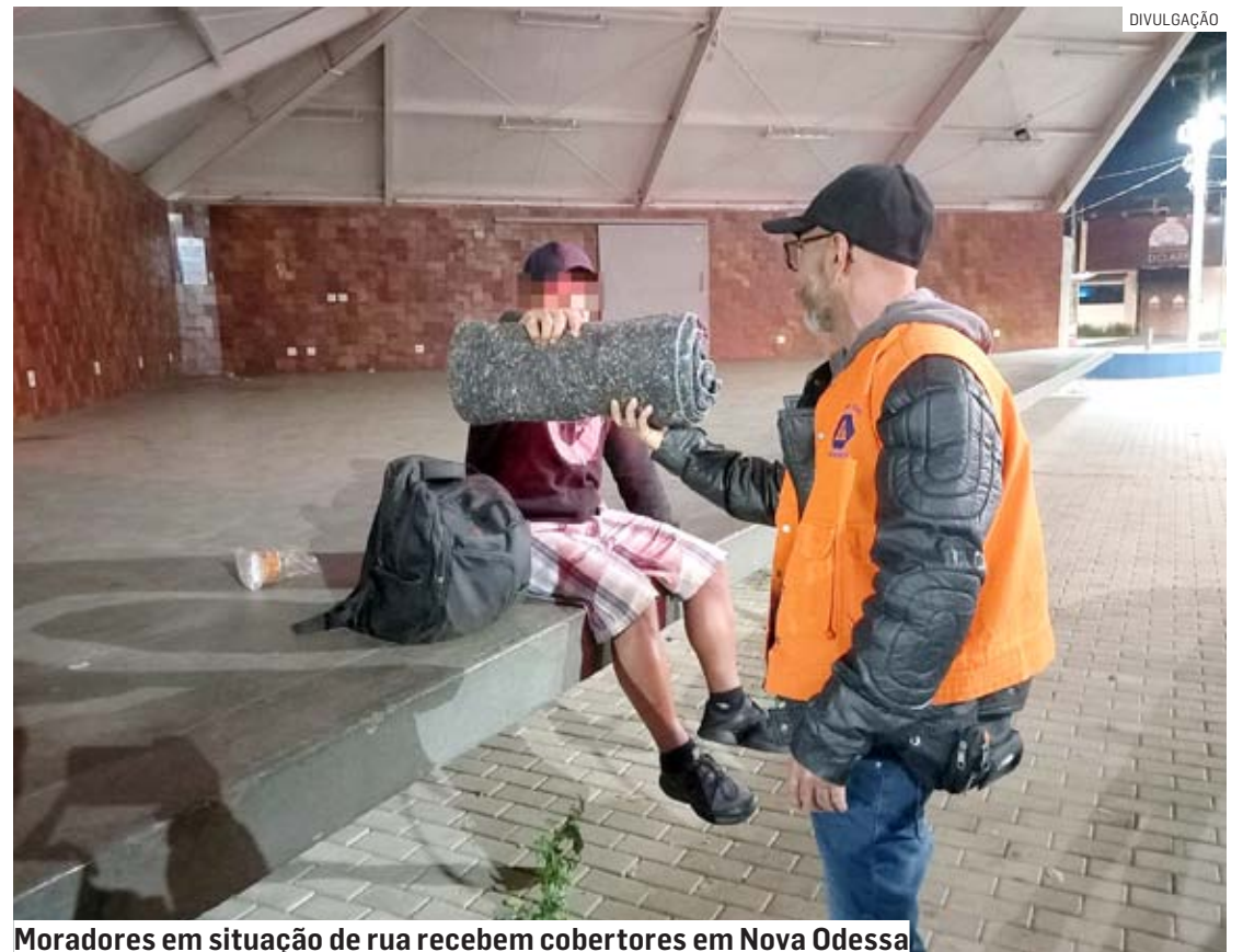
Moradores em situação de rua recebem cobertores em Nova Odessa

Sempre que as temperaturas caem, a equipe da Defesa Civil e a GCM (Guarda Civil Municipal) percorrem os pontos onde estes cidadãos costumam ser encontrados, ofere-