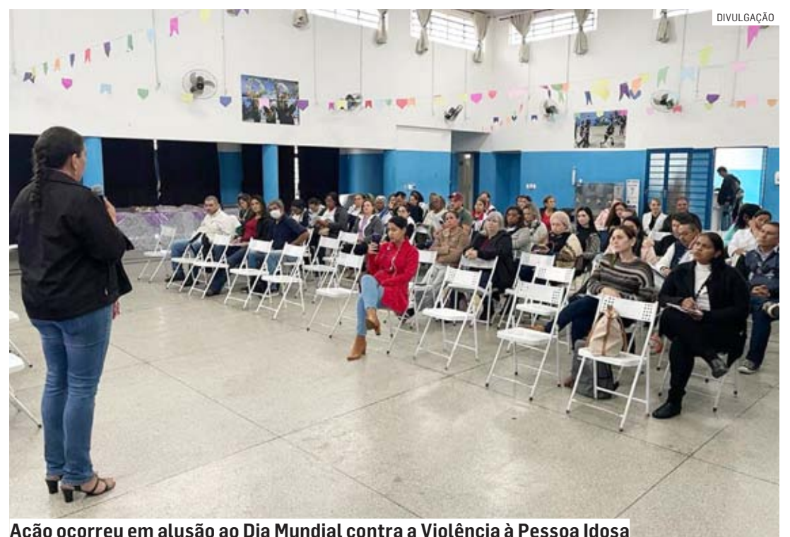
Ação ocorreu em alusão ao Dia Mundial contra a Violência à Pessoa Idosa

“Com a iniciativa, a gestão municipal visa valorizar a experiência e a sabedoria dos idosos, reconhecendo sua contribuição para a construção de uma sociedade mais justa e inclusiva, além de contribuir efetivamente para o bem-estar e saúde dos idosos”, informou a Prefeitura.