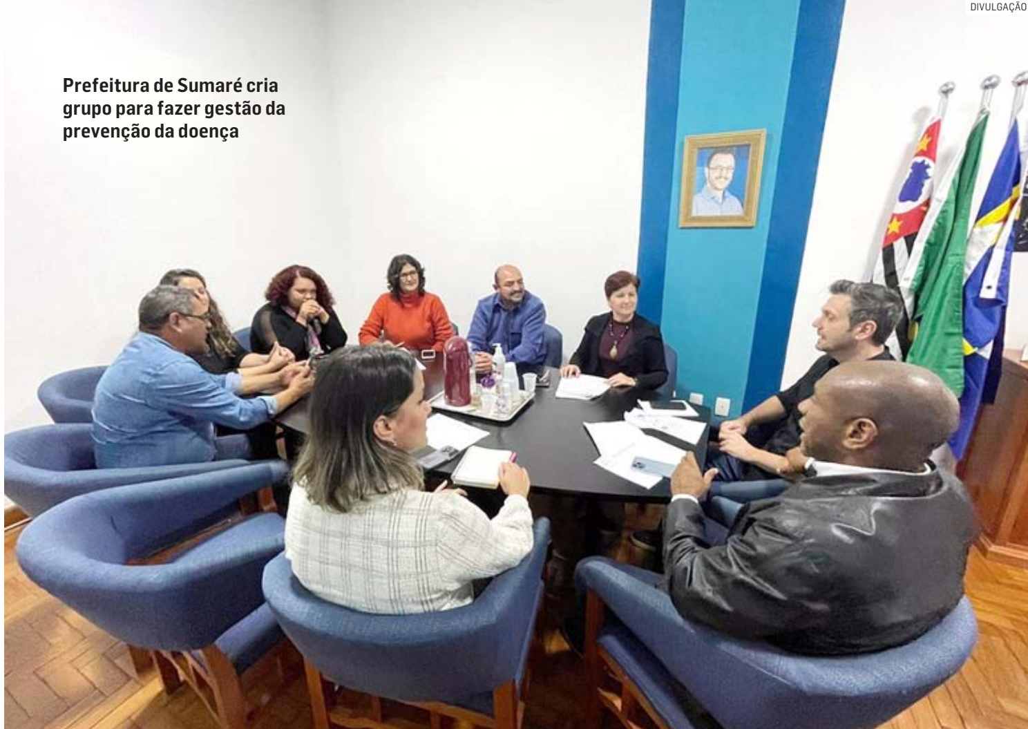
Prefeitura de Sumaré cria grupo para fazer gestão da prevenção da doença

“Devido às ações já realizadas, não há registro de nenhum caso da doença em Sumaré. A Prefeitura tem mantido um trabalho contínuo no combate a questões que possam