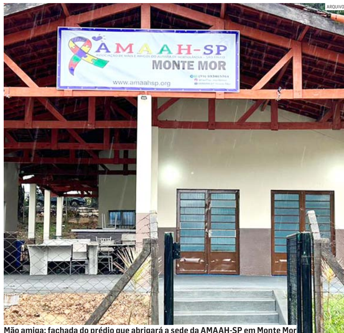
Mão amiga: fachada do prédio que abrigará a sede da AMAAH-SP em Monte Mor