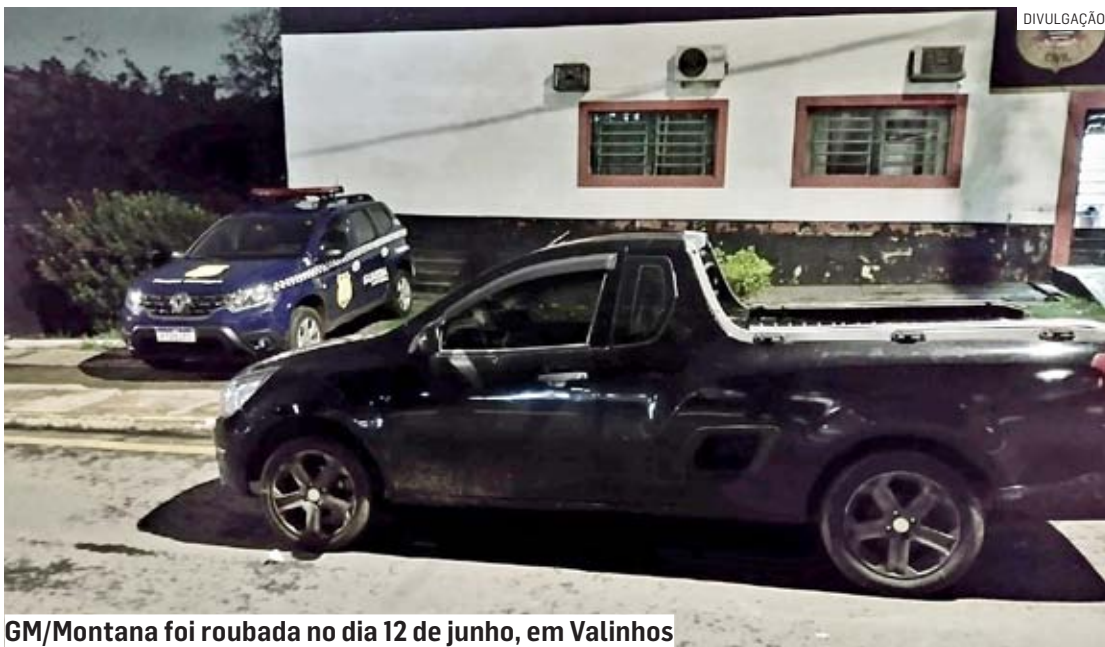
GM/Montana foi roubada no dia 12 de junho, em Valinhos