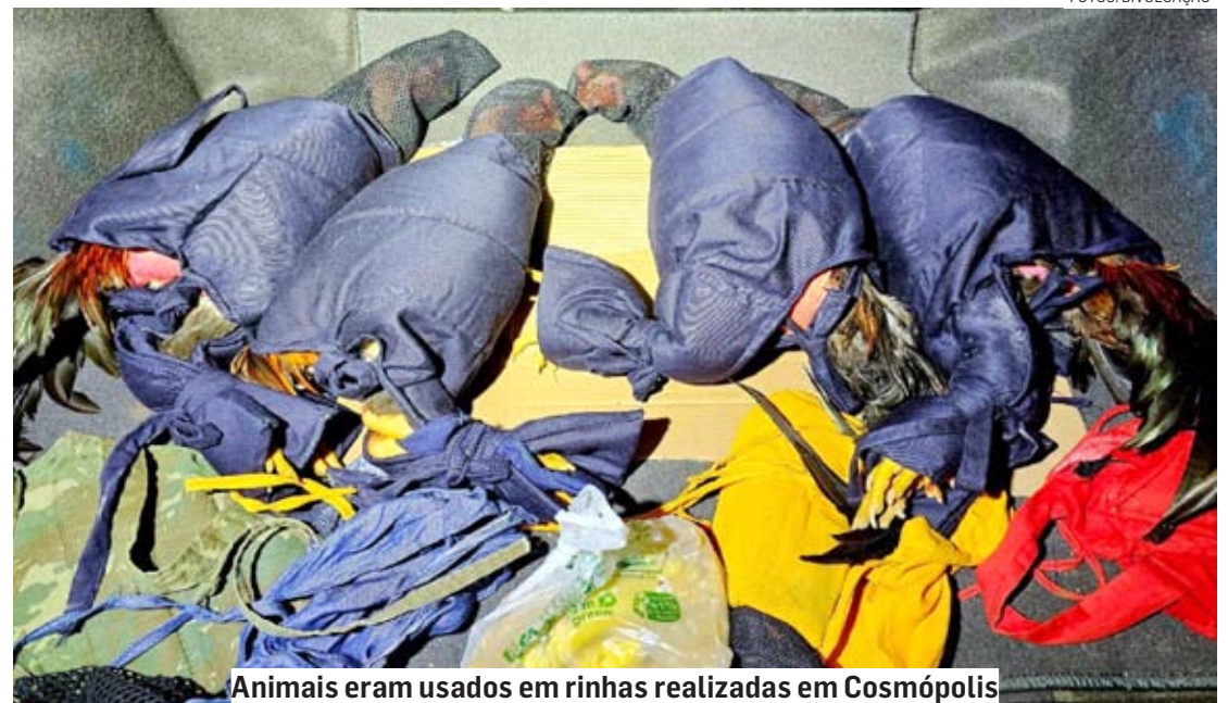
Animais eram usados em rinhas realizadas em Cosmópolis

A equipe, mediante as alegações, prosseguiu com a busca veicular e localizou R$ 2.252, quatro galos em situação que se