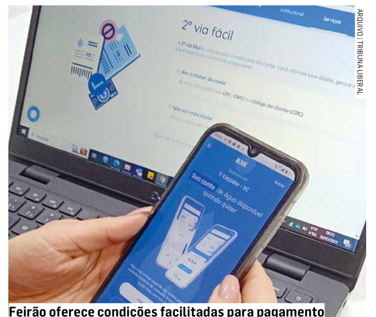
Feirão oferece condições facilitadas para pagamento

Para falar e negociar com a BRK, os clientes podem entrar em contato pelo whatsapp, no (11) 9 9988-0001, que funciona de segunda a sexta-feira, das 8h às 20h, e aos sábados das 8h às 14h. O Feirão BRK segue até o dia 7 de junho.