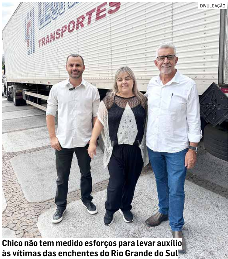
Chico não tem medido esforços para levar auxílio às vítimas das enchentes do Rio Grande do Sul