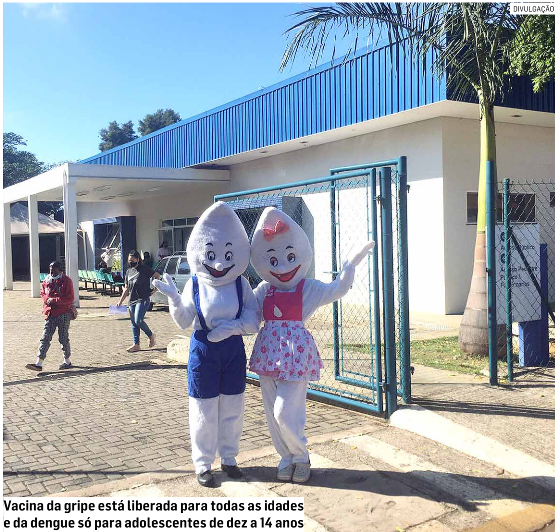
Vacina da gripe está liberada para todas as idades e da dengue só para adolescentes de dez a 14 anos

Já a faixa etária dos adolescentes que devem se vacinar contra a dengue foi ampliada em abril para quem tem de dez a 14 anos. Para concluir o ciclo de imunização, a segunda dose da vacina contra a dengue deve ser tomada após três meses após a data da primeira dose. “Vamos aproveitar e vacinar a rotina e os adolescentes de dez a 14 anos contra a dengue também. E vamos montar equipes volantes, para vacinar os pacientes acamados da área atendida pela UBS 5 em suas casas”, acrescentou a enfermeira.