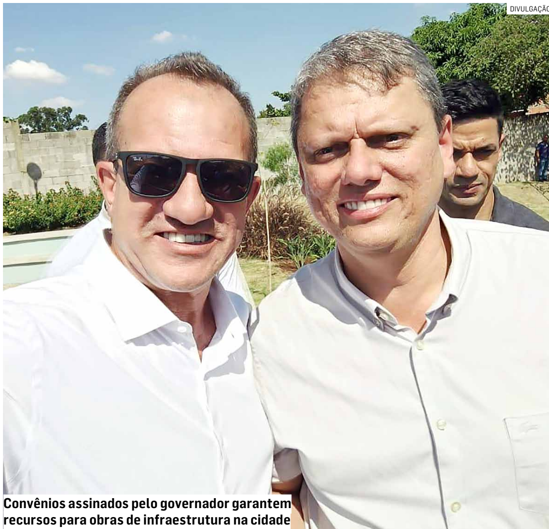
Convênios assinados pelo governador garantem recursos para obras de infraestrutura na cidade

"São três recursos importantes para a área de esportes e lazer de Nova Odessa. Nossa cidade sempre teve essa relação com o esporte, com o verde, tem lindas praças e locais de lazer, e vamos incrementar isso com esses convênios e também com o novo Parque Municipal das Crian-