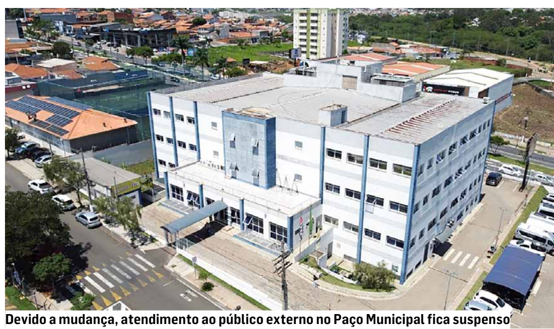
Devido a mudança, atendimento ao público externo no Paço Municipal fica suspenso