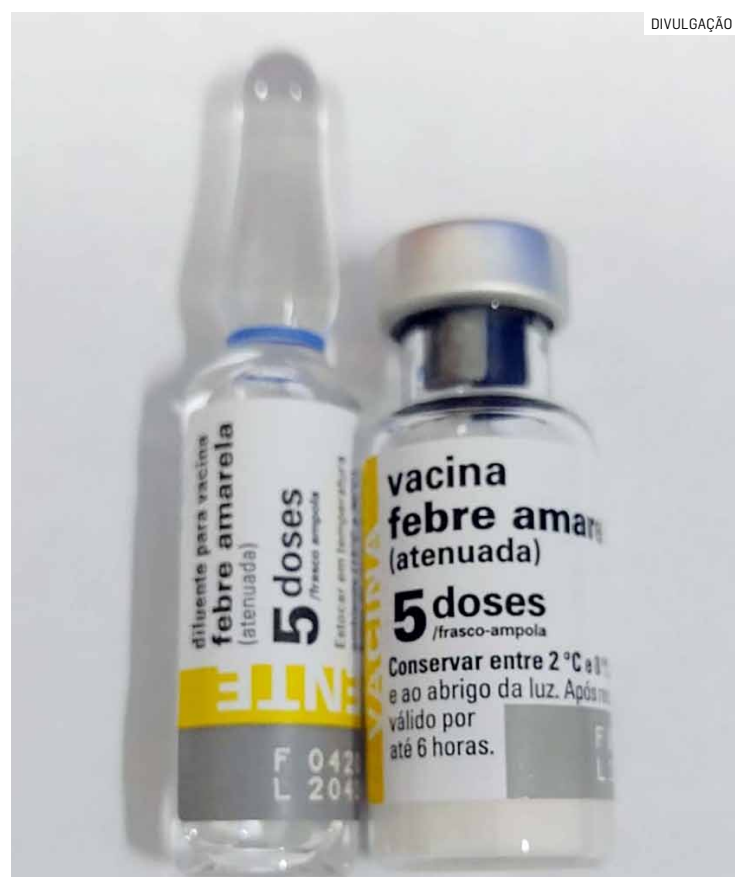
Vacina está disponível nas UBSs de segunda a sexta-feira, das 8h às 15h30