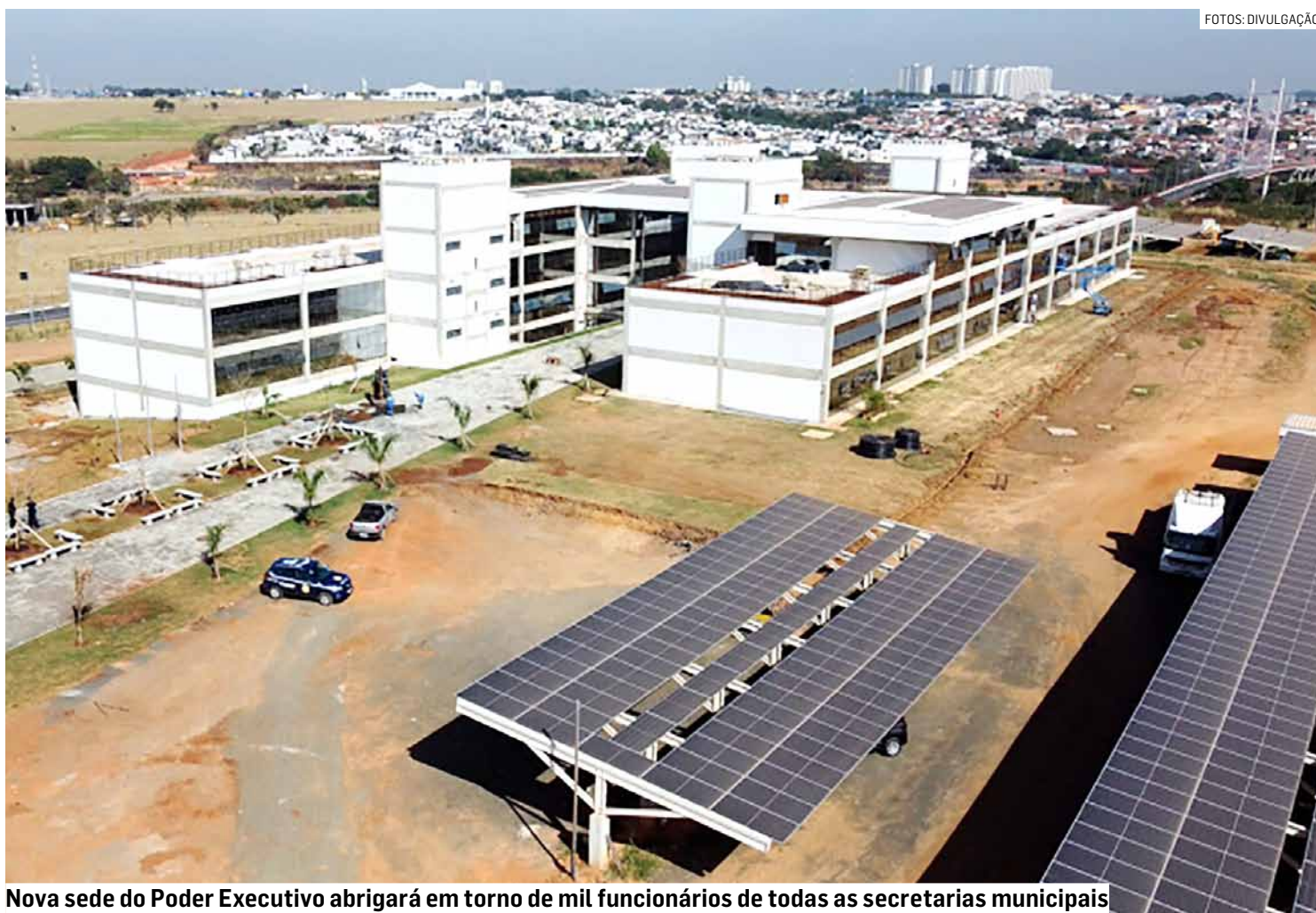
Nova sede do Poder Executivo abrigará em torno de mil funcionários de todas as secretarias municipais

O valor da obra de construção é de R$ 66 milhões, dos quais R$ 50 milhões oriundos do Finisa (Financiamento à Infraestrutura e ao Saneamento) da Caixa e R$16 milhões de recursos próprios da Prefeitura. O prefeito Zezé Gomes (Republicanos) assinou a ordem de serviço para a construção do novo Paço Municipal