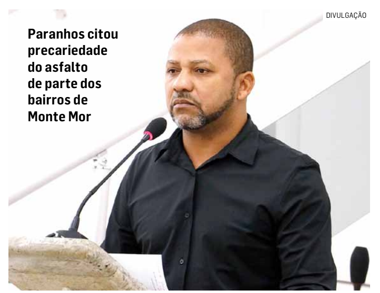
Paranhos citou precariedade do asfalto de parte dos bairros de Monte Mor

“A gente, como vereador, tem vergonha de falar para a população que a prefeitura está fazendo aquilo. Essa é a sensação da população, a minha sensação, a sensação da minha família: de que a nossa cidade não funciona”, disse o parlamentar, no plenário.