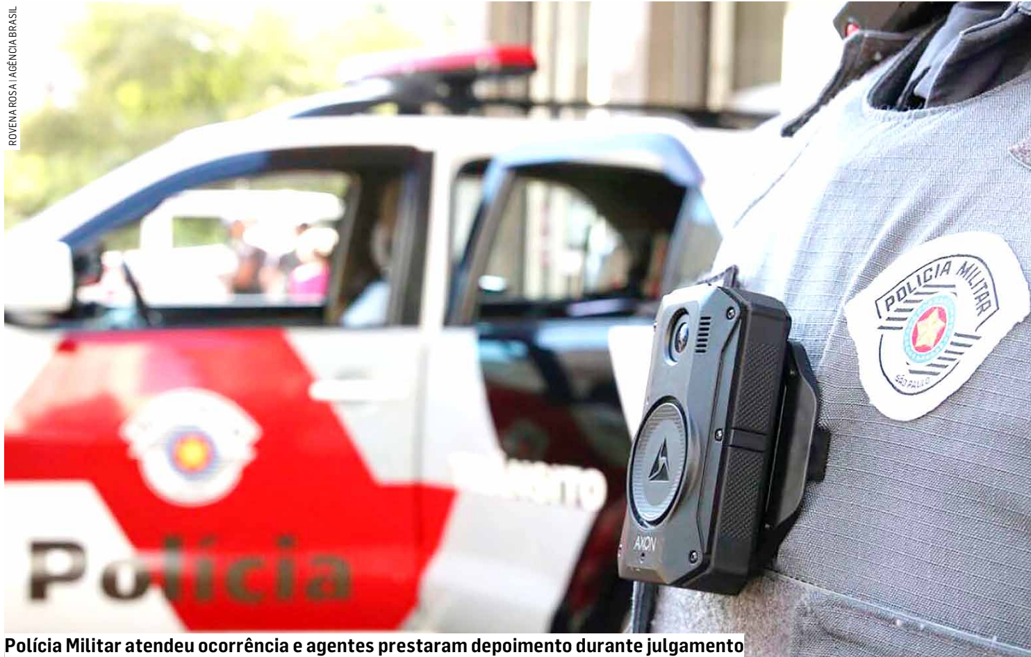
Polícia Militar atendeu ocorrência e agentes prestaram depoimento durante julgamento

Acusados agiram em conjunto para levar uma motocicleta, mas a vítima reagiu, entrou em luta corporal com os assaltantes, tomou arma de fogo de um deles e atirou contra os réus, que ficaram internados; caso ocorreu em setembro de 2023