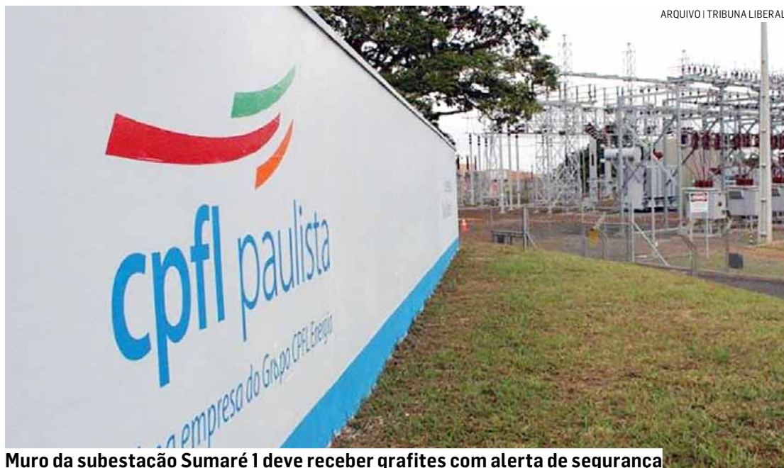
Muro da subestação Sumaré 1 deve receber grafites com alerta de segurança

Em sintonia com o plano ESG do grupo CPFL Energia, a ideia é promover o comportamento seguro e, ao mesmo tempo, apoiar a cultura, valorizando artistas locais. Até o momento, 30 subestações da área de concessão da CPFL Paulista já têm seus muros grafitados. Desse total, cinco foram pintados em 2024.