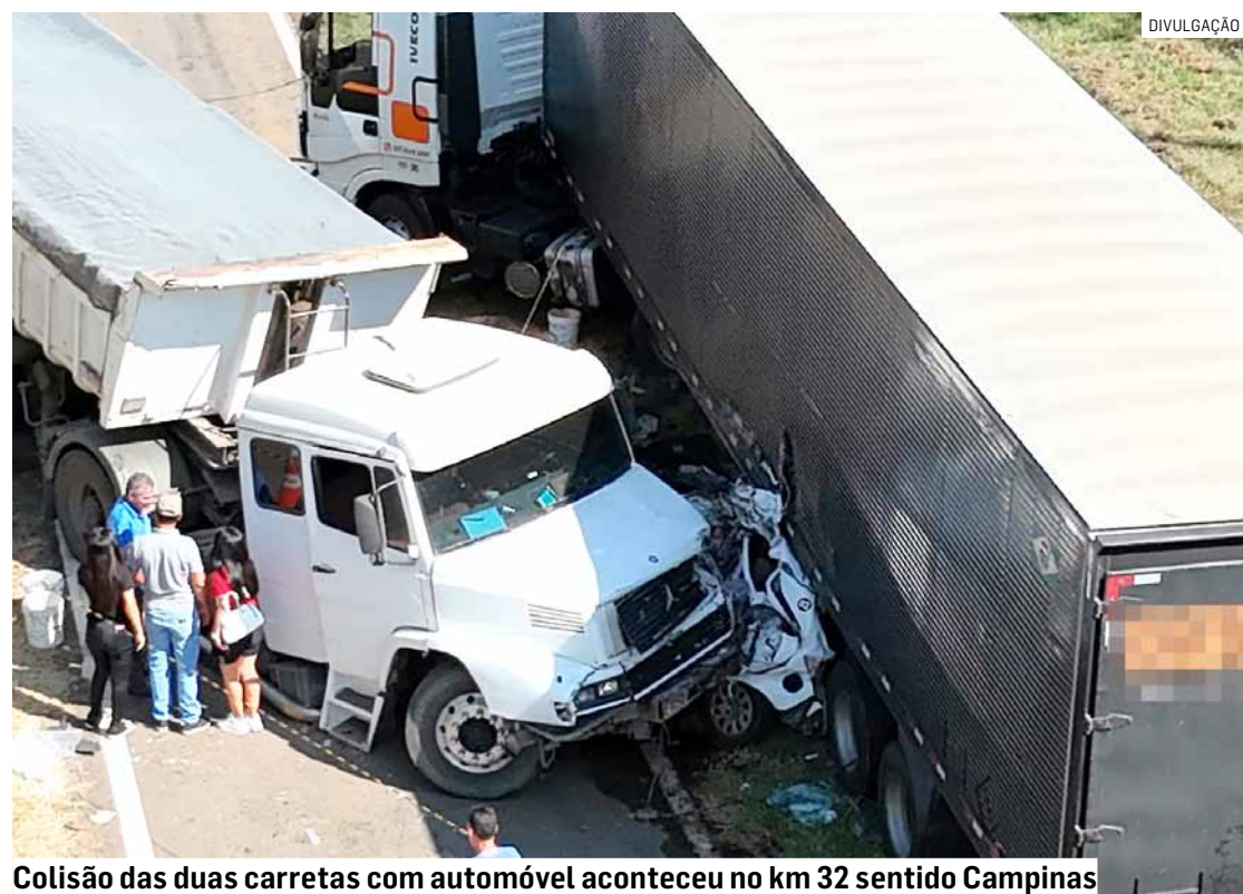
Colisão das duas carretas com automóvel aconteceu no km 32 sentido Campinas