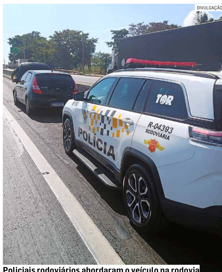
Policiais rodoviários abordaram o veículo na rodovia