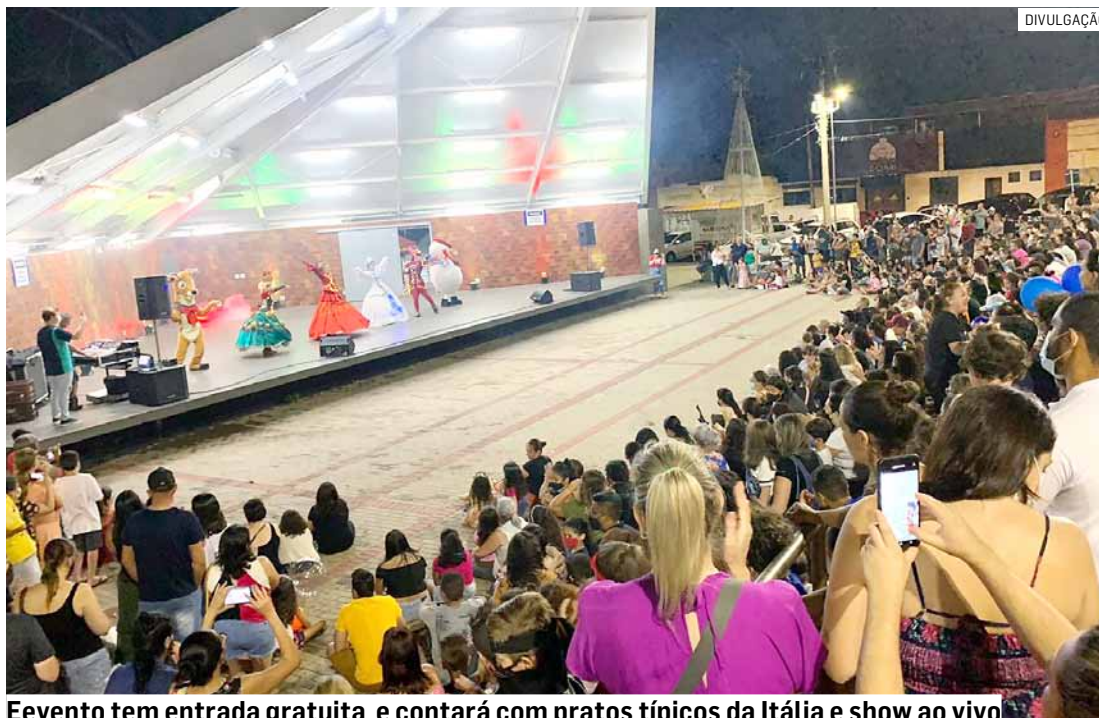
Evento tem entrada gratuita e contará com pratos típicos da Itália e show ao vivo

Em uma parceria do Departamento de Cultura e Turismo de Nova Odessa e as paróquias Santa Josefina Bakhita e Santo Amaro, a Festa Italiana será um momento de celebração e troca de experiências entre moradores e visitantes.