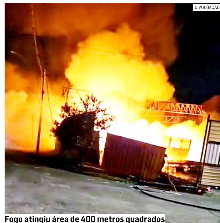
Fogo atingiu área de 400 metros quadrados

O proprietário esteve no depósito e acompa-