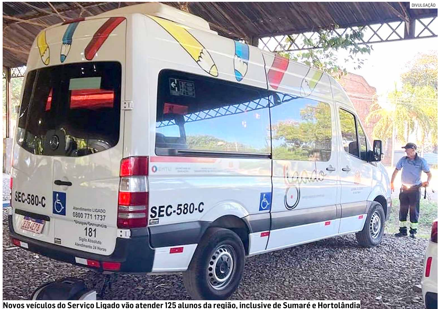
Novos veículos do Serviço Ligado vão atender 125 alunos da região, inclusive de Sumaré e Hortolândia