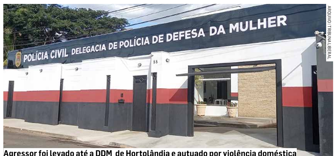
Agressor foi levado até a DDM de Hortolândia e autuado por violência doméstica

pessoa e ficou alterado. O acusado quebrou o celular da mulher e bateu com o aparelho em seu rosto. Em seguida o homem passou a ameaçar a ex com uma tesoura. Após ser detido pelos militares, o agressor foi conduzido até a DDM (Delegacia de Defesa da Mulher), onde foi autuado por violência doméstica.