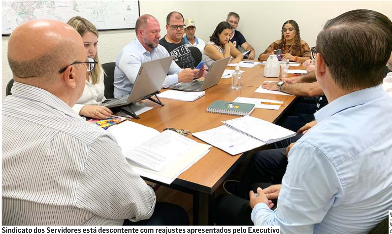
Sindicato dos Servidores está descontente com reajustes apresentados pelo Executivo

"Eles têm condições de oferecer um aumento real maior. Não tem nada decidido, eu vou levar o proposto pela Prefeitura em assembleia, que vai decidir, então a fala de que (a Prefeitura) vai levar projeto de lei (para a Câmara com a pro-