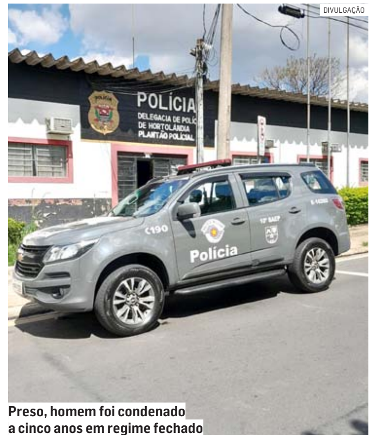
Preso, homem foi condenado a cinco anos em regime fechado

Foi realizada consulta nos sistemas de inteligência da Polícia Militar e constatado que havia contra o suspeito um mandado de prisão expedido pela 2ª Vara Criminal da cidade de Hor-