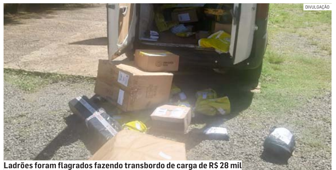
Ladrões foram flagrados fazendo transbordo de carga de R$ 28 mil

A ocorrência foi apresentada no 1º Plantão Policial de Campinas, onde o delegado determinou a prisão do indivíduo.