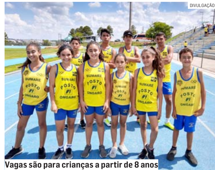
Vagas são para crianças a partir de 8 anos

Os horários de treinamentos são no contraturno escolar e acontecem nas tardes de segundas e quartas-feiras, das 16h às 18h, e nas manhãs de terças e quintas-feiras, das 8h às 10h.