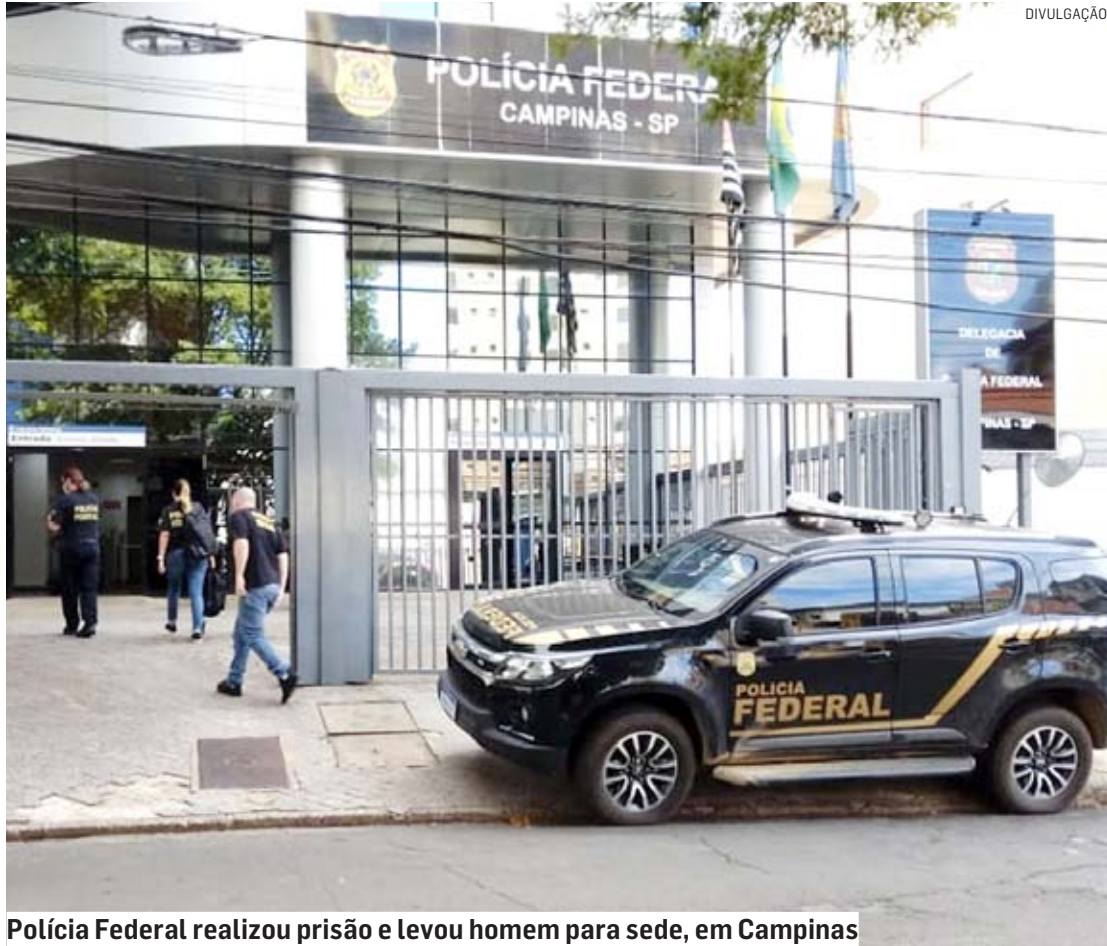
Polícia Federal realizou prisão e levou homem para sede, em Campinas

Homem, um dos procurados pela Operação Rapina, deflagrada pela Polícia Federal contra crimes em estradas, estava foragido há cerca de nove meses; ele foi achado em estabelecimento comercial