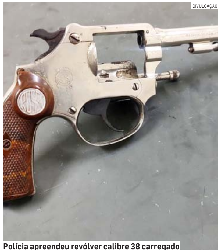
Polícia apreendeu revólver calibre 38 carregado

Ao serem questionados a respeito da arma, ambos ficaram em si-