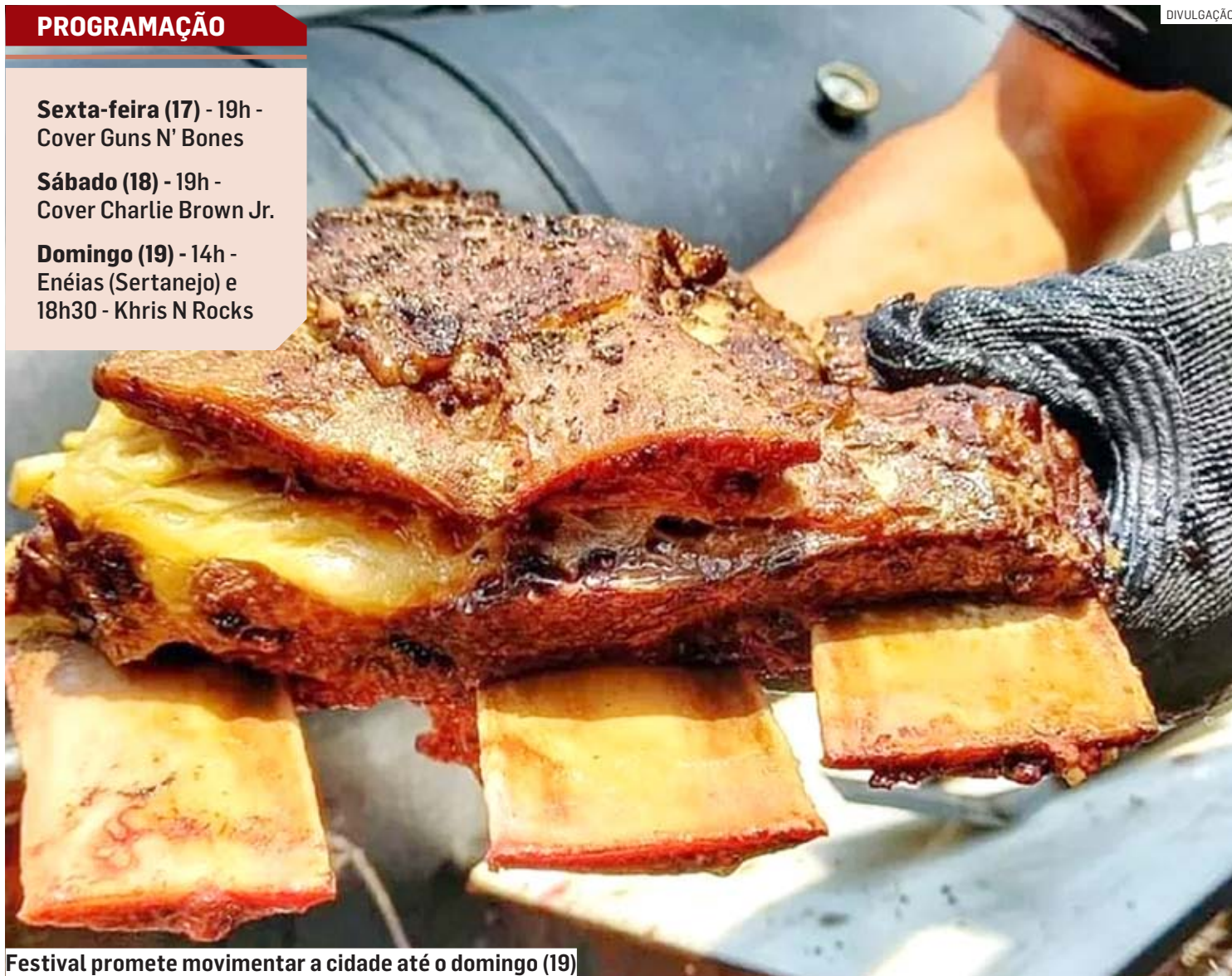
Festival promete movimentar a cidade até o domingo (19)

Domingo (19) - 14h - Enéias (Sertanejo) e 18h30 - Khris N Rocks