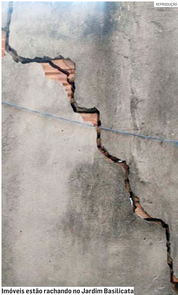
Imóveis estão rachando no Jardim Basilicata

Condomínio em construção no Jardim Basilicata segue proibido de seguir com as obras, segundo decisão do Tribunal de Justiça; ação de moradores que tiveram as suas residências rachadas está em R$ 101,2 mil