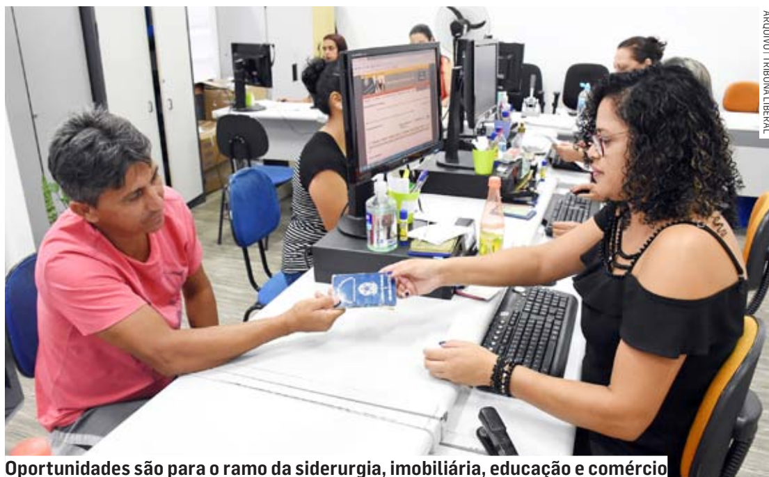
Oportunidades são para o ramo da siderurgia, imobiliária, educação e comércio

O PAT (Posto de Atendimento ao Trabalhador) de Hortolândia informou nesta quinta-feira (16) a abertura de 34 oportunidades para quem está em busca de trabalho na cidade. Os postos são em diversas áreas. Há vagas para auxiliar de fundição em siderúrgica, vazador de metais, corretor de imóveis, auxiliar de limpeza, atendente de lojas, representante técnico de vendas, instalador de sistemas de segurança, ajudante de obras, pedreiro e professor de natação. Candidatos interessados podem se inscrever por meio do aplica-