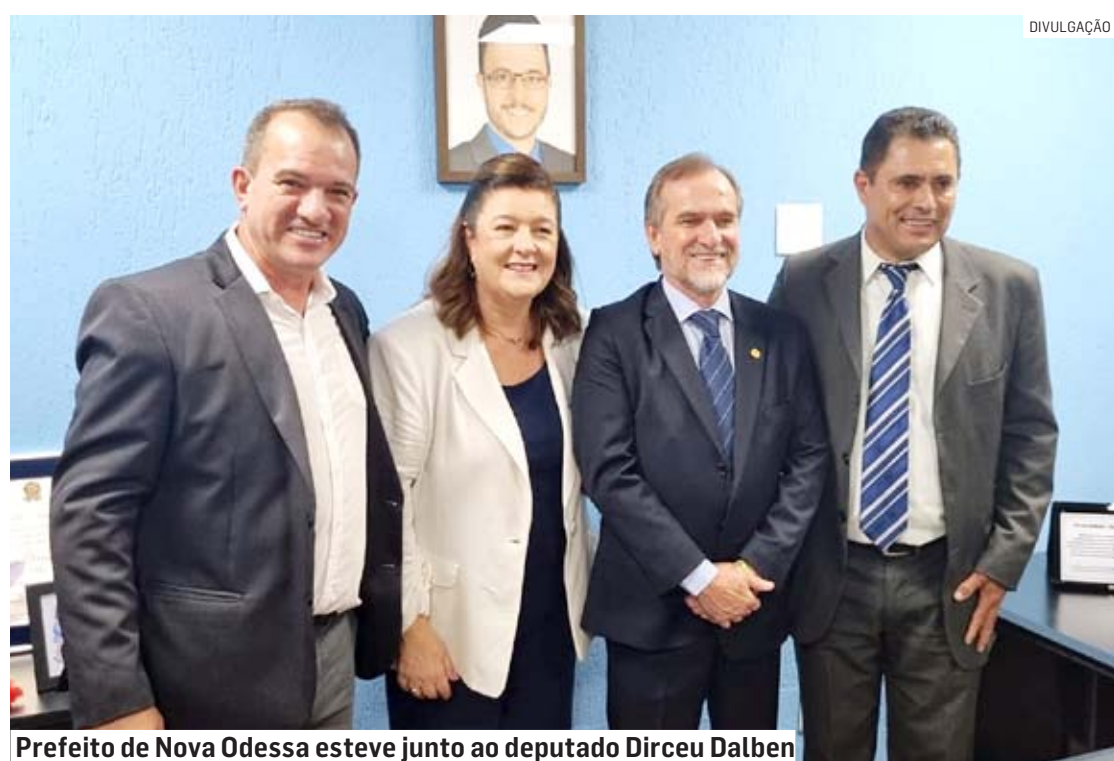
Prefeito de Nova Odessa esteve junto ao deputado Dirceu Dalben

Os 94 deputados paulistas assumiram um mandato de quatro anos, entre março de 2023 e março de 2027. A sessão solene foi realizada no Plenário Juscelino Kubistchek, na sede da Alesp. Na ocasião, cada deputado e deputada prestou seu compromisso com o mandato, prometendo cumprir o que está previsto na Constituição do Estado de São Paulo.