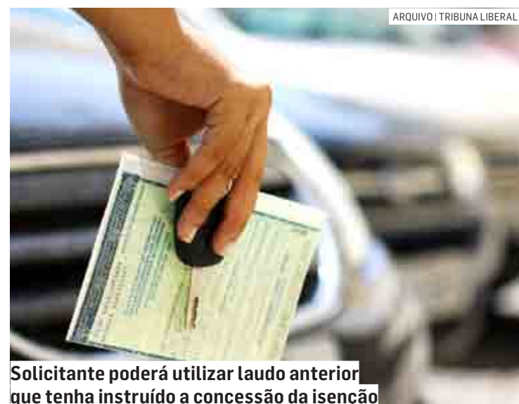
Solicitante poderá utilizar laudo anterior que tenha instruído a concessão da isenção