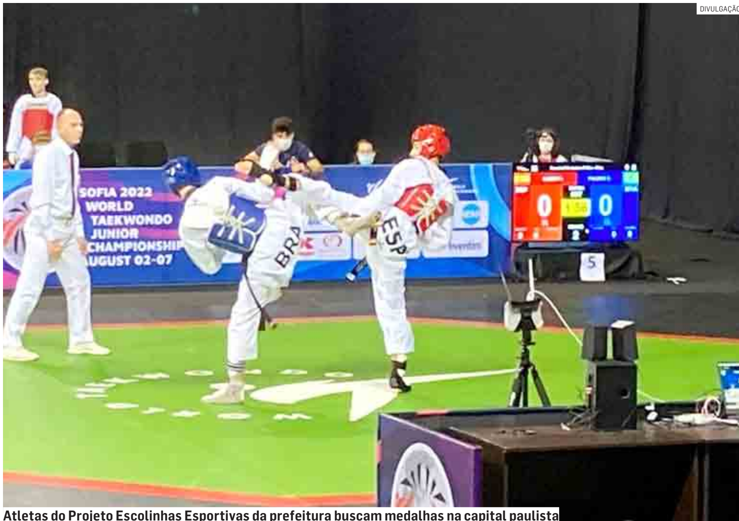
Atletas do Projeto Escolinhas Esportivas da prefeitura buscam medalhas na capital paulista

“Os atletas de alto rendimento do taekwondo treinam nas estruturas do Projeto Escolinhas Esportivas e, a cada dia, conseguimos observar os grandes resultados obtidos em competições. Agora, os meninos representarão Hortolândia e o Brasil em mais