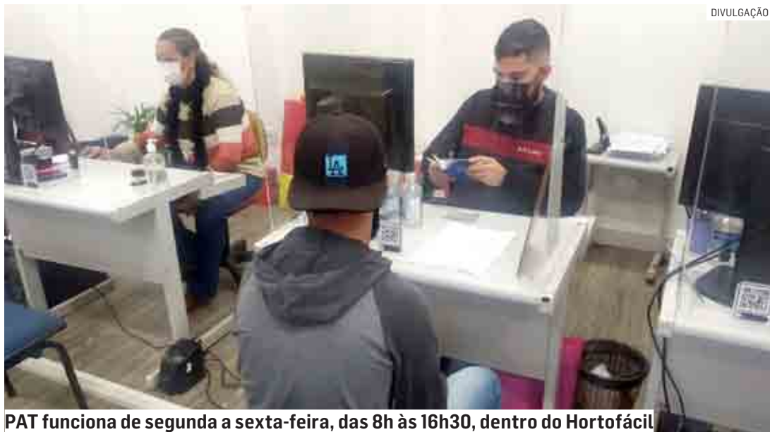
PAT funciona de segunda a sexta-feira, das 8h às 16h30, dentro do Hortofácil

Da Redação | HORTOLÂNDIA tribunaliberal@tribunaliberal.com.br