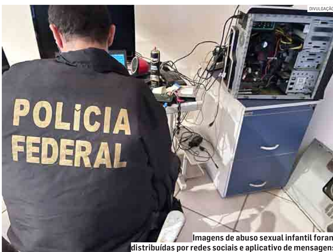
Imagens de abuso sexual infantil foram distribuídas por redes sociais e aplicativo de mensagens

Há indícios de que um dos investigados seja suspeito de, não só disseminar arquivos, mas também de proceder a produção de imagens com conteúdo de pornografia infantil, podendo, portanto, responder ainda por estupro de vulnerável. Esfor-