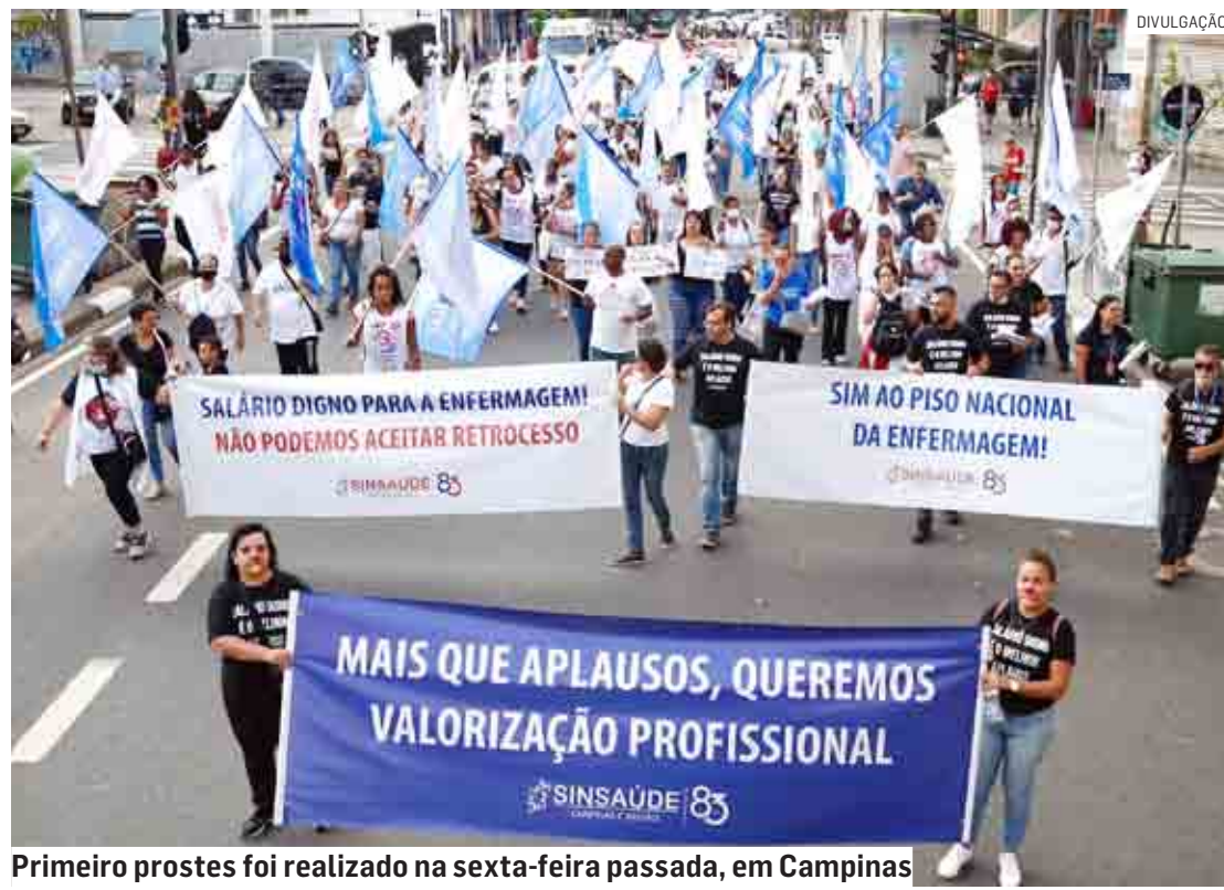
Primeiro protest foi realizado na sexta-feira passada, em Campinas

O Sinsaúde (Sindicato dos Empregados em Estabelecimentos de Saúde de Campinas e Região) realiza nesta sexta-feira (16), a partir das 14h, uma nova manifestação em prol do cumprimento da lei 14.434/2002, que instituiu o Piso Nacional da Enfermagem. Em Campinas, a manifestação se concentrará no Largo do Rosário e, acompanhada de carro de som e distribuição de carta aberta à população, percorrerá a Avenida Francisco Glicério até o Largo do Pará. O primeiro protesto foi rea-