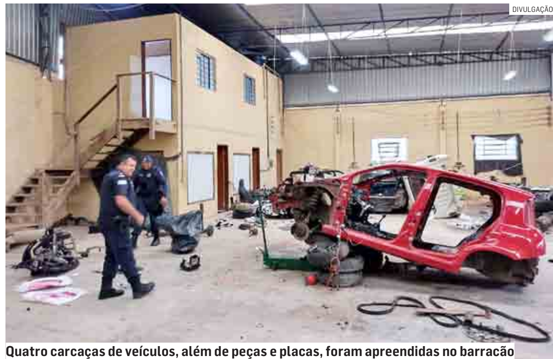
Quatro carcaças de veículos, além de peças e placas, foram apreendidas no barracão