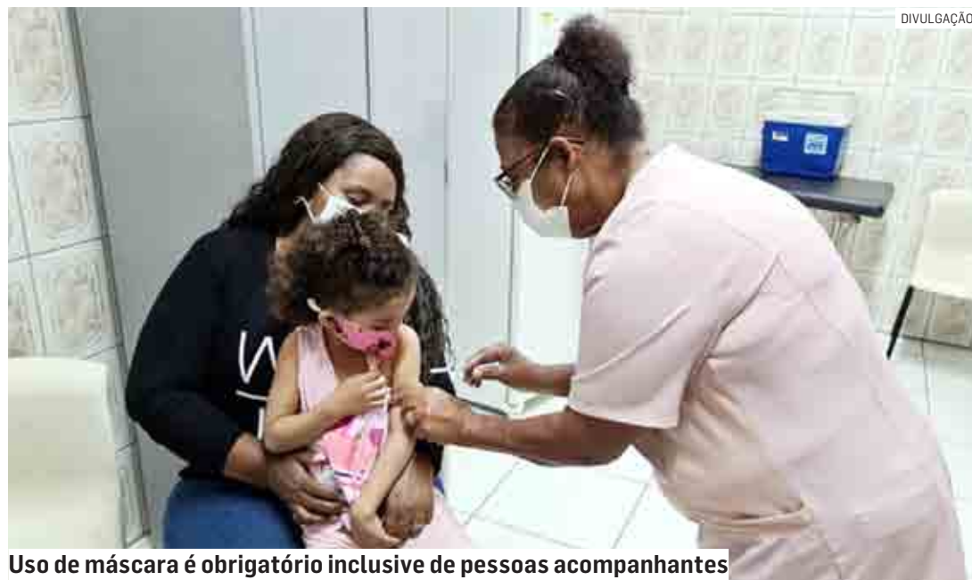
Uso de máscara é obrigatório inclusive de pessoas acompanhantes

A Secretaria de Saúde reforça a importância de famílias e responsáveis levarem crianças e adolescentes para serem imunizados contra várias doenças, como tuberculose, hepatite, tétano, difteria, meningite, febre amarela, sarampo, rubéola, caxumba, catapora, dentre outras. De acordo com a Vigilância Epidemiológica, órgão da Secretaria de Saúde, crianças de 0 a 4 anos devem receber 14 vacinas diferentes. Já crianças e adolescentes de 5 a 14 anos devem receber 17 vacinas.