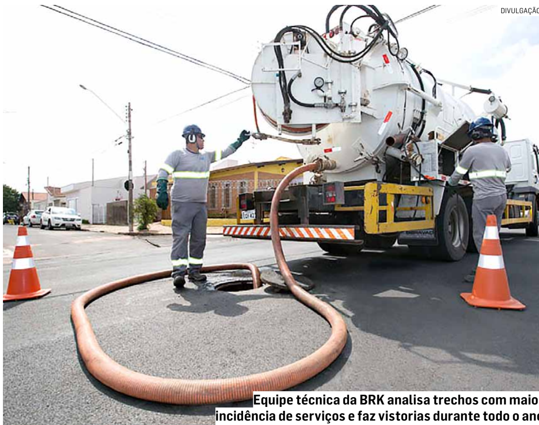
Equipe técnica da BRK analisa trechos com maior incidência de serviços e faz vistorias durante todo o ano

Para a identificação dos pontos que vão passar pela ação preventiva, a equipe técnica analisa, por meio de um sistema chamado GIS (Geographic Information System), os trechos com maior incidência de serviços, além de realizar vistorias preventivas em poços de visita.