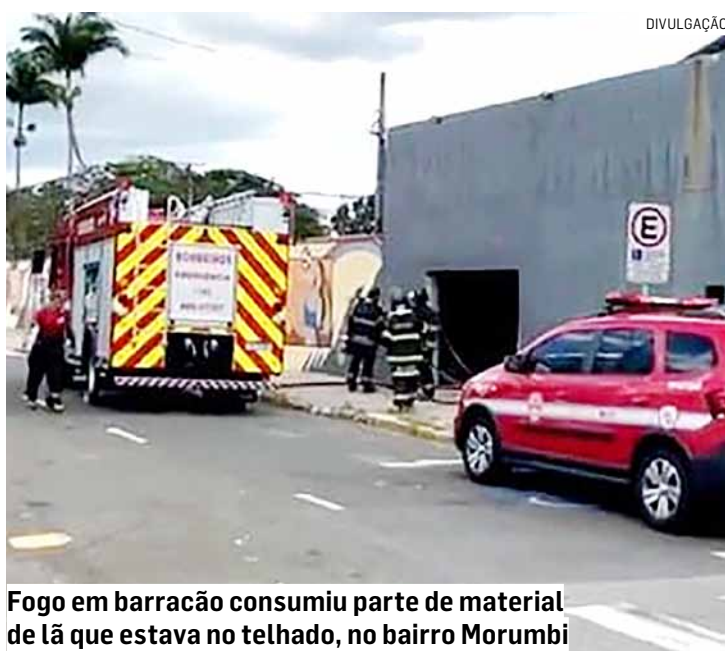
Fogo em barracão consumiu parte de material de lâ que estava no telhado, no bairro Morumbi

cêndio. A ocorrência contou com apoio da Defesa Civil para avaliar possíveis danos na estrutura do local. O caso foi registrado na Delegacia de Polícia do município.