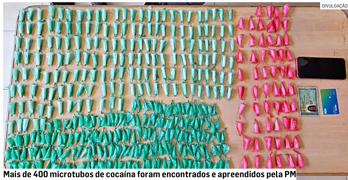
Mais de 400 microtubos de cocaína foram encontrados e apreendidos pela PM

Ela foi contida e durante a abordagem a polícia constatou que no interior da sacola havia 407 microtubos de cocaína. A mulher foi conduzida ao 2º DP (Distrito Policial) de Sumaré, onde permaneceu à disposição da Justiça.