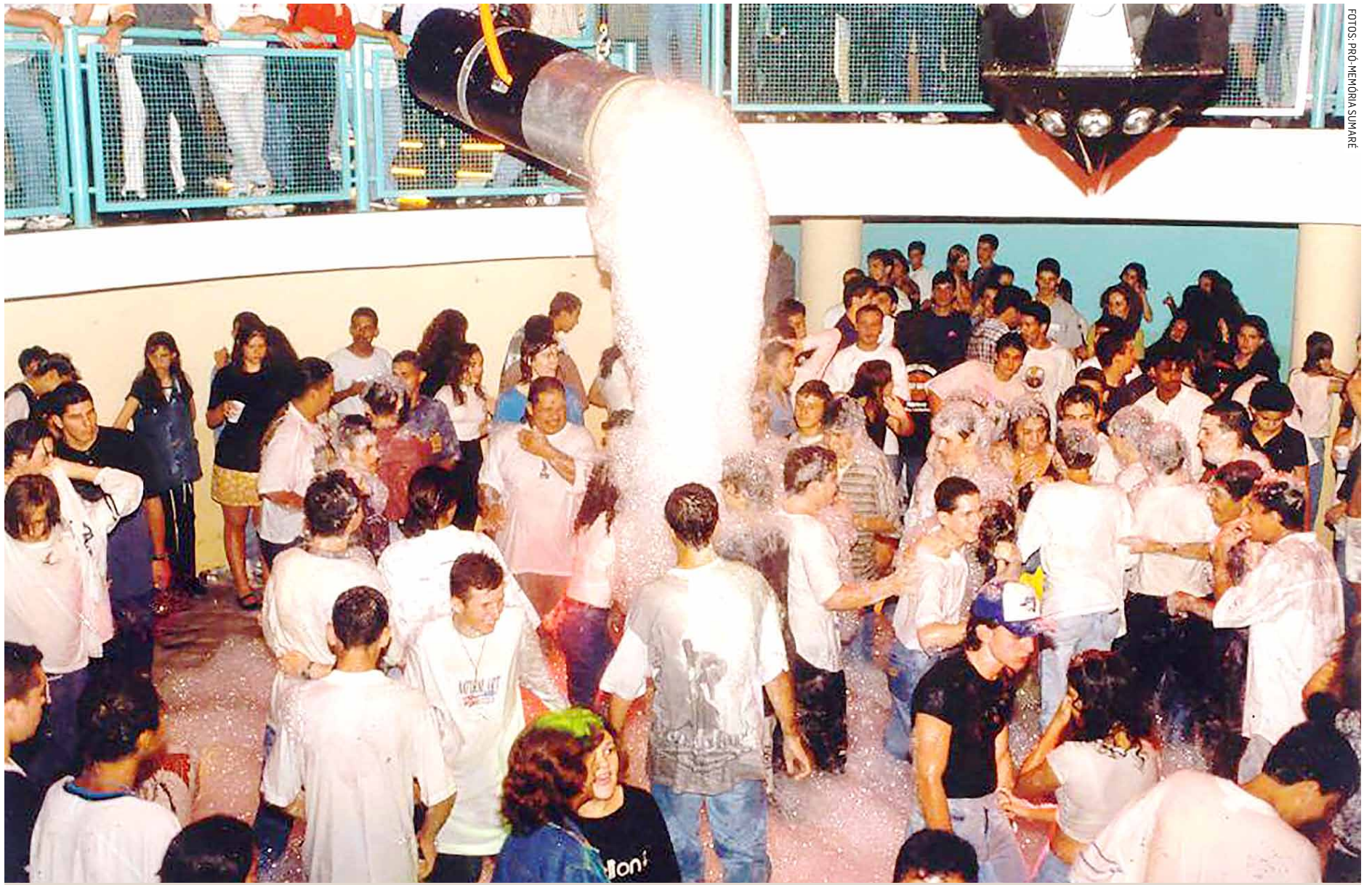
Discoteca do Recreativo