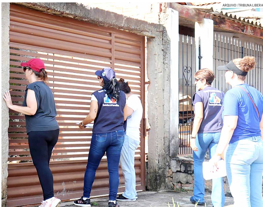
Secretaria de Saúde organiza ações de combate ao mosquito da dengue no Jd. Planalto

O objetivo do mutirão é eliminar possíveis criadouros do mosquito Aedes aegypti , transmissor da dengue, zika e chikungunya, por meio da coleta de materiais inservíveis e conscientização da população.