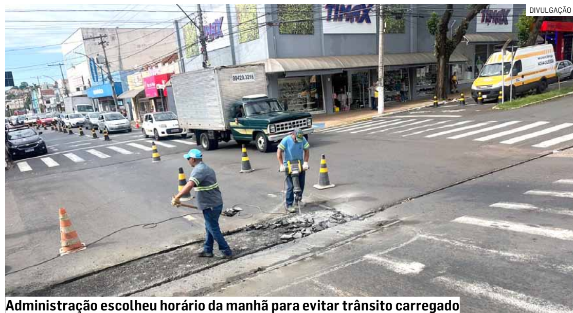
Administração escolheu horário da manhã para evitar trânsito carregado

“Assim, os motoristas que trafegam de manhã pela região central de Nova Odessa, principalmente no sentido Sumaré-Americana, devem redobrar a atenção e obedecer rigorosamente à sinalização temporária de desvios e rotas alternativas”, informou a Prefeitura.