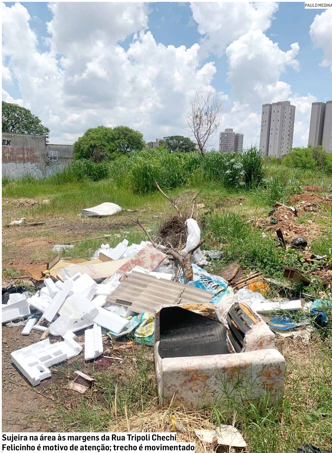
Sujeira na área às margens da Rua Tripoli Chechi Felicino é motivo de atenção; trecho é movimentado

Depois da cidade registrar mais de 5,1 mil casos de dengue e sete mortes no ano passado, área do Jardim Nova Alvorada concentra grande volume de lixo e móveis antigos; região deve viver nova epidemia durante 2025