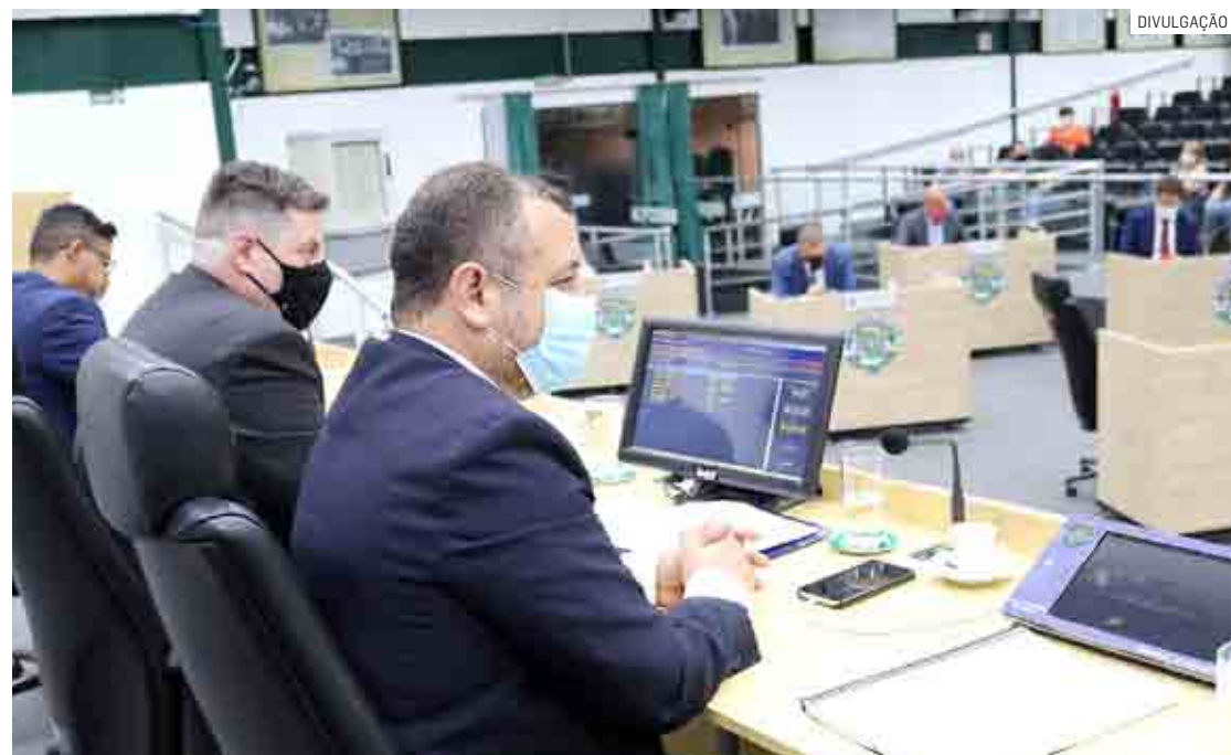
Para ganhar o selo "Escola Amiga do Autista", será preciso demonstrar ações tanto entre alunos como entre funcionários e prestadores de serviços

Da Redação | PAULÍNIA tribunaliberal@tribunaliberal.com.br