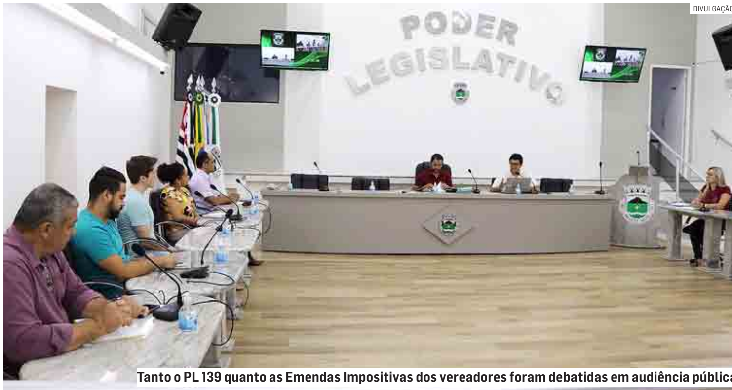
Tanto o PL 139 quanto as Emendas Impositivas dos vereadores foram debatidas em audiência pública

Ao todo, as emendas totalizam cerca de R$ 3,47 milhões - ou seja, cada um dos 15 parlamentares destina um total de cerca de R$ 231,8 mil, para efetivação de políticas públicas