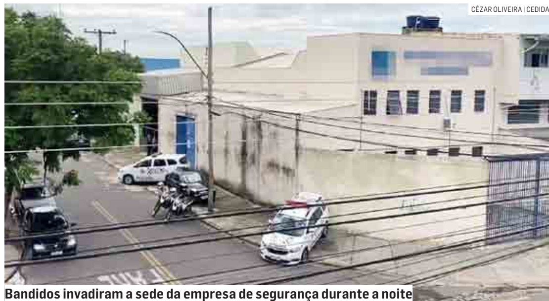
Bandidos invadiram a sede da empresa de segurança durante a noite