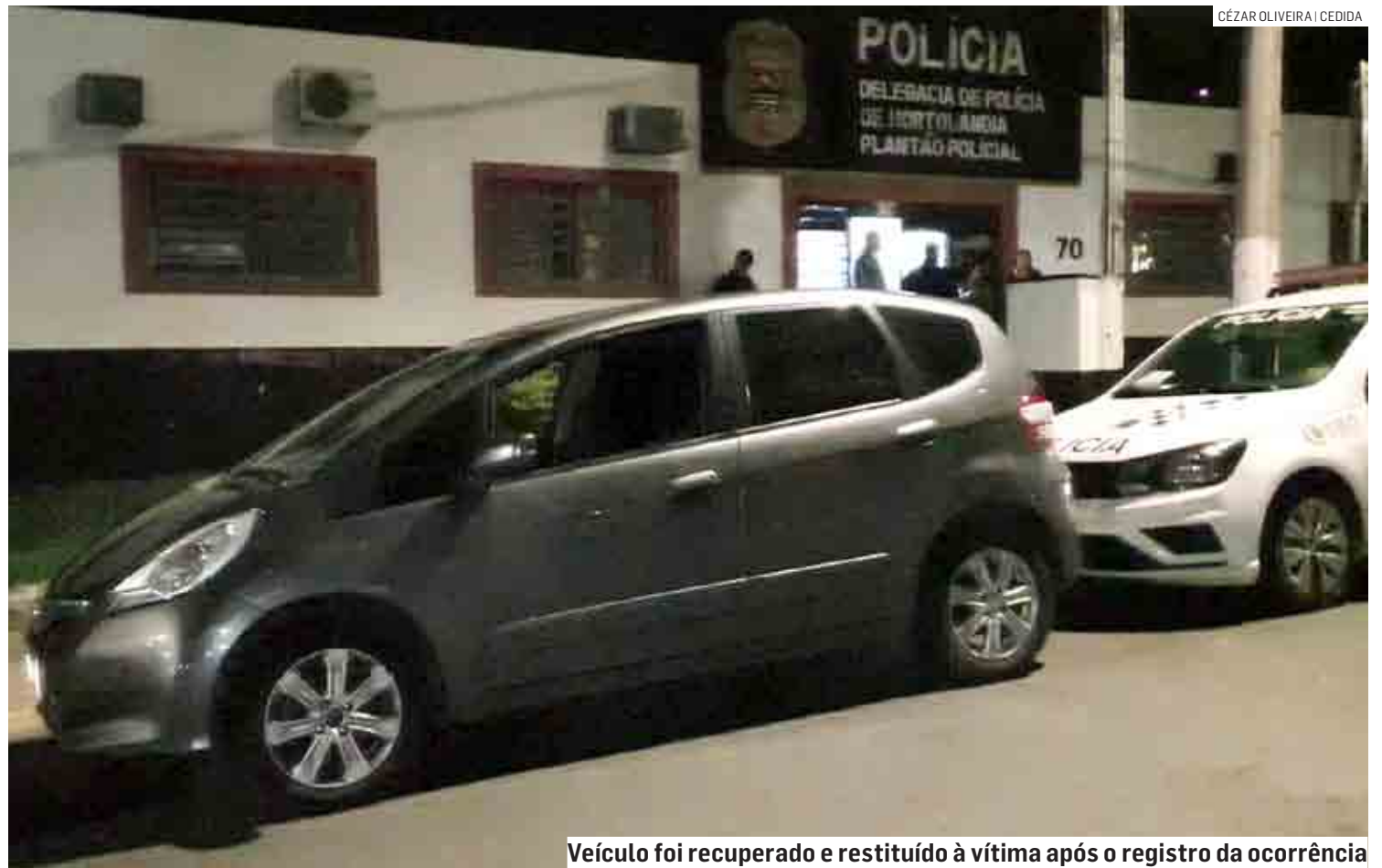
Veículo foi recuperado e restituído à vítima após o registro da ocorrência

A ocorrência foi registrada como roubo e o indivíduo ficou preso, permanecendo à disposição da Justiça.