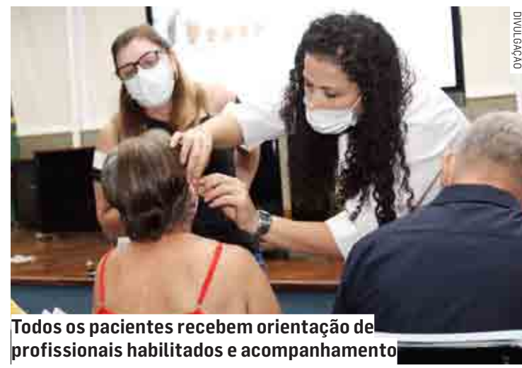
Todos os pacientes recebem orientação de profissionais habilitados e acompanhamento

Para receber o aparelho, o munícipe precisa apresentar um relatório médico, emitido por profissional da rede municipal de saúde, seja da UBS (Unidade Básica de Saúde) ou da Especialidades. Em seguida, ele abrirá um protocolo, que será encaminhado para o Departamento de Reabilitação, responsável pelo encaminhamento das demais etapas.