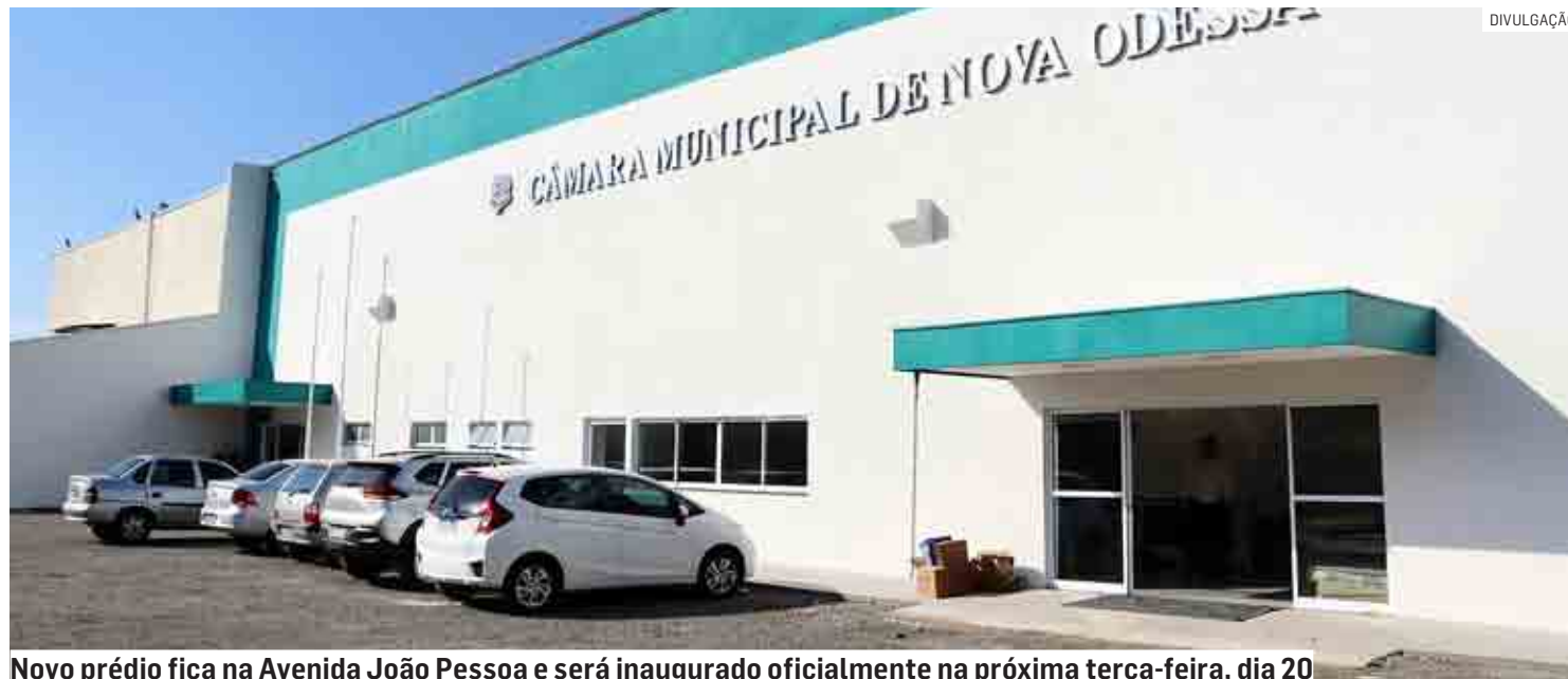
Novo prédio fica na Avenida João Pessoa e será inaugurado oficialmente na próxima terça-feira, dia 20

Da Redação | NOVA ODESSA tribunaliberal@tribunaliberal.com.br