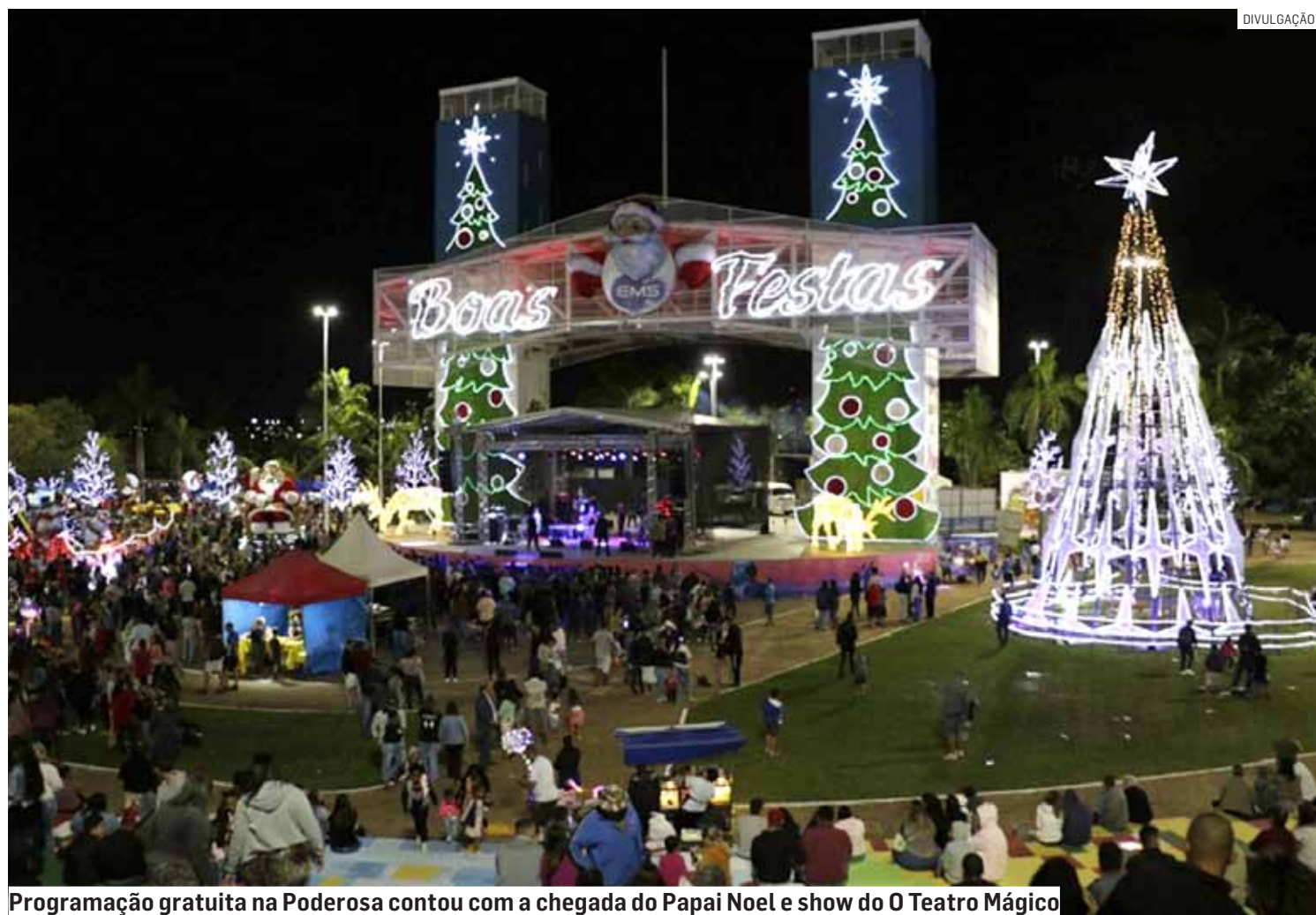
Programação gratuita na Poderosa contou com a chegada do Papai Noel e show do O Teatro Mágico

Para este Natal, a Prefeitura de Hortolândia preparou uma programação especial que segue até o dia 23 de dezembro, na Praça A Po-