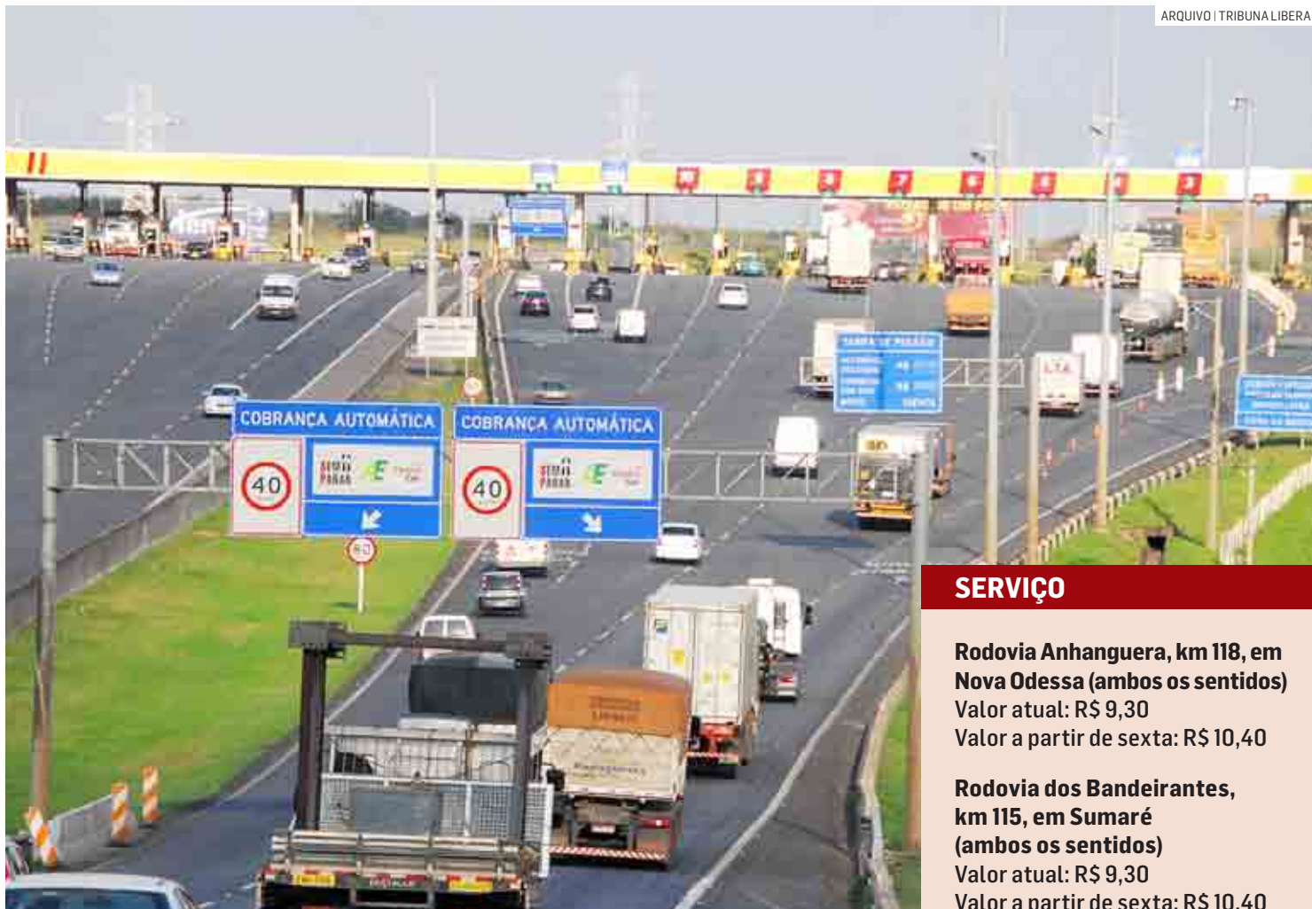
Percentual de reajuste considera a evolução do IPCA de junho de 2021 a maio de 2022

Com isso, nas rodovias sob concessão das empresas AutoBAN, Rota das Bandeiras,