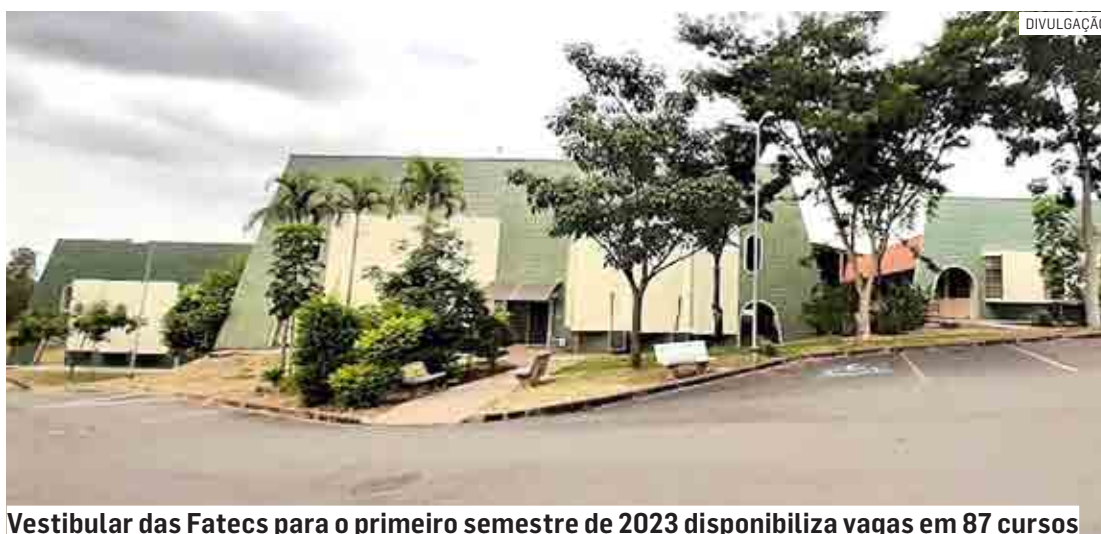
Vestibular das Fatecs para o primeiro semestre de 2023 disponibiliza vagas em 87 cursos

O Vestibular das Fatecs para o primeiro semestre de 2023 disponibiliza vagas em 87 cursos, como Análise e Desenvolvimento de Sistemas, Defesa Cibernética e Gestão Empresarial entre outros, todos gratuitos. Para concorrer a uma vaga, o candidato deve ter cursado o Ensino Médio regular ou equivalente, comprovan-