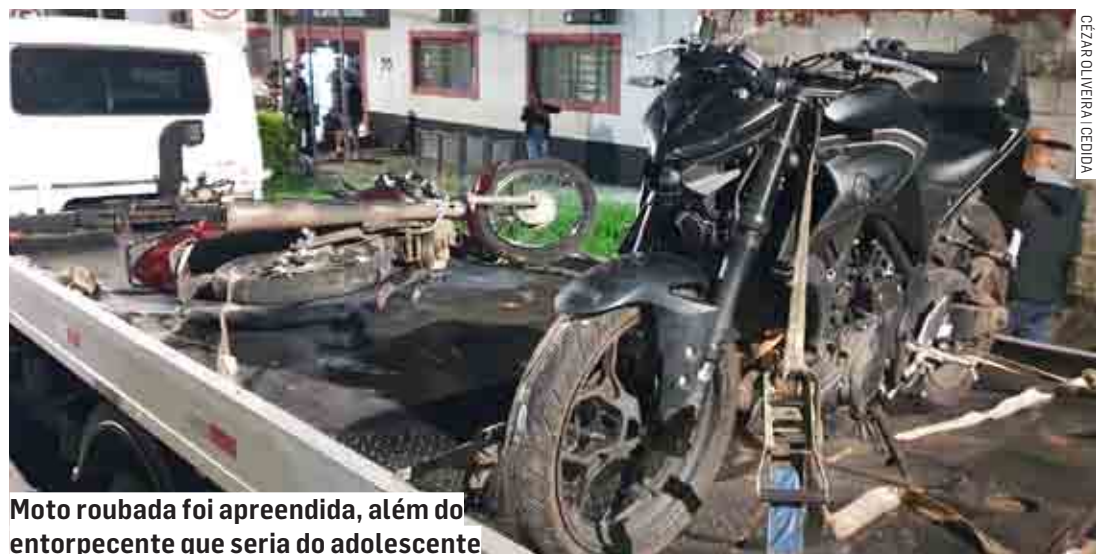
Moto roubada foi apreendida, além do entorpecente que seria do adolescente

Os policiais conduziram o homem, o adolescente, além das motos, drogas e dinheiro até o plantão policial, onde foi registrado o boletim de ocorrência. O homem foi preso por receptação e tráfico, e o adolescente apreendido por tráfico.