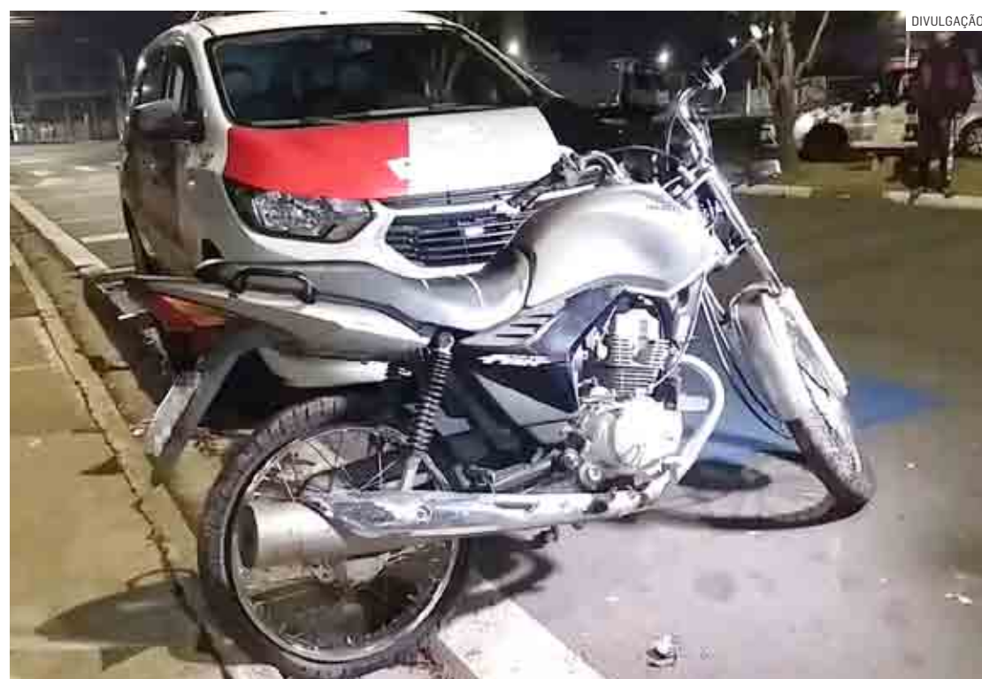
Moto foi recolhida ao pátio após o registro da ocorrência no Plantão Policial de Hortolândia

Cézar Oliveira | HORTOLÂNDIA tribunaliberal@tribunaliberal.com.br