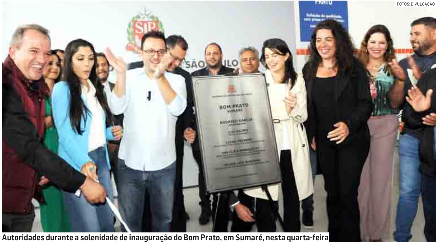
Autoridades durante a solenidade de inauguração do Bom Prato, em Sumaré, nesta quarta-feira

O investimento da Secretaria de Desenvolvimento Social na implantação da nova unidade é de R$ 2 milhões, sendo R$ 1 milhão no custeio das refeições por 12 meses; e o outro R$ 1 milhão na compra de utensílios e maquinários. A unidade para o município foi garantida através de emenda do deputado estadual Dirceu Dalben (Cidadania).