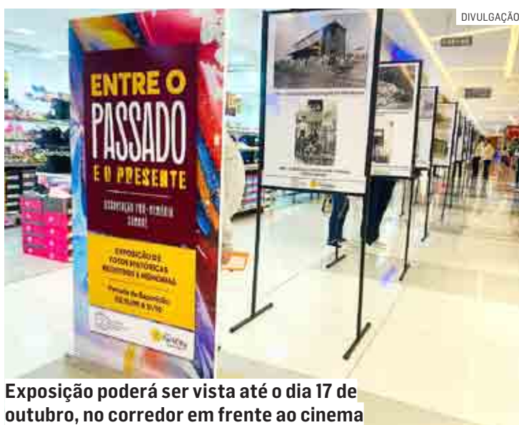
Exposição poderá ser vista até o dia 17 de outubro, no corredor em frente ao cinema

“A abertura da exposição será no dia 15 desse mês com uma cerimônia, às 10h, para marcar nosso compromisso com a preservação da história sumareense. Inclusive, o Shopping ParkCity Sumaré deseja firmar uma parceria com a Associação Pró-Memória de Sumaré, com o objetivo de levar cultura e conheci-