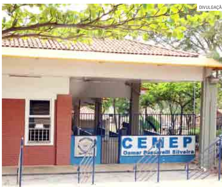
Cemep oferece 83 vagas para o curso Técnico de Informática

Os candidatos deverão estar cursando, obrigatoriamente, o 9º ano do Ensino Fundamental em 2022. Dessa forma, não serão aceitas inscrições