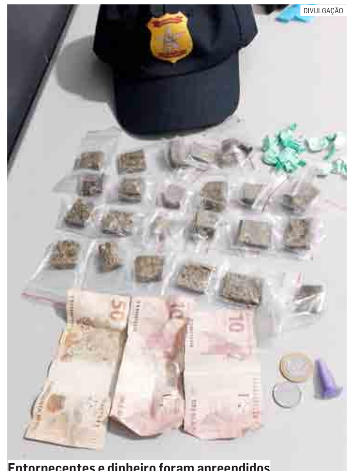
Entorpecentes e dinheiro foram apreendidos

Eles foram conduzidos ao Plantão Policial, onde o homem ficou preso e a adolescente, apreendida.