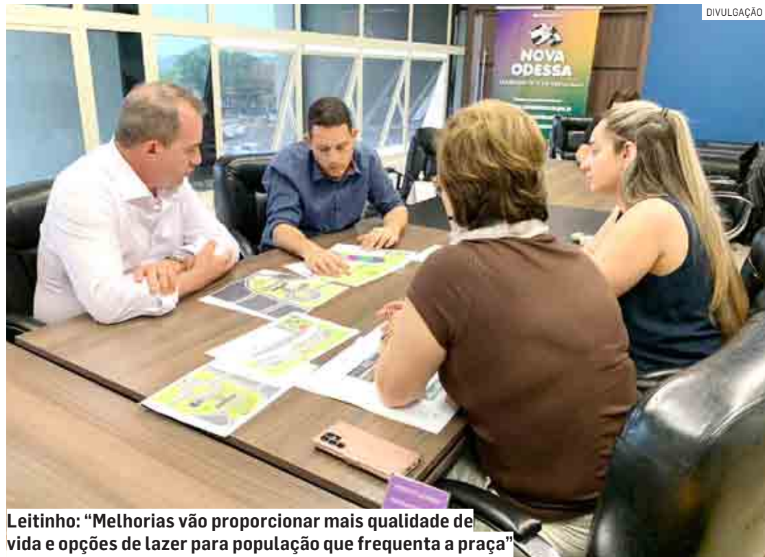
Leitinho: “Melhorias vão proporcionar mais qualidade de vida e opções de lazer para população que frequenta a praça”

Na frente da prefeitura, vai ser criada também uma área de descanso para os servidores municipais, uma fonte interativa (que promete ser uma das primeiras da Região Metropolitana) e um “cenário” com pergolado para as tradicionais fotos de noivas e aniversariantes de todas as idades nos jardins do complexo administrativo. A Praça dos Três poderes deve ganhar uma área urbanizada para o convívio dos jovens.