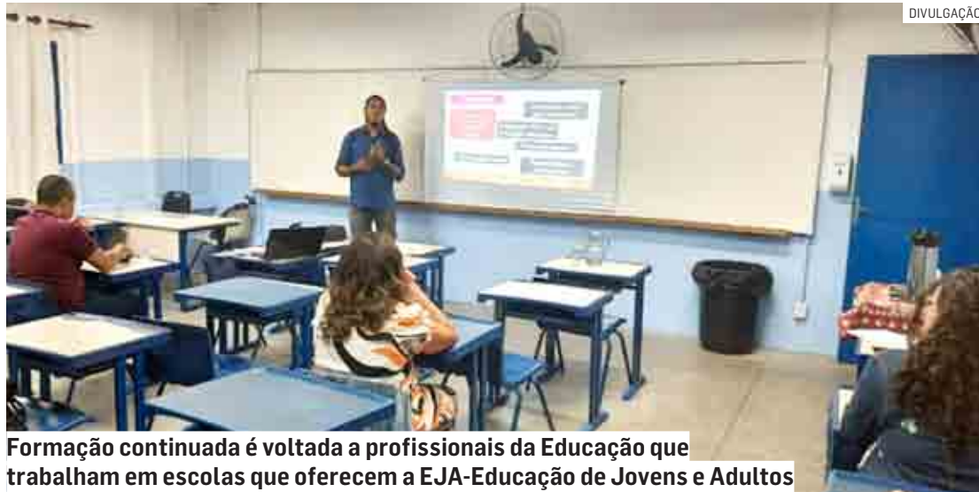
Formação continuada é voltada a profissionais da Educação que trabalham em escolas que oferecem a EJA-Educação de Jovens e Adultos