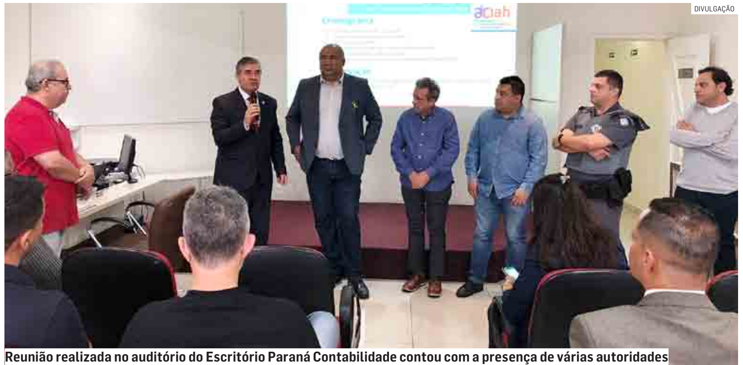
Reunião realizada no auditório do Escritório Paraná Contabilidade contou com a presença de várias autoridades

Segundo relatos de algumas das vítimas, bandidos se aproveitam quando o comércio está fechado, para efetuar os crimes. E durante o dia, os lojistas estão sendo prejudicados devido à invasão de seus comércios, por moradores de rua que entram sem autorização para pedir esmolas aos clientes, que sentem-se coagidos pela maneira de sua abordagem “em tom intimidador”. Além disso, eles estariam invadindo as lojas para urinar e defecar em locais não apropriados. Apontaram, também, a mendicância em semáforos com uso de ferramentas e facas.