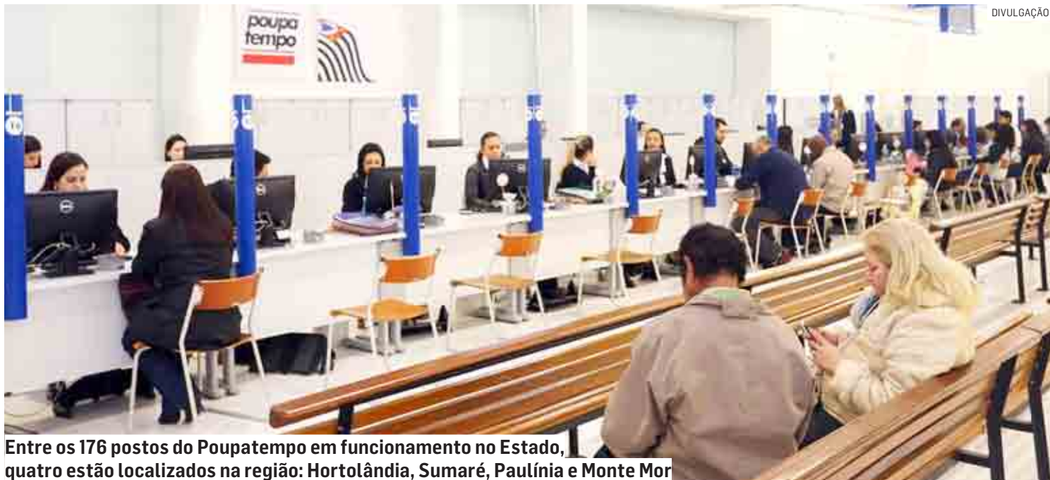
Entre os 176 postos do Poupatempo em funcionamento no Estado, quatro estão localizados na região: Hortolândia, Sumaré, Paulínia e Monte Mor

Os documentos que forem solicitados a partir de agora já serão emitidos no novo modelo da CNH pelo Detran-SP. Atendendo à Resolução nº 886 do