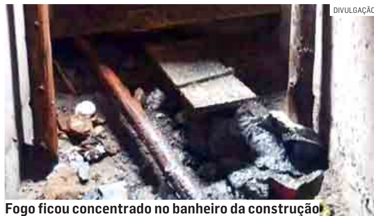
Fogo ficou concentrado no banheiro da construção

O fogo se concentrou no banheiro da construção, atingindo lixo e madeiras que estavam no cômodo. Os bombeiros controlaram as chamas e retornaram à sede.