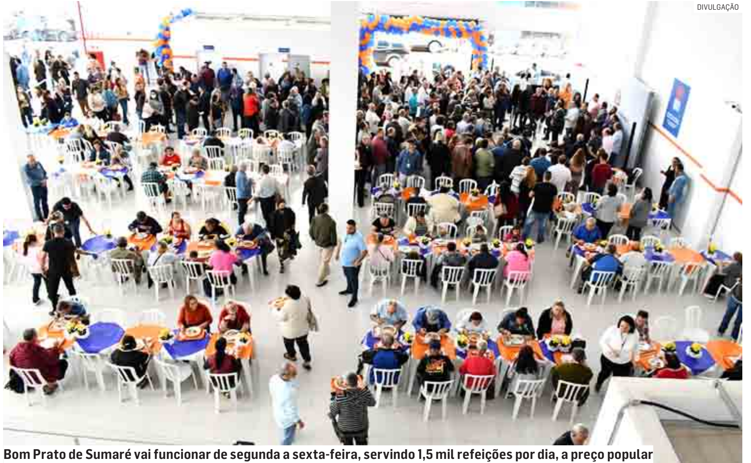
Bom Prato de Sumaré vai funcionar de segunda a sexta-feira, servindo 1,5 mil refeições por dia, a preço popular

O governo do Estado entregou, nesta quarta-feira (14), o Bom Prato de Sumaré. O restaurante servirá, 1,5 mil refeições por dia, sendo 300 cafés da manhã. Os valores cobrados são de R$ 1 o almoço e R$ 0,50 o café da manhã. E vai funcionar de segunda a sexta-feira, das 7h às 14h. O Bom Prato foi instalado em um imóvel na Rua José Maria Miranda, 581, no centro. A unidade para o município foi garantida através de emenda do deputado estadual Dirceu Dalben (Cidadania). PÁGINA 03