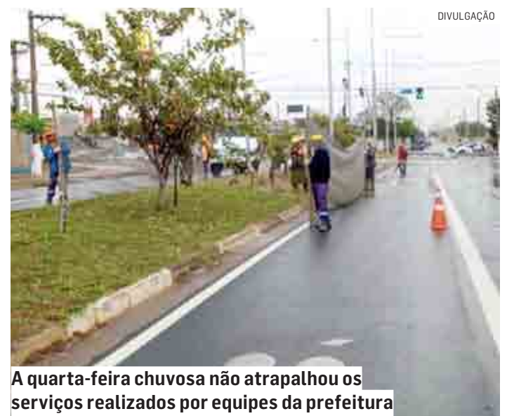
A quarta-feira chuvosa não atrapalhou os serviços realizados por equipes da prefeitura