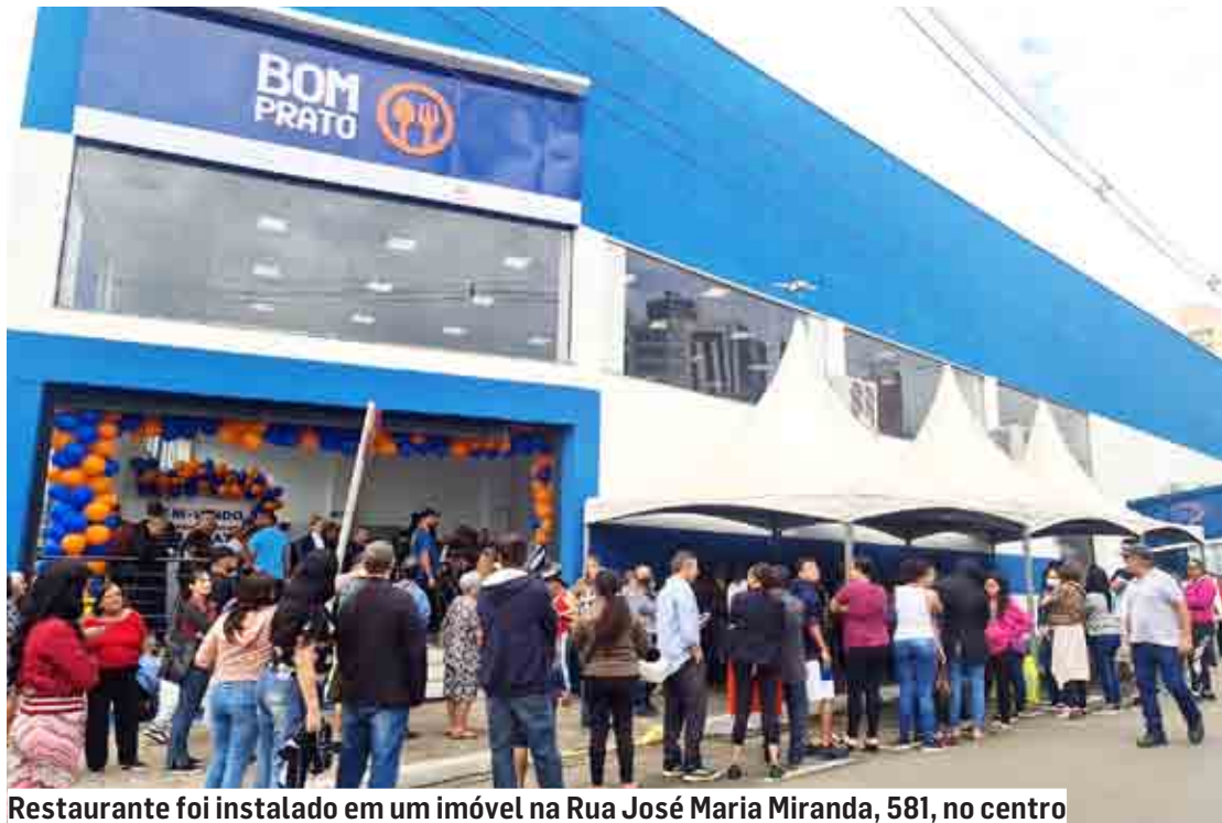
Restaurante foi instalado em um imóvel na Rua José Maria Miranda, 581, no centro