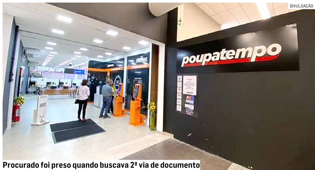
Procurado foi preso quando buscava 2ª via de documento

Um motociclista foi parado por policiais militares e durante abordagem confessou que não possuía habilitação. Foi realizada consulta via Copom sendo constatado que ele era procurado pela Justiça. O homem foi conduzido até a delegacia e permaneceu preso.