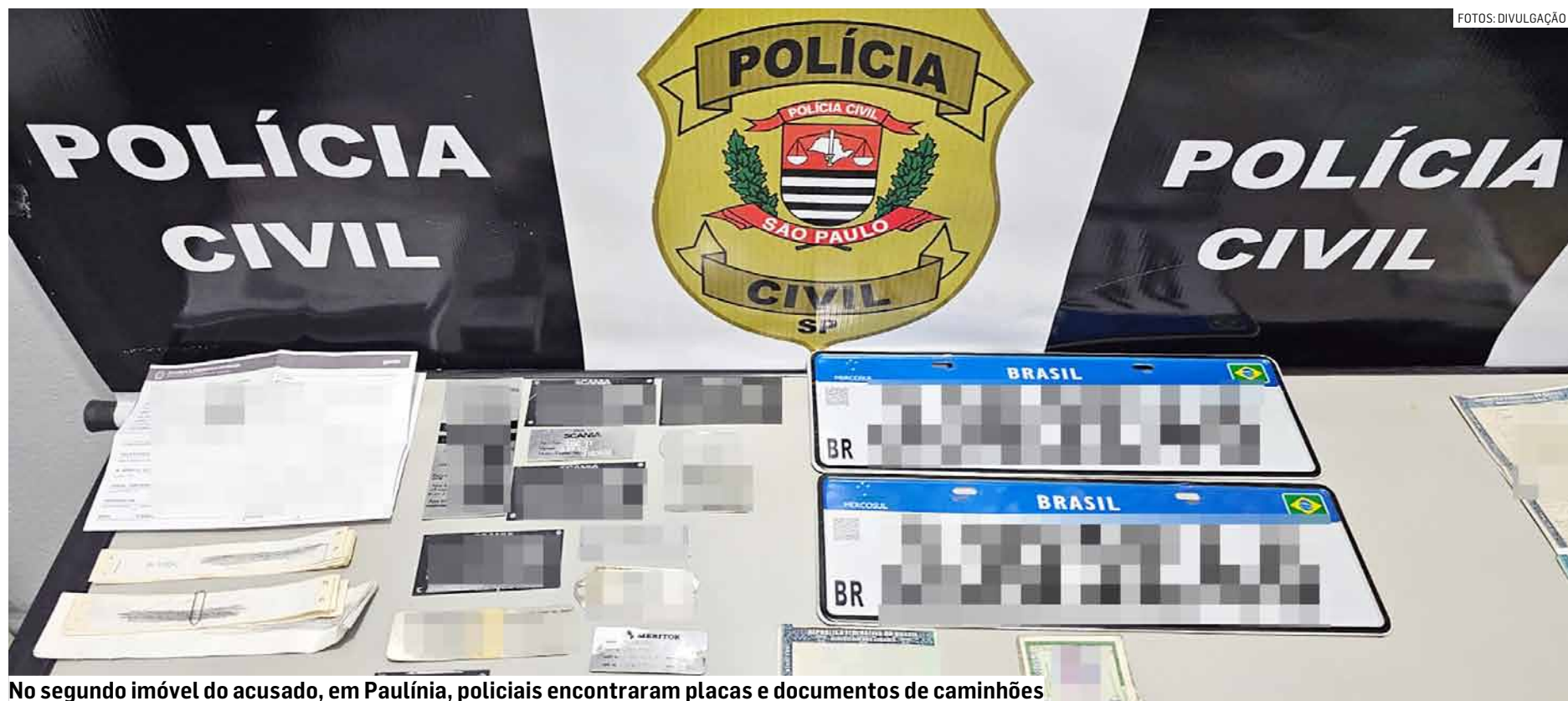
No segundo imóvel do acusado, em Paulínia, policiais encontraram placas e documentos de caminhões

O suspeito alegou ter adquirido de pessoa que não