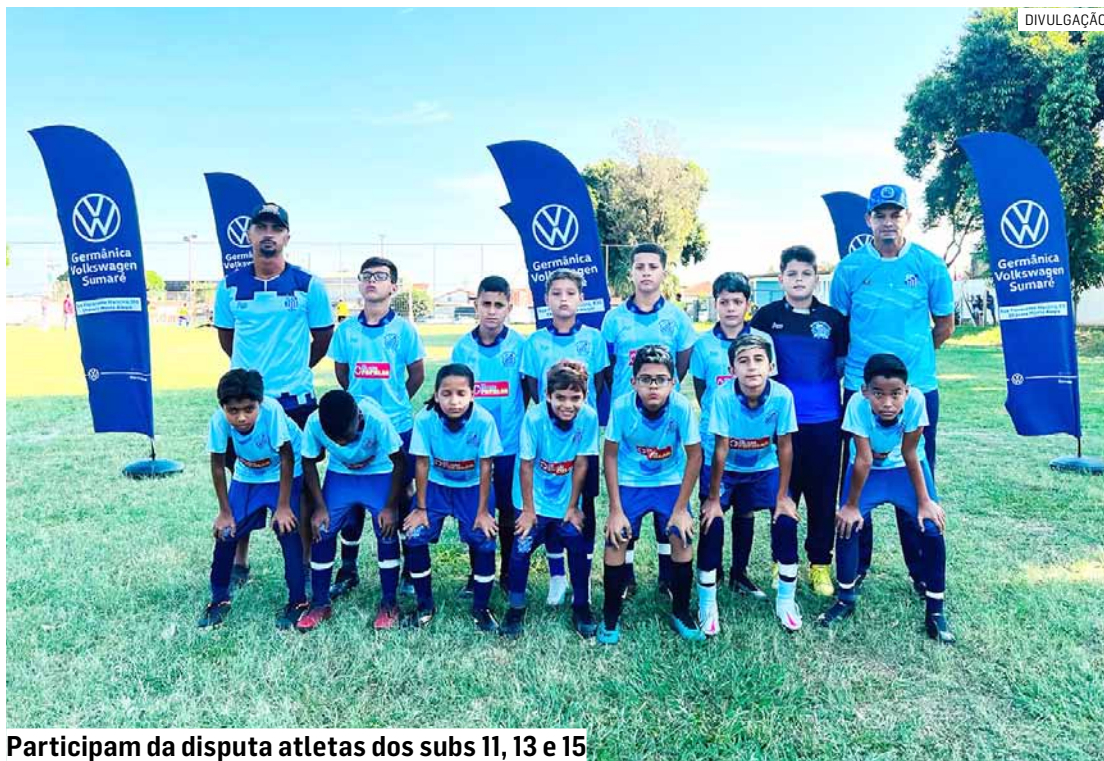
Participam da disputa atletas dos subs 11, 13 e 15

Pela categoria sub 11, a primeira final será entre Alvorada e União Três Pontes, às 7h45. Já CT Timão e EF Bom de Bola disputam o tí-