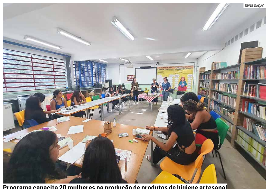
Programa capacita 20 mulheres na produção de produtos de higiene artesanal

Essa semana ocorre o terceiro encontro do projeto quando será introduzido o modelo "Empreendedorismo e Gestão".