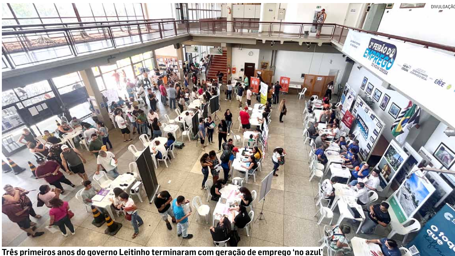
Três primeiros anos do governo Leitinho terminaram com geração de emprego 'no azul'

Desde janeiro de 2021, quando entrou em vigência a atual política municipal de Desenvolvimento, já são 3.397 empregos criados na cidade. Foram gerados 1.605 novos postos de trabalho em 2021, mais 690 em 2022 e 318 em 2023. Entre 2021 e 2023, portanto, foram 2.613 empregos criados pelas empresas da cidade – uma média de quase 900 vagas por ano, que já está quase sendo alcançada agora em 2024.