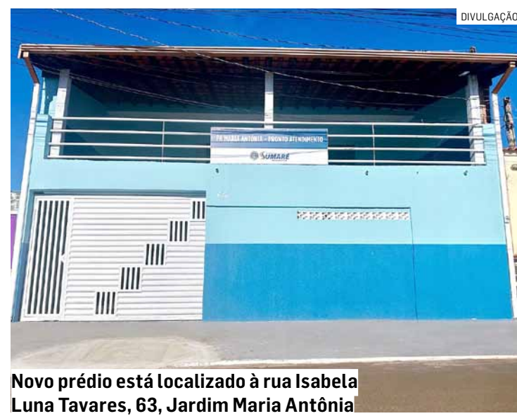
Novo prédio está localizado à rua Isabela Luna Tavares, 63, Jardim Maria Antônia

Esse é mais um investimento na região do Maria Antônia, que recebeu o bosque dos Lagos Cidade Orquídea, o CEU (Centro de Esportes e Artes Unificado) Recanto dos Sonhos, nova unidade de saúde no Florely, praça do Florely, pontes do Maria Antônia e Salerno, e está em andamento o projeto para dar sequência à construção da UPA Maria Antônia.