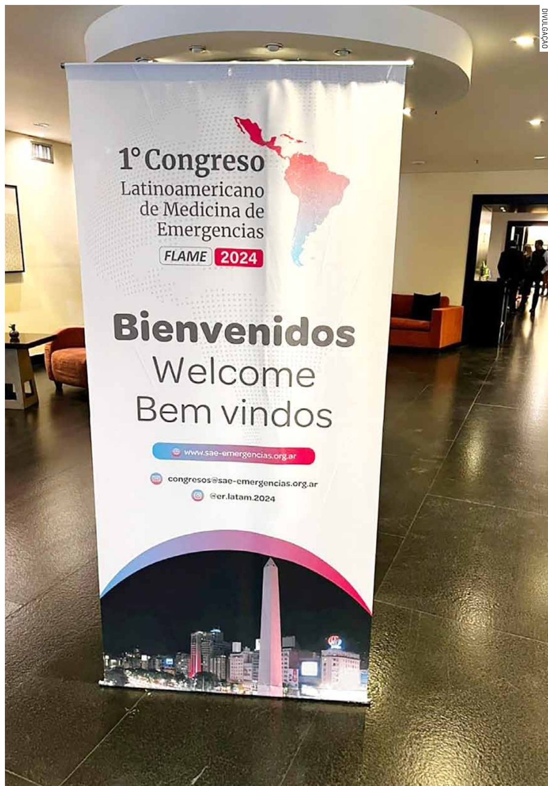
Samu de Hortolândia foi o único a apresentar casos de atendimento pré-hospitalar no evento

Em paralelo ao trabalho de atendimento de ocorrências, o Samu de Hortolândia realiza uma programação constante de capacitações para servidores municipais de outros órgãos da prefeitura e para a população.