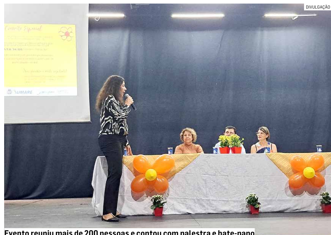
Evento reuniu mais de 200 pessoas e contou com palestra e bate-papo

Da Redação • SUMARÉ tribunaliberal@tribunaliberal.com.br