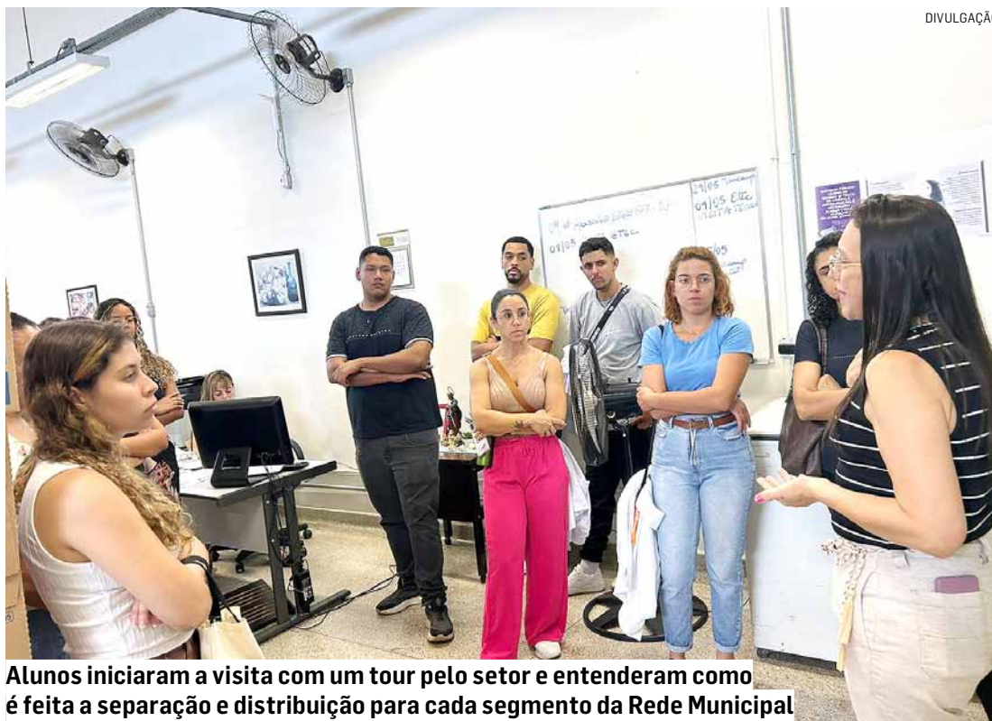
Alunos iniciaram a visita com um tour pelo setor e entenderam como é feita a separação e distribuição para cada segmento da Rede Municipal

“Temos muito orgulho e segurança em receber no