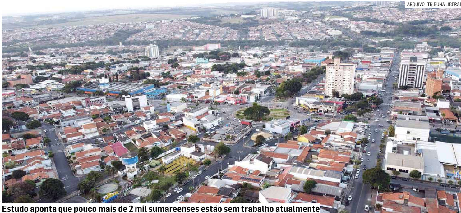
Estudo aponta que pouco mais de 2 mil sumareenses estão sem trabalho atualmente

Esse resultado significa que apenas 2.197 pessoas da PEA (População Economicamente Ativa) em Sumaré estão desempregadas, um número baixo em relação à sua população total, na faixa dos 300 mil moradores.