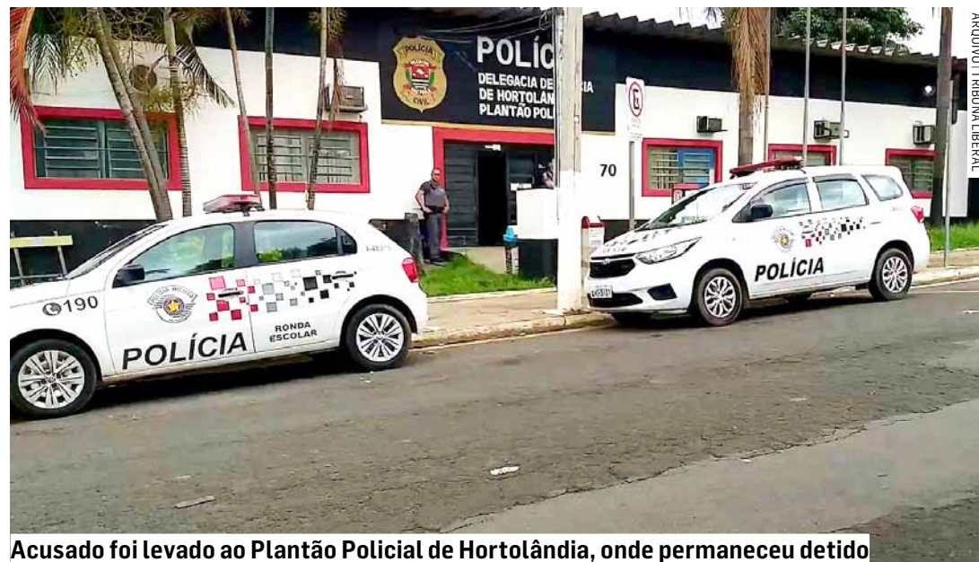
Acusado foi levado ao Plantão Policial de Hortolândia, onde permaneceu detido

Cézar Oliveira • HORTOLÂNDIA tribunaliberal@tribunaliberal.com.br