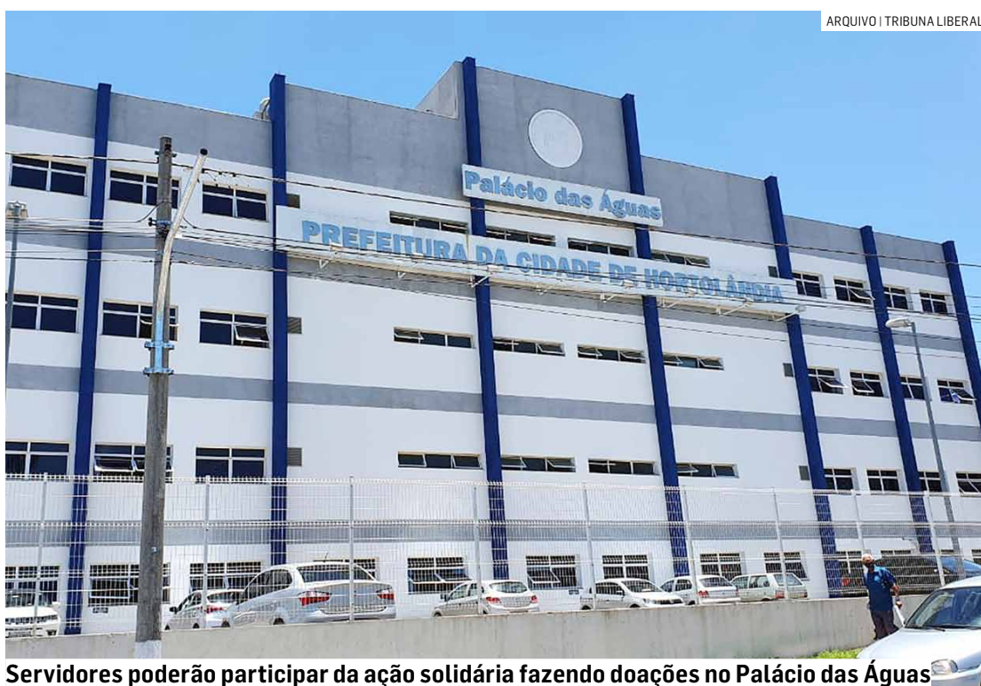
Servidores poderão participar da ação solidária fazendo doações no Palácio das Águas

Entre os produtos de higiene e cuidados pessoais, a população poderá colaborar com a doação de itens como creme dental, escova de dente, sabonete, toalha de banho, absorventes e shampoo. Todos os itens dessa categoria deverão ser doados novos.