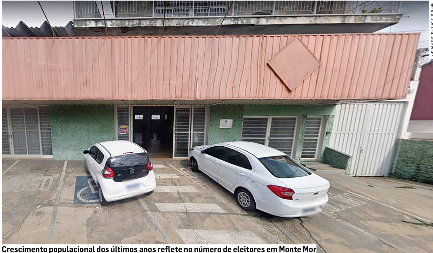
Crescimento populacional dos últimos anos reflete no número de eleitores em Monte Mor

Entre os eleitores aptos a votar, um destaque importante é o número daqueles que possuem cadastro biométrico. Dos 46.204 eleitores, 40.411 estão com a biometria cadastrada, o que equivale a 87,46% do elei-