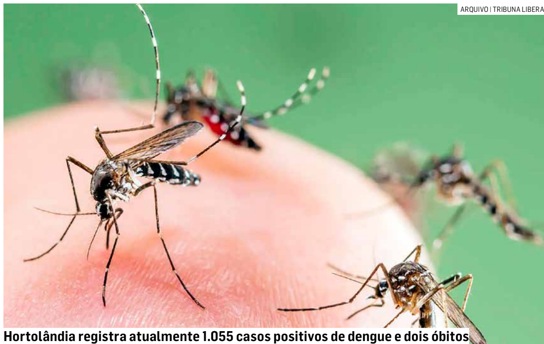
Hortolândia registra atualmente 1.055 casos positivos de dengue e dois óbitos

A Secretaria de Saúde destacou que o fenômeno da onda de calor que persiste no Brasil, favorece a reprodução mosquito. Por isso é importante que a população reforce os cuidados contra o vetor de transmissão. Uma medida simples