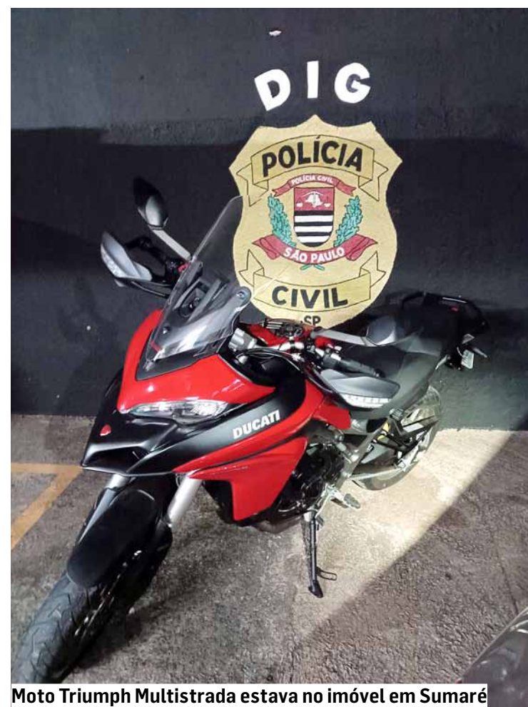
Moto Triumph Multistrada estava no imóvel em Sumaré

O motorista foi conduzido até a sede da DIG de Americana, onde foi autuado por receptação e crime contra a ordem econômica, permanecendo à disposição da Justiça.