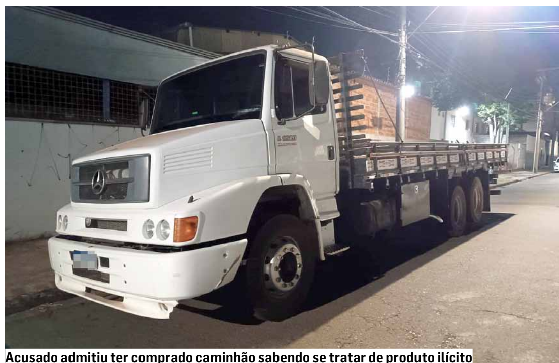
Acusado admitiu ter comprado caminhão sabendo se tratar de produto ilícito

quis fornecer o nome, telefone, paradeiro ou endereço, levantando a suspeita de se tratar de veículo produto de ilícito.