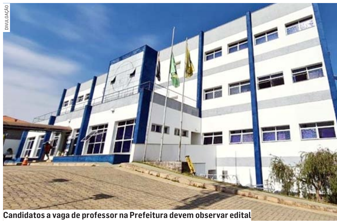
Candidatos a vaga de professor na Prefeitura devem observar edital