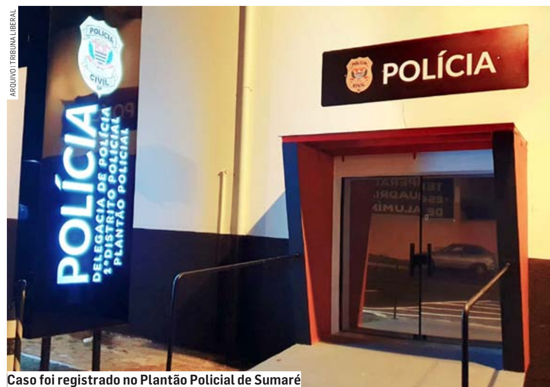
Caso foi registrado no Plantão Policial de Sumaré

Cézar Oliveira | SUMARÉ tribunaliberal@tribunaliberal.com.br