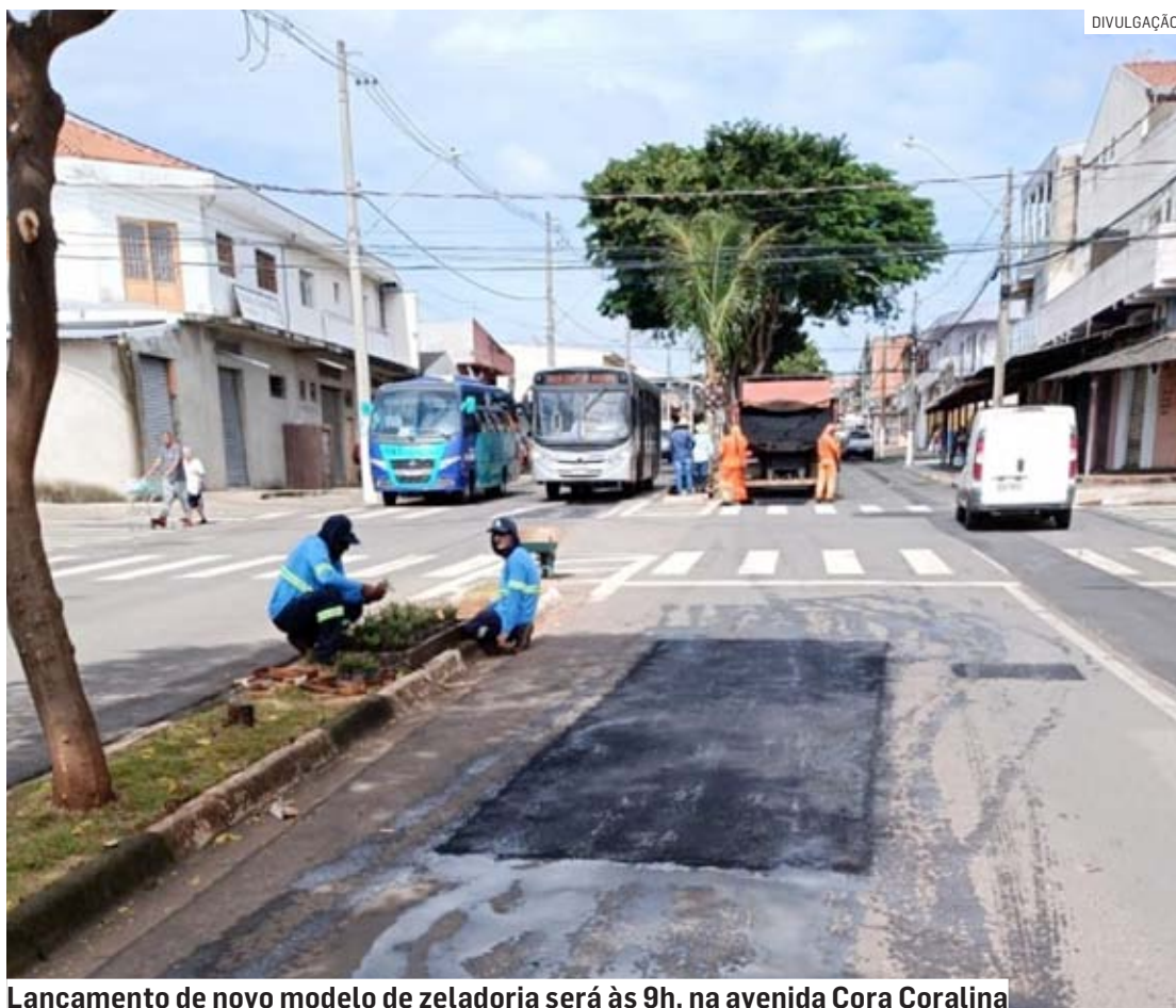
Lançamento de novo modelo de zeladoria será às 9h, na avenida Cora Coralina

Os equipamentos de varrição mecanizada que serão usados por equipes da Prefeitura de Hortolândia para a implantação da nova diretriz de limpeza urbana que começará no Jardim Amanda e, depois, será ampliada para toda a cidade, serão apresentados às 9h desta quarta-feira (15), na avenida Cora Coralina, 239. Desde a semana passada, o bairro recebe o mutirão de serviços de zeladoria representando o pontapé inicial da modernização dos conceitos de limpeza urbana e cuidados ambientais. Os moradores e comerciantes passaram por um trabalho de sensibilização