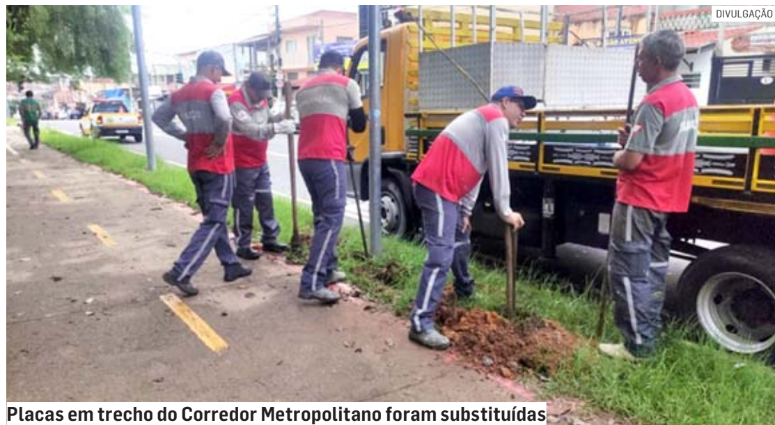
Placas em trecho do Corredor Metropolitano foram substituídas

Da Redação | HORTOLÂNDIA tribunaliberal@tribunaliberal.com.br