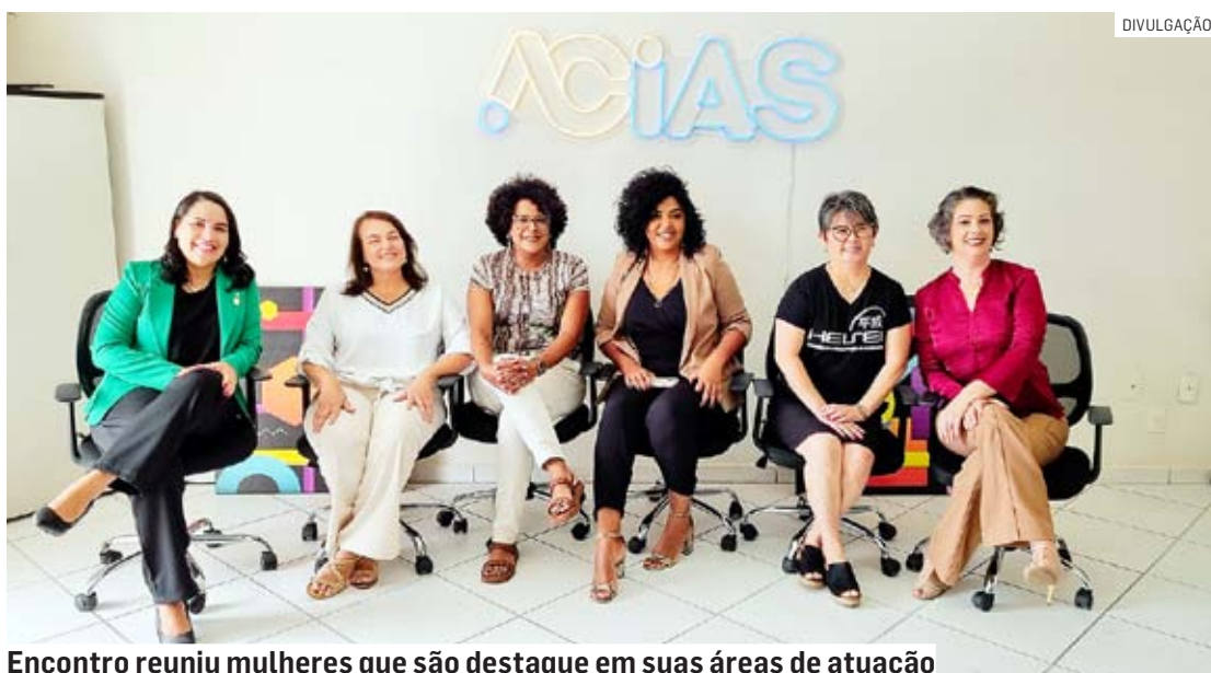
Encontro reuniu mulheres que são destaque em suas áreas de atuação

A necessidade de se tornar protagonista da sua