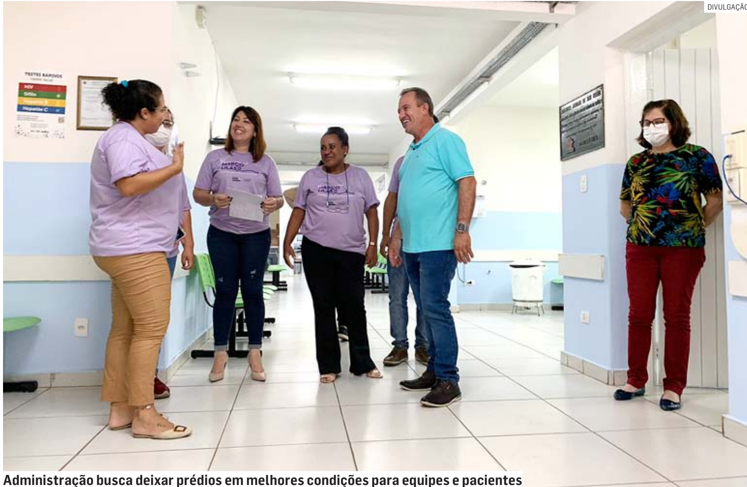
Administração busca deixar prédios em melhores condições para equipes e pacientes

Na UBS 2, no Jardim São Jorge, que sofreu danos recentes no telhado causados por um galho derrubado durante um vendaval, os consertos incluíram a troca de telhas e da cumeeira do prédio, troca de vidros,