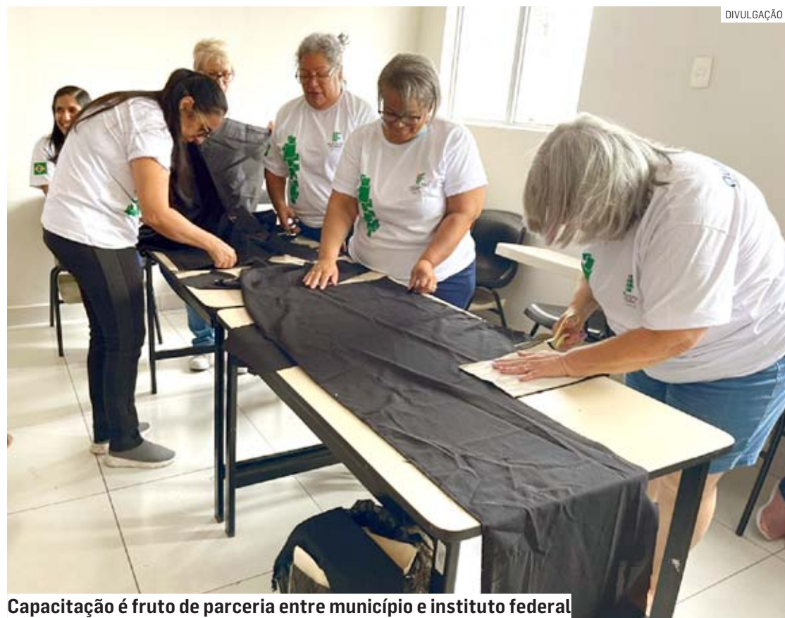
Capacitação é fruto de parceria entre município e instituto federal

A ação tem o objetivo de oferecer formação, visando a inclusão produtiva, o empreendedorismo, a empregabilidade e a geração de renda.