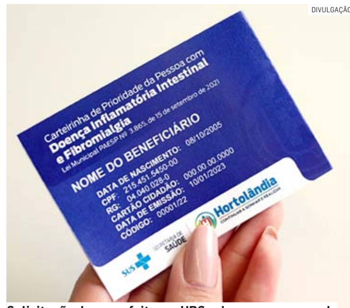
Solicitação deve ser feita em UBS e doença comprovada

Hortolândia emitiu a carteirinha para pessoas diagnosticadas com fibromialgia ou doença inflamatória intestinal. A ação é realizada em cumprimento à Lei Municipal 3.865, de setembro de 2021. De acordo com a lei, os portadores da carteirinha têm direito a atendimento especial e preferencial em estabelecimentos públicos e privados da cidade. A emissão é feita pela Secretaria de Saúde.