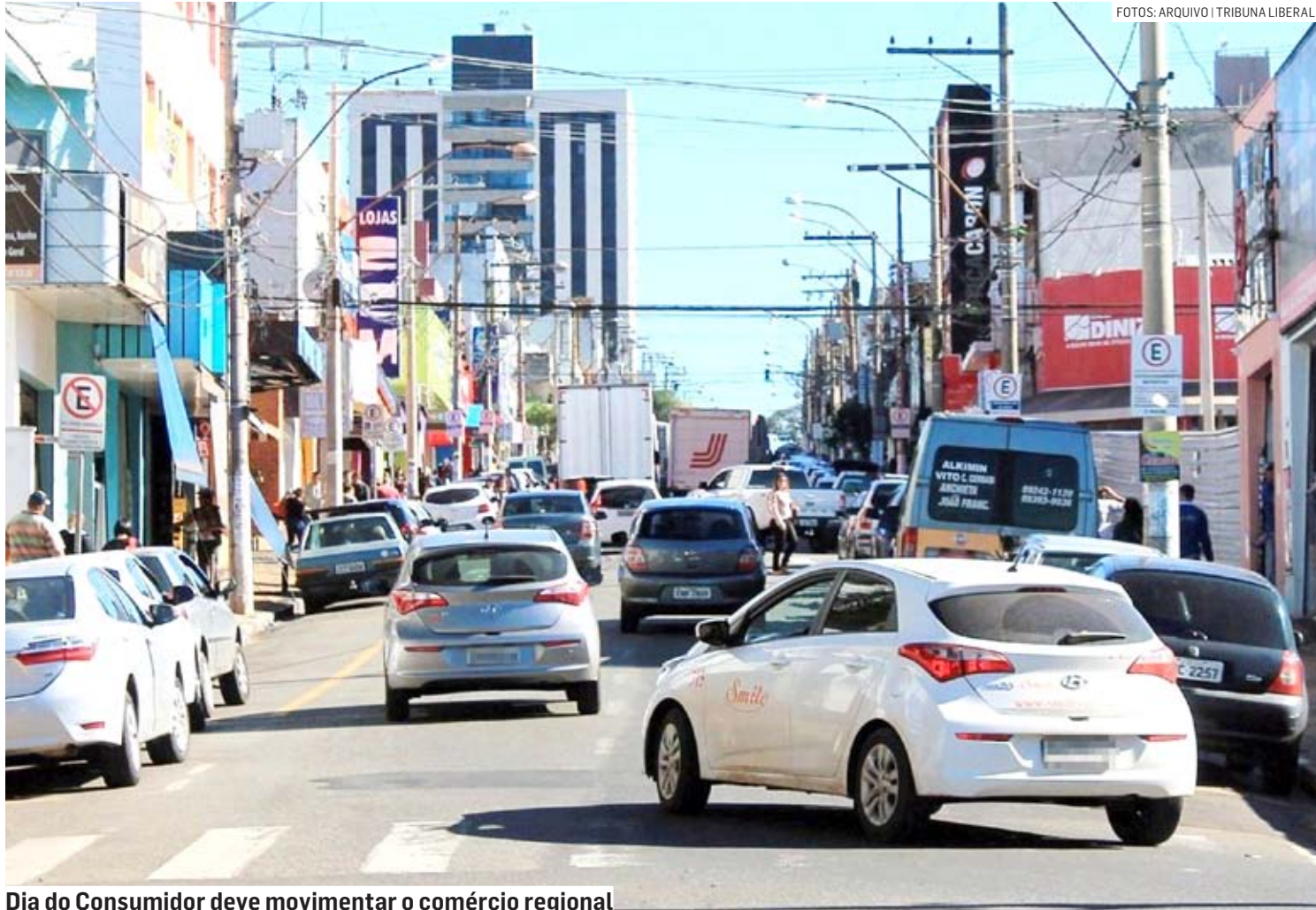
Dia do Consumidor deve movimentar o comércio regional