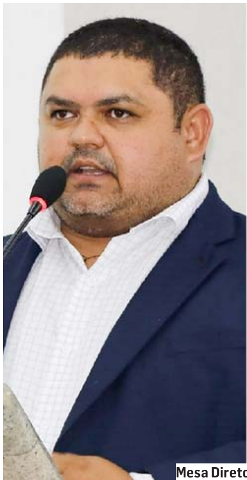
Mesa Diretora é autora do PL que garantiu a reposição inflacionária

A reposição foi garantida a partir da aprovação do Projeto de Lei 12/2023, de autoria da Mesa Diretora da Casa, votado na sessão ordinária. A propositura contou com o voto favorável de todos os parlamentares. A regra, que ainda depende da sanção do prefeito, Edivaldo Brischi (PTB), tem efeitos retroativos a