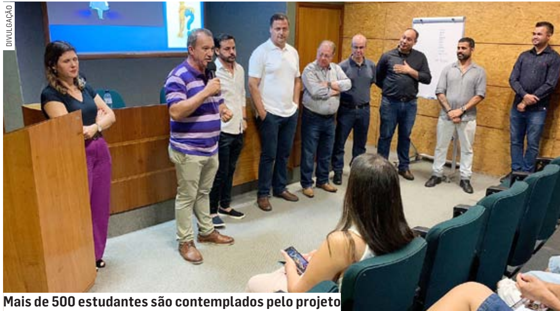
Mais de 500 estudantes são contemplados pelo projeto

Organizado pela Secretaria Municipal de Desenvolvimento Econômico e Social e pela DRE (Diretoria Regional de Ensino), com apoio da Secretaria Municipal de Educação e do Grupo A Executiva, o programa atende mais