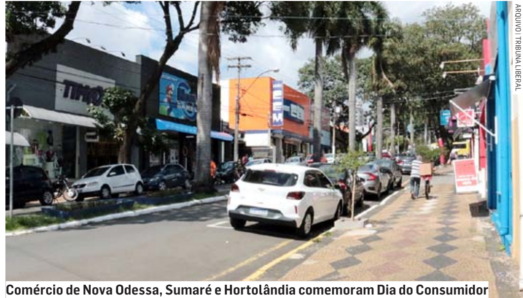
Comércio de Nova Odessa, Sumaré e Hortolândia comemoram Dia do Consumidor

Nesta quarta-feira, 15 de março, é comemorado o Dia Mundial do Consumidor, uma data para conscientizar as pessoas sobre seus direitos e responsabilidades como clientes e compradores. A data foi estabelecida em 1962 pelo então presidente dos Estados Unidos, John Kennedy. As associações comerciais da região pontuam a importância de as empresas oferecerem condições especiais aos clientes a fim de homenageá-los e aproximá-los dos lojistas.