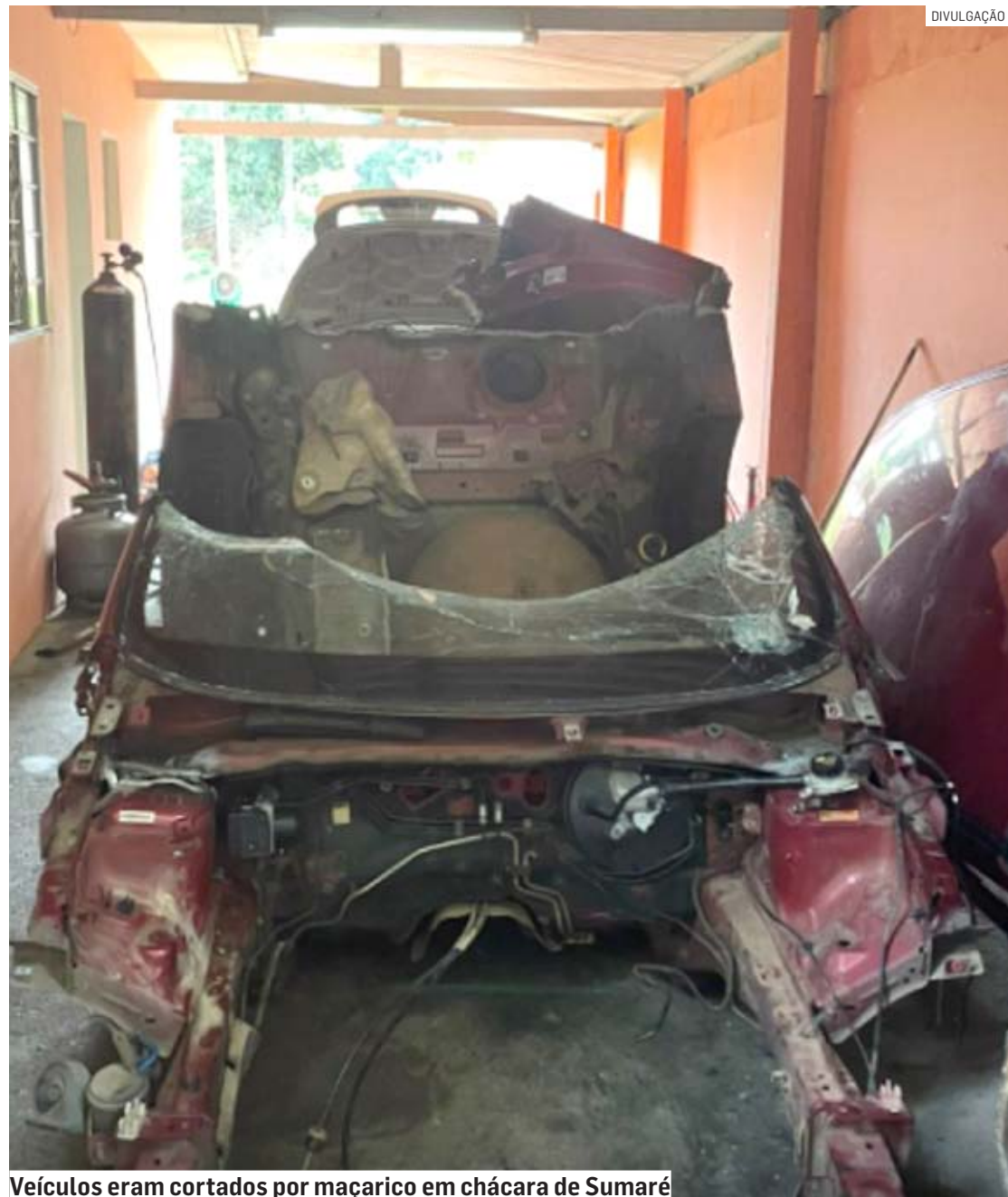
Veículos eram cortados por maçarico em chácara de Sumaré

Ambos foram conduzidos ao Plantão Policial de Sumaré, onde ficaram à disposição da justiça, pelos crimes de adulteração de sinais identificadores de veículo e receptação.