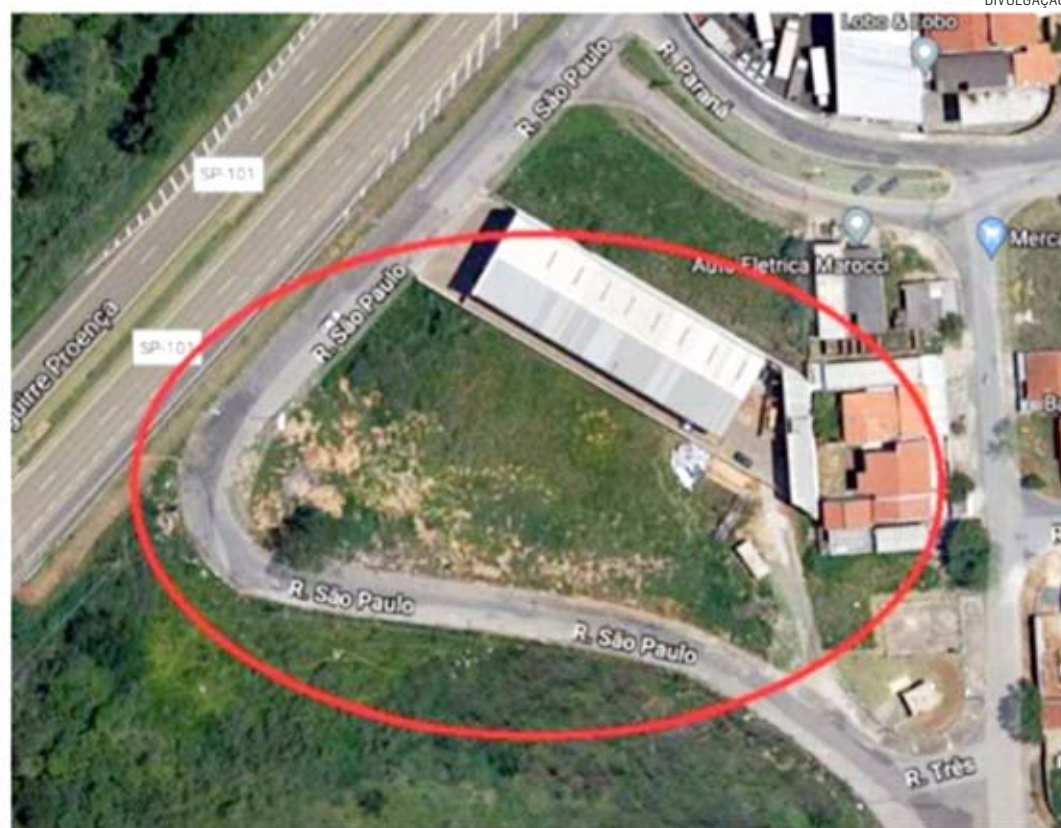
Imagem aérea do terreno onde será construída a nova escola, no Engenho

gião do Jd do Engenho”, diz o prefeito, em trecho da justificativa do Projeto. “O município cons-