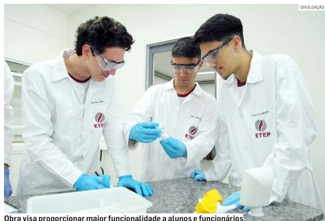
Obra visa proporcionar maior funcionalidade a alunos e funcionários