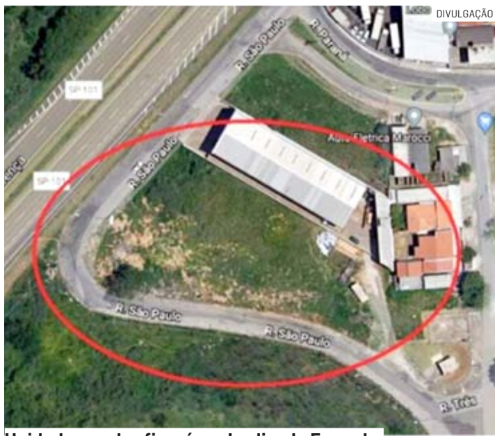
Unidade escolar ficará no Jardim do Engenho

Os vereadores de Monte Mor aprovaram por unanimidade o Projeto de Lei 5/2023, da Prefeitura, que autoriza a inclusão de crédito adicional de R$ 12,7 milhões no orçamento visando à construção de escola no bairro Jardim do Engenho. A verba é decorrente de "excesso de arrecadação", proveniente de Termo de Compromisso que direciona recursos do Governo do Estado ao município.