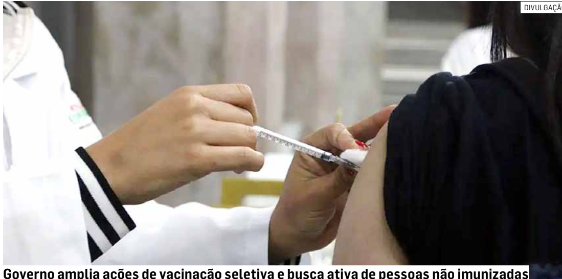
Governo amplia ações de vacinação seletiva e busca ativa de pessoas não imunizadas

A Secretaria de Estado da Saúde confirmou no último dia 6, por meio do Instituto Adolfo Lutz (IAL), que exames realizados em quatro macacos encontrados mortos na área de mata do campus da Universidade de São Paulo (USP), em Ribeirão Preto, testaram positivo para a febre amarela. Além disso, exa-