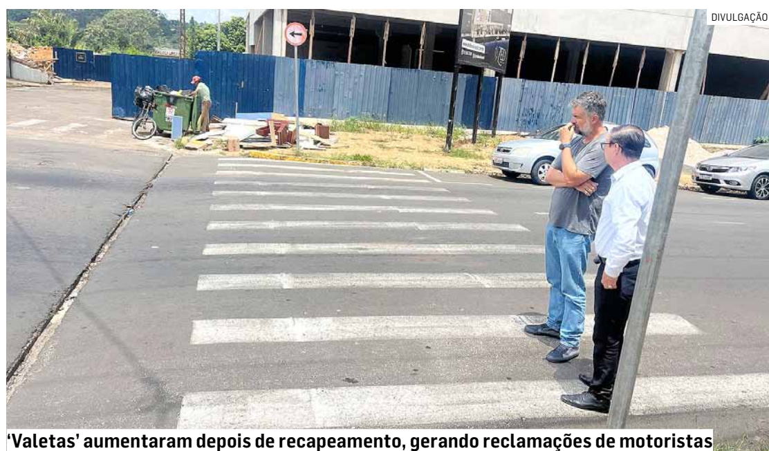
‘Valetas’ aumentaram depois de recapeamento, gerando reclamações de motoristas

Além dos dois quarteirões da Carlos Botelho situados entre as esquinas atendidas pela obra, também serão interditados os trechos finais da própria Avenida João Pessoa, da Rua Aristeu Valente e - por causa das mãos de direção - também uma mão de direção da Rua Washington Luiz. Os motoristas devem obedecer a sinalização