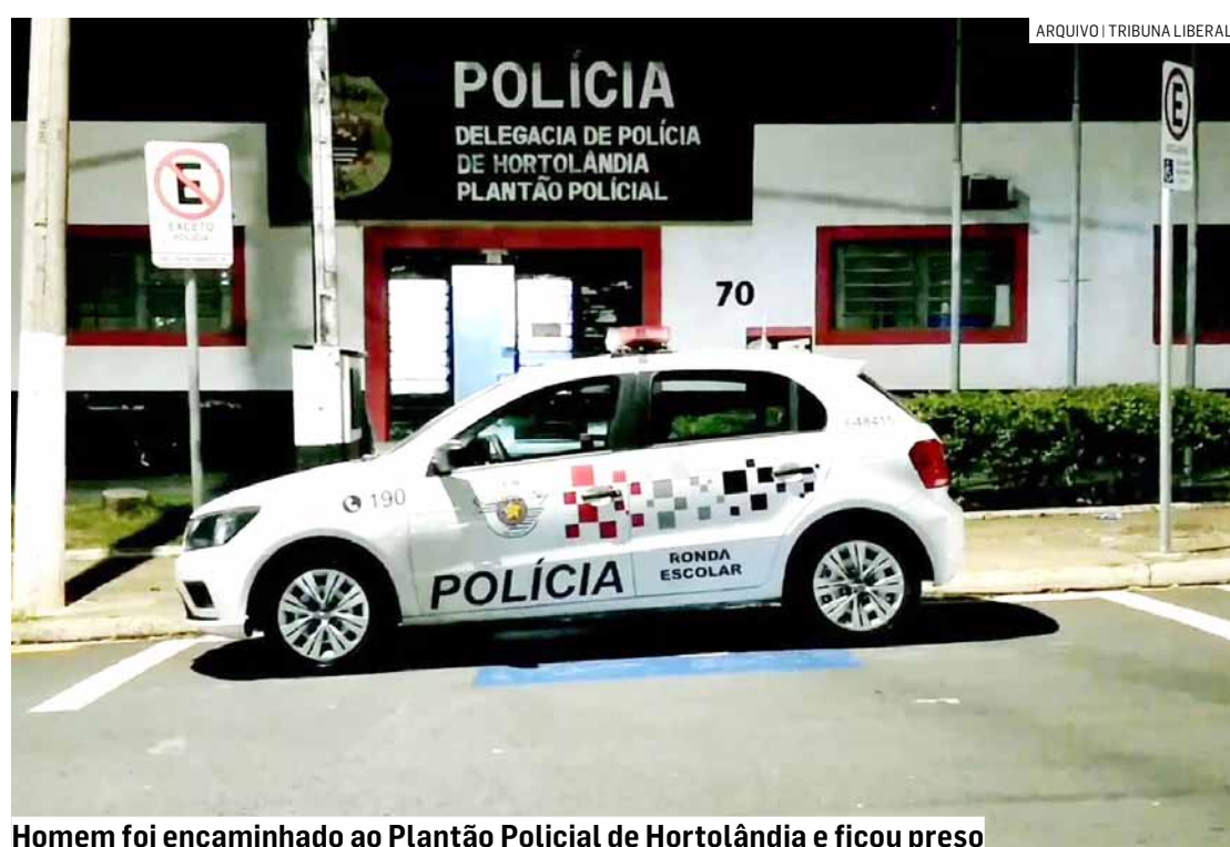
Homem foi encaminhado ao Plantão Policial de Hortolândia e ficou preso

O abordado foi questionado sobre a posse da mochila, informou que estava fazendo "um favor" a um amigo e que levaria a mochila até o ponto de tráfico, onde a deixaria em uma árvore. Diante dos fatos, o abordado foi conduzido ao Plantão Policial de Hortolândia, onde permaneceu à disposição da Justiça.