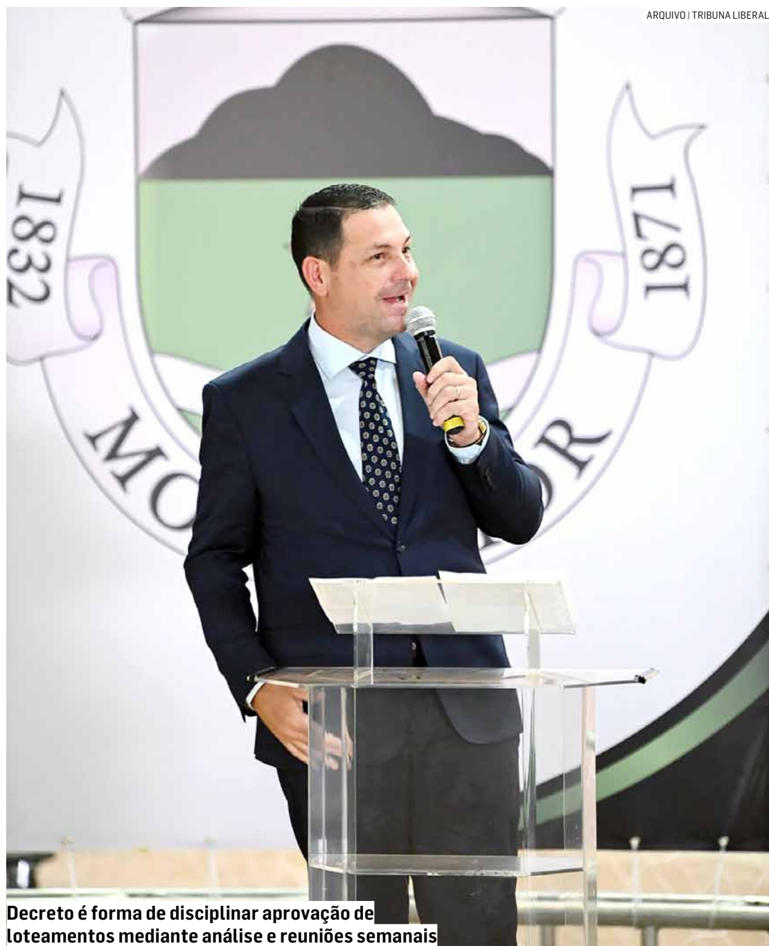
Decreto é forma de disciplinar aprovação de loteamentos mediante análise e reuniões semanais