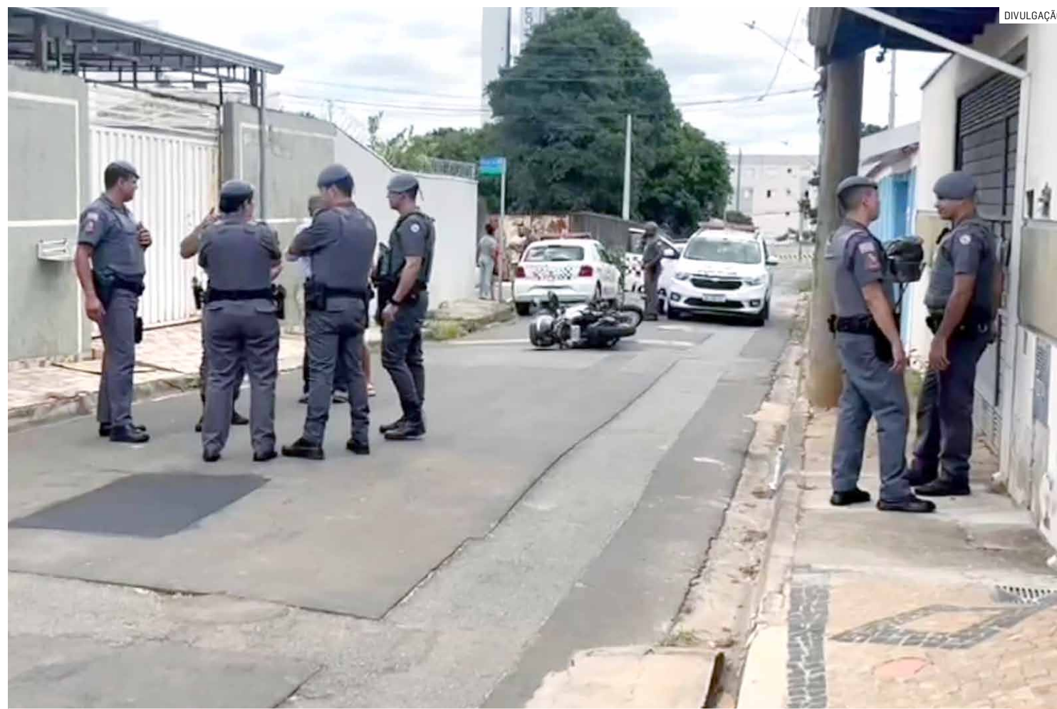
Tentativa de roubo a uma moto BMW ocorreu nesta terça-feira (14), na Chácara Assay; PM trocou tiros com bandidos

Homem, de 70 anos, foi alvejado com dois tiros, sendo atingido no olho em meio a uma tentativa de roubo a uma moto da marca BMW, na Chácara Assay; policial à paisana reagiu e frustrou dupla de assaltantes durante troca de tiros