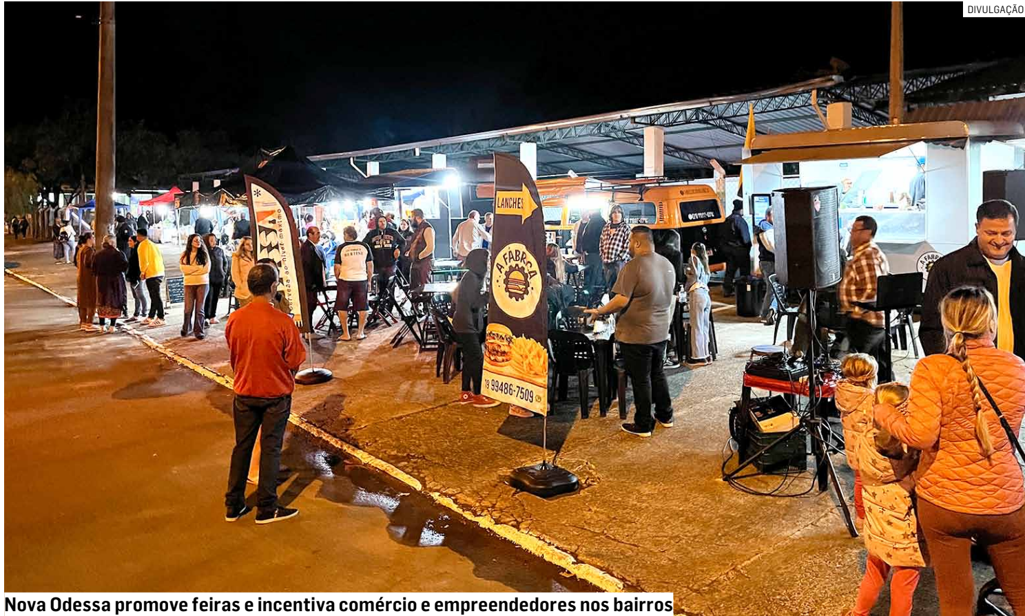
Nova Odessa promove feiras e incentiva comércio e empreendedores nos bairros