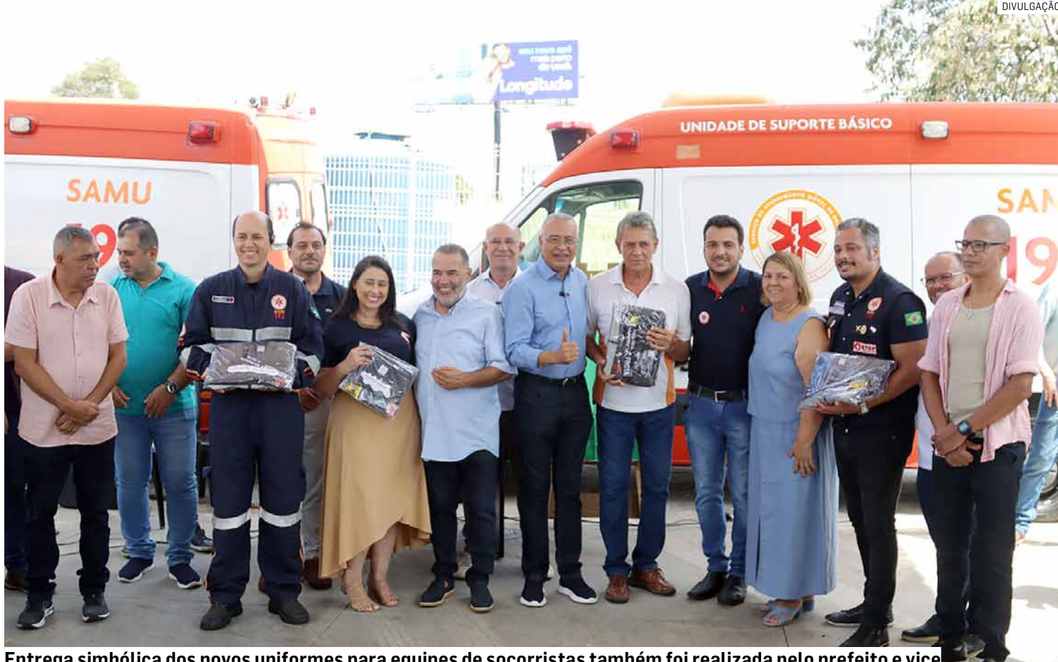
Entrega simbólica dos novos uniformes para equipes de socorristas também foi realizada pelo prefeito e vice