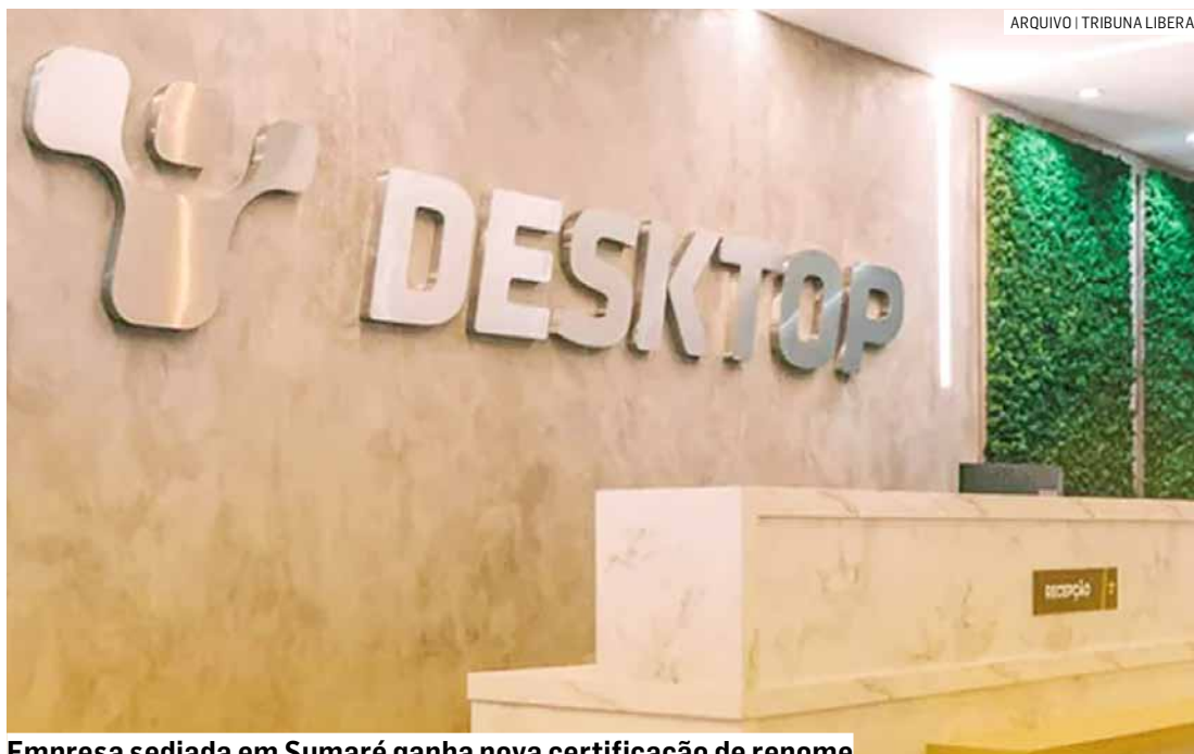
Empresa sediada em Sumaré ganha nova certificação de renome