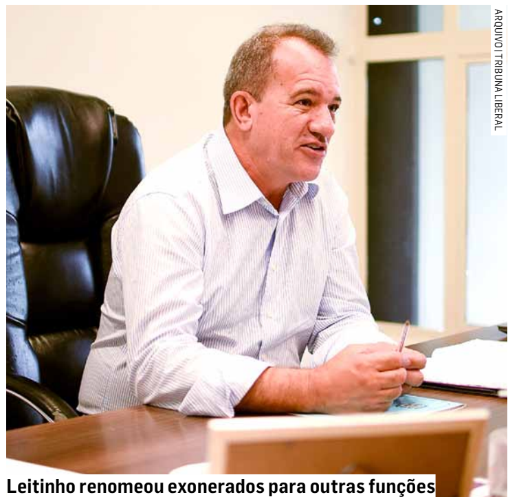
Leitinho renomeou exonerados para outras funções