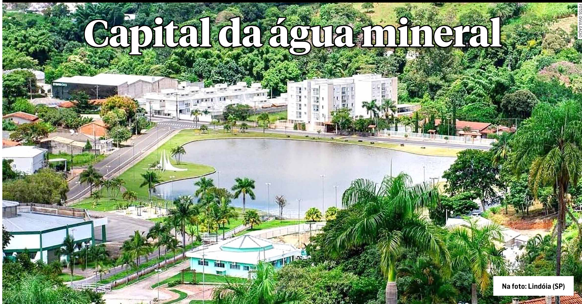
Na foto: Lindóia (SP)

Quarenta por cento de toda água mineral consumida no Brasil é procedente da pequena cidade de Lindóia, a 156 km da capital, através de 9 diferentes rótulos. Fundada em 1899, somente foi emancipada em 1965. Por iniciativa do Lions Clube, uma enorme “Garrafona de Água Mineral” é um marco em homenagem aos seus emancipadores, monumento muito fotografado por visitantes. A atual cidade de Lindóia era apenas um distrito da cidade de Águas de Lindóia, tendo sido desmembrada por Lei Estadual de 1964 e instalada no ano seguinte.