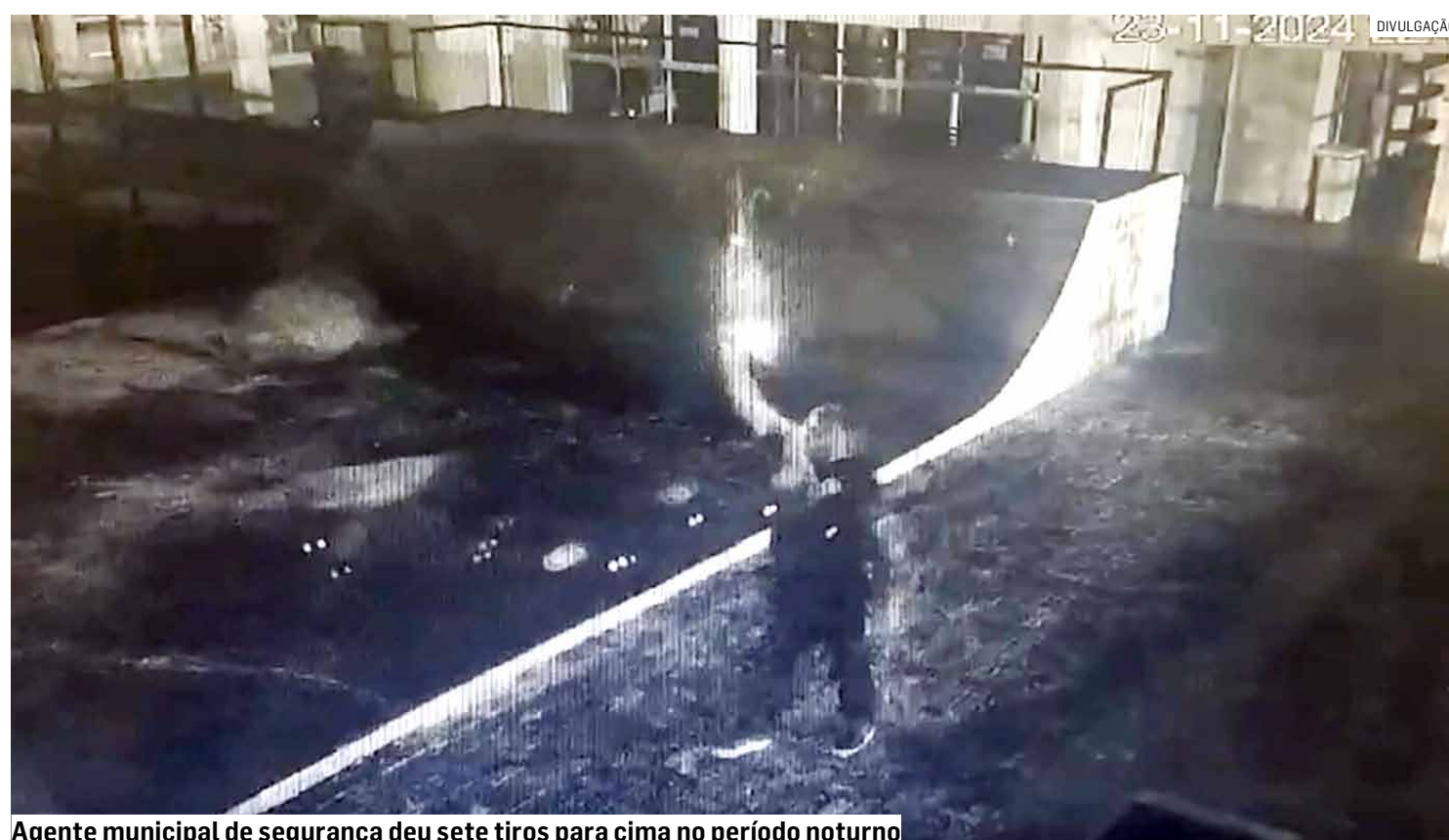
Agente municipal de segurança deu sete tiros para cima no período noturno

Em nota, a Secretaria de Segurança de Sumaré informou que não foi notificada oficialmente sobre a prisão do integrante da Guarda Civil Municipal. No entanto, o caso em questão será apurado por meio de um processo administrativo.