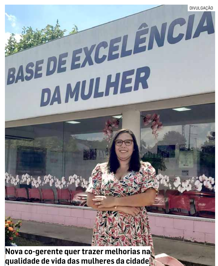
Nova co-gestora quer trazer melhorias na qualidade de vida das mulheres da cidade