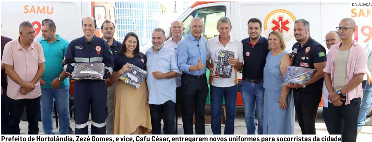
Prefeito de Hortolândia, Zezé Gomes, e vice, Cafu César, entregaram novos uniformes para socorristas da cidade

Hortolândia pretende expandir a regionalização do SAMU (Serviço de Atendimento Móvel de Urgência). A novidade foi anunciada pela Prefeitura durante a cerimônia da entrega da reforma e ampliação da central do serviço, na manhã desta terça-feira (14). O evento comemorou os 17 anos de implantação do SAMU no município. Na ocasião, a Prefeitura tam-