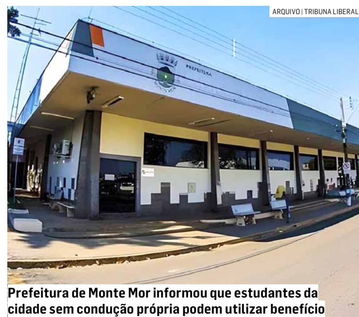
Prefeitura de Monte Mor informou que estudantes da cidade sem condução própria podem utilizar benefício

está previsto em lei e beneficia os jovens e adultos da cidade que não têm meio de transporte próprio para ir até a universidade. "As inscrições são realizadas semestralmente. Por isso os estudantes devem ficar atentos e fazer novamente mesmo quem já tinha o benefício no semestre passado", disse a secretária.