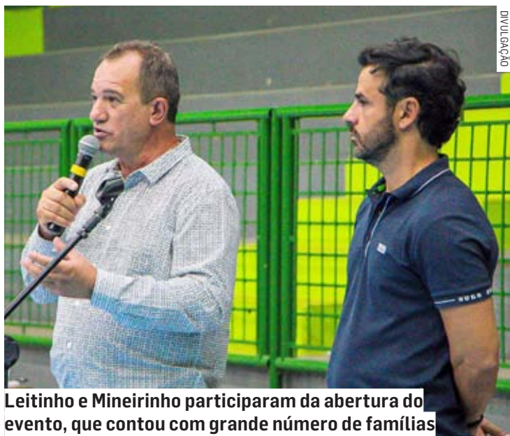
Leitinho e Mineirinho participaram da abertura do evento, que contou com grande número de famílias

A solenidade contou com o desfile de alunos representando cada uma das 12 EMEFS que disputam a competição, iniciada na se-