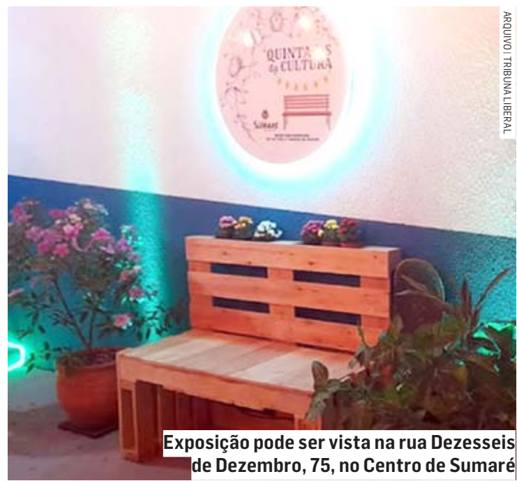
Exposição pode ser vista na rua Dezesesseis de Dezembro, 75, no Centro de Sumaré

Da Redação • SUMARÉ tribunaliberal@tribunaliberal.com.br