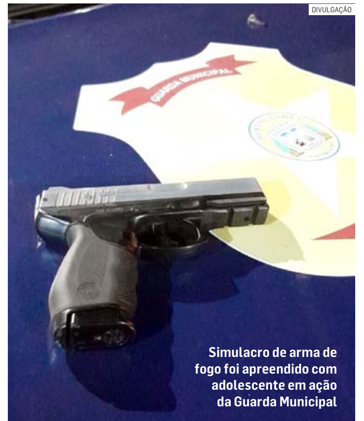
Simulacro de arma de fogo foi apreendido com adolescente em ação da Guarda Municipal

Uma equipe da GM chegou ao local e conseguiu deter os dois adolescentes. Durante revista pessoal, foi localizada uma arma de brinquedo. Ao serem