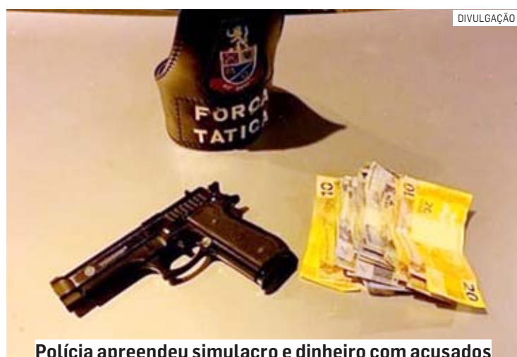
Polícia apreendeu simulacro e dinheiro com acusados

Cézar Oliveira • SUMARÉ tribunaliberal@tribunaliberal.com.br