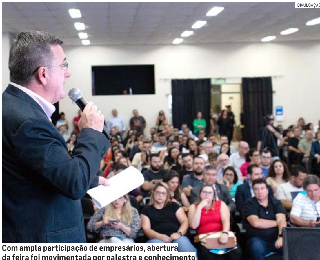
Com ampla participação de empresários, abertura da feira foi movimentada por palestra e conhecimento

Conforme o secretário de Desenvolvimento Econô-