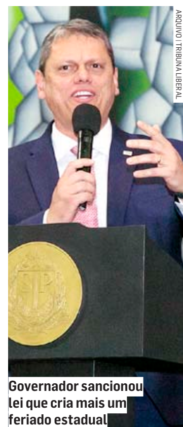
Governador sancionou lei que cria mais um feriado estadual

A efeméride tem o objetivo de potencializar a importância do debate sobre o povo e a cultura africana no Brasil, seja por meio da música, da política, da religião ou da gastronomia, entre várias outras áreas.