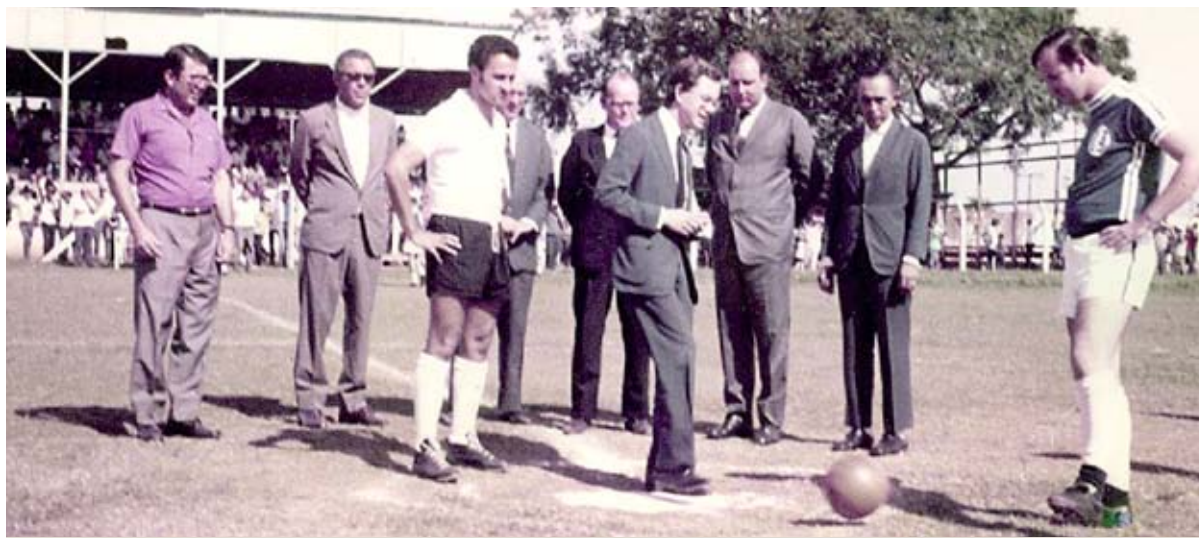
Clube Recreativo Sumaré - comemoração do 1º de Maio

Até o aparecimento do Clube União Cultural XVI de Dezembro, que tinha uma sede social maior que o Recreativo, além de piscinas e quadra de futebol de salão, o Recreativo era o local onde tudo que acontecia de importante na cidade. A sede e o estádio eram utilizados pela Prefeitura, clubes de serviço, entidades sociais e assistenciais, escolas, e de casamentos ou aniversários.