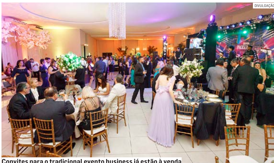
Convites para o tradicional evento business já estão à venda

“Para proporcionar uma noite inesquecível aos convidados, toda a equipe da ACIAS tem trabalhado intensamente, cuidando de