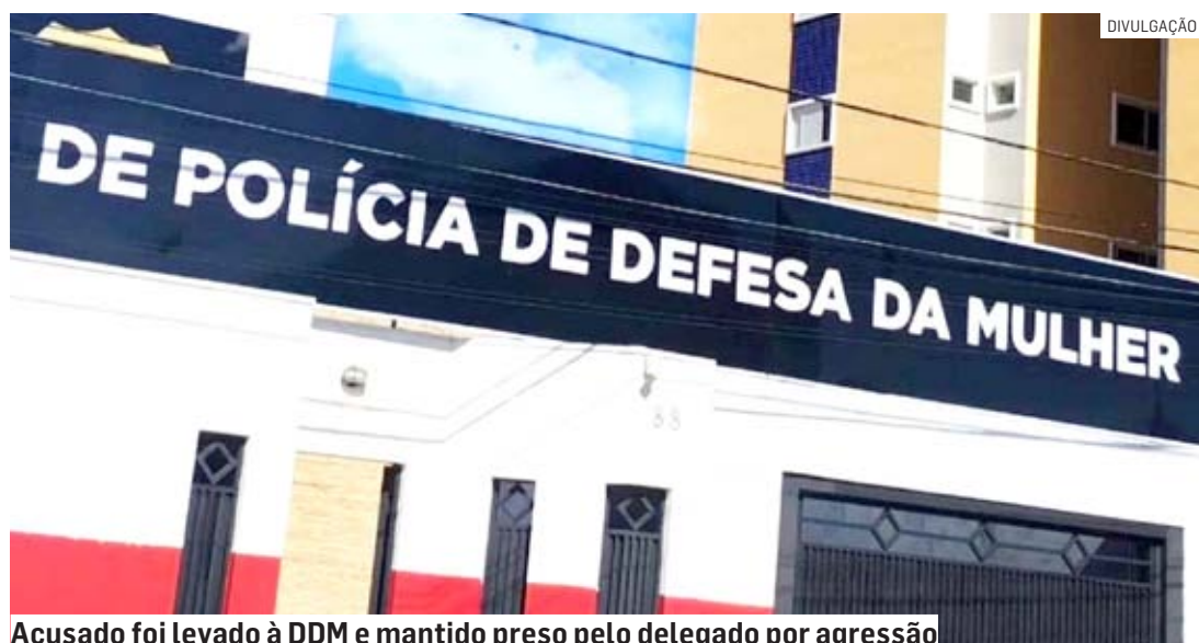
Acusado foi levado à DDM e mantido preso pelo delegado por agressão

A ocorrência foi registrada na DDM (Delegacia de Defesa da Mulher) de Hortolândia, onde o delegado manteve preso o acusado de agressão.