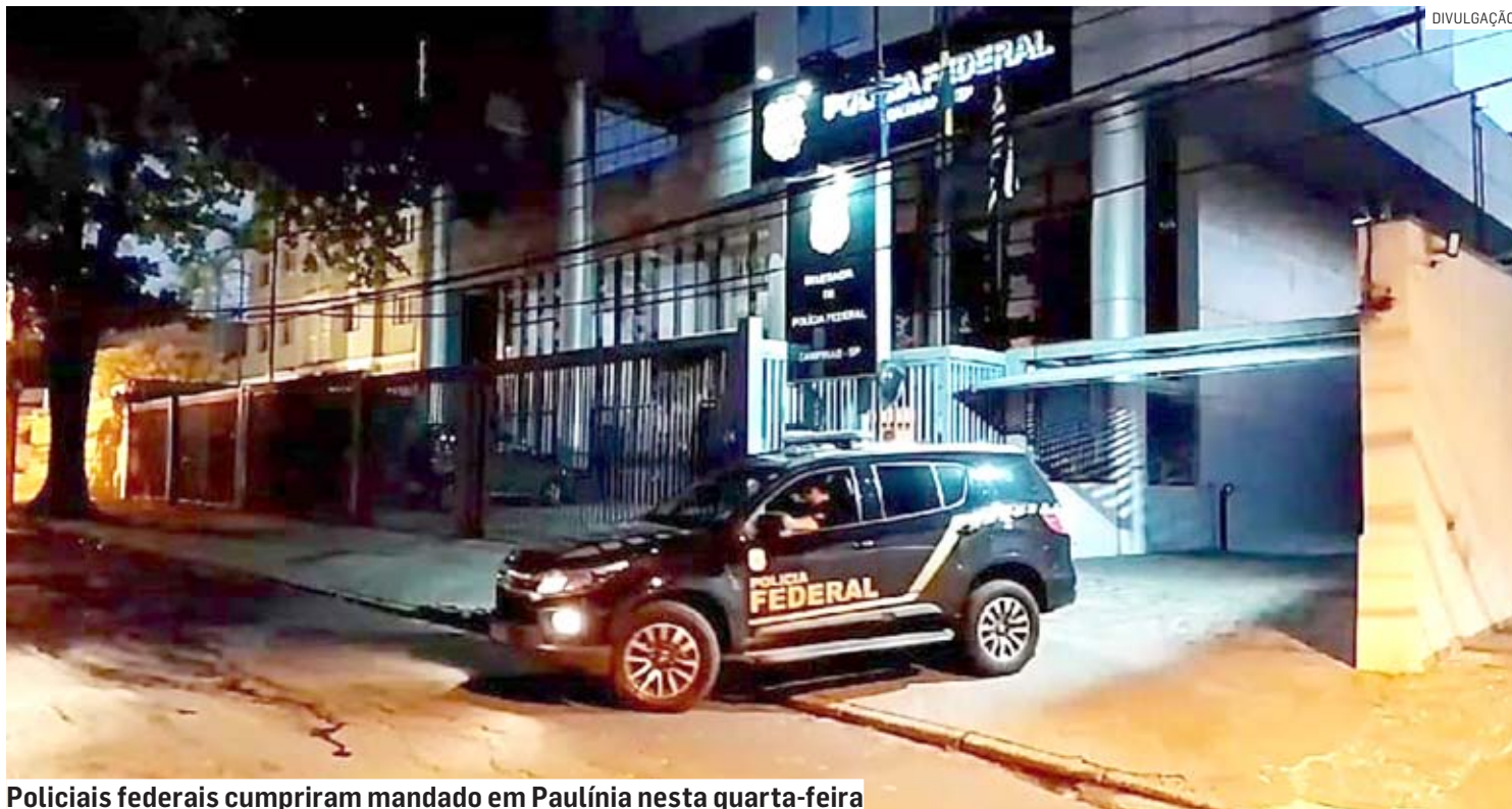
Policiais federais cumpriram mandado em Paulínia nesta quarta-feira

Foram mobilizados 120 policiais federais para cumprimento de 25 mandados de busca e apreensão e dois mandados de prisão, em endereços localizados no Distrito Federal, Goiás, Santa Catarina, Mato Grosso do Sul, Paraná, Rio Grande do Sul, São Paulo e Espírito Santo. Também foram executadas diversas medidas cautelares e ações de