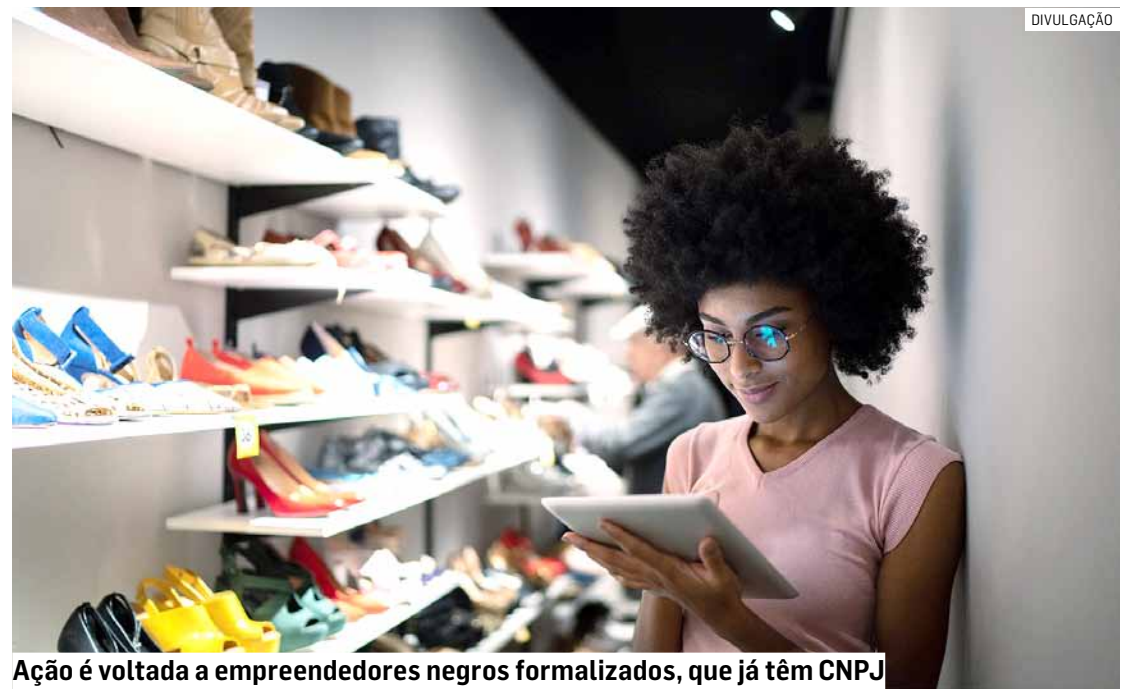
Ação é voltada a empreendedores negros formalizados, que já têm CNPJ

De acordo com o Relatório Técnico Empreendedorismo Negro do 4º trimestre de 2023 do Sebrae, os empreendedores negros são maioria no país e representam 52,4% dos pequenos negócios. Em relação a distribuição desses empreendedores por sexo, os homens estão em quantidade maior (67,8%), contra apenas 32,2% de mulheres.