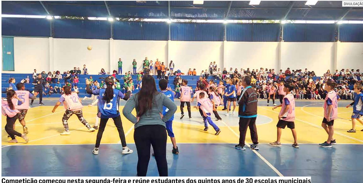
Competição começou nesta segunda-feira e reúne estudantes dos quintos anos de 30 escolas municipais

Segundo a Secretaria de Educação, Ciência