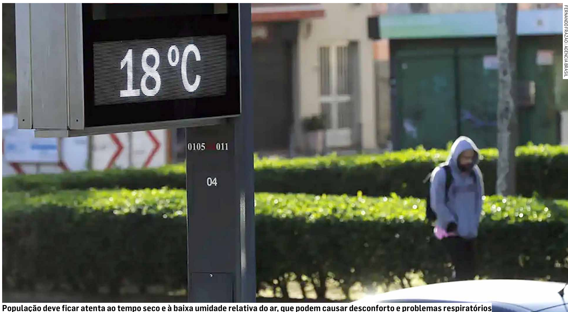
População deve ficar atenta ao tempo seco e à baixa umidade relativa do ar, que podem causar desconforto e problemas respiratórios

Conforme a semana chega ao final, a tendência é de aquecimento. A partir de quinta-feira (15), as temperaturas mínimas matinais começam a subir gradualmente, enquanto as tardes também ficarão um pouco mais quentes. O sol conti-