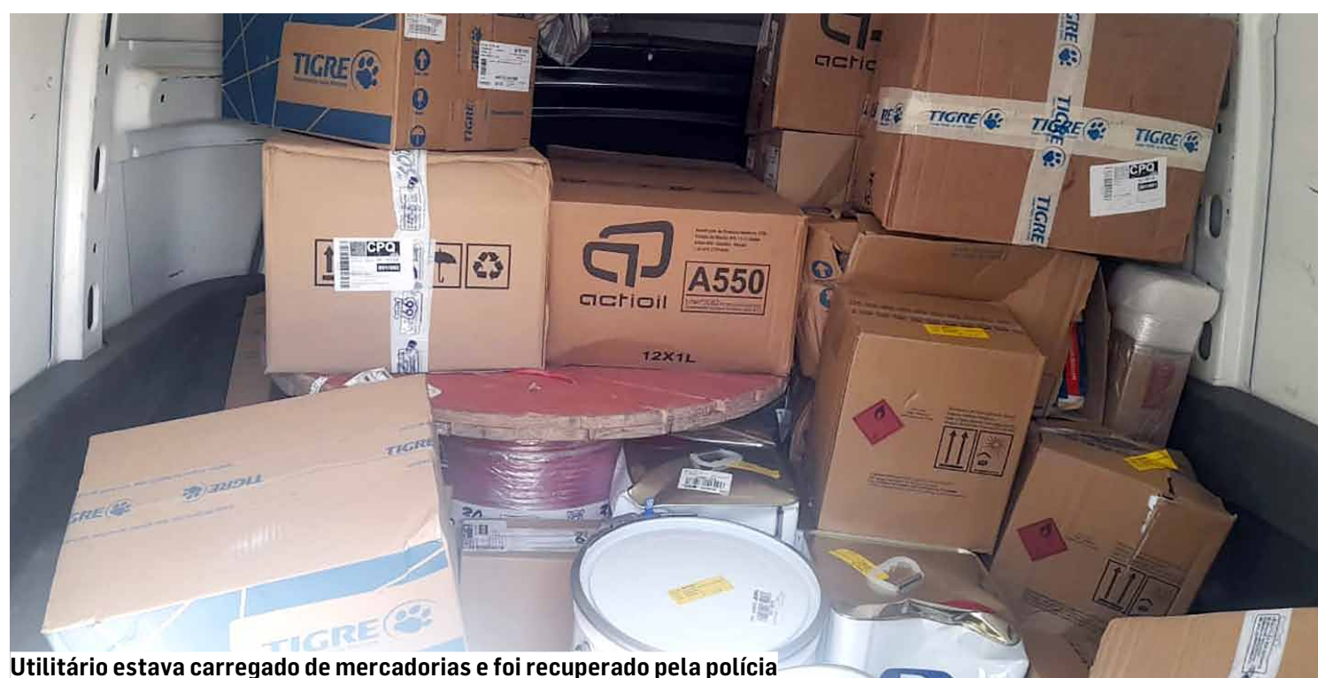
Utilitário estava carregado de mercadorias e foi recuperado pela polícia

A vítima foi mantida no compartimento de cargas do veículo; prisão aconteceu após perseguição inclusive, com o apoio do helicóptero Águia da Polícia Militar