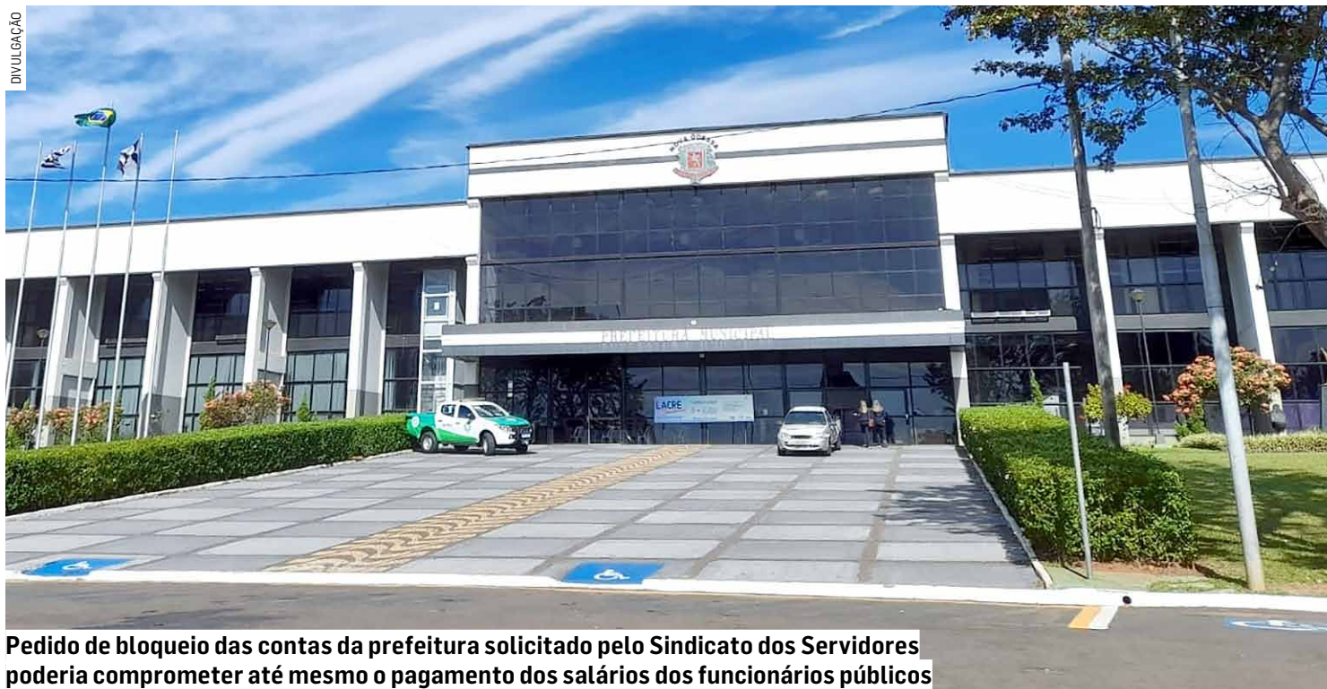
Pedido de bloqueio das contas da prefeitura solicitado pelo Sindicato dos Servidores poderia comprometer até mesmo o pagamento dos salários dos funcionários públicos

Segundo a administração municipal, a dívida é resultado de uma ação trabalhista iniciada em 2019 por cerca de 200 EDIs (Educadoras de Desenvolvimento Infantil) da rede municipal de ensino, conhecida como 'a ação dos 15 minutos de descanso'.