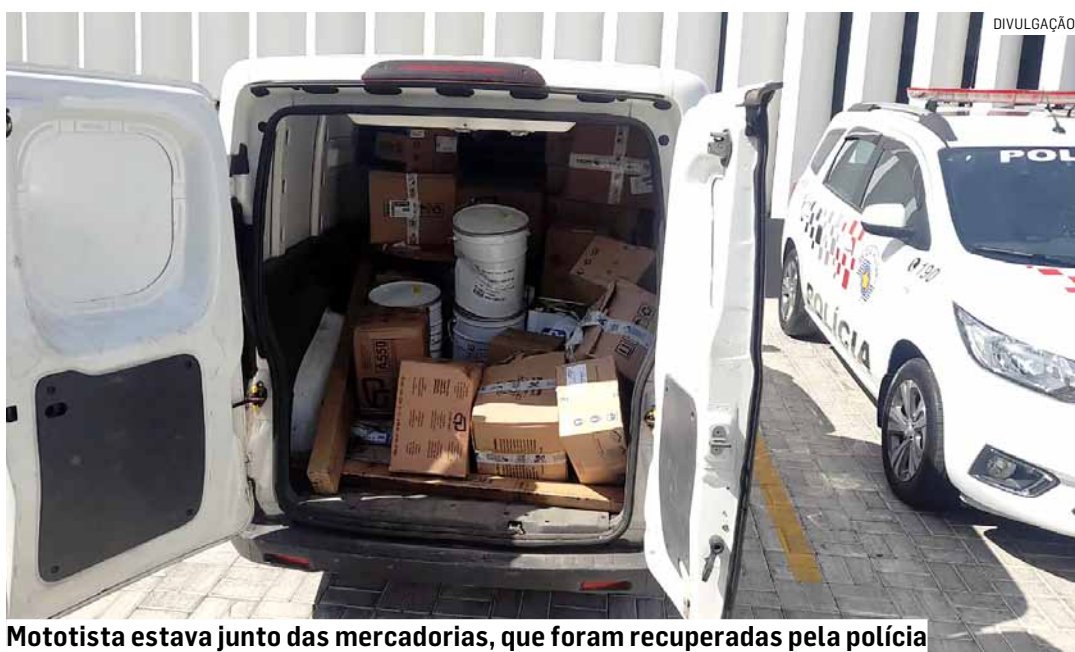
Mototista estava junto das mercadorias, que foram recuperadas pela polícia

Dois homens foram presos após roubarem um veículo de entrega e manter o motorista refém, na manhã desta terça-feira (13) em Hortolândia. Segundo informações da Polícia Militar, os assaltantes renderam o motorista no Jardim Interlagos e fugiram com o veículo. A PM foi acionada e localizou o furgão Fiorino branco que era usado como veículo de entrega. Uma perseguição foi iniciada, inclusive, com o apoio do helicóptero Águia da Polícia Militar. PÁGINA 09