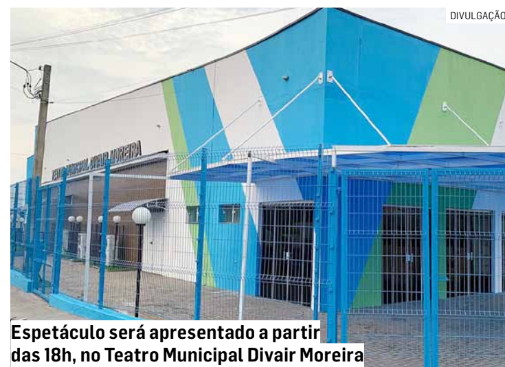
Espectáculo será apresentado a partir das 18h, no Teatro Municipal Divair Moreira

O espetáculo é dividido e interligado por três Contos. O primeiro é o 'Criação', no qual uma dupla de bonecos descobre um simpático ser que surge da areia. Em seguida, o conto 'O artista', que mostra o impacto da arte de um artista de rua transformando o dia de um executivo muito atarefado. O último conto se intitula "Abdução" e traz uma simples amputada que deixa de funcio-