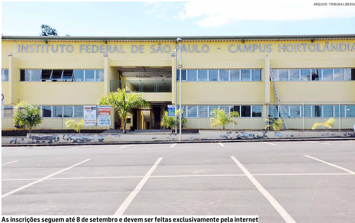
As inscrições seguem até 8 de setembro e devem ser feitas exclusivamente pela internet

Além de Hortolândia, as mais de sete mil vagas estão sendo ofertadas pelos campi de Araraquara, Avaré, Barretos, Bauru, Birigui, Boituva, Bragança Paulista, Campinas, Campos do Jordão, Capivari, Caraguatatuba, Catanduva, Cubatão, Guarulhos, Ilha Solteira, Itapetininga, Itaquaquecetuba, Jacareí, Jundiaí, Matão, Pirituba, Piracicaba, Presidente Epitácio, Presidente Prudente, Registro, Salto, São João da Boa Vista, São Carlos, São José dos Campos, São José do Rio Preto, São Miguel Paulista, São Paulo, São Roque, Sorocaba, Sertãozinho, Suzano, Tupã e Votuporanga.