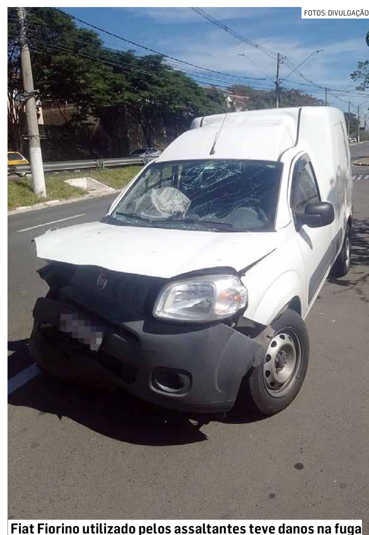
Fiat Fiorino utilizado pelos assaltantes teve danos na fuga

O suspeito levou a equipe onde estava escondida a droga, uma área de mata na rua João de Melo Costa. No local, os policiais encontraram 20 papéletes de cocaína. Diante dos fatos foi dada voz de prisão em flagrante ao acusado, que foi conduzido ao Plantão Policial.