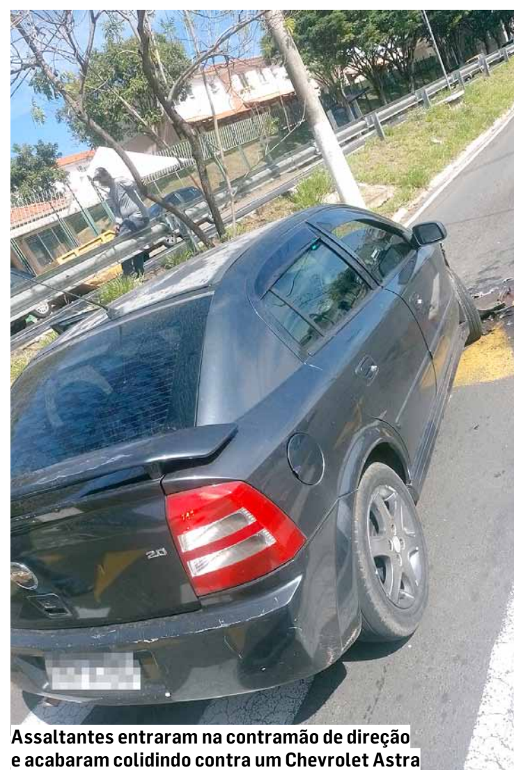
Assaltantes entraram na contramão de direção e acabaram colidindo contra um Chevrolet Astra