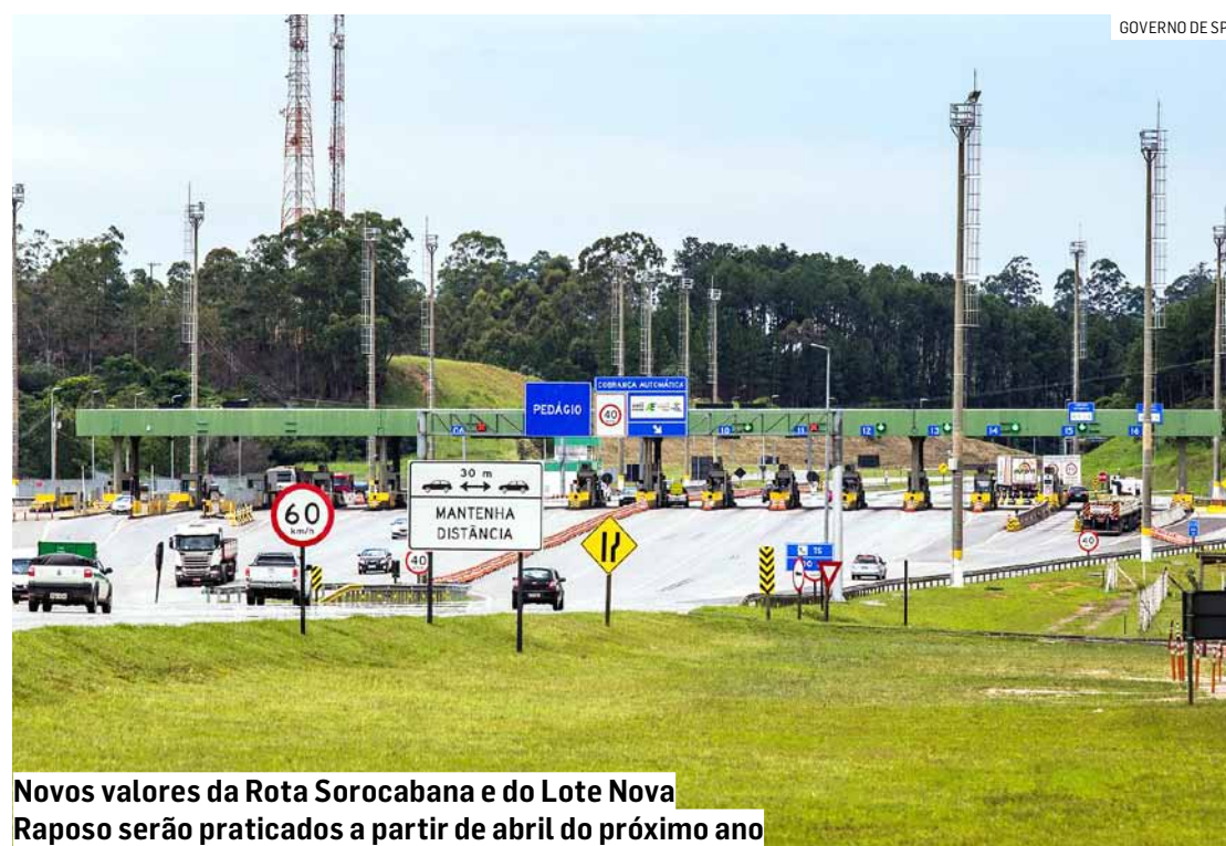
Novos valores da Rota Sorocabana e do Lote Nova Raposo serão praticados a partir de abril do próximo ano

No caso do trecho da Rota Sorocabana que já é concedido, a queda nas tarifas nas cinco praças será de 21,5% a 22,6% - isso representa um desconto de entre