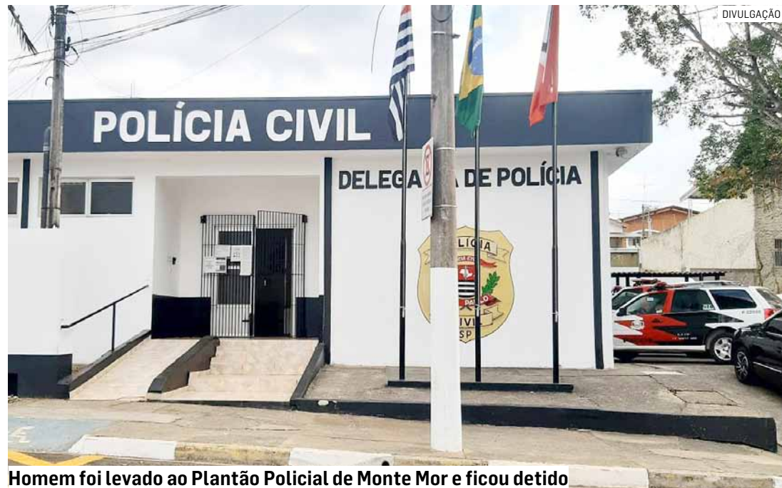
Homem foi levado ao Plantão Policial de Monte Mor e ficou detido

César Oliveira • MONTE MOR tribunaliberal@tribunaliberal.com.br