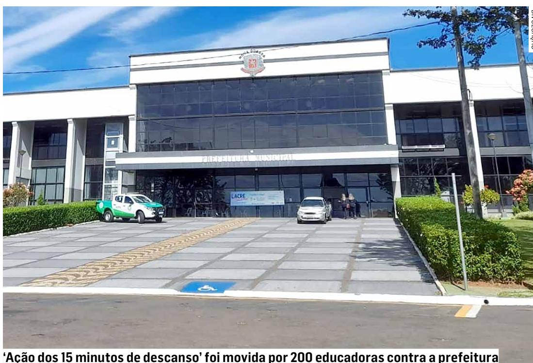
'Ação dos 15 minutos de descanso' foi movida por 200 educadoras contra a prefeitura

Pagamento evitou risco de bloqueio das contas bancárias do município e atraso dos salários dos servidores