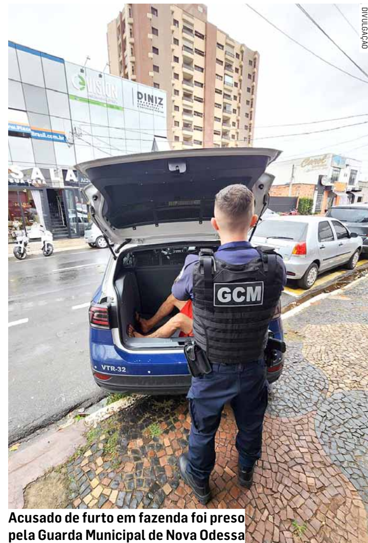
Acusado de furto em fazenda foi preso pela Guarda Municipal de Nova Odessa

A vítima, realizou o reconhecimento do autor do crime e dos objetos furtados, relatou também que o homem teria arrombado uma das portas da fazenda para subtrair os objetos. O criminoso foi conduzido até o Plantão Policial, onde ficou preso à disposição da Justiça.