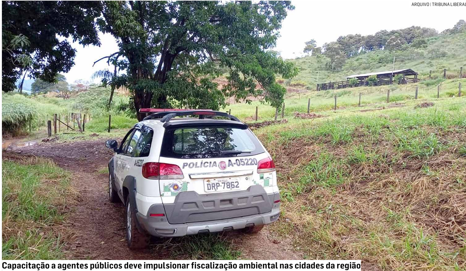
Capacitação a agentes públicos deve impulsionar fiscalização ambiental nas cidades da região

Com mais de mil inscritos, o curso, que começou neste mês de agosto, é composto por dez módulos ministrados semanalmente