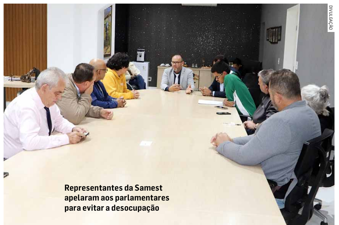
Representantes da Samest apelaram aos parlamentares para evitar a desocupação

Também ficou acordado o prazo de cinco dias úteis para a entidade visitar o espaço Viva Mais, no Jardim Santa Claro do Lago I. A Prefeitura propôs à Samest