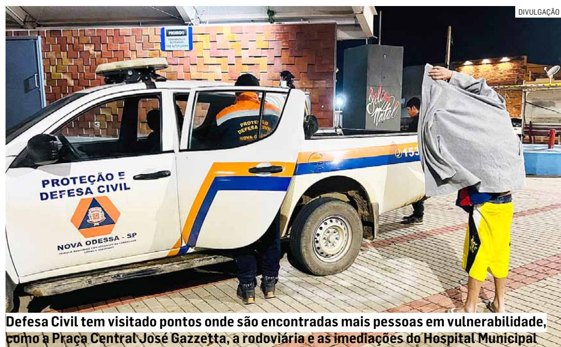
Defesa Civil tem visitado pontos onde são encontradas mais pessoas em vulnerabilidade, como a Praça Central José Gazzetta, a rodoviária e as imediações do Hospital Municipal

A Defesa Civil e o Fundo Social de Solidariedade de Nova Odessa atenderem, nos últimos dias, em virtude da atual onda de frio que atinge a cidade, mais 20 pessoas em situação de rua – algumas delas mais de uma vez, pois o órgão estima que o número total de moradores de rua na cidade varie de dez a 15 atualmente. Foram realizadas três ações de campo, nas noites de sexta-feira (9) para sábado, sábado para domingo e segunda para terça-feira (13).