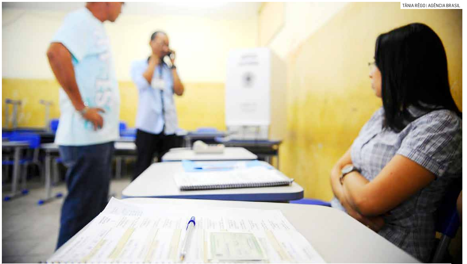
Quem for nomeado precisa atender às convocações tanto para os trabalhos no dia das eleições como para o treinamento

Os convocados para os trabalhos são nomeados pelo juiz eleitoral 60 dias antes do pleito, conforme o artigo 120 do Código Eleitoral (Lei nº 4.737/65). A recusa à participação por motivo de saúde, por exemplo, poderá ser encaminhada para análise do juiz em até 5 dias após o recebimento da convocação. O período e a modalidade da capacitação, que pode ser presencial, à distância ou das duas formas, serão definidos pelos cartórios.