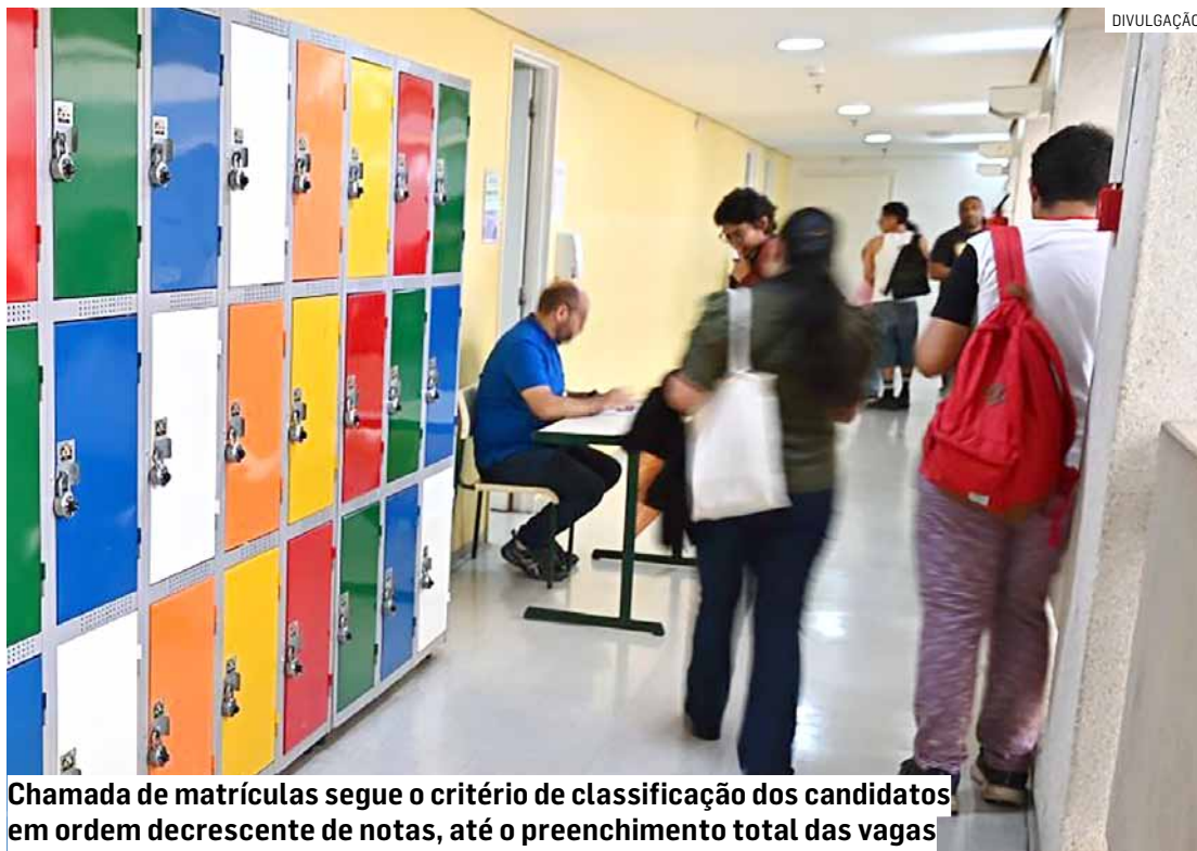
Chamada de matrículas segue o critério de classificação dos candidatos em ordem decrescente de notas, até o preenchimento total das vagas

• Documento de identidade com foto, dentro da validade. Ex: RG ou Carteira Nacional de Habilitação (CNH);