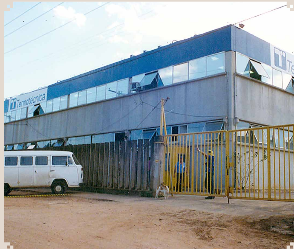
Foto da empresa química TERMOTÉCNICA, instalada num prédio localizado na Rodovia Virgínia Viel Campo Dall'Orto. Hoje esse prédio é ocupado pela UNIMED.