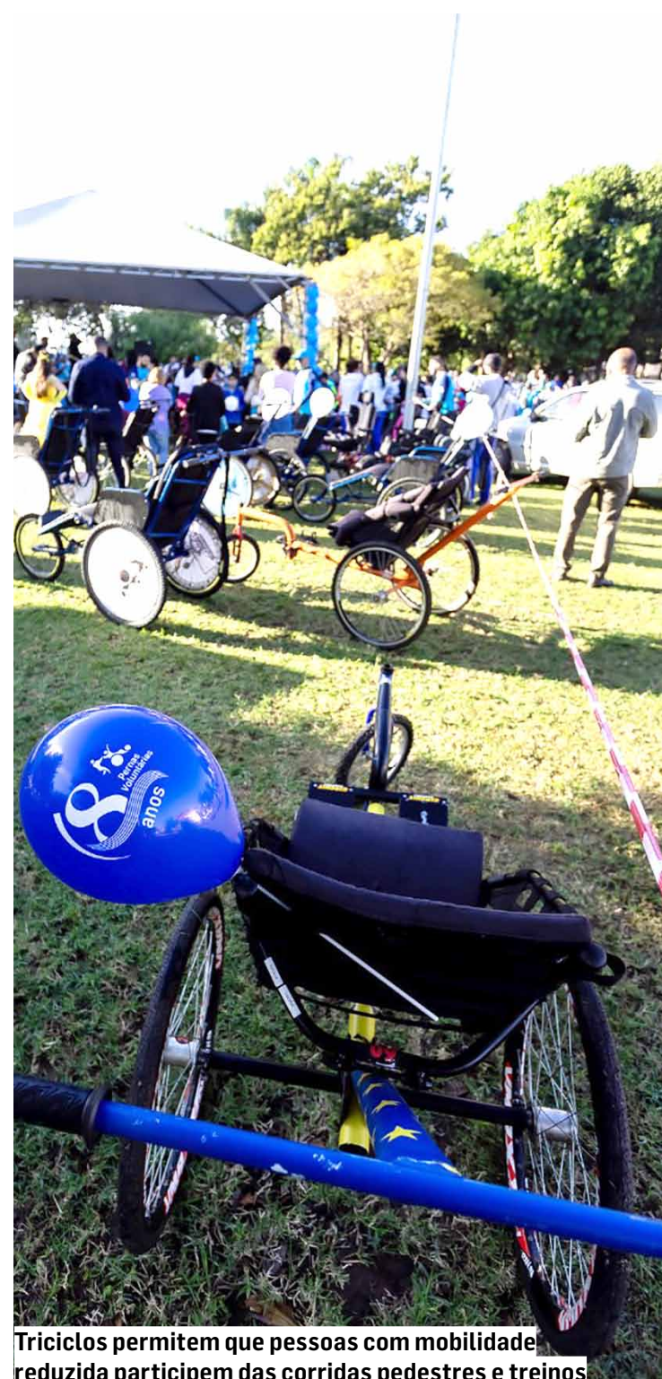
Triciclos permitem que pessoas com mobilidade reduzida participem das corridas pedestres e treinos