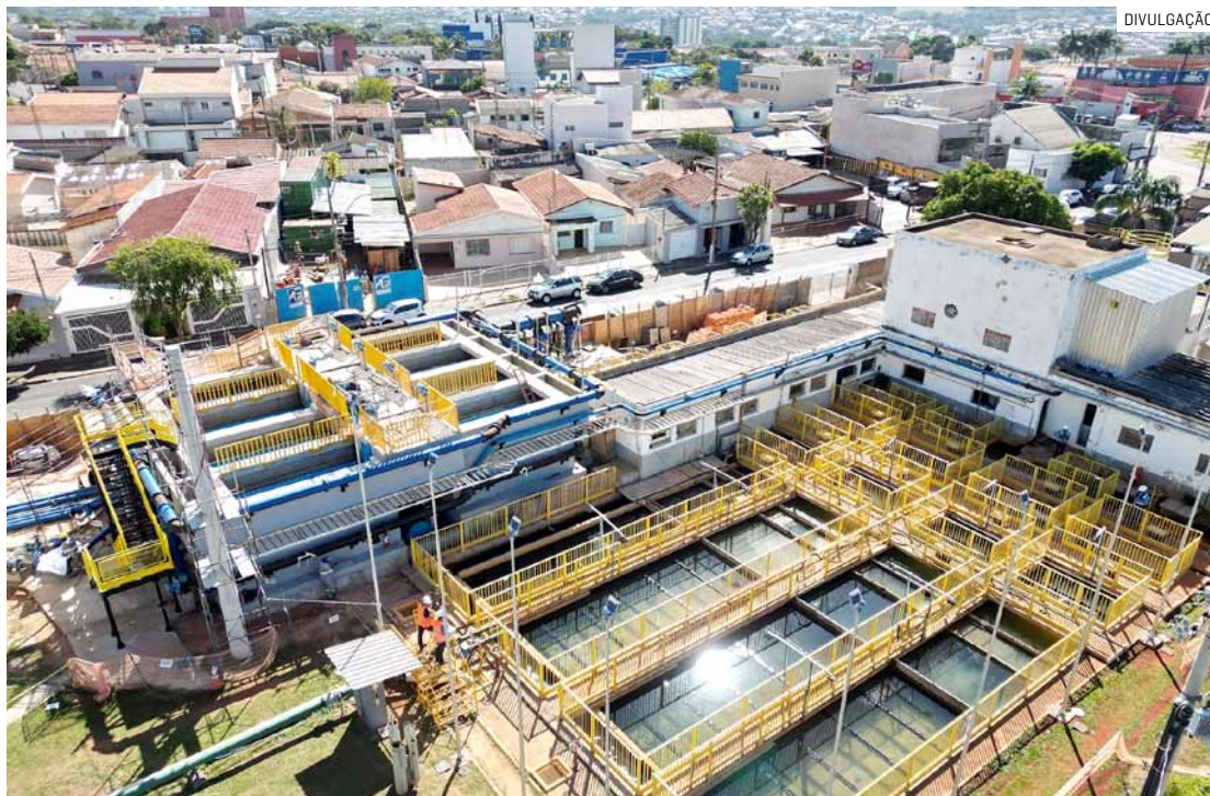
Devido à interrupção da energia elétrica para garantir a segurança dos trabalhos, bairros das regiões do João Paulo e Centro podem ter oscilações no abastecimento

Iniciada em maio de 2023, a obra já tem avanço de 93% no cronograma de trabalho da primeira fase. Esse percentual contempla a implantação de um