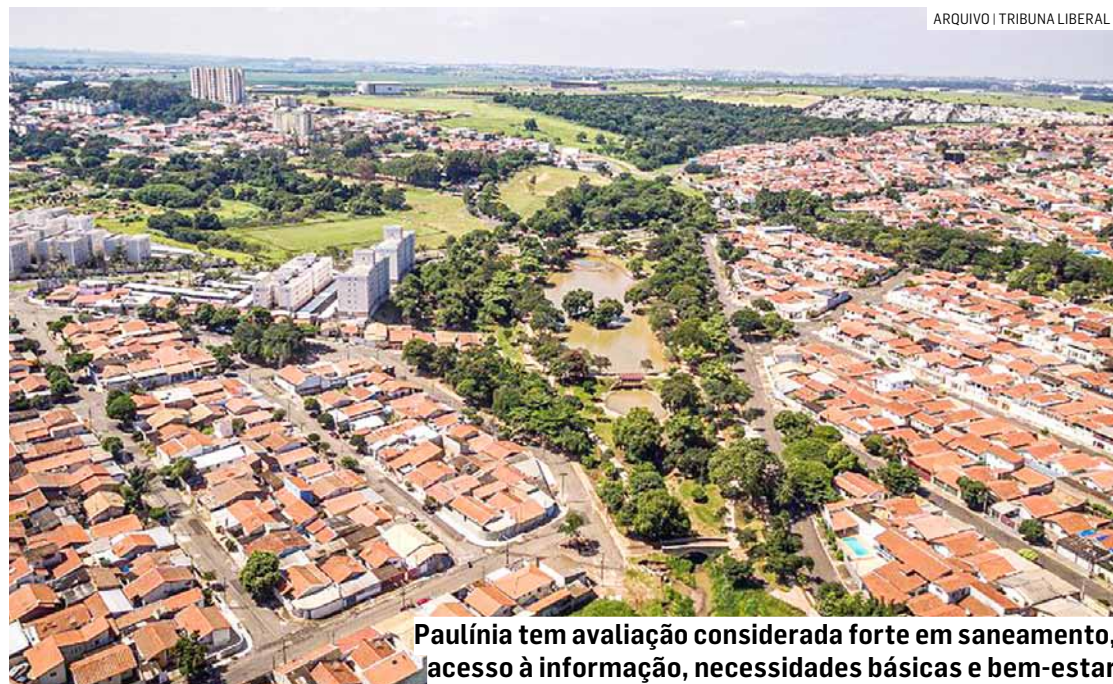
Paulínia tem avaliação considerada forte em saneamento, acesso à informação, necessidades básicas e bem-estar