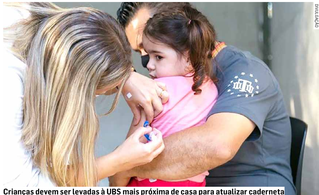
Crianças devem ser levadas à UBS mais próxima de casa para atualizar caderneta

Da Redação • REGIÃO tribunaliberal@tribunaliberal.com.br