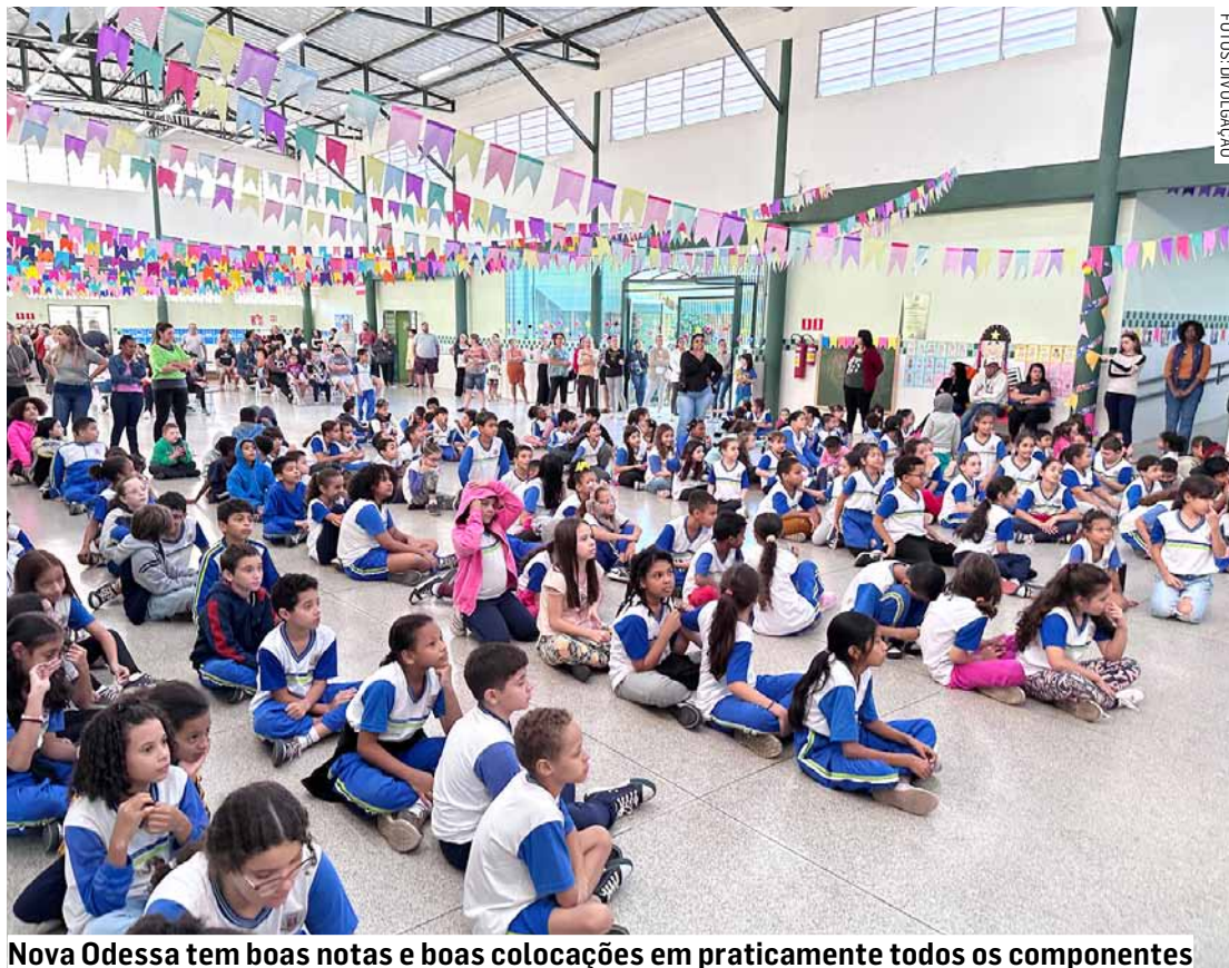
Nova Odessa tem boas notas e boas colocações em praticamente todos os componentes

Nos componentes dos ‘Fundamentos do Bem-Estar’, Nova Odessa conquistou nota 84,53 em Acesso ao Conhecimento Básico, 79,68 em Acesso à Informação e Comunicação, 61,99 em Saúde e Bem-Estar e 75,48 em Qualidade do Meio Ambiente. O único subcomponente em vermelho (relativamente fraco) da cidade está no quesito ‘Obesidade’. Em todos os demais Nova Odessa consta como amarelo (relativamente neutro) ou azul (relativamente forte).