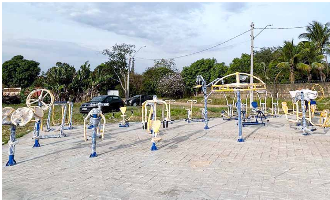
Instalação dos equipamentos públicos vai gerar novas opções de lazer para população local

A nova praça foi projetada e instalada em um local estratégico e de fácil acesso do bairro, localizado na área rural de Nova Odessa e carente de lazer para a população. A área conta agora com equipamentos de ginástica e mus-