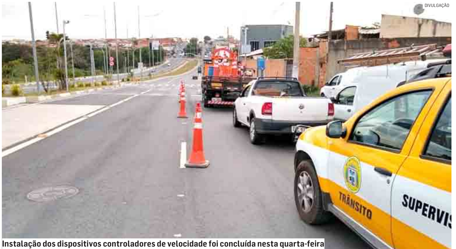
Instalação dos dispositivos controladores de velocidade foi concluída nesta quarta-feira

Segundo a Prefeitura, as políticas públicas implementadas na cidade reduziram em aproxima-