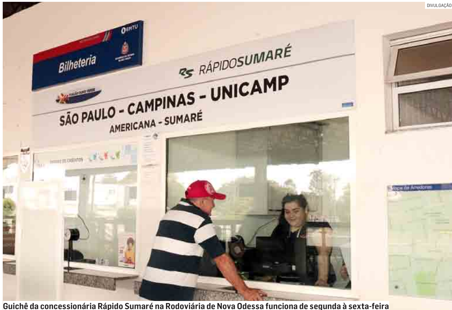
Guichê da concessionária Rápido Sumaré na Rodoviária de Nova Odessa funciona de segunda à sexta-feira

Já para solicitar o “Cartão Especial” (a isenção para PCDs), o solicitante deve requerer um Laudo Médico com a CID da deficiência junto à Ouvidoria da Secretaria Municipal de Saúde, na sede da pasta (o antigo CT-VP). Em seguida, deverá preencher o requerimento de isenção de tarifa e protocolar no setor