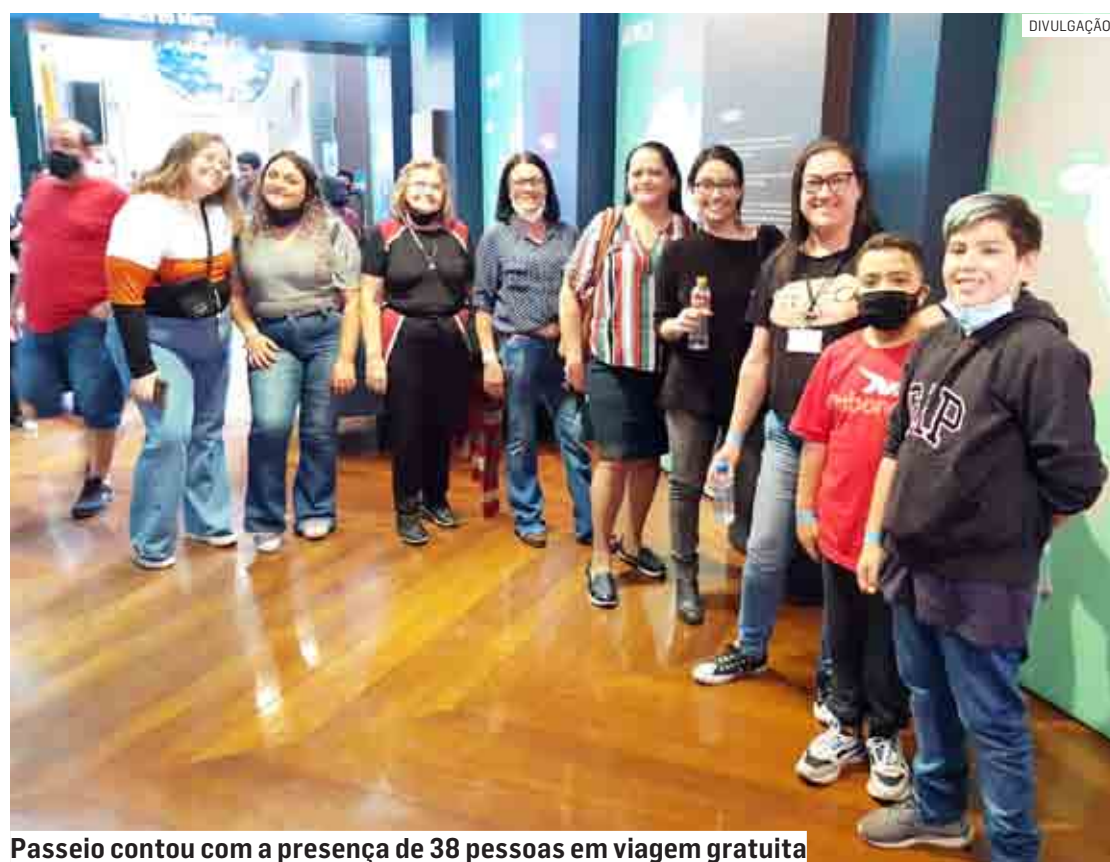
Passeio contou com a presença de 38 pessoas em viagem gratuita

Um ônibus levou os inscritos para o Museu, inaugurado em março de 2009 e localizado no Pa-