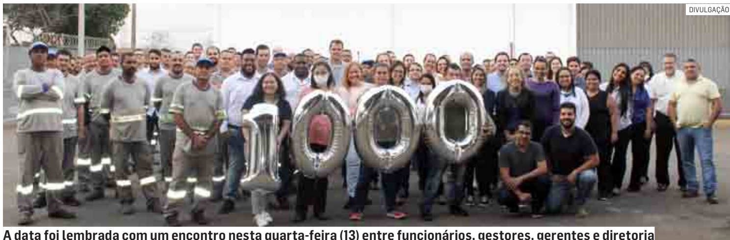
A data foi lembrada com um encontro nesta quarta-feira (13) entre funcionários, gestores, gerentes e diretoria