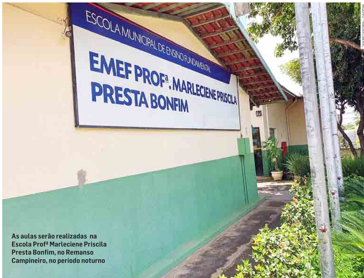
As aulas serão realizadas na Escola Profª Marleciene Priscila Presta Bonfim, no Remanso Campineiro, no período noturno

Parceria da escola profissionalizante com a Prefeitura garante as aulas, que começam no dia 27 de julho