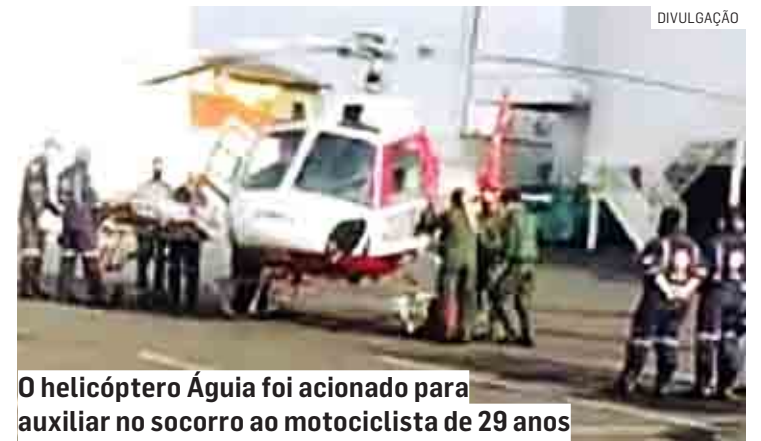
O helicóptero Águia foi acionado para auxiliar no socorro ao motociclista de 29 anos

O Samu prestou os primeiros atendimentos ao motociclista, que foi socorrido pelo helicóptero Águia até o hospital das clínicas da Unicamp.