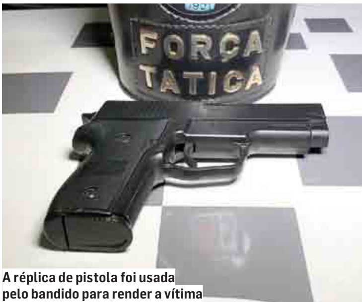
A réplica de pistola foi usada pelo bandido para render a vítima

Cézar Oliveira | REGIÃO tribunaliberal@tribunaliberal.com.br