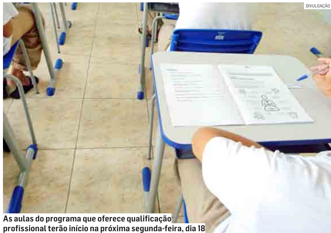
As aulas do programa que oferece qualificação profissional terão início na próxima segunda-feira, dia 18

O programa é realizado pelo Sebrae (Serviço Brasileiro de Apoio às Micro e Pequenas Empresas), órgão da Secretaria