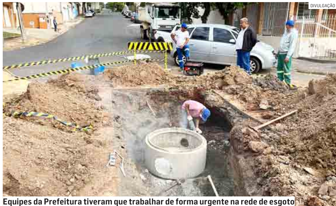
Equipes da Prefeitura tiveram que trabalhar de forma urgente na rede de esgoto