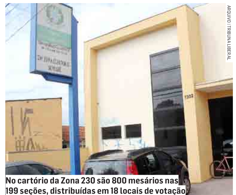
No cartório da Zona 230 são 800 mesários nas 199 seções, distribuídas em 18 locais de votação

lio alimentação (ver todos os benefícios no quadro nesta página). Os cadastrados ainda poderão passar por um treinamento por meio de um aplicativo, que será liberado a partir do dia 15 de agosto. Os treinamentos poderão ser realizados até 30 de setembro.