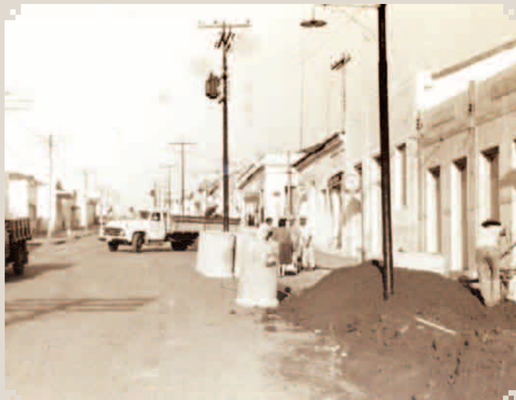
Foto de 1967 da Avenida 7 de Setembro, por ocasião da grande reforma feita pelo Prefeito João Smânio Franceschini. O melhoramento fazia parte da programação das comemorações do Centenário de Sumaré, que aconteceu no ano seguinte. O piso, que era de paralelepípedo, foi trocado por asfalto.