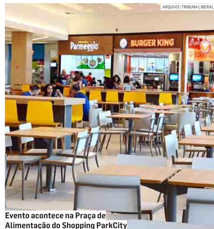
Evento acontece na Praça de Alimentação do Shopping ParkCity

“Elvis Presley recebeu três Grammys durante sua carreira e vendeu mais de um bilhão de álbuns, sendo o artista que mais vendeu discos na história da música. Não poderíamos deixar de homenageá-lo