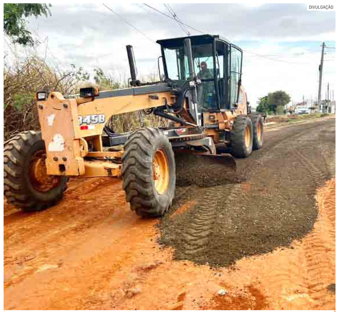
Trecho rural da antiga vicinal recebeu um volume expressivo de terra e toneladas de pedras

Parte da pista sentido Sumaré, ao longo do bairro, segue fechada para o fluxo de veículos. Mas o trecho entre os Campos Verdes e a cidade vizinha está liberado. “O objetivo é diminuir a poeira para melhorar a condição do trânsito”, explica Vitorelli. “Colocamos terra nova, compactamos o solo e a irrigação será diária para acelerar essa compactação.”