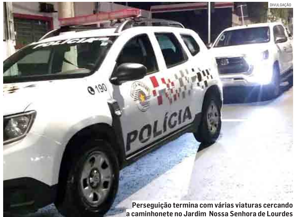
Perseguição termina com várias viaturas cercando a caminhonete no Jardim Nossa Senhora de Lourdes

O ladrão acabou preso em flagrante por receptação e adulteração do emplacamento. A caminhonete foi devolvida ao proprietário.