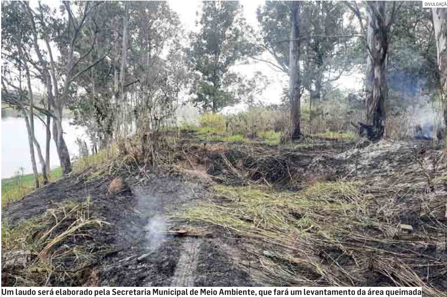
Um laudo será elaborado pela Secretaria Municipal de Meio Ambiente, que fará um levantamento da área queimada

Bombeiros foram acionados para controlar o fogo, que se alastrou e destruiu parcialmente a vegetação da Área de Preservação Ambiental