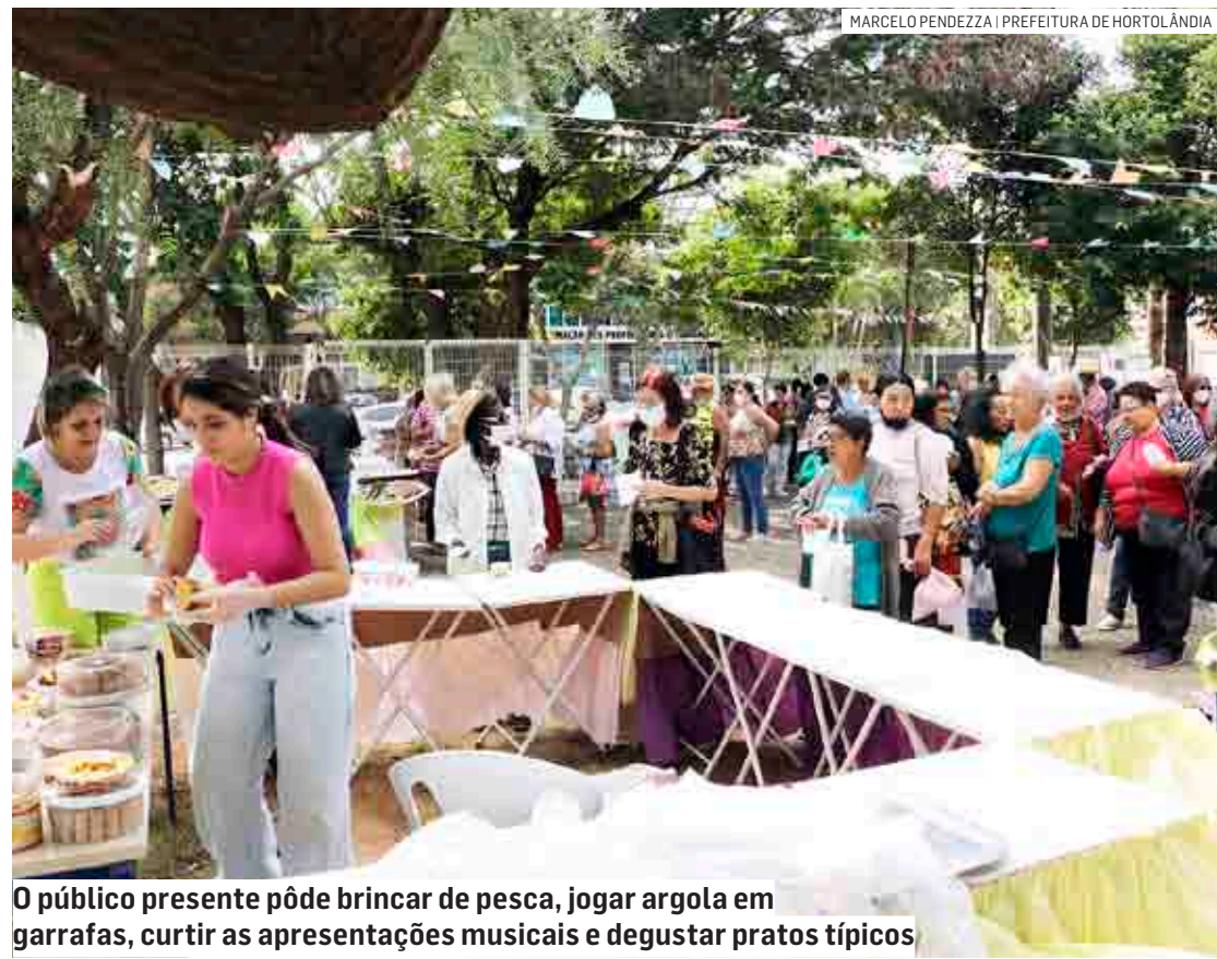
O público presente pôde brincar de pesca, jogar argola em garrafas, curtir as apresentações musicais e degustar pratos típicos

Da Redação | HORTOLÂNDIA tribunaliberal@tribunaliberal.com.br