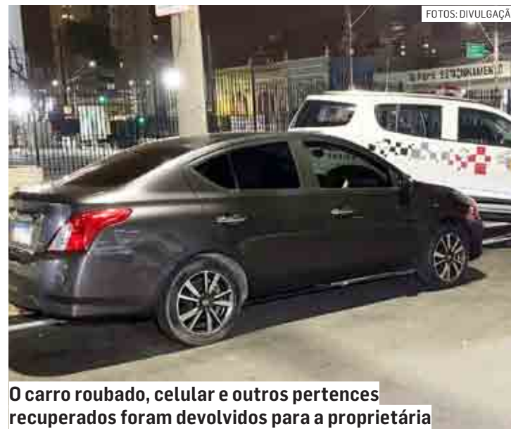
O carro roubado, celular e outros pertences recuperados foram devolvidos para a proprietária

A vítima tinha acabado de sair do trabalho e, já dentro do carro, foi rendida pelo bandido, que usava uma réplica de pistola. Depois do assalto, a mulher entrou em contato com o marido, que passou a rastrear a localização do