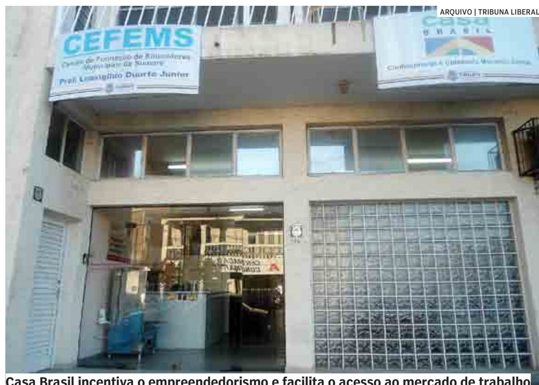
Casa Brasil incentiva o empreendedorismo e facilita o acesso ao mercado de trabalho

Da Redação | SUMARÉ tribunaliberal@tribunaliberal.com.br