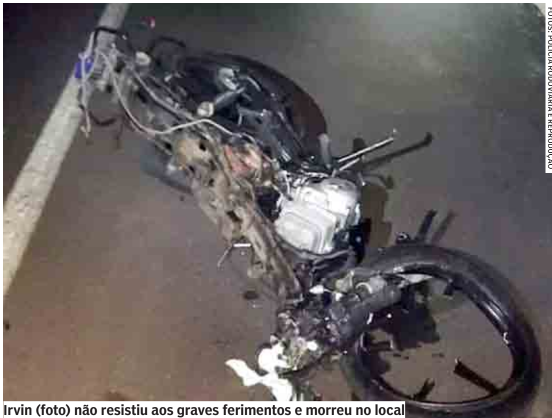
Irvin (foto) não resistiu aos graves ferimentos e morreu no local

O boletim de ocorrência foi registrado no Plan-