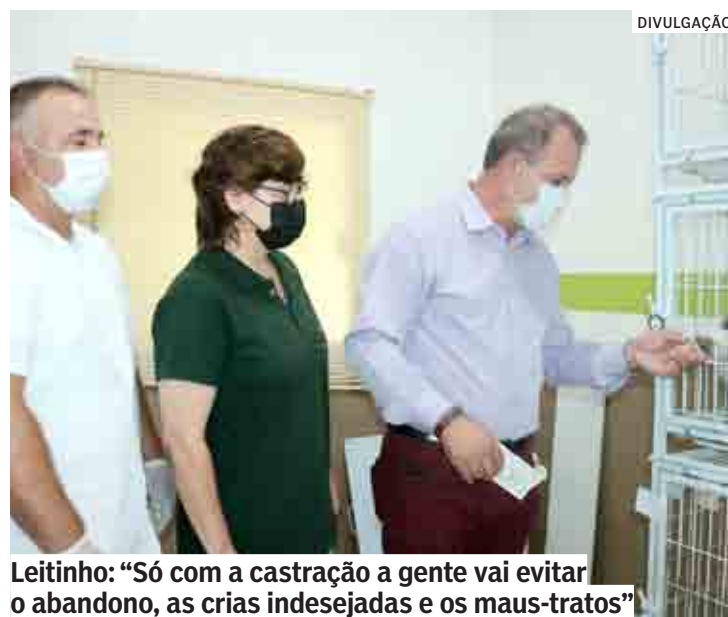
Leitinho: “Só com a castração a gente vai evitar o abandono, as crias indesejadas e os maus-tratos”

O programa iniciado em 2021 beneficia também animais abandonados e abrigados por ONGs ou cuidadores voluntários da cidade. Todo o processo é conduzido pela equipe técnica do Setor de Zoonoses da Secretaria