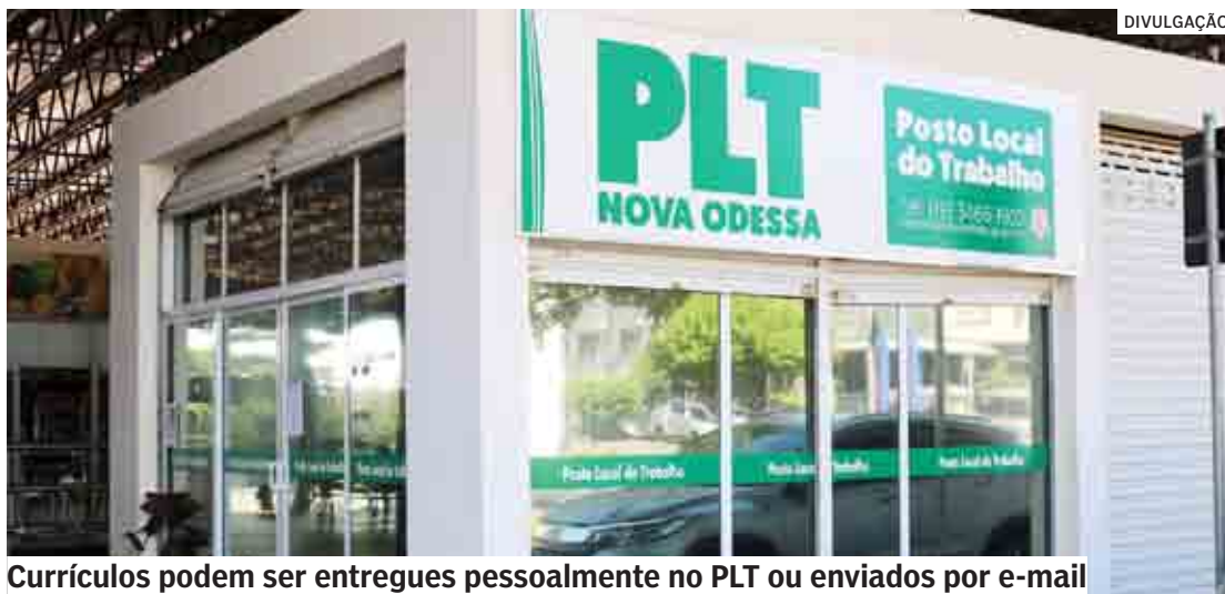
Currículos podem ser entregues pessoalmente no PLT ou enviados por e-mail

SENAI de aprendizagem industrial na área de Mecânica de Usinagem.