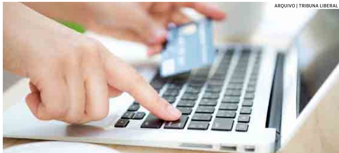
ARQUIVO | TRIBUNA LIBERAL

O faturamento do comércio, referente às vendas físicas na RMC (Região Metropolitana de Campinas), em maio de 2022, foi de R$ 1,848 bilhão, o equivalente a 2,1% acima do total faturado em 2021, de R$ 1,810 bilhão. No comércio eletrônico, o crescimento nas vendas foi mais significativo, de 18,5%, atingindo cerca de R$ 492,4 milhões.