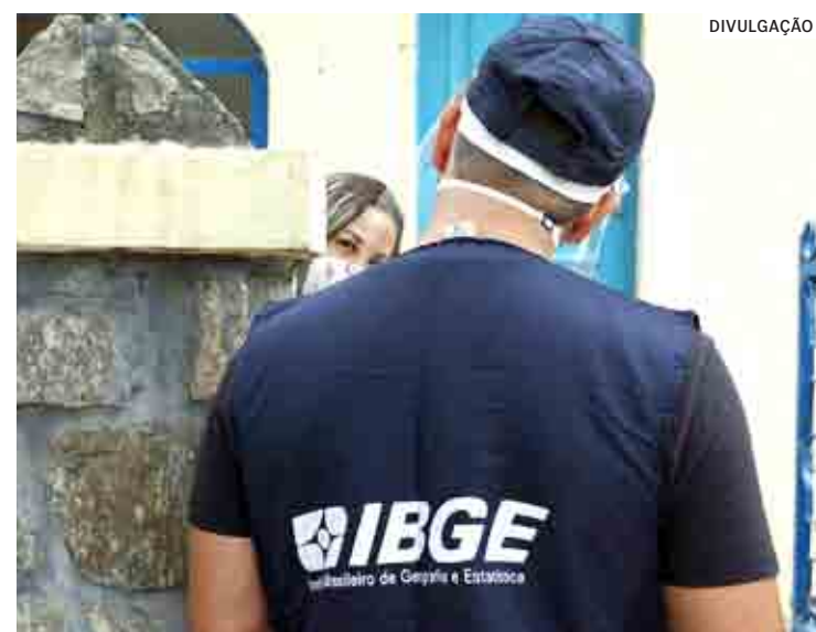
Inscrições são gratuitas e encerram-se nesta quarta-feira

A função do recenseador é entrevistar os moradores para que sejam levantadas informações sócioeconômico-culturais que irão abastecer o banco de dados do IBGE. A ferramenta é importante