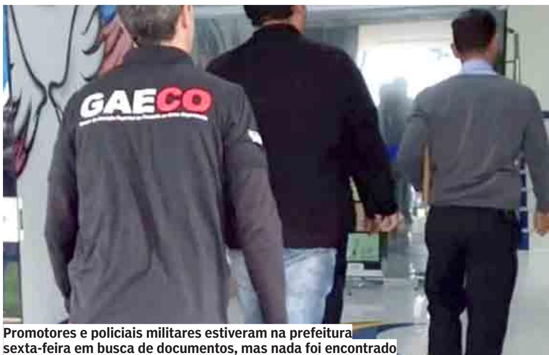
Promotores e policiais militares estiveram na prefeitura sexta-feira em busca de documentos, mas nada foi encontrado