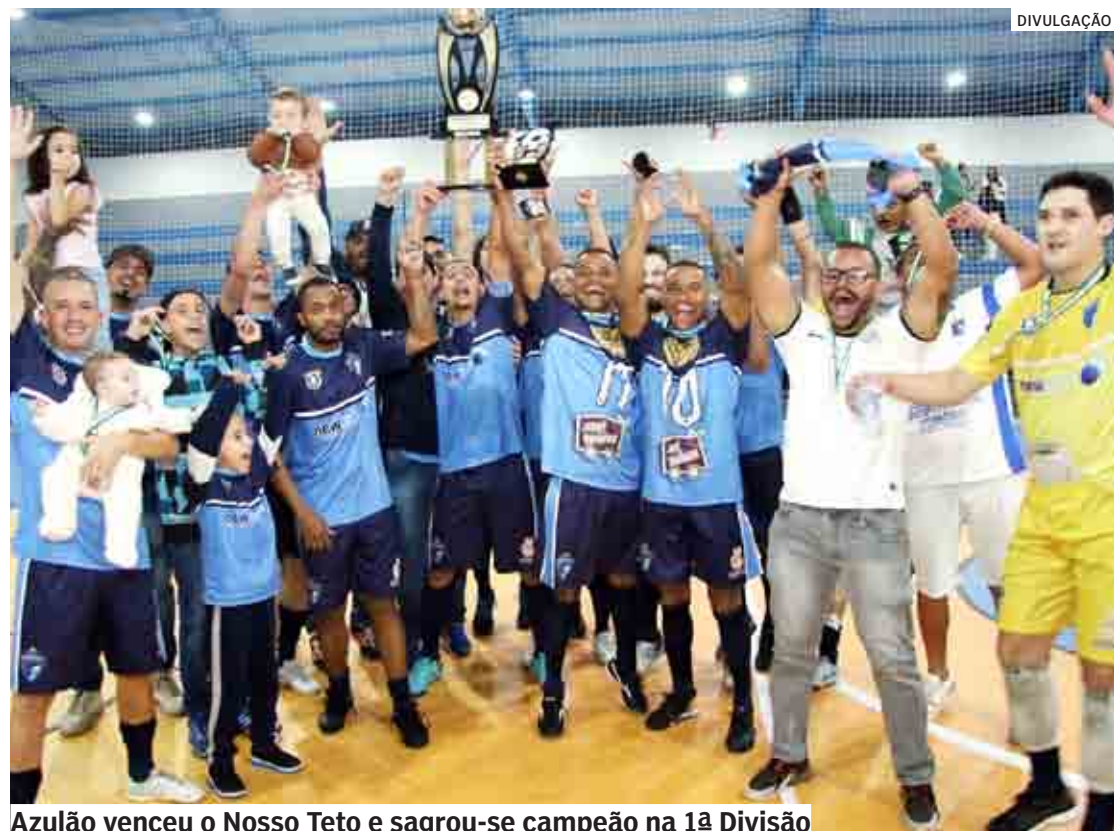
Azulão venceu o Nosso Teto e sagrou-se campeão na 1ª Divisão