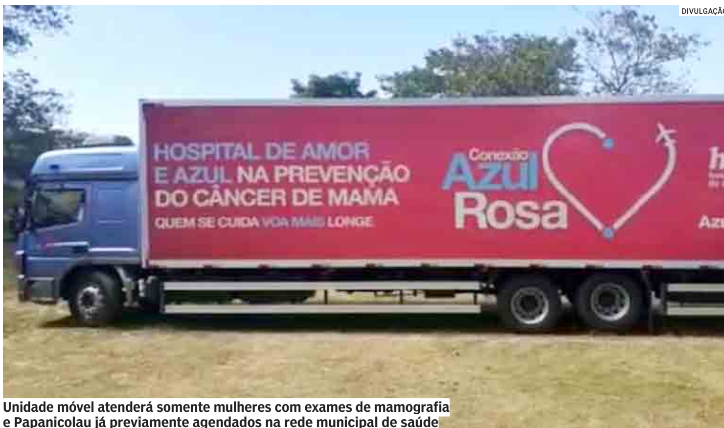
Unidade móvel atenderá somente mulheres com exames de mamografia e Papanicolau já previamente agendados na rede municipal de saúde

Hortolândia contará com um importante reforço para o atendimento de mulheres que aguardam exames de saúde. O município receberá a carreta do Hospital de Amor, na próxima segunda-feira (20/06). A unidade móvel atenderá somente mulheres, com oferta de exames gratuitos de mamografia e Papanicolau já previamente agendados na rede municipal de saúde. A carreta ficará estacionada até a sexta-feira (24/06) na Secretaria de Cultura, localizada na Rua Graciliano Ramos, 280, Jardim Amanda. O horário de