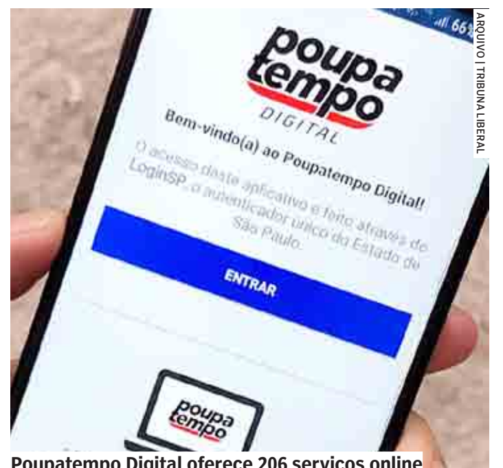
Poupatempo Digital oferece 206 serviços online

Para informações, consulta de endereço e horário de funcionamento das unidades, basta acessar o site do Poupatempo, que está de cara nova, reformulado, para atender às necessidades da população.