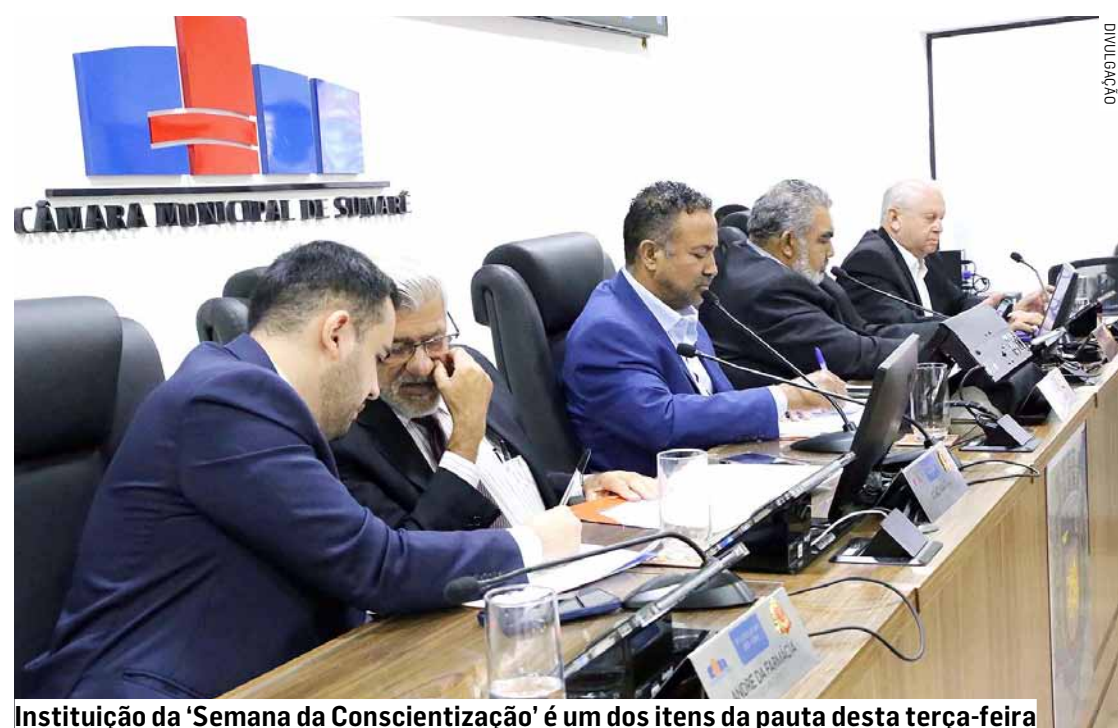
Instituição da 'Semana da Conscientização' é um dos itens da pauta desta terça-feira