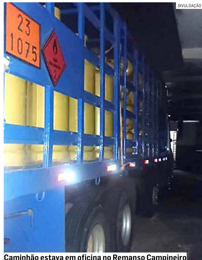
Caminhão estava em oficina no Remanso Campineiro

O proprietário da oficina e o caminhão com a carga foram apresentados no Plantão Policial, onde foi determinada a prisão do acusado. A vítima compareceu à unidade policial, mas não reconheceu o suspeito como sendo o autor do roubo.