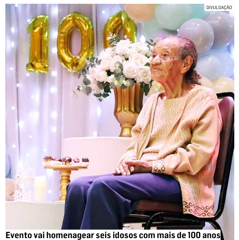
Evento vai homenagear seis idosos com mais de 100 anos

A ‘Homenagem aos Centenários’ é um tradicional evento que compõe as comemorações de aniversário da cidade. Além de reunir os seis moradores homenageados, o evento contará com a presença de autoridades públicas, entre as quais o prefeito de Hortolândia, Zezé Gomes (Republicanos), e dos idosos do CCMI (Centro de Convivência da Melhor Idade). A cerimônia será aberta ao público.