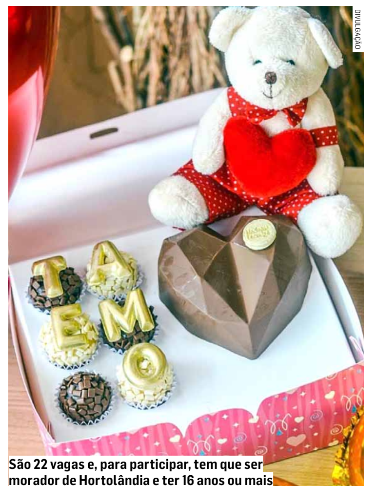
São 22 vagas e, para participar, tem que ser morador de Hortolândia e ter 16 anos ou mais

quarta-feira (22/05), no período da manhã, das 8h às 12h, na Cozinha Escola Comunitária, localizada na Av. Osvaldo de Souza, 375, no Jd. Novo ângulo.