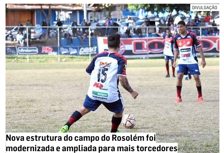
Nova estrutura do campo do Rosolém foi modernizada e ampliada para mais torcedores