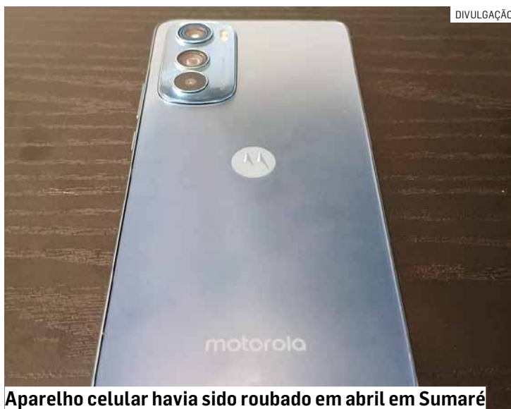
Aparelho celular havia sido roubado em abril em Sumaré

O comerciante foi conduzido até o Plantão Policial de Nova Odessa, onde foi autuado por receptação.