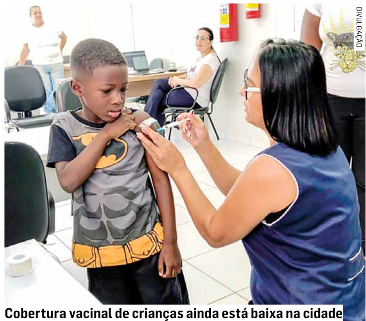
Cobertura vacinal de crianças ainda está baixa na cidade

Da Redação • HORTOLÂNDIA tribunaliberal@tribunaliberal.com.br