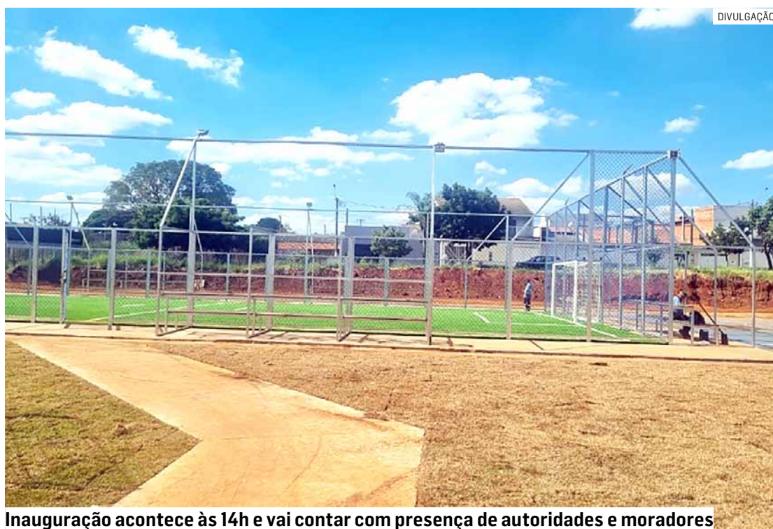
Inauguração acontece às 14h e vai contar com presença de autoridades e moradores

A Arena Esportiva, projeto construído pela parceria entre Prefeitura de Hortolândia e Governo do Estado de São Paulo, no Jardim Nova Alvorada, será inaugurada nesta quinta-feira (16), às 14h; O evento vai contar com a presença da secretária de Esportes do Governo do Estado de São Paulo, Coronel Helena Reis, e da deputada estadual, Edna Macedo (Republicanos). A Arena Esportiva está localizada na via entre a academia Panobianco e o PEV (Ponto de Entrega Voluntária) do bairro.