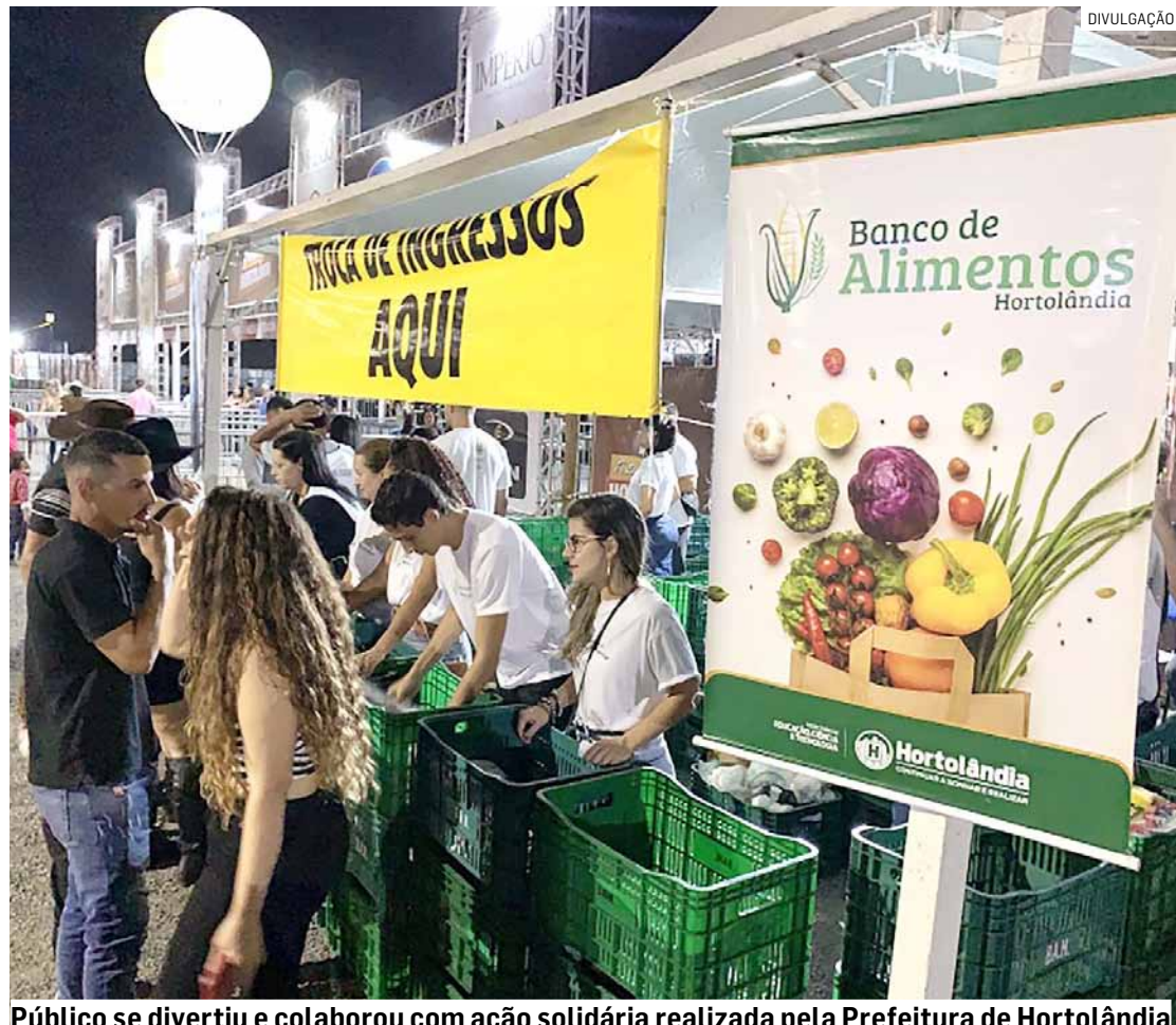
Público se divertiu e colaborou com ação solidária realizada pela Prefeitura de Hortolândia

"Cada apresentação é especial e marcante na vida do artista. Ter a oportunidade de fazer parte desse grande evento é muito pra-