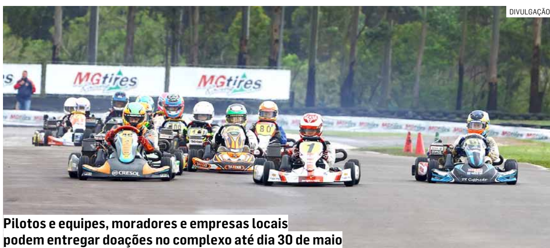
Pilotos e equipes, moradores e empresas locais podem entregar doações no complexo até dia 30 de maio

Da Redação • PAULÍNIA tribunaliberal@tribunaliberal.com.br