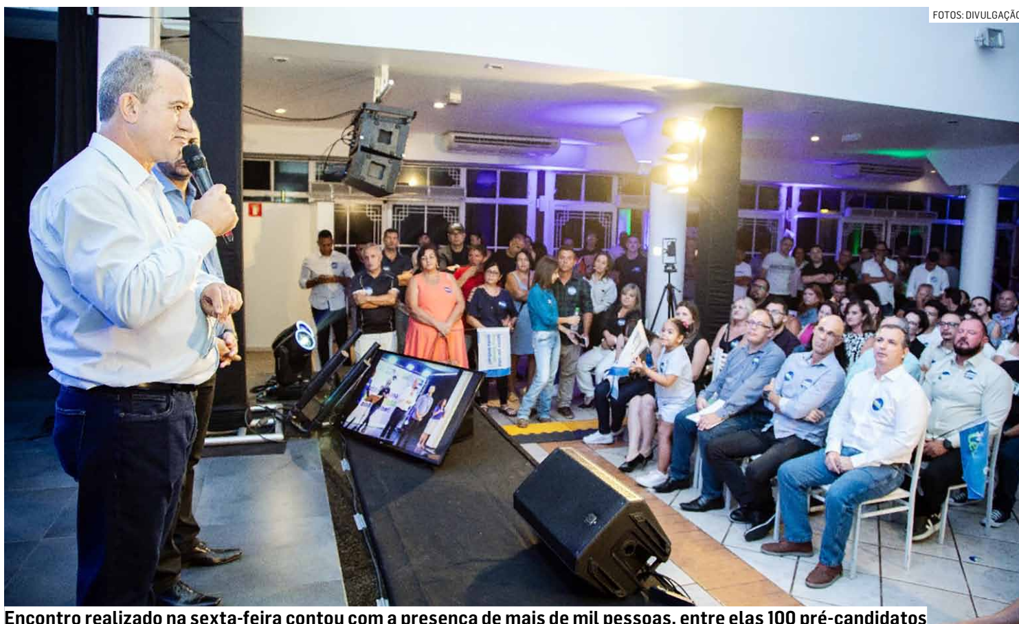
Encontro realizado na sexta-feira contou com a presença de mais de mil pessoas, entre elas 100 pré-candidatos

“Estar com o Leitinho em cima desse palco, diante dessa multidão, é um motivo de orgulho. Fico feliz de ver pessoas de bem, pessoas de caráter, se unindo para fazer o bem por essa