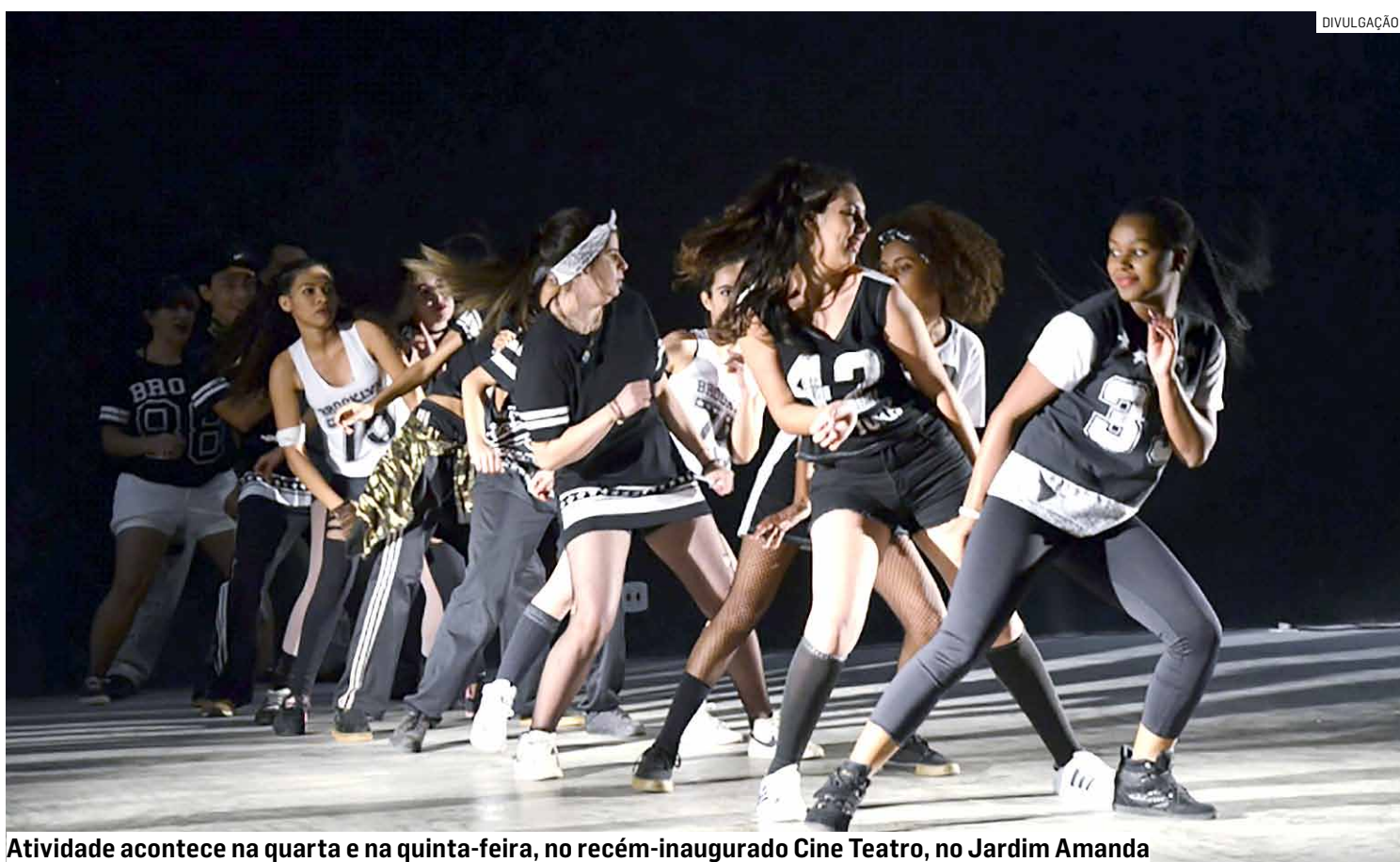
Atividade acontece na quarta e na quinta-feira, no recém-inaugurado Cine Teatro, no Jardim Amanda

A realização da oficina é para atender uma demanda apresentada por faze-