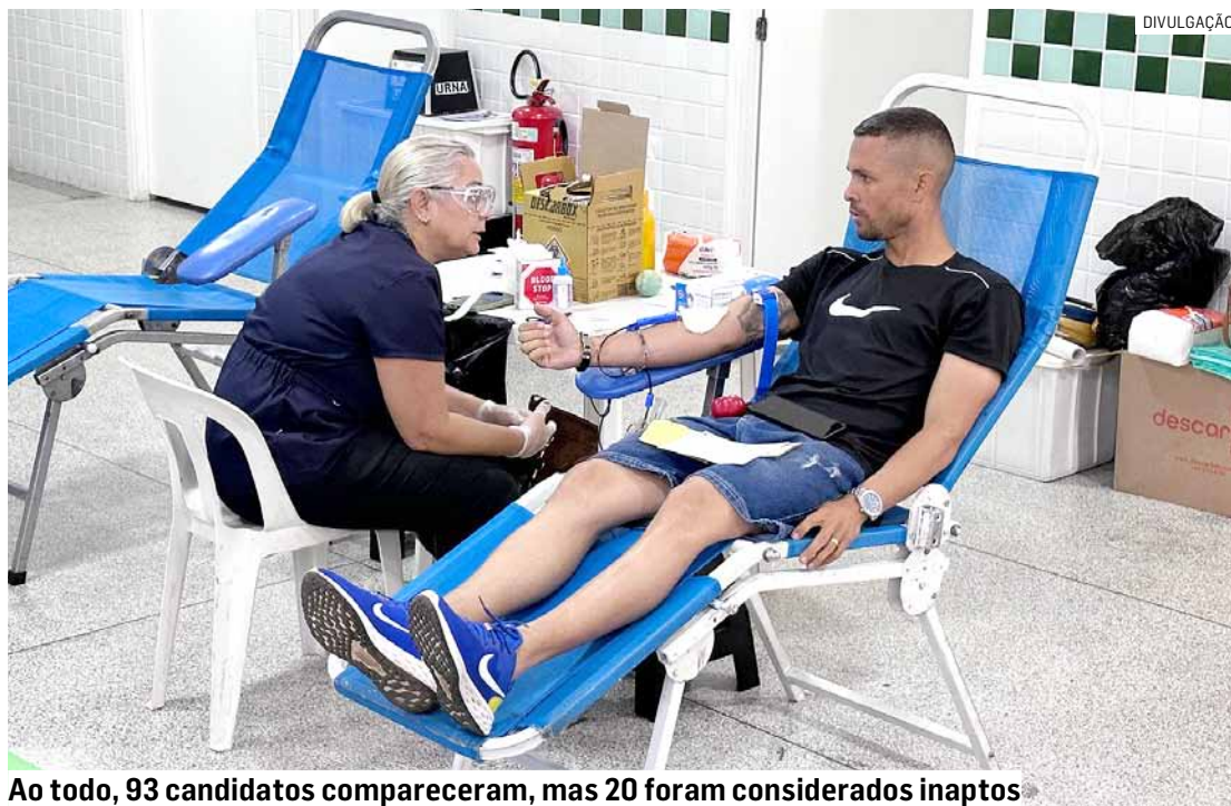
Ao todo, 93 candidatos compareceram, mas 20 foram considerados inaptos

A iniciativa contou com o apoio da Polícia Militar, Colégio Objetivo, Escoteiros do Ar, Etec (Escola Técnica Estadual) e Faculdades Network. As coletas periódicas ocorrem quatro vezes ao ano e visam repor os estoques de sangue do Hemocentro, que cede bolsas para os pacientes do mu-