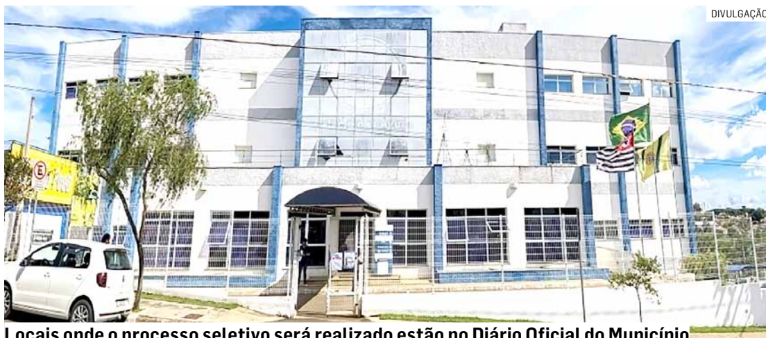
Locais onde o processo seletivo será realizado estão no Diário Oficial do Município

Os candidatos inscritos no concurso público da prefeitura podem consul-