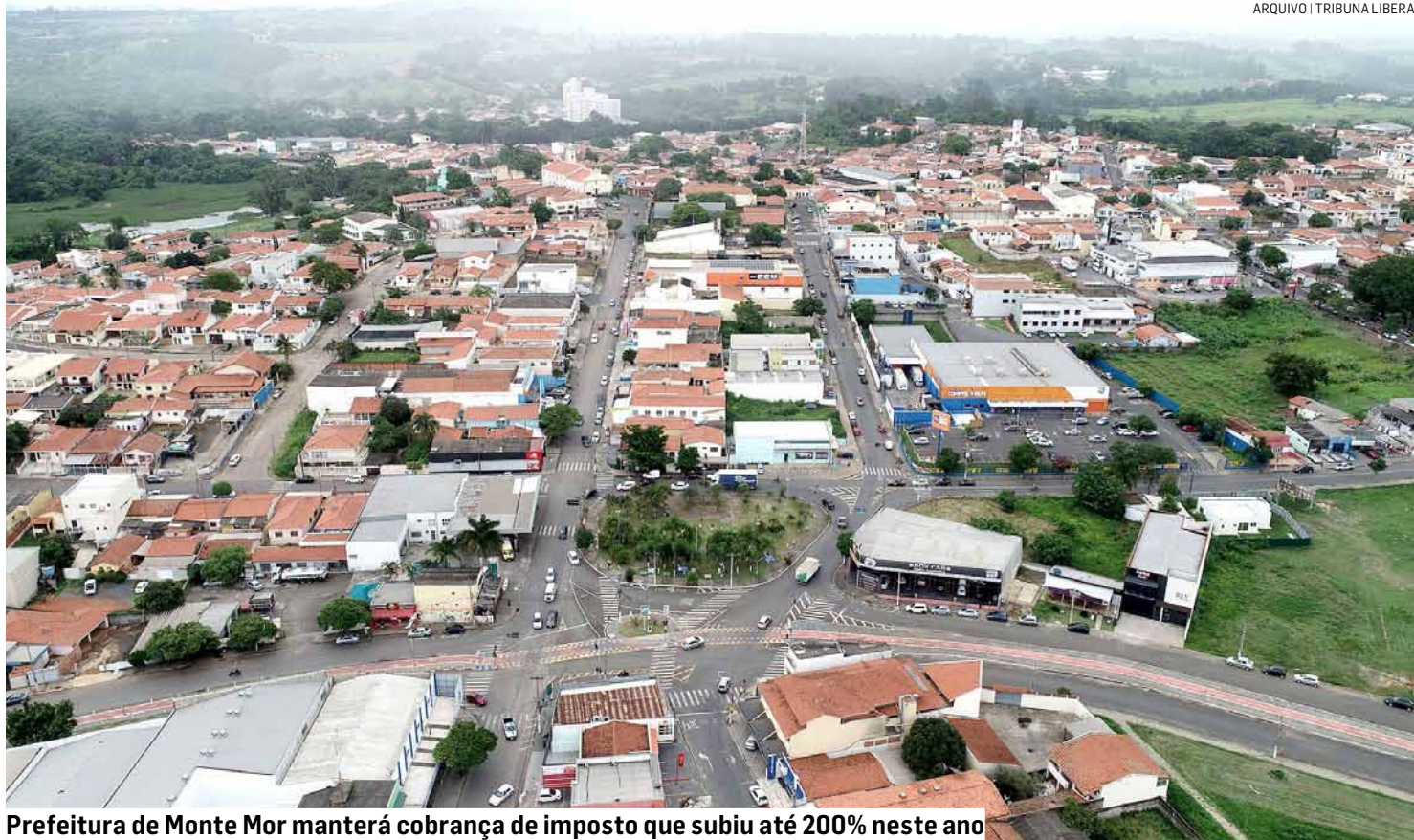
Prefeitura de Monte Mor manterá cobrança de imposto que subiu até 200% neste ano

“Desde o início dos lançamentos do IPTU 2024, a procura por correções nas áreas construídas lançadas foi notavelmente baixa em relação à quantidade de cadastros realizados. Isso reflete a precisão do sistema e a confiabilidade dos dados registrados. Aque-