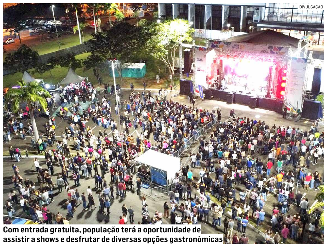
Com entrada gratuita, população terá a oportunidade de assistir a shows e desfrutar de diversas opções gastronômicas

Originária de Nova Odessa, a Banda Mídia tem marcado presença