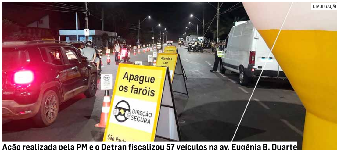
Ação realizada pela PM e do Detran fiscalizou 57 veículos na av. Eugênia B. Duarte

A operação foi realizada na avenida Eugênia Biancalana Duarte, no Jardim