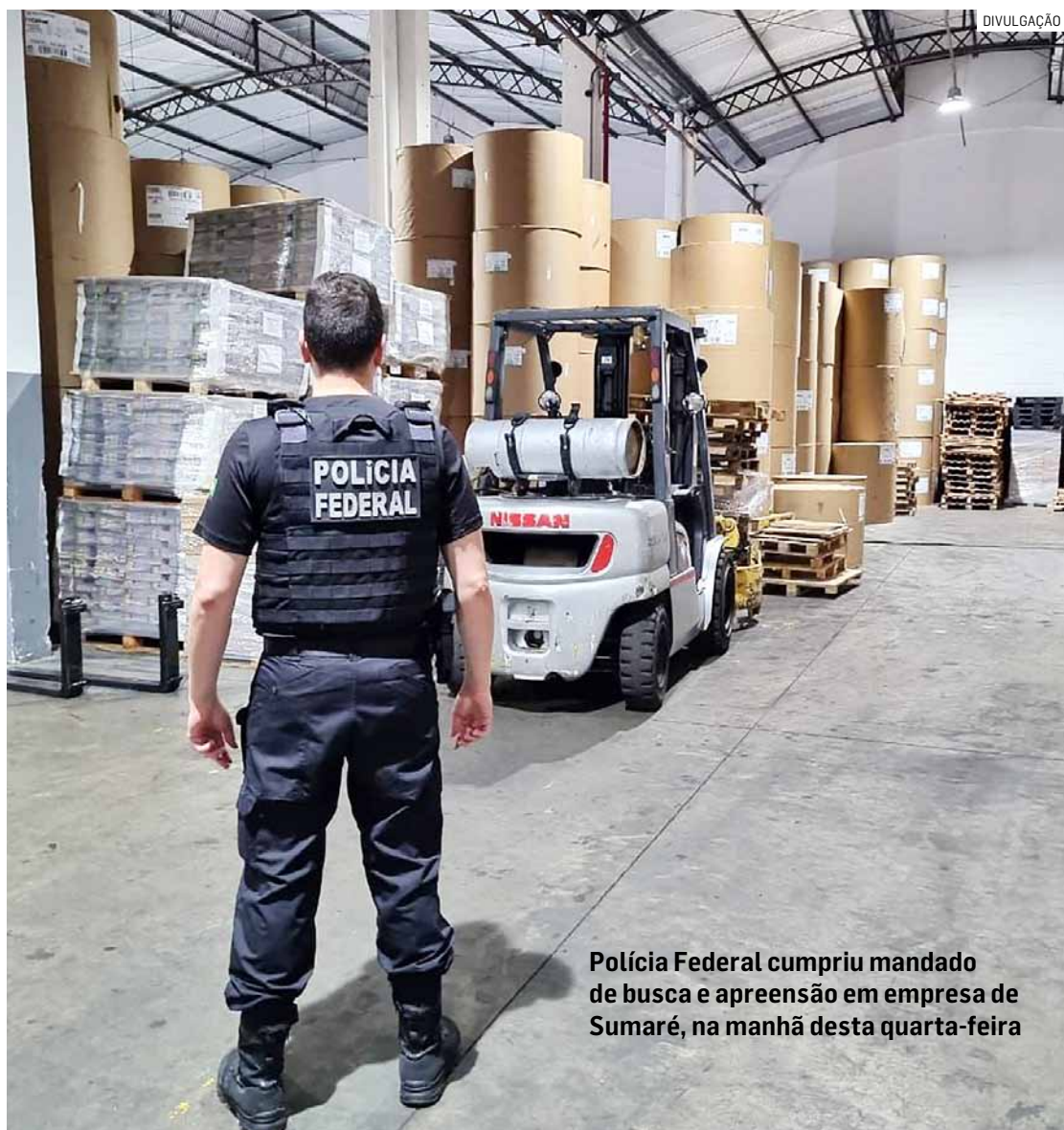
Polícia Federal cumpriu mandado de busca e apreensão em empresa de Sumaré, na manhã desta quarta-feira

A lavagem de dinheiro era feita por meio da constituição de empresas de fachada, aquisição de imóveis por meio de intermediários, superfaturamento de serviços prestados aos candidatos laranja e ao partido.