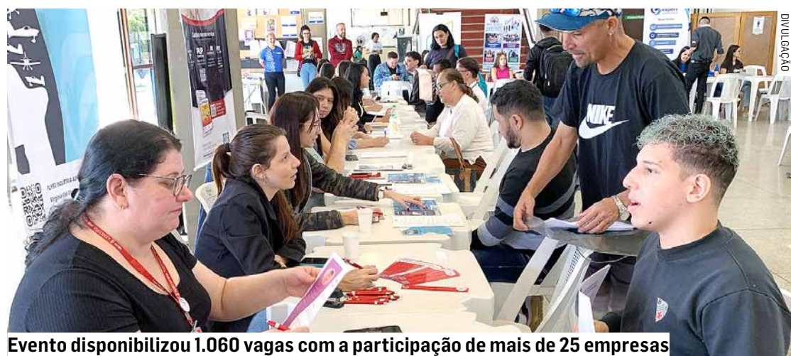
Evento disponibilizou 1.060 vagas com a participação de mais de 25 empresas

Da Redação • NOVA ODESSA tribunaliberal@tribunaliberal.com.br