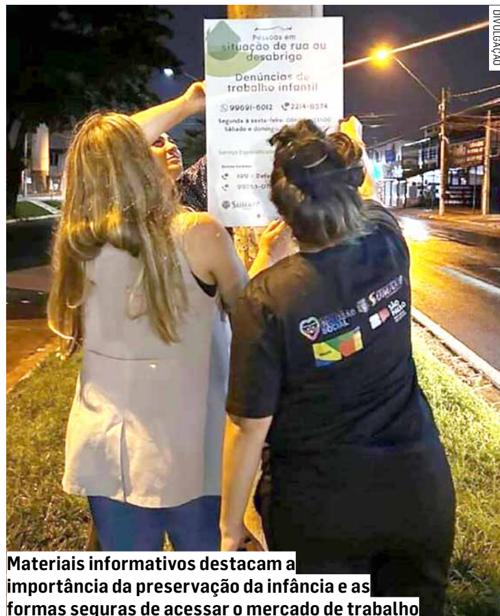
Materiais informativos destacam a importância da preservação da infância e as formas seguras de acessar o mercado de trabalho

A Secretaria Municipal de Inclusão, Assistência e Desenvolvimento Social conta com o Serviço Especializado de Abordagem Social, cuja equipe técnica monitora, identifica e acompanha casos de trabalho infantil em áreas pú-