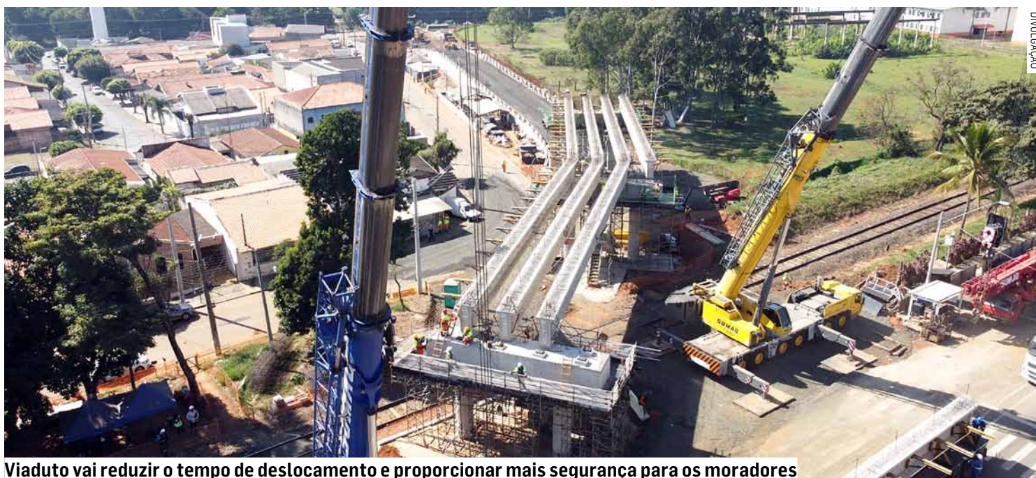
Viaduto vai reduzir o tempo de deslocamento e proporcionar mais segurança para os moradores

O prefeito ressaltou o impacto positivo da obra na vida dos moradores. “Esta é uma conquista histórica para Sumaré. A instalação das vigas e das estruturas de concreto representa um passo significativo para a conclusão do viaduto do Jardim Primavera. Esta obra vai melhorar significativamente a mobilida-