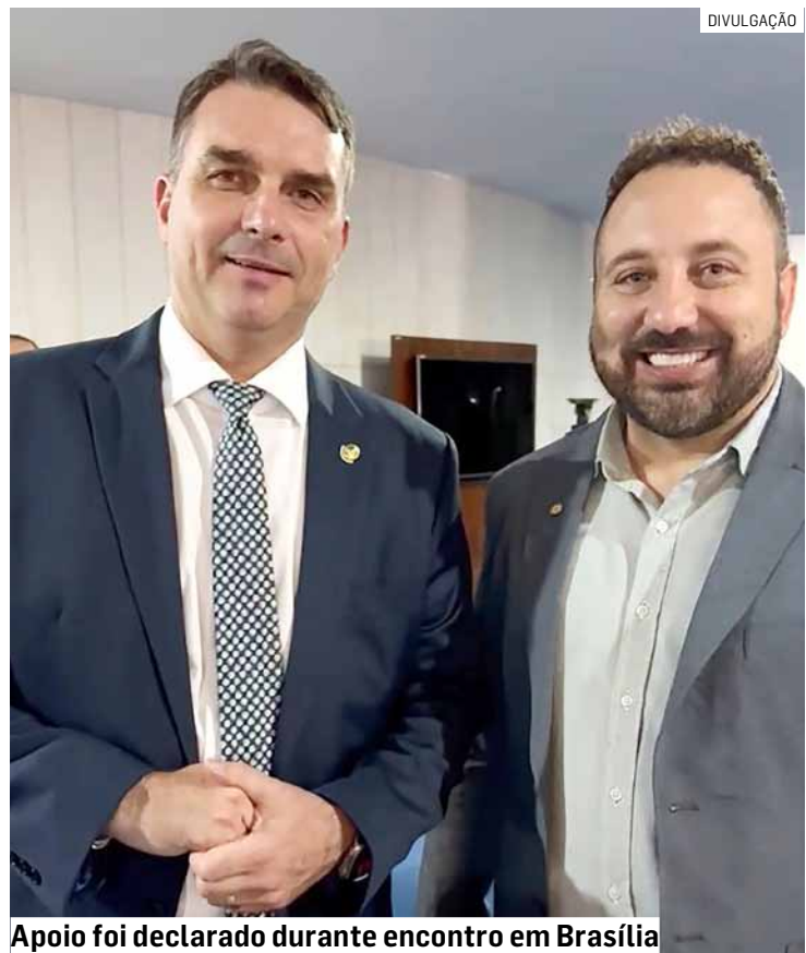
Apoio foi declarado durante encontro em Brasília