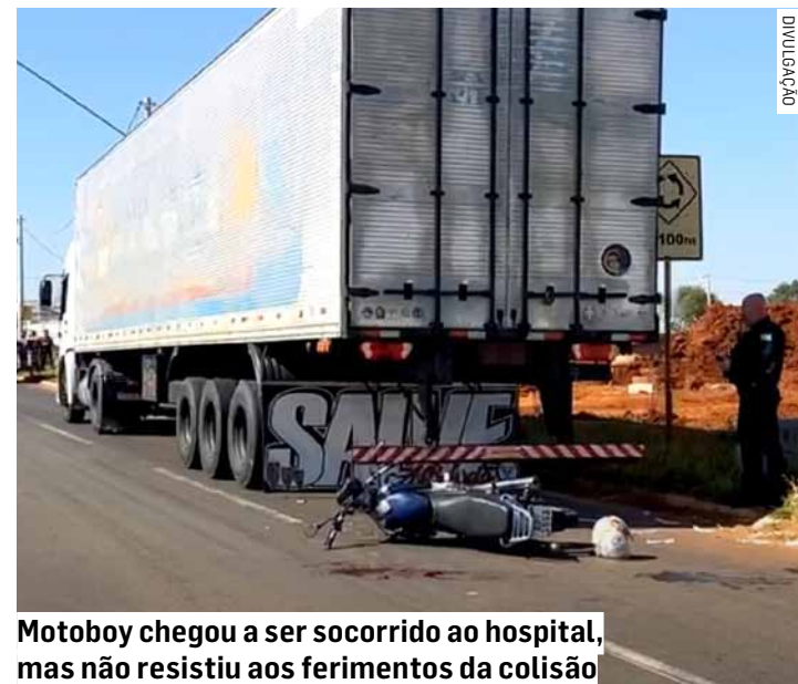
Motoboy chegou a ser socorrido ao hospital, mas não resistiu aos ferimentos da colisão

Em seguida chegou a ambulância do Samu (Serviço Móvel de Urgên-