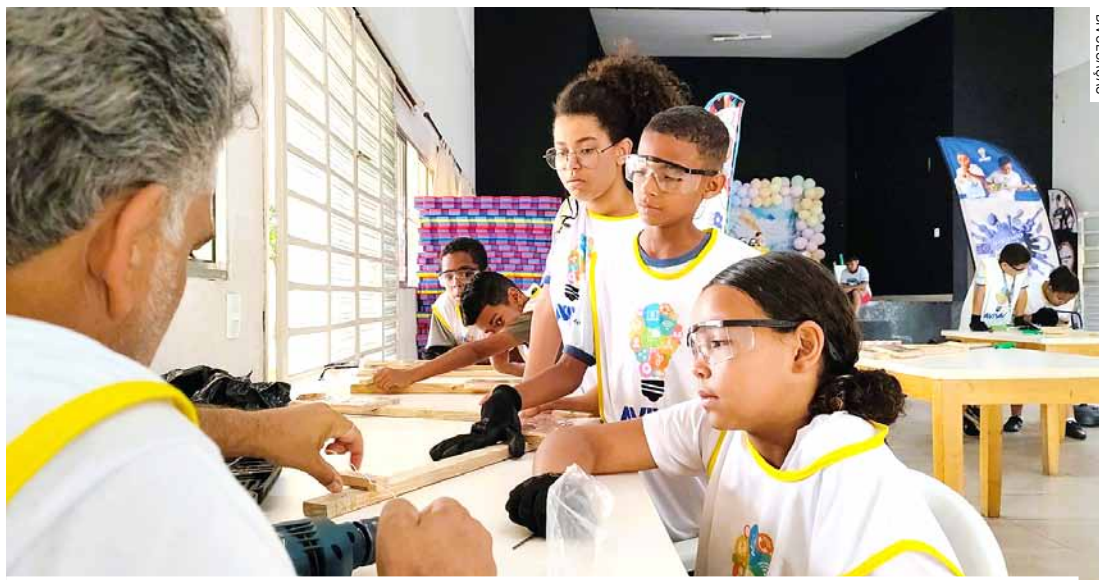
Estratégia é contribuir para conscientização ambiental dos participantes e suas famílias

A ação cultural possui o objetivo de estimular a formação de público e o desenvolvimento de talentos e habilidades artísticas de crianças e adolescentes em situação de vulnerabilidade social no segmento de música e tem atendido gratuitamente um público de cem participantes organi-