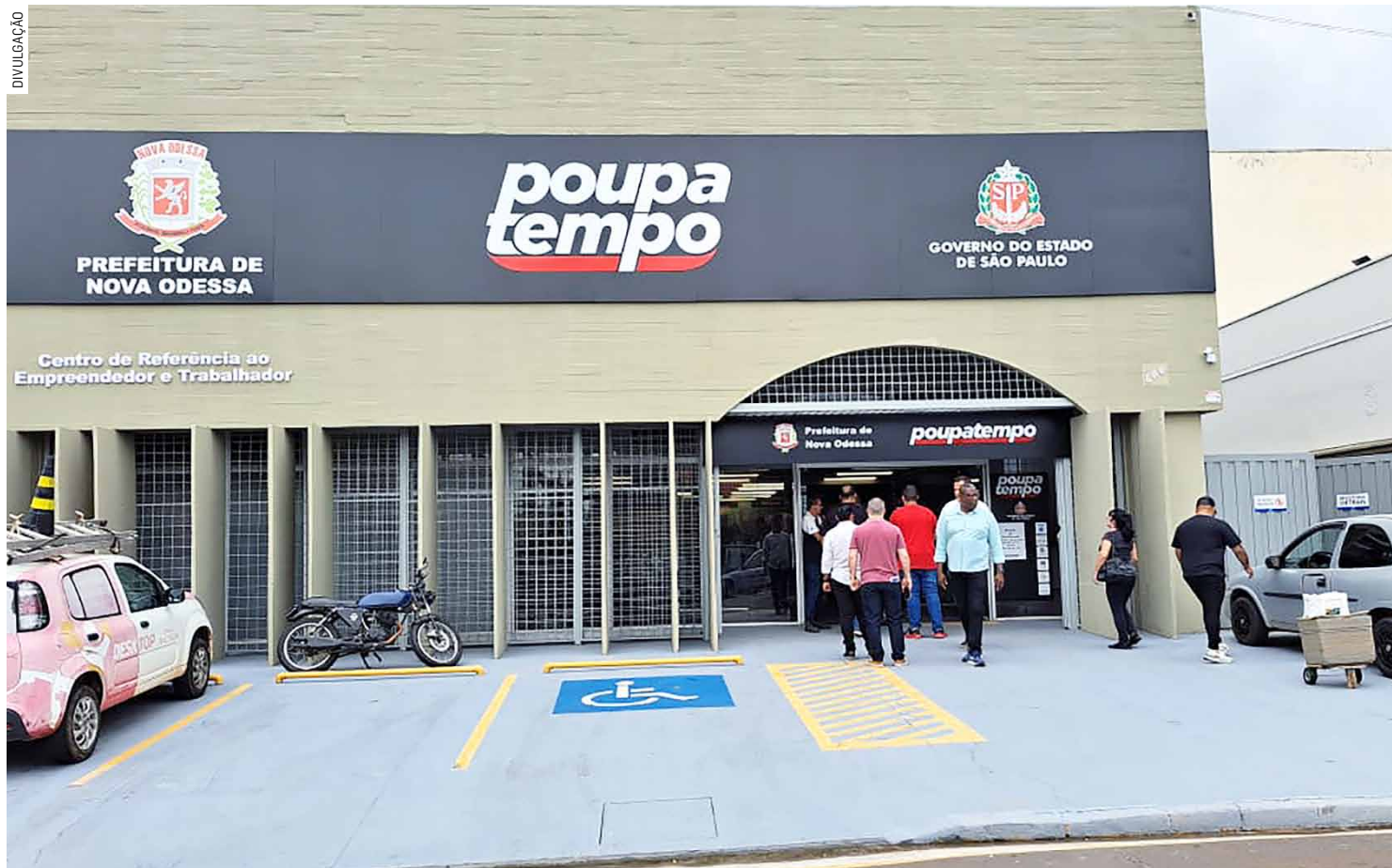
Desde a sua abertura em outubro do ano passado, Poupatempo já realizou cerca de seis mil atendimentos à população local

Entre 31 de outubro de 2023, quando abriu ao público ainda em fase de testes, e o final de maio deste ano, a unidade de Nova Odessa do Poupatempo Paulista já havia realizado cerca de seis mil atendimentos à população local, principalmente referente