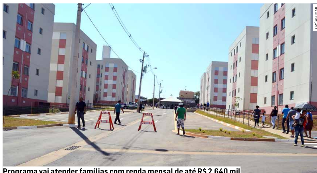
Programa vai atender famílias com renda mensal de até R$ 2,640 mil

Ainda de acordo com a propositura, para implementação do programa, o município poderá celebrar TAC (termo de acordo e compromisso) com instituições financeiras autorizadas pelo Banco Central do Brasil, assim como fa-