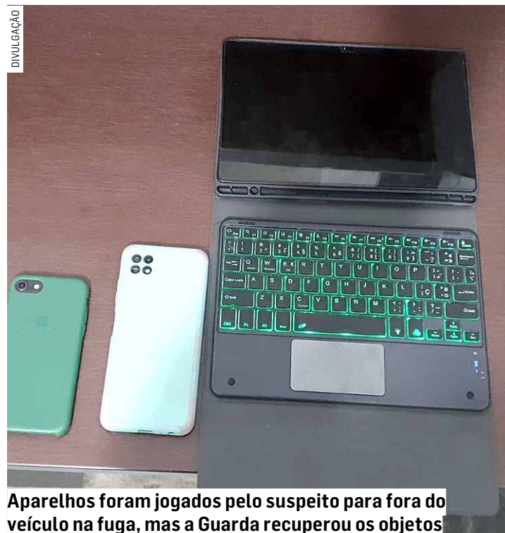
Aparelhos foram jogados pelo suspeito para fora do veículo na fuga, mas a Guarda recuperou os objetos

A equipe deu ordem de parada e, durante o acompanhamento, o motorista dispensou uma sacola com os aparelhos celulares pela janela do veículo. O motorista suspeito obedeceu a ordem de parada a duas quadras da delegacia.