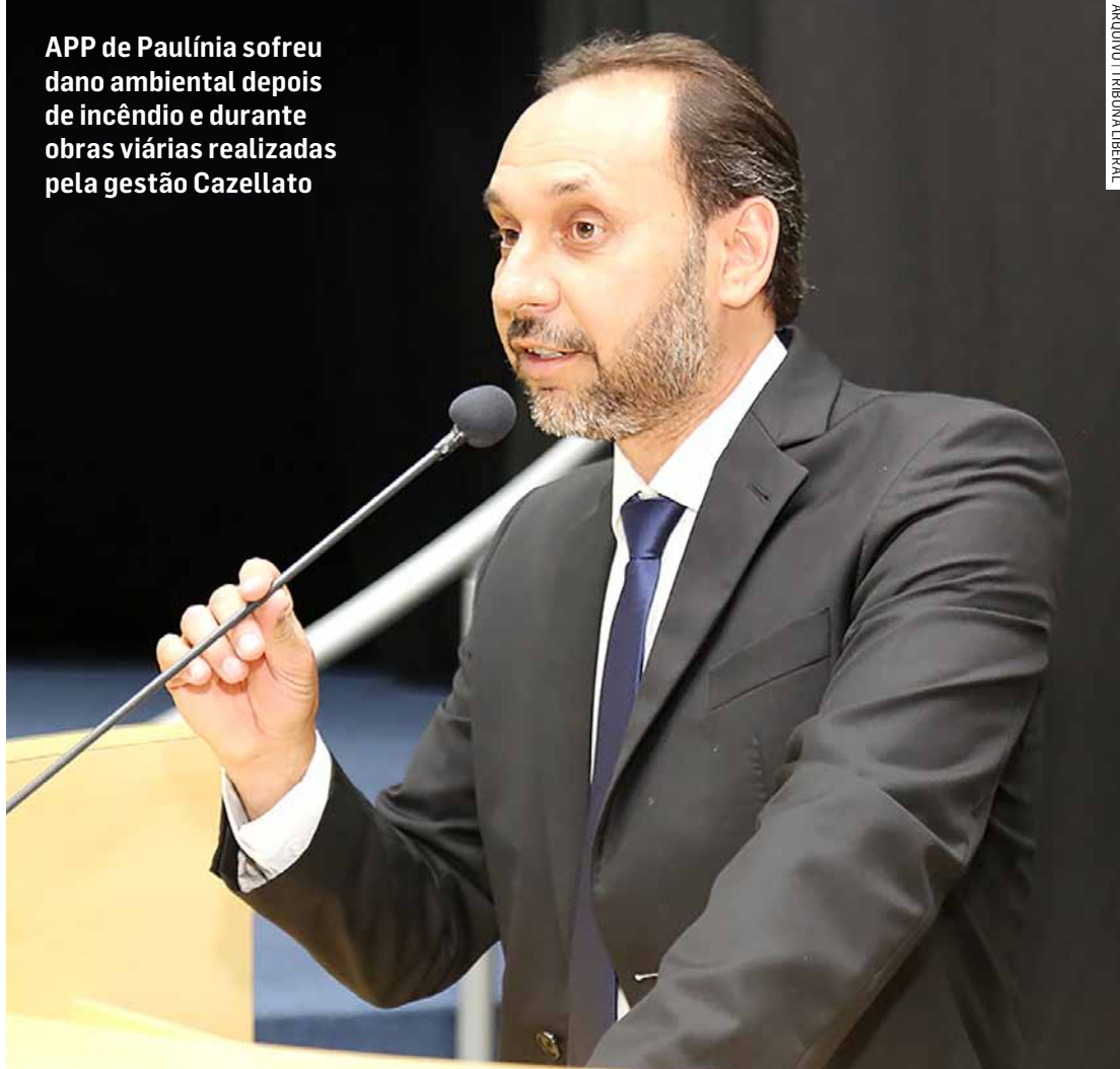
APP de Paulínia sofreu dano ambiental depois de incêndio e durante obras viárias realizadas pela gestão Cazellato

A determinação da perícia ocorre no âmbito de uma ação civil pública movida pelo Ministério Público de São Paulo, que acusa a Prefeitura de Paulínia de negligência na recuperação ambiental de uma área afetada por obras viárias. Segundo o MP, desde 30 de setembro de 2022, a administração do prefeito Du Cazellato (PL) falhou em cumprir integralmente