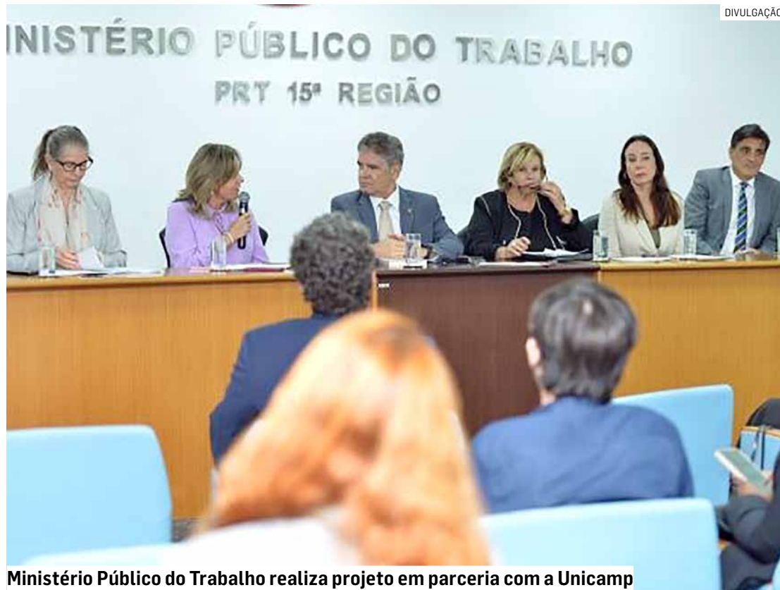
Ministério Público do Trabalho realiza projeto em parceria com a Unicamp

A ferramenta é vista como uma forma de "sensibilização social". A partir da assinatura, as instituições se comprometeram a desenvolver ações conjuntas que vão além da cria-