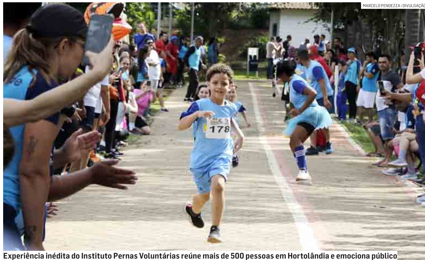
Experiência inédita do Instituto Pernas Voluntárias reúne mais de 500 pessoas em Hortolândia e emociona público

Da Redação | HORTOLÂNDIA tribunaliberal@tribunaliberal.com.br