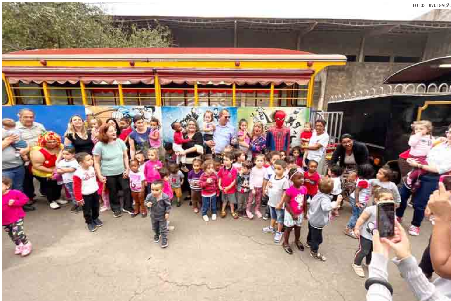
Leitinho “pegou carona” nos passeios de trenzinho dos alunos dos CMEIs: “É muito bom ver esses estudantes sorrindo”

Nos passeios, as crianças circulam pelos bairros onde ficam suas creches durante 20 minutos, com música, diversão e ainda a participação especial do super-herói Homem Aranha para animar a criançada – tudo em baixa velocidade, com total segurança e monitoramento