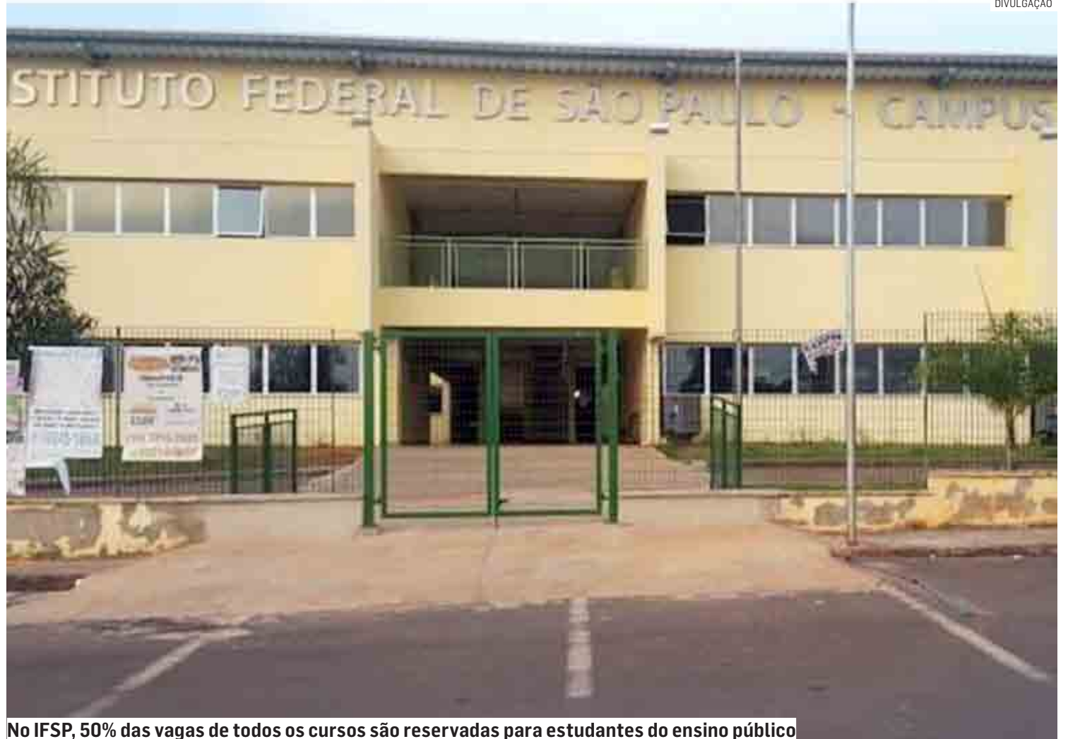
No IFSP, 50% das vagas de todos os cursos são reservadas para estudantes do ensino público

ção, há a cobrança de uma taxa de R$ 20 reais. Candidatos que estudaram o ensino fundamental integralmente em escola da rede pública, ou com bolsa in-