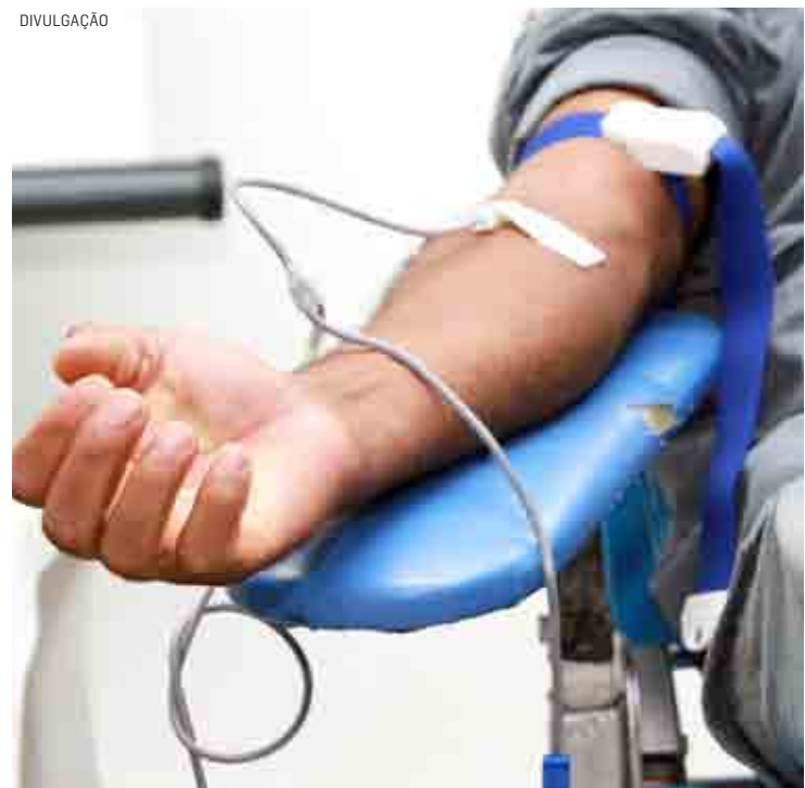
Doador passará por exames na triagem para atestar aptidão