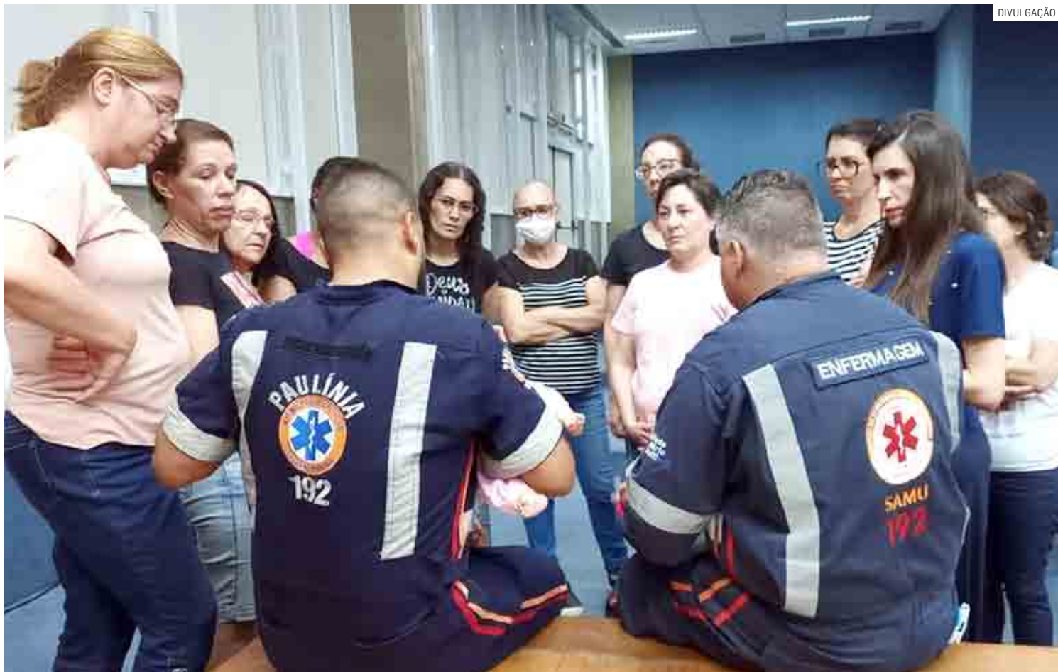
Após o término das capacitações, profissionais da educação receberão certificado de participação com validade de dois anos

Durante quatro horas, os socorristas do APH ensinam manobras em casos de engasgos, quei-