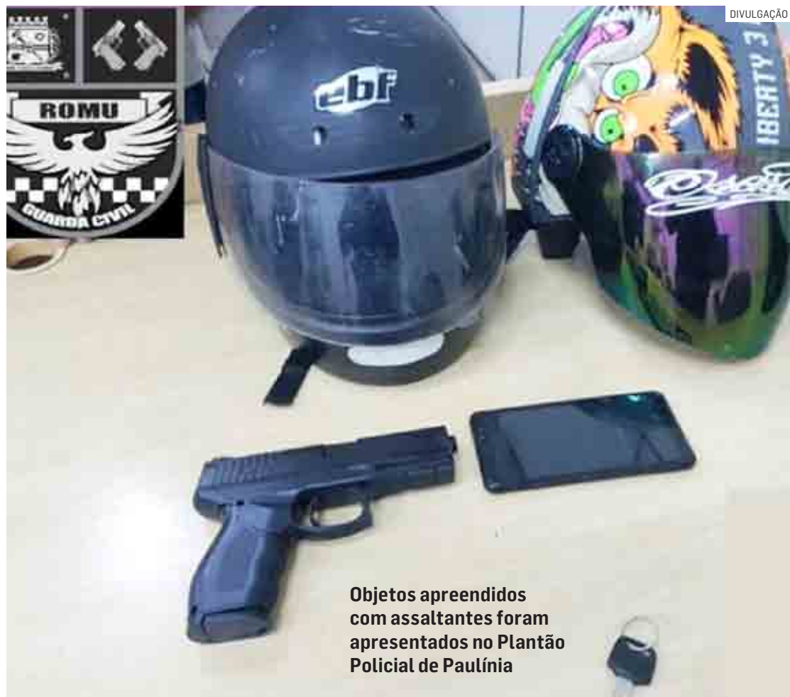
Objetos apreendidos com assaltantes foram apresentados no Plantão Policial de Paulínia