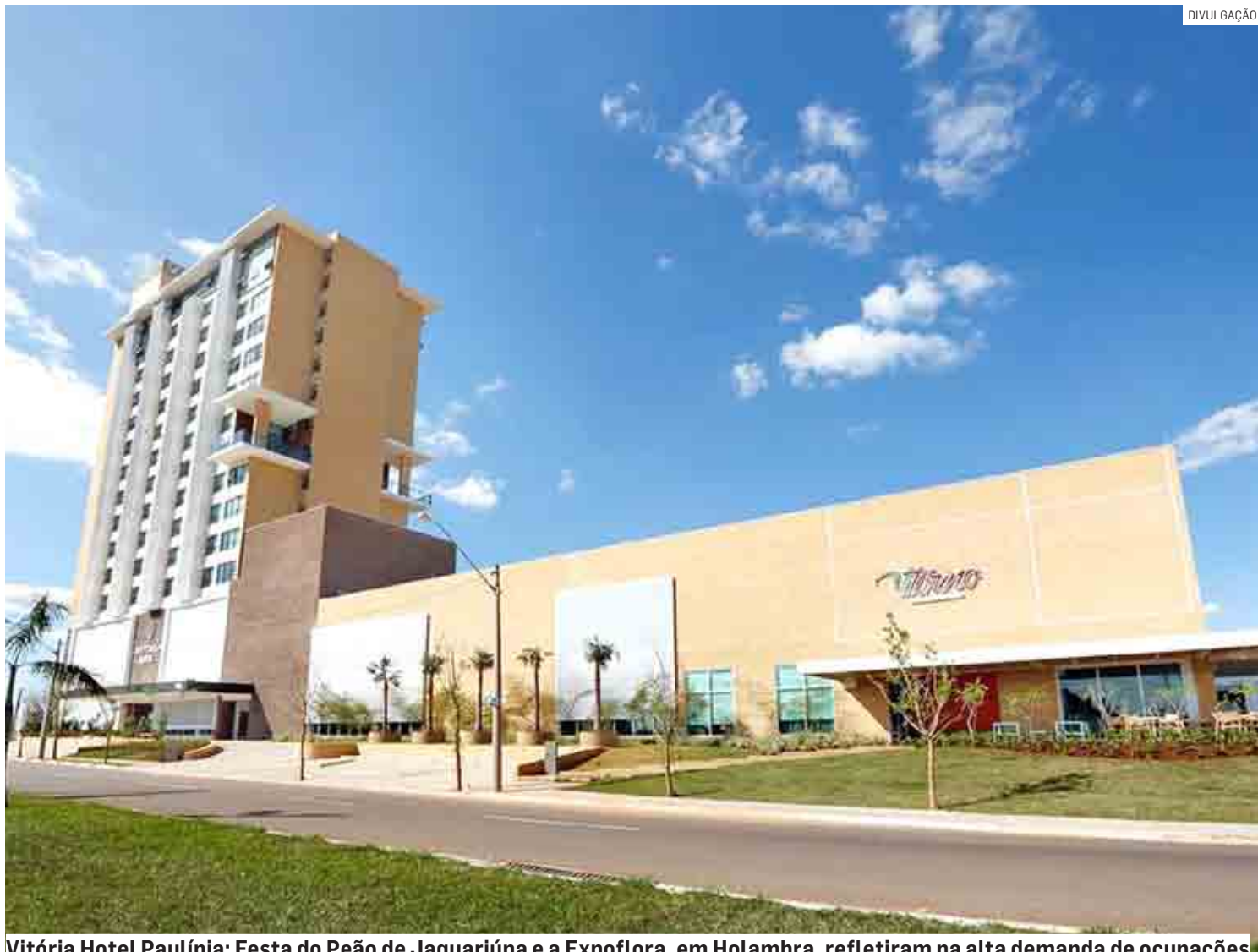
Vitória Hotel Paulínia: Festa do Peão de Jaguariúna e a Expoflora, em Holambra, refletiram na alta demanda de ocupações

Outro dado importante apontado pela pesquisa mensal refere-se ao valor médio das diárias, que ficou em R$ 291,82. “Este dado é muito importante na rede, pois permite a recomposição dos caixas e para manter a saúde financeira dos negócios”, completa Marcondes.