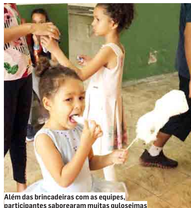
Além das brincadeiras com as equipes, participantes saborearam muitas guloseimas

Os participantes foram divididos em quatro tur-