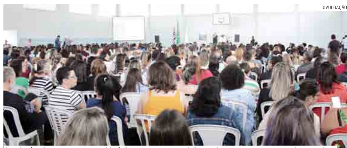
Conferência aconteceu no Ginásio da Escola Municipal Miguel Jalbut, no Jardim Paulista

Da Redação | MONTE MOR tribunaliberal@tribunaliberal.com.br