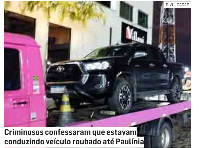
Criminosos confessaram que estavam conduzindo veículo roubado até Paulínia

A ocorrência foi apresentada na Segunda Delegacia Seccional de Campinas, onde o proprietário da caminhonete reconheceu os indivíduos que praticaram o roubo. Os assaltantes ficaram presos à disposição da Justiça.