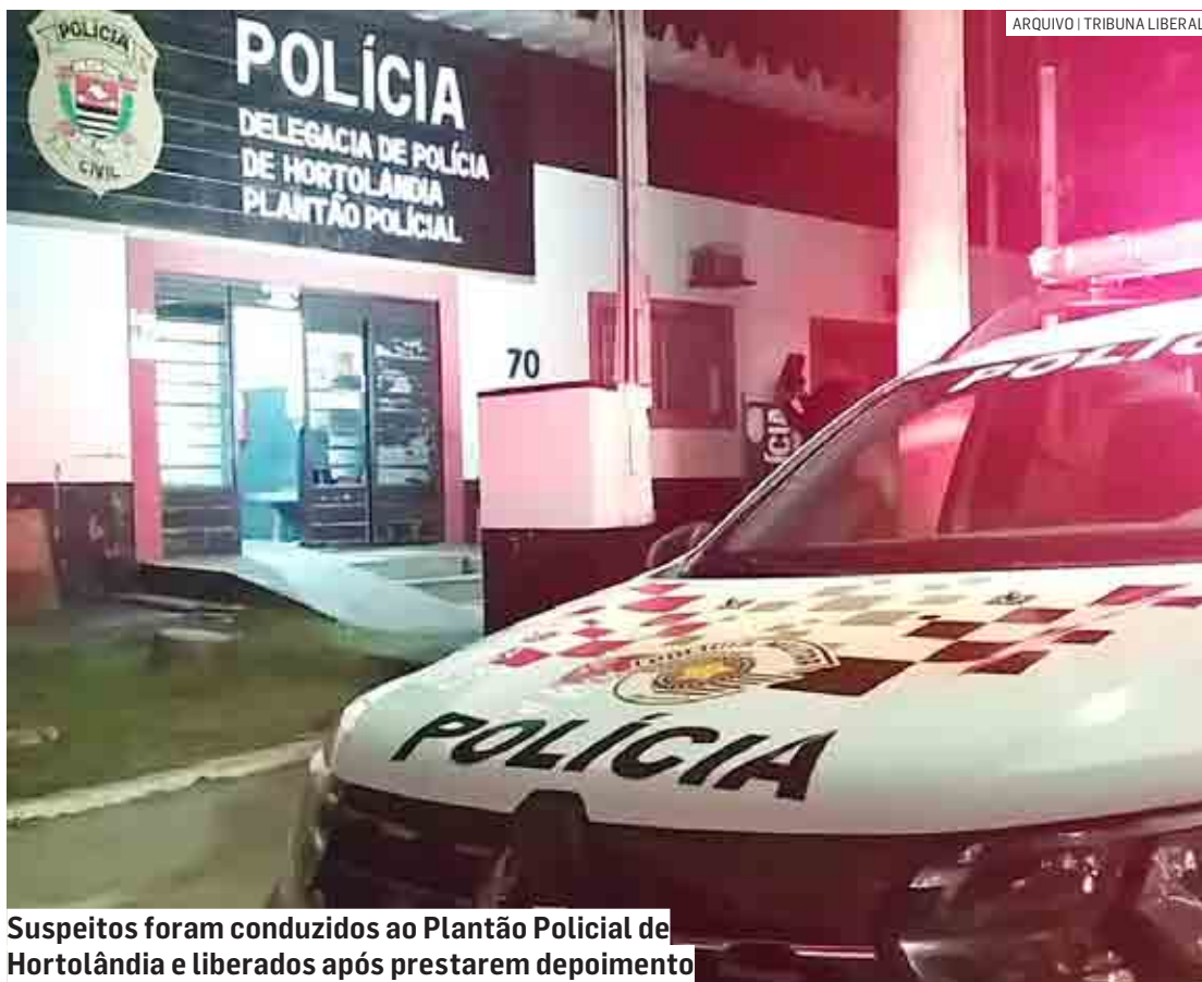
Suspeitos foram conduzidos ao Plantão Policial de Hortolândia e liberados após prestarem depoimento

O condutor tentou fugir, mas acabou caindo após o acompanhamento