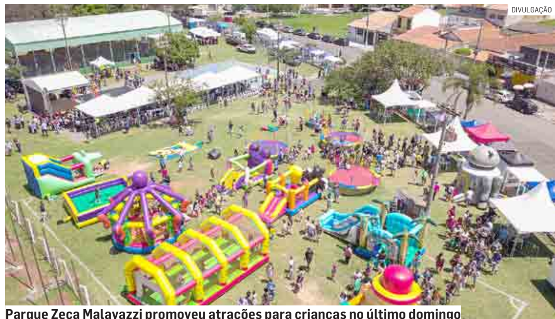
Parque Zeca Malavazzi promoveu atrações para crianças no último domingo

Crianças de 1 a 4 anos deverão receber a Polio Oral, mesmo que as vacinas estejam em dias. Adolescentes maiores de 15 anos e adultos também poderão receber a vacina contra gripe. É importante levar a carteira de vacinação para atualização.