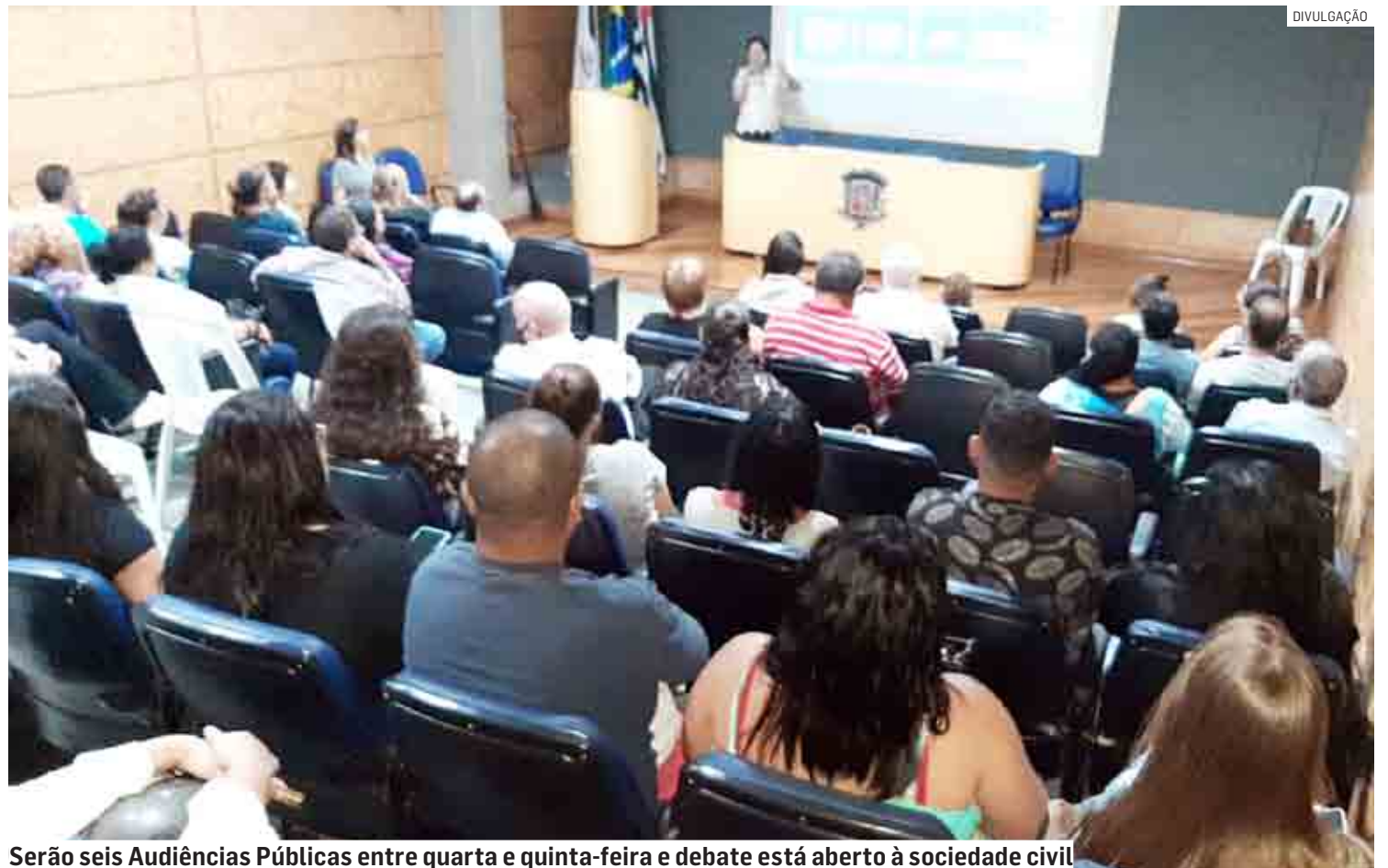
Serão seis Audiências Públicas entre quarta e quinta-feira e debate está aberto à sociedade civil