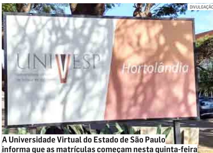
A Universidade Virtual do Estado de São Paulo informa que as matrículas começam nesta quinta-feira

O candidato convocado deverá enviar, de forma eletrônica, os seguintes arquivos em formato PDF: certificado de conclusão do ensino médio ou equivalente; certidão de nascimento ou casamento; RG e CPF; título de eleitor ou certidão de