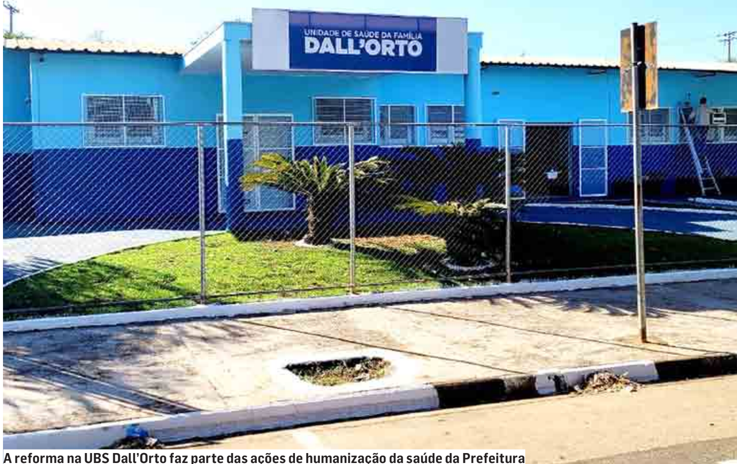
A reforma na UBS Dall'Orto faz parte das ações de humanização da saúde da Prefeitura

Prédio recebeu a troca da parte elétrica e hidráulica, adequações internas, pintura, novo paisagismo e substituição de mobiliário