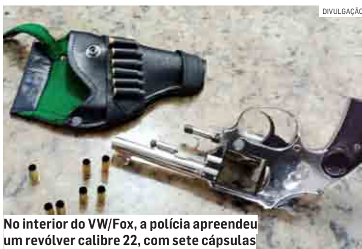
No interior do VW/Fox, a polícia apreendeu um revólver calibre 22, com sete cápsulas

O autor dos disparos foi autuado em flagrante por