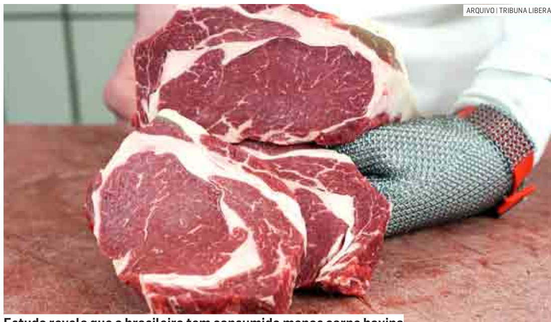
Estudo revela que o brasileiro tem consumido menos carne bovina

A desaceleração do índice de inflação foi verificada por conta da deflação de alguns produtos com peso relevante no consumo das famílias, muito em virtude da maior oferta desses