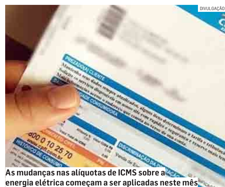
As mudanças nas alíquotas de ICMS sobre a energia elétrica começam a ser aplicadas neste mês

ta com cliente residencial das distribuidoras da CPFL com consumo de 285 kWh mostrou que uma conta de R$ 256 pode baixar para cerca de R$ 211 apenas pela redu-