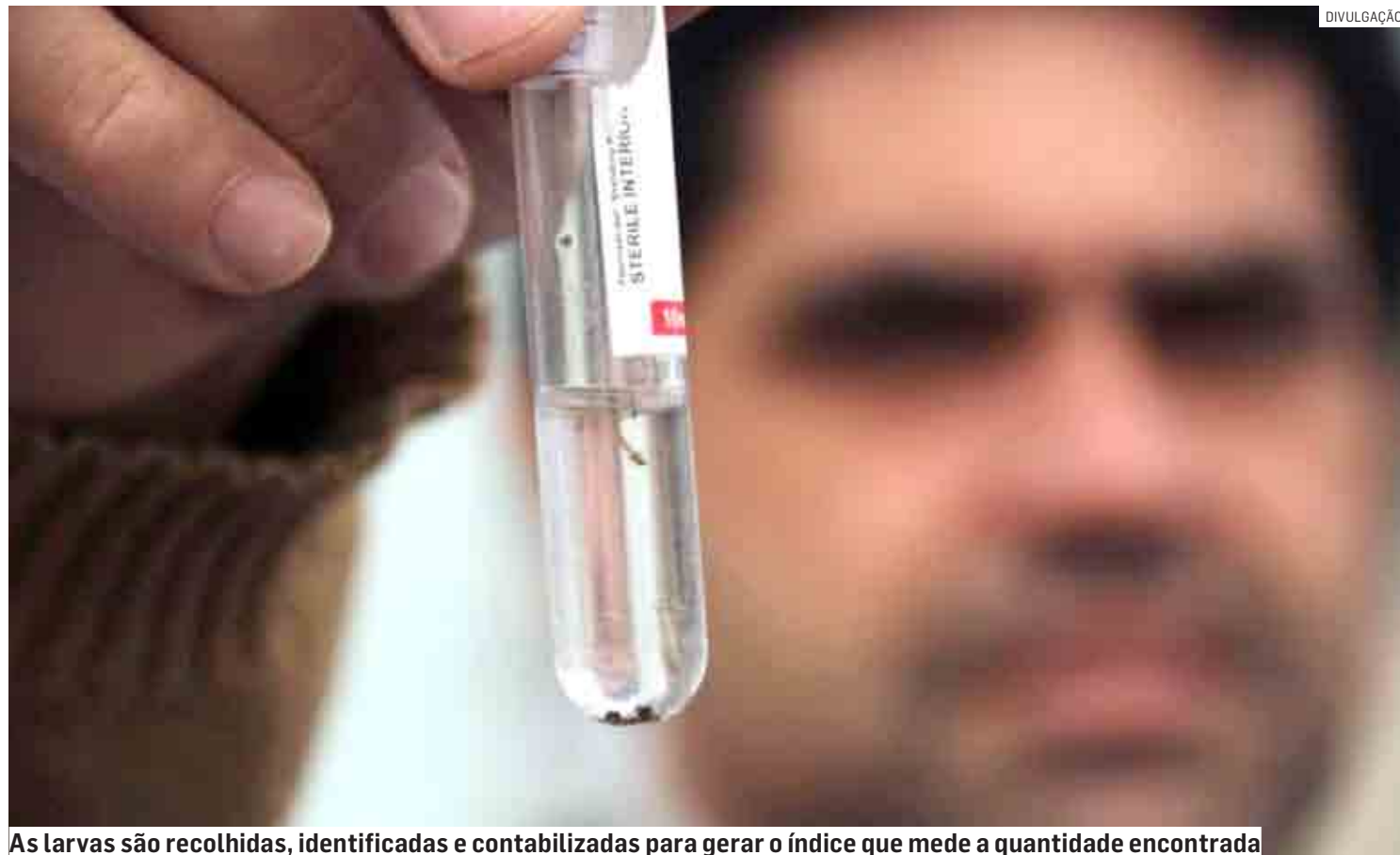
As larvas são recolhidas, identificadas e contabilizadas para gerar o índice que mede a quantidade encontrada

Trabalho visa definir estratégias de enfrentamento ao mosquito transmissor de Dengue, Chikungunya, Zika, dentre outras doenças