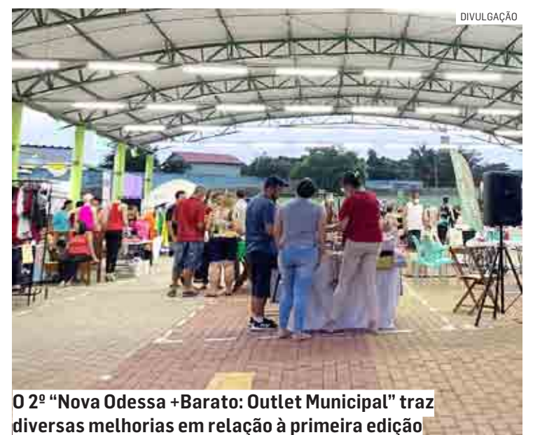
O 2º “Nova Odessa +Barato: Outlet Municipal” traz diversas melhorias em relação à primeira edição

A ação é uma forma de incentivo à economia local, que tem ainda o apoio da Clicknet Internet. “Nossa gestão tem feito tudo que está ao nosso alcance para ajudar os empresários, comerciantes e autônomos a alavancarem seus negócios” comentou o prefeito Cláudio José Schooder, o Leitinho. “E esse Outlet se mostrou uma ação muito boa para as lojas, que giram o estoque e atraem novos consumidores.”