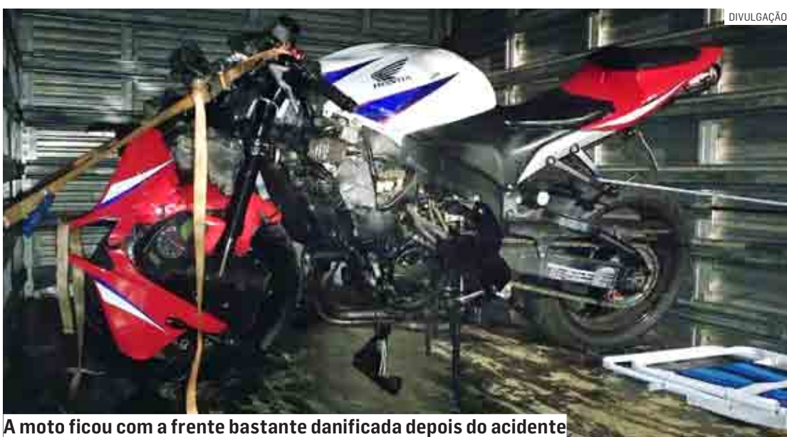
A moto ficou com a frente bastante danificada depois do acidente

Cézar Oliveira | HORTOLÂNDIA tribunaliberal@tribunaliberal.com.br