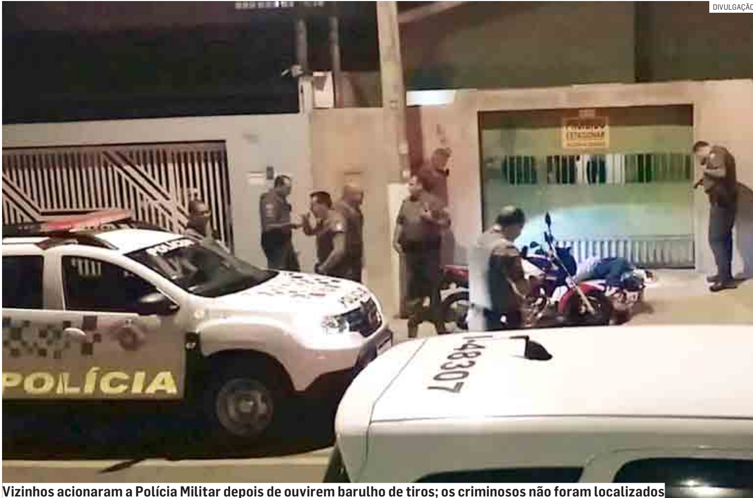
Vizinhos acionaram a Polícia Militar depois de ouvirem barulho de tiros; os criminosos não foram localizados

Segundo testemunhas, um homem fez as vítimas de 23 e 24 anos se ajoelharem antes de efetuar disparos na madrugada de domingo