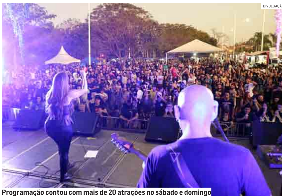
Programação contou com mais de 20 atrações no sábado e domingo

Cerca de 10.000 pessoas, de diferentes gerações e tribos, lotaram o Parque Socioambiental Chico Mendes para conferir a 8ª edição do festival “Planeta Rock”, realizada pela Prefeitura de Hortolândia e a loja Planeta Hippie, no sábado e domingo (09 e 10). O prefeito José Nazareno Zezé Gomes esteve presente no evento. A programação contou com mais de 20 atrações de diferentes vertentes roqueiras. O evento teve também a campanha de arrecadação