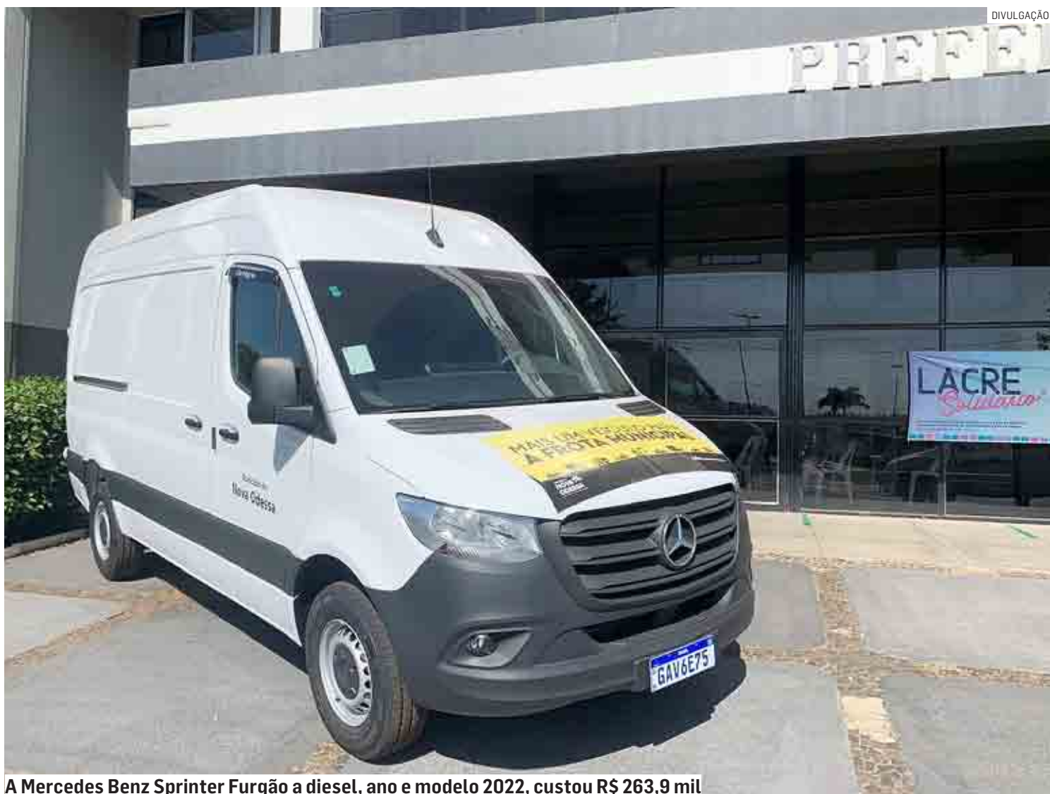
A Mercedes Benz Sprinter Furgão a diesel, ano e modelo 2022, custou R$ 263,9 mil

Segundo ela, o veículo deve beneficiar diretamente 100% das crianças que são atendidas pelo serviço de Alimentação Escolar Municipal. “A van é um elo que reforça a parceria entre o prefeito Leitinho, a Secretaria de Educação e os setores administrados nessa gestão, ressaltando a