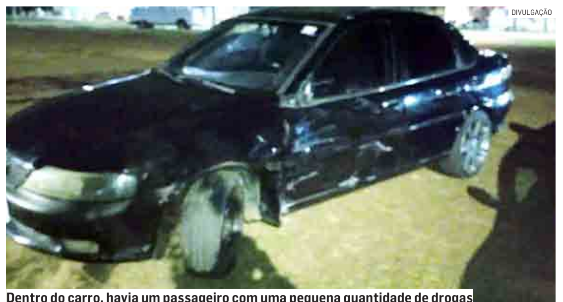
Dentro do carro, havia um passageiro com uma pequena quantidade de drogas

Já o motorista e o passageiro do carro foram conduzidos ao Plantão Policial, onde o caso foi registrado. Eles irão responder por porte de entorpecentes e omissão de socorro.