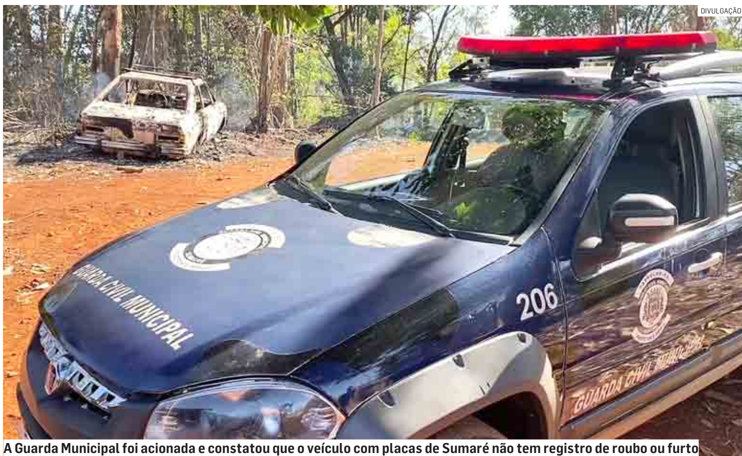
A Guarda Municipal foi acionada e constatou que o veículo com placas de Sumaré não tem registro de roubo ou furto

soa carbonizado. O sexo da vítima não foi possível identificar. O carro era um Corcel II. O local foi isolado e agentes da Polícia Científica realizaram a perícia no veículo e no corpo. O carro, com placas de Sumaré, não possui registro de roubo ou furto. O caso foi registrado no Plantão Policial de Sumaré. O corpo seguiu para o Instituto Médico Legal de Americana, onde passará por exames que possam ajudar na identificação. A Polícia Civil vai dar continuidade nas investigações.