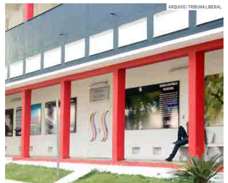
Evento acontece no Anfiteatro Dirce Dalben, em Nova Veneza

Para ter direito ao certificado é necessário a frequência de pelo menos 70% das aulas. Todo