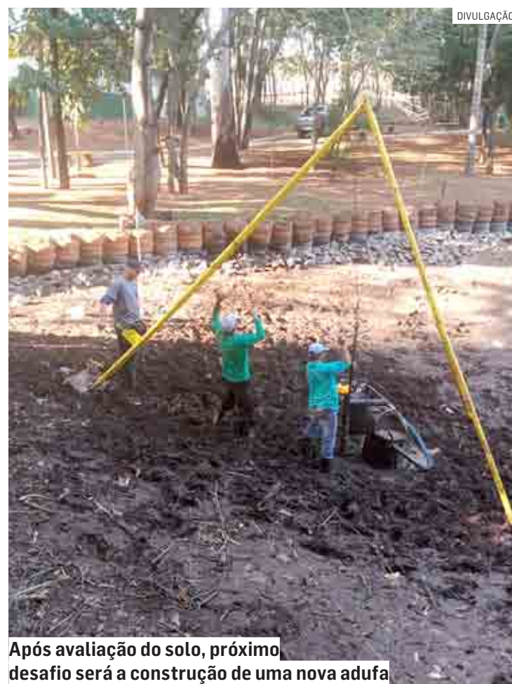
Após avaliação do solo, próximo desafio será a construção de uma nova adufa

Técnicos das secretarias municipais de Obras e de Meio Ambiente e da Coden Ambiental analisaram rapidamente o rompimento e as possíveis causas, e a conclusão foi que o “remendo” realizado quando da mais re-