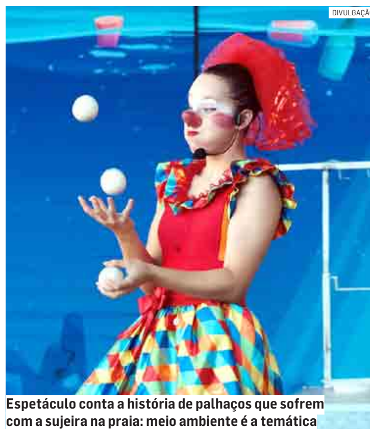
Espectáculo conta a história de palhaços que sofrem com a sujeira na praia: meio ambiente é a temática

Além do lançamento e das apresentações, a Lona das Artes distribuirá duas mil cópias gratuitas do livro para bibliotecas, espaços culturais, orga-