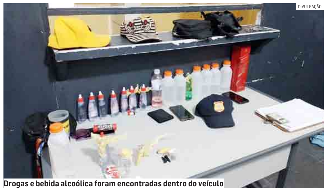
Drogas e bebida alcoólica foram encontradas dentro do veículo

As drogas e todos os envolvidos foram encaminhados para o Plantão Policial de Hortolândia. As pessoas que não estavam portando drogas foram liberadas. Oito jovens vão responder, em liberdade, por uso e porte de entorpecentes.