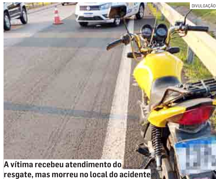
A vítima recebeu atendimento do resgate, mas morreu no local do acidente

As equipes de resgate da Rodovias do Tietê tentaram reanimar a vítima, que não resistiu e morreu no local. A moto foi levada para o pátio e o corpo, removido ao IML de Americana.