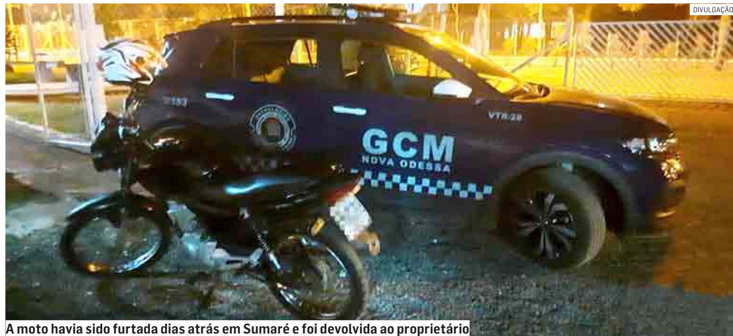
A moto havia sido furtada dias atrás em Sumaré e foi devolvida ao proprietário

Cézar Oliveira | NOVA ODESSA tribunaliberal@tribunaliberal.com.br