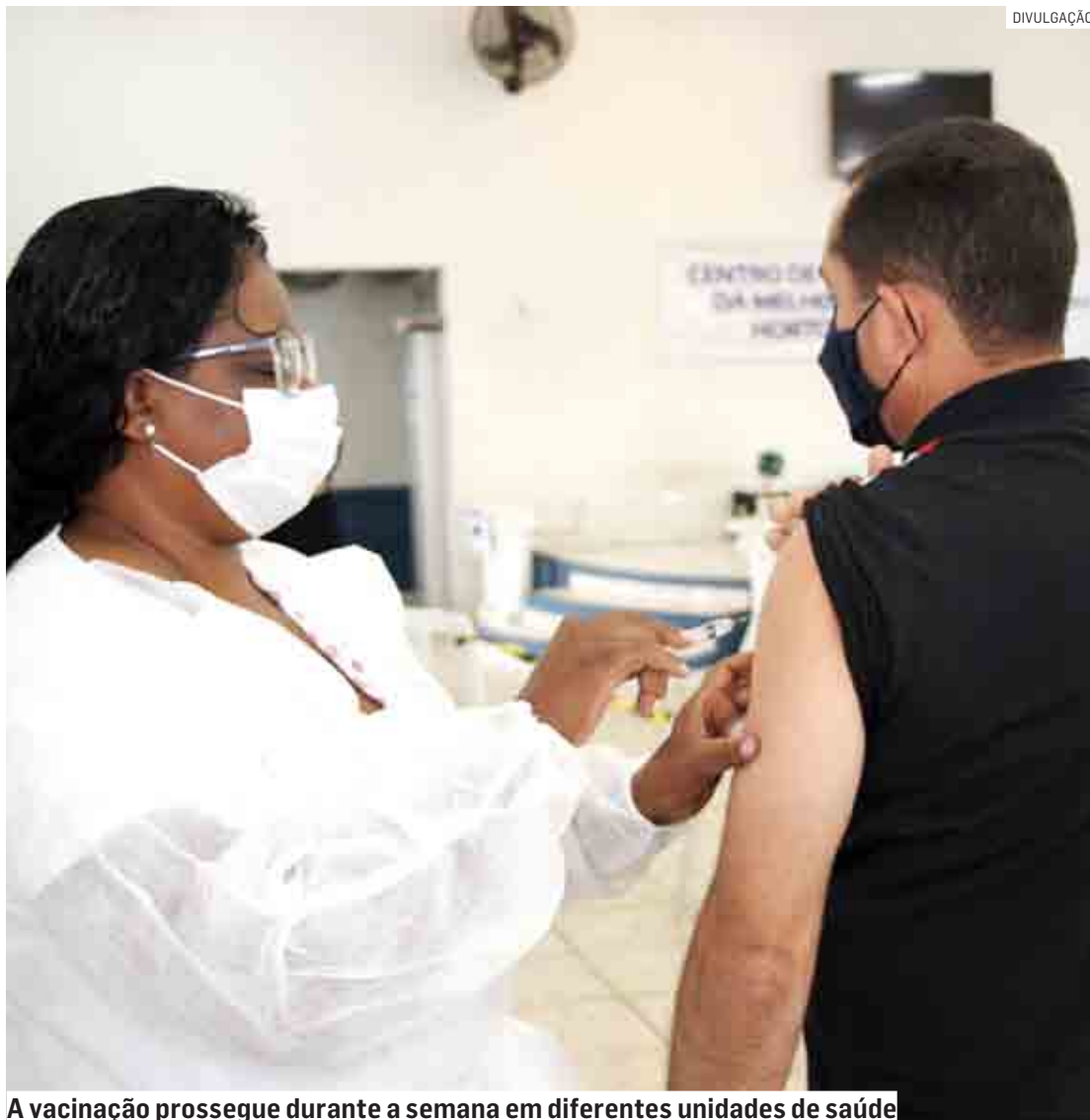
A vacinação prossegue durante a semana em diferentes unidades de saúde

A Secretaria de Saúde salienta que a campanha de vacinação contra a gripe continua durante a semana nas UBSs, enquanto houver disponibilidade de doses no município.