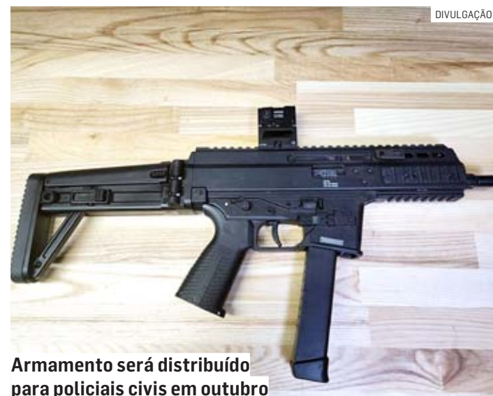
Armamento será distribuído para policiais civis em outubro

Também para outubro está prevista a entrega de 800 espingardas calibre 12 de funcionamento híbrido da empresa Benelli Armi S.P.A. A assinatura foi feita no dia 02 de maio e o investimento foi de R$ 5,2 milhões.