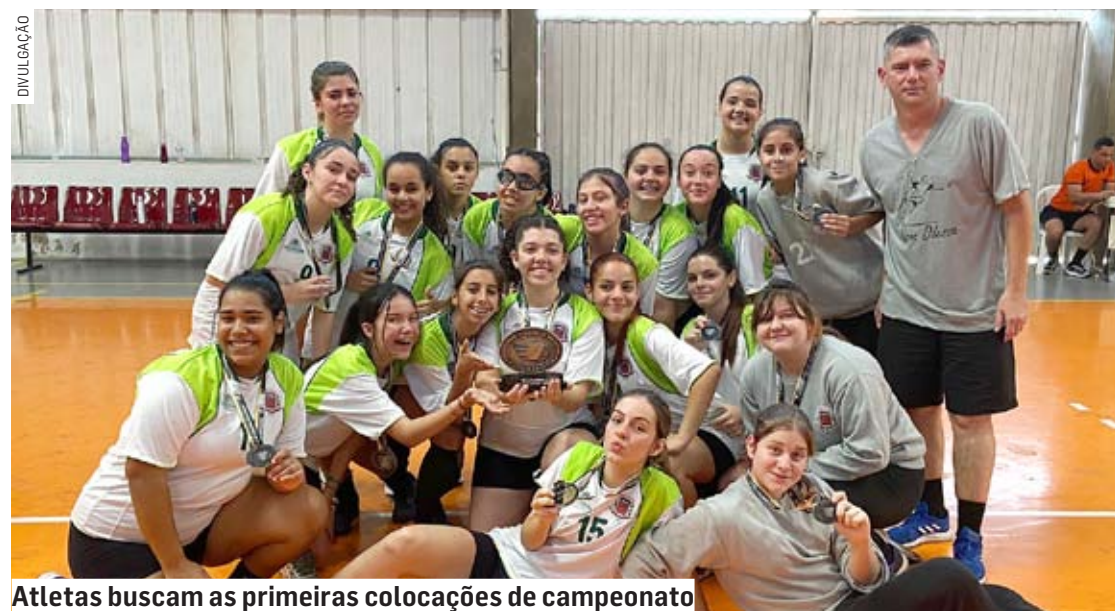
Atletas buscam as primeiras colocações de campeonato

Da Redação • NOVA ODESSA tribunaliberal@tribunaliberal.com.br