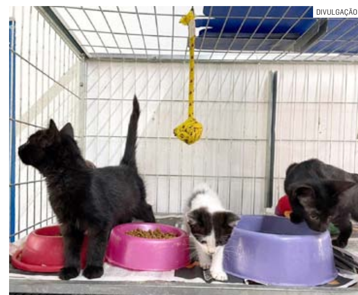
Tutor passará por uma entrevista antes de receber o animal

Para mais informações os interessados devem entrar em contato pelo telefone: (19) 3828-8451.