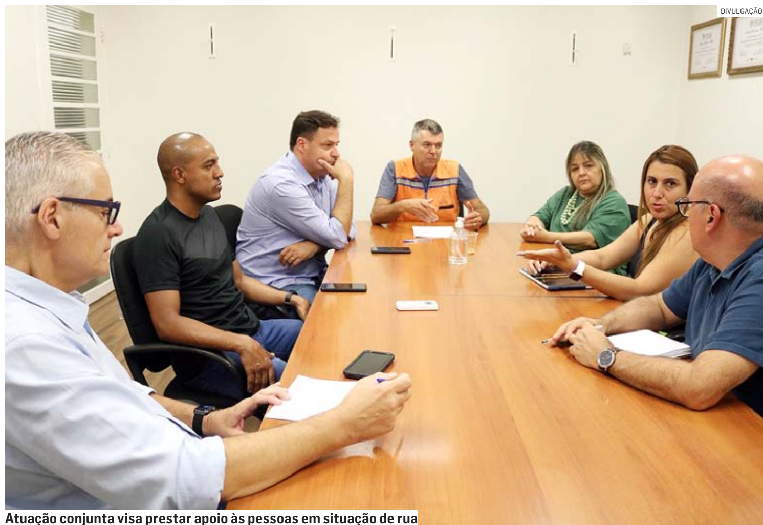
Atuação conjunta visa prestar apoio às pessoas em situação de rua

A chegada das baixas temperaturas aumenta a preocupação em relação às pessoas que se encontram sem abrigo. “A provável chegada de uma frente fria nos próximos dias, baixando as temperaturas, principalmente nas madrugadas,