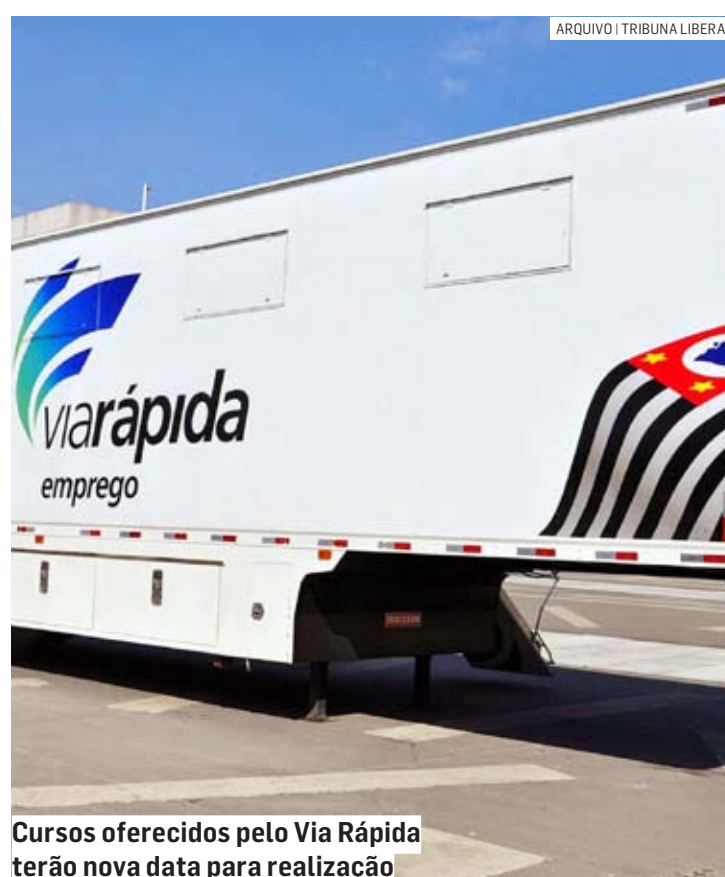
Cursos oferecidos pelo Via Rápida terão nova data para realização

O pagamento da bolsa-auxílio se dará após conclusão do curso, mediante 75% de frequência. Após a disponibilização da bolsa-auxílio, o valor ficará à disposição do estudante pelo prazo de 30 dias.