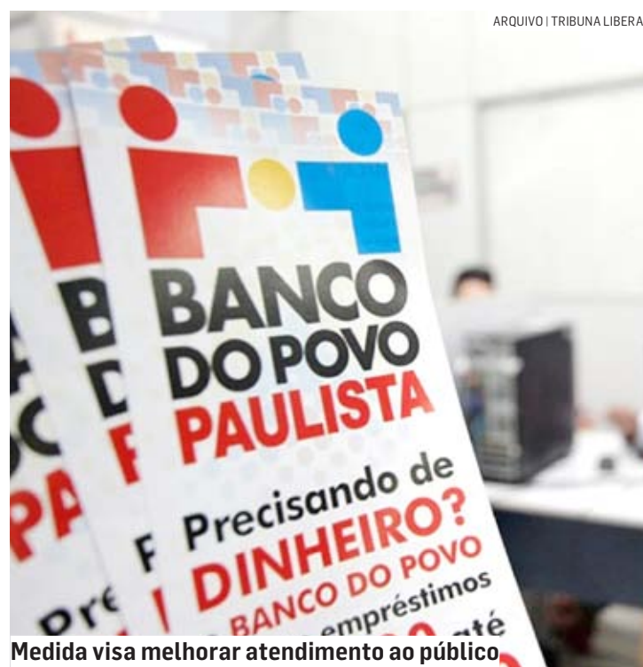
Medida visa melhorar atendimento ao público.

“O objetivo dessa gestão é criar cada vez mais canais que possam funcionar como um elo entre empregadores, trabalhadores, empreendedores e poder público, além de aprimorar os já existentes. Desta forma, a mudança dará a possibilidade de otimizar o trabalho realizado pela Secretaria de Desenvolvimento Eco-