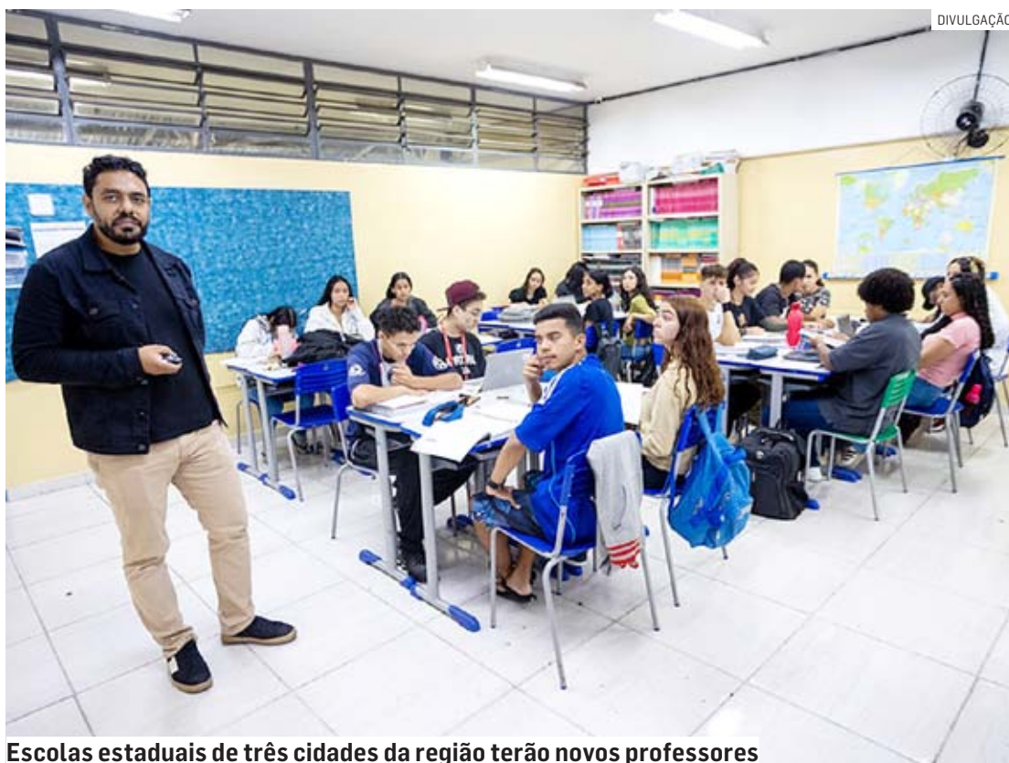
Escolas estaduais de três cidades da região terão novos professores

No ato da inscrição, o candidato deve indicar, por ordem de preferência, sete Diretorias de Ensino para fins de ingresso. Caso após a realização do concurso não haja vagas disponíveis nas Diretorias de Ensino indicadas, o candidato po-