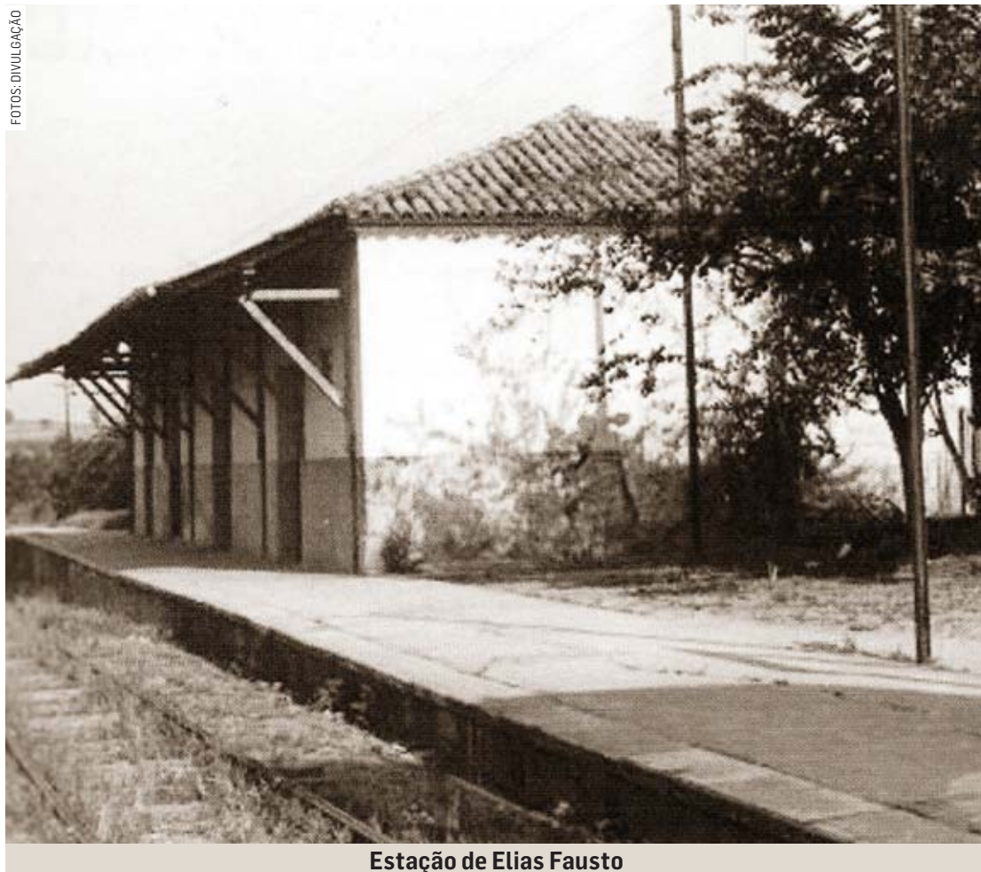
Estação de Elias Fausto

É de se acreditar que muita gente não saiba que Monte Mor já teve uma estação ferroviária. Pois é, o trem já passou pelo município que teve sua estação onde as locomotivas e seus vagões paravam para desembarcar e ou embarcar passageiros e cargas.