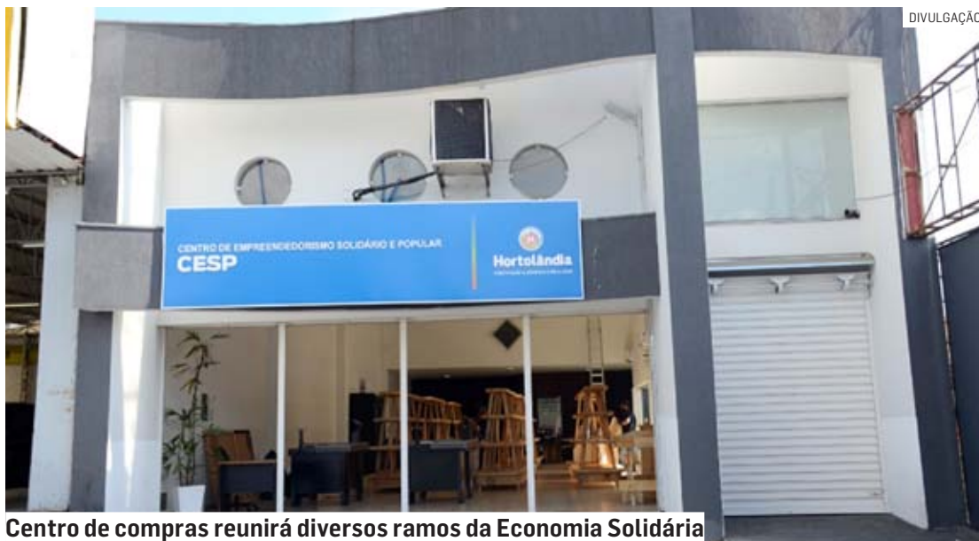
Centro de compras reunirá diversos ramos da Economia Solidária

Além disso, a pintura interna e a comunicação visual interna do espaço estão em andamento, com a finalidade de criar uma atmosfera acolhedora para os consumidores. Os grupos de empreendedores solidários estão se reunindo por segmento de produtos para acertar as exposições e formalizar a participação no Empório Jacuba, garantindo assim que o espaço apre-