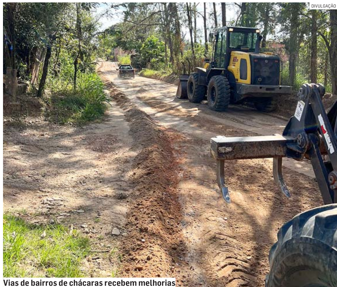
Vias de bairros de chácaras recebem melhorias

“Realizamos esse trabalho (de manutenção das vias rurais) desde 2021 periodicamente, em todas as regiões de chácaras da cidade, geralmente uma vez ao mês. Ele é importante para garantir as condições de tráfego e a segurança de quem passa por estes locais, garantindo o pleno direito de ir e vir dos moradores e produtores rurais”, completou o gestor.