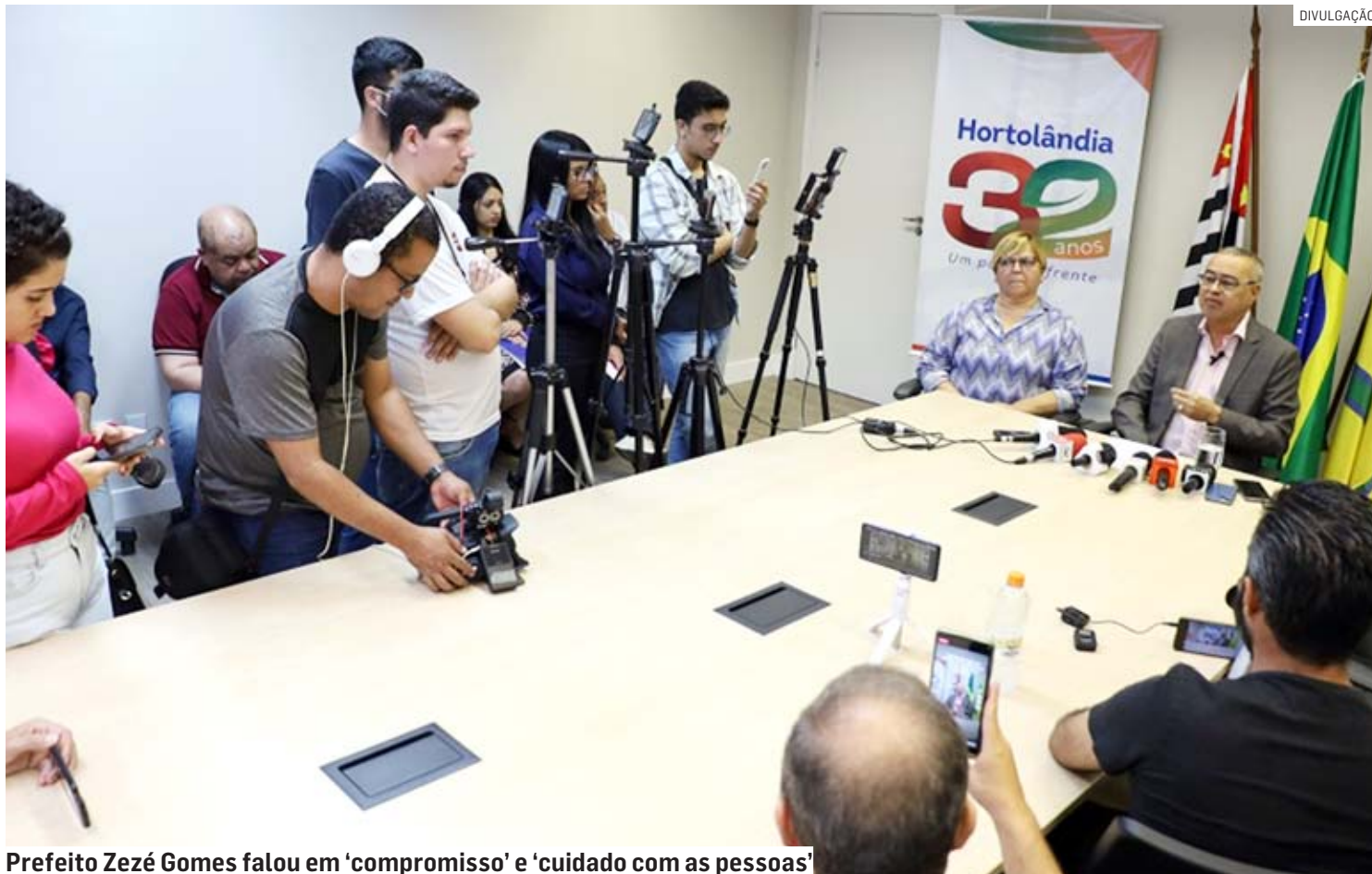
Prefeito Zezé Gomes falou em 'compromisso' e 'cuidado com as pessoas'

O chefe do Executivo ressaltou o perfil humanitário da gestão na construção de políticas públicas. “O maior legado que um gestor pode deixar nessa cidade é cuidar bem das pessoas e isso nós não vamos deixar de fazer. Do que adiantaria realizar grandes obras e não cuidar das pessoas? Por isso, priorizamos a qualidade no ensino, na saúde, na construção de parques para atender desde a criança, a juventude