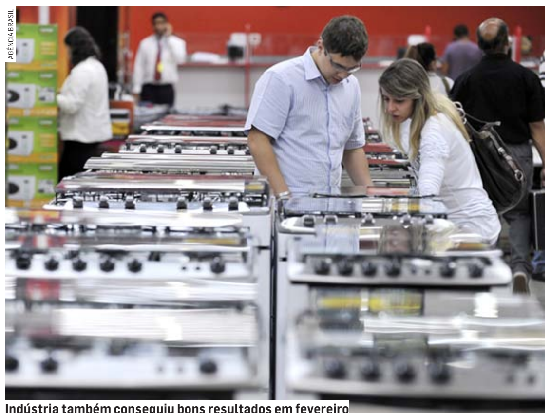
Indústria também conseguiu bons resultados em fevereiro

Em âmbito geral, o PIB reflete a soma de todos os bens e serviços produzidos. O Seade desenvolveu diferentes metodologias de cálculo do PIB em São Paulo, que permitem a análise das principais tendências da economia paulista.