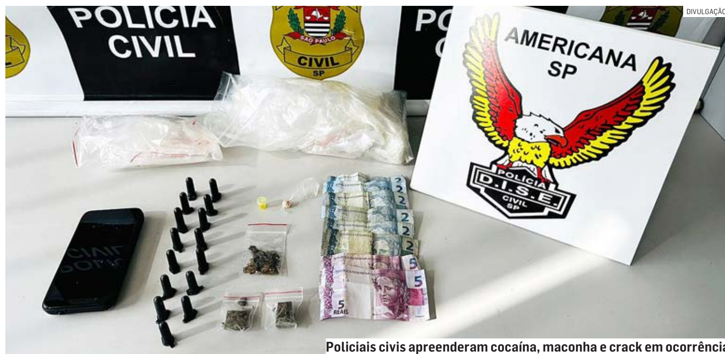
Policiais civis apreenderam cocaína, maconha e crack em ocorrência

César Oliveira • SUMARÉ tribunaliberal@tribunaliberal.com.br