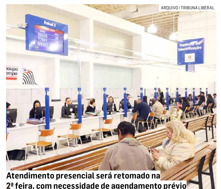
Atendimento presencial será retomado na 2ª feira, com necessidade de agendamento prévio

O Poupatempo reforça a importância de utilizar essas opções digitais, que têm facilitado o acesso da população a serviços públicos de forma prática e ágil, especialmente durante os períodos de feriados prolongados.