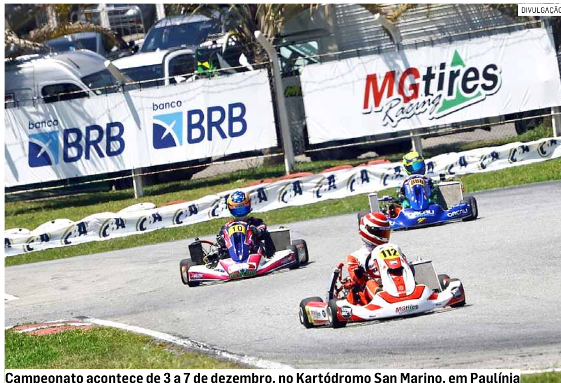
Campeonato acontece de 3 a 7 de dezembro, no Kartódromo San Marino, em Paulínia

A partir do dia 5 de novembro, as inscrições serão encerradas, podendo ser reabertas, a critério da CBA, com reajustes de va-