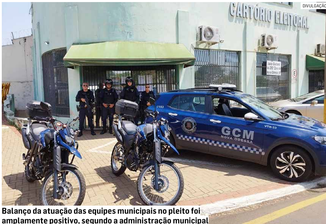
Balanço da atuação das equipes municipais no pleito foi amplamente positivo, segundo a administração municipal

No domingo, duas viaturas foram destacadas para patrulhamento nas zonas eleitorais, priorizando aquelas com maior número de seções. Cada uma das 11 escolas municipais utilizada como local de votação também teve um GCM