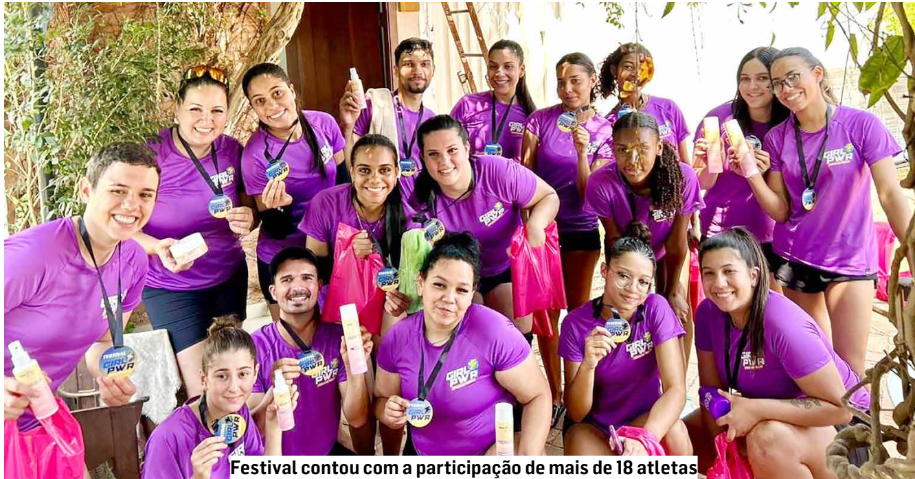
Festival contou com a participação de mais de 18 atletas

Em contrapartida, todas as participantes receberam camiseta, garrafinha e medalhas de participação personalizadas, além de um kit com produtos cosméticos Meliss For You. Um buffet com frutas, petiscos, suco e água ficou à disposição para consumo durante todo o evento.