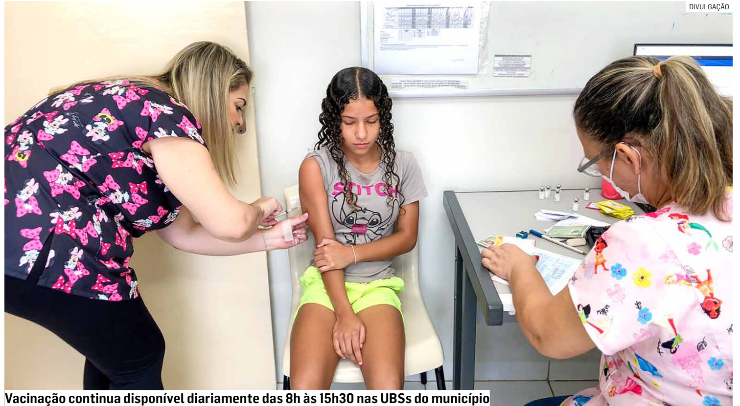
Vacinação continua disponível diariamente das 8h às 15h30 nas UBSS do município

Hortolândia iniciou a vacinação contra a dengue em