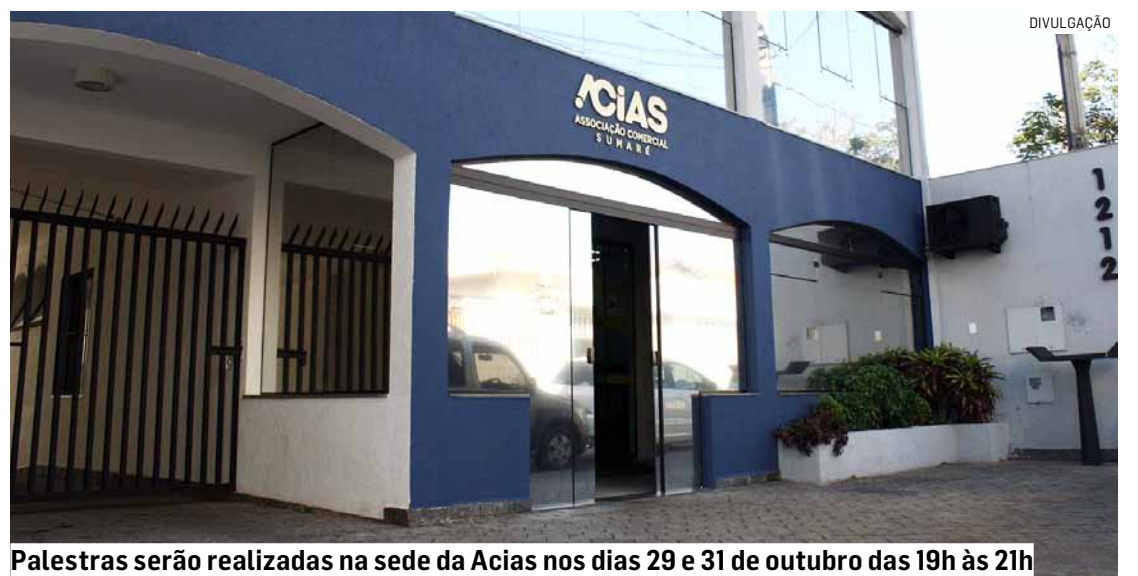
Palestras serão realizadas na sede da Acias nos dias 29 e 31 de outubro das 19h às 21h

Os interessados na palestra 'Natal de Sucesso: Estratégias para Aumentar suas Vendas e Fidelizar Clientes' devem fazer a inscrição pelo link https://shre.ink/gvFb . Não é necessário ser associado da Acias para participar.