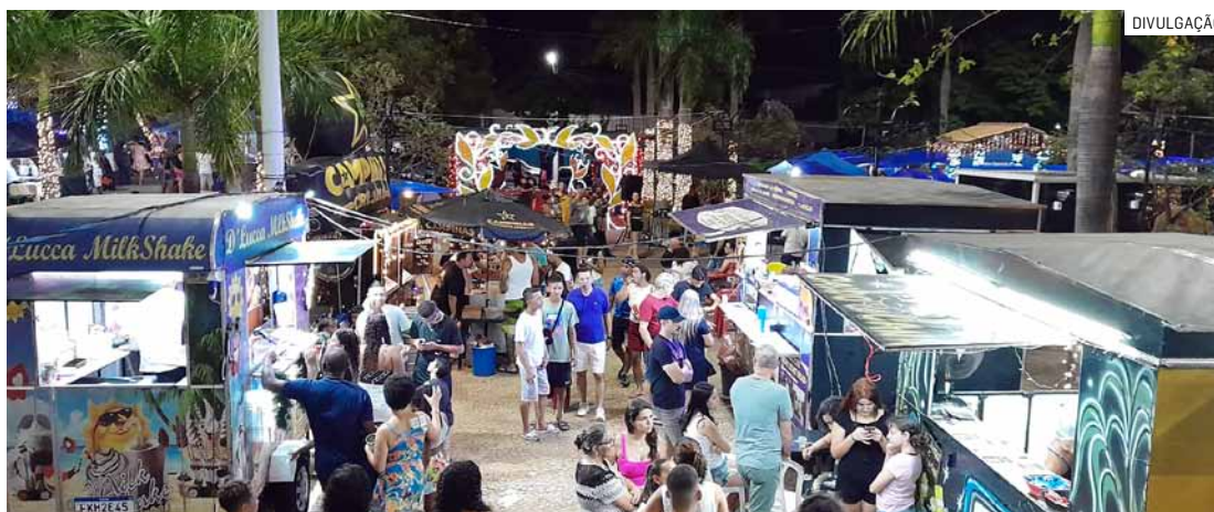
Até esta quinta-feira, 22 empreendedores já haviam efetuado cadastro junto à prefeitura

O Programa de Economia Solidária é “estinado à capacitação e comerciali-