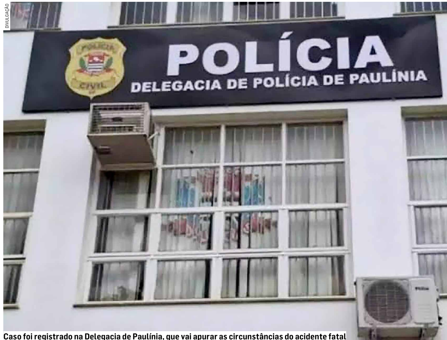
Caso foi registrado na Delegacia de Paulínia, que vai apurar as circunstâncias do acidente fatal

Suspeita é que o jovem tenha morrido ao tentar resgatar seu cachorro, que teria caído em uma vala de restilo de cana; animal não foi encontrado