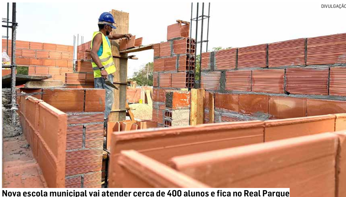
Nova escola municipal vai atender cerca de 400 alunos e fica no Real Parque