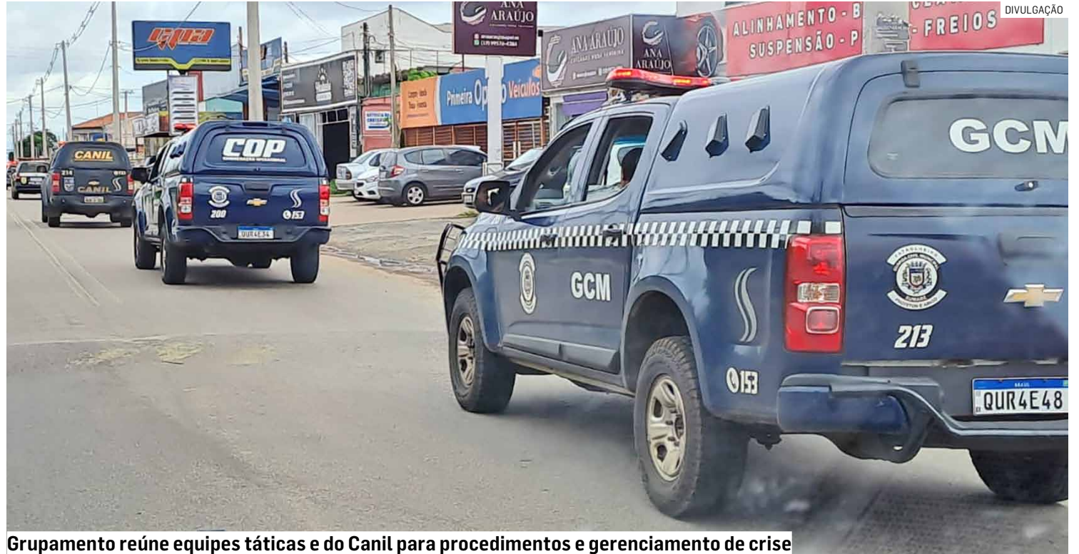
Grupamento reúne equipes táticas e do Canil para procedimentos e gerenciamento de crise

Os GMs Agentes de Fiscalização Ambiental foram regulamentados no Município e trabalham em con-