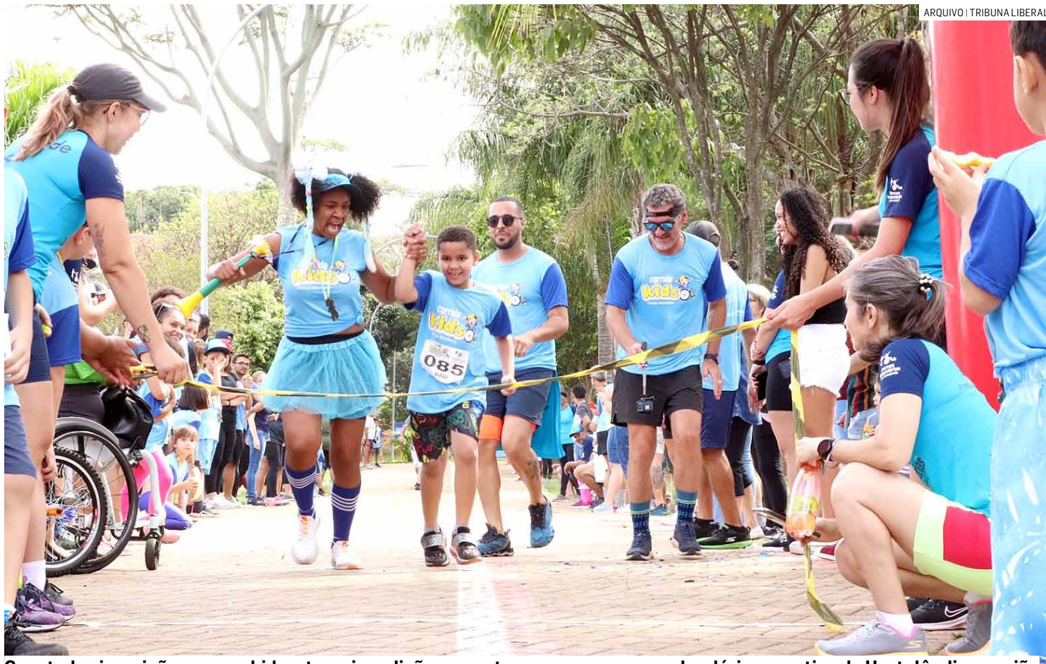
Com todas inscrições preenchidas, terceira edição promete ser um marco no calendário esportivo de Hortolândia e região