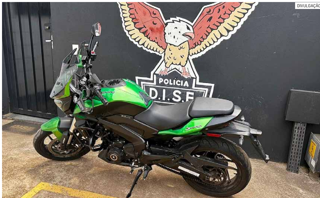
Motocicleta que estava na casa do adolescente foi furtada há cerca de um mês em Sumaré

Um adolescente de 16 anos, que estava na resi-