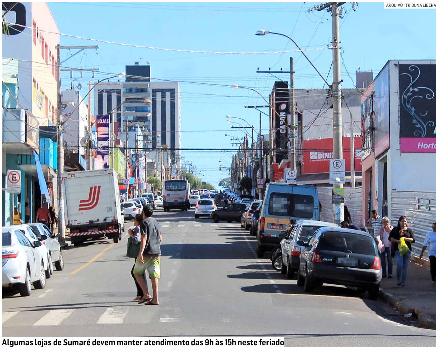
Algumas lojas de Sumaré devem manter atendimento das 9h às 15h neste feriado

Data é uma das mais aguardadas pelo comércio e com o apoio das associações comerciais e as facilidades aos consumidores, a estimativa é de um aumento de até 5% nas vendas; lojas da região estarão abertas das 9h às 15h, para atender à demanda