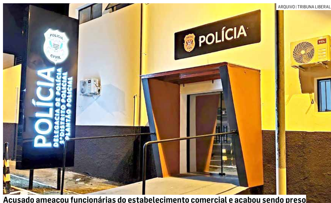
Acusado ameaçou funcionárias do estabelecimento comercial e acabou sendo preso

conduzido ao Plantão Policial, onde a vítima o reconheceu e informou que ele entrou no estabelecimento anunciando o roubo e insinuou estar armado, ameaçando as funcionárias e exigindo os pertences. Quando uma funcionária conseguiu ligar para o 190, o criminoso percebeu e deixou o local sem levar nada. O acusado permaneceu preso.