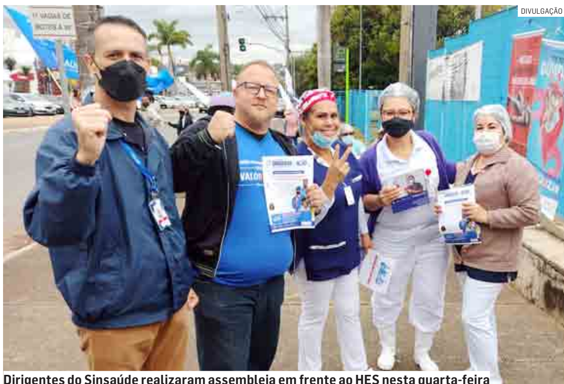
Dirigentes do Sinsauúde realizaram assembleia em frente ao HES nesta quarta-feira

SUMARÉ (CENTRO | NOVA VENEZA | PICERNO | MARIA ANTONIA | ÁREA CURA | MATÃO) • HORTOLÂNDIA • NOVA ODESSA • MONTE MOR • ELIAS FAUSTO • PAULÍNIA