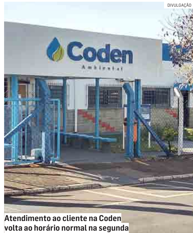
Atendimento ao cliente na Coden volta ao horário normal na segunda

Informações adicionais podem ser obtidas a qualquer momento junto ao SAC (Serviço de Atendimento ao Consumidor), por meio de ligação gratuita para 0800 771-1195.