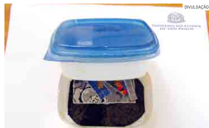
Droga estava escondida em fundo falso de pote de margarina

De acordo com a SAP, pessoas flagradas tentando inserir materiais proibidos dentro das unidades prisionais são suspensas do rol de visitas temporariamente.