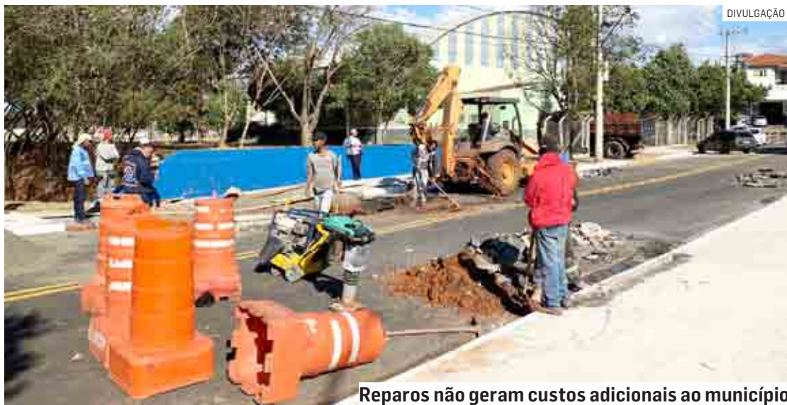
Reparos não geram custos adicionais ao município

Da Redação | NOVA ODESSA tribunaliberal@tribunaliberal.com.br