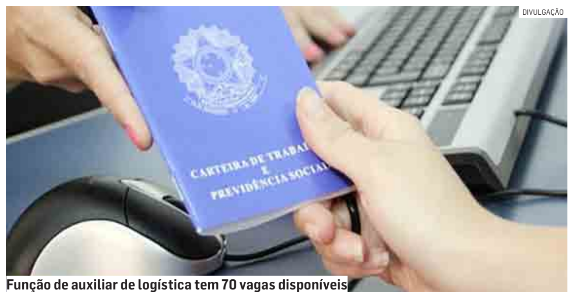
Função de auxiliar de logística tem 70 vagas disponíveis

se dirigir ao PAT, localizado na Rua Ipiranga, nº 316, região Central (de segunda a sexta-feira, das 8h às 17h). O Posto de Atendimento ao Trabalhador de Sumaré disponibiliza o telefone (19) 3803 – 3003 para dúvidas e mais informações.