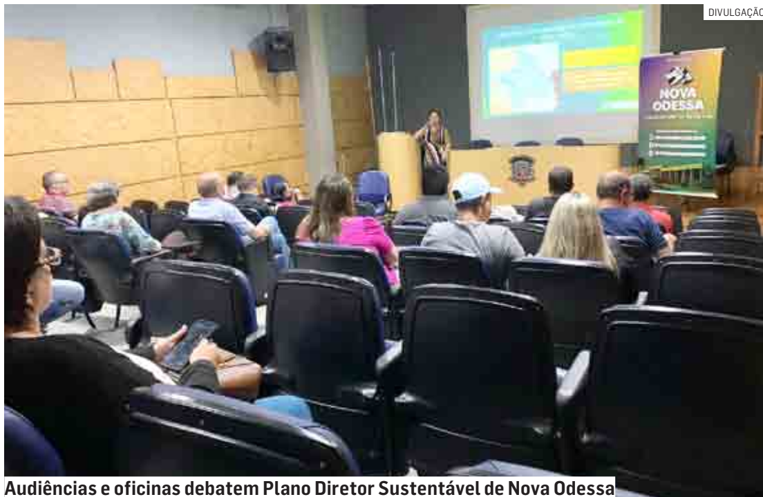
Audiências e oficinas debatem Plano Diretor Sustentável de Nova Odessa

partir das 18h15, tem como tema “Saneamento Básico”, com representantes da Secretaria de Meio Ambiente, da Coden Ambiental, dos Conselhos Municipais relacionados ao tema e demais interessados (como detalhado acima), bem como “de todos os representantes que a consultoria e a Secretaria de Obras acharem pertinentes”.