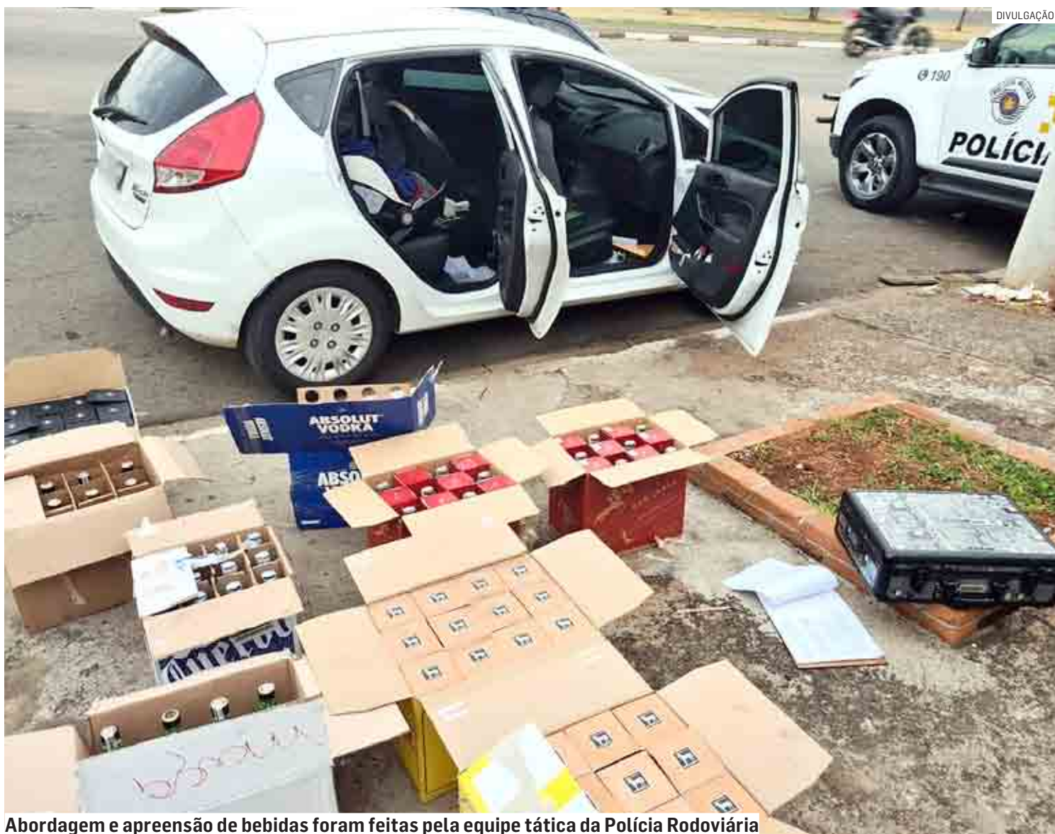
Abordagem e apreensão de bebidas foram feitas pela equipe tática da Polícia Rodoviária

A ocorrência foi apresentada no Plantão Policial de Sumaré, onde 900 caixas de bebidas falsificadas foram apreendidas e os suspeitos presos em flagrante por crime de posse e comércio de bebidas alcoólicas falsificadas, permanecendo à disposição da Justiça.