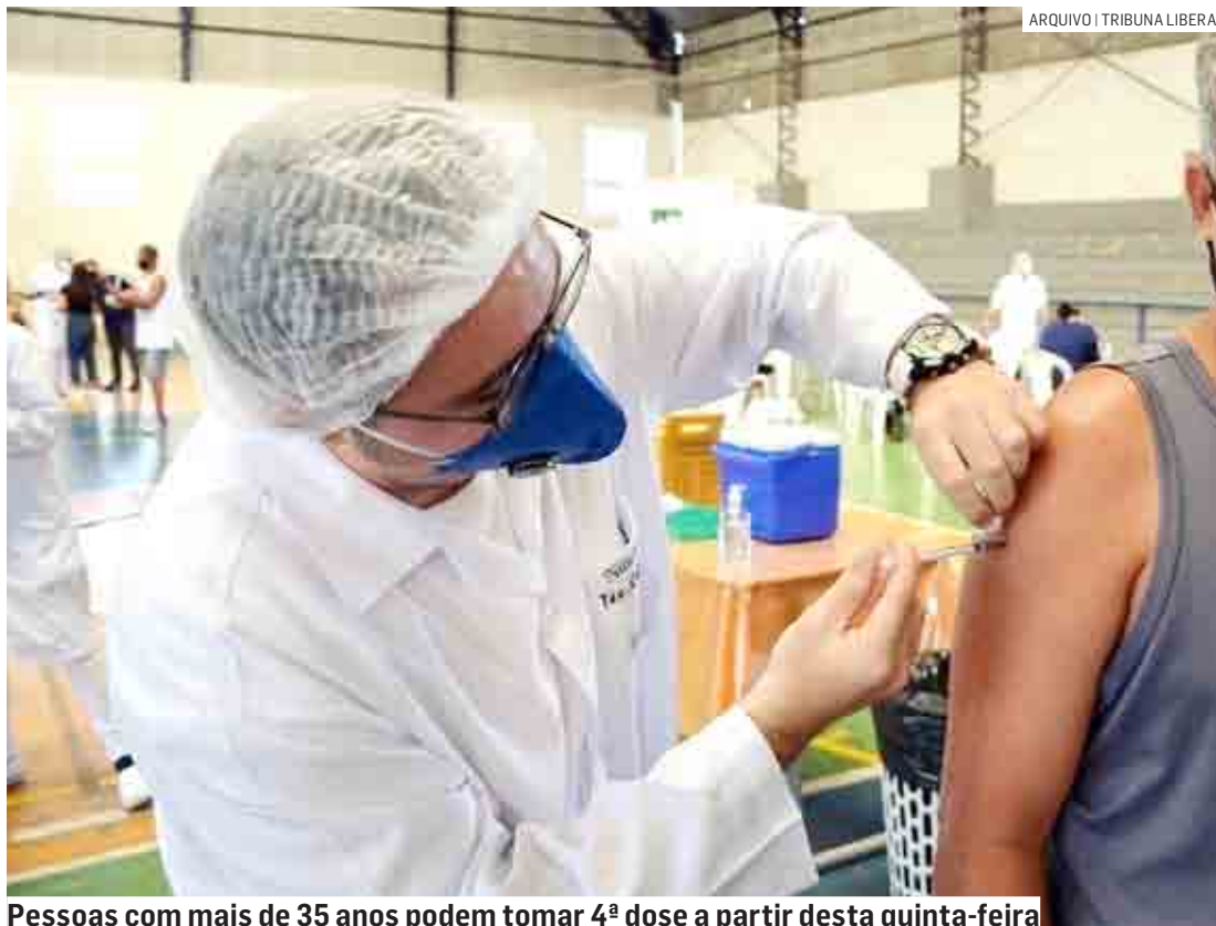
Pessoas com mais de 35 anos podem tomar 4ª dose a partir desta quinta-feira

A Vigilância Epidemiológica segue recomendando o uso de máscaras