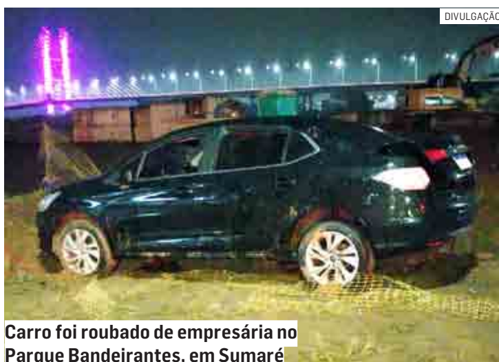
Carro foi roubado de empresária no Parque Bandeirantes, em Sumaré

A dona do veículo, uma empresária de 31 anos, contou os momentos de terror que sofreu jun-