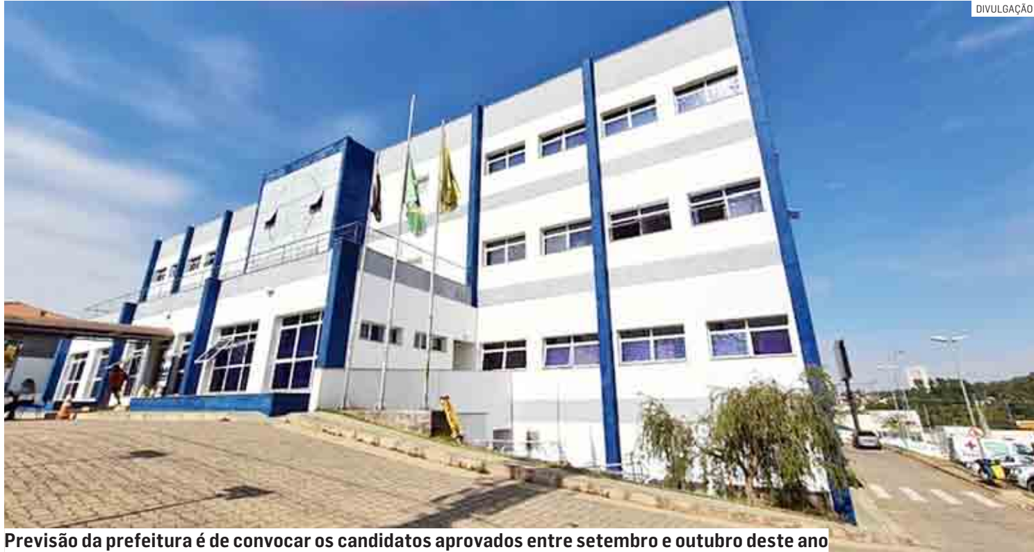
Previsão da prefeitura é de convocar os candidatos aprovados entre setembro e outubro deste ano

Segundo a Secretaria de Administração e Gestão de Pessoal, em breve, será divulgada a lista de aprovados na etapa do dia 31 de julho. A banca examinadora ainda corrige as provas dos candidatos com alguma necessidade