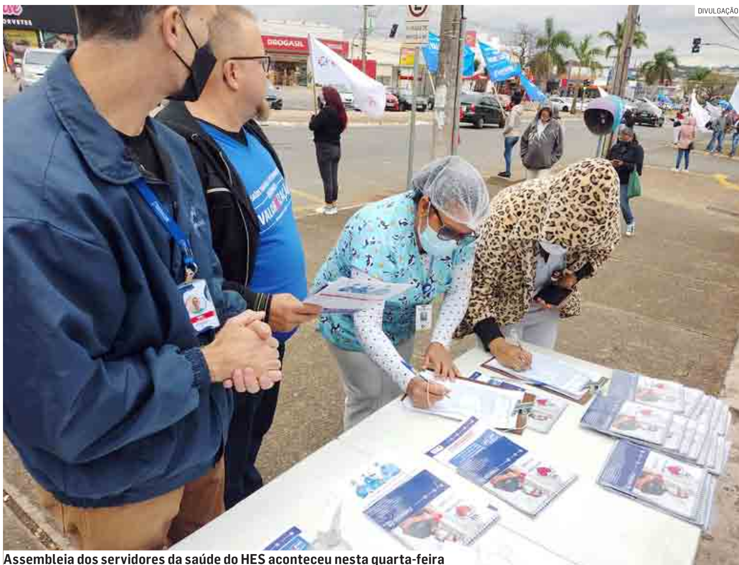
Assembleia dos servidores da saúde do HES aconteceu nesta quarta-feira