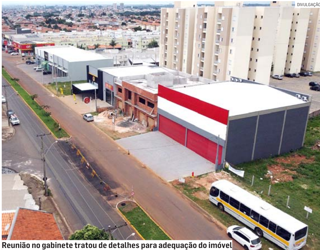
Reunião no gabinete tratou de detalhes para adequação do imóvel

"Não estamos medindo esforços para acertar, junto ao proprietário, to-