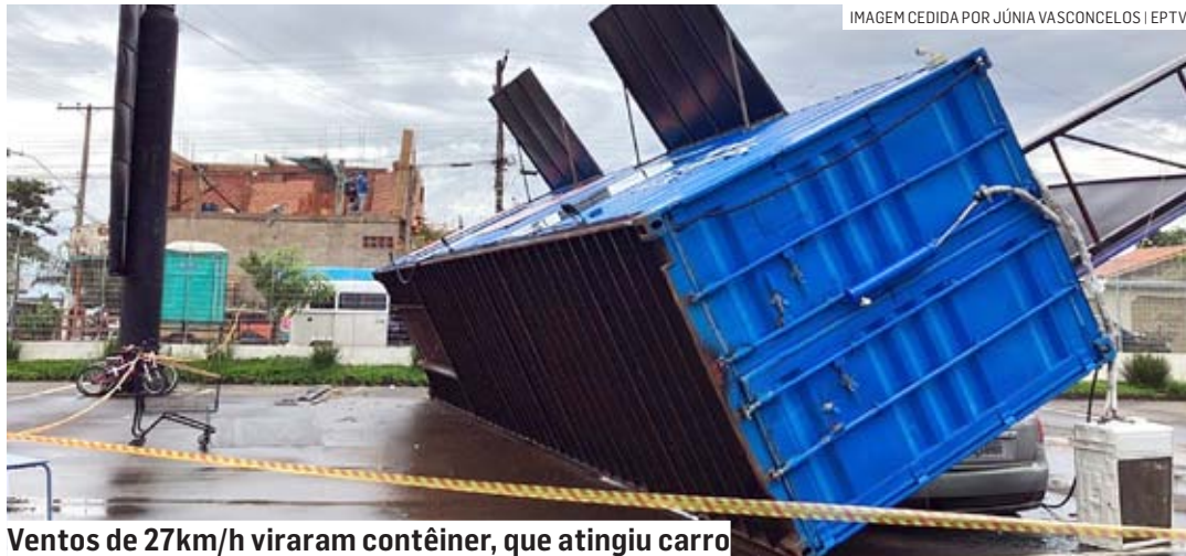
Ventos de 27km/h viraram contêiner, que atingiu carro

Com ferimentos leves, as vítimas que estavam no contêiner receberam atendimento do Samu (Serviço de Atendimento Móvel de Urgência). A ocorrência também foi