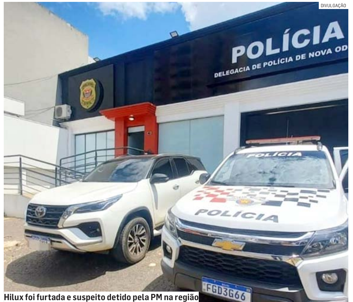
Hilux foi furtada e suspeito detido pela PM na região

Ao vistoriar o veículo, os policiais acharam um aparelho celular e constataram que a caminhonete estava com placas falsas, sobrepostas às placas originais e havia outro módulo eletrônico conectado à ignição e a parte inferior do painel estava danificada.