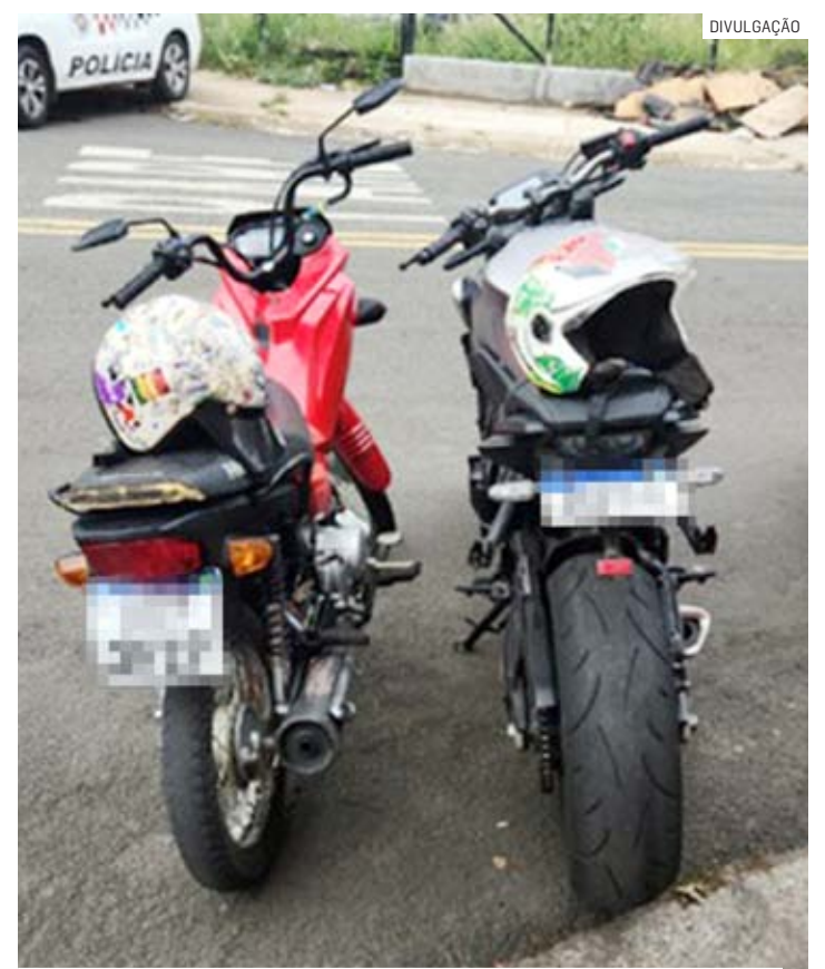
Motocicletas são produtos do crime e foram apreendidas

De imediato, os suspeitos foram abordados. Em consulta aos emplacements das motocicletas, uma Honda CB650 estava com fitas. A polícia constatou que a motocicleta era produto de roubo no dia 03 de março. A outra motocicleta, uma Pop 100, é do esta-