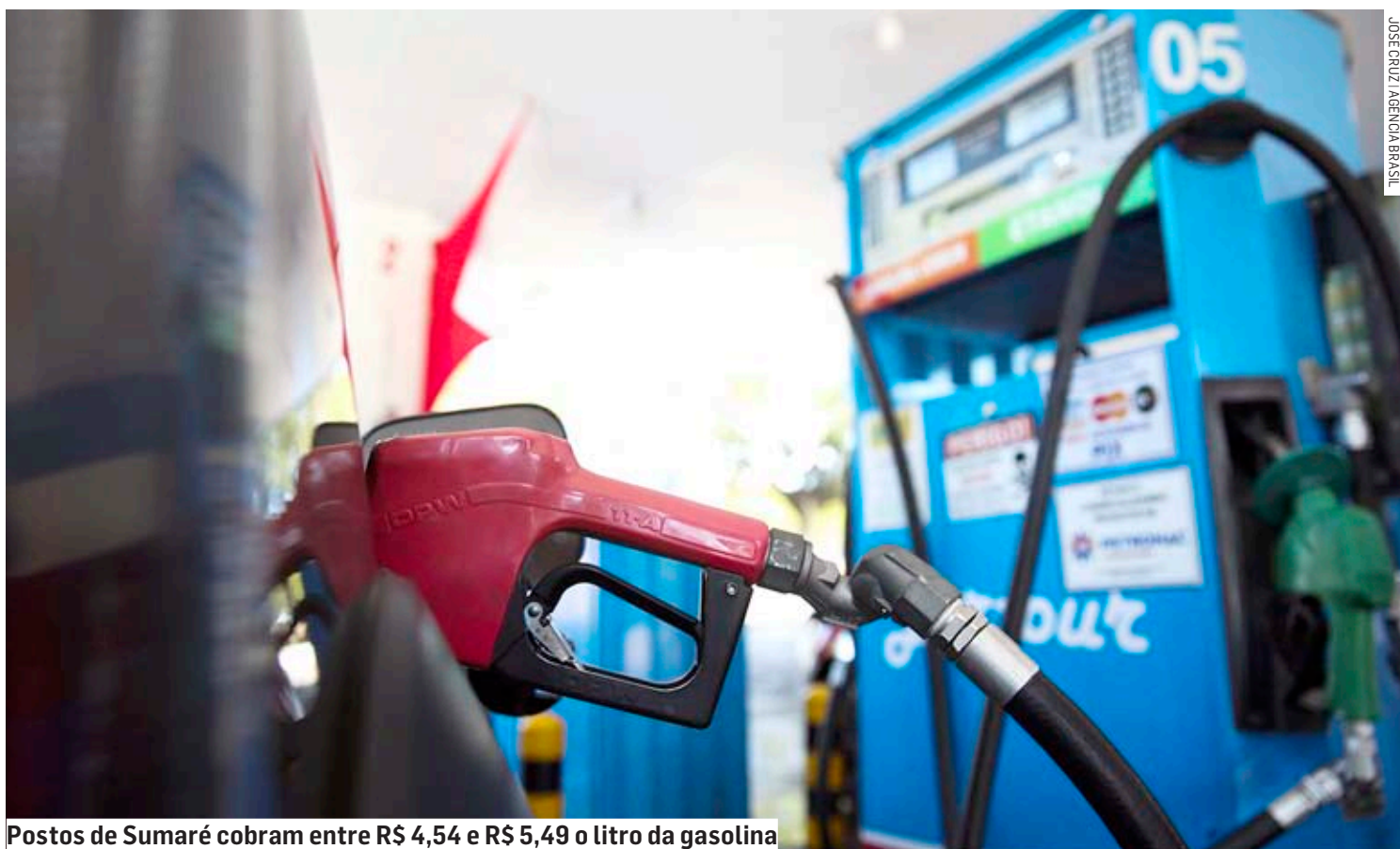
Postos de Sumaré cobram entre R$ 4,54 e R$ 5,49 o litro da gasolina

“Não é só o imposto, a reoneração que faz o preço do combustível variar, tem o etanol, tem o anidrido. O mercado é muito dinâmico, da reoneração pra cá, já teve muito reajuste e variação de anidrido. A gente acredita é na competição, no mercado sadio, quando a gente vê variações muito grandes