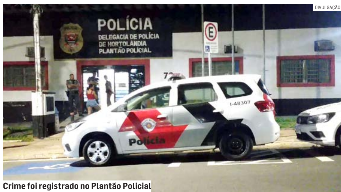
Crime foi registrado no Plantão Policial

Cézar Oliveira | HORTOLÂNDIA tribunaliberal@tribunaliberal.com.br