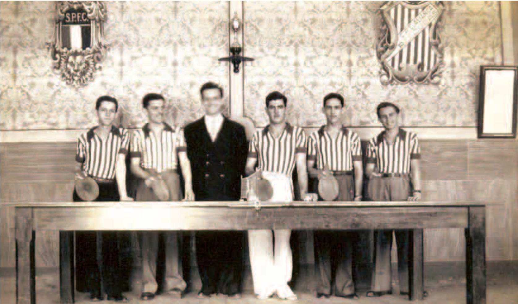
Clube R.E. Aliança - time de pingue-pongue