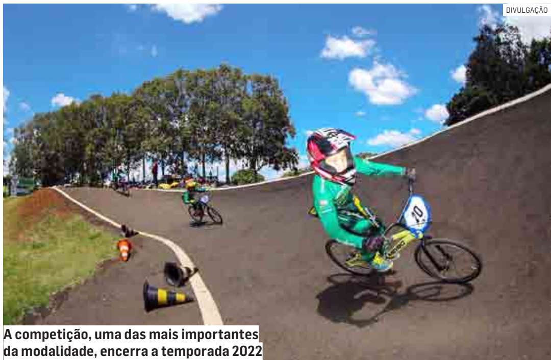
A competição, uma das mais importantes da modalidade, encerra a temporada 2022

Da Redação | PAULÍNIA tribunaliberal@tribunaliberal.com.br