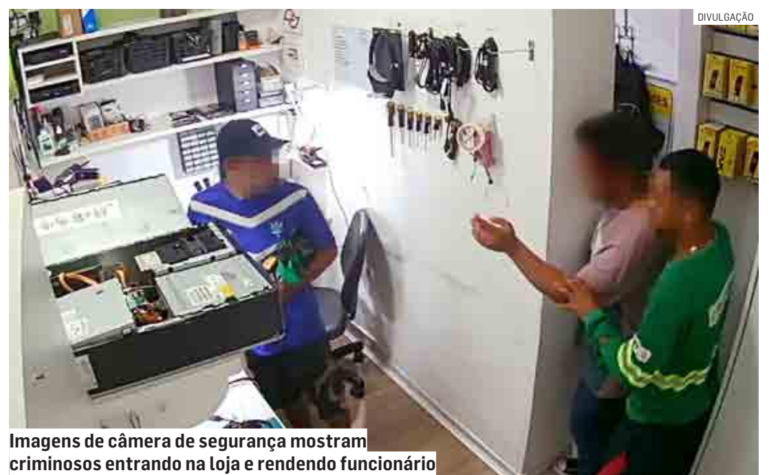
Imagens de câmera de segurança mostram criminosos entrando na loja e rendendo funcionário

A ocorrência foi registrada na delegacia do Parque dos Pinheiros, onde as imagens poderão ajudar a Polícia Civil a identificar a dupla.