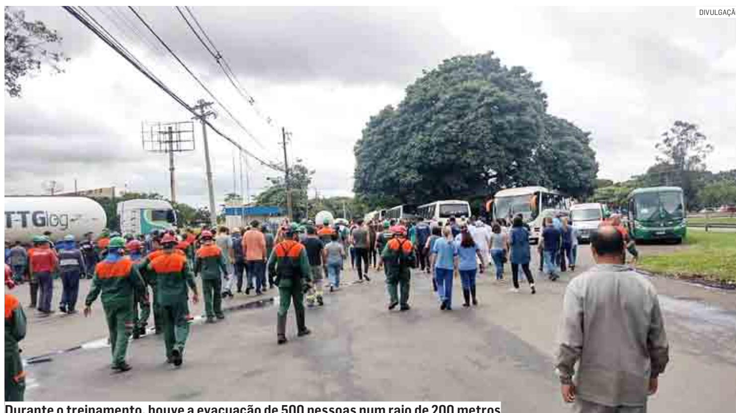
Durante o treinamento, houve a evacuação de 500 pessoas num raio de 200 metros

Da Redação | PAULÍNIA tribunaliberal@tribunaliberal.com.br