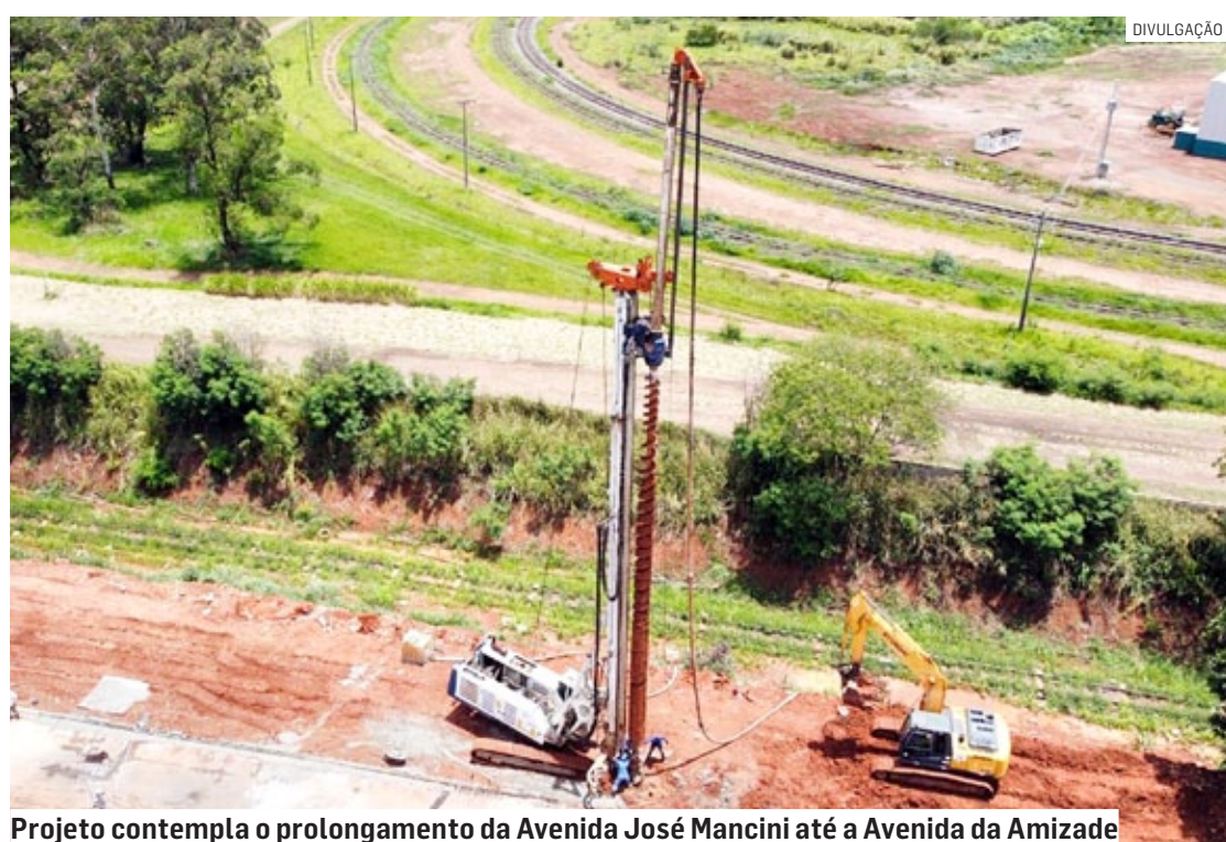
Projeto contempla o prolongamento da Avenida José Mancini até a Avenida da Amizade

Investimento será de aproximadamente R$ 4,3 milhões e estimativa de conclusão da obra é de quatro meses