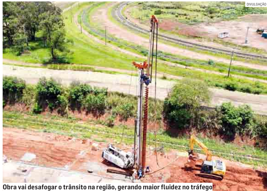
Obra vai desafogar o trânsito na região, gerando maior fluidez no tráfego

Obra inclui prolongamento da Avenida José Mancini, na região central, à Avenida da Amizade, em Nova Veneza; valor do investimento é de R$ 4,3 milhões e previsão de conclusão dos trabalhos é de quatro meses