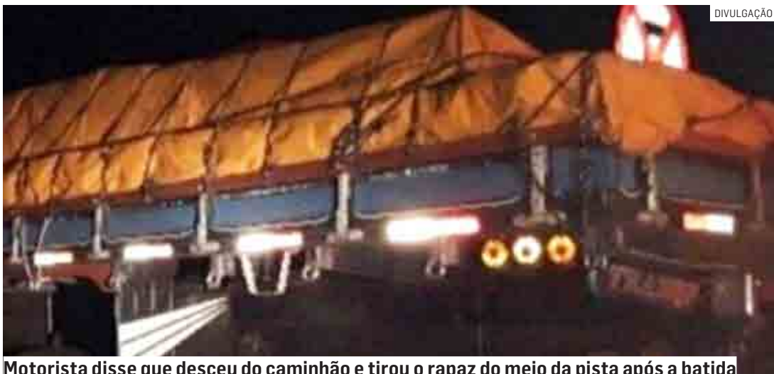
Motorista disse que desceu do caminhão e tirou o rapaz do meio da pista após a batida

Cézar Oliveira | SUMARÉ tribunaliberal@tribunaliberal.com.br