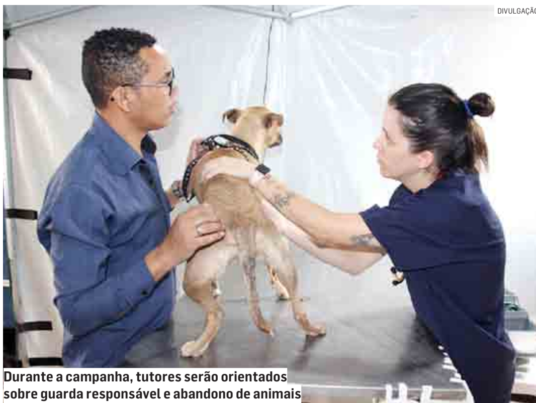
Durante a campanha, tutores serão orientados sobre guarda responsável e abandono de animais

Ainda durante a campanha, o Núcleo de Educação Ambiental, órgão da Secretaria de Meio Ambiente e Desenvolvimento Sustentável, fará ação de orientação com os tutores sobre os temas guarda responsável