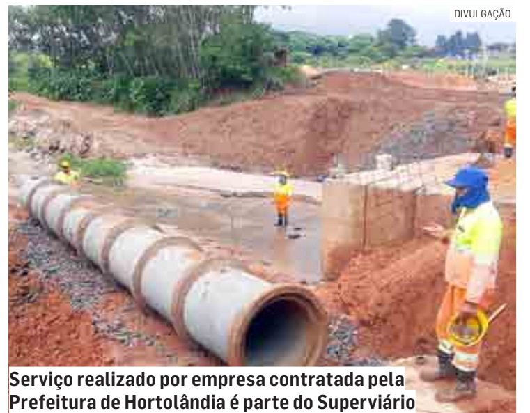
Serviço realizado por empresa contratada pela Prefeitura de Hortolândia é parte do Superviário

Próximo ao local, acontece mais um trecho de prolongamento e dupli-