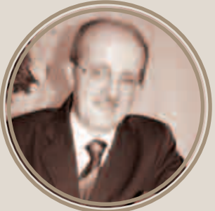
Francisco Antonio de Toledo