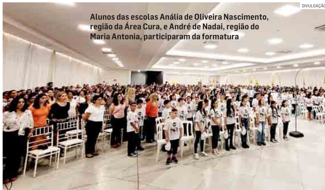
Alunos das escolas Anália de Oliveira Nascimento, região da Área Cura, e André de Nadei, região do Maria Antonia, participaram da formatura