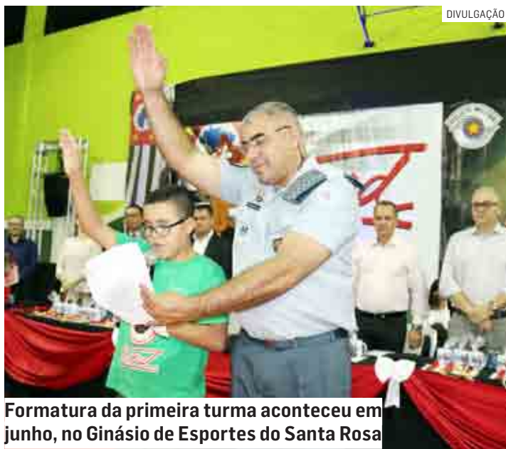
Formatura da primeira turma aconteceu em junho, no Ginásio de Esportes do Santa Rosa

O Proerd é desenvolvido e aplicado pela Polícia Militar em parceria com a Secretaria Municipal de Educação de Nova Odessa e escolas particulares e visa oferecer atividades