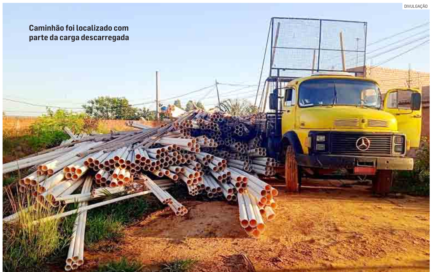
Caminhão foi localizado com parte da carga descarregada

O caso foi registrado na CPJ (Central de Polícia Judiciária) de Americana, onde a Polícia Civil vai investigar o caso.