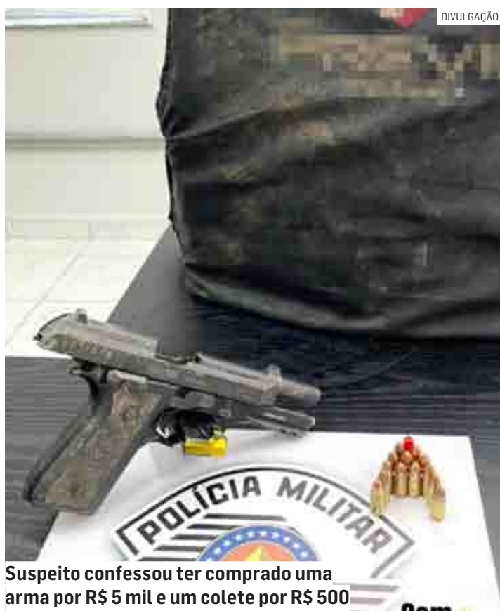
Suspeito confessou ter comprado uma arma por R$ 5 mil e um colete por R$ 500

O suspeito estava com um colete à prova de balas e uma pistola. Ele confessou ter comprado a arma por R$ 5 mil e o colete por R$ 500. Declarou, ainda, que ele e mais três