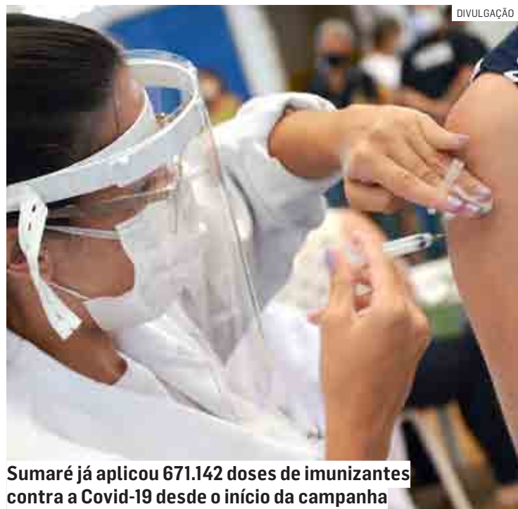
Sumaré já aplicou 671.142 doses de imunizantes contra a Covid-19 desde o início da campanha