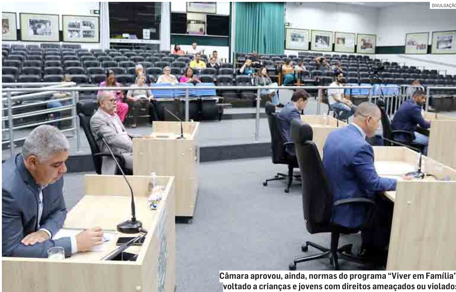
Câmara aprovou, ainda, normas do programa "Viver em Família", voltado a crianças e jovens com direitos ameaçados ou violados

Na justificativa do texto, a prefeitura diz