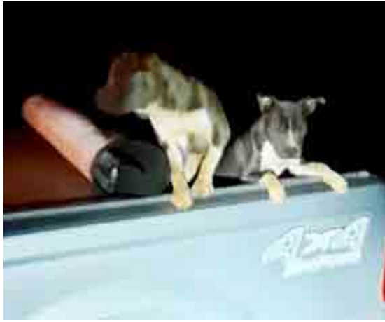
Casos envolvem morte a pauladas, agressão em condomínio e abandono de animais