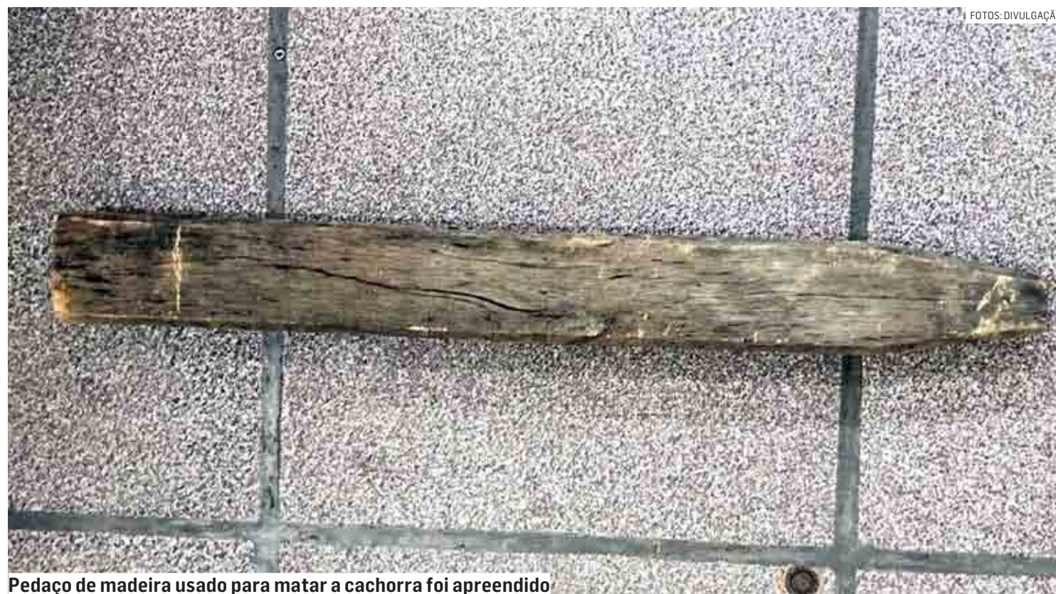
Pedaco de madeira usado para matar a cachorra foi apreendido

Corpo do animal foi abandonado dentro de uma sacola em uma área de mata; preso após denúncia, acusado alegou que a cadela estava doente e que “não tinha mais jeito”; outros casos foram registrados na região