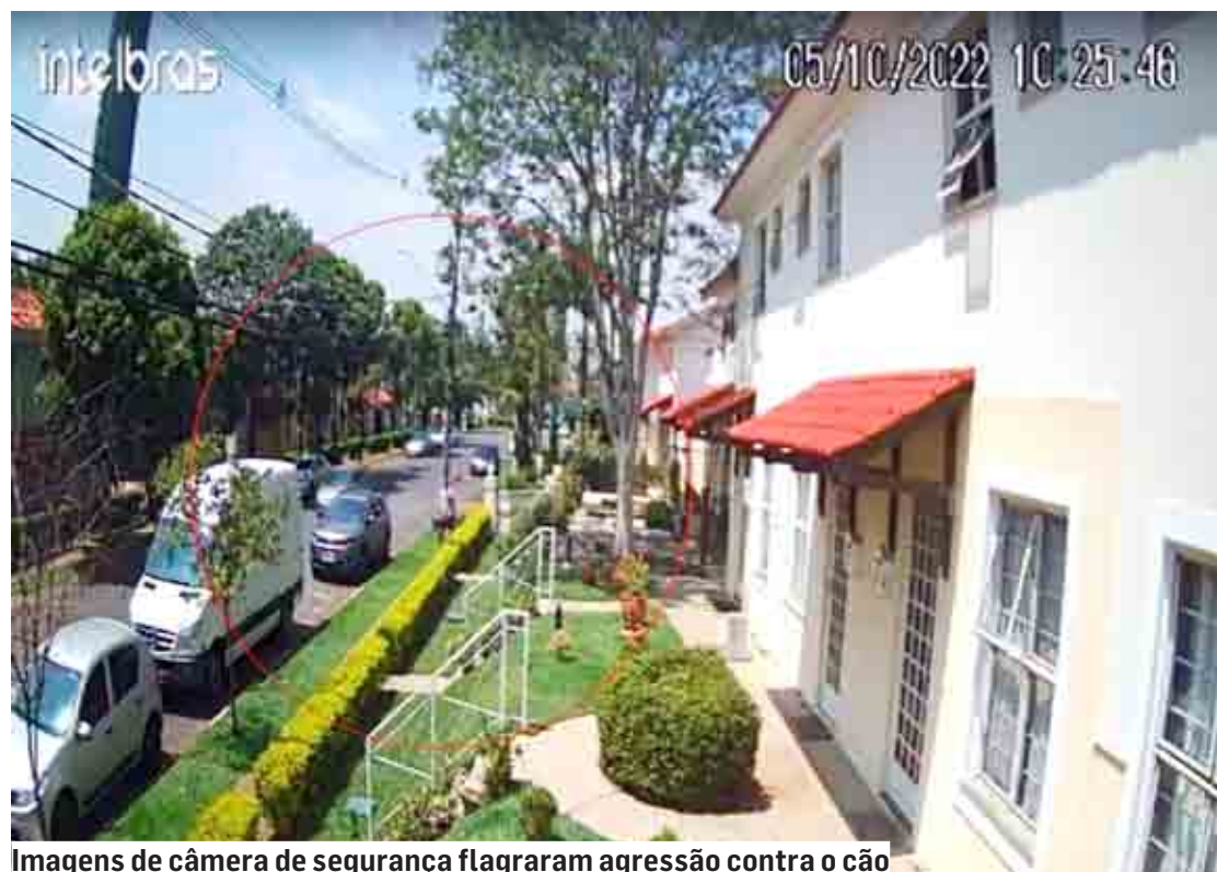
Imagens de câmera de segurança flagraram agressão contra o cão