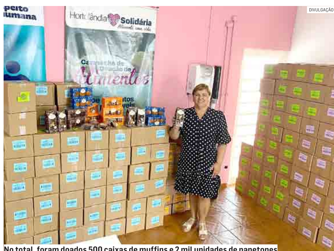
No total, foram doados 500 caixas de muffins e 2 mil unidades de panetones