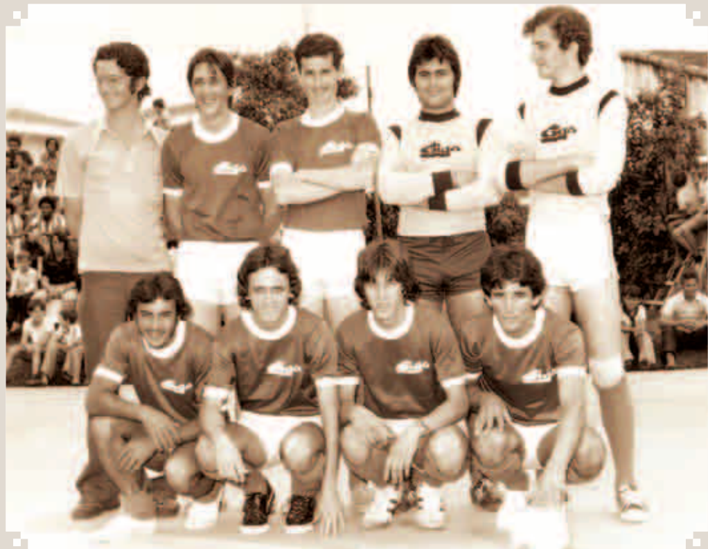
Foto dos anos 1970, do time de futebol de salão do Grêmio Gigo, do Supermercados Gigo, que disputou o Torneio dos Trabalhadores. O registro foi feito na quadra do Clube União Cultural XVI de dezembro. O Grêmio Gigo participava dos jogos praticamente em todas as modalidades existentes.