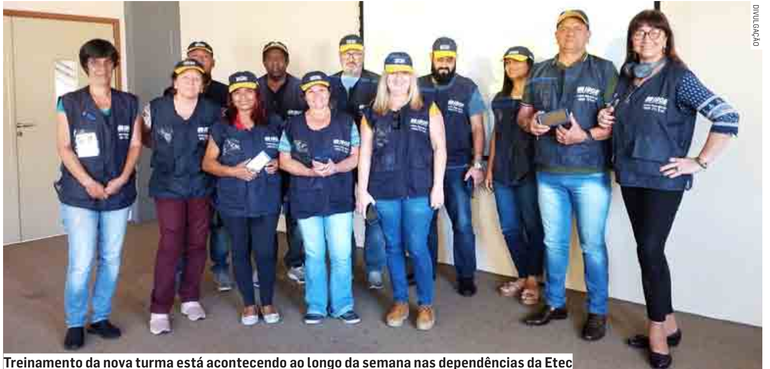
Treinamento da nova turma está acontecendo ao longo da semana nas dependências da Etec