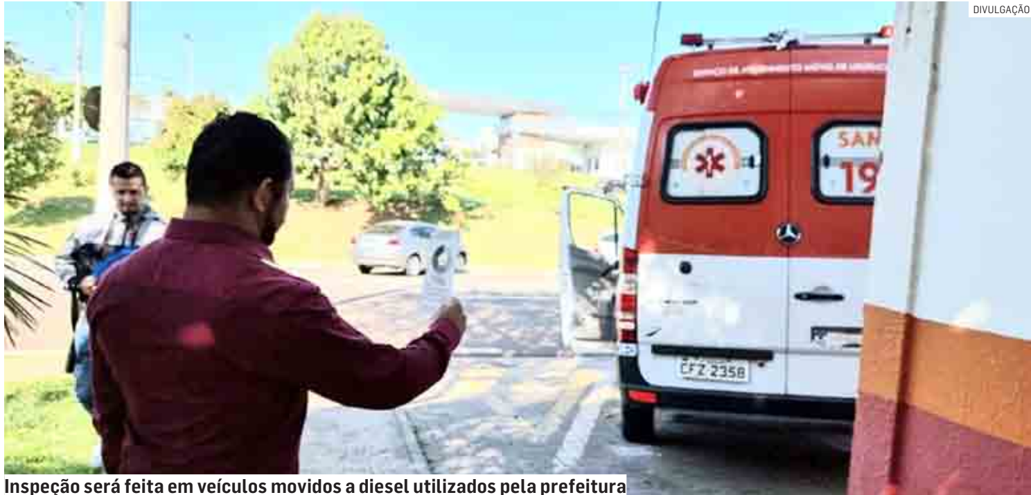
Inspeção será feita em veículos movidos a diesel utilizados pela prefeitura

A inspeção, iniciada neste mês, é feita pelo Departamento de Licença Ambiental e Gestão de Resíduos da Secretaria de Meio Ambiente e Desenvolvimento Sustentável. De acordo com dados da Secretaria de Administração, a frota municipal tem 74 veículos movidos a diesel, dentre os quais caminhões, ambulâncias, tratores, entre outros. A Secretaria de Meio Ambiente e Desenvolvimento Sustentável informa que já foram inspeciona-