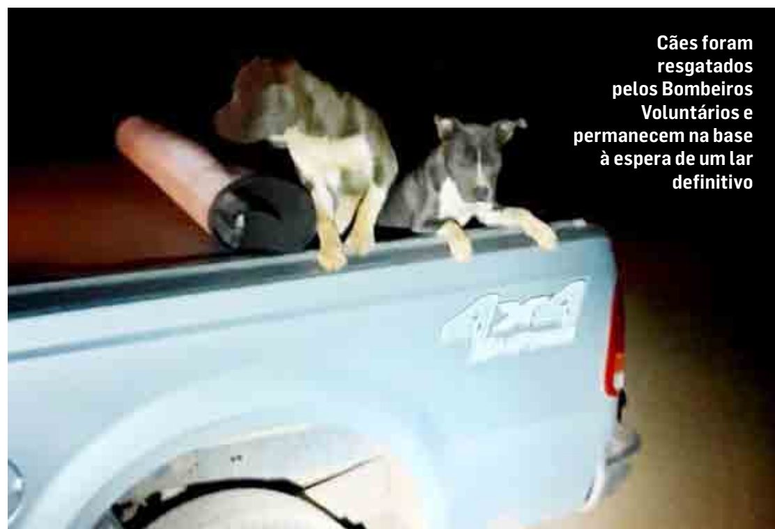
Cães foram resgatados pelos Bombeiros Voluntários e permanecem na base à espera de um lar definitivo

Dois cães da raça pitbull foram abandonados em uma área rural na noite desta terça-feira (8) na Fazenda Velha, em Nova Odessa. Moradores da região encontraram os animais e acionaram a GCM (Guarda Civil Municipal), informando o caso.