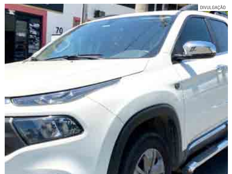
Caminhonete Fiat Toro foi roubada de um idoso de 60 anos

Os policiais avistaram o Fiat Toro na cor branca parado no acostamento, na altura do quilômetro 15, com um indivíduo no interior do veículo. A equipe realizou a abordagem policial e o ocupante foi retirado do in-