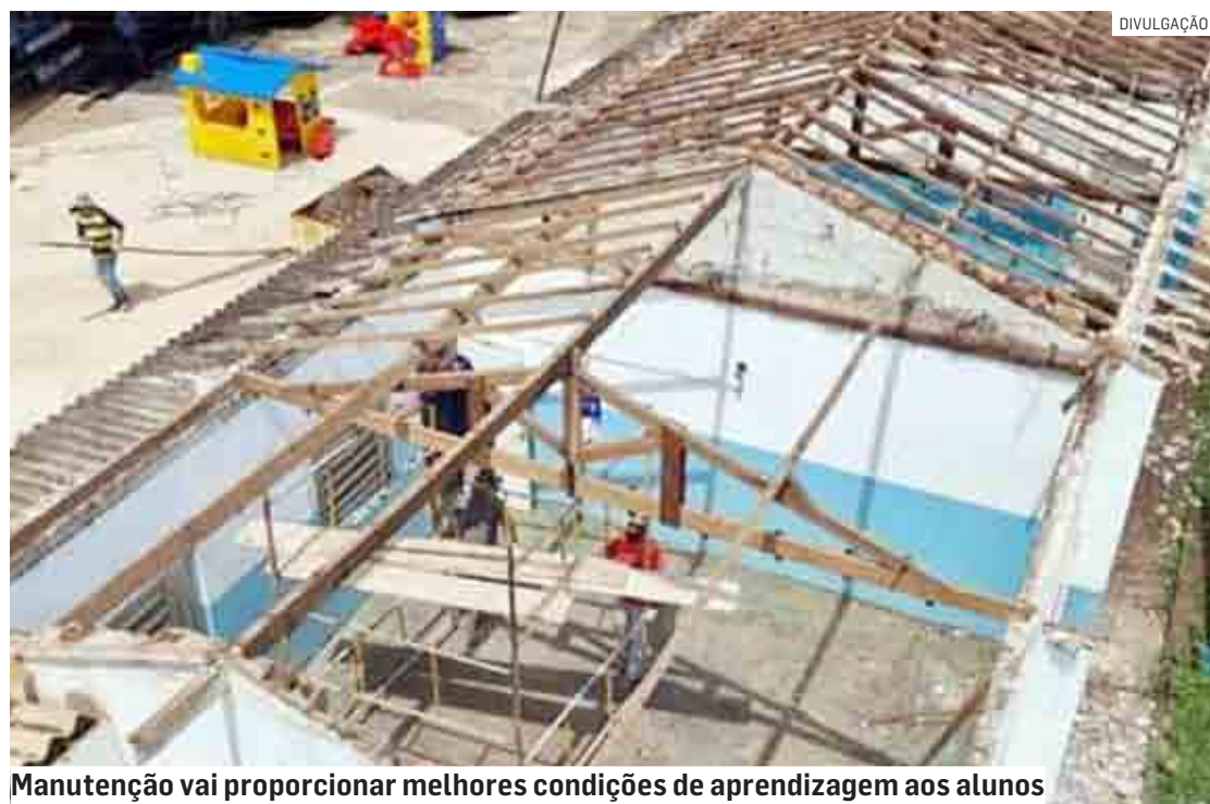
Manutenção vai proporcionar melhores condições de aprendizagem aos alunos

As escolas municipais São Judas Tadeu, região da Área Cura, e na EM Magdalena Maria Vedovatto Callegari, região do Maria Antonia, contam com Ensino em Tempo Integral, como um projeto piloto. O cardápio da merenda escolar foi rea-