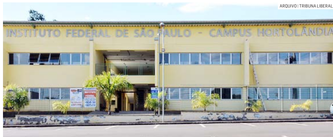
Vagas ofertadas na unidade de Hortolândia são para o primeiro semestre de 2024

Da Redação • HORTOLÂNDIA tribunaliberal@tribunaliberal.com.br