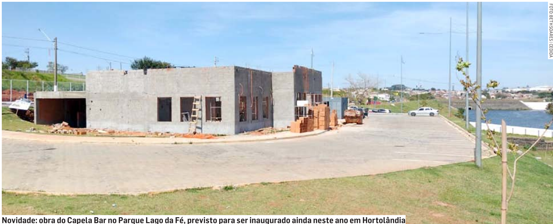
Novidade: obra do Capela Bar no Parque Lago da Fé, previsto para ser inaugurado ainda neste ano em Hortolândia

O Capela Bar recebeu a permissão para utilizar a área pública para fins comerciais pelo período de 10 anos. Nesse período, pagará ao município uma taxa mensal de R$ 2.849,95 que será corrigida, uma vez por ano, pelo IPCA (Índice Nacional de Preço ao Consumidor Amplo), informa de-