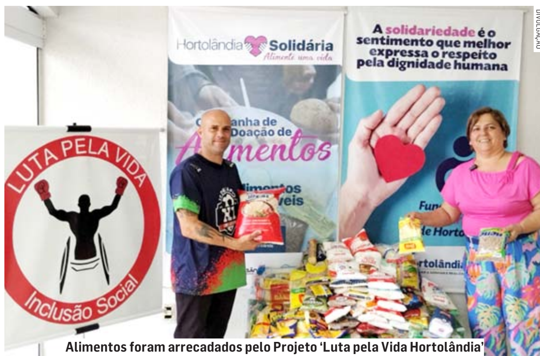
Alimentos foram arrecadados pelo Projeto 'Luta pela Vida Hortolândia'

“Essa é uma ação que transborda solidariedade, onde se pode trabalhar outros pilares, como inclusão e saúde. Graças a essa ação tão importante, muitas famílias serão beneficiadas. Nosso trabalho incansável na busca de alimentos é garantir que não falte o alimento à mesa de ninguém. Temos que aplaudir de pé ações como essa. Parabéns à entidade Luta pela Vida.