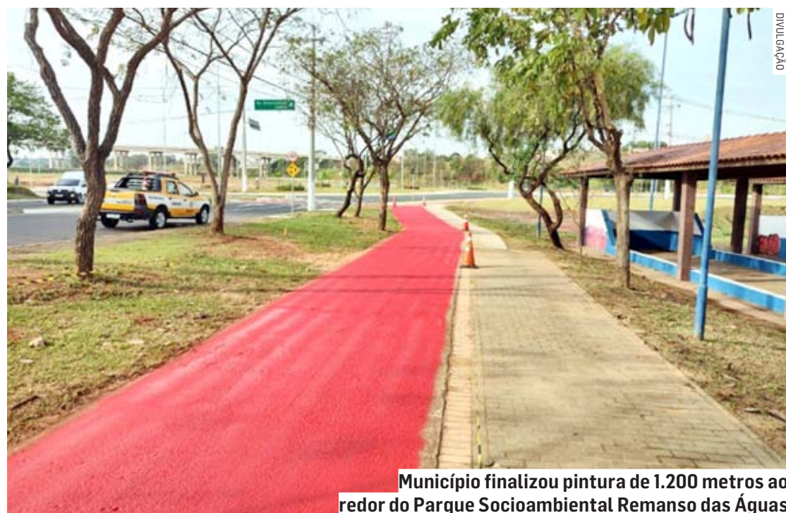
Município finalizou pintura de 1.200 metros ao redor do Parque Socioambiental Remanso das Águas

Recentemente, a Administração Municipal implantou 5 quilômetros de ciclovia no “Superviário”, local onde acontece o já tradicional passeio “Vem de Bike”. Também foi concluída a implantação no Parque Socioambiental “GM Alexandre Roberto Fernandes dos Reis”, ao lado do condomínio Green Park e em um trecho ciclo-