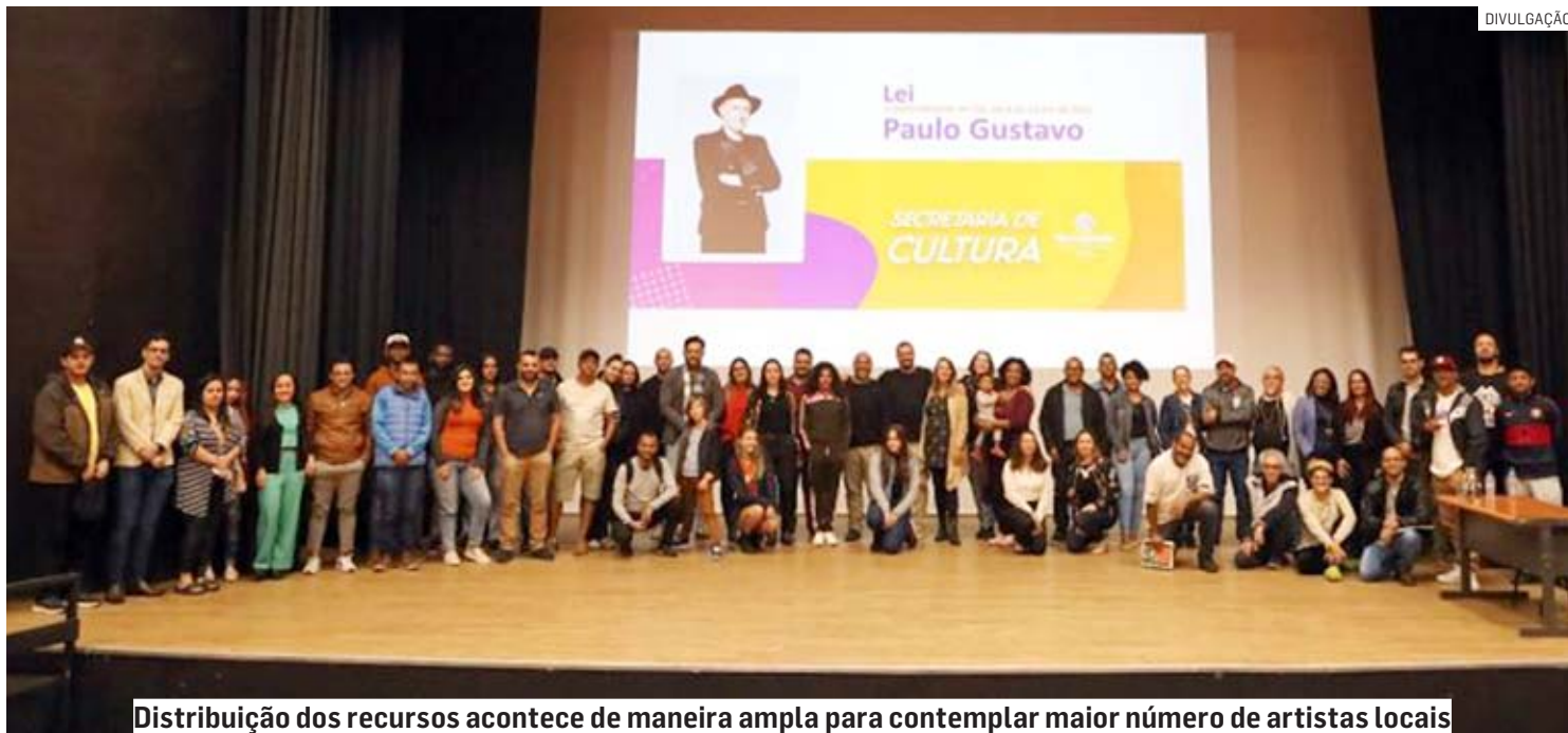
Distribuição dos recursos acontece de maneira ampla para contemplar maior número de artistas locais

Promulgada em julho de 2022, a Lei Complementar 195, batizada como “Lei Paulo Gustavo” em homenagem ao ator e humorista vitimado pela Covid-19, foi criada como forma de incentivar a produção cultural do país e garantir ações emergenciais demandadas pelas consequências do pe-