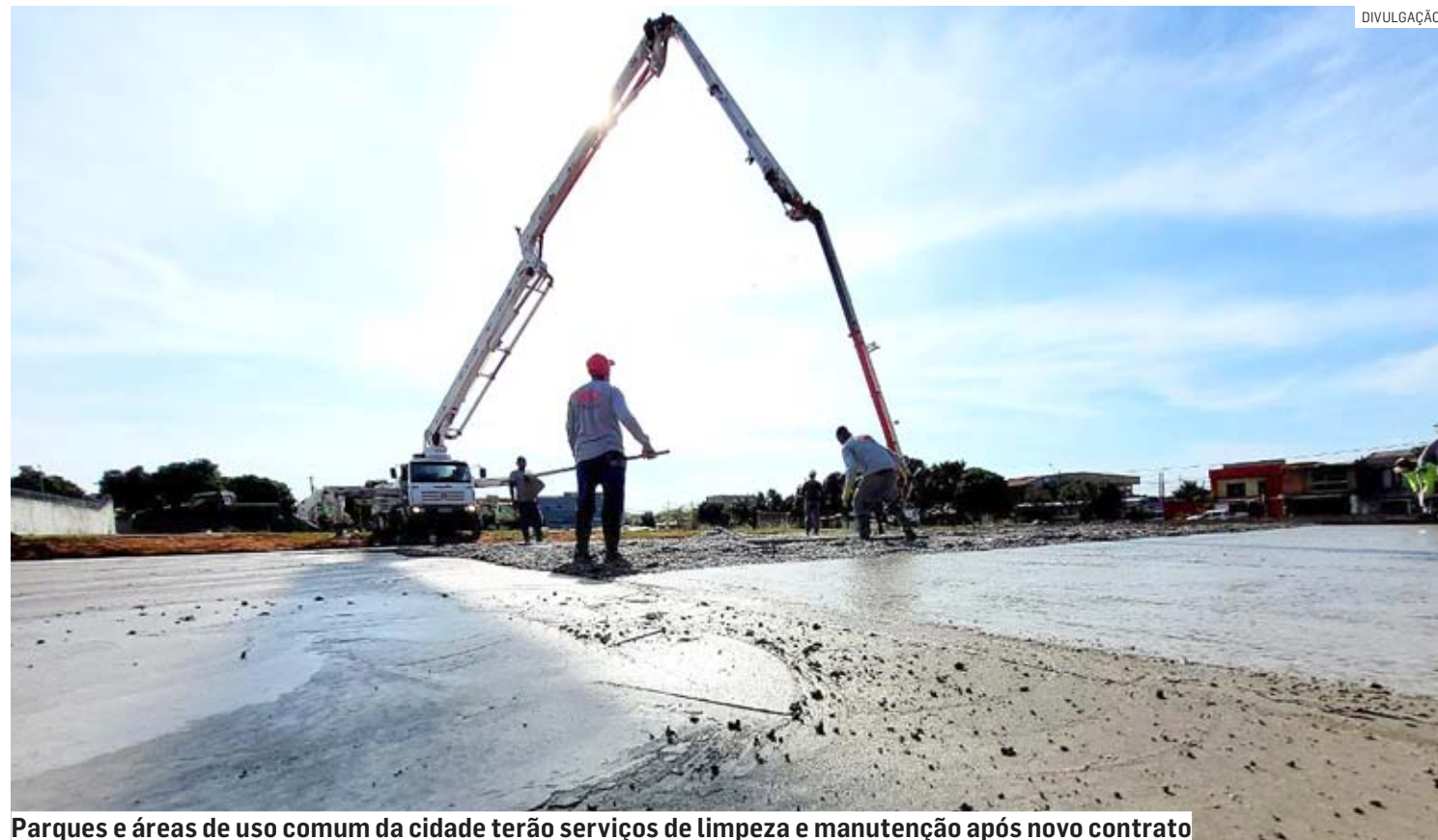
Parques e áreas de uso comum da cidade terão serviços de limpeza e manutenção após novo contrato

Empresa Agreg Construção e Soluções Ambientais Ltda fará serviços de manutenção de espaços do município em contrato de R$ 15,2 milhões