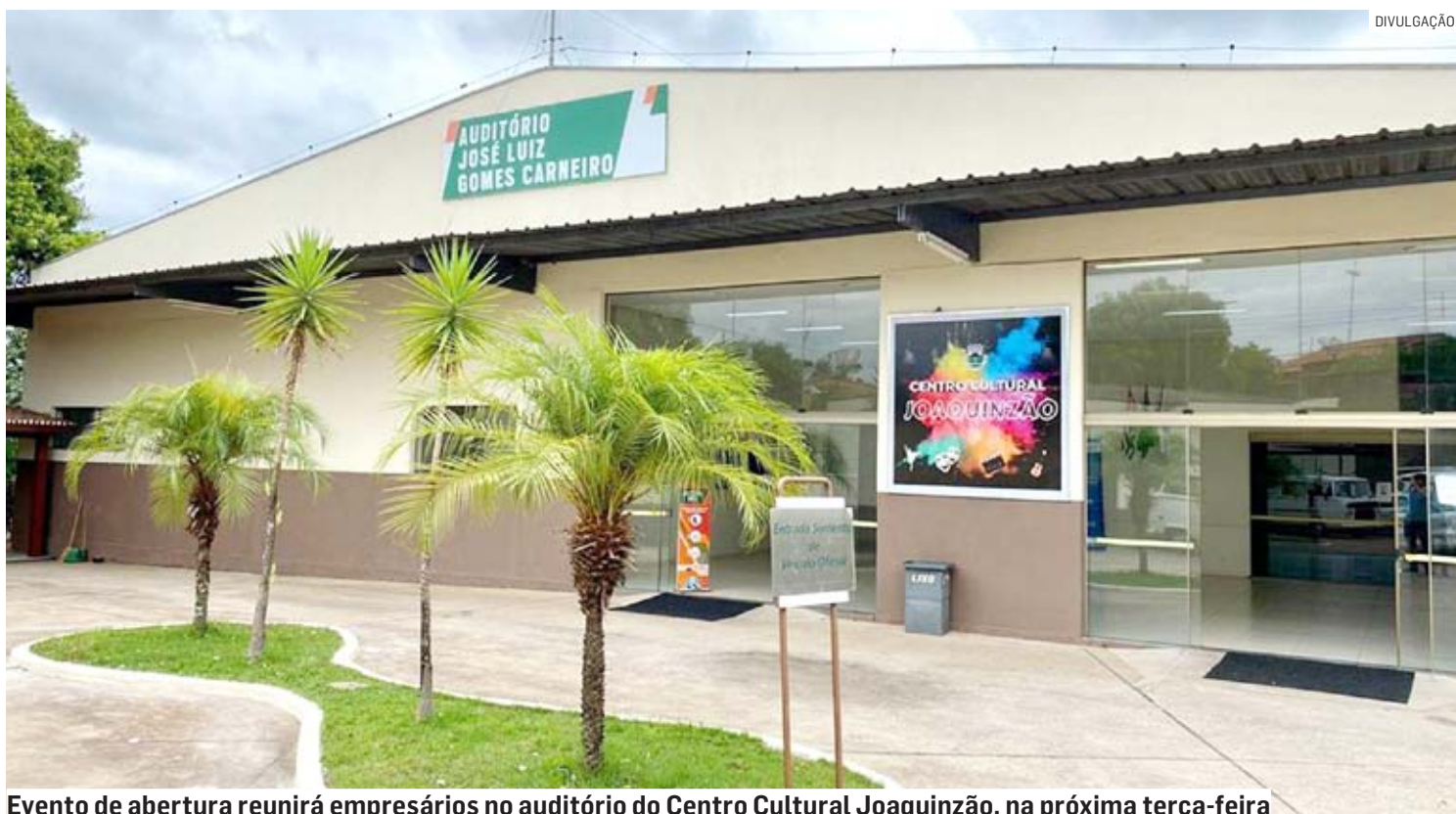
Evento de abertura reunirá empresários no auditório do Centro Cultural Joaquinão, na próxima terça-feira

O último dia de Feira, dia 16, que também acontece no Ginásio Durval