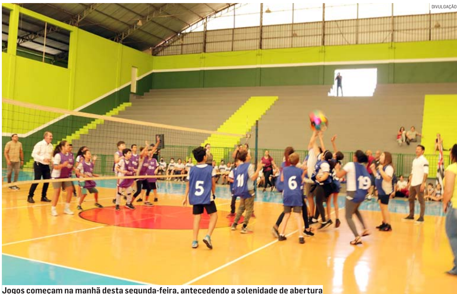
Jogos começam na manhã desta segunda-feira, antecedendo a solenidade de abertura

As disputas continuam no dia 14, com EMEF Haldrey e Vereador Avelino Xavier Alves “Poneis”, EMEF Augustina Adamson Paiva e Paulo Azenha, e EMEF Prof. Salime Abdo e Vereador