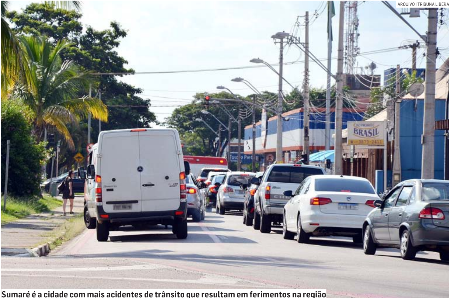
Sumaré é a cidade com mais acidentes de trânsito que resultam em ferimentos na região

Segundo levantamento da Secretaria de Segurança Pública de São Paulo, total de 683 ocorrências dessa natureza foi registrado entre meses de janeiro e julho de 2023 em Sumaré, Nova Odessa, Hortolândia, Monte Mor e Paulínia