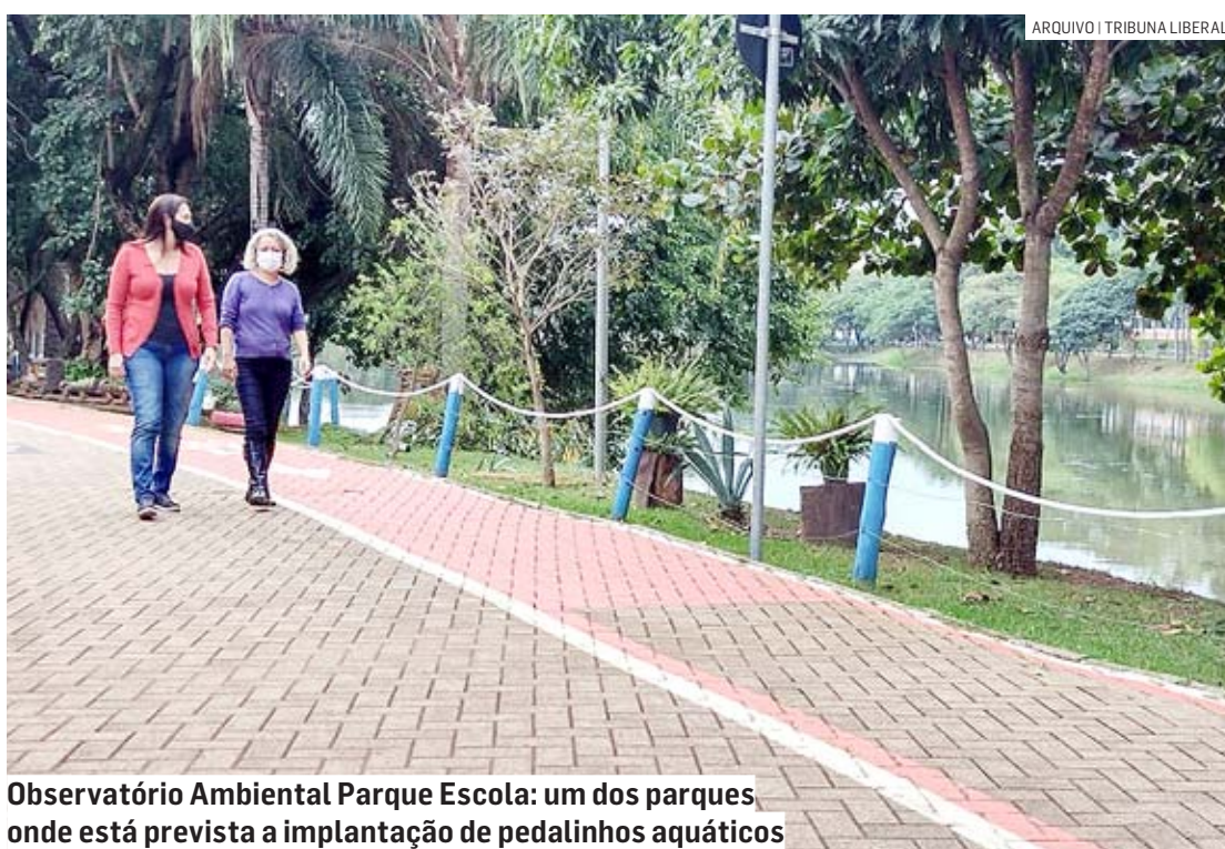
Observatório Ambiental Parque Escola: um dos parques onde está prevista a implantação de pedalinhos aquáticos

No ano passado, a Prefeitura anunciou a instalação de pedalinhos aquáticos e quiosques de alimentação nos parques. A previsão era de que a estrutura estaria em funcionamento a partir do primeiro trimestre deste ano, por meio de parcerias com o setor privado, conforme reportagem publicada pelo Tribuna Liberal em dezembro de 2022. Três parques socioambientais de Hortolândia seriam beneficiados com a estrutura, inicialmente: Irmã Dorothy Stang (Jd. Nossa Senhora de Fátima), o Lago da Fé (região do Parque Gabriel), e o Observatório Ambiental Par-