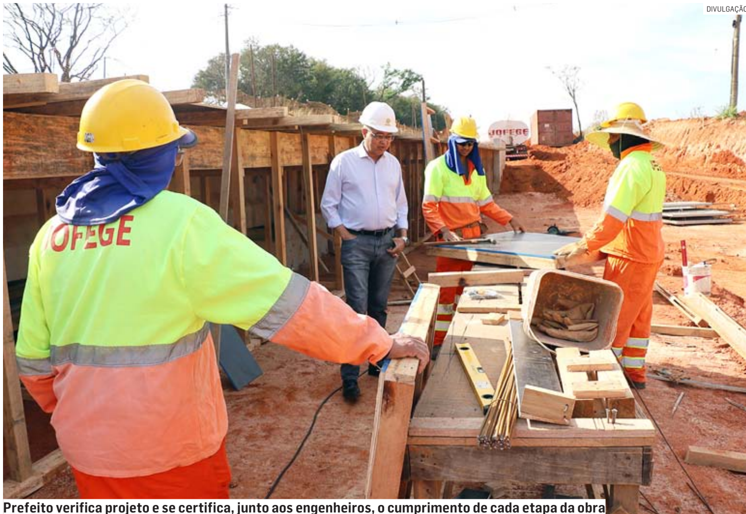
Prefeito verifica projeto e se certifica, junto aos engenheiros, o cumprimento de cada etapa da obra

No canteiro de obras da Passagem Inferior sob a ferrovia, o prefeito verificou o projeto e se certificou, junto aos engenheiros, sobre o cumprimento de cada etapa da obra. “Fico extremamente feliz porque essa ação vem seguindo religiosamente o cronograma pré-estabelecido e acredito que a passagem duplicada será entregue no primeiro semestre do próximo ano. Muitas pessoas passam por aqui e pensam que a duplicação é uma obra que vai apenas desafogar o fluxo de veí-