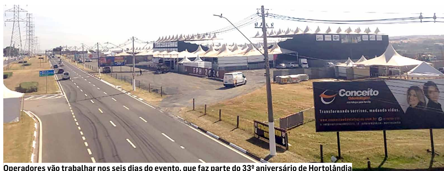
Operadores vão trabalhar nos seis dias do evento, que faz parte do 33º aniversário de Hortolândia

A Festa do Peão de Hortolândia, evento que faz parte do calendário oficial do município, está de volta nesta sexta-feira (10) com o início das apresentações artísticas e as etapas da Copa VR de Rodeio, de