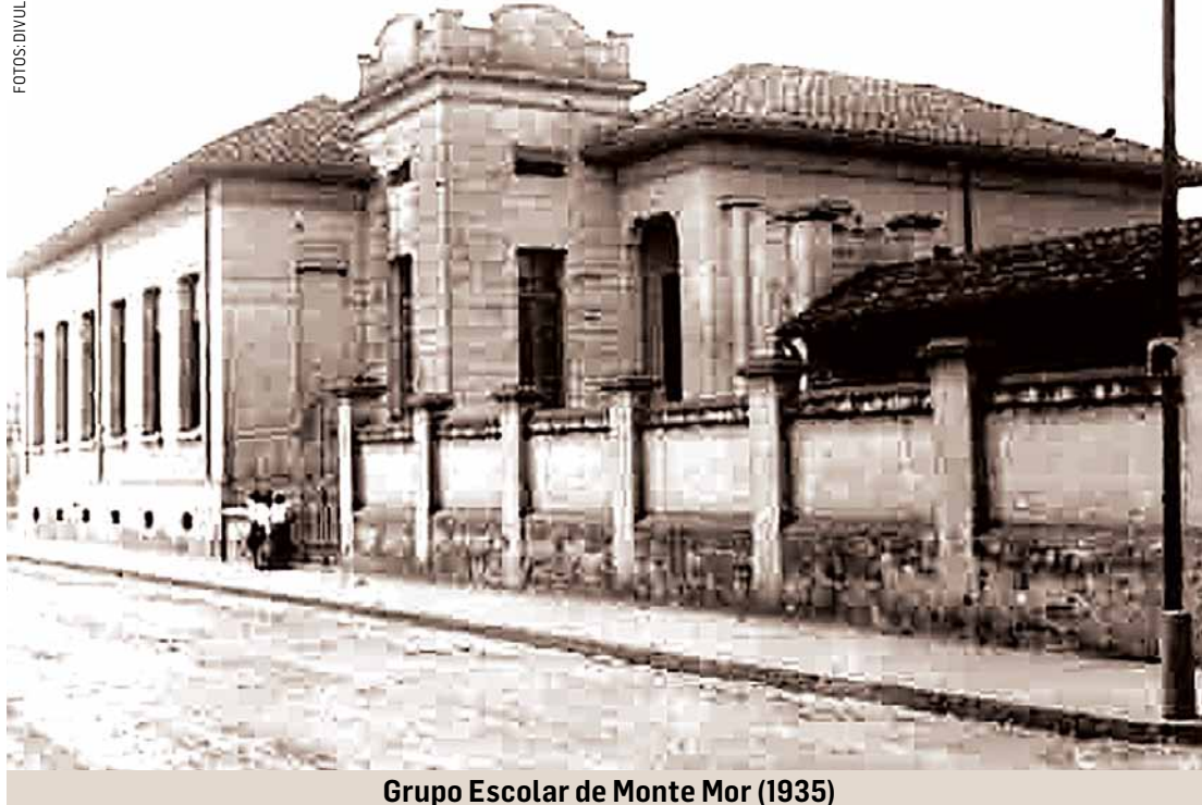
Grupo Escolar de Monte Mor (1935)

O Estado de São Paulo foi o pioneiro na criação e instalação dos Grupos Escolares, a partir de 1893, partindo da proposta de reunião das escolas isoladas de acordo com a proximidade entre elas. Esses grupos escolares do início da República foram responsáveis por um novo modelo de organização escolar graduada que começara a ser utilizada, nesse final do século XIX em vários países da Europa e nos Estados Unidos com o objetivo de implantar uma educação popular.