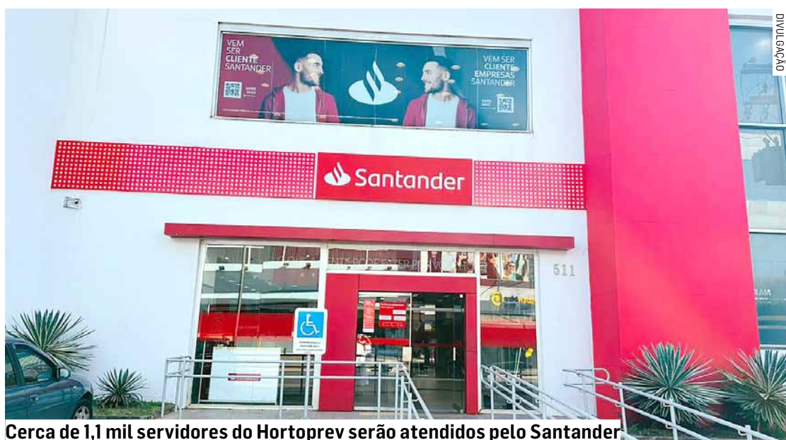
Cerca de 1,1 mil servidores do Hortoprev serão atendidos pelo Santander

Da Redação • HORTOLÂNDIA tribunaliberal@tribunaliberal.com.br