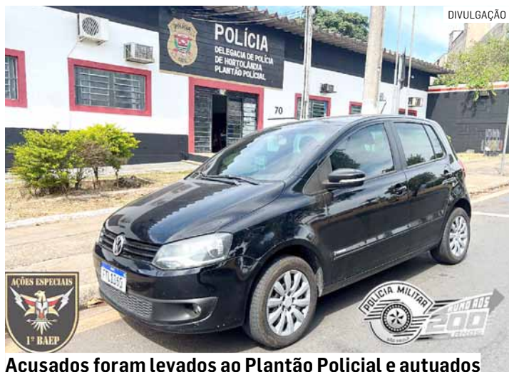
Acusados foram levados ao Plantão Policial e autuados

placas de outro carro. Ao verificar o verdadeiro emplacamento do veículo, foi confirmado que se tratava de produto de furto no último dia 3, em Campinas.