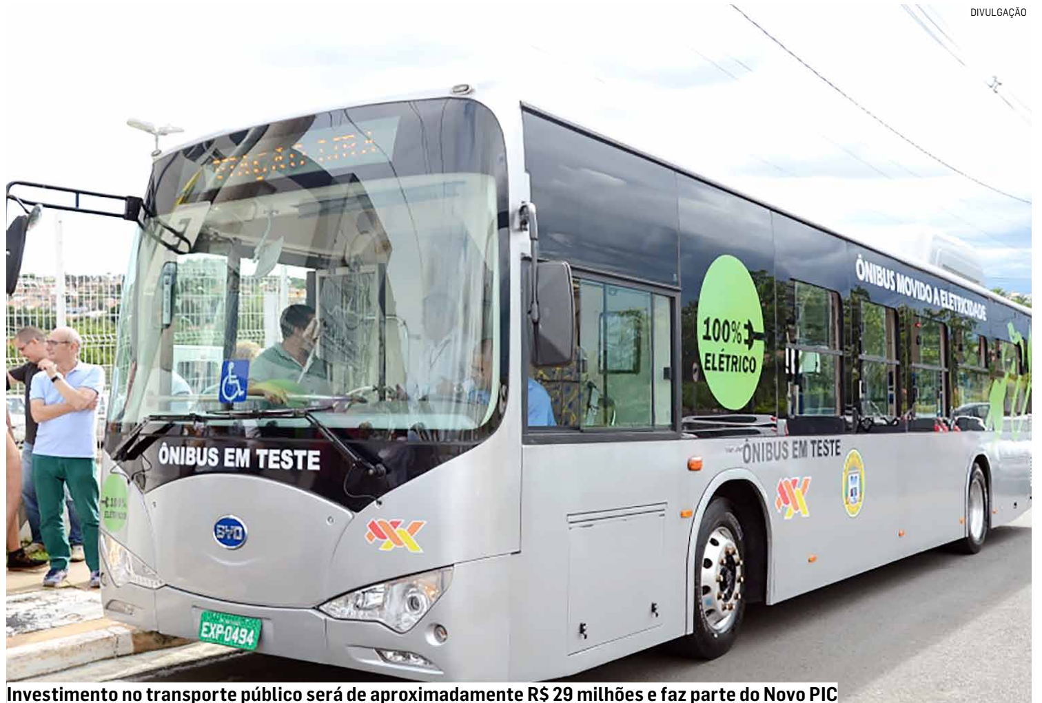
Investimento no transporte público será de aproximadamente R$ 29 milhões e faz parte do Novo PIC

O programa municipal prevê investimentos de mais de R$260 milhões em obras, projetos e serviços,