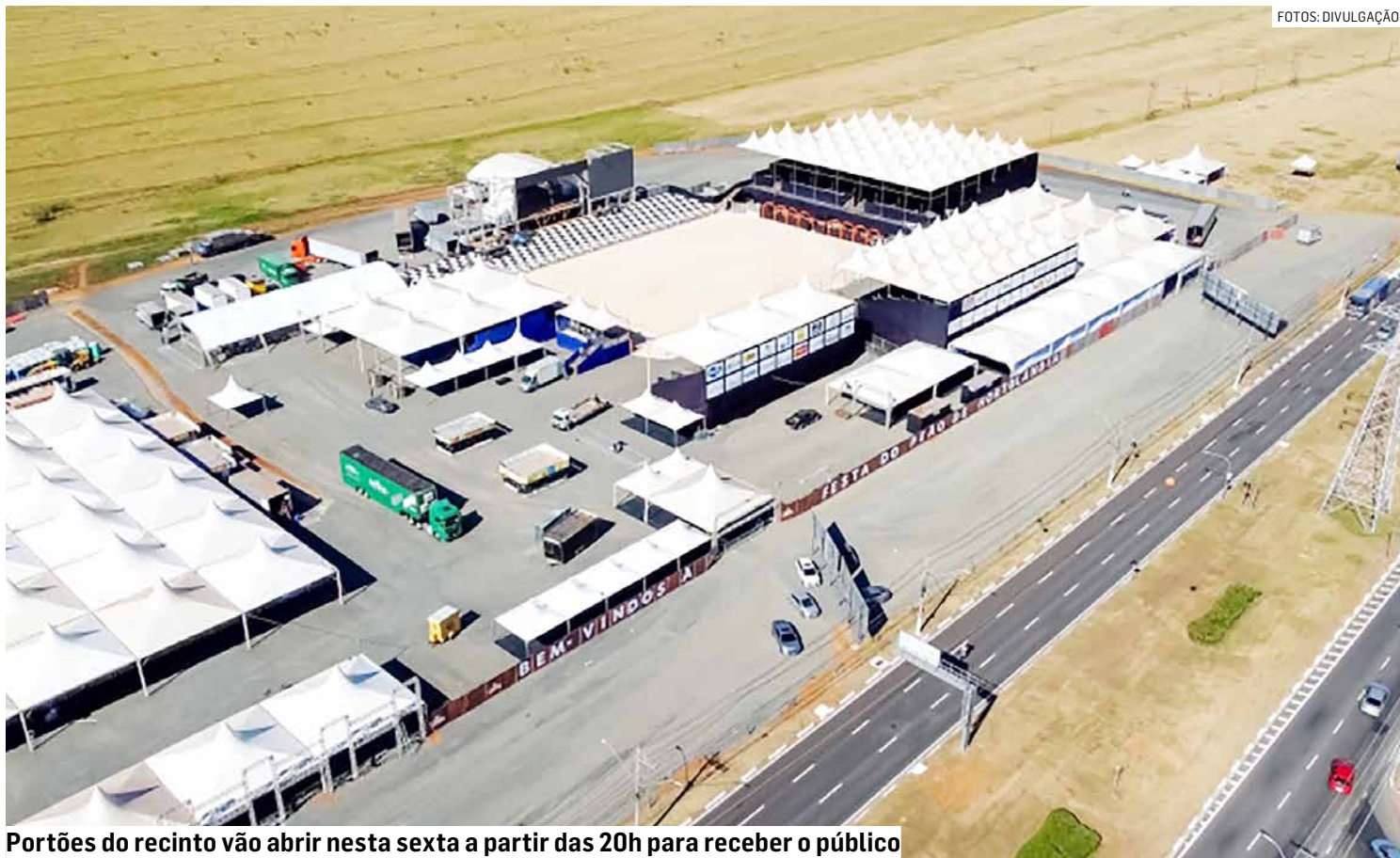
Portões do recinto vão abrir nesta sexta a partir das 20h para receber o público

Os portões do recinto vão abrir nesta sexta a partir das 20h para receber o público que vai poder prestigiar, a partir das 21h, a solenidade de abertura com shows pirotécnicos e apresentação dos peões denominados “laranjas mecânicas”, além do início das montarias. A cantora Elaine Mendonça e a dupla Israel & Rodolfo inauguram o palco da edição 2024.