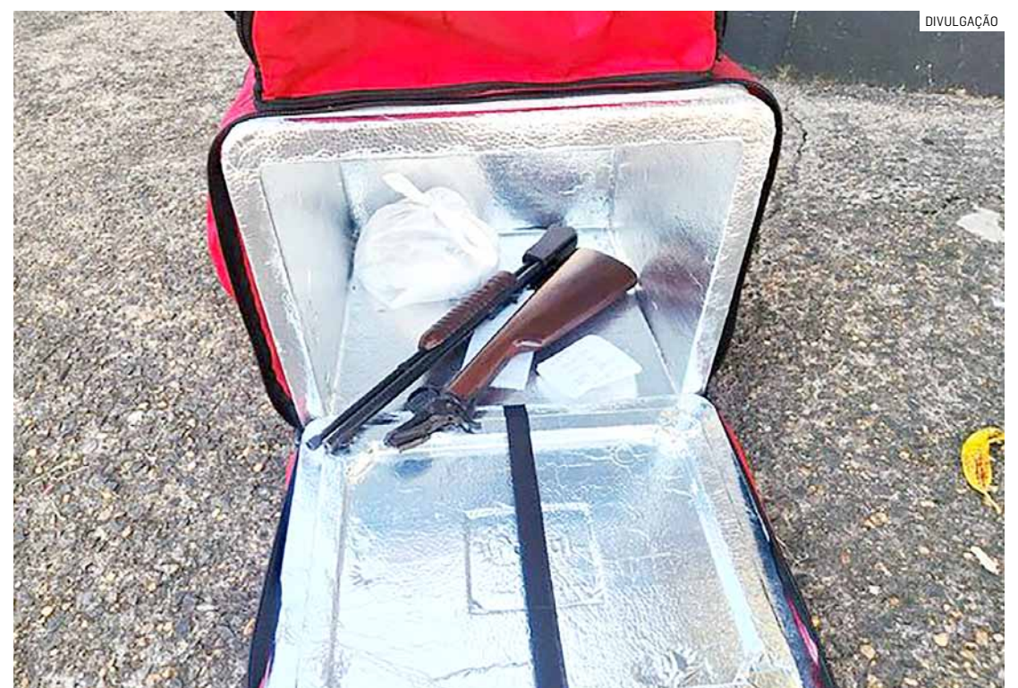
Acusado entrou em luta corporal com o marido da vítima e fugiu deixando arma no local

nada pelo Hospital Municipal de Nova Odessa, informando que havia dado entrada uma mulher grávida e estava ferida por arma de fogo.