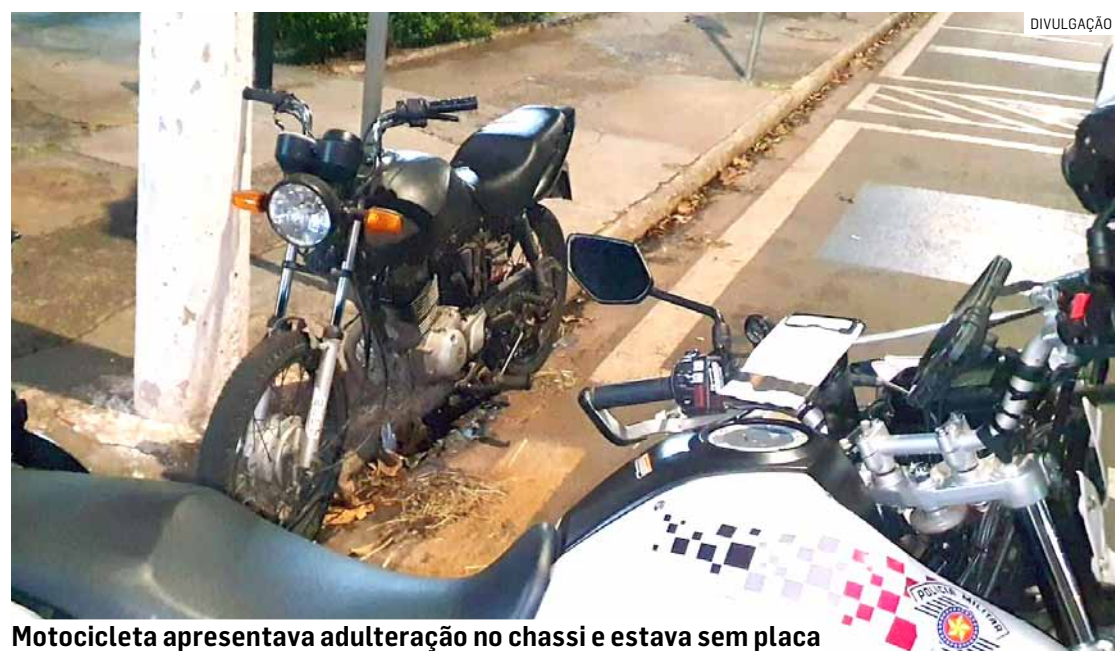
Motocicleta apresentava adulteração no chassi e estava sem placa