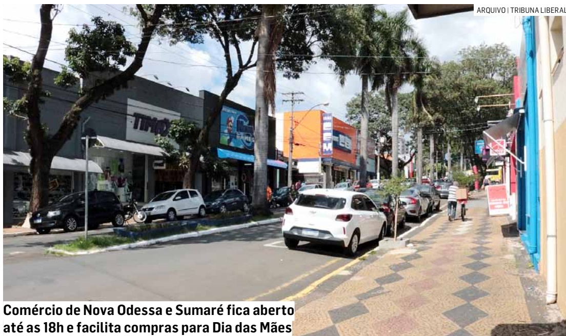
Comércio de Nova Odessa e Sumaré fica aberto até as 18h e facilita compras para Dia das Mães