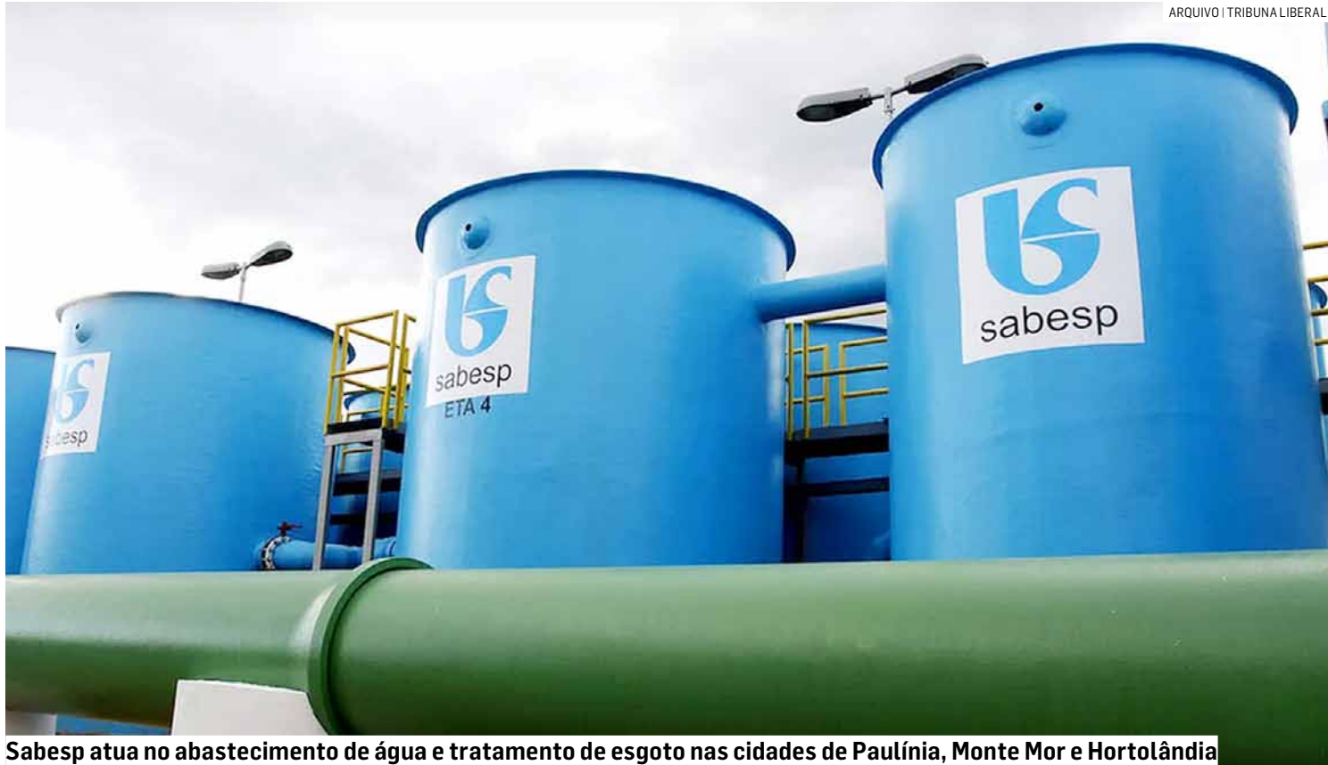
Sabesp atua no abastecimento de água e tratamento de esgoto nas cidades de Paulínia, Monte Mor e Hortolândia

O Estado anunciou o novo modelo de concessão da Sabesp, que entrará em vigor após a desestatização da companhia. Ele prevê a redução de 10% nas tarifas social e vulnerável de água e esgoto. As demais categorias também devem ficar mais baratas – a residencial terá queda de 1%, e as demais, como comercial e industrial, terão 0,5%