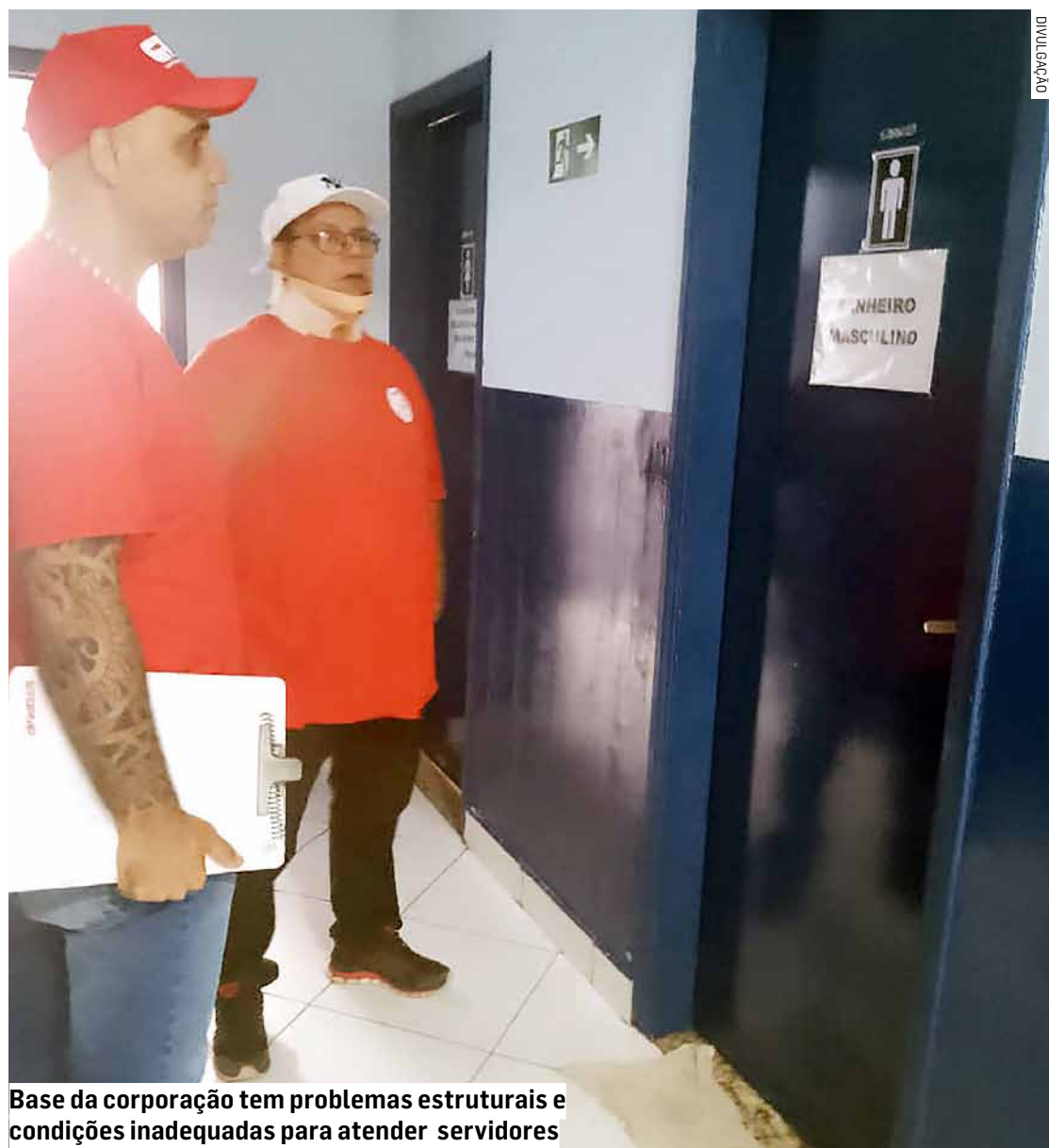
Base da corporação tem problemas estruturais e condições inadequadas para atender servidores

Local apresenta condições consideradas irregulares, como ausência de espaço para troca de roupa ou fardamento e apenas um chuveiro para cerca de 200 agentes de segurança; sindicato quer providências imediatas diante da gravidade do caso