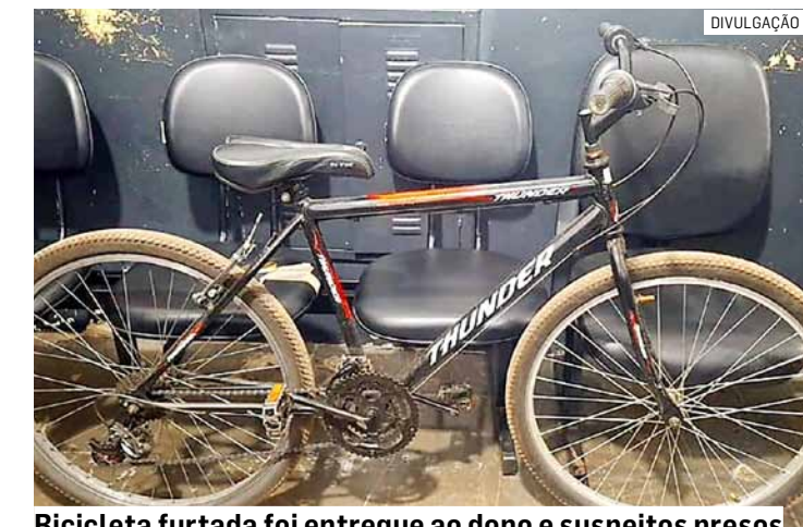
Bicicleta furtada foi entregue ao dono e suspeitos presos

Os policiais colheram informações das características do autor do furto e, após patrulhamento, o homem foi localizado escondido próximo à Praça Poderosa. Aos militares, ele confessou onde e para