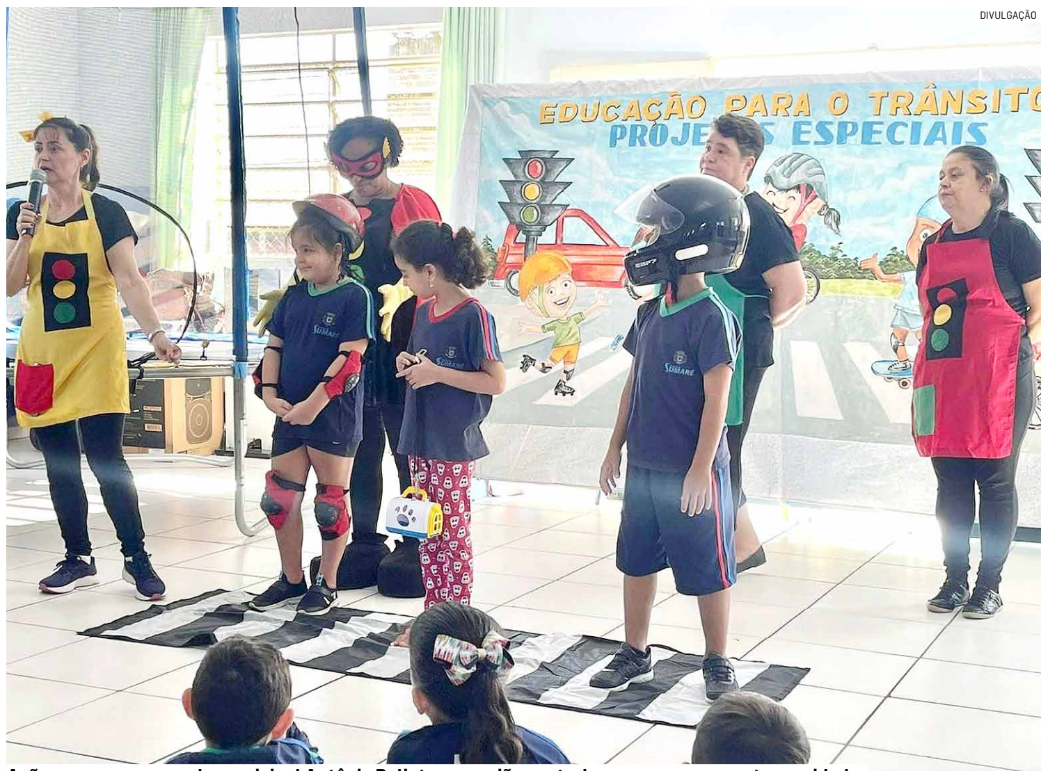
Ação começou na escola municipal Antônio Palioto, na região central, e prossegue em outras unidades

As pontes do Maria Antonia, Salerno, Emilio Bosco, Cecap, Inocoop foram recuperadas e revitalizadas, houve a duplicação das rotatórias da Praça do Evangelho, no Matão, e da Estrada Municipal Amé-