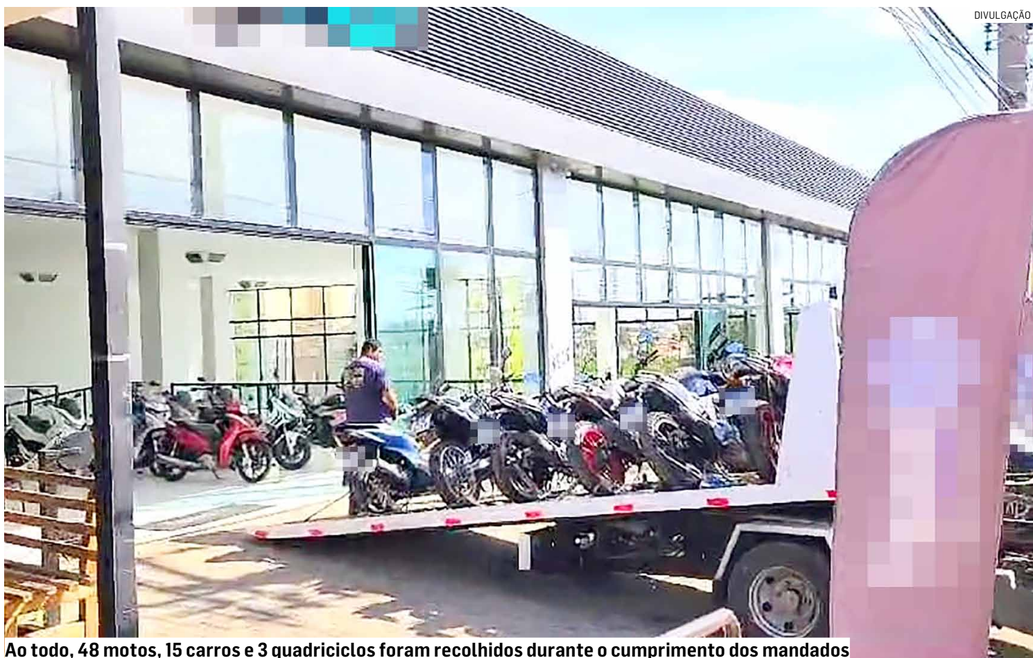
Ao todo, 48 motos, 15 carros e 3 quadriciclos foram recolhidos durante o cumprimento dos mandados

Ao todo, segundo a DIG (Delegacia de Investigações Gerais), nove pessoas estariam envolvidas e as apreensões desta quinta-feira são resultados da apuração de que lojas automotivas estariam envolvidas no crime.