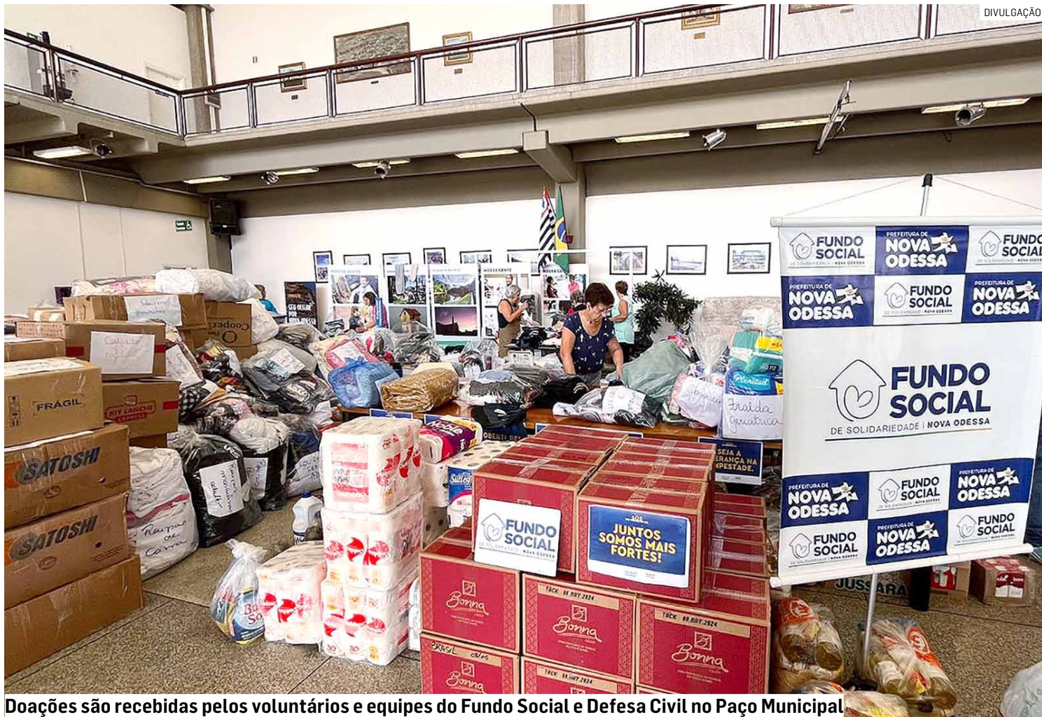
Doações são recebidas pelos voluntários e equipes do Fundo Social e Defesa Civil no Paço Municipal

“Antes de fazer uma contribuição, garanta que os itens enviados estejam em bom estado.”