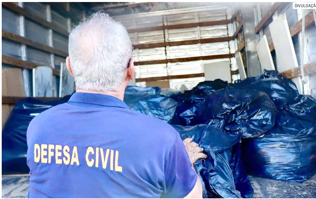
Doações podem ser feitas pelo sistema drive-thru na Praça das Bandeiras, na região central

"Mais uma vez contamos com a solidariedade da nossa população! Neste momento que vivemos é muito importante olharmos para quem mais precisa e promover ações de cuidados com essas pessoas. Intensificamos nossa Campanha Solidária do Bem, dessa vez com o SOS Rio Grande do Sul, e não estamos medindo esfor-