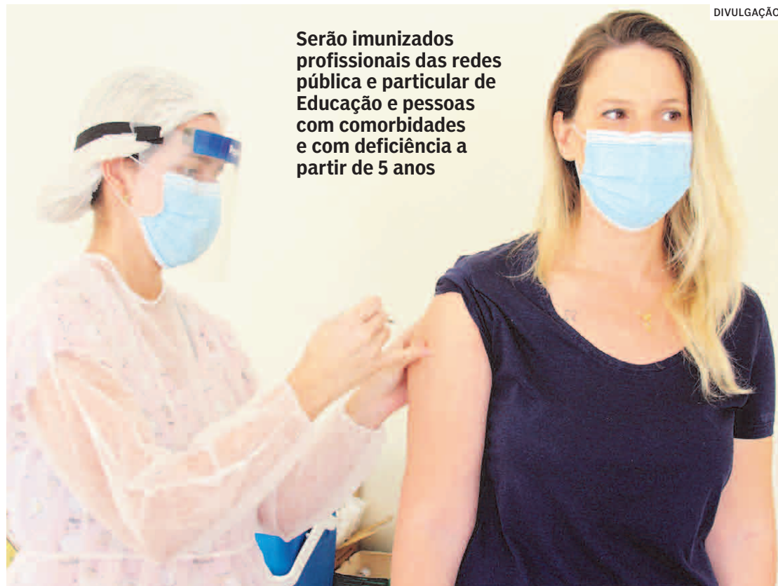
Serão imunizados profissionais das redes pública e particular de Educação e pessoas com comorbidades e com deficiência a partir de 5 anos

A 4ª etapa da campanha deverá começar em 16 de maio. Nessa etapa, serão vacinados caminhoneiros, trabalhadores do transporte coletivo, forças de segurança, de salvamento e armadas, funcionários do sis-