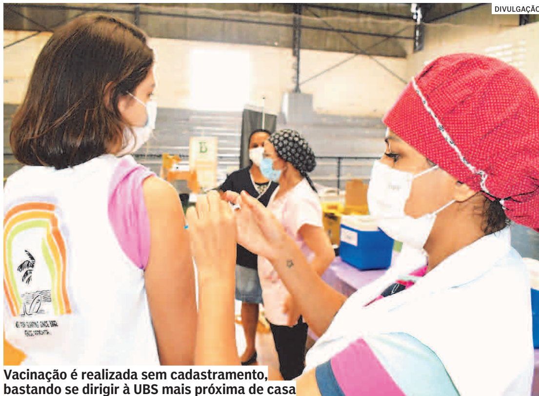
Vacinação é realizada sem cadastramento, bastando se dirigir à UBS mais próxima de casa

A Prefeitura de Nova Odessa, por meio da Secretaria de Saúde, iniciou nessa segunda-feira (09/05) a vacinação contra a gripe comum (causada pelo vírus Influenza) em mais um grupo de moradores, formado por professores, pessoas portadoras de deficiências ou com comorbidades. Mas a imunização prossegue diariamente em todas as UBSs (Unidades Básicas de Saúde) para todos os demais públicos já contemplados desde o início da campanha – incluindo idosos, crianças