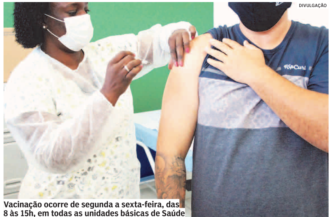
Vacinação ocorre de segunda a sexta-feira, das 8 às 15h, em todas as unidades básicas de Saúde

A vacina é contraindicada para pessoas com história de reação anafilática prévia em doses anteriores ou para pessoas que tenham alergia grave relacionada a ovo de galinha e seus derivados. Além da vacinação, cuidados simples também podem evitar o contágio