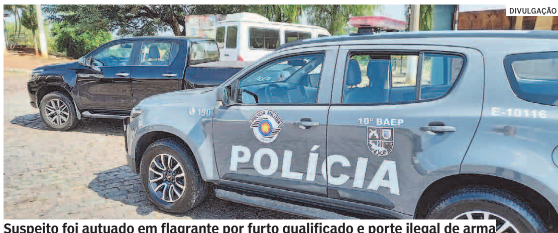
Suspeito foi autuado em flagrante por furto qualificado e porte ilegal de arma

foi localizada a quantia de R$ 10 mil em dinheiro. Questionado sobre a quantia, relatou que utilizou uma chave Philips para abrir a porta e, em seguida, instalou um módulo para acionamento do motor. Ele contou ainda que o dinheiro localizado em sua blusa estava dentro do veículo. Argumentou que o revólver era para sua própria segurança. Posteriormente, foi levado à UPJ (Unidade de Polícia Judiciária) de Americana, onde o delegado de plantão determinou a prisão em flagrante. Ele foi recolhido na Cadeia de Sumaré.