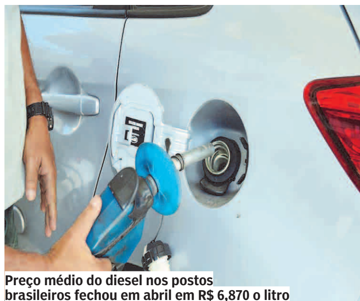
Preço médio do diesel nos postos brasileiros fechou em abril em R$ 6,870 o litro

A empresa justifica o aumento informando que o balanço global de diesel está sendo impactado, nesse momento, por uma redução da oferta frente à demanda. “Os estoques globais estão reduzidos e abaixo das mínimas sazonais dos últimos cinco anos nas principais regiões supridoras. Esse desequilíbrio resultou na elevação dos preços