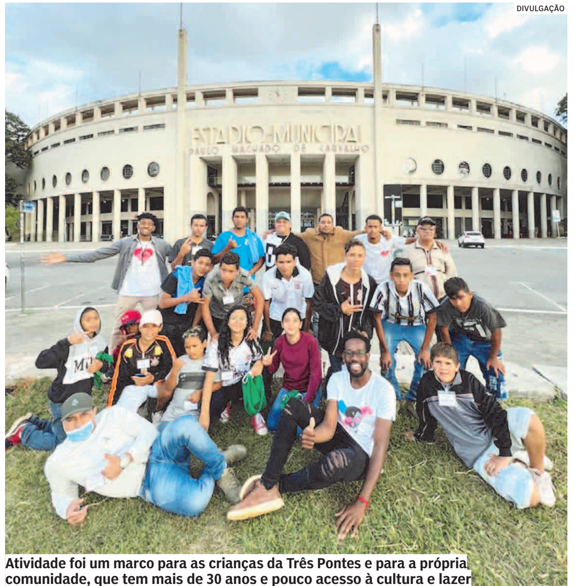
Atividade foi um marco para as crianças da Três Pontes e para a própria comunidade, que tem mais de 30 anos e pouco acesso à cultura e lazer

“A Constituição Federal, dentre os direitos fundamentais e suas garantias sociais traz, além de muitos outros, o Direito à Cultura e ao Lazer. No Brasil, o direito à cultura é previsto na carta magna como um direito fundamental do cidadão; para nós é uma grande honra sermos usados como ponte de acesso para fazer valer principalmente os direitos dos mais vulneráveis, pois produ-