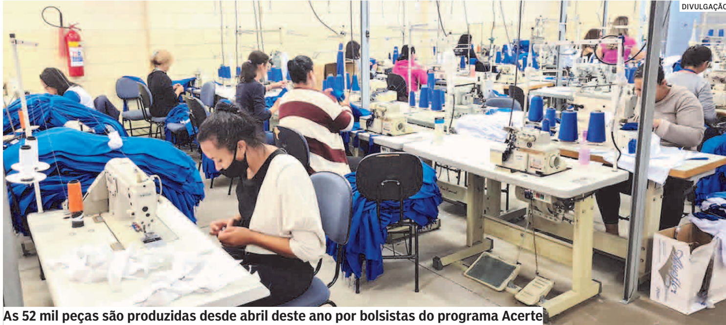
As 52 mil peças são produzidas desde abril deste ano por bolsistas do programa Acerte

Previsão é que kits sejam entregues após as férias de julho aos estudantes de Hortolândia; cada kit é composto por um agasalho e uma calça