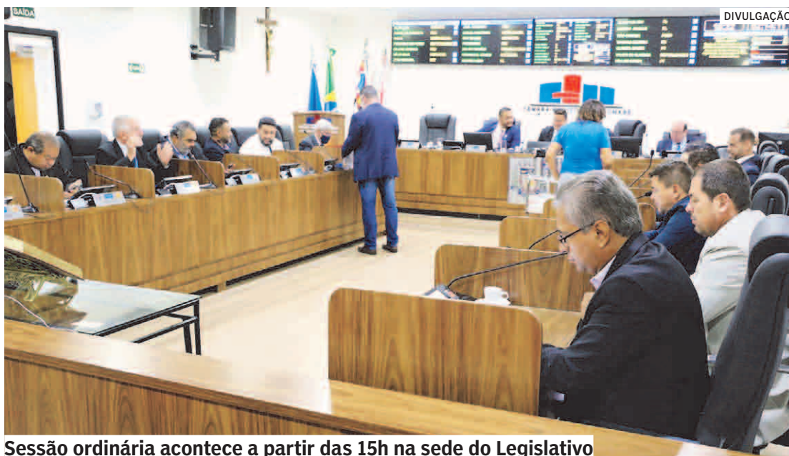
Sessão ordinária acontece a partir das 15h na sede do Legislativo

A Câmara de Sumaré promove a 15ª sessão do ano, na próxima terça-feira (10), a partir das 15h, no Plenário José Maria Matosinho, localizado na sede do Legislativo. Os vereadores se reúnem para discutir e votar cinco itens, sendo quatro projetos de lei e uma emenda modificativa. A população pode acompanhar os trabalhos de maneira presencial ou através