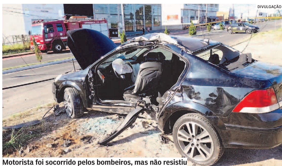
Motorista foi socorrido pelos bombeiros, mas não resistiu