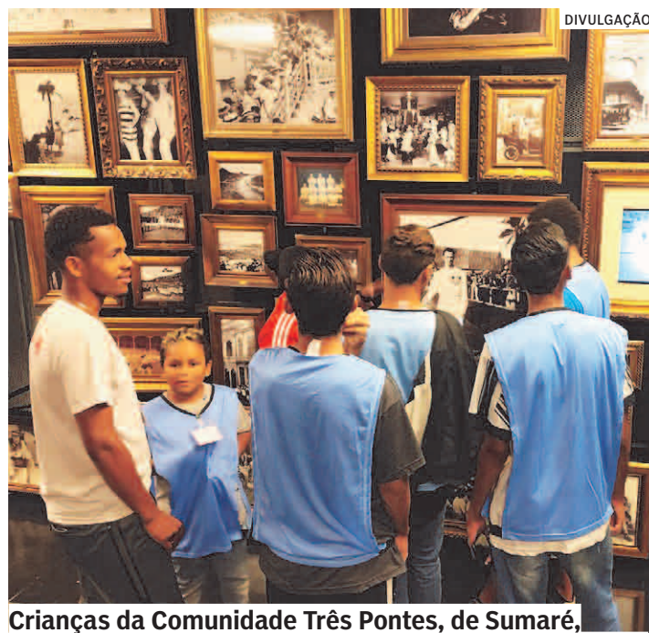
Crianças da Comunidade Três Pontes, de Sumaré, tiveram a oportunidade de conhecer o Museu do Futebol

A ONG Expandindo Amor promoveu uma ação cultural levando crianças da Comunidade de Três Pontes, de Sumaré, para conhecer o Museu do Futebol, localizado no estádio do Pacaembu, na sexta-feira passada (6). A ação fez parte do lançamento do projeto Expansão Cultural da ONG. É uma forma de garantir o acesso a cultura e ao lazer aos moradores vulneráveis da comunidade.