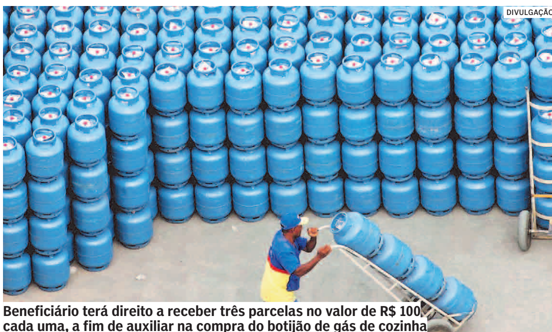
Beneficiário terá direito a receber três parcelas no valor de R$ 100, cada uma, a fim de auxiliar na compra do botijão de gás de cozinha

Ao todo, serão entregues 2008 cartões a famílias cadastradas no CadÚnico e que fazem parte do Programa Bolsa do Povo, da Secretaria Estadual de Desenvolvimento Social. Cada cartão dará direito ao beneficiário receber três parcelas no valor