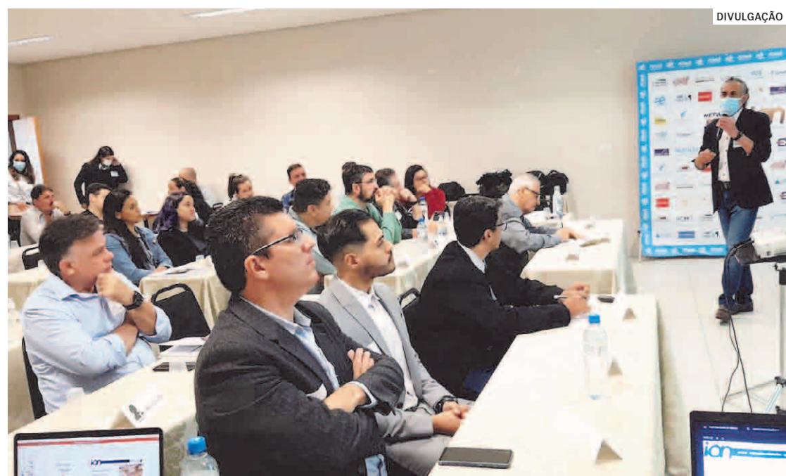
Empresários tiveram a oportunidade de se conhecer e passar a fazer negócio juntos

Da Redação | SUMARÉ tribunaliberal@tribunaliberal.com.br