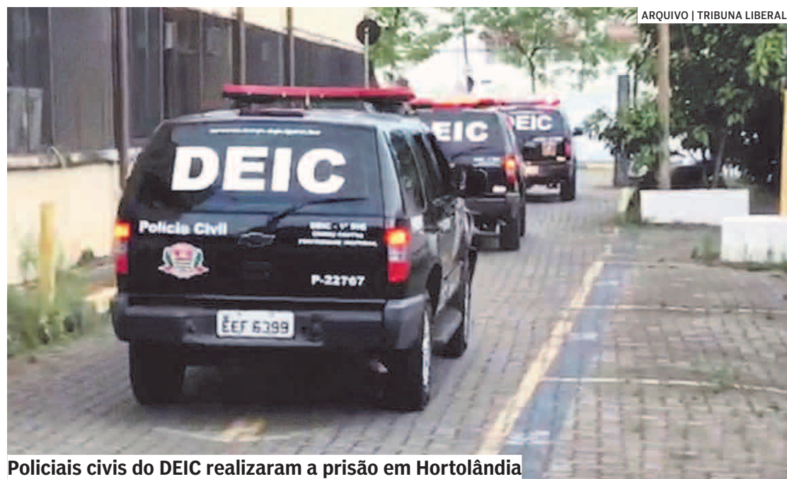
Policiais civis do DEIC realizaram a prisão em Hortolândia

A investigação sobre o caso foi conduzida pelos integrantes da 5ª Delegacia da Divisão de Investigações sobre Crimes contra o Patrimônio do Deic, que apuravam as atividades do procurado, que é experiente em roubos a banco e a empresas de transporte de valores.