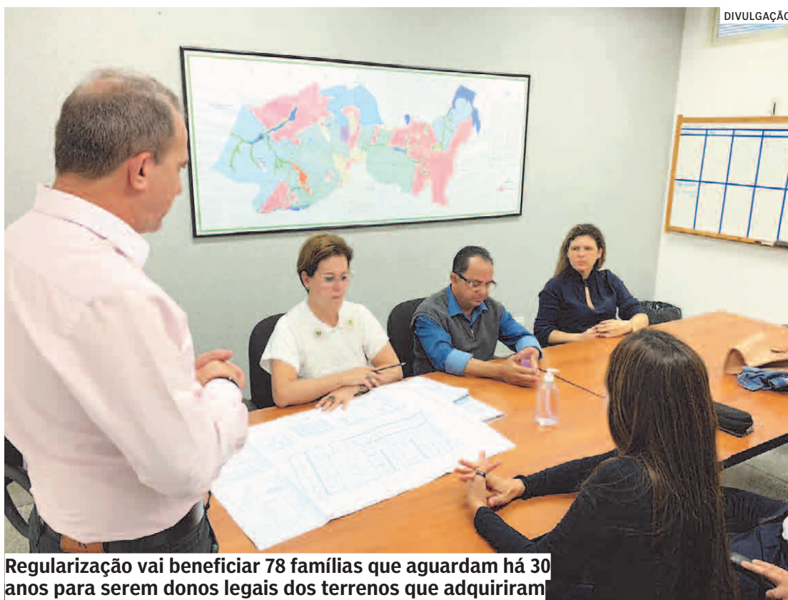
Regularização vai beneficiar 78 famílias que aguardam há 30 anos para serem donos legais dos terrenos que adquiriram