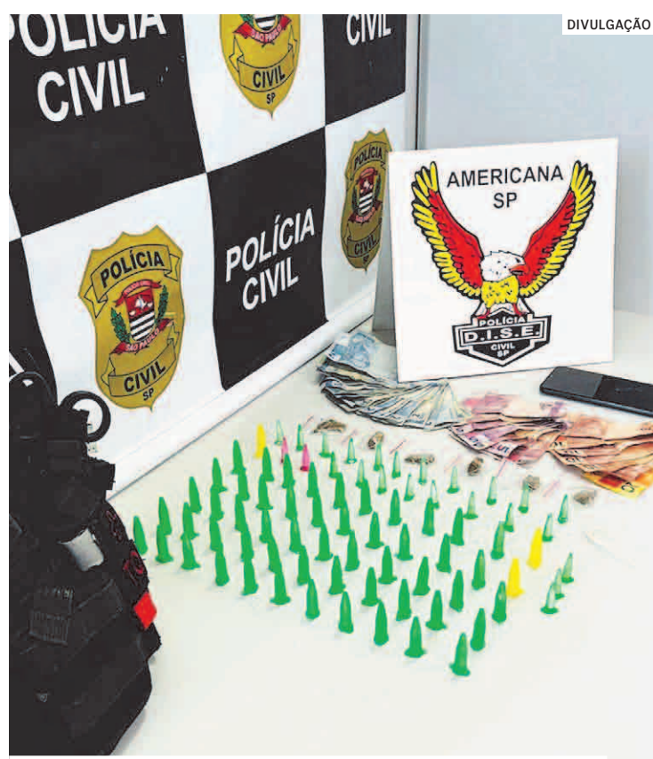
Entorpecentes foram apreendidos e jovens, liberados

Os envolvidos ficavam no interior de um terreno e vendiam as drogas através das grades do portão. Depois de fazer campanas, para analisar a movimentação, os policiais civis fizeram um