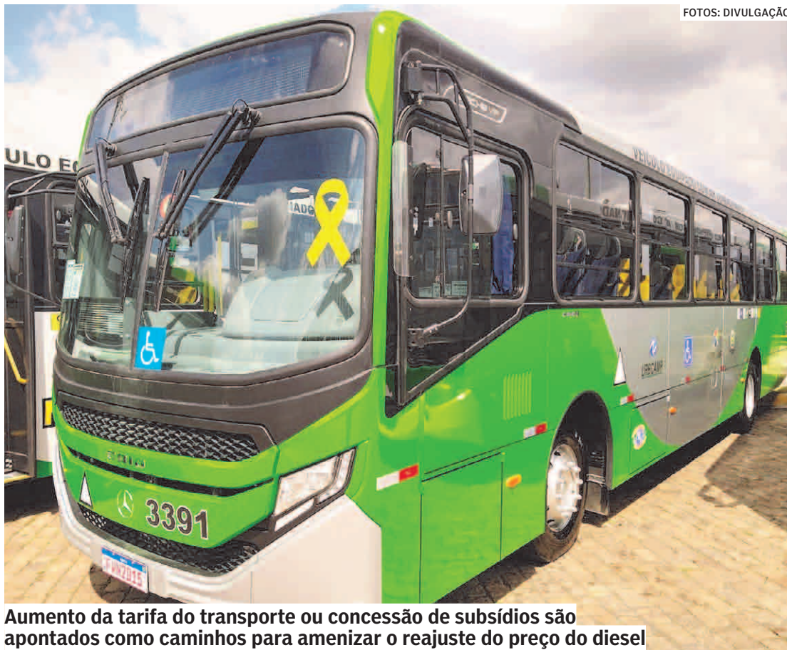
Aumento da tarifa do transporte ou concessão de subsídios são apontados como caminhos para amenizar o reajuste do preço do diesel