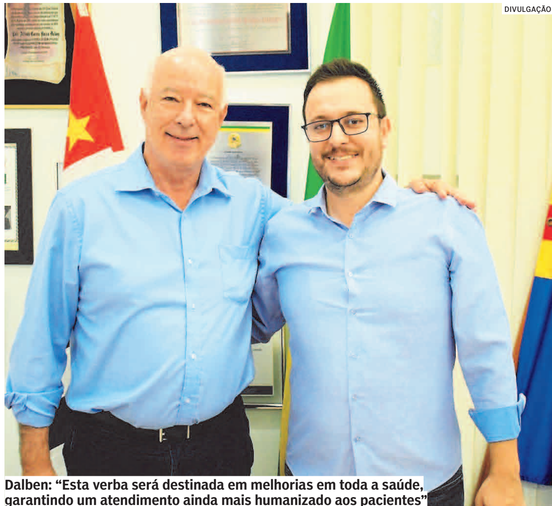
Dalben: "Esta verba será destinada em melhorias em toda a saúde, garantindo um atendimento ainda mais humanizado aos pacientes"

Comunicado foi feito durante encontro do chefe do Executivo com o deputado federal Herculano Passos