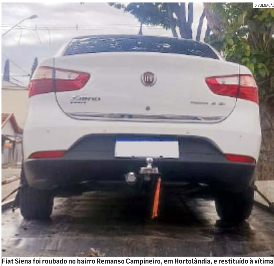
Fiat Siena foi roubado no bairro Remanso Campineiro, em Hortolândia, e restituído à vítima

Com o adolescente, nada de ilícito foi encontrado, bem como dentro do veículo. Os PMs entraram em contato com a vítima, que compareceu à delegacia e reconheceu apenas o menor de idade como um dos autores do crime. A ocorrência foi apresentada no Plantão Policial de Sumaré, onde o delegado deliberou pela apreensão do adolescente, permanecendo à disposição da Justiça pelo ato infracional, assim como o adulto.