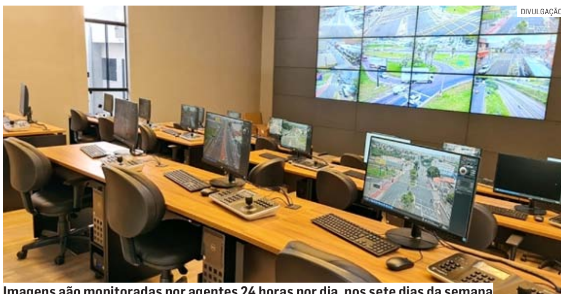
Imagens são monitoradas por agentes 24 horas por dia, nos sete dias da semana

Há exatamente um mês, Hortolândia modernizava, oficialmente, a segurança pública na cidade com a inauguração da nova Central de Monitoramento do Trânsito. Funcionando 24 horas por dia, nos sete dias da semana, os aparelhos que compõem a muralha digital da prefeitura oferecem um novo conceito de cuidado para a po-