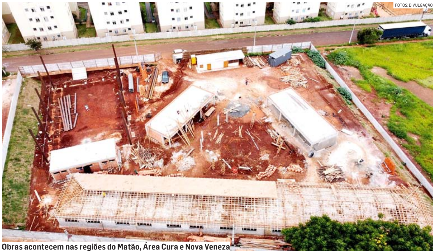
Obras acontecem nas regiões do Matão, Área Cura e Nova Veneza

A unidade escolar em construção no Residencial Itália tem 1.323,11 m 2 e capacidade para 376 crianças. Ao todo, são seis salas de aula, playground, sala de atividades,