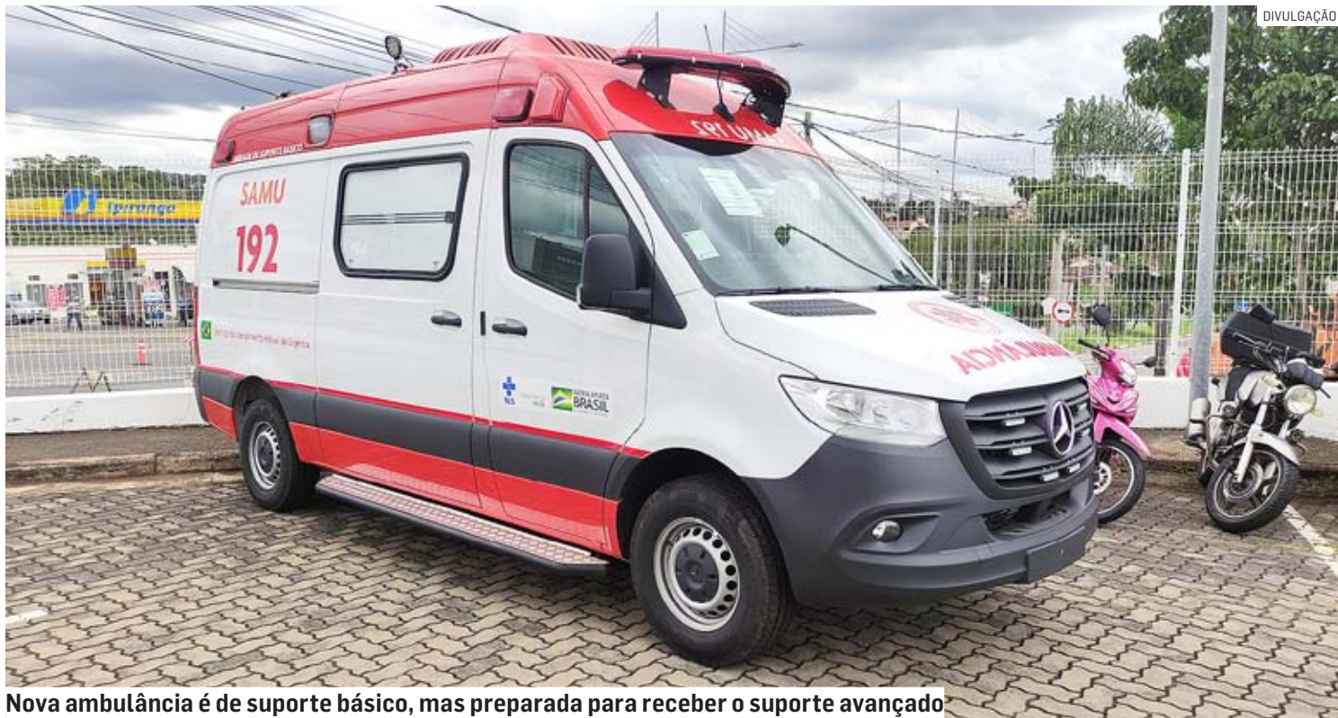
Nova ambulância é de suporte básico, mas preparada para receber o suporte avançado