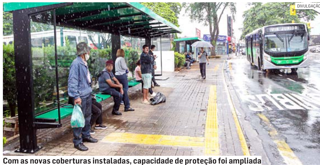
Com as novas coberturas instaladas, capacidade de proteção foi ampliada

Os abrigos instalados contam com piso tátil, espaço exclusivo para pessoas com deficiência, tomada USB, proteção atrás dos assentos e