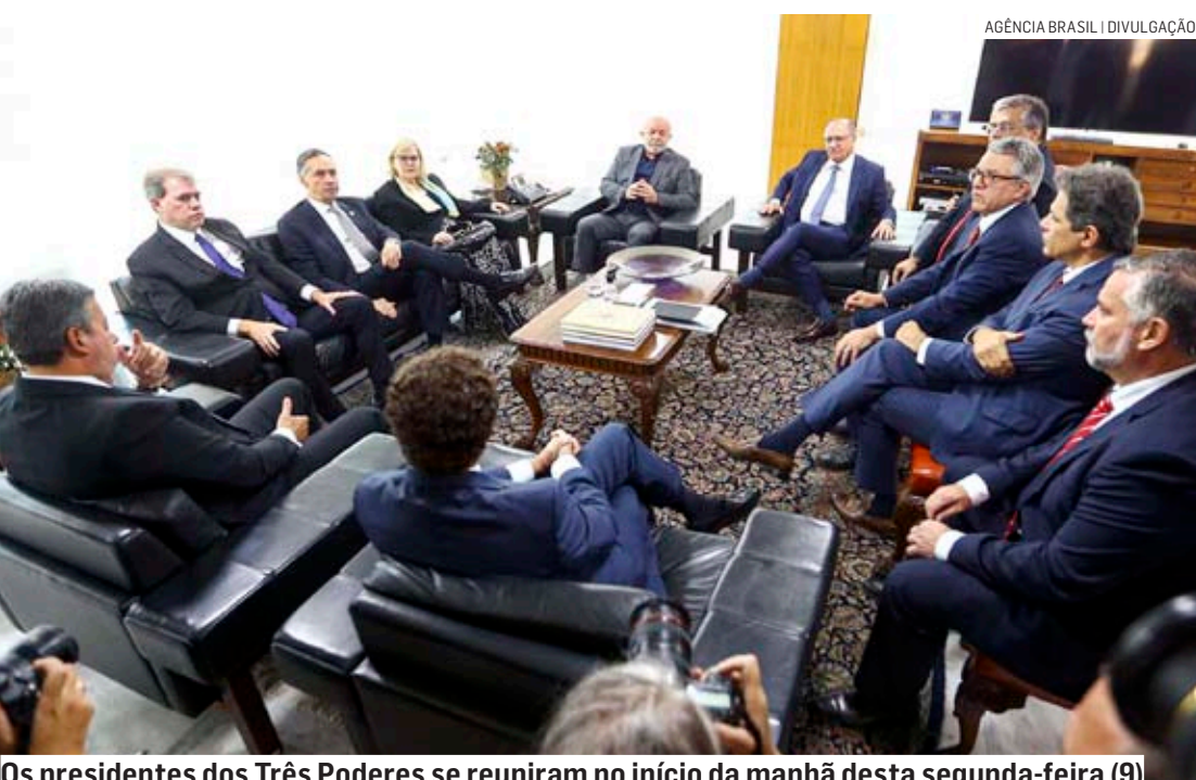
Os presidentes dos Três Poderes se reuniram no início da manhã desta segunda-feira (9)

Poderes se reuniram no início da manhã desta segunda-feira (9), depois que as sedes de Executivo, Legislativo e Judiciário foram invadidas na tarde de domingo (8) e depredadas por vândalos e pessoas que não aceitam o resultado das eleições do ano passado e pedem um golpe militar no país. Também participaram o ministro da Defesa, José Múcio, e o ministro da Secretaria de Comunicação Social da Presidência, Paulo Pimenta, além dos ministros do STF Luís Roberto Barroso e Dias Toffoli.