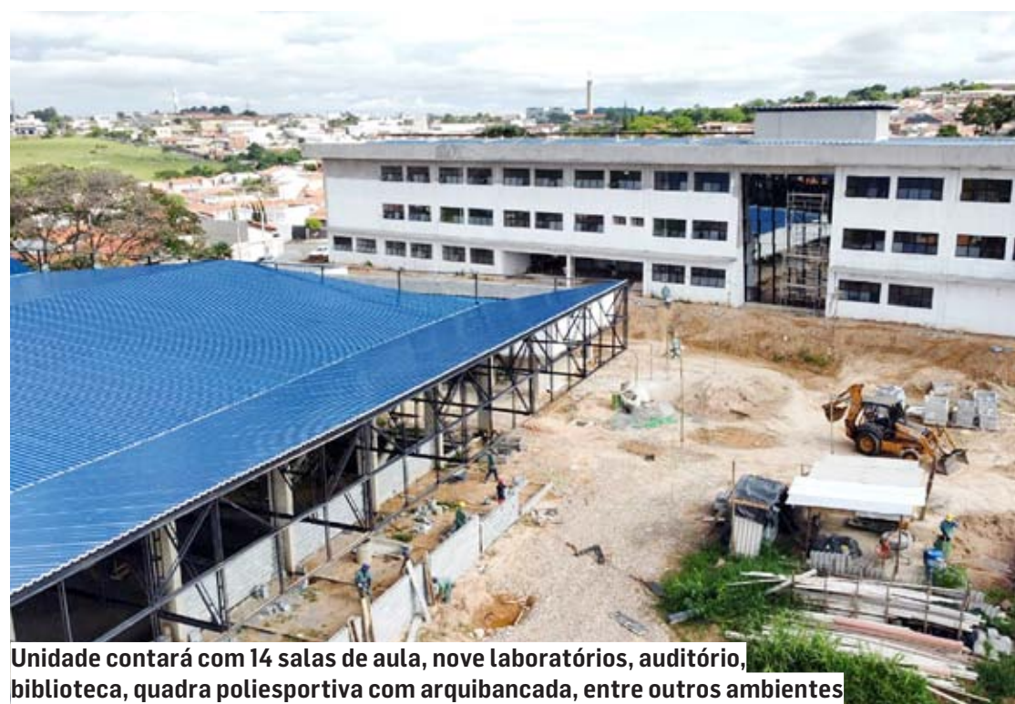
Unidade contará com 14 salas de aula, nove laboratórios, auditório, biblioteca, quadra poliesportiva com arquibancada, entre outros ambientes

A unidade contará com 14 salas de aula, nove la-