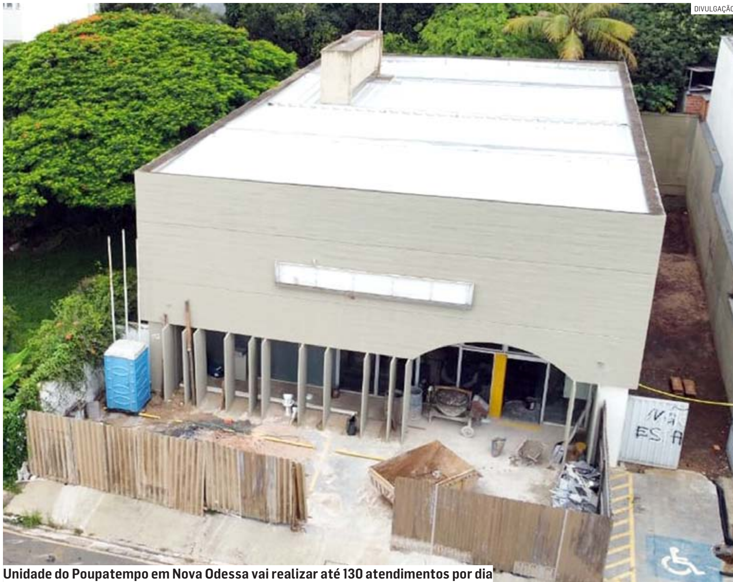
Unidade do Poupatempo em Nova Odessa vai realizar até 130 atendimentos por dia

“Estamos muito contentes por trazer a unidade do Poupatempo para nossa cidade, o que vai facilitar para a nossa população que antes tinha que se deslocar até