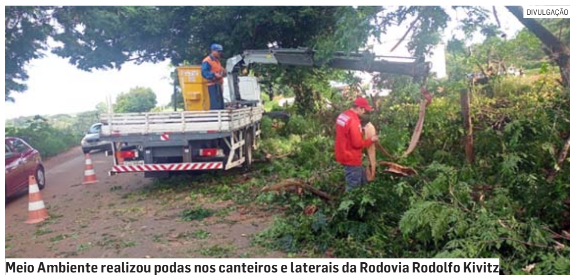
Meio Ambiente realizou podas nos canteiros e laterais da Rodovia Rodolfo Kivitz

Da Redação | NOVA ODESSA tribunaliberal@tribunaliberal.com.br