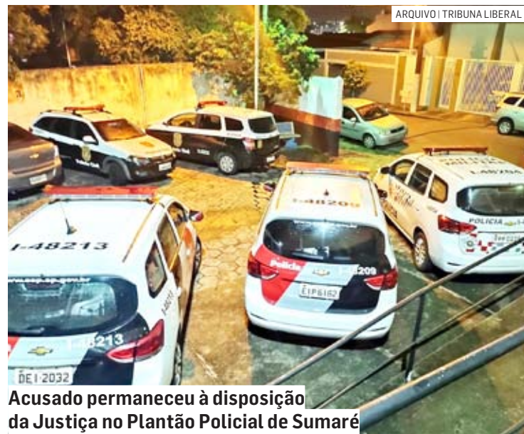
Acusado permaneceu à disposição da Justiça no Plantão Policial de Sumaré

César Oliveira | SUMARÉ tribunaliberal@tribunaliberal.com.br