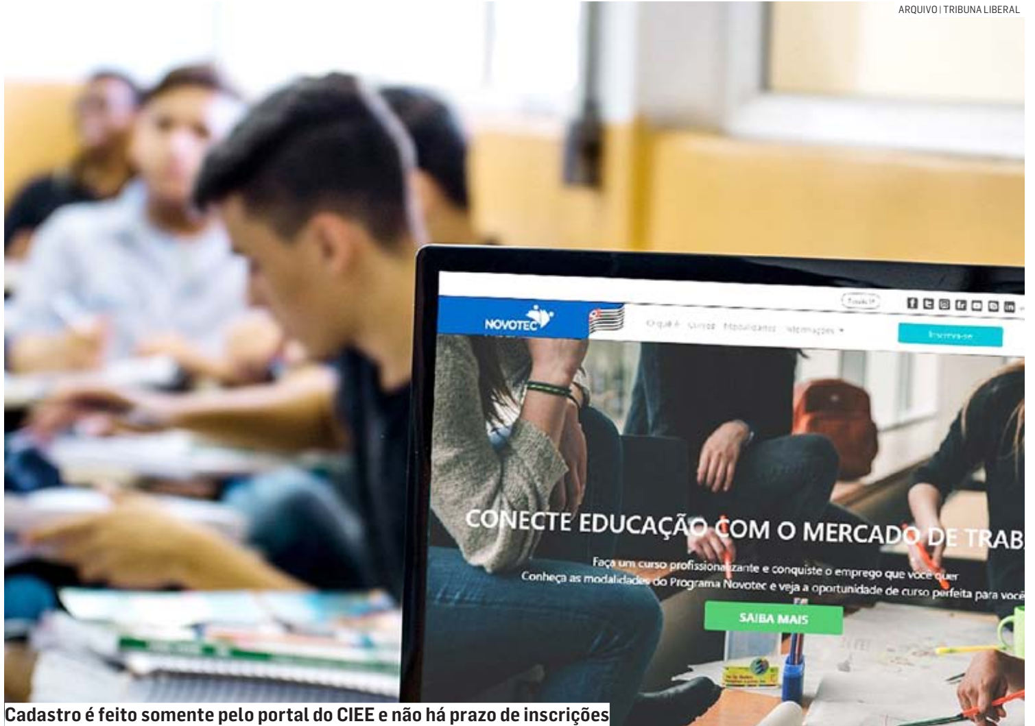
Cadastro é feito somente pelo portal do CIEE e não há prazo de inscrições

Já as empresas que desejam cadastrar suas vagas devem acessar portal. ciece.org.br/novotec/empresas . Apenas nesse endereço as empresas poderão admitir um estagiário Novotec sem custo algum com a contratação.