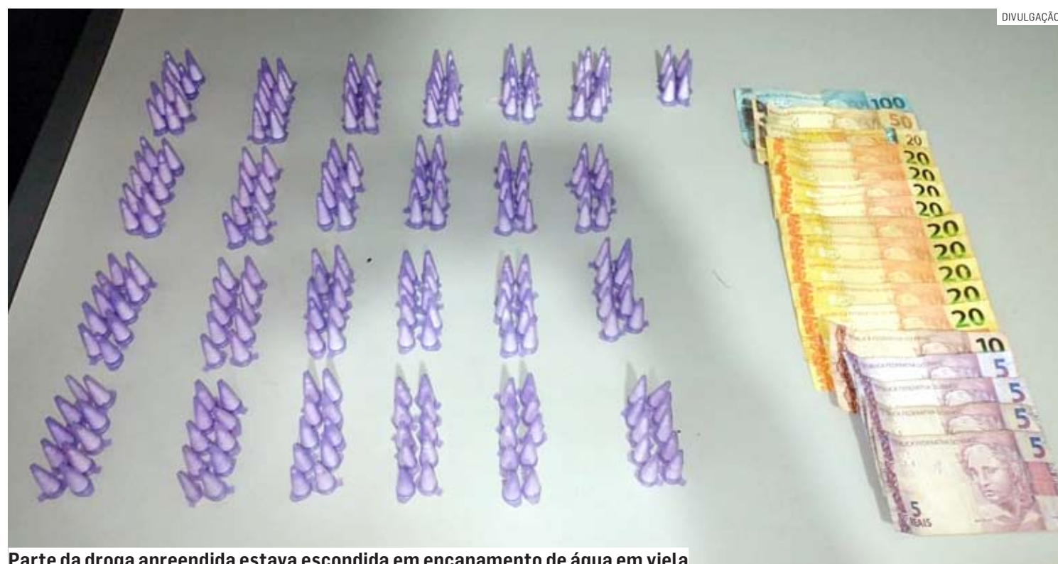
Parte da droga apreendida estava escondida em encanamento de água em viela

César Oliveira | HORTOLÂNDIA tribunaliberal@tribunaliberal.com.br