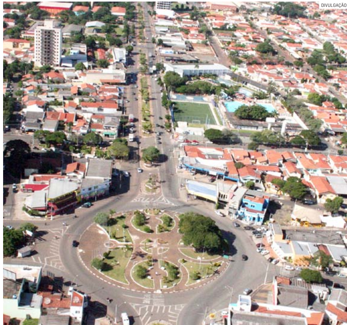
Sumaré é uma das cidades que participaram da pesquisa do Creci

Segundo o levantamento, 60% das propriedades vendidas em novembro estavam situadas na periferia, 17,8% nas áreas nobres e 22,2% nas regiões centrais. Com relação às modalidades de venda, 34,6% foram financiadas pela Caixa e 5,8% por outros bancos, 30,8%