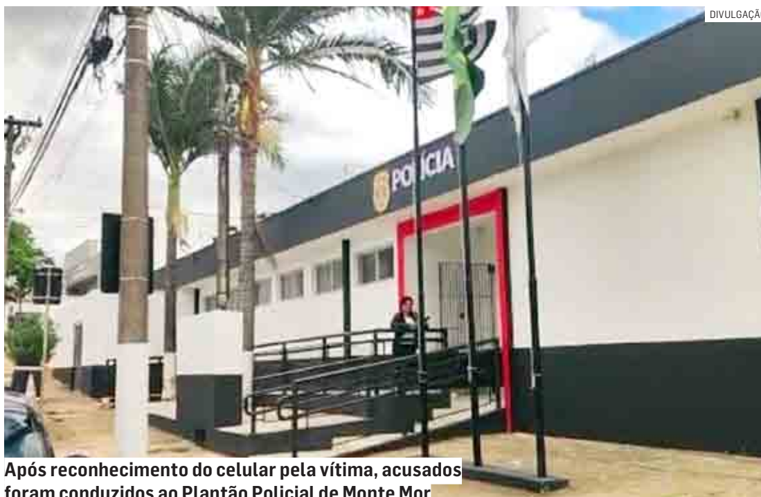
Após reconhecimento do celular pela vítima, acusados foram conduzidos ao Plantão Policial de Monte Mor

A Polícia Militar da 4ª Companhia foi acionada e passou a fazer patrulhamento com vistas ao veículo Ford/Fiesta, roubado por três indivíduos utilizando arma de fogo no bairro Chácaras Assay, em Hortolândia. Além do carro, eles sub-