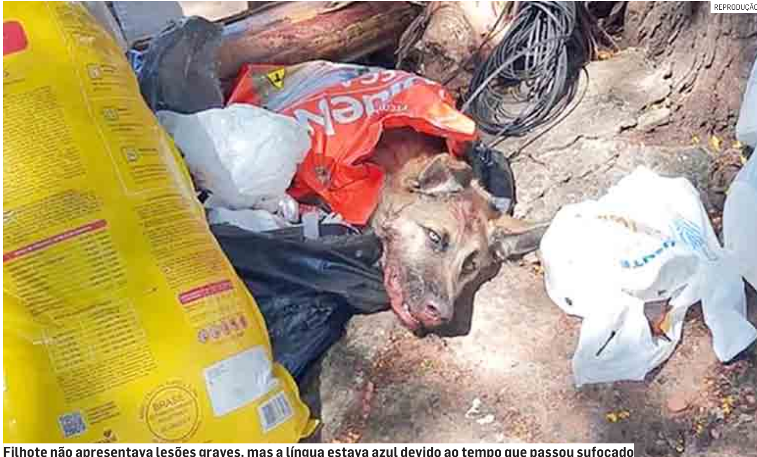
Filhote não apresentava lesões graves, mas a língua estava azul devido ao tempo que passou sufocado

O pastor alemão estava em estado de choque. Ele foi encontrado por uma moradora quando ela deixava o seu lixo em uma lixeira comunitária na Rua Eduardo Leeking. Foi neste momento que a moradora notou movimento em um saco de ração laranja, que foi deixado próximo ao local, e viu a sacola mexendo. Populares acionaram a Vigilância em Zoonoses e a Guarda Municip