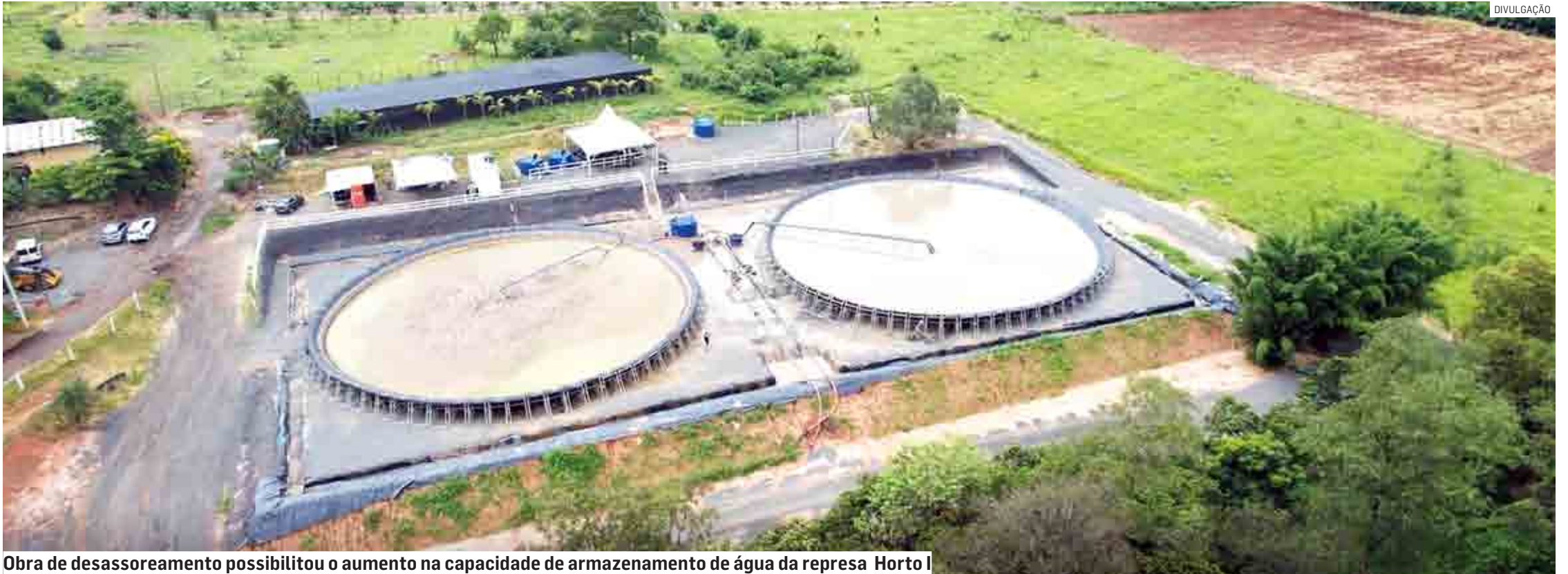
Obra de desassoreamento possibilitou o aumento na capacidade de armazenamento de água da represa Horto I

Concessionária concorre com o projeto de desassoreamento da represa Horto I, em Sumaré, que beneficiou 80 mil moradores