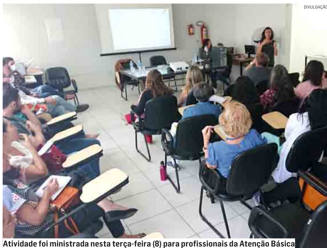
Atividade foi ministrada nesta terça-feira (8) para profissionais da Atenção Básica

Na capacitação, ministrada por profissionais do CAISM (Centro