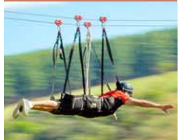
Salto de Pirapora PÁGINA 10

◆ SUMARÉ (CENTRO | NOVA VENEZA | PICERNO | MARIA ANTONIA | ÁREA CURA | MATÃO) ◆ HORTOLÂNDIA ◆ NOVA ODESSA ◆ MONTE MOR ◆ ELIAS FAUSTO ◆ PAULÍNIA ◆