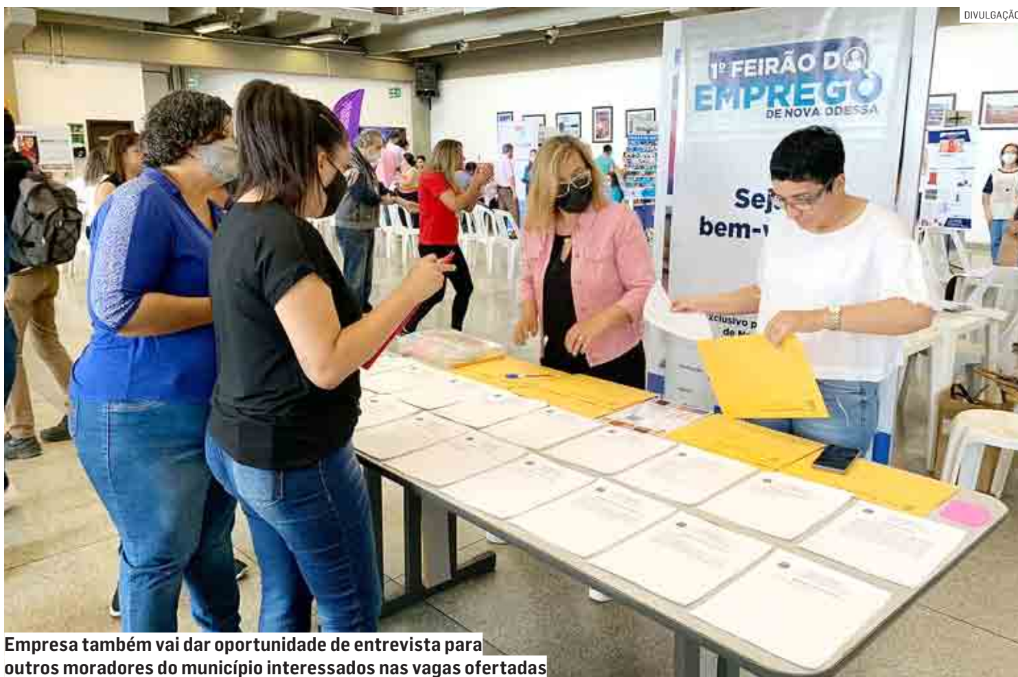
Empresa também vai dar oportunidade de entrevista para outros moradores do município interessados nas vagas ofertadas

O departamento de RH (Recursos Humanos) da empresa já es-