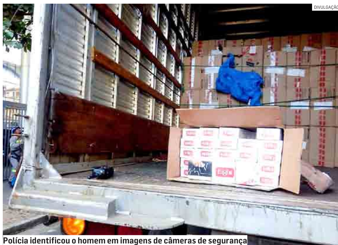
Polícia identificou o homem em imagens de câmeras de segurança

Segundo a polícia, no ano passado, o homem trabalhou na empresa que foi alvo dos crimi-