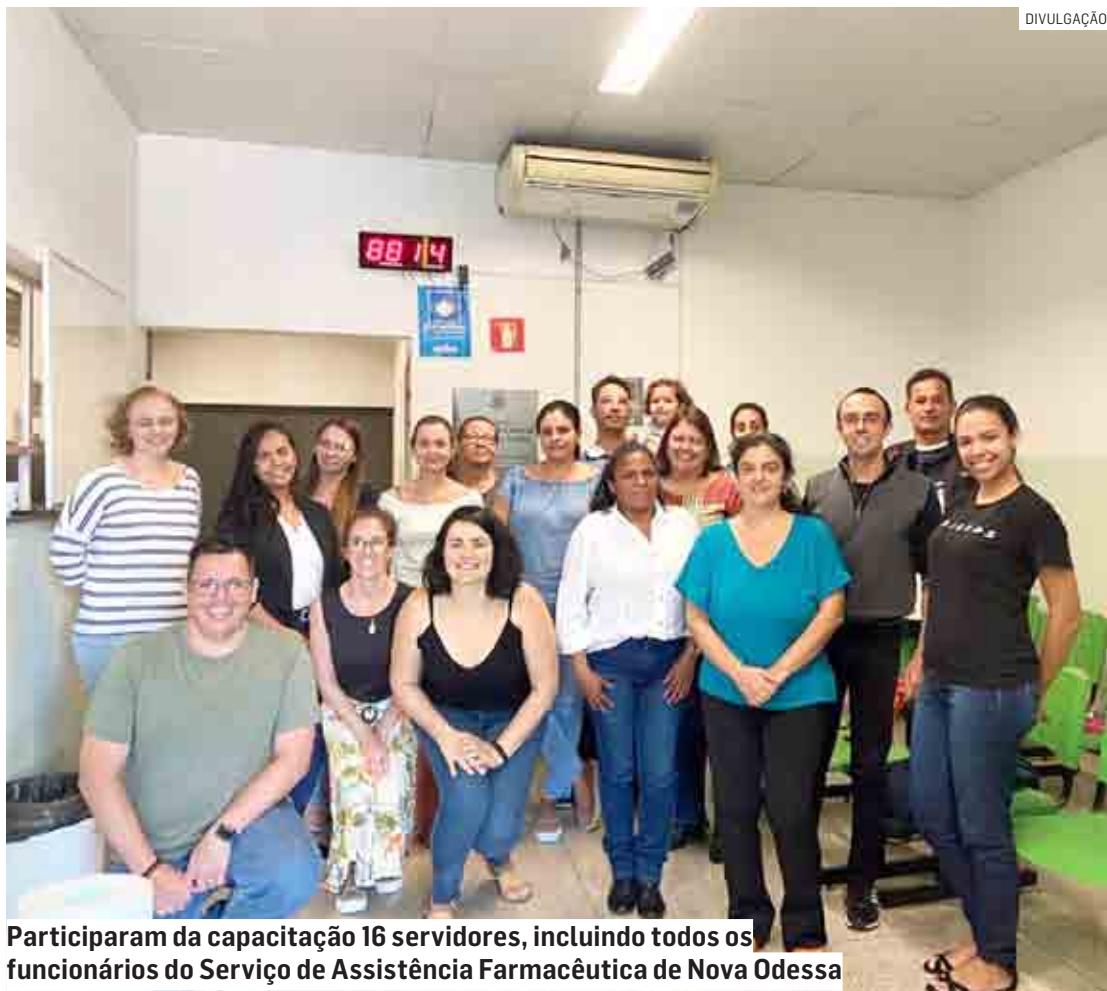
Participaram da capacitação 16 servidores, incluindo todos os funcionários do Serviço de Assistência Farmacêutica de Nova Odessa