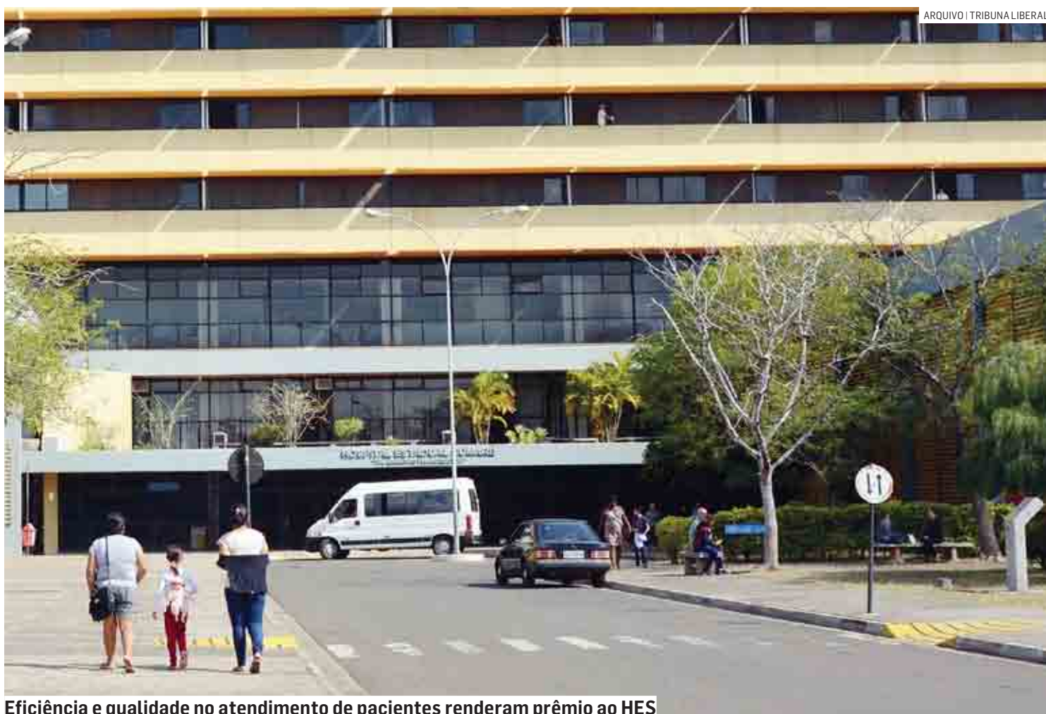
Eficiência e qualidade no atendimento de pacientes renderam prêmio ao HES

Ainda estão na lista dos melhores hospitais o Instituto do Câncer do Estado de São Paulo, Hospital Estadual Vila Alpina, Hospital de