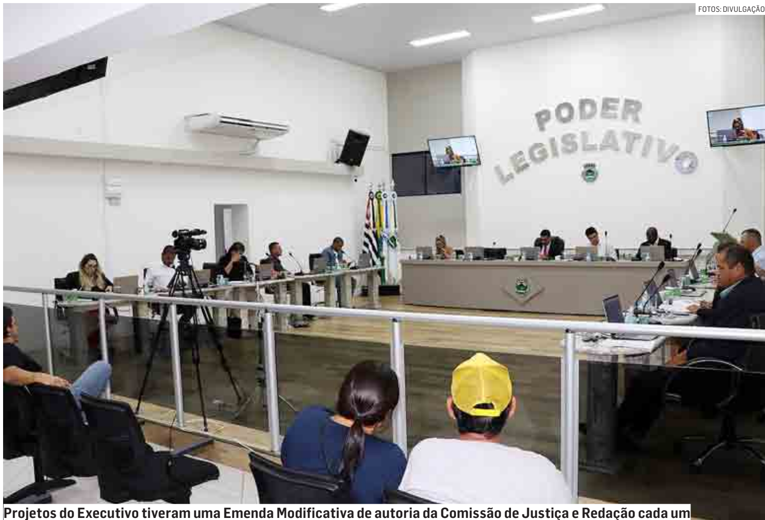
Projetos do Executivo tiveram uma Emenda Modificativa de autoria da Comissão de Justiça e Redação cada um