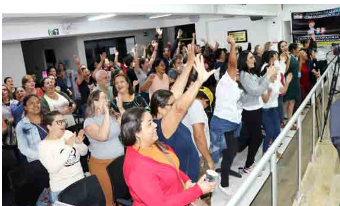
Cuidadores comemoram aprovação de projeto de redução de carga horária pelos vereadores

Também foram aprovadas, por unanimidade, duas Emendas Modificativas de iniciativa da Comissão de Justiça e Redação (CJR), com adequações no texto.