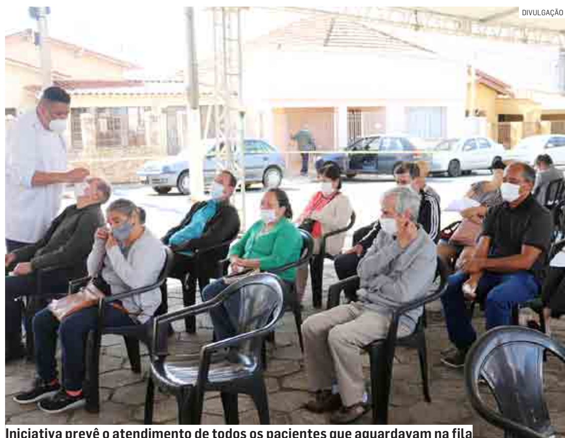
Iniciativa prevê o atendimento de todos os pacientes que aguardavam na fila

Segundo a prefeitura, em breve a ação levará a mesma triagem de atendimento com avaliações de patologias oftalmológicas para acolhimento na UPA (Unidade de Pronto Atendimento) do Jardim Paulista.