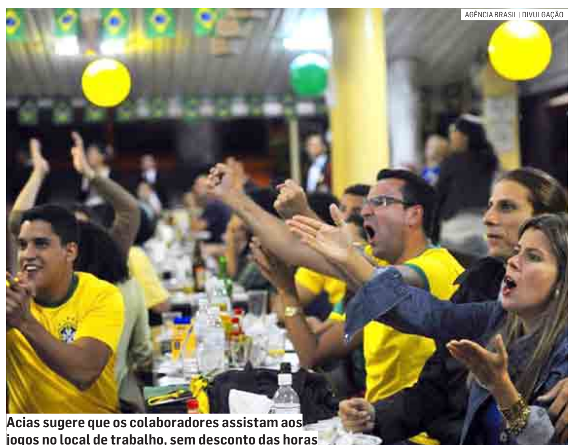
Acias sugere que os colaboradores assistam aos jogos no local de trabalho, sem desconto das horas

Quando os jogos forem às 13h, a sugestão da Acias é que os colaboradores assistam aos jogos no local de trabalho, sem desconto das horas. Os estabelecimentos fecham durante a partida, reabrindo logo após o encerramento do jogo. Quando os jogos forem às 16h, a sugestão é liberar os funcionários às 15h e fazer um acordo para pagamentos das horas.