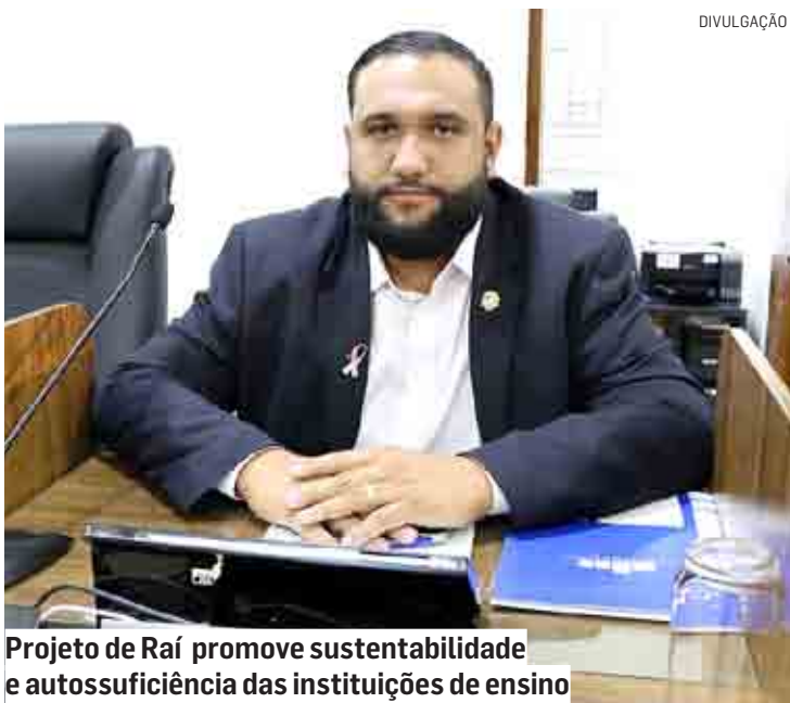
Projeto de Rai promove sustentabilidade e autossuficiência das instituições de ensino