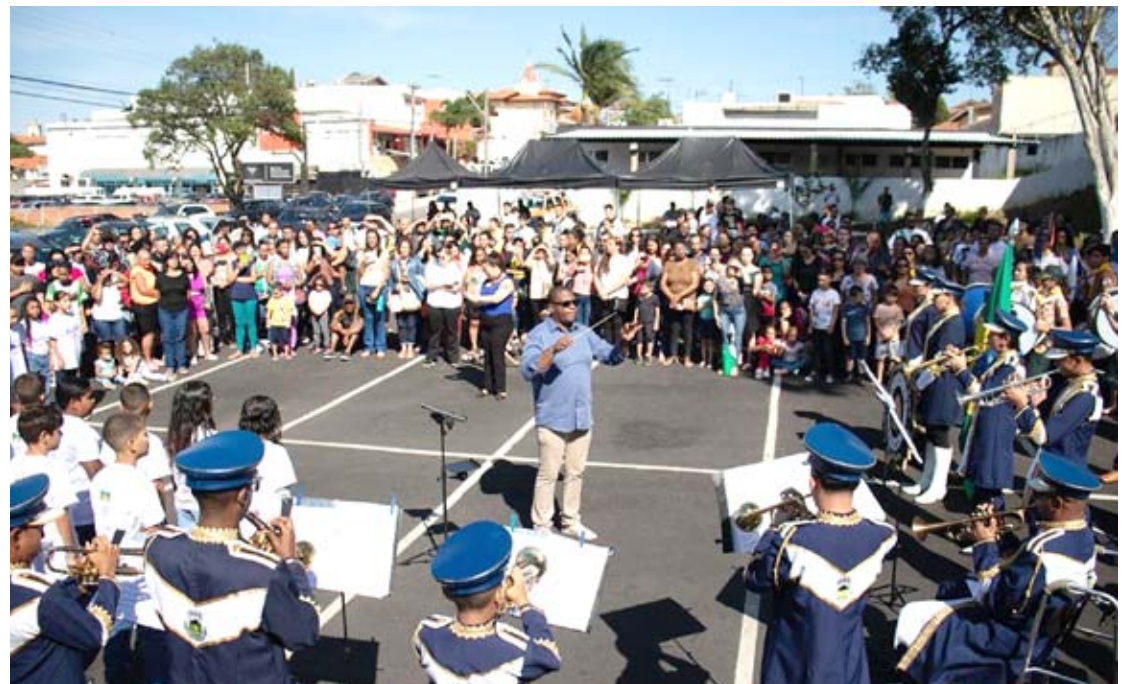
Bandas de Monte Mor emocionaram o público durante o Desfile Cívico realizado este ano