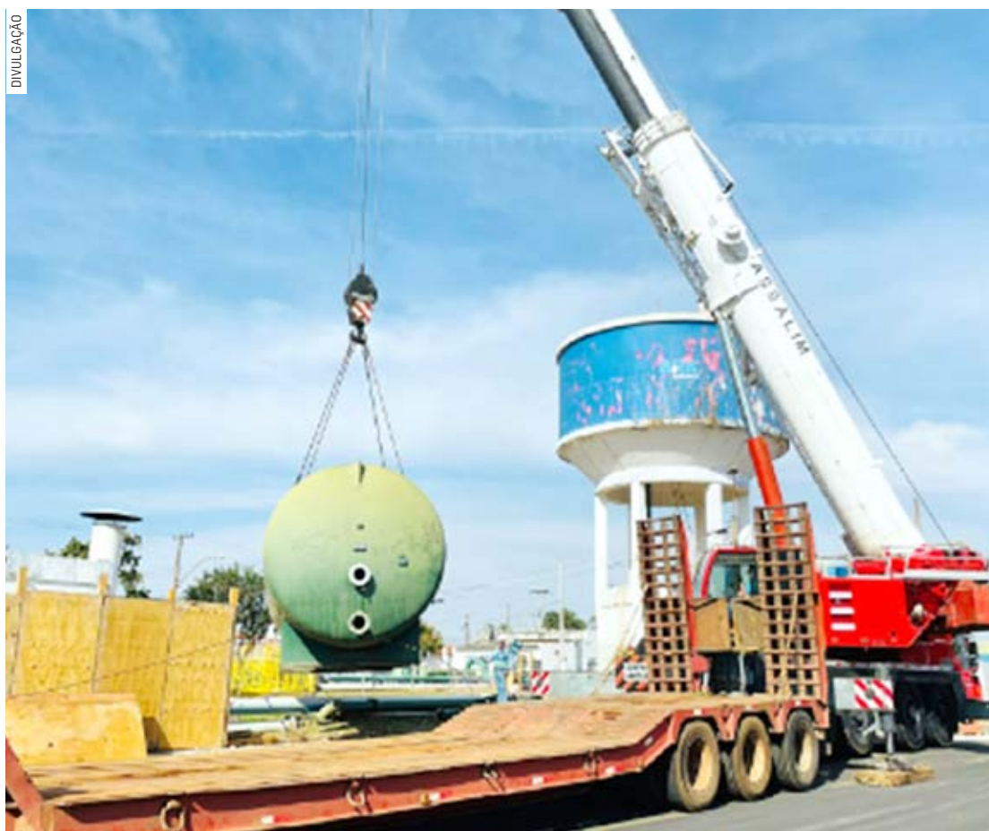
Ao longo da obra podem ocorrer interrupções pontuais no abastecimento, avisa BRK

Quando finalizada, a intervenção vai beneficiar cerca de 82 bairros, 45 mil