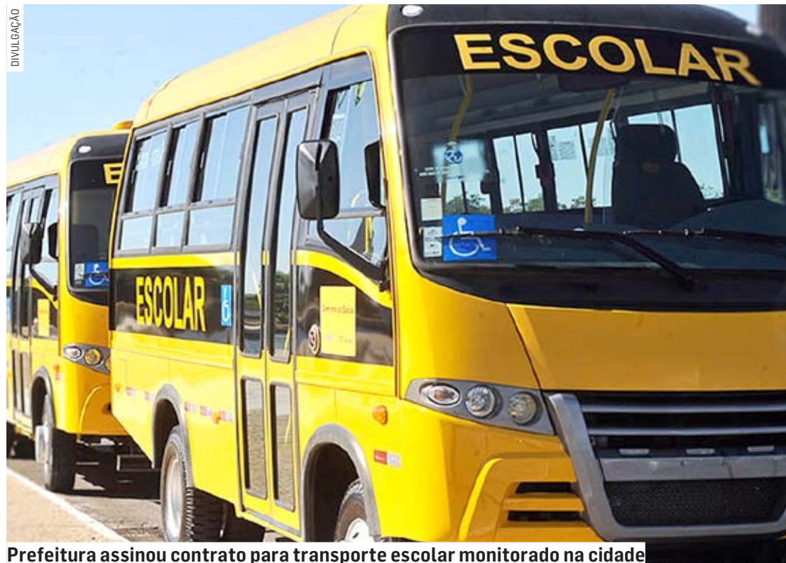
Prefeitura assinou contrato para transporte escolar monitorado na cidade

O processo de licitação que resultou na assinatura do contrato foi realizado através de prego presencial.