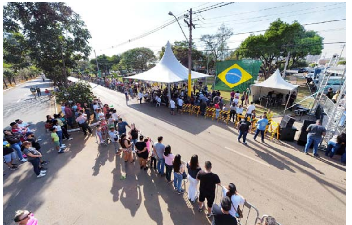
População de Nova Odessa compareceu ao Jardim Marajoara para celebrar a Independência