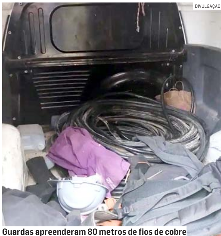
Guardas apreenderam 80 metros de fios de cobre

O autor confessou que teria trocado as placas.