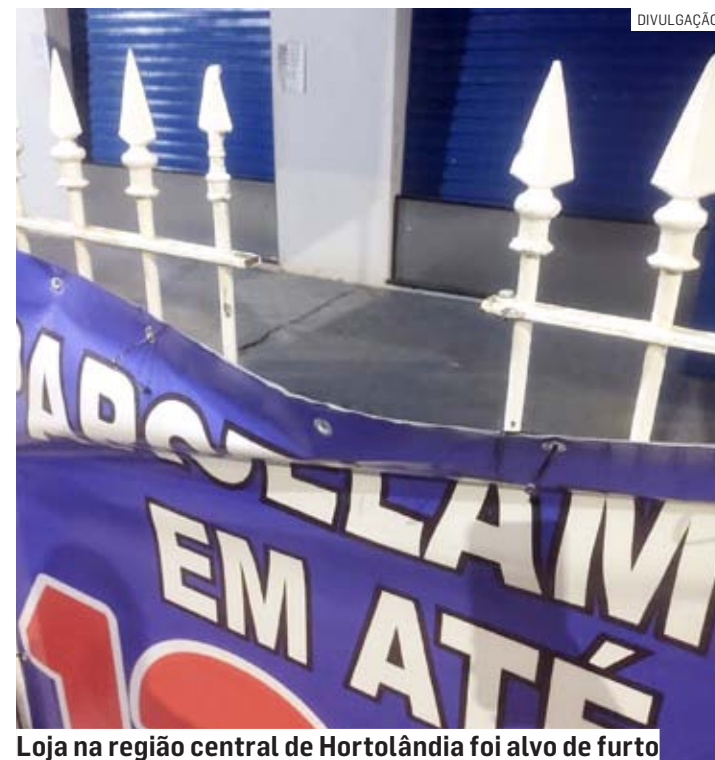
Loja na região central de Hortolândia foi alvo de furto

Os guardas fizeram contato com o comerciante, que confirmou que as tábuas pertenciam a seu comércio. Em consulta ao monitoramento interno da