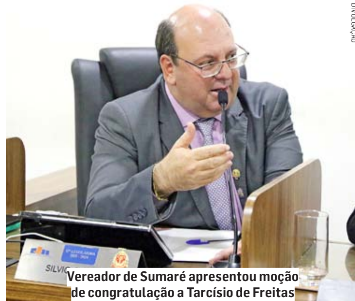
Vereador de Sumaré apresentou moção de congratulação a Tarcísio de Freitas

“A decisão de complementar os valores repassados pelo Ministério da Saúde aos hospitais, beneficiando as Santas Casas, entidades filantrópicas e autárquicas é um passo significativo em direção a uma assistência mais eficiente e justa. Reconhecemos o esforço do governo em assegurar que os procedimentos hospitalares sejam remunerados de maneira adequada, permitindo a retomada de operações e tratamentos essenciais que muitas vezes eram adiados devido a questões financeiras”, salienta o parlamentar.