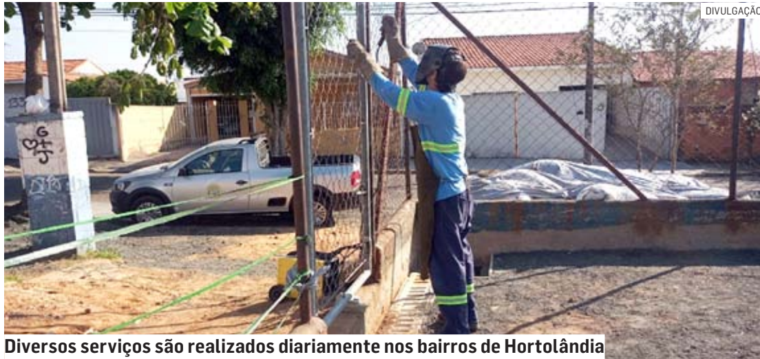
Diversos serviços são realizados diariamente nos bairros de Hortolândia

“A prevenção evita enxurradas, por exemplo. Mesmo com o tempo mais seco, chuvas fortes podem atingir a cidade e causar prejuízos. Também já estamos nos preparando para o período mais chuvoso”, explica o secretário-adjunto de Serviços Urbanos, Mar-