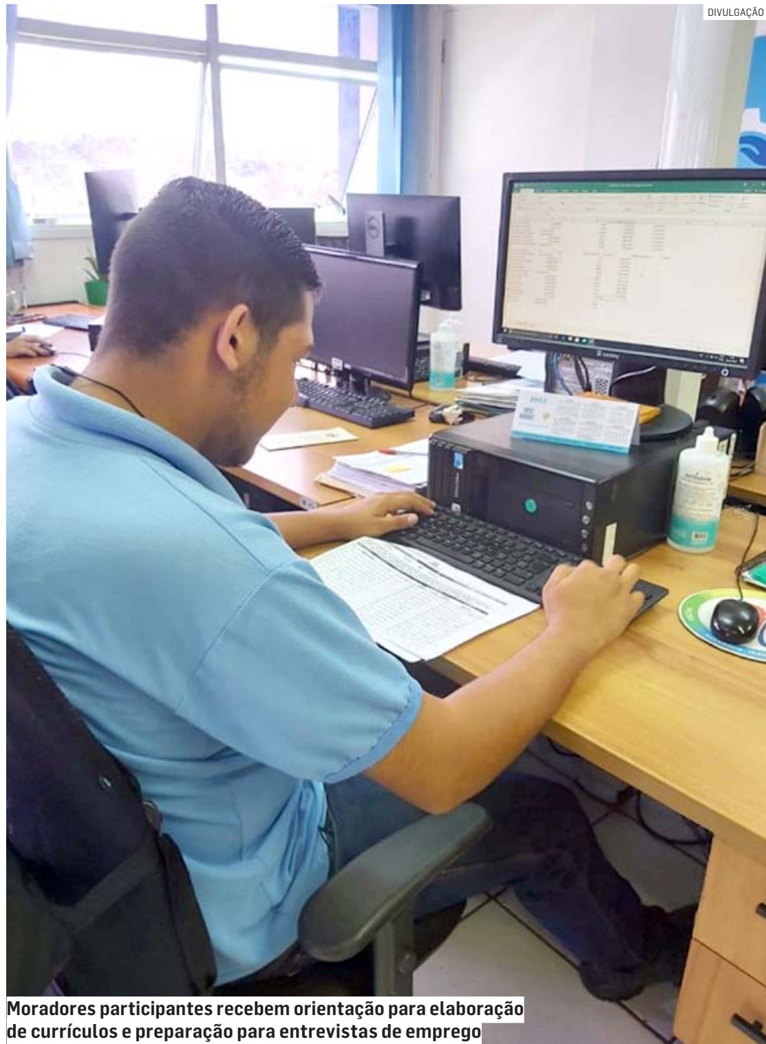
Moradores participantes recebem orientação para elaboração de currículos e preparação para entrevistas de emprego

Programa Meu Emprego – Trabalho em Equipe prepara profissionais para o mercado de trabalho; desempregados há mais de três meses são foco da ação