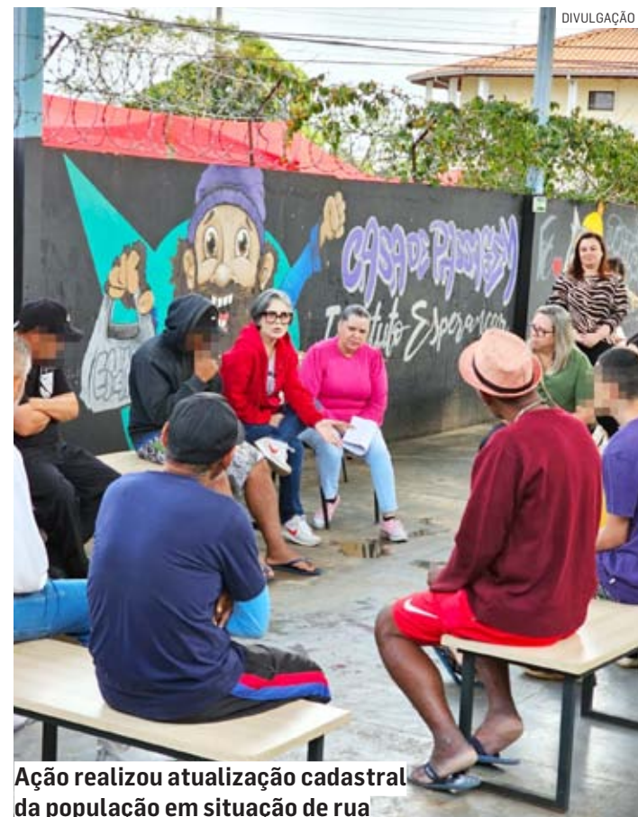
Ação realizou atualização cadastral da população em situação de rua

O principal objetivo da ação intersectorial foi promover acesso aos serviços públicos, como a atualização e inserção de novos Cadastros no CadÚnico (Bolsa Família), orientações sobre saúde mental e o uso de substâncias, distribuição de kits preventivos de IST (Infecções Sexualmente Transmissíveis) e kits de saúde bucal.