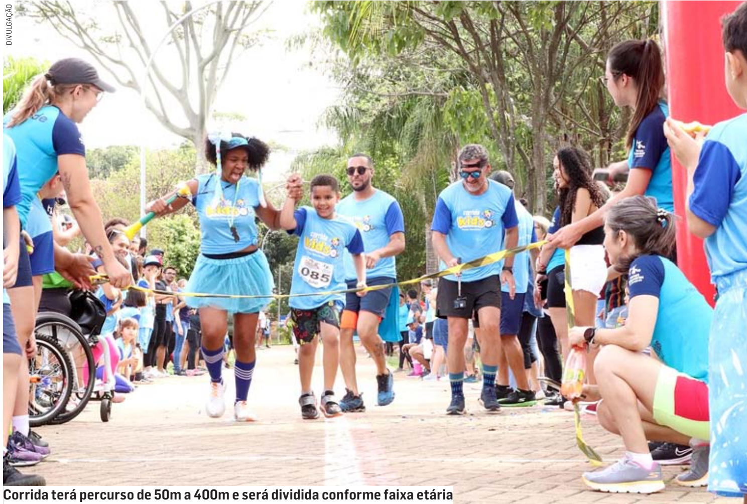
Corrida terá percurso de 50m a 400m e será dividida conforme faixa etária