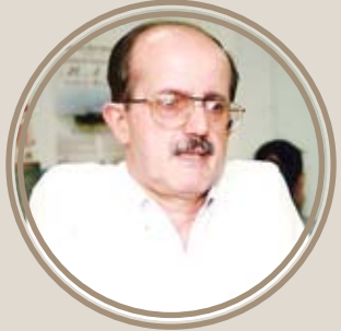
Francisco Antônio de Toledo