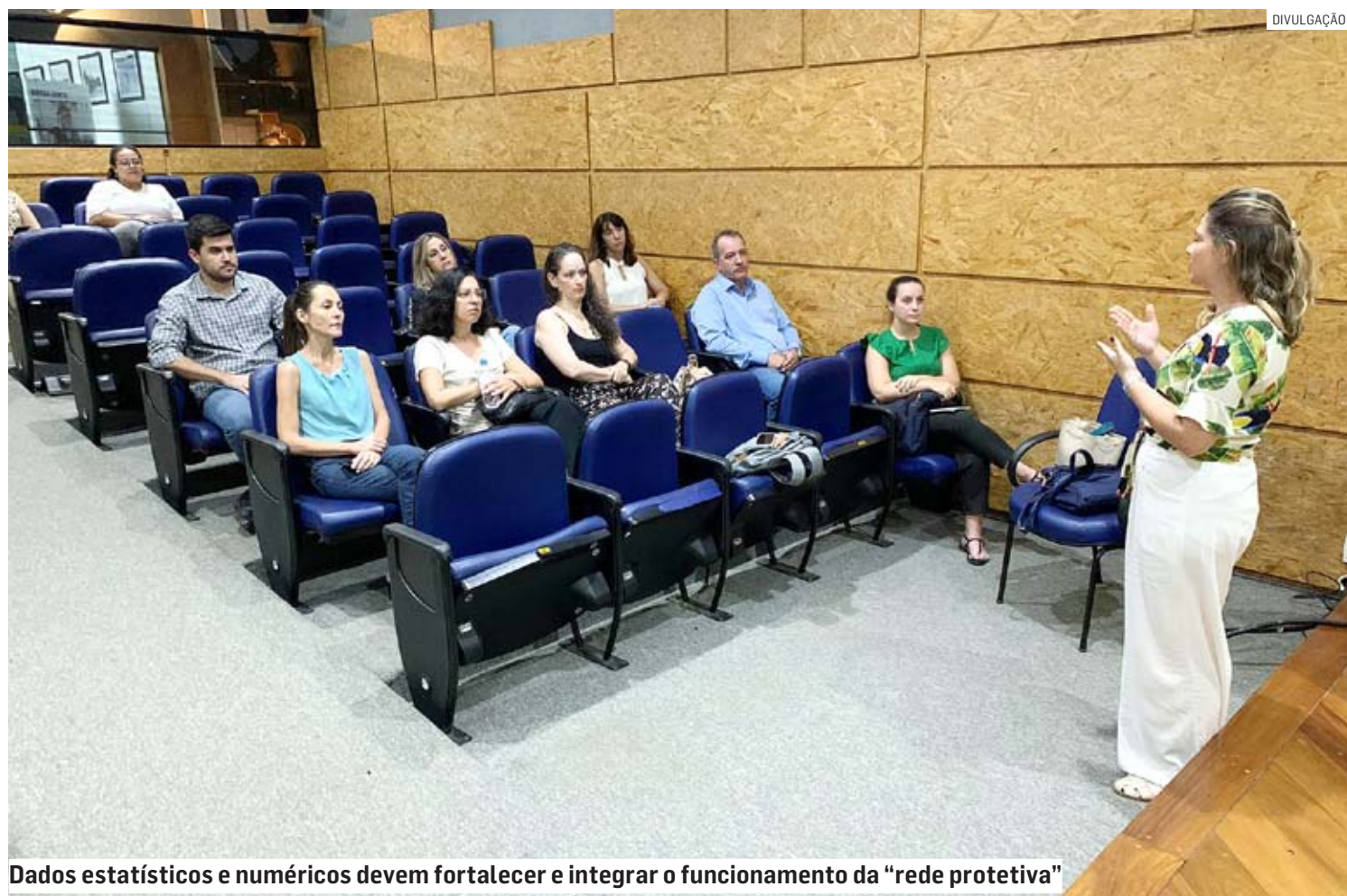
Dados estatísticos e numéricos devem fortalecer e integrar o funcionamento da “rede protetiva”

O “pacote” do Programa Municipal de Fortalecimento de Rede de Proteção inclui ainda a apresentação pela Maná, em breve, de um Plano de Ação Plurianual dos Direitos da Criança e do Adolescente, seguido por um novo Fluxo de Atendimento à Criança e ao Adolescente Vítimas ou Testemunhas de Violência e da formação de to-