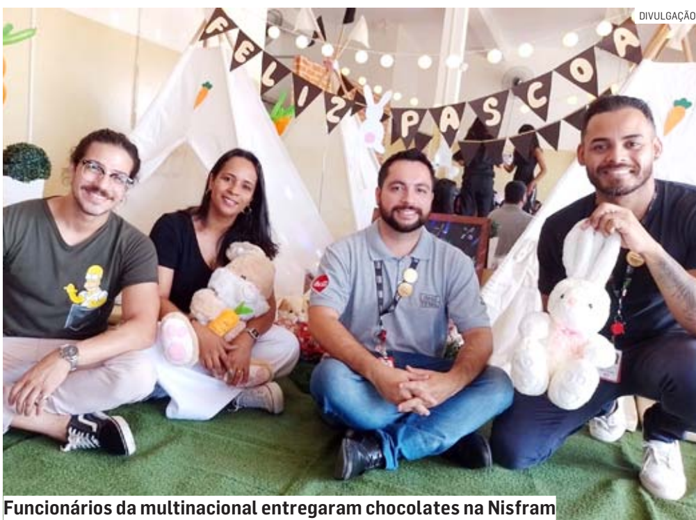
Funcionários da multinacional entregaram chocolates na Nisfram

Basta dar uma volta pelas cidades da região (Sumaré, Nova Odessa, Hortolândia, Monte Mor e Paulínia) para perceber uma cena comum nos municípios: fios de distribuição de energia, Internet, TV a cabo e telefonia soltos nos postes.