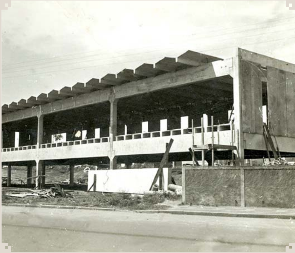
Foto da atual Estação Rodoviária de Sumaré, ainda em construção, localizada na Avenida Júlia de Vasconcellos Bufarah. Ela foi inaugurada no dia 18 de março de 1979.