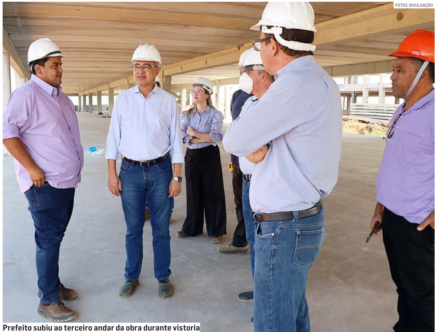
Prefeito subiu ao terceiro andar da obra durante vistoria

A usina deverá produzir energia suficiente para abastecer o novo Paço. A produção excedente será transmitida à rede elétrica da CPFL (Companhia Paulista de Força e Luz) para compensações futuras. A Secretaria de Planejamento Urbano e Gestão Estratégica salienta que com a usina haverá redução da