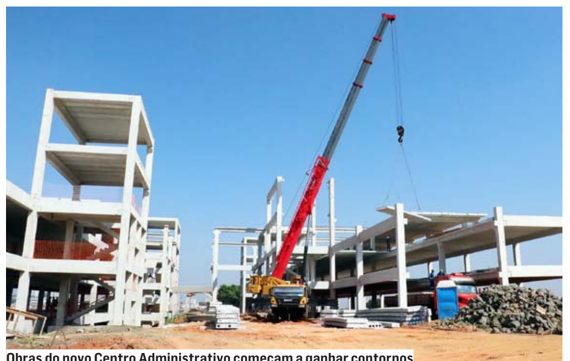
Obras do novo Centro Administrativo começam a ganhar contornos