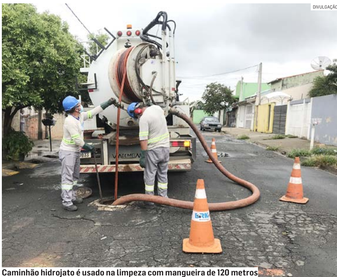
Caminhão hidrojetado é usado na limpeza com mangueira de 120 metros

A execução do trabalho, explicou a BRK, reflete diretamente na redução dos casos de entupimentos de redes na cidade. No primeiro bimestre