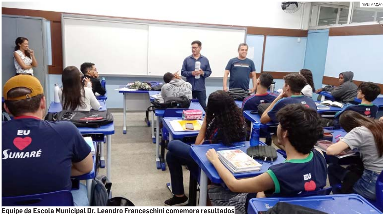
Equipe da Escola Municipal Dr. Leandro Franceschini comemora resultados

Segundo informações do governo estadual, alunos do ensino médio da unidade obtiveram 281,5 em língua portuguesa, 288,1 em matemática e 288,9 em ciências. Enquanto isso, a rede estadual, por exem-