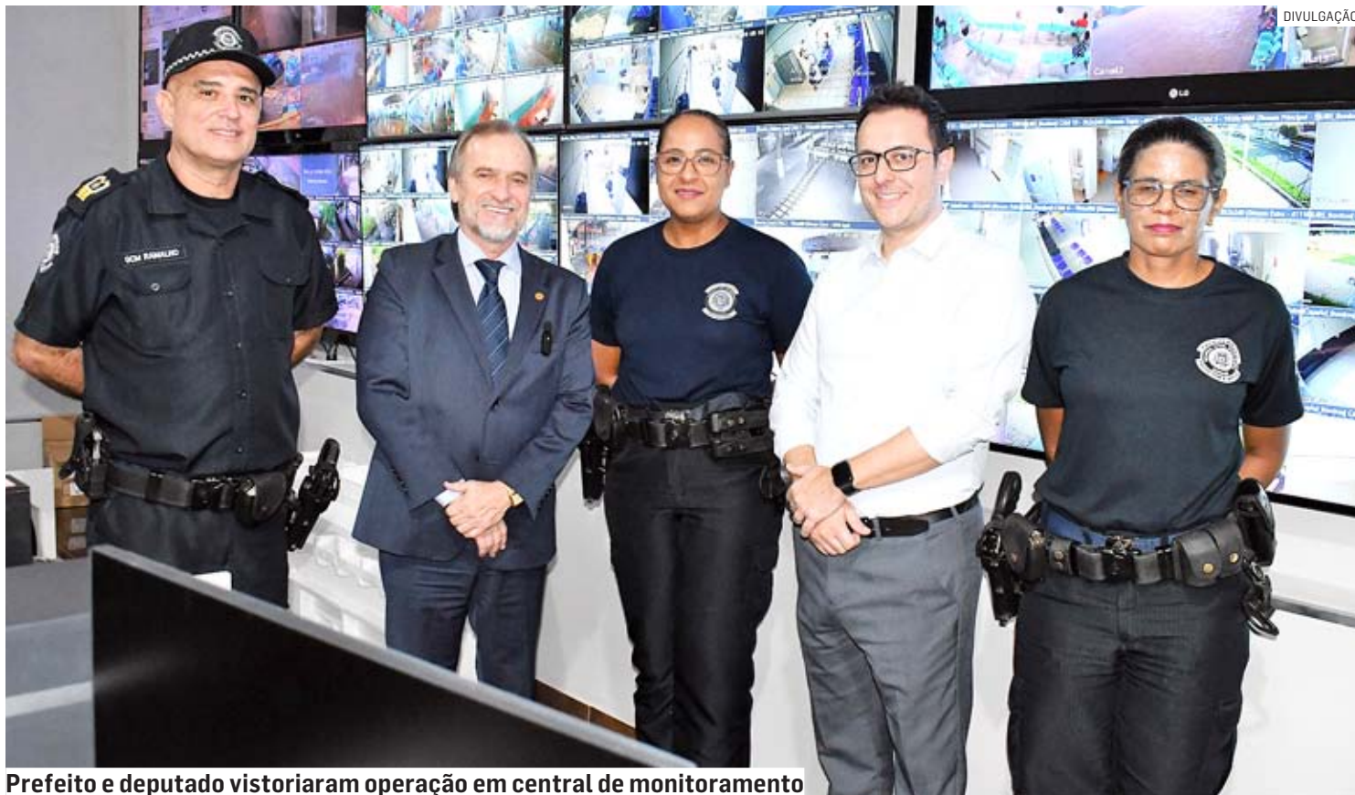
Prefeito e deputado visitaram operação em central de monitoramento

Nesta semana, seis novos veículos foram integrados à frota da Guarda Municipal de Sumaré e outros três estão em preparação. “Vamos reforçar o patrulhamento nas escolas de Sumaré e, claro, também combater a criminalidade. Segurança é uma prioridade aqui em Sumaré e por isso estamos equipando a