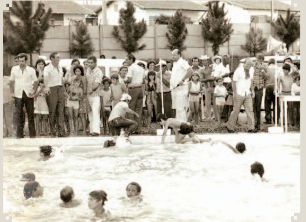
O Centro Esportivo “Vereador José Pereira” foi construído na gestão do Prefeito João Smânio Franceschini. A inauguração oficial aconteceu no dia 26 de julho de 1974, durante o mesmo governo. Na foto, vemos a entrega das piscinas ao público, acontecida logo após a inauguração do Centro. No centro, o prefeito Franceschini.