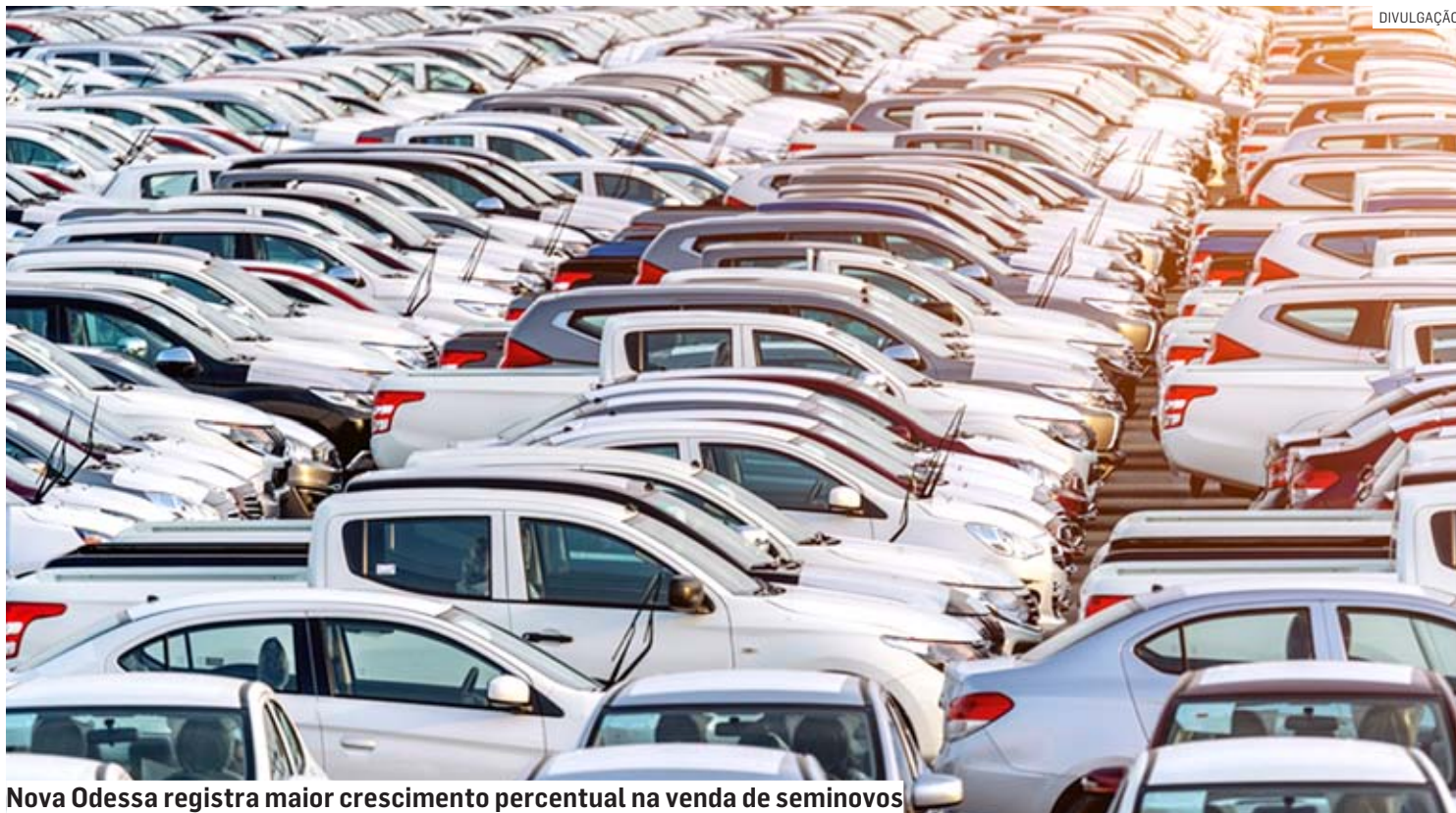
Nova Odessa registra maior crescimento percentual na venda de seminovos

Nova Odessa é a cidade que registrou o maior aumento percentual na venda de seminovos em