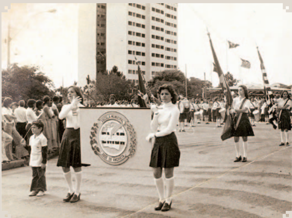
Registro fotográfico de um desfile da antiga Escola Normal, rebatizada mais tarde de “José de Anchieta”. É dos anos 1970, na Praça das Bandeiras. A Escola Normal de Sumaré funcionava no mesmo prédio do Colégio Comercial, na Praça da República. Foi criada por Decreto Municipal no dia 29 de agosto de 1967.