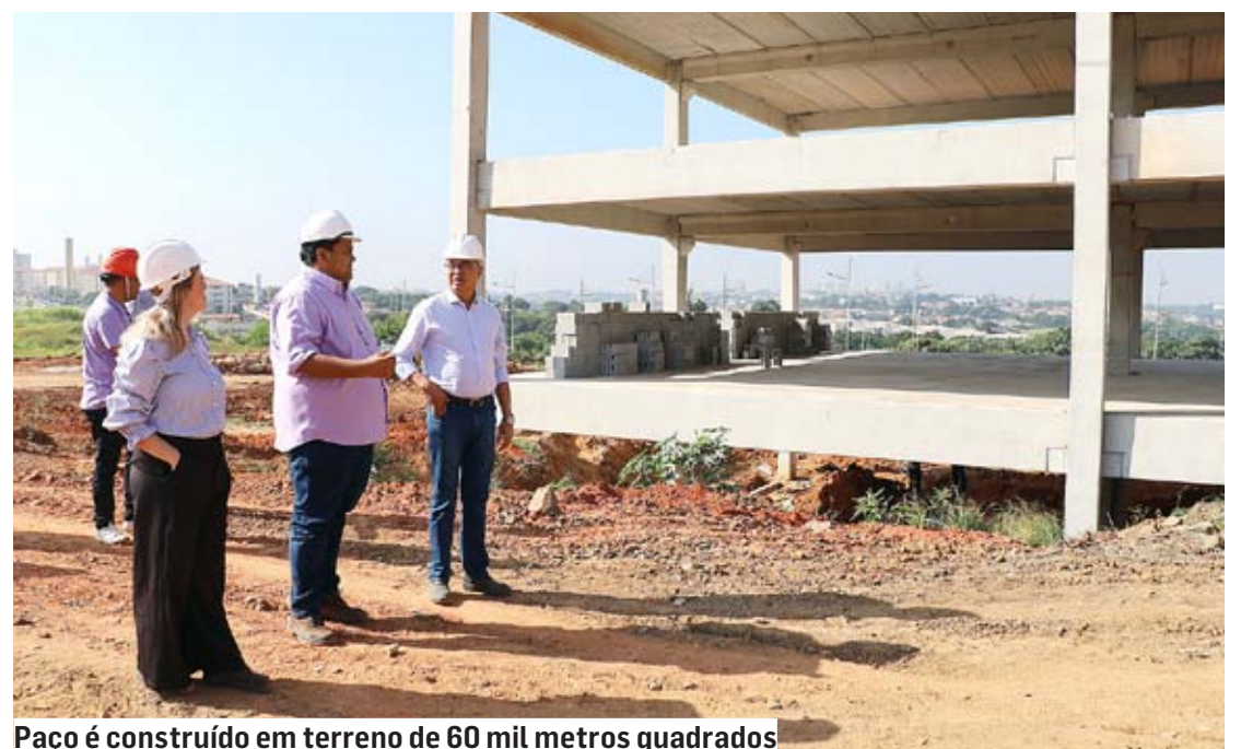
Paço é construído em terreno de 60 mil metros quadrados

Refleta hoje sobre as formas que você pode impactar positivamente a vida do seu filho. Quais marcas você escolhe deixar na próxima geração?