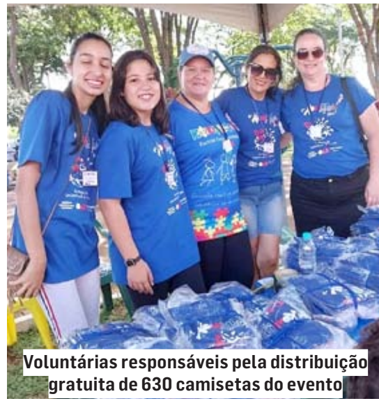
Voluntárias responsáveis pela distribuição gratuita de 630 camisetas do evento