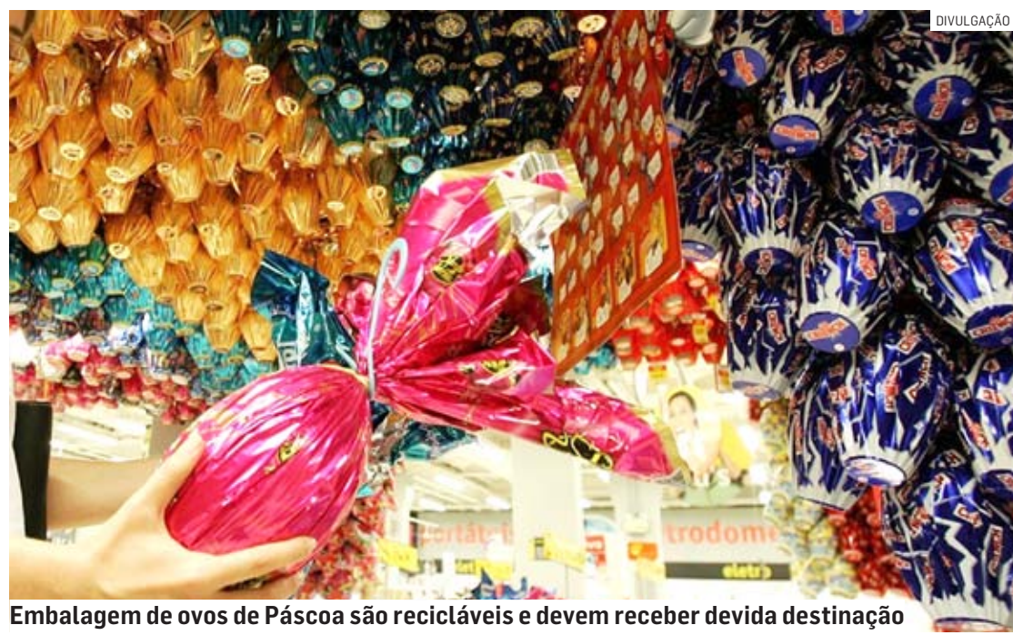
Embalagem de ovos de Páscoa são recicláveis e devem receber devida destinação

Da Redação | REGIÃO tribunaliberal@tribunaliberal.com.br