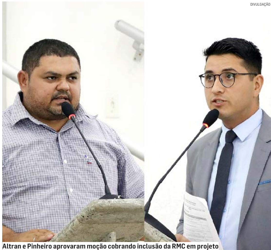
Altran e Pinheiro aprovaram moção cobrando inclusão da RMC em projeto