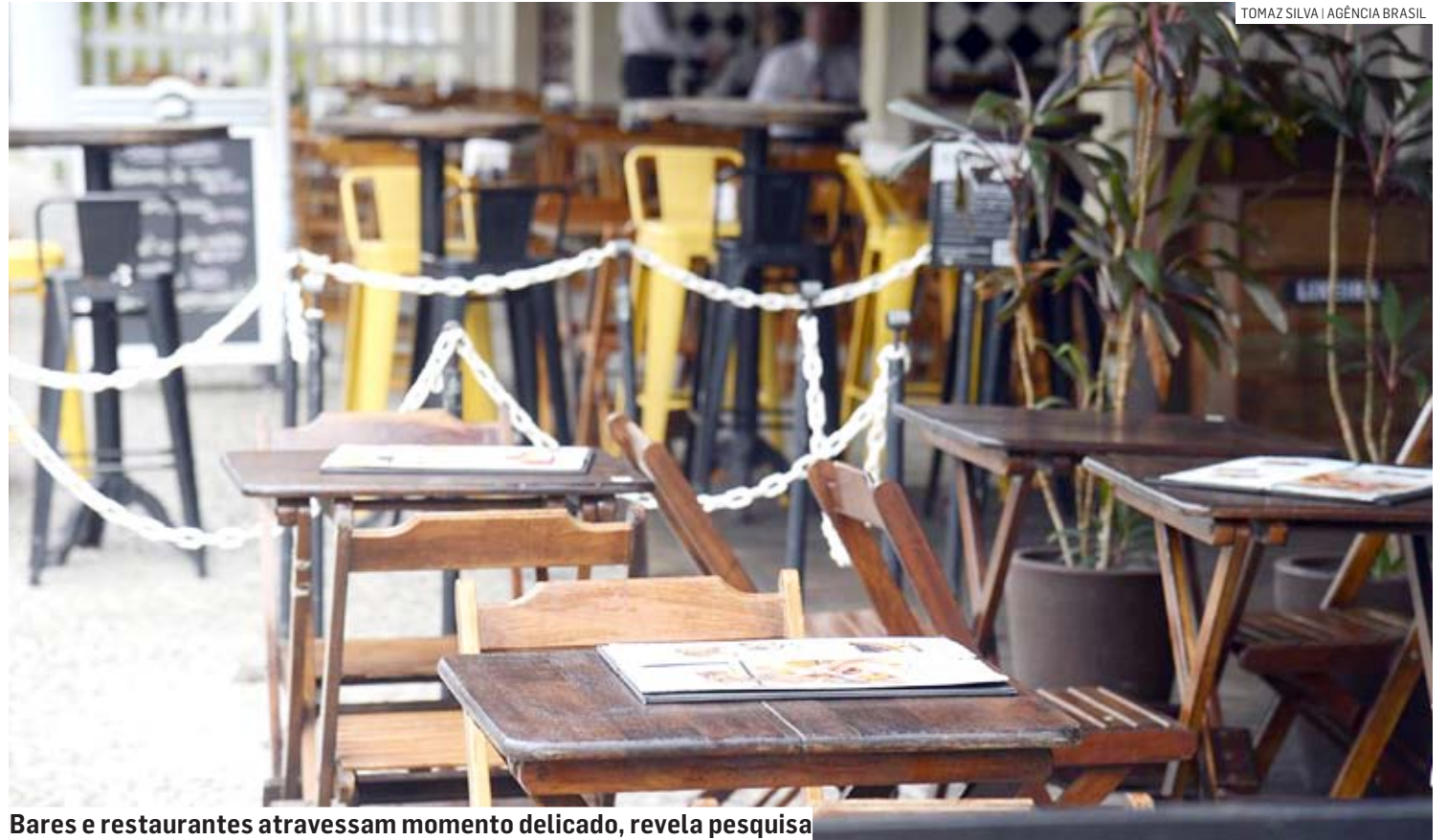
Bares e restaurantes atravessam momento delicado, revela pesquisa

A pesquisa, que ouviu 1513 empresários, também revelou que 68% dos bares e restaurantes têm empréstimos bancários contratados e a inadimplência é de 27% entre os que tomaram dinheiro de linhas regulares, um aumento de seis pontos percentuais em