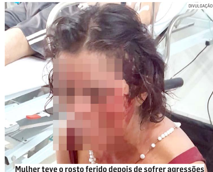
Mulher teve o rosto ferido depois de sofrer agressões

O acusado foi detido pelos guardas. A mulher, que apresentava ferimentos pelo rosto, foi encaminhada à UPA (Unidade de Pronto Atendimento) Nova Hortolândia, onde recebeu aten-