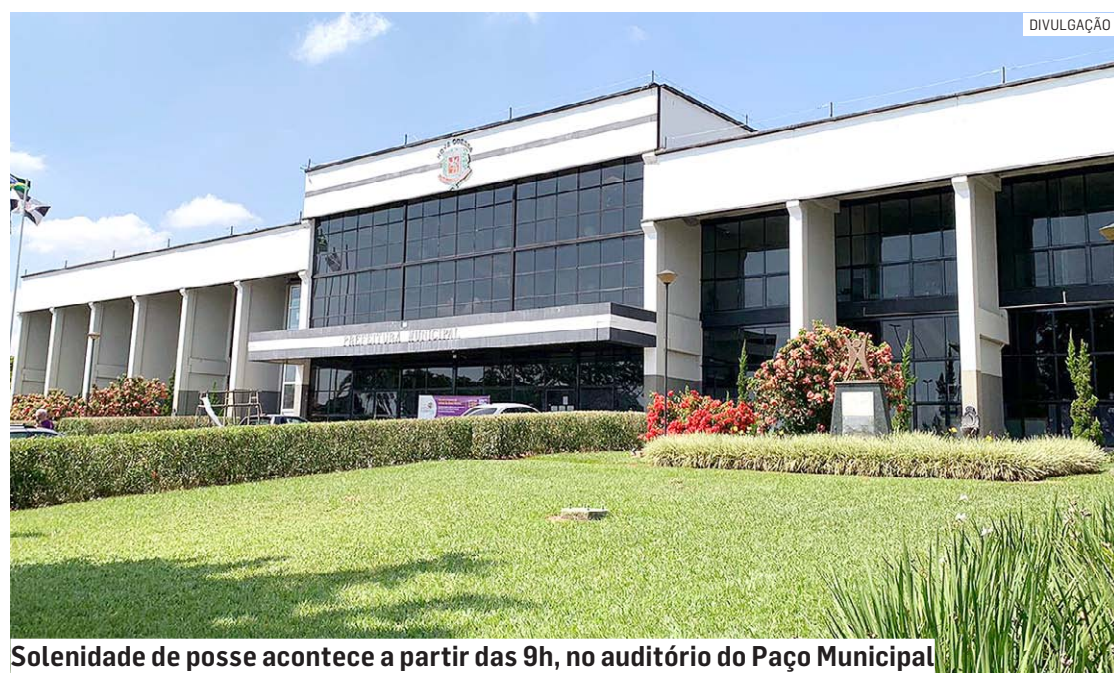
Solenidade de posse acontece a partir das 9h, no auditório do Paço Municipal

Da Redação • NOVA ODESSA tribunaliberal@tribunaliberal.com.br