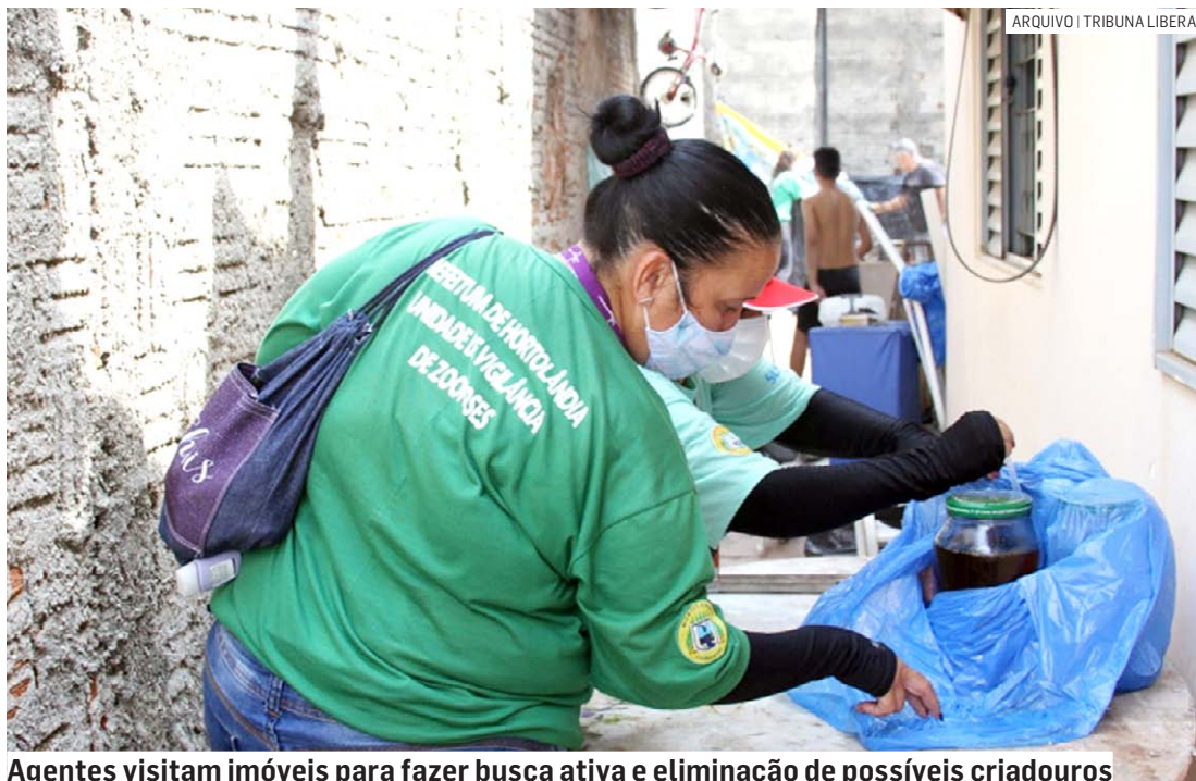
Agentes visitam imóveis para fazer busca ativa e eliminação de possíveis criadouros

Na ação casa a casa, os agentes visitam imóveis para fazer busca ativa e eliminação de possíveis criadouros do Aedes aegypti. O objetivo é eliminar