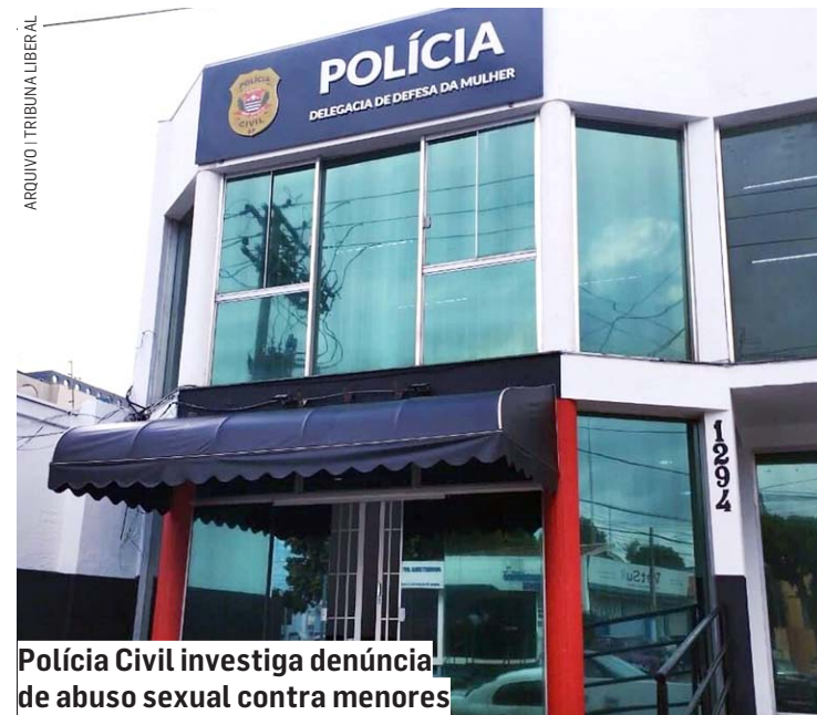
Polícia Civil investiga denúncia de abuso sexual contra menores

landa, em Sumaré. O indivíduo foi agredido por populares que fugiram com a chegada da Polícia Militar. Aos policiais, o suspeito disse que beijou a mão e o rosto da criança. O indivíduo foi levado ao Pronto-Socorro devido às lesões no corpo e no rosto. O caso será investigado pela DDM (Delegacia de Defesa da Mulher).