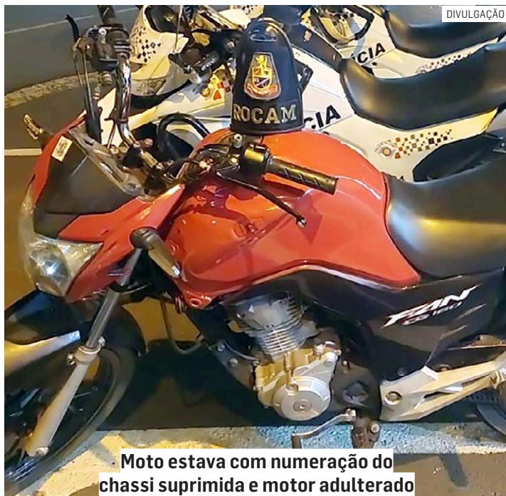
Moto estava com numeração do chassi suprimida e motor adulterado

Foi realizada abordagem e, questionado sobre a origem da motocicleta, o indivíduo informou que havia comprado em Campinas o veículo e