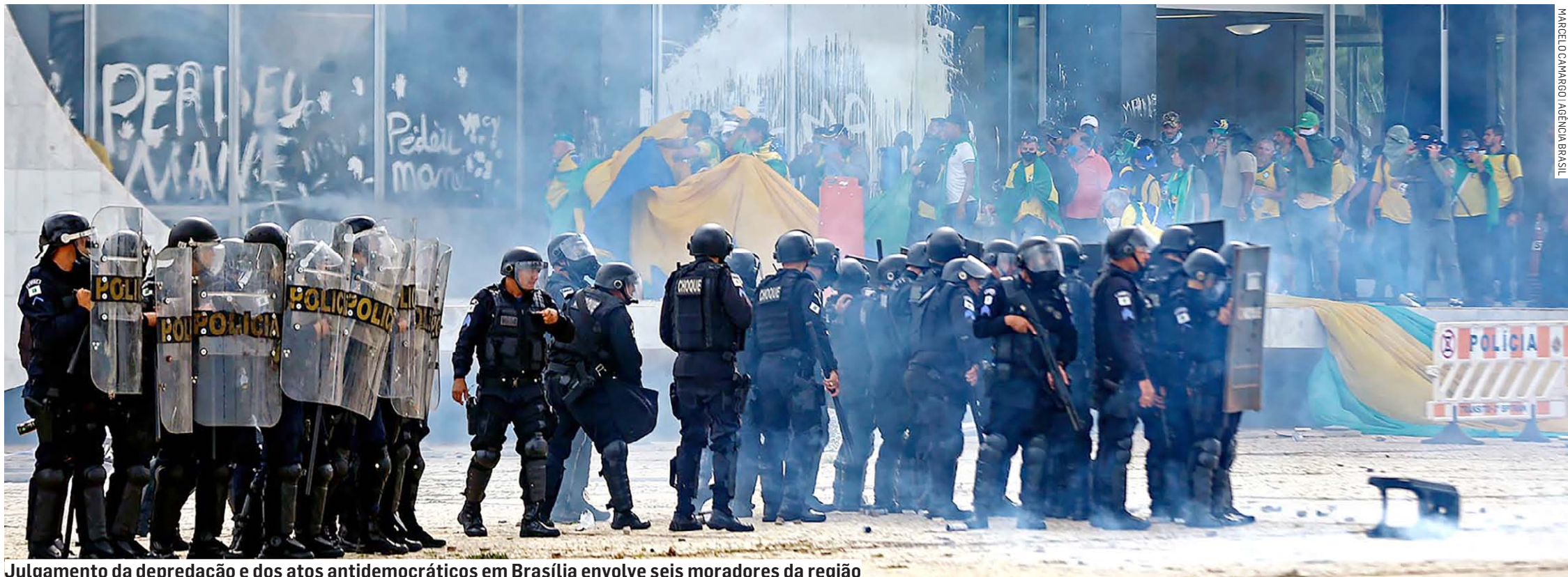
Julgamento da deprecação e dos atos antidemocráticos em Brasília envolve seis moradores da região

Em liberdade provisória, moradores de Sumaré e Nova Odessa passarão por julgamento no Supremo Tribunal Federal