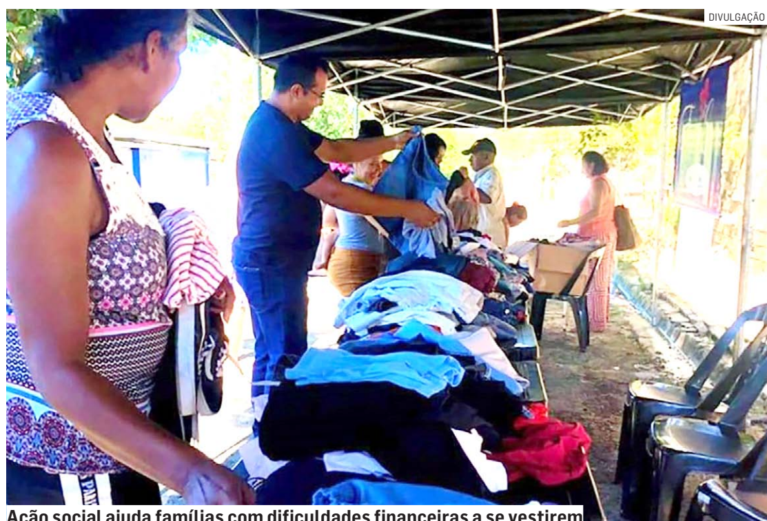
Ação social ajuda famílias com dificuldades financeiras a se vestirem