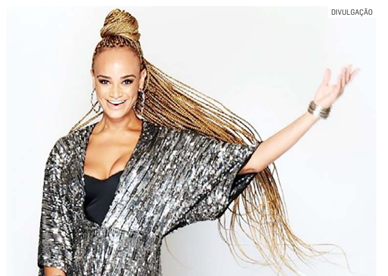
Artista é a convidada especial do projeto ‘Quinteto convida’

ciana tem luz própria. Ao longo de sua carreira, ela se destaca com sua mistura de MPB, pop, samba, funk e outros gêneros. A artista se tornou conhecida com o segundo disco “Assim que se faz”, que apresentou os sucessos “Assim que se faz” e “Simples desejo”. Em 2016, ela gravou o disco “Na luz do samba”, com repertório todo dedicado ao gênero. No ano passado, a cantora lançou o projeto audiovisual “35 anos na música”.