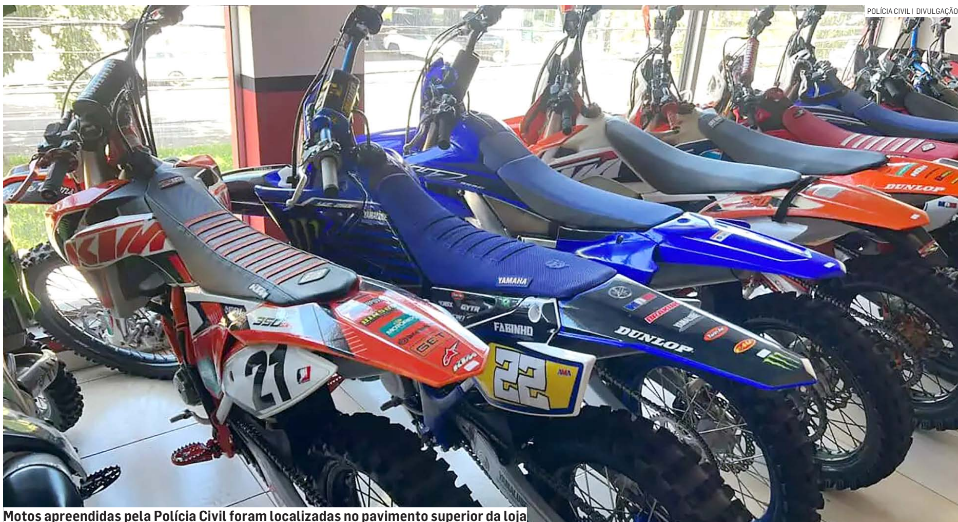
Motos apreendidas pela Polícia Civil foram localizadas no pavimento superior da loja

O proprietário foi questionado e informou que ambas estavam ali para serem vendidas, e em seguida apresentou um documento aparentando ser nota fiscal, relacionada a