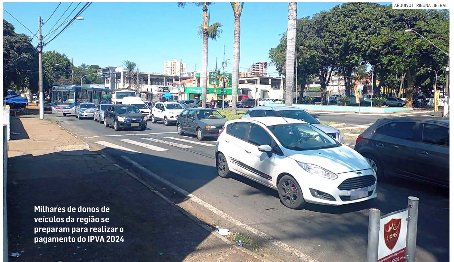
Milhares de donos de veículos da região se preparam para realizar o pagamento do IPVA 2024

O IPVA também pode ser pago via Pix, de forma rápida, facilitada e imediata, permitindo o recolhimento por meio de QR code junto a cerca de 800 instituições fi-