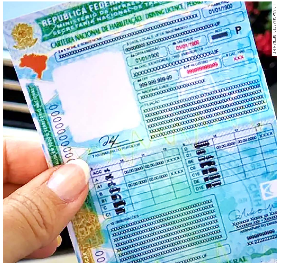
Sumaré contabiliza 35.923 condutores com CNH em situação irregular junto ao Detran-SP

Para o condutor que vai renovar as carteiras de habilitação categorias A e B, é preciso selecionar a data e hora para exame médico com um profissional credenciado pelo Detran. No caso de profissionais que exercem atividade remunerada é necessário que se faça também o exame psicológico. É necessário pagar a taxa de emissão do documento. A CNH no formato digital, que é válido em todo o país, é disponibilizada por meio do aplicativo da CDT (Carteira Digital de Trânsito), da Serpro (Empresa de Tecnologia da Informação do Governo Fe-