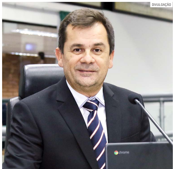
Parlamentar faz cobranças para o sistema público de saúde