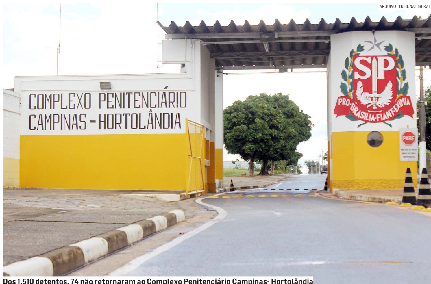
Dos 1.510 detentos, 74 não retornaram ao Complexo Penitenciário Campinas- Hortolândia

Quatro detidos descumpriram as medidas impostas pelo Poder Judiciário em Hortolândia, foram apresentados no Plantão Policial e encaminhados novamente ao regime fechado nas unidades prisionais. Esse grupo passou a cumprir, além do crime co-