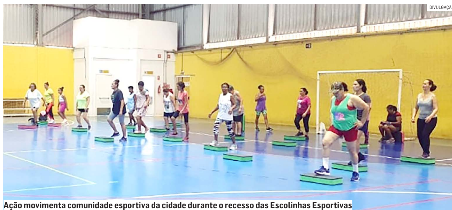
Ação movimenta comunidade esportiva da cidade durante o recesso das Escolinhas Esportivas

Da Redação • HORTOLÂNDIA tribunaliberal@tribunaliberal.com.br