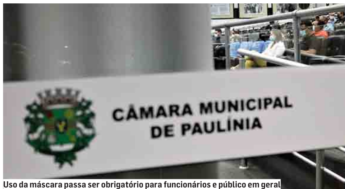
Uso da máscara passa ser obrigatório para funcionários e público em geral

A Casa mantém protocolos já adotados de higienização e cuidados: sanitização de gabinetes, corredores, Plenário, recepção e principais entradas; pulverização em todo o prédio semanalmente; e distribuição de álcool em gel. | Da Redação