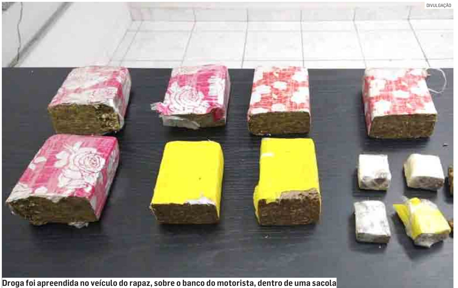
Droga foi apreendida no veículo do rapaz, sobre o banco do motorista, dentro de uma sacola

A ocorrência foi apresentada no Plantão Policial de Nova Odessa, onde o homem ficou preso, permanecendo à disposição da Justiça para audiência de custódia.