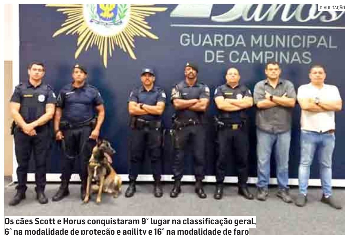
Os cães Scott e Horus conquistaram 9º lugar na classificação geral, 6º na modalidade de proteção e agility e 16º na modalidade de faro

Da Redação | MONTE MOR tribunaliberal@tribunaliberal.com.br