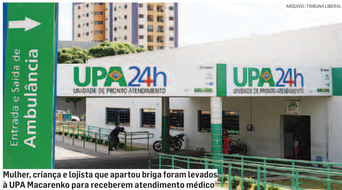
Mulher, criança e lojista que apartou briga foram levados à UPA Macarenko para receberem atendimento médico

Cézar Oliveira | SUMARÉ tribunaliberal@tribunaliberal.com.br