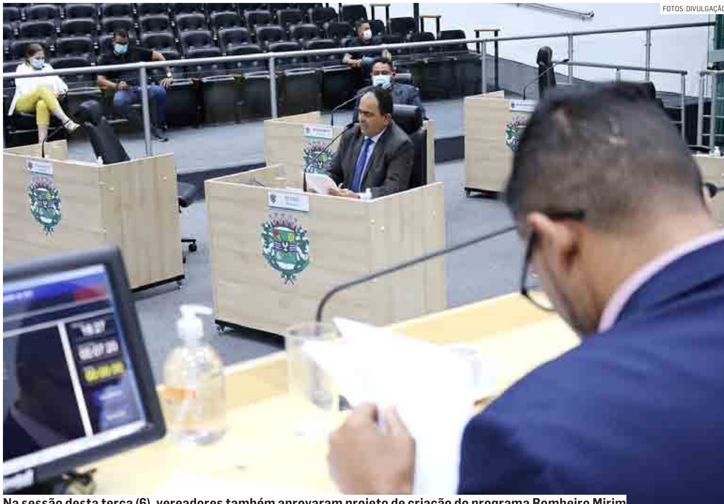
Na sessão desta terça (6), vereadores também aprovaram projeto de criação do programa Bombeiro Mirim

Outra proposta aprovada pretende obrigar a