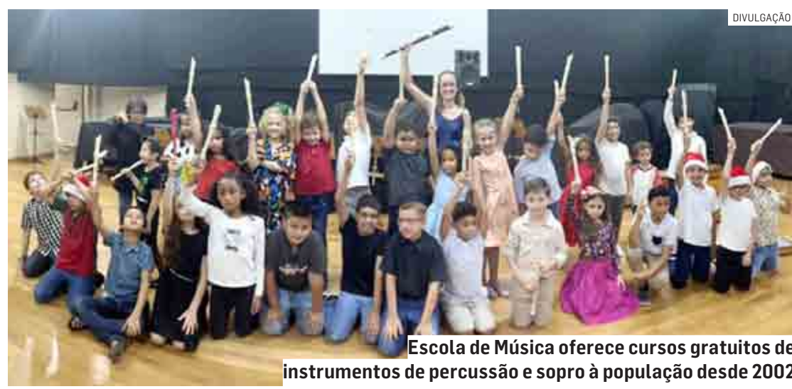
Escola de Música oferece cursos gratuitos de instrumentos de percussão e sopro à população desde 2002

Já as Audições Coletivas acontecem semes-