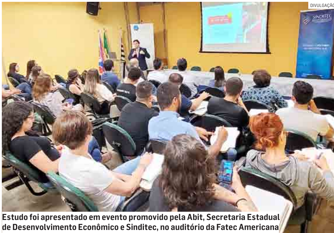
Estudo foi apresentado em evento promovido pela Abit, Secretaria Estadual de Desenvolvimento Econômico e Sinditec, no auditório da Fatec Americana

“Esse estudo vem confirmar com números o quanto o polo têxtil de Americana, envolvendo Santa Bárbara, Nova