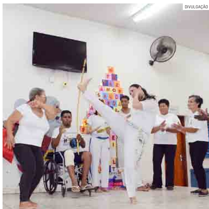
Para marcar o encerramento das aulas houve apresentação especial dos professores e do Coral da Melhor Idade