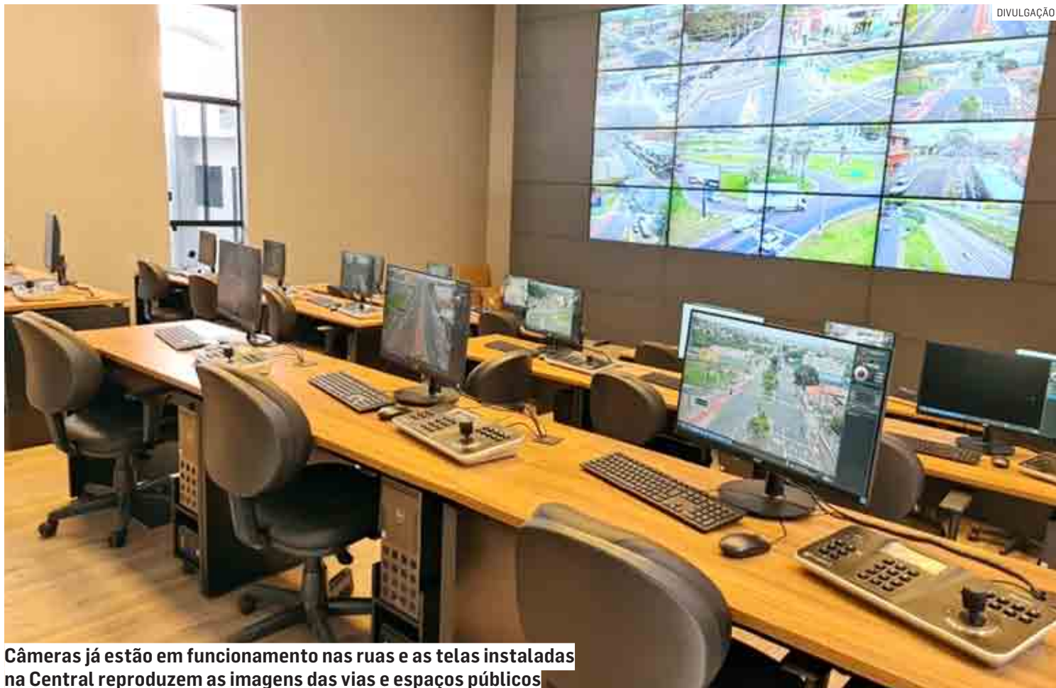
Câmeras já estão em funcionamento nas ruas e as telas instaladas na Central reproduzem as imagens das vias e espaços públicos

Após a inauguração, os agentes de Mobilidade da Segurança irão operar o sistema altamente tecnológico e integrado. As câmeras já estão em funcionamento nas ruas e as telas instaladas na Central reproduzem as imagens das vias e espaços públicos, compondo uma das "muralhas digitais" de segurança mais modernas do Brasil.