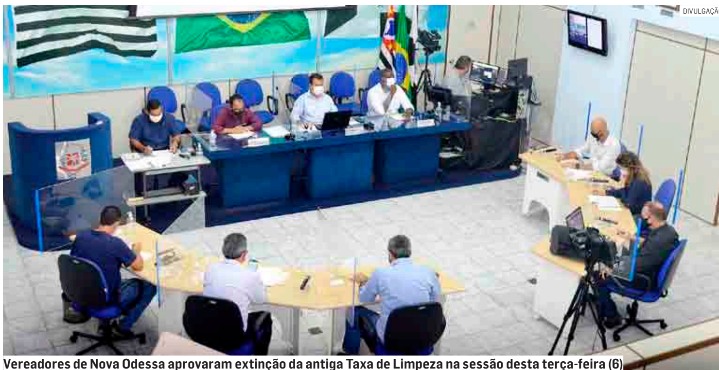
Vereadores de Nova Odessa aprovaram extinção da antiga Taxa de Limpeza na sessão desta terça-feira (6)

Pelo texto aprovado pela Câmara, nova “Taxa do Lixo” segue com valor igual para 98% dos imóveis residenciais e 86,2% dos comércios