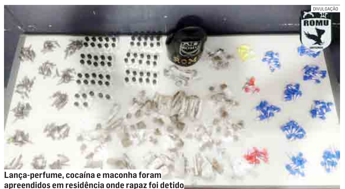
Lança-perfume, cocaína e maconha foram apreendidos em residência onde rapaz foi detido

O adolescente foi conduzido ao Plantão Policial de Hortolândia, onde a autoridade deliberou medidas judiciais e o adolescente ficou à disposição da Justiça.