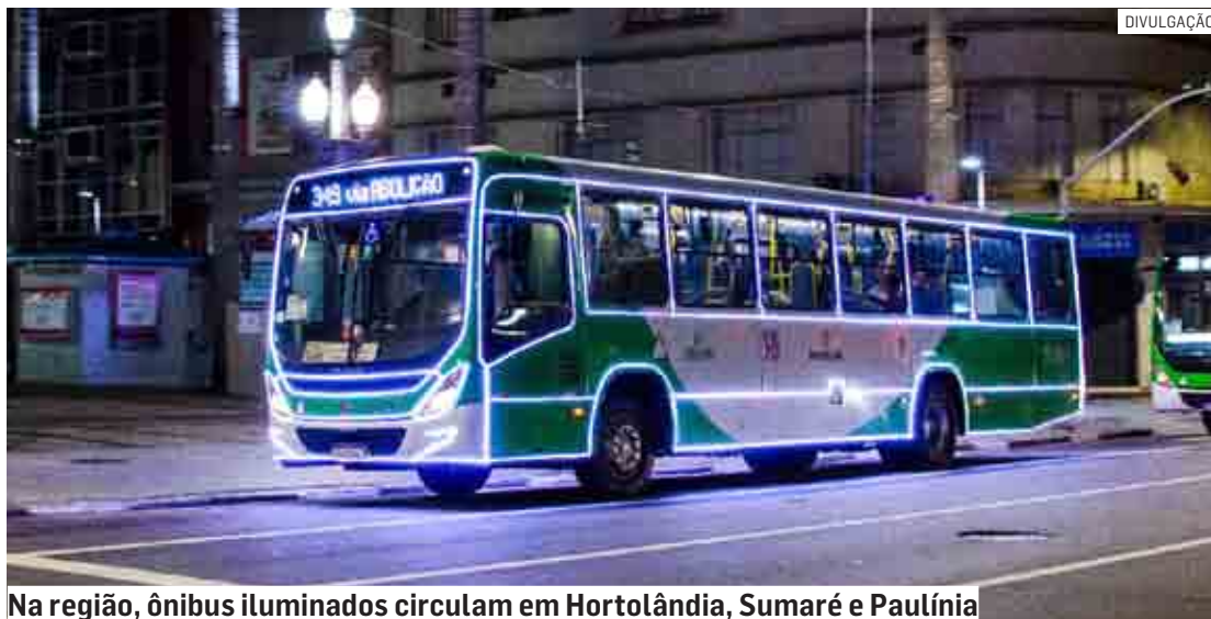
Na região, ônibus iluminados circulam em Hortolândia, Sumaré e Paulínia

Recebem as luzes natalinas os ônibus urbanos, suburbanos, escola-