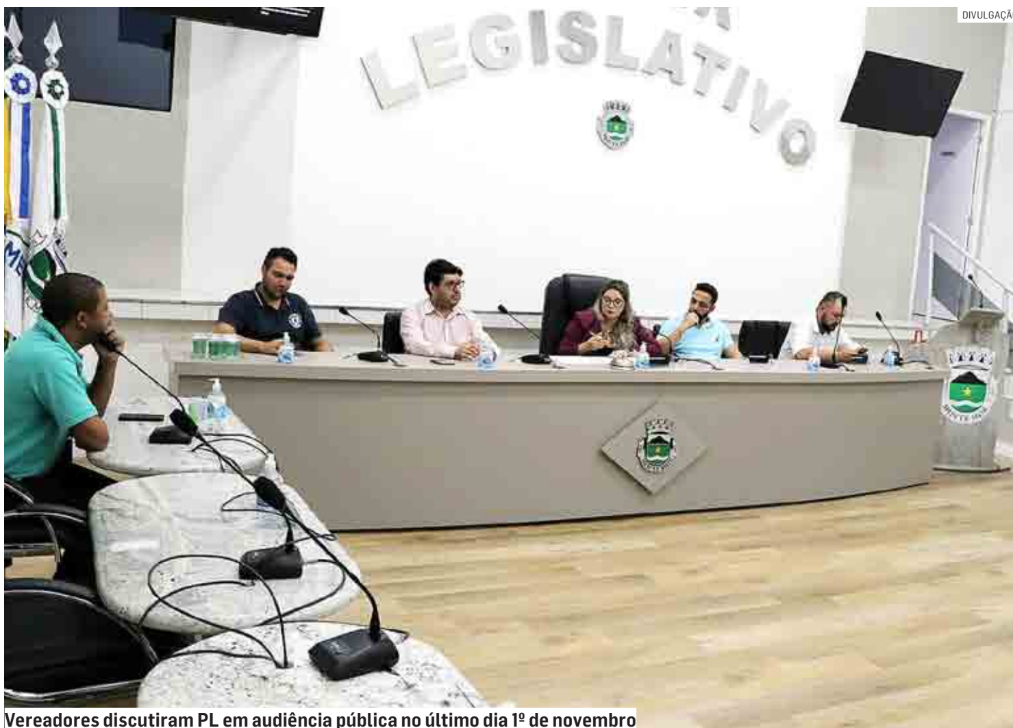
Vereadores discutiram PL em audiência pública no último dia 1º de novembro

Novo texto prevê que alienação será feita através de “avaliação pericial”, para contemplar a nova lei; PL passará por comissão antes de ir a plenário