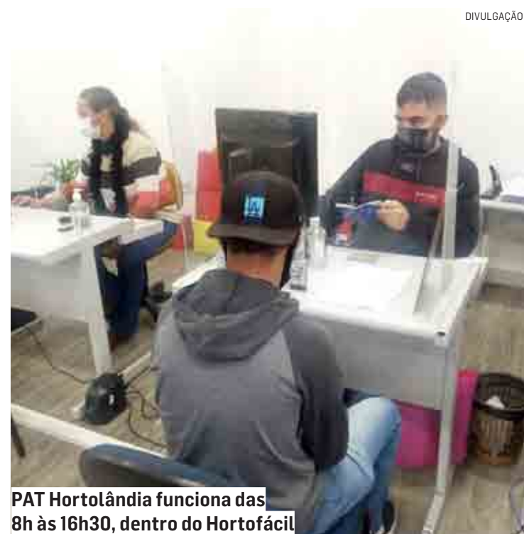
PAT Hortolândia funciona das 8h às 16h30, dentro do Hortofácil

Os candidatos também podem levar currículo e comprovante de endereço, mas, de acordo com o PAT, a apresentação desses documentos não é obrigatória. Para mais informações e orientações,