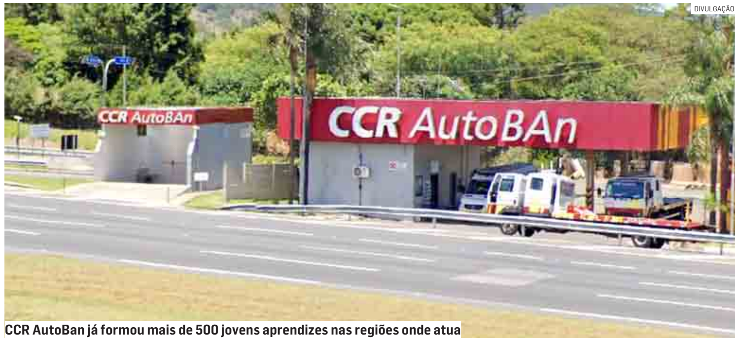
CCR AutoBAN já formou mais de 500 jovens aprendizes nas regiões onde atua

O profissional será capacitado para atuar no apoio às demandas da área do atendimento, de acordo com políticas e normas da empresa, para contribuir com o correto e adequado processo de atendimento, cobranças e recebimentos nos postos de pedágios. É esperado que o jovem aprendiz preze pela segurança, afinal essa é condição de existência da empresa, além de que tenha muita vontade e desejo de aprender, e se desenvolver. É um diferencial para