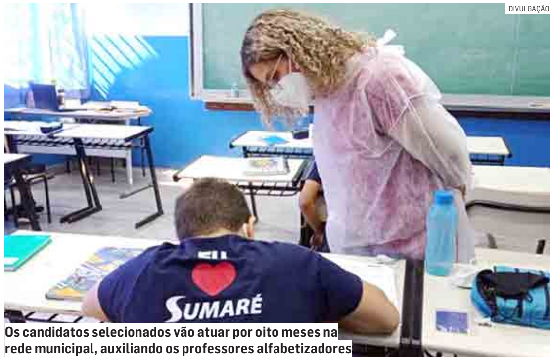
Os candidatos selecionados vão atuar por oito meses na rede municipal, auxiliando os professores alfabetizadores

ta ou em andamento em Pedagogia. Para se inscrever, o candidato deve enviar uma mensagem de e-mail ao endereço: tempoaprender.sme@educacaosumare.com.br demonstrando interesse. A partir do contato, um link para concluir o processo será disponibilizado. São necessários para a inscrição: cópia do RG ou CNH, cópia da certidão de nascimento de cada filho menor de 18 anos, caso houver, comprovante de residência, comprovante de conclusão