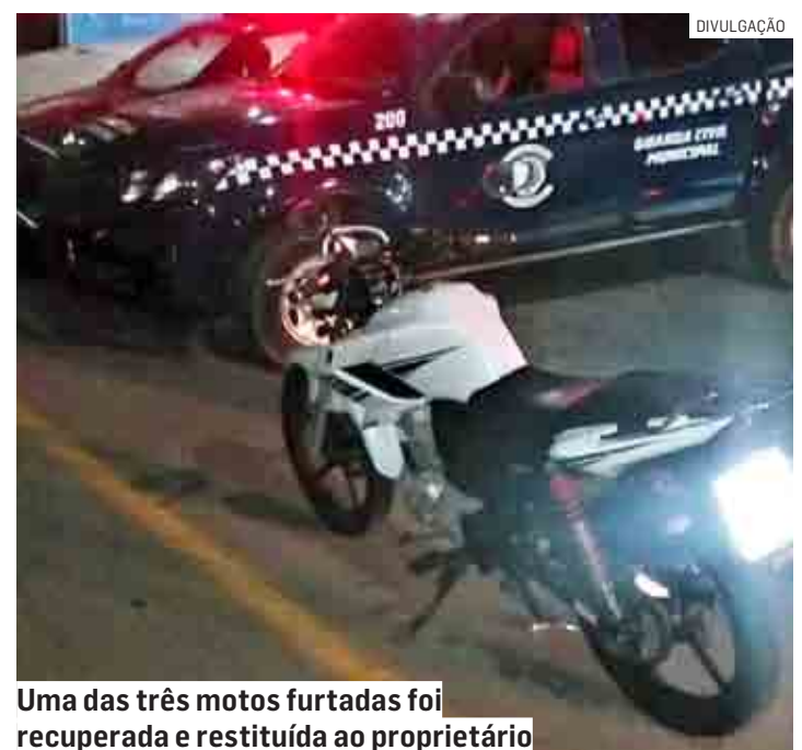
Uma das três motos furtadas foi recuperada e restituída ao proprietário

Ao ser questionado pelos guardas, o detido informou que estava passando em frente ao estabelecimento quando os suspeitos disseram "pega uma pra você", e dis-