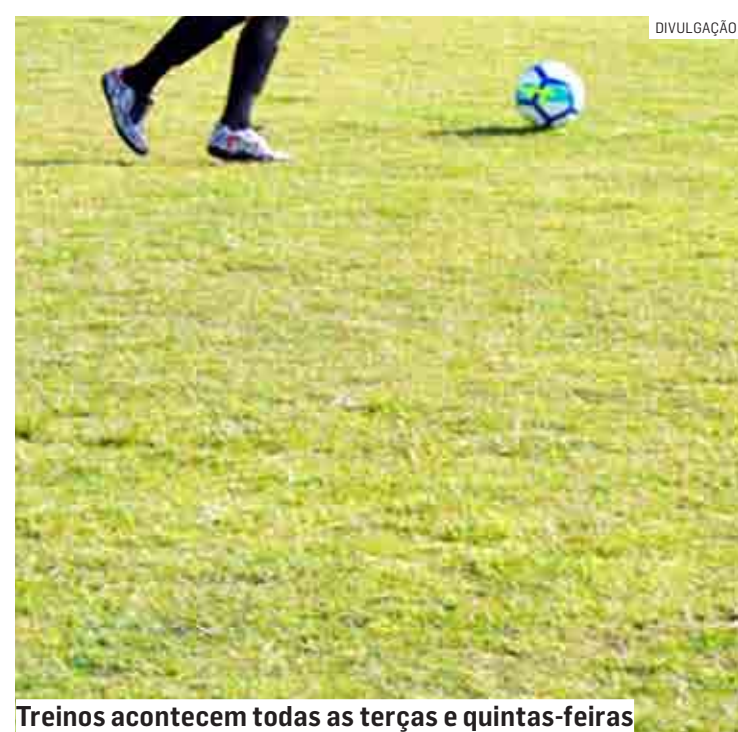
Treinos acontecem todas as terças e quintas-feiras

ra se inscrever em alguma das modalidades disponíveis, basta levar RG e uma foto 3x4. Quando a inscrição for para menores de 18 anos, além do RG e da foto é necessário um comprovante de endereço do responsável pelo aluno. O Projeto Escolinhas Esportivas atende aproximadamente 6 mil pessoas em Hortolândia.