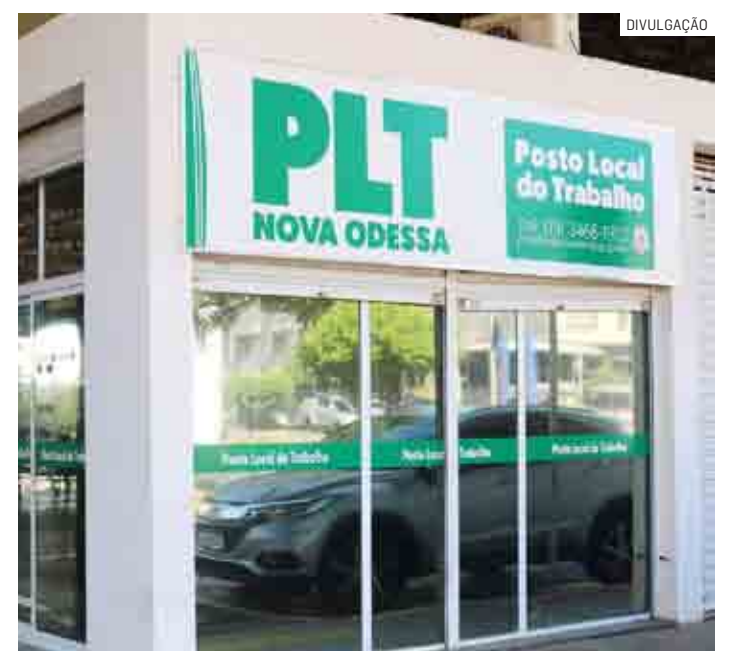
Para entrega presencial do currículo, o Posto Local do Trabalho fica na rodoviária

A entrega do currículo também pode ser feita presencialmente das 8h30 às 11h30 na sede da unidade, que funciona na Rodoviária Municipal, localizada na Rua Rio Branco, nº 699, no Centro. Mais informações pelo telefone (19) 3466-1902. As vagas são para pessoas com experiência e para moradores de Nova Odessa.