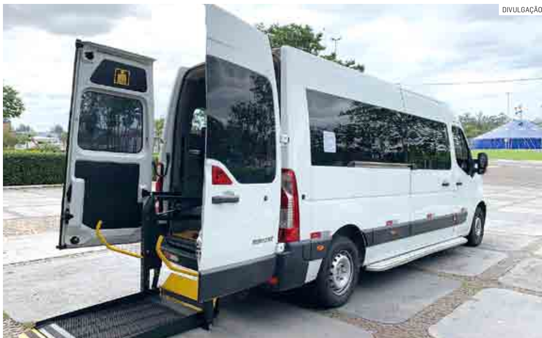
Nova van adaptada para o transporte de cadeirantes e PCDs foi locada através do Cismetro