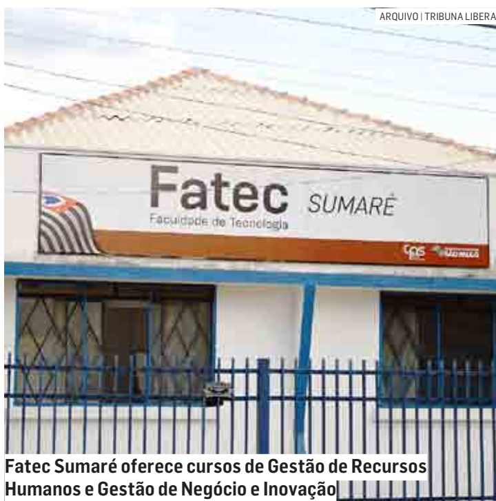
Fatec Sumaré oferece cursos de Gestão de Recursos Humanos e Gestão de Negócio e Inovação

A inscrição deve ser feita exclusivamente pe-