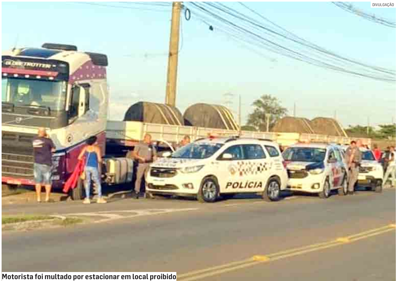
Motorista foi multado por estacionar em local proibido

O caso foi registrado no Plantão Policial onde o caso será investigado.