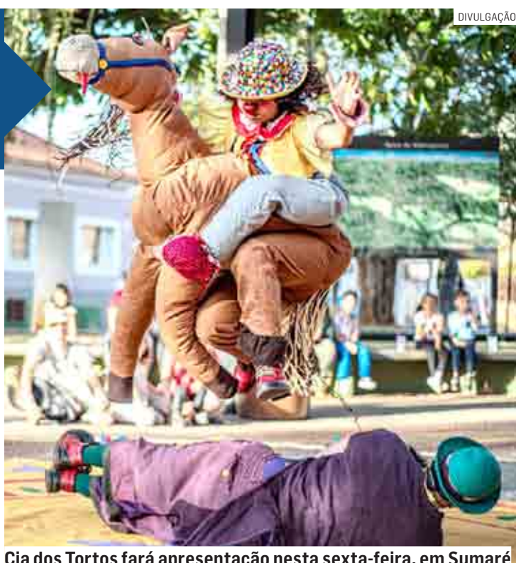
Cia dos Tortos fará apresentação nesta sexta-feira, em Sumaré

A Cia dos Tortos - grupo do ABC Paulista que em 2022 celebra dez anos - está realizando uma temporada de apresentações gratuitas com o projeto “Quem Não Tem Lona Pede Carona”, realizado com apoio do governo do Estado de São Paulo. Na sexta-feira (11), às 16h, o grupo se apresenta no Anfiteatro Dirce Dalben, no Jardim Nova Veneza, em Sumaré. O espetáculo “Quem Não Tem Lona Pede Carona”, que em 2022 comemora oito anos de circulação, desafia o tempo e conta a história de dois artistas. PÁGINA 03