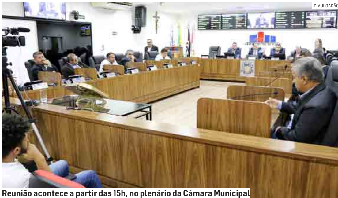
Reunião acontece a partir das 15h, no plenário da Câmara Municipal

O primeiro item da pauta de votação é o Projeto