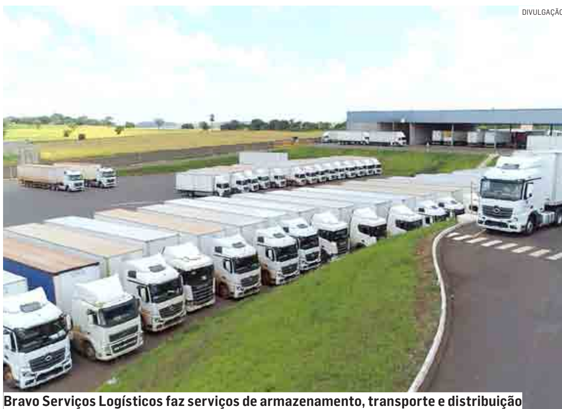
Bravo Serviços Logísticos faz serviços de armazenamento, transporte e distribuição

Os interessados precisam portar CNH E e cur-