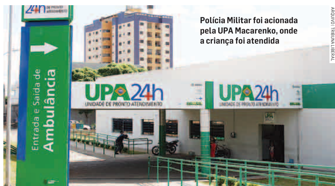
Polícia Militar foi acionada pela UPA Macarenko, onde a criança foi atendida

na casa da avó. A mãe da menina ainda contou aos policiais que, ao chegar em casa, a menina relatou que o tio teria passado a mão nas partes íntimas dela. Não foi possível constatar o abuso pelo médico, mas o caso foi registrado no Plantão Policial e será investigado.