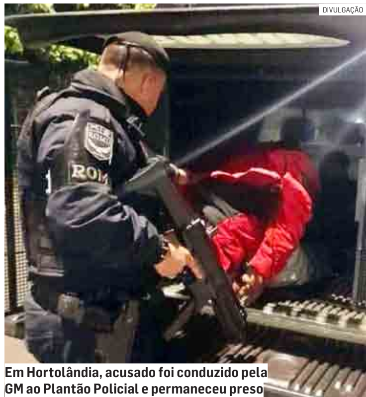
Em Hortolândia, acusado foi conduzido pela GM ao Plantão Policial e permaneceu preso