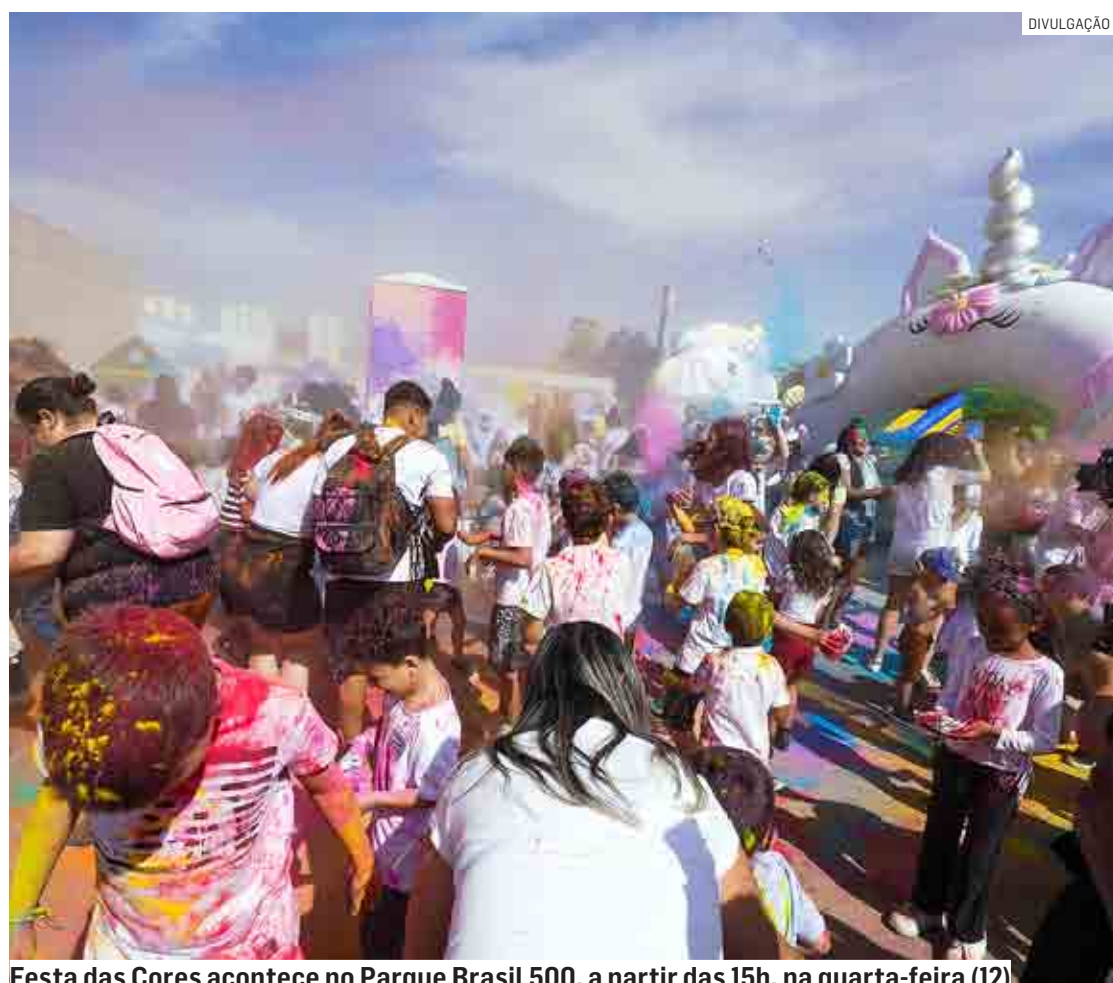
Festa das Cores acontece no Parque Brasil 500, a partir das 15h, na quarta-feira (12)

Da Redação | PAULÍNIA tribunaliberal@tribunaliberal.com.br