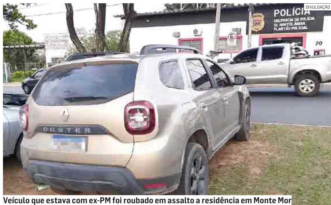
Veículo que estava com ex-PM foi roubado em assalto a residência em Monte Mor

O homem, que é ex-policial militar, foi conduzido ao Plantão Policial, onde ficou preso em flagrante, permanecendo à disposição da Justiça.