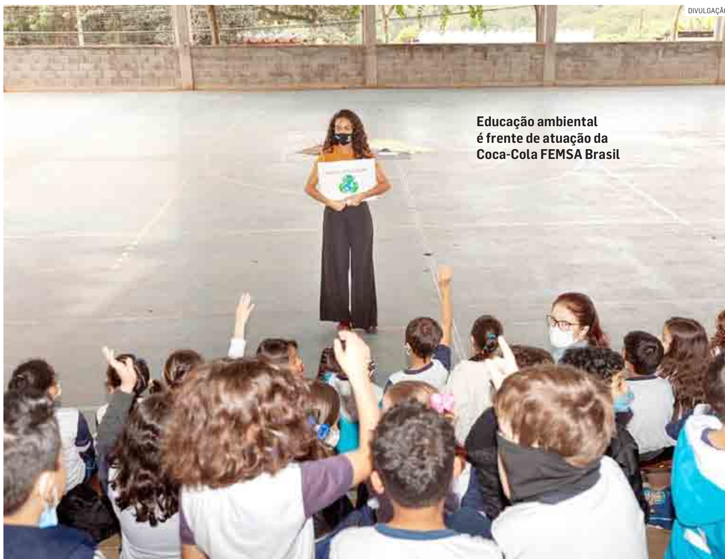
Educação ambiental é frente de atuação da Coca-Cola FEMSA Brasil

As iniciativas devem apresentar contribuições para temas relacionados às frentes relevantes para a Coca-Cola FEMSA Brasil: gestão de resíduos e economia circular; gestão de água e reposição hídrica; mudanças climáticas e aquecimento