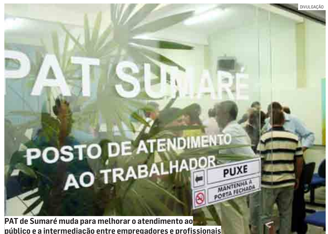
PAT de Sumaré muda para melhorar o atendimento ao público e a intermediação entre empregadores e profissionais

“O objetivo dessa gestão é criar cada vez mais canais que possam funcionar como um elo entre empregadores e tra-