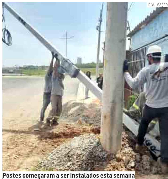
Postes começaram a ser instalados esta semana

A CPFL (Companhia Paulista de Força e Luz) iniciou a instalação dos postes públicos e dos postes padrão da rede elétrica para regularizar a distribuição de energia no Jardim Santa Fé. Cerca de 130 famílias serão beneficiadas. A ação integra o processo de regularização fundiária do bairro. A instalação dos postes é uma das diretrizes anunciadas pela Prefeitura de Hortolândia durante os trabalhos desenvolvidos pela Secretaria Municipal de Habitação. PÁGINA 05