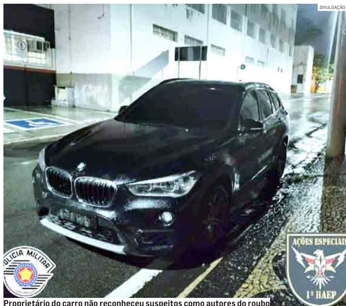
Proprietário do carro não reconheceu suspeitos como autores do roubo