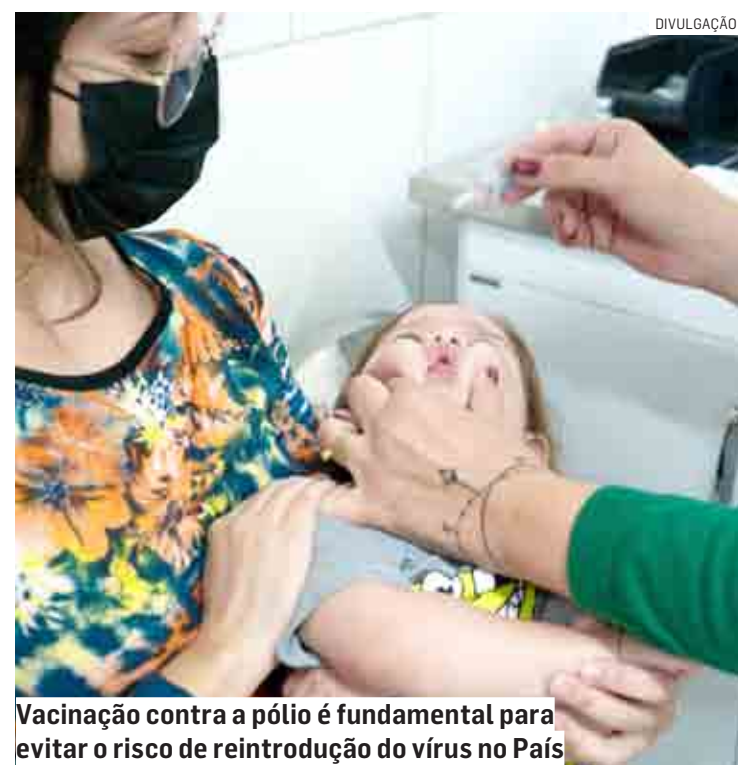
Vacinação contra a pólio é fundamental para evitar o risco de reintrodução do vírus no País

Contra a poliomielite, foram imunizadas 1,2 milhão de crianças, o que representa 53% do público-alvo desta faixa etária. A vacinação contra esta doença é fundamental para evitar o risco de reintrodução do vírus, do qual não se tem registro de caso no Estado