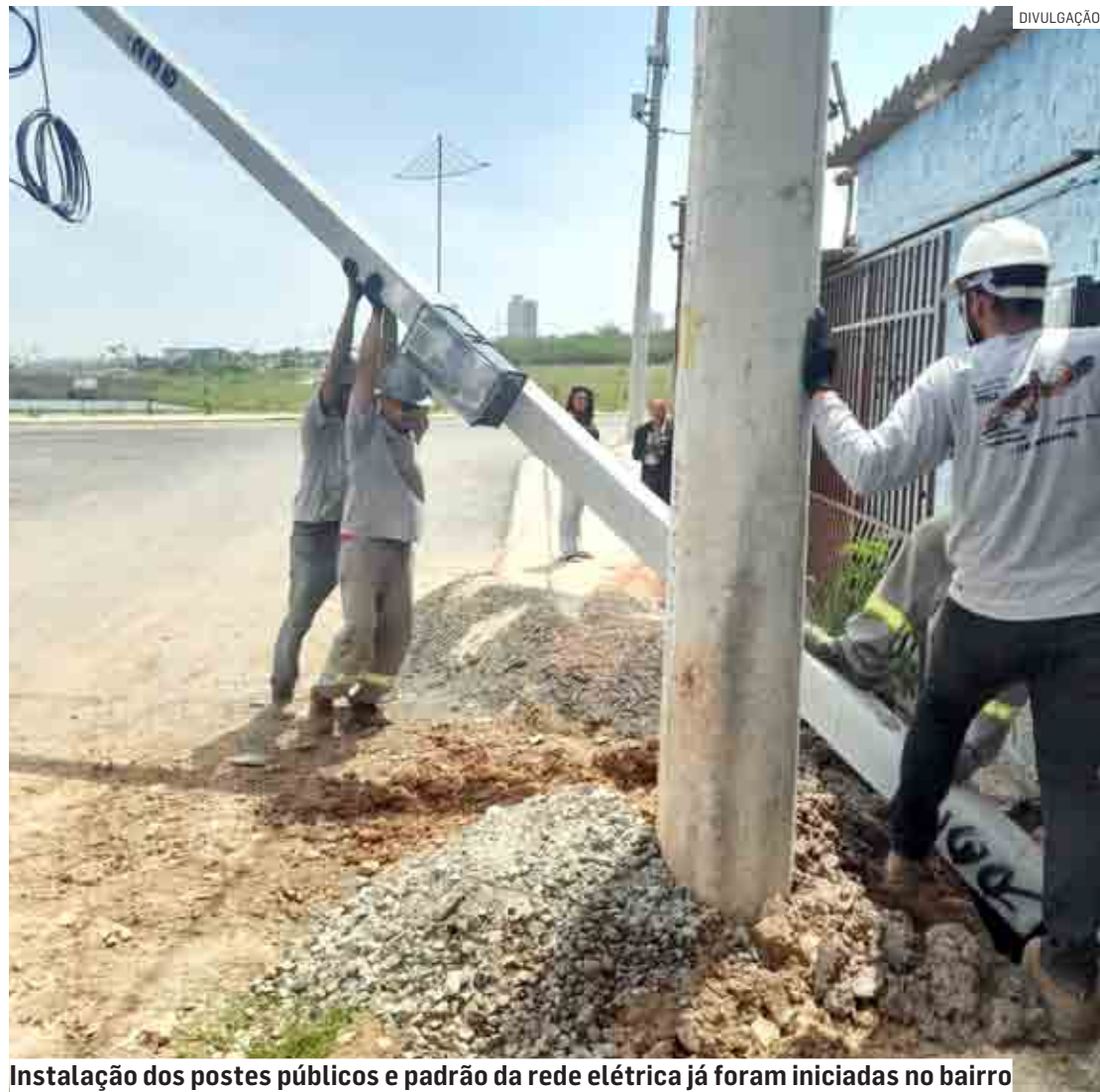
Instalação dos postes públicos e padrão da rede elétrica já foram iniciadas no bairro

Ação integra o processo de regularização fundiária do bairro; cerca de 130 famílias serão beneficiadas