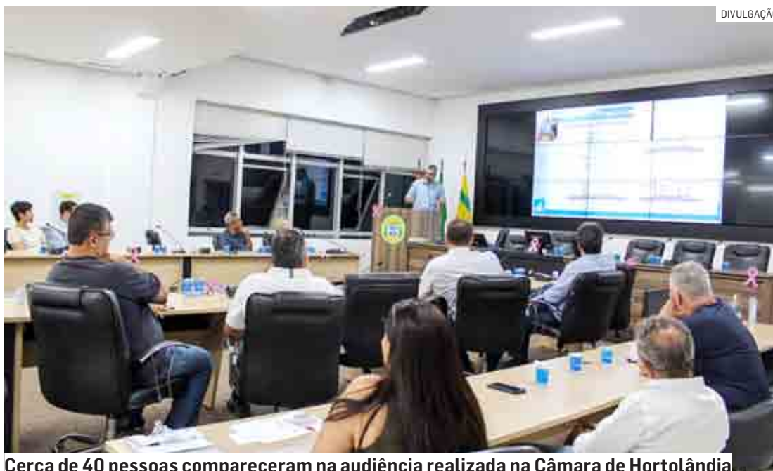
Cerca de 40 pessoas compareceram na audiência realizada na Câmara de Hortolândia

didos para futuras análises de quem foi até o local contribuir com o desenvolvimento do novo plano. As sugestões da comunidade que es-