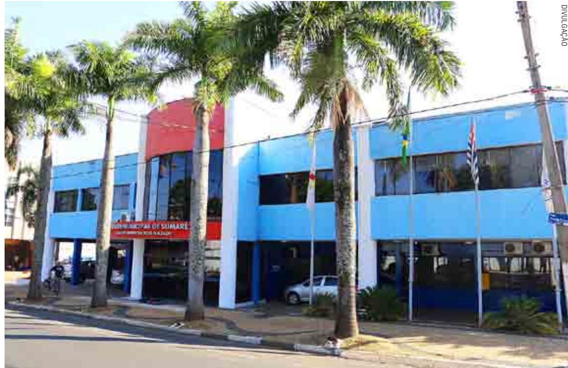
Inscrições começam na próxima quinta-feira, dia 13, e devem ser feitas no site do Instituto Indepac

A Câmara Municipal de Sumaré anunciou a abertura de concurso público com 10 vagas para diversos cargos de nível fundamental, médio e superior. O edital nº 01/2022 foi publicado no Diário Oficial do Município e no site da Câmara Municipal (https://www.camarasumare.sp.gov.br/), nesta sexta-feira (7). As inscrições para o concurso começam no dia 13 de outubro e vão até o dia 4 de novembro e deverão ser realizadas no site do Instituto Indepac (https://institutoindepac.org.br). PÁGINA 03