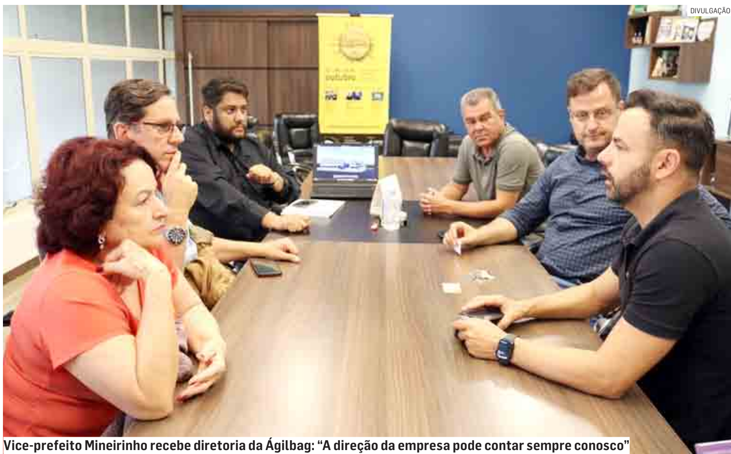
Vice-prefeito Mineirinho recebe diretoria da Ágilbag: “A direção da empresa pode contar sempre conosco”

expansão, a empresária informou ter iniciado a construção de um prédio de 6 mil metros quadrados no condomínio empresarial Park Anhanguera. “Nossos agradecimentos ao prefeito Leitinho e ao vice-prefeito Mineirinho pela recepção. Também estamos felizes por retornar a Nova