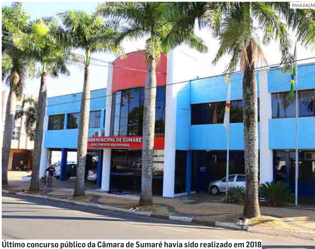
Último concurso público da Câmara de Sumaré havia sido realizado em 2018

As vagas serão distribuídas em cinco cargos: Faxineiro (2 vagas), Assistente Legislativo (1), Auxiliar de Sonoplastia (1), Motorista (1) e Analista Administrativo (5 vagas, das quais 3 para ampla concorrência, 1 para