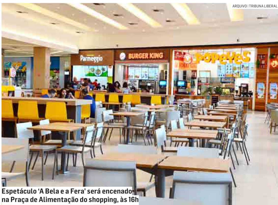
Espectáculo ‘A Bela e a Fera’ será encenado na Praça de Alimentação do shopping, às 16h

Da Redação | SUMARÉ tribunaliberal@tribunaliberal.com.br