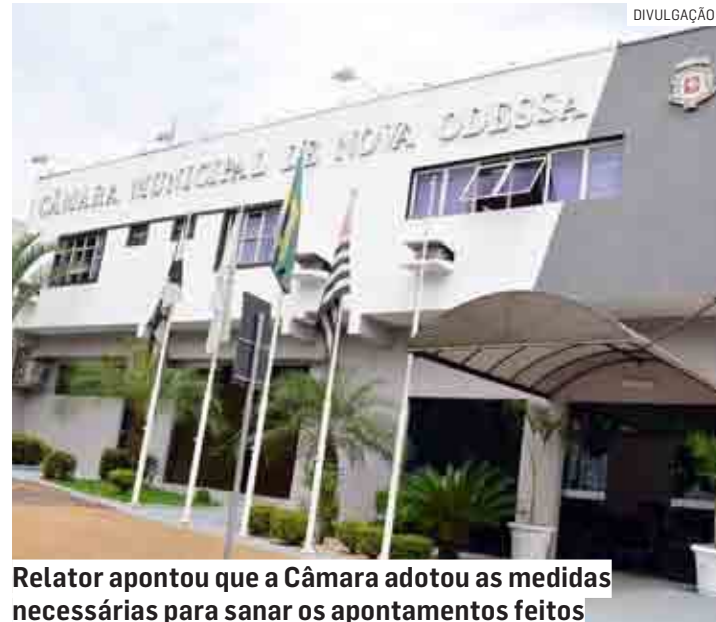
Relator apontou que a Câmara adotou as medidas necessárias para sanar os apontamentos feitos

Entre os apontamentos feitos pela fiscalização estava a falta de AVCB (Auto de Vistoria do Corpo de Bombeiros) do imóvel que hoje abriga o Legislativo municipal. “Igualmente relevo o desacerto relativo à falta de AVCB do pré-