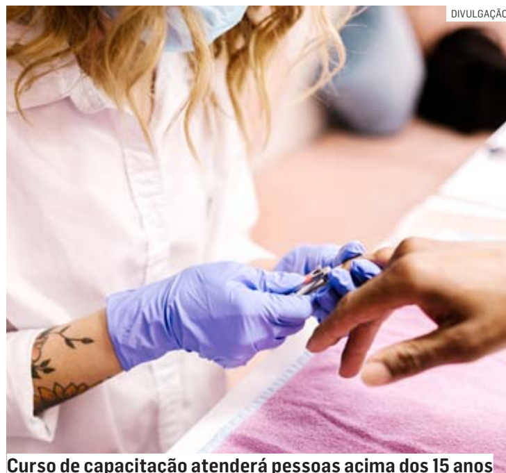
Curso de capacitação atenderá pessoas acima dos 15 anos

mas como atendimento ao público, cuidados pessoais e organização do ambiente de trabalho. Realizado uma vez por semana, o curso será dividido em duas turmas, com oito vagas para o período da manhã (das 9h às 10h30) e as outras oito vagas para o período da tarde (das 15h às 16h30). Todas as aulas serão ministradas às segundas-feiras, com duração de uma hora e meia.