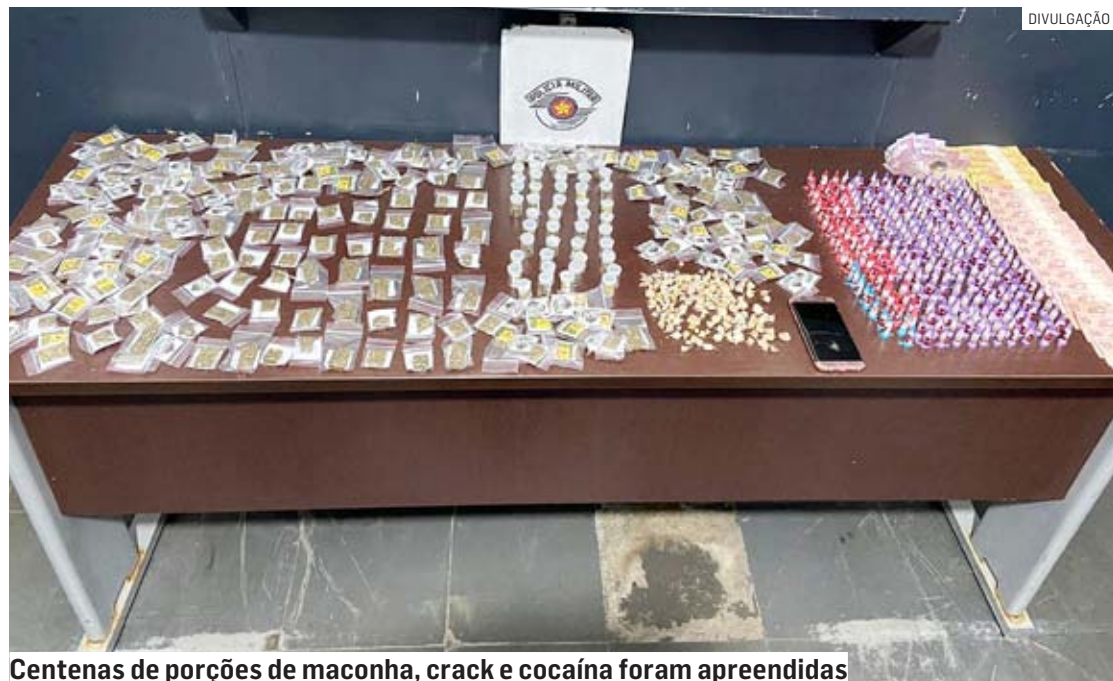
Centenas de porções de maconha, crack e cocaína foram apreendidas