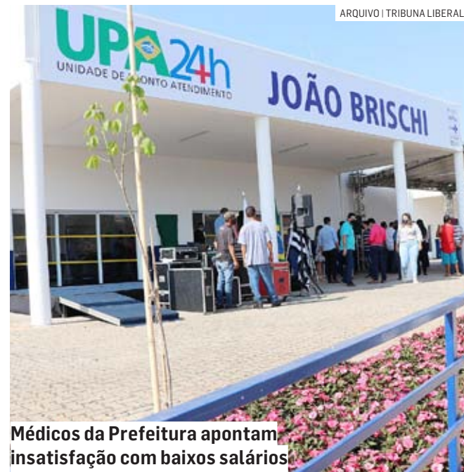
Médicos da Prefeitura apontam insatisfação com baixos salários

A Secretaria de Saúde informou que tem conhecimento das reivindicações dos médicos e irá recebê-los junto com o secretário de Administração na segunda-feira para discutir as propostas apresentadas pelos médicos através de ofício protocolado.