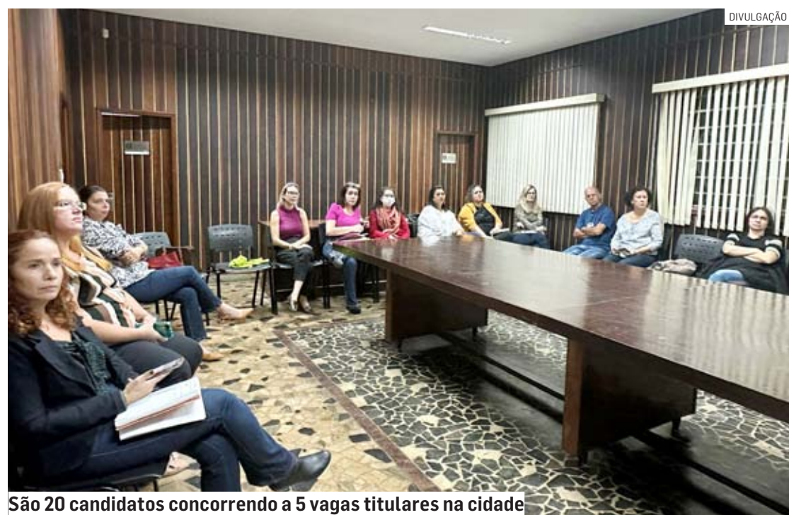
São 20 candidatas concorrendo a 5 vagas titulares na cidade