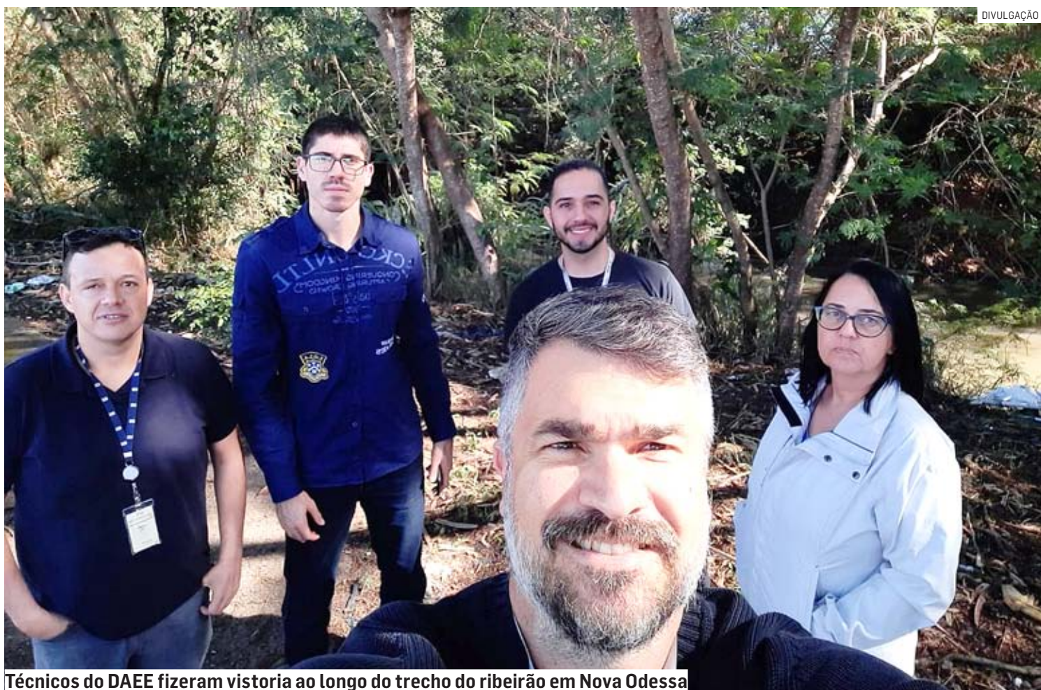
Técnicos do DAEE fizeram vistoria ao longo do trecho do ribeirão em Nova Odessa

O ciclo 2023-2024 do Programa Rios Vivos foi lançado no último dia 05. A iniciativa está inserida no Plano Estadual de Meio Ambiente e visa a revitalização de margens e despoluição de 240 cursos d'água, com a retirada de sedimentos, o que auxilia no combate a inundações e garante mais água e qualidade de vida para