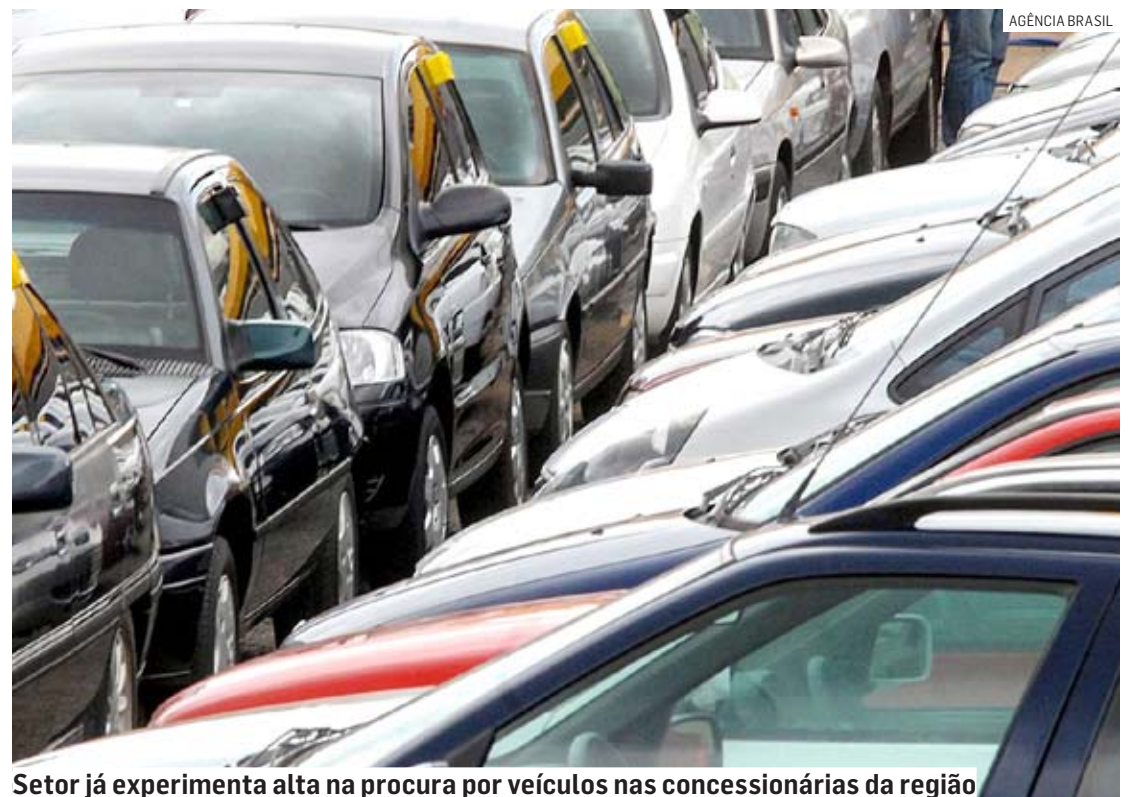
Setor já experimenta alta na procura por veículos nas concessionárias da região

“Acredito que esse desconto não chega para os carros da Honda, a princípio não está sendo legal. O cliente irá esperar a redução do preço do carro zero para essa redução chegar