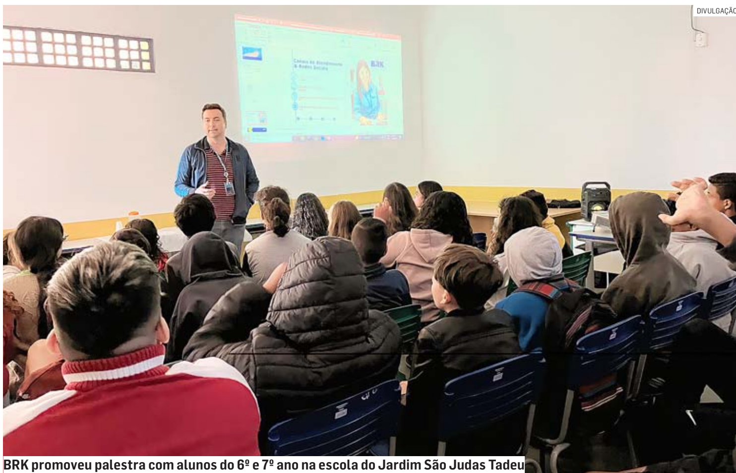
BRK promoveu palestra com alunos do 6º e 7º ano na escola do Jardim São Judas Tadeu

Palestra aconteceu na E.E. Professor Luís Henrique Marchi e estudantes tiveram acesso ao controle de qualidade da água feito pela concessionária