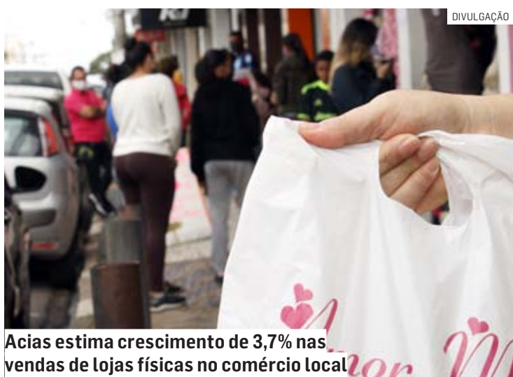
Acias estima crescimento de 3,7% nas vendas de lojas físicas no comércio local

Da Redação • SUMARÉ tribunaliberal@tribunaliberal.com.br