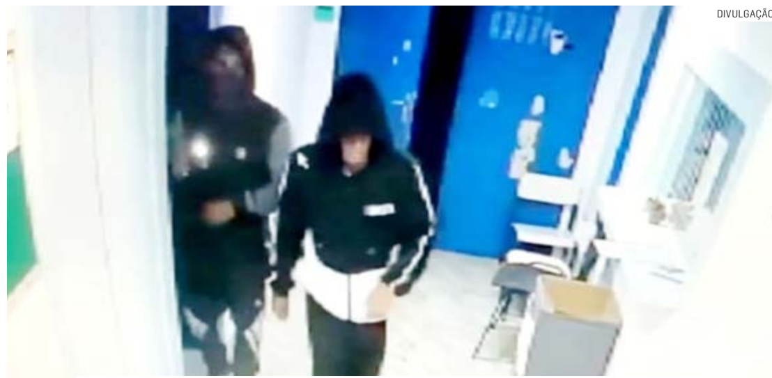
Câmeras de segurança flagraram bandidos dentro da escola com máscaras

Três indivíduos invadiram e furtaram equipamentos eletrônicos da Escola Estadual Professora Sylvania Aparecida Santos, na madrugada desta quarta-feira (7), no bairro Parque Residencial Triunfo, em Nova Odessa. Os funcionários informaram que os ladrões invadiram a instituição de ensino por um portão lateral e estouraram um cadeado. A ação criminosa foi flagrada por câmeras de segurança, que mostram o local sendo invadido por volta das 2h. As imagens mostram um deles entrando em uma sala, deitando no chão e se arrastando até pegar um notebook. Em outro vídeo, os bandidos invadem o prédio administrativo da escola.