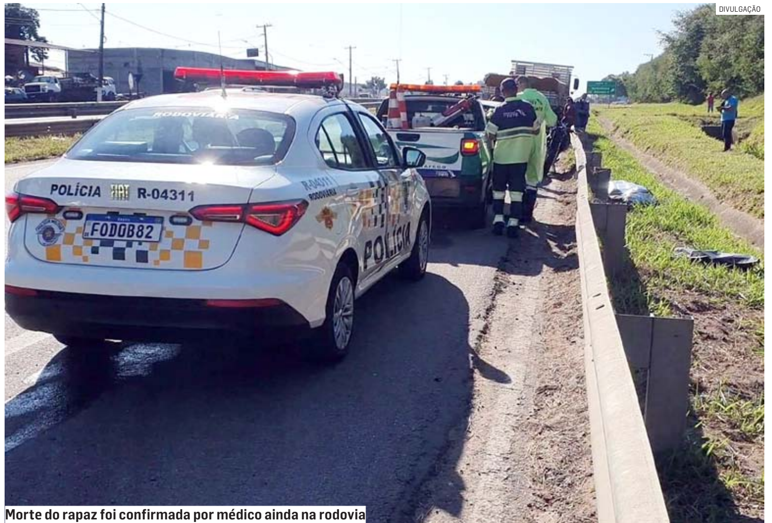
Morte do rapaz foi confirmada por médico ainda na rodovia

A Polícia Militar Rodoviária registrou o caso no 2º DP (Distrito Policial), localizado no Jardim Amanda. As circunstâncias do acidente serão apuradas pela Polícia Civil.