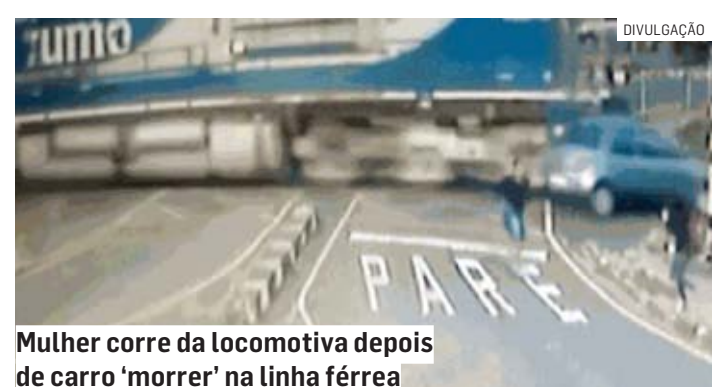
Mulher corre da locomotiva depois de carro 'morrer' na linha férrea

A empresa Rumo, que explora os trilhos na região, recomenda que motoristas precisem se atentar à sinalização e parar antes de cruzamentos, uma vez que a linha férrea é preferencial.