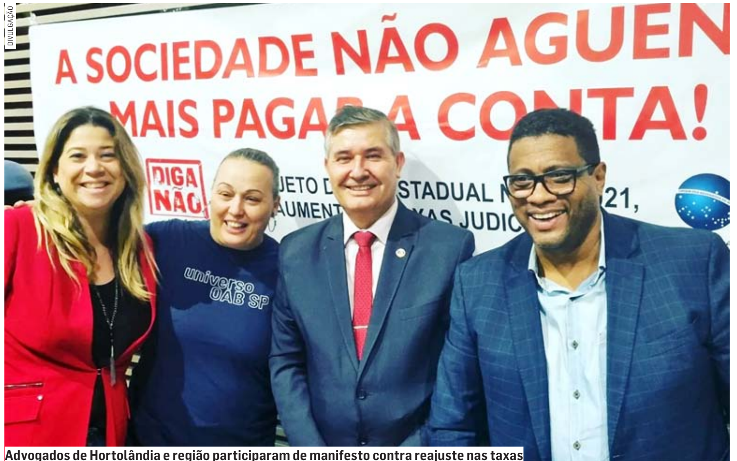
Advogados de Hortolândia e região participaram de manifesto contra reajuste nas taxas

O grupo dialogou com deputados estaduais pedindo a rejeição do Projeto de Lei 752/2021, que