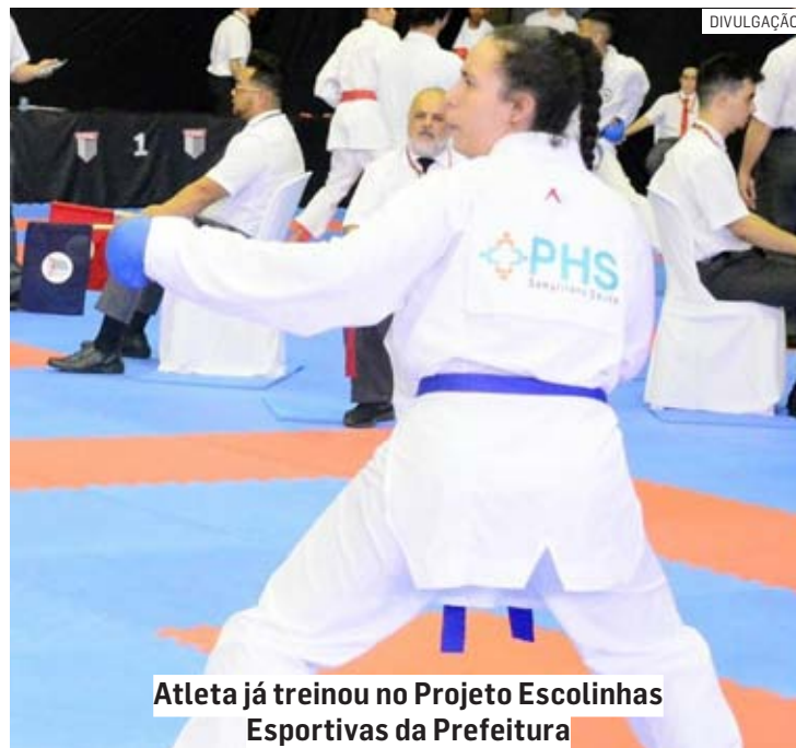
Atleta já treinou no Projeto Escolinhas Esportivas da Prefeitura

No final de semana passado, ela brilhou nas finais do Campeonato Paulista de Karatê, realizado em São Bernardo do Campo. Em diferentes categorias, foram conquistados um terceiro lugar e um vice-campeonato. Antes da