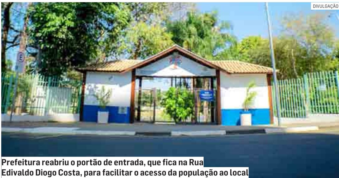
Prefeitura reabriu o portão de entrada, que fica na Rua Edivaldo Diogo Costa, para facilitar o acesso da população ao local

Da Redação | HORTOLÂNDIA tribunaliberal@tribunaliberal.com.br