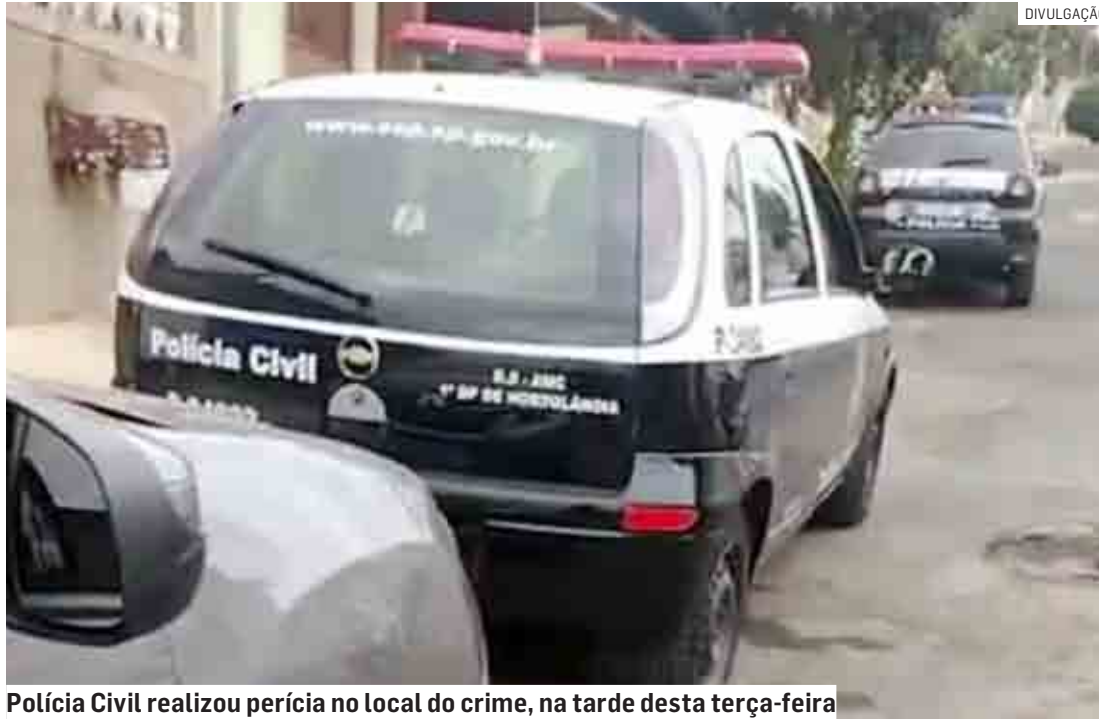
Polícia Civil realizou perícia no local do crime, na tarde desta terça-feira

Um motociclista de 31 anos ficou em estado grave após bater em um carro, na noite desta segunda-feira (5), em Sumaré. A moto bateu na lateral do veículo e ficou enroscada antes de cair com a vítima na Estrada Norma Marson Biondo, que liga Sumaré a Monte Mor. PÁGINA 09