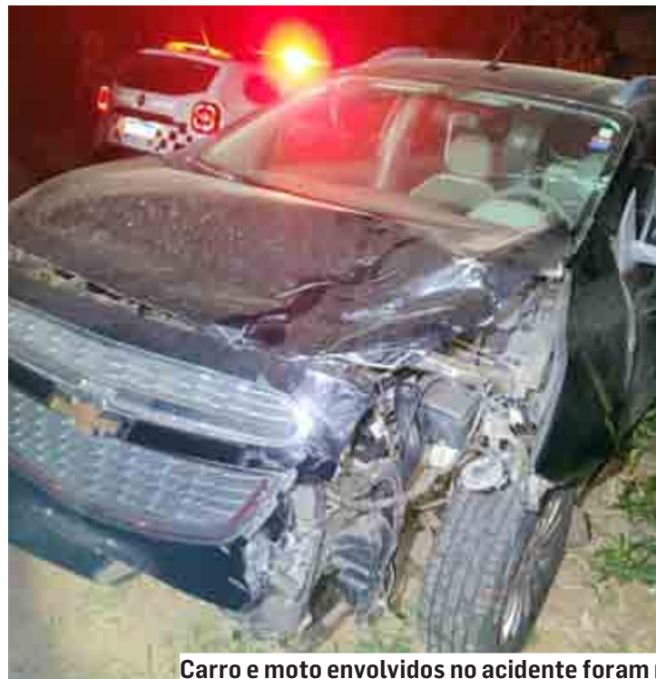
Carro e moto envolvidos no acidente foram removidos ao pátio após o registro da ocorrência

Segundo a Polícia Militar, a mulher que conduzia o carro estava psicologicamente instável após o acidente e