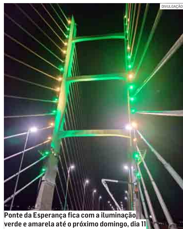
Ponte da Esperança fica com a iluminação verde e amarela até o próximo domingo, dia 11

Periodicamente, a prefeitura projeta cores diferentes na estrutura a fim de homenagear, sensibilizar e conscientizar a população acerca de temas importantes para a sociedade, com repercussão nacional ou internacional. As campanhas mais recentes foram as do “Agosto Laranja”, em razão do mês de conscientização sobre a EM (Esclerose Múltipla), e do “Agosto Lilás”, pelo fim da violência contra a mulher.