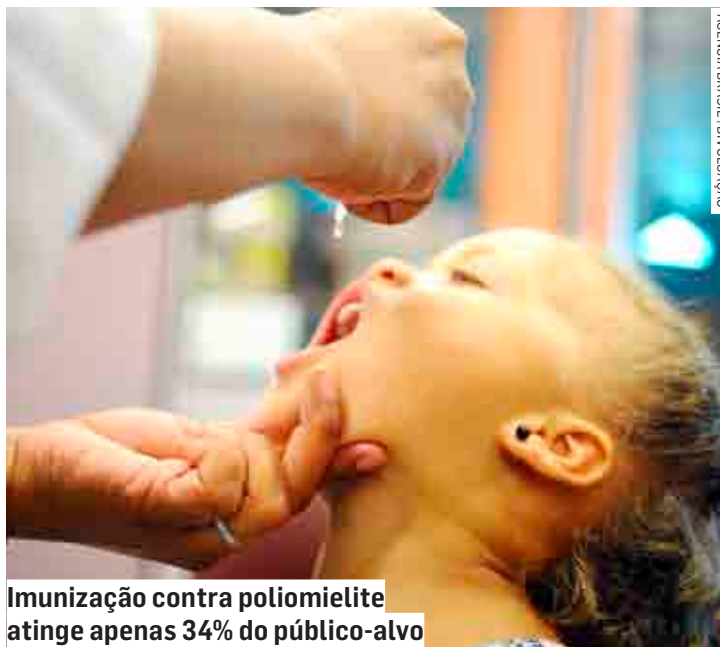
Imunização contra poliomielite atinge apenas 34% do público-alvo

“O Programa Nacional de Imunizações permanece alertando sobre a importância e o benefício da vacinação do público-alvo das campanhas para a manutenção da eliminação da poliomielite, uma vez que a doença permanece como uma prioridade política, nacional e internacional, e a erradicação só será possível mediante esforços globais, e pela necessidade de proteger as crianças e adolescentes contra as doenças imunopre-