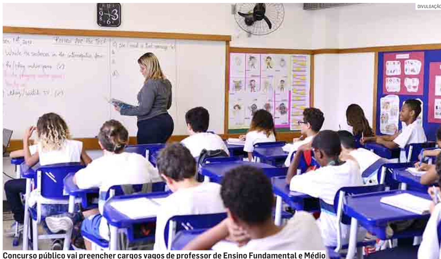
Concurso público vai preencher cargos vagos de professor de Ensino Fundamental e Médio

Despacho do governador Rodrigo Garcia publicado no Diário Oficial informa que o certame deve preencher cargos vagos de professor de Ensino Fundamental e Médio, para o exercício de 2024