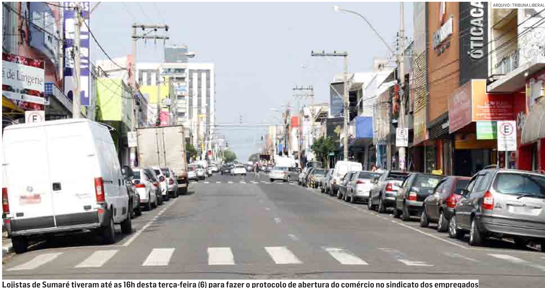
Lojistas de Sumaré tiveram até as 16h desta terça-feira (6) para fazer o protocolo de abertura do comércio no sindicato dos empregados

A determinação foi seguida pelas associações comerciais de Sumaré e Hortolândia. Nessas cidades, o funcionamento das lojas com expediente para funcionários seguem as normas do acordo coletivo. Em Sumaré, as empresas tinham até as 16h desta terça-feira para fazer a solicitação junto ao sindicato dos empregados. Sem a convocação de fun-