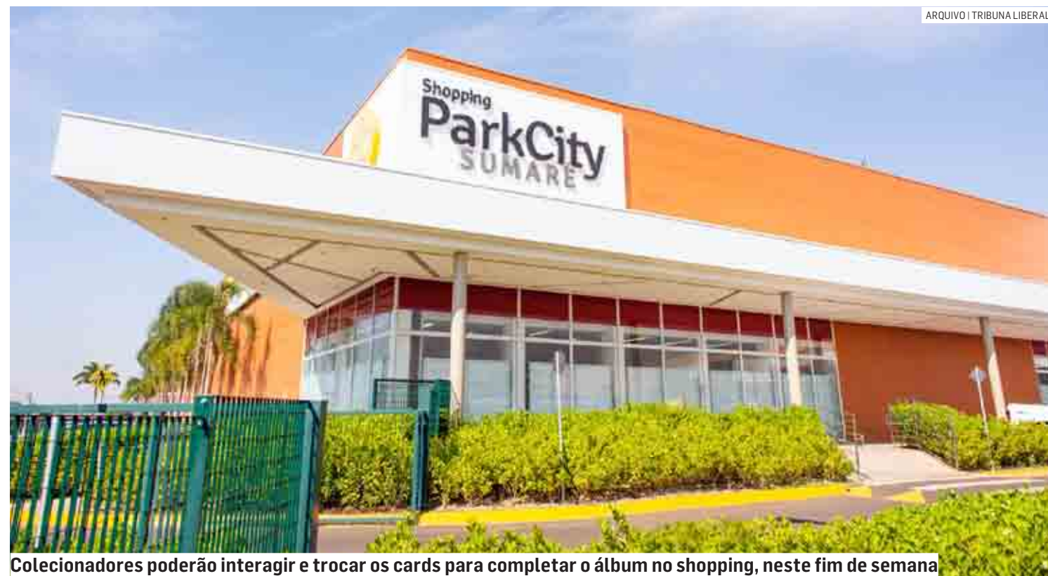
Colecionadores poderão interagir e trocar os cards para completar o álbum no shopping, neste fim de semana

Da Redação | SUMARÉ tribunaliberal@tribunaliberal.com.br