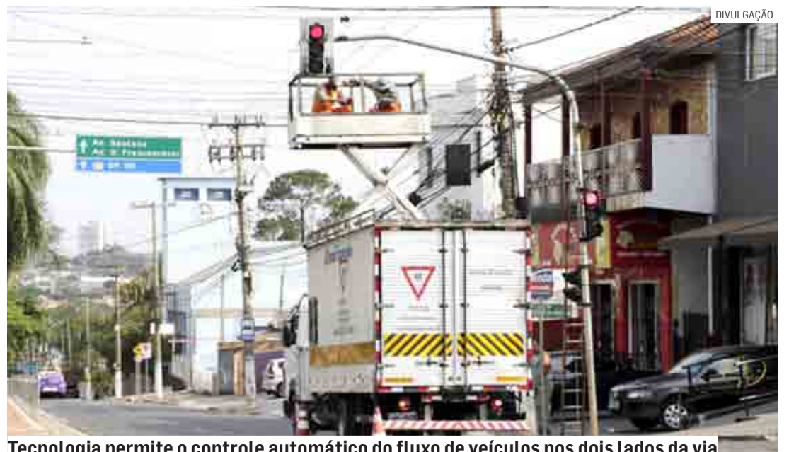
Tecnologia permite o controle automático do fluxo de veículos nos dois lados da via

Além disso, a cidade recebe, periodicamente, um mutirão de Tapar-Buraco em todas as regiões. Outra medida importante é a instalação dos painéis eletrônicos informativos nos portais de entrada e saída da cidade e investimentos na malha cicloviária.