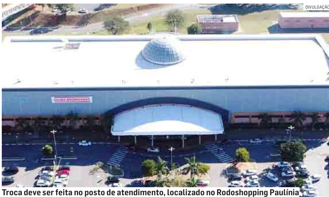
Troca deve ser feita no posto de atendimento, localizado no Rodoshopping Paulínia

Já para fazer a troca do Cartão Escolar, que dá direito a um desconto de 50% sobre a tarifa vigente e é destinado aos estudantes universitários, basta comparecer ao Posto de Atendimento MoV