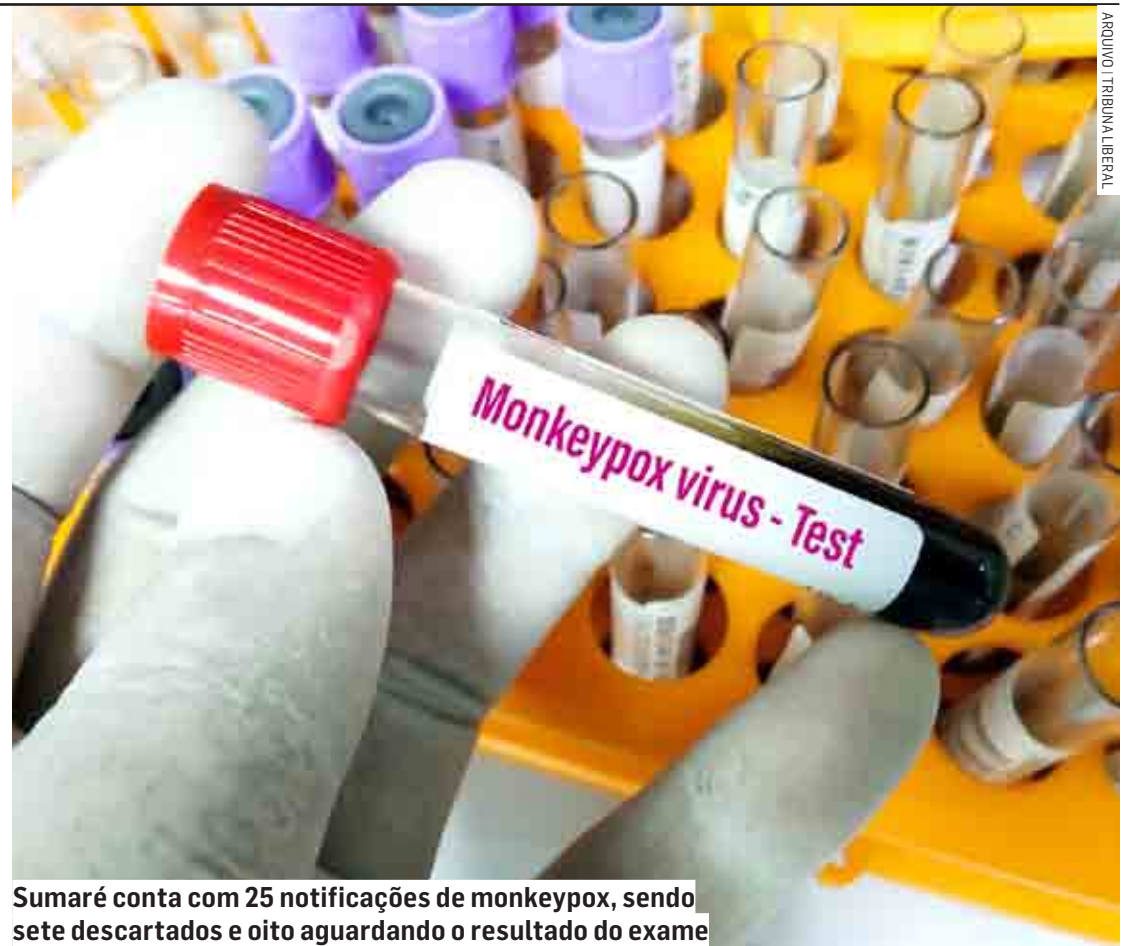
Sumaré conta com 25 notificações de monkeypox, sendo sete descartados e oito aguardando o resultado do exame

A Vigilância Epidemiológica reforça que o atual surto não tem a participação de macacos na transmissão para se-