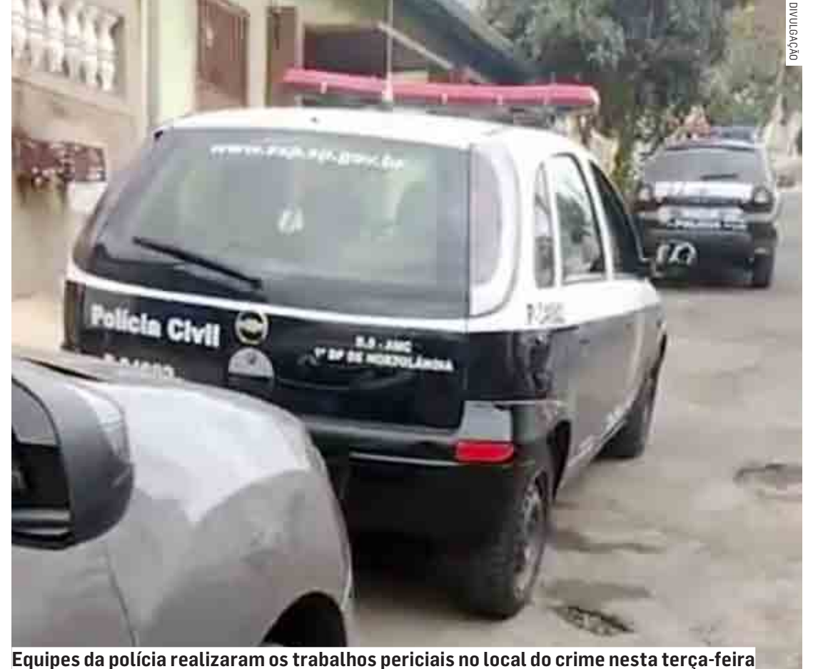
Equipes da polícia realizaram os trabalhos periciais no local do crime nesta terça-feira

duas pessoas. Segundo informou o denunciante, o caso aconteceu na noite de segunda-feira (5) quando um homem chegou armado exigindo que o casal entregasse o dinheiro, na sequência