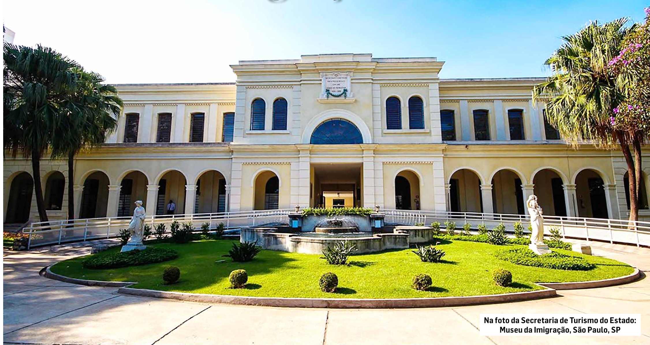
Museu da Imigração, São Paulo, SP

Eram prédios construídos em 1886 e abrigavam as pessoas que chegavam de outros países. Aqueles eram os anos do fim da escravatura e faltava mão de obra, principalmente a especializada. Nos prédios, até 1.000 imigrantes podiam se hospedar e comer gratuitamente por até oito dias, enquanto eram contratados para diversos trabalhos. Assim, no local, hoje é um Museu, onde existe uma parte importante da nossa história, até porque, todos imigrantes eram registrados em livros atualmente indispensáveis para os descendentes, quando querem saber as datas da chegada dos seus antepassados. Os países europeus aceitam os documentos oficiais emitidos pelo Museu da Imigração para obtenção da dupla cidadania, por exemplo. A visita é das 9h às 17h, exceto 2ª-feira. Ingresso para adultos: R$10,00, meia entrada R$5,00. É grátis aos sábados. Há monitores para grupos e um pequeno passeio de trem “Maria Fumaça” nos feriados e fins de semana. Local: Rua Visconde de Parnaíba, 1316, Bairro da Mooca. Informações (11) 2692-1866.