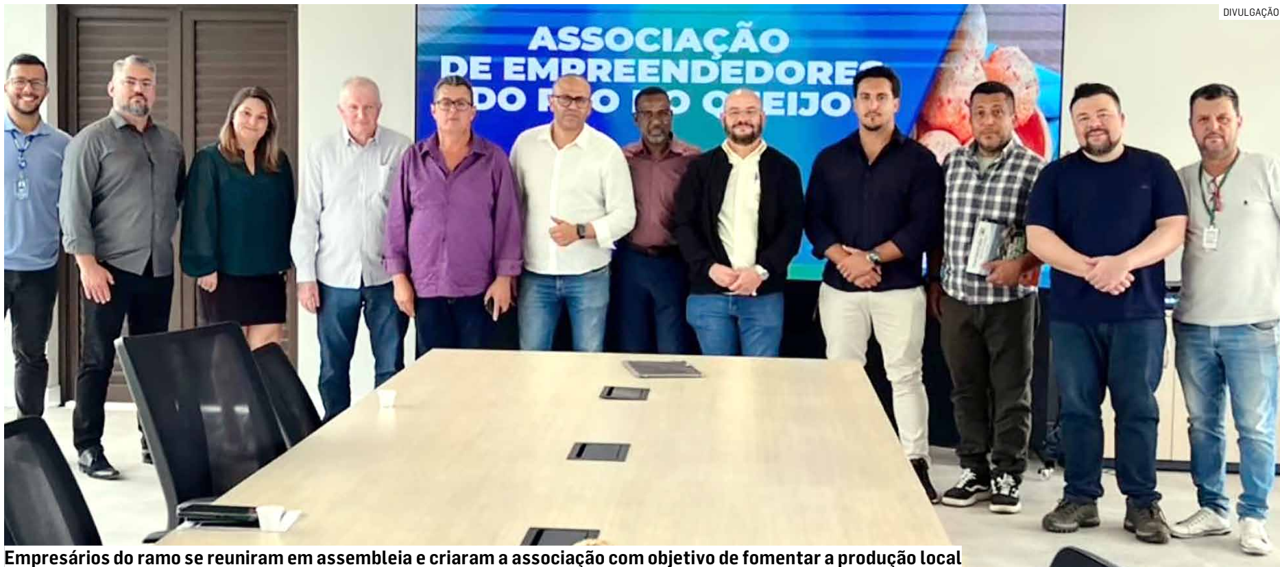
Empresários do ramo se reuniram em assembleia e criaram a associação com objetivo de fomentar a produção local

A cadeia produtiva do pão de queijo em Hortolândia incentiva o desenvolvimento econômico local, gera empregos e renda. Os empresários do ramo se uniram para promover e pre-