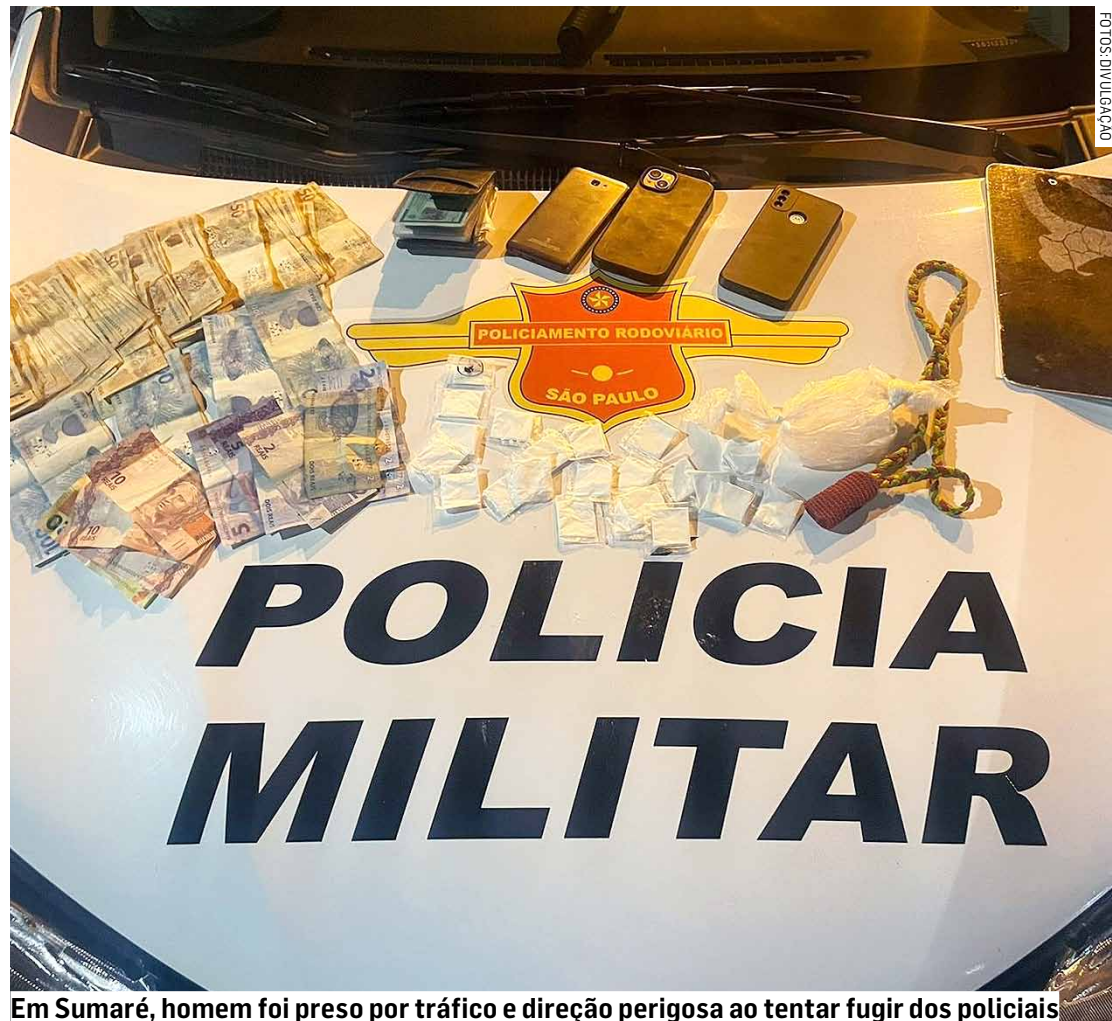
Em Sumaré, homem foi preso por tráfico e direção perigosa ao tentar fugir dos policiais

Durante operação Direção Segura realizada pe-