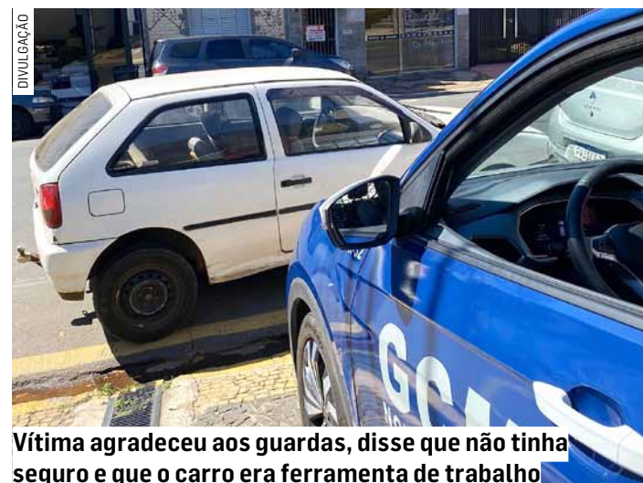
Vítima agradeceu aos guardas, disse que não tinha seguro e que o carro era ferramenta de trabalho

O suspeito confessou o delito e foi conduzido até o Plantão Policial, onde foi preso em flagrante por furto. A vítima compareceu à delegacia e agradeceu a ação da GCM, já que o veículo não possuía seguro e era a ferramenta de trabalho dela.