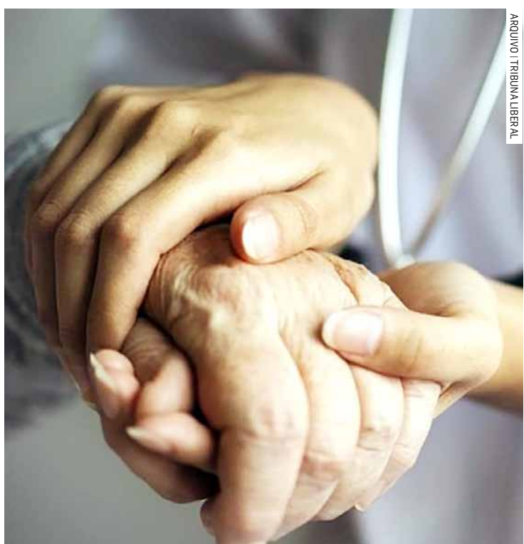
Técnicos atuam em todos dos territórios dos CRASs a procura de usuários do SUAS com dificuldade de locomoção

Da Redação • HORTOLÂNDIA tribunaliberal@tribunaliberal.com.br