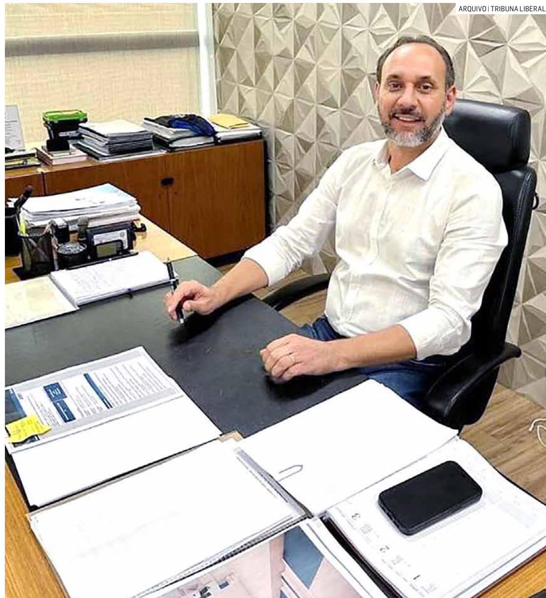
Prefeito de Paulínia sofre críticas por problemas com a falta de remédios nas UBSs e no HMP

A prefeitura não se posiciona sobre o assunto.