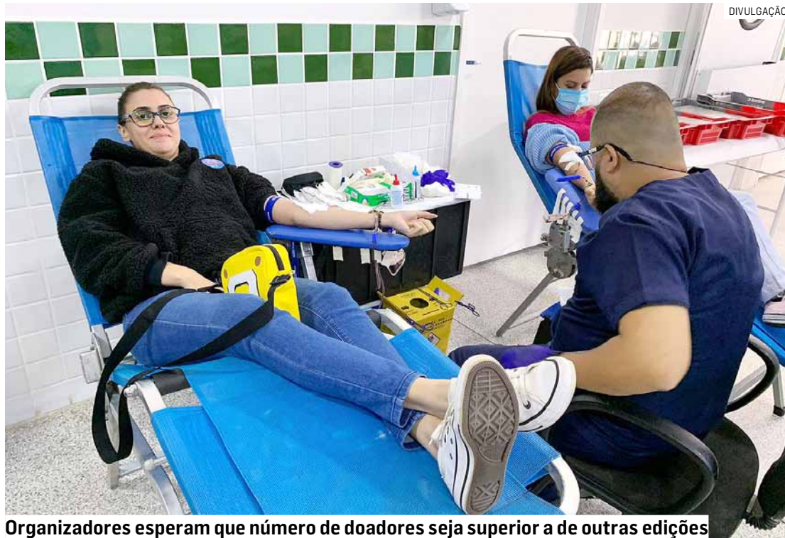
Organizadores esperam que número de doadores seja superior a de outras edições

Na segunda edição, em maio, foram arrecadadas mais 73 bolsas de sangue – 93 candidatos se prontificaram a doar, mas 20 deles não estavam aptos. O balanço foi considerado positivo, principalmente porque 29 pessoas foram doa-