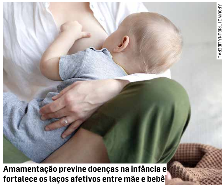
Amamentação previne doenças na infância e fortalece os laços afetivos entre mãe e bebê

de um grupo de gestantes atendidas pela UBS Santa Esmeralda, nesta segunda-feira. As futuras mães conheceram as instalações da maternidade do hospital e foram recepcionadas pelas profissionais da Linha Materno Infantil. As gestantes também assistiram à palestra "Mitos, medos, rede de apoio e armazenamento de leite materno". O município retomou o programa de visitas de gestantes à maternidade em junho deste ano. A campanha Agosto Doura-