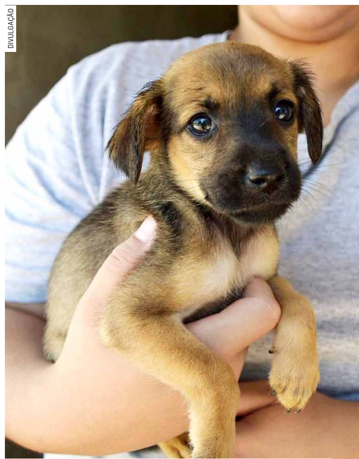
Sede da associação abriga cerca de 400 animais e exige um investimento mensal de R$ 60 mil para manutenção

Desde 2012, a AAANO realiza a feira de adoção todos os sábados, proporcionando uma oportunidade para que os animais encontrem lares responsáveis. Em 2018, a associação desempenhou um papel fundamental na elaboração, em conjunto, com os órgãos municipais, do Estatuto de Defesa, Controle e Proteção dos Animais, o que efetivou a fiscalização municipal de maus-tratos, além da cria-