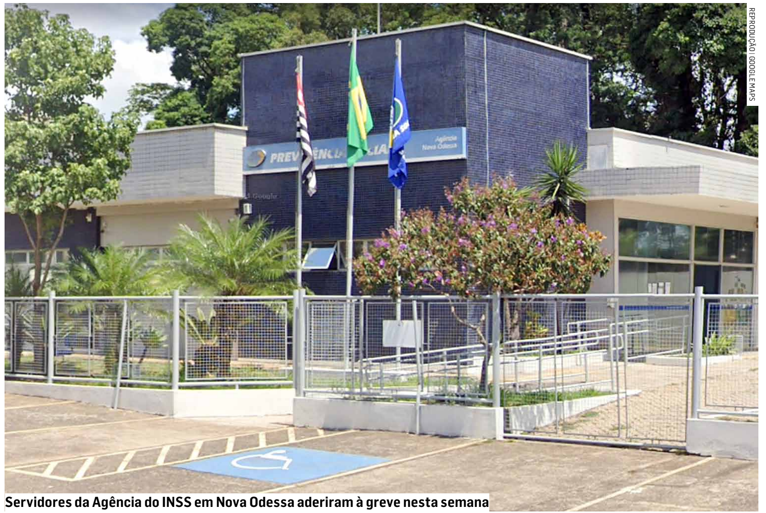
Servidores da Agência do INSS em Nova Odessa aderiram à greve nesta semana

Na ocasião, a média geral da força de trabalho para o reconhecimento de direitos, MOB (monitoramento