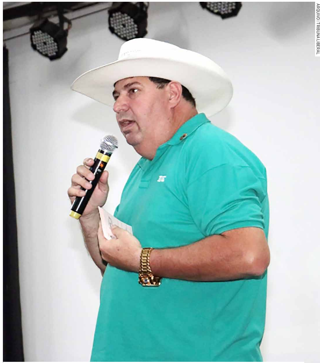
Prefeito de Monte Mor correu para o Legislativo e fez live contra decisão de vereadores

A controvérsia sobre as contas municipais de 2016 a 2019 promete continuar sendo um tema quente em Monte Mor, com potencial de impactar as próximas eleições municipais e a estabilidade política da cidade.