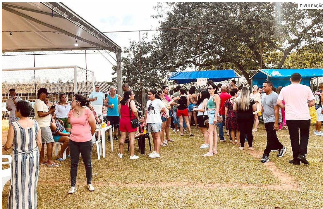
Encontro Nordestino acontece neste sábado das 17h às 22h, no ‘Calçadão do Parque Triunfo’