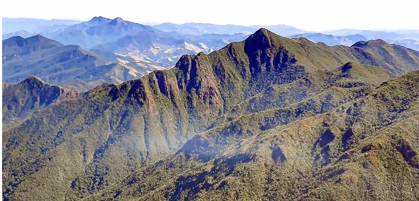
Na foto: Pedra da Mina, no coração da Serra da Mantiqueira

A Pedra da Mina ou, ocasionalmente, o Pico da Pedra da Mina é a quarta montanha do Brasil, com 2798 metros de altitude. Localizada no coração da Serra da Mantiqueira, entre o Parque Nacional do Itatiaia e o maciço Marins-Itaguapé, a sua conquista é datada em 1952 para fins de medição, mas foi somente no ano de 2000, com uma nova aferição e medidores mais precisos, o seu verdadeiro lugar entre as montanhas mais altas e expressivas do país veio à tona. Mais alta, portanto, que Agulhas Negras. O Pico Pedra da Mina fica no trecho da Serra da Mantiqueira chamado de “Serra Fina”. Ali temos a divisa de Queluz (SP) e Passa Quatro (MG). Na Serra Fina nasce o Rio Claro que é a nascente mais alta do Brasil (2.500m) e localizada no município de Queluz.