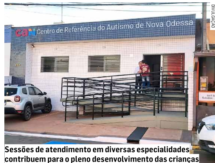
Sessões de atendimento em diversas especialidades contribuem para o pleno desenvolvimento das crianças

Todo o atendimento é pago pela prefeitura, sem custo para as famílias atendidas, e tem sido aprovado pela maioria das mães e pais das crianças com TEA (Transtorno do Espectro Autista) que passam semanalmente pelo local. O funcionamento do Centro de Autistas de Nova Odessa foi