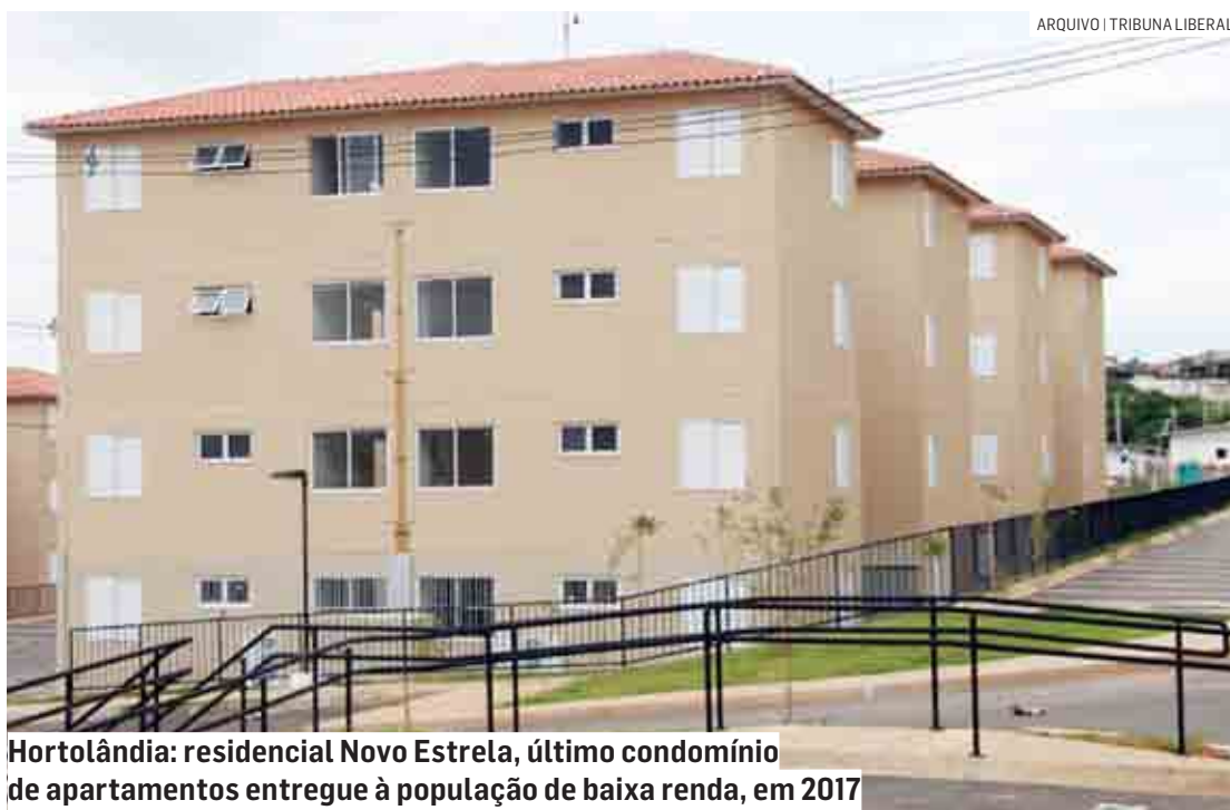
Hortolândia: residencial Novo Estrela, último condomínio de apartamentos entregue à população de baixa renda, em 2017

A cidade é um dos municípios da RMC que mais construiu apartamentos populares com subsídio do governo federal durante o Minha Casa Minha Vida, com 3.392 unidades entregues, segundo a prefeitura. “Na prática, a extinção da faixa 1