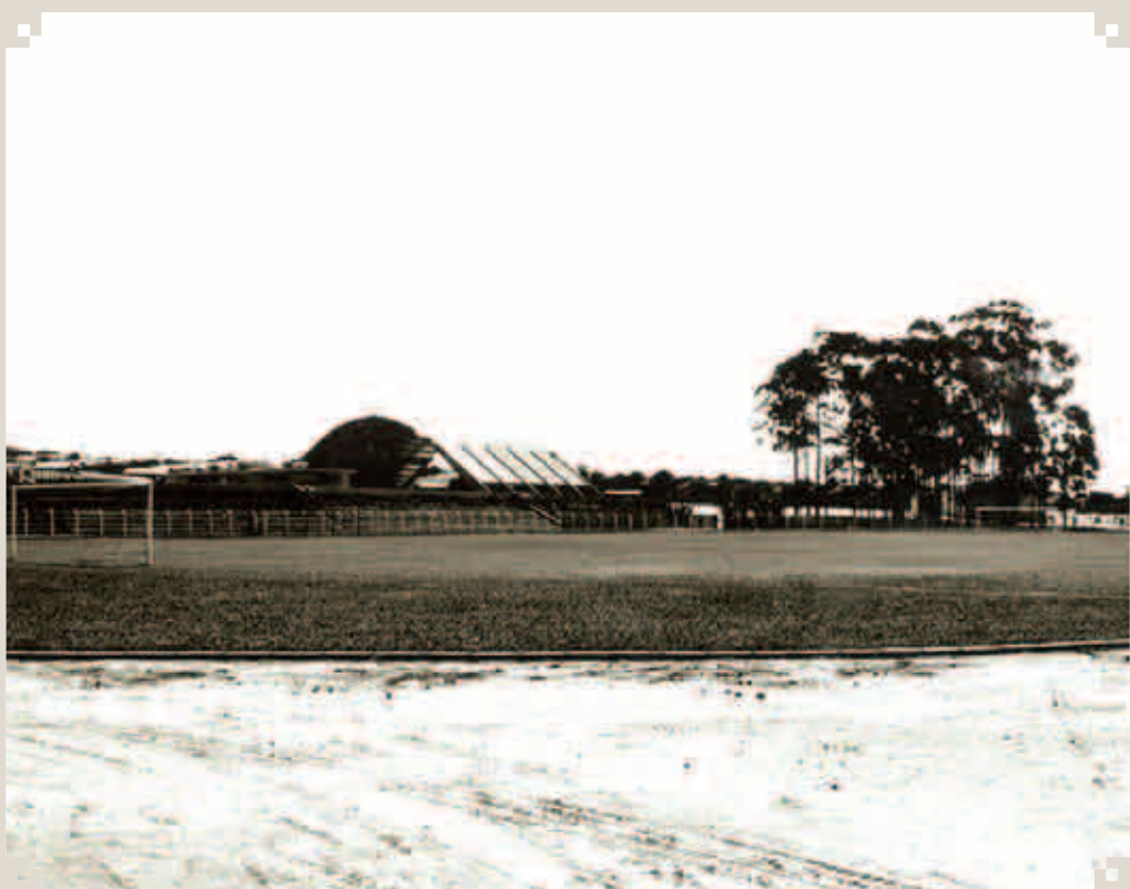
Foto da década de 1970 do Centro Esportivo "Vereador José Pereira", da Prefeitura Municipal de Sumaré. Sua construção e inauguração aconteceu no governo de João Smânio Franceschini (1973 a 1976).