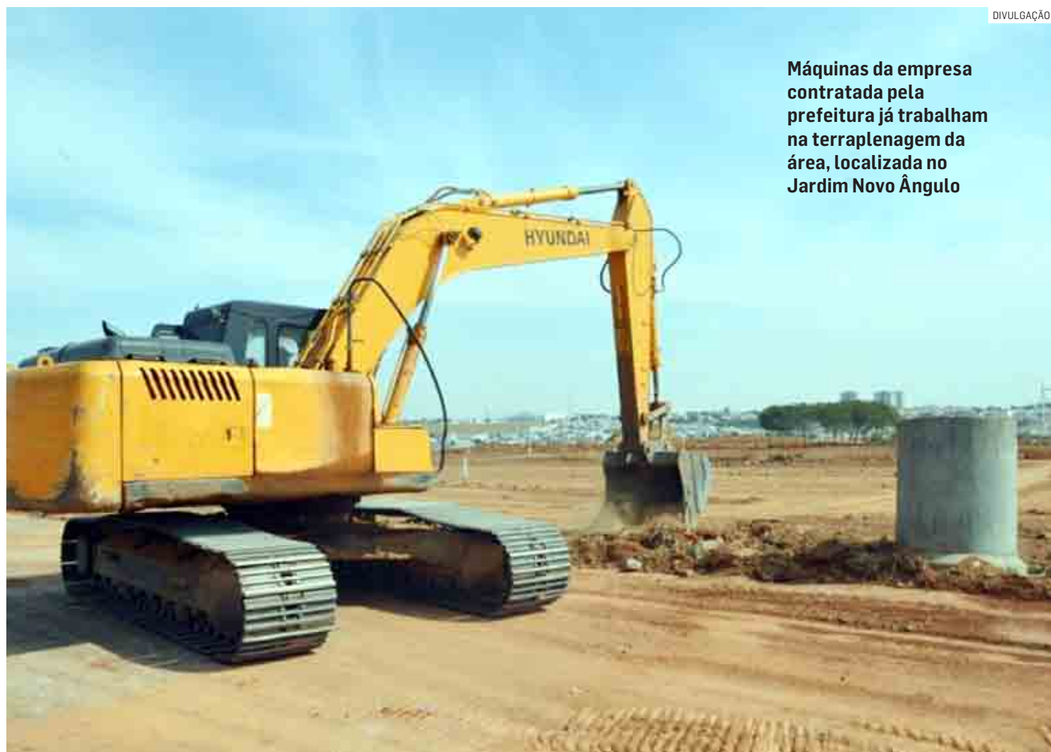
Máquinas da empresa contratada pela prefeitura já trabalham na terraplanagem da área, localizada no Jardim Novo Ângulo

O projeto prevê ainda que o prédio tenha cisternas para armazenamento de águas da chuva, que serão utilizadas tanto na manutenção dos