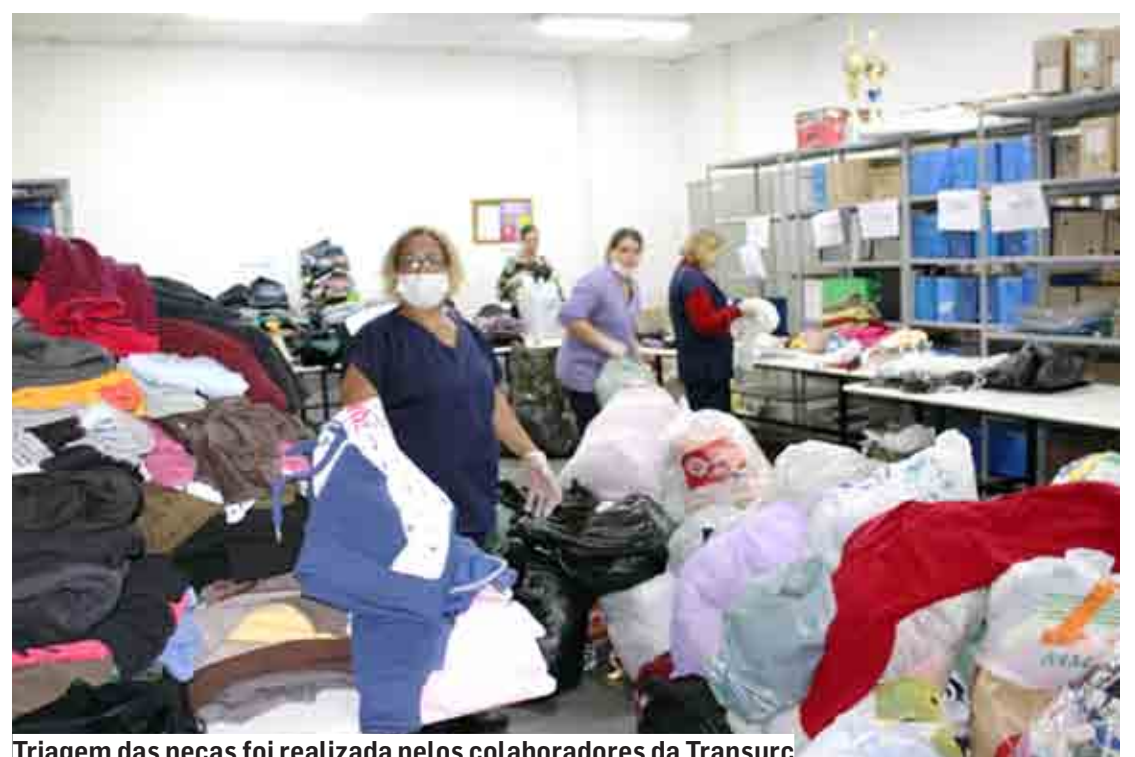
Triagem das peças foi realizada pelos colaboradores da Transurc

A burocratização para que o cidadão tenha acesso ao tratamento de que necessita vai na contramão da norma suprema, que é a Constituição Federal.