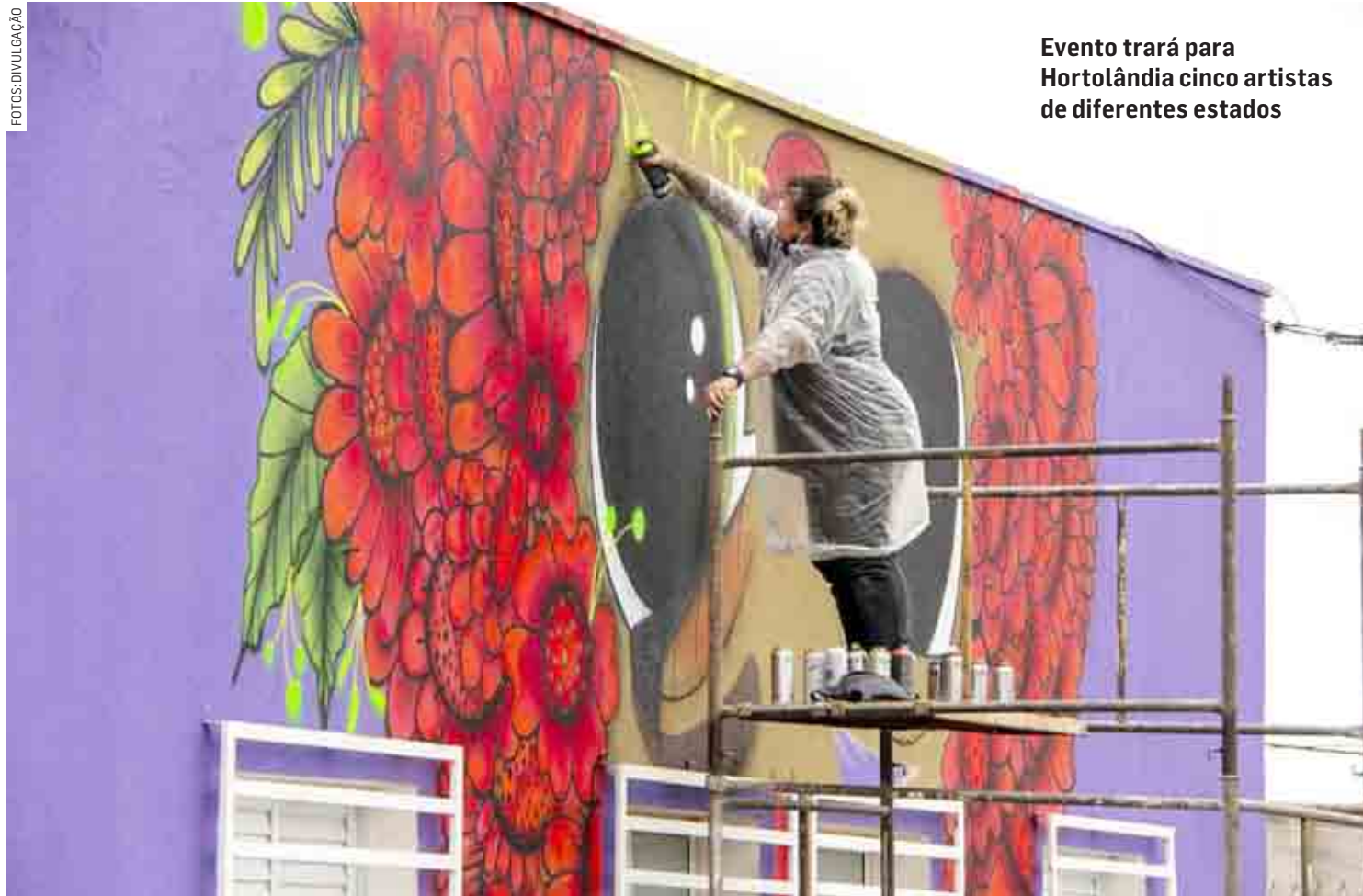
Evento trará para Hortolândia cinco artistas de diferentes estados