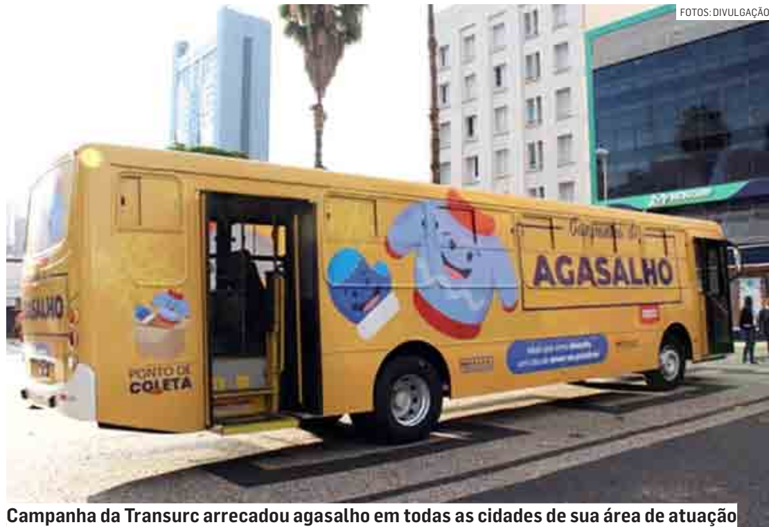
Campanha da Transurc arrecadou agasalho em todas as cidades de sua área de atuação

Equipe de colaboradores da Transurc fez a triagem das doações, de forma que as entidades pudessem receber sempre agasalhos em bom estado de conservação; mais de 27 mil peças foram arrecadadas