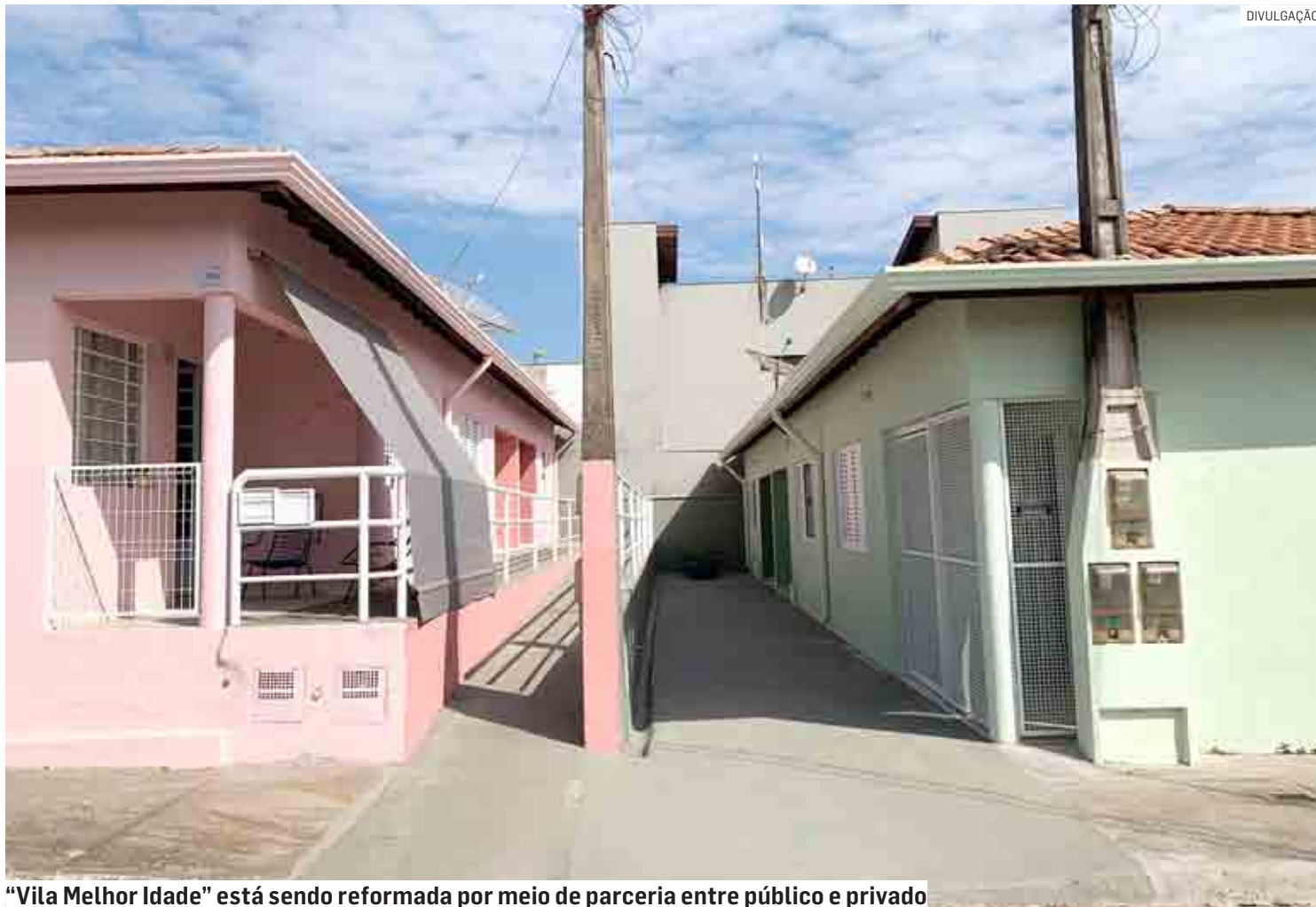
"Vila Melhor Idade" está sendo reformada por meio de parceria entre público e privado

Orçada em quase R$ 500 mil pela Gallo Engenharia, a título de contrapartida ao município, a reforma vai contemplar gradualmente (três por vez) as 30 casas (das quais 27 estão ocupadas no momento), tanto interna quanto externamente. O local ainda vai ganhar cerca, cancela e uma praça com uma Academia da Melhor Idade (equipamentos de ginástica adaptados a esta faixa etária).