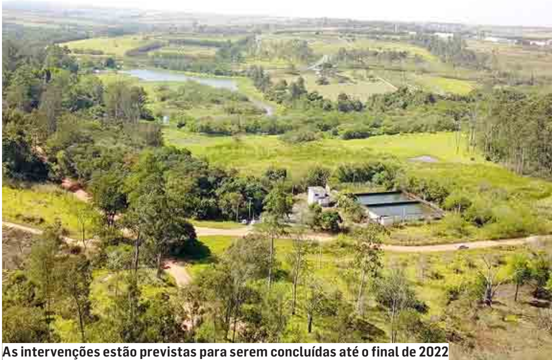
As intervenções estão previstas para serem concluídas até o final de 2022