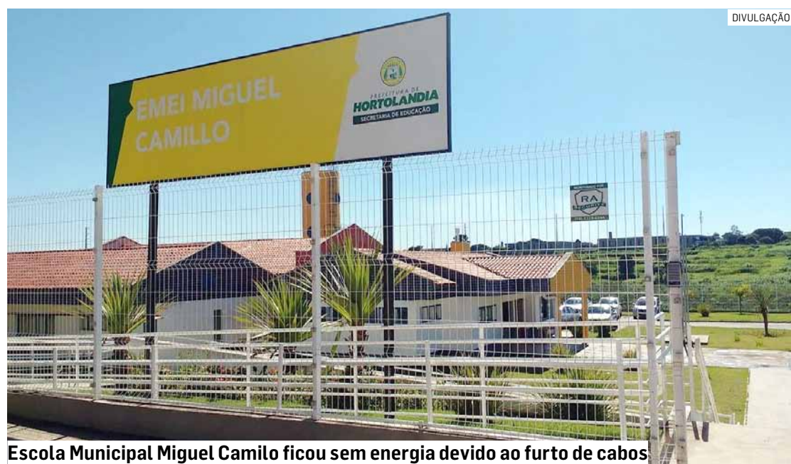
Escola Municipal Miguel Camilo ficou sem energia devido ao furto de cabos

O homem foi questionado sobre o furto dos cabos elétricos, mas negou. Mas como ele já era conhecido da Guarda pela prática de crimes de furto, foi levado até o Plantão Policial de Hortolândia, e o delegado determinou a elaboração do boletim de ocorrência. O acusado ficou preso e vai responder por furto, desacato, resistência e lesão corporal.