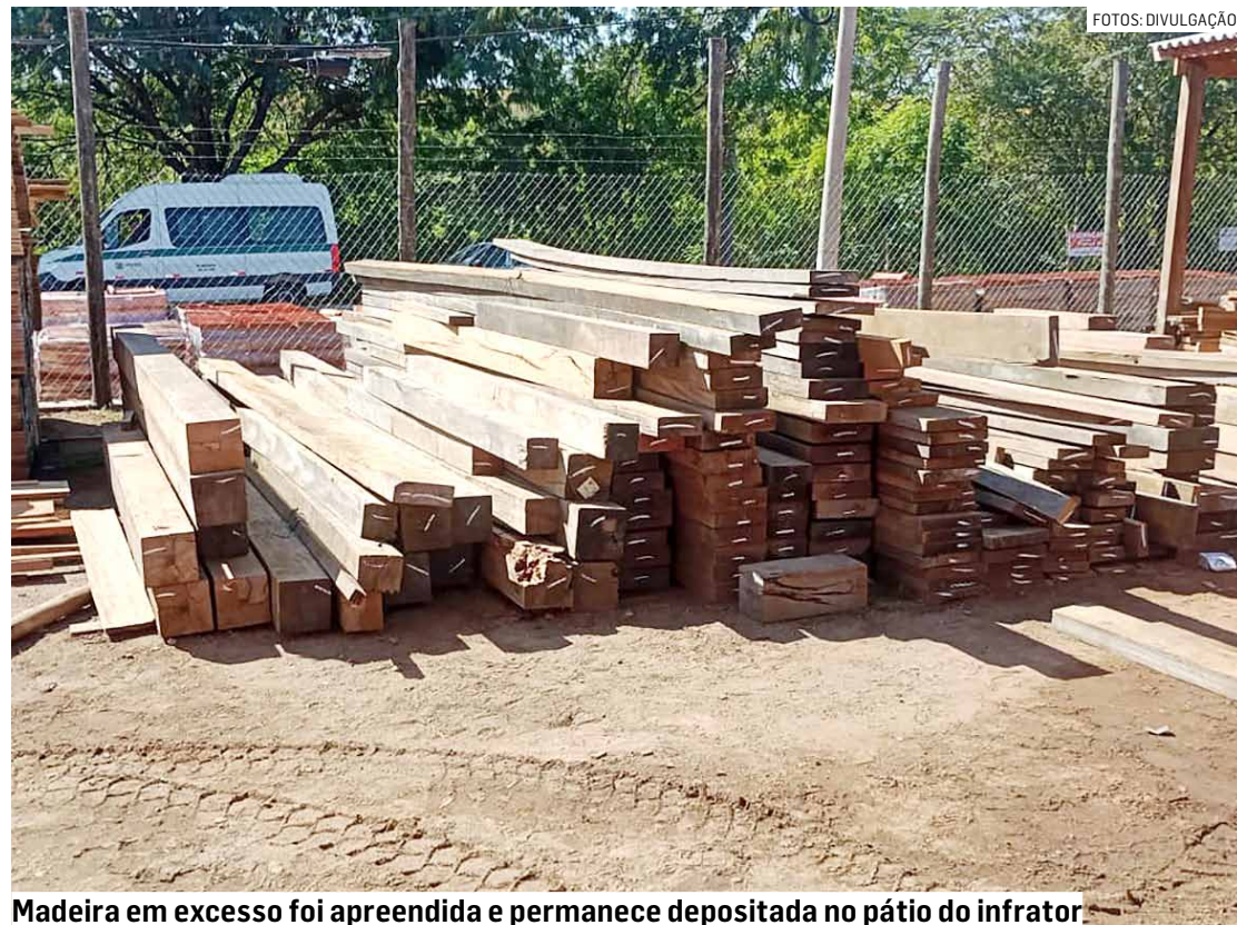
Madeira em excesso foi apreendida e permanece depositada no pátio do infrator

De acordo com a polícia, durante a operação, as equipes realizaram uma aferição minuciosa de todo o estoque de madeira nativa presente no pátio. Utilizando o método de conferência peça a peça, por