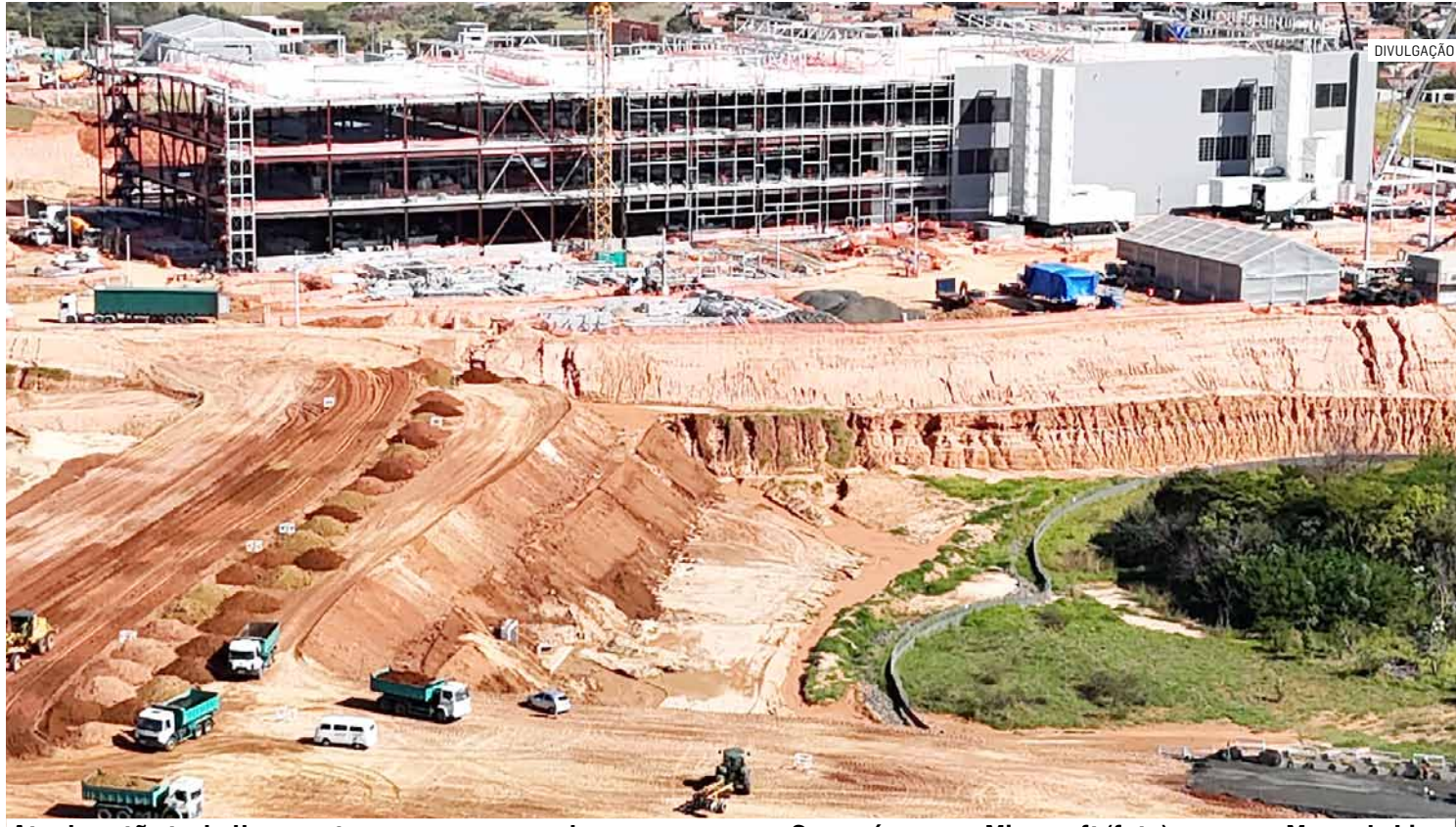
Atual gestão trabalha para trazer novas e grandes empresas para Sumaré, como a Microsoft (foto) e agora o Mercado Livre

A indústria destacou-se como o setor com maior número de novas vagas, totalizando 213 empregos gerados, sendo o setor que