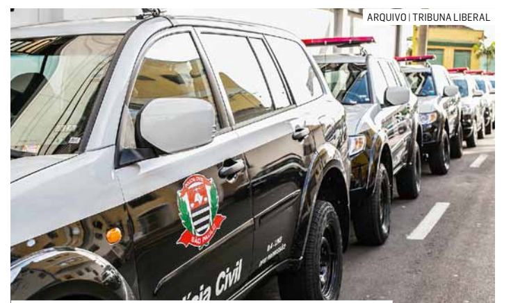
Com a aprovação do projeto, policiais estarão mais rapidamente nas ruas e delegacias do Estado