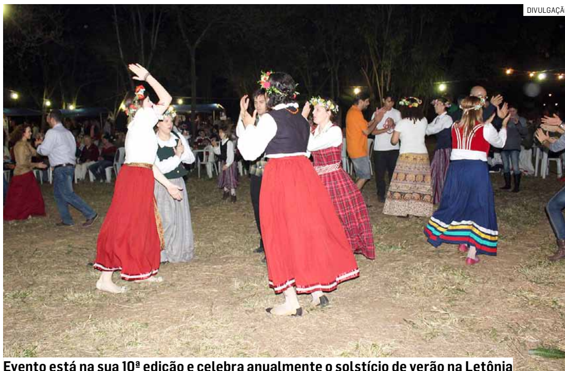
Evento está na sua 10ª edição e celebra anualmente o solstício de verão na Letônia

“A Festa Ligo está na sua 10ª edição e nosso intuito é manter essa tradição. Na Festa Ligo os convidados poderão experimentar pratos feitos aqui em Nova Odessa, mas com um toque leto. São receitas passadas de geração a geração. Quem quiser também poderá vestir trajes típicos da Letônia ou de outro país. Na Letônia, durante a Fes-