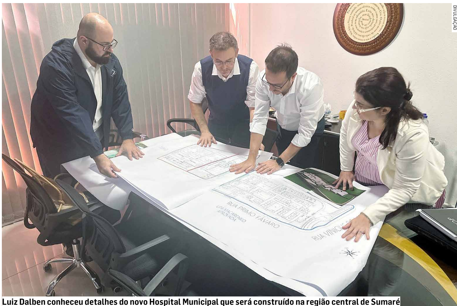
Luiz Dalben conheceu detalhes do novo Hospital Municipal que será construído na região central de Sumaré

“Muito feliz com mais esta grandiosa conquista. Agradeço ao secretário Eleuses e ao governador Tarcísio de Freitas pelo empenho em melhorar a Saúde da cidade, da nossa região, de todo o Estado, e por toda esta parceria que tem dado muitos resultados positivos para a população! Juntos, para Sumaré, já levamos Etec, Restaurante Bom Prato, Poupatempo, Corpo de Bombeiros, importantes obras de infraestrutura como duplicação de rodovias, viadutos e recuperação de estradas, e agora vamos iniciar mais este importante projeto: a construção do Hospital Municipal”, falou o deputado Dirceu Dalben (Cidadania).