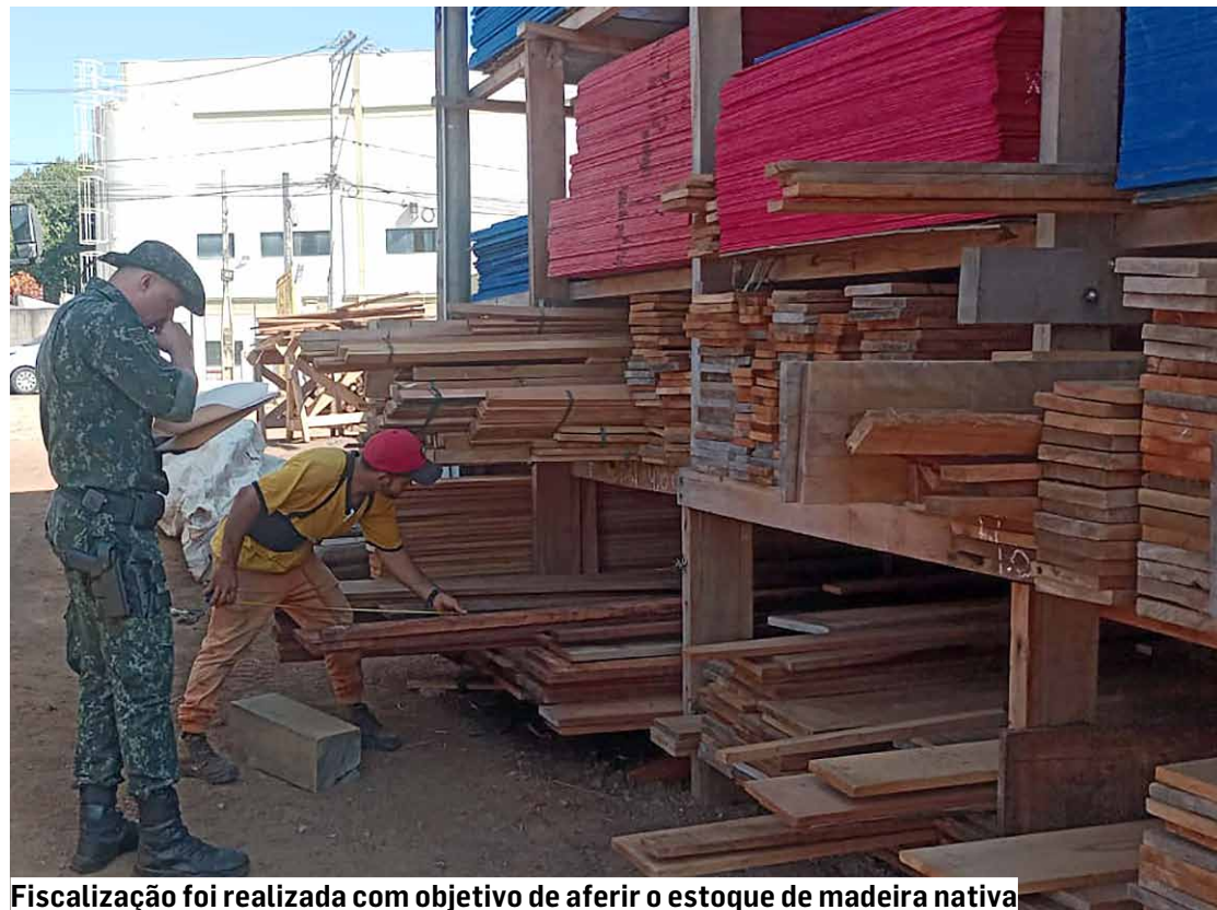
Fiscalização foi realizada com objetivo de aferir o estoque de madeira nativa

Equipes realizaram uma aferição minuciosa de todo o estoque de madeira nativa presente no pátio, utilizando o método de conferência peça a peça, por espécie e tipo de corte