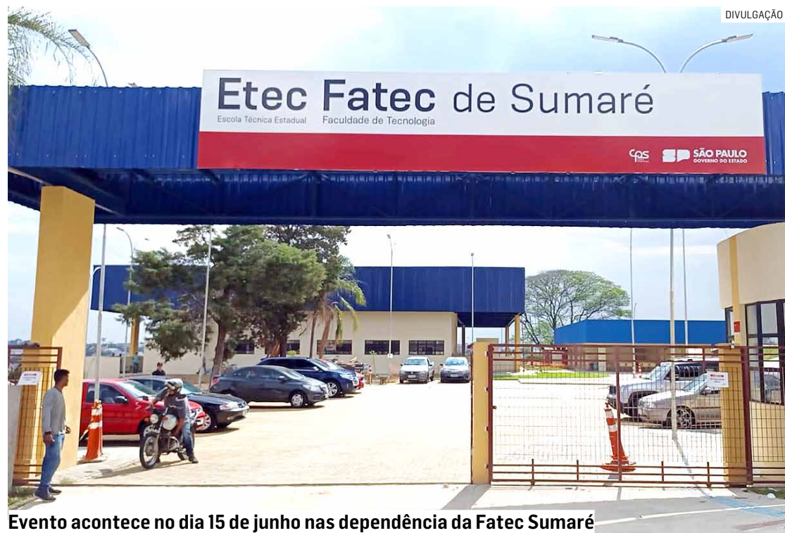
Evento acontece no dia 15 de junho nas dependências da Fatec Sumaré

Da Redação • SUMARÉ tribunaliberal@tribunaliberal.com.br