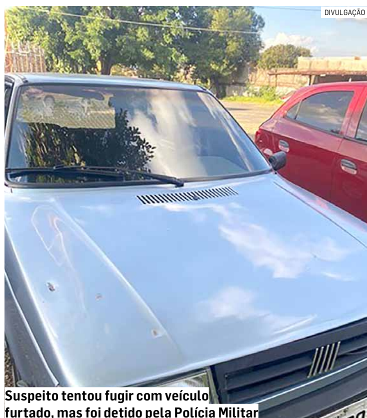
Suspeito tentou fugir com veículo furtado, mas foi detido pela Polícia Militar