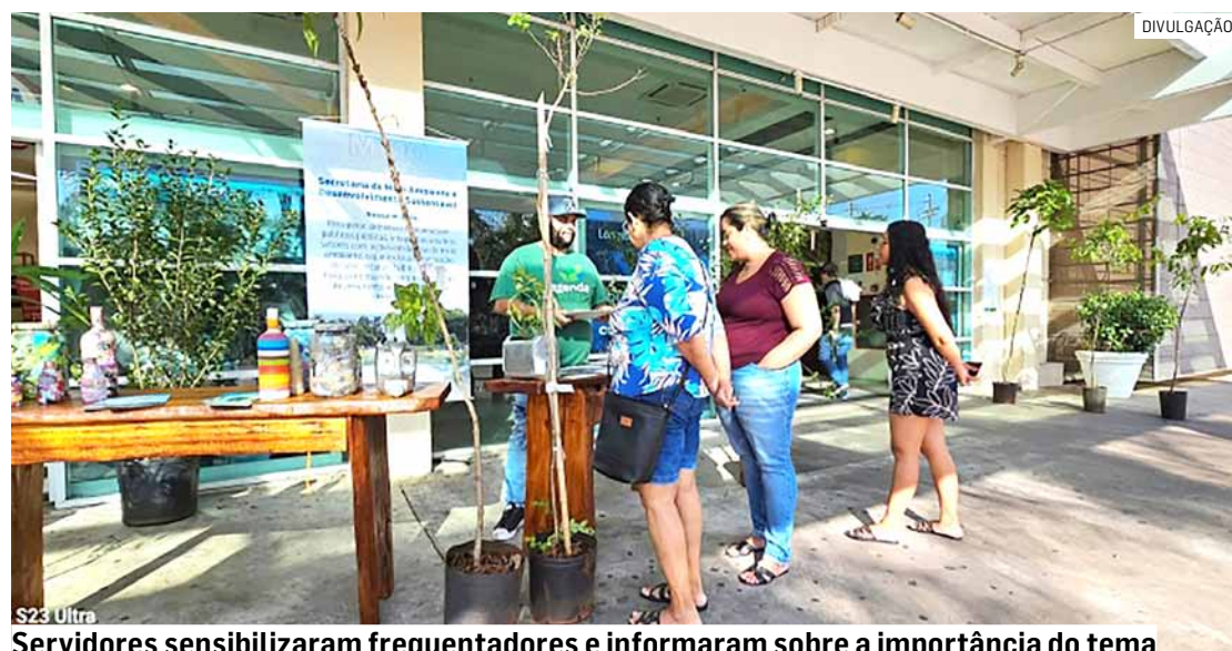
Servidores sensibilizaram frequentadores e informaram sobre a importância do tema

Neste ano, o tema focado pelos ambientalistas é "Nossa Terra, Nosso Futuro". A ideia é promover o combate à desertificação, restaurar a terra e desenvolver a resiliência à seca. O tema da campanha de