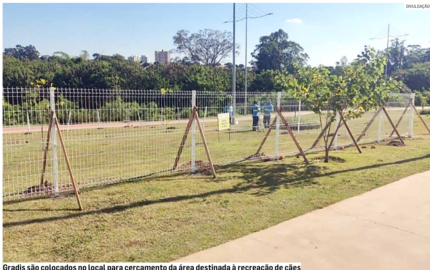
Gradis são colocados no local para cercamento da área destinada à recreação de cães

A ação é promovida pela Coordenadoria Estadual de Defesa Civil, com o apoio