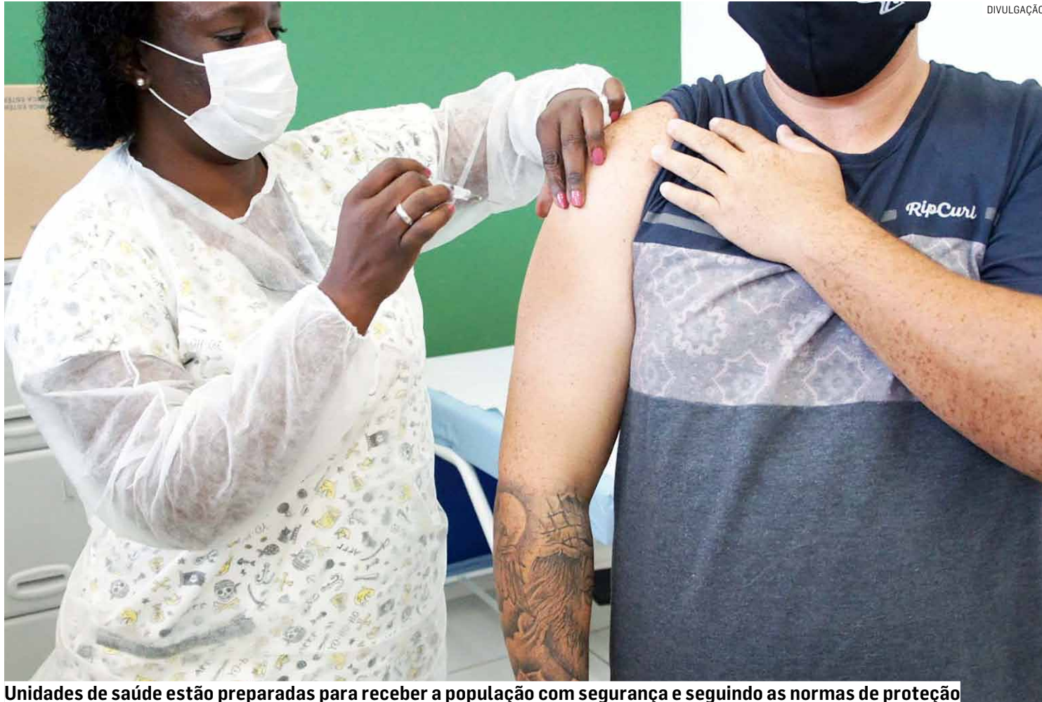
Unidades de saúde estão preparadas para receber a população com segurança e seguindo as normas de proteção

“O nosso objetivo é proteger a população contra o vírus H1N1. Nossas unidades de saúde estão preparadas para receber todos com segurança e seguindo as normas de proteção”, declarou o prefeito Luiz Dalben (PSD). A vacina é contraindicada para pessoas com