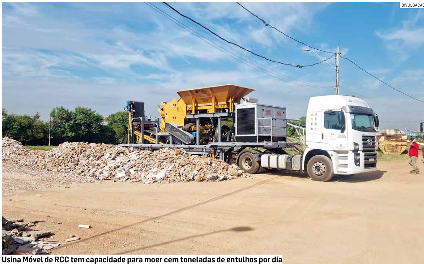
Usina Móvel de RCC tem capacidade para moer cem toneladas de entulhos por dia

A estrutura da Usina Móvel de RCC é composta por um caminhão conjugado a um equipamento móvel, que tritura restos da cons-