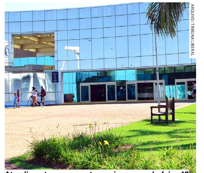
Atendimento no paço retornará na segunda-feira, 10

Cemitérios Municipais João Rodrigues e Parque das Palmeiras: funcionamento das 7h às 17h