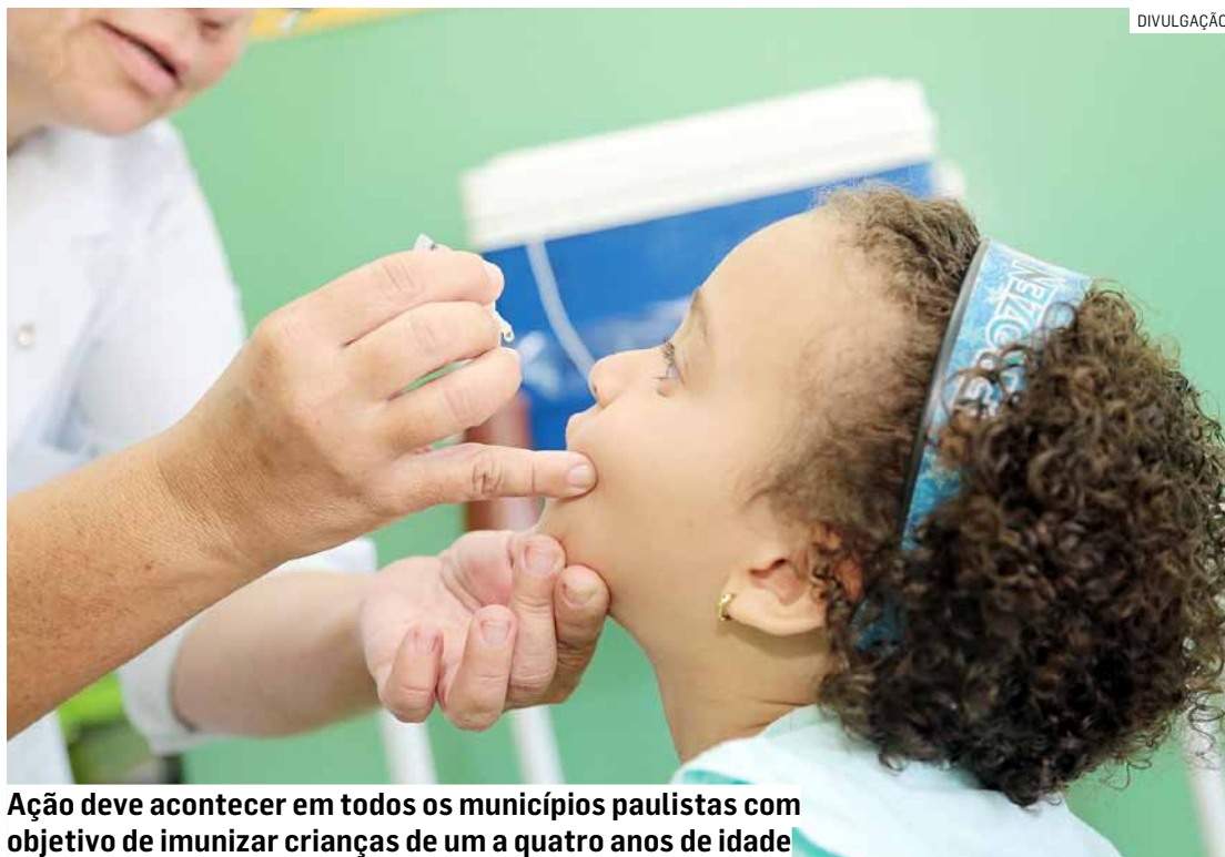
Ação deve acontecer em todos os municípios paulistas com objetivo de imunizar crianças de um a quatro anos de idade