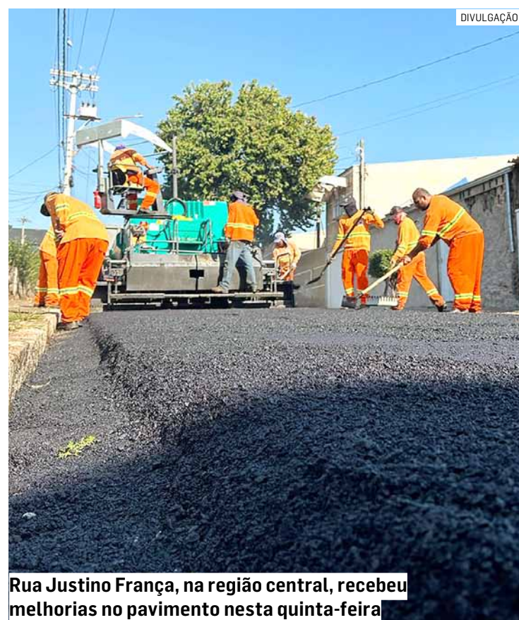
Rua Justino França, na região central, recebeu melhorias no pavimento nesta quinta-feira

A meta do programa é contribuir significativamente para a mobilidade urbana, além de agregar valor às áreas atendidas. O PRC é promovido pela Administração Municipal desde 2017 e já garantiu mais de seis milhões de metros quadrados de asfalto novo em todas as regiões de Sumaré, com recursos próprios do município e emendas do deputado Dirceu Dalben.