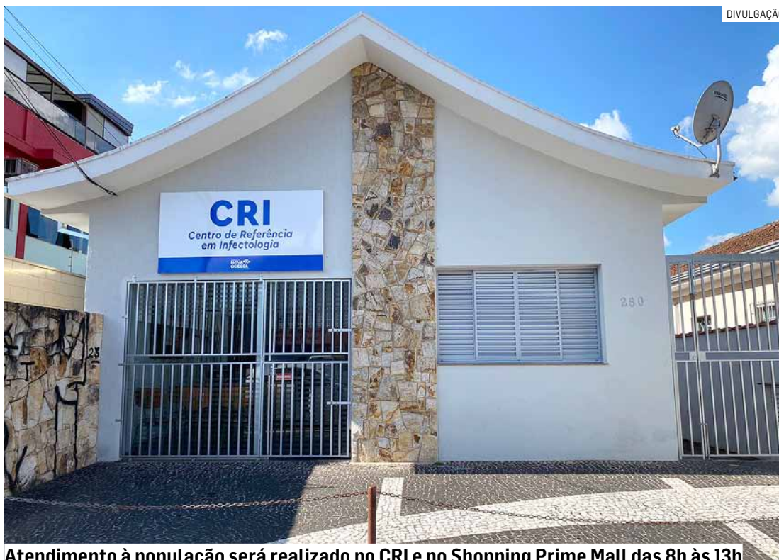
Atendimento à população será realizado no CRI e no Shopping Prime Mall das 8h às 13h

São oferecidas orientações sobre HIV, sífilis e ou-