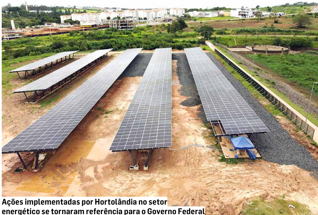
Ações implementadas por Hortolândia no setor energético se tornaram referência para o Governo Federal