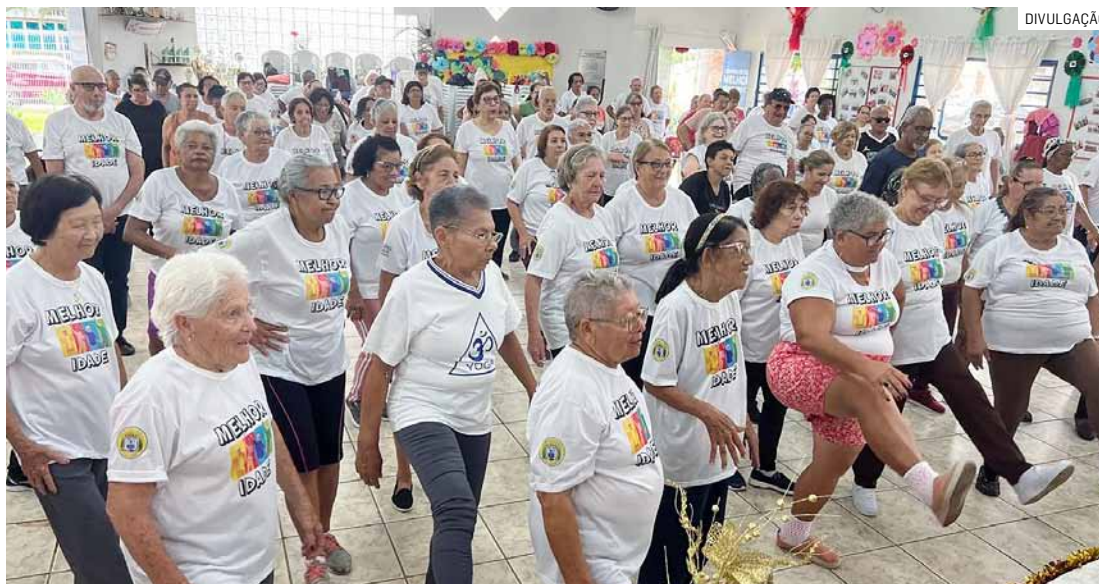
Idosos participaram de diversas atividades físicas ministradas pelos professores do CCMI

Durante toda a manhã, os idosos puderam participar de atividades físicas diversas, com exercícios de boxe, capoeira, ginás-