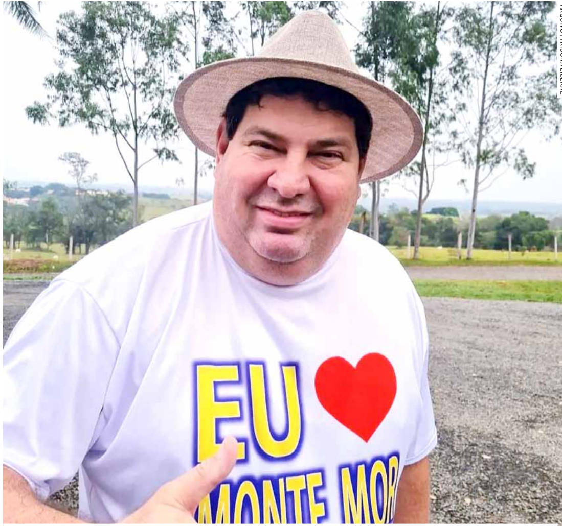
Prefeito de Monte Mor publicou exoneração de 'fiel escudeiro' na administração municipal