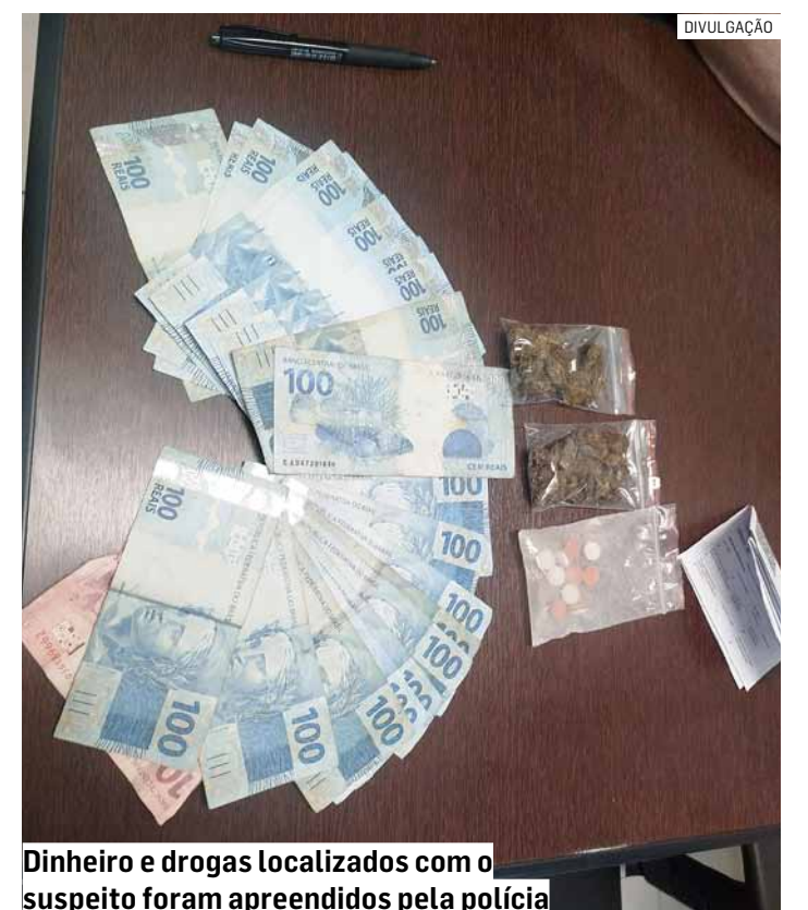
Dinheiro e drogas localizados com o suspeito foram apreendidos pela polícia

O suspeito foi conduzido até o 1º Distrito Policial de Sumaré. Após registro do boletim de ocorrência, o homem foi liberado.