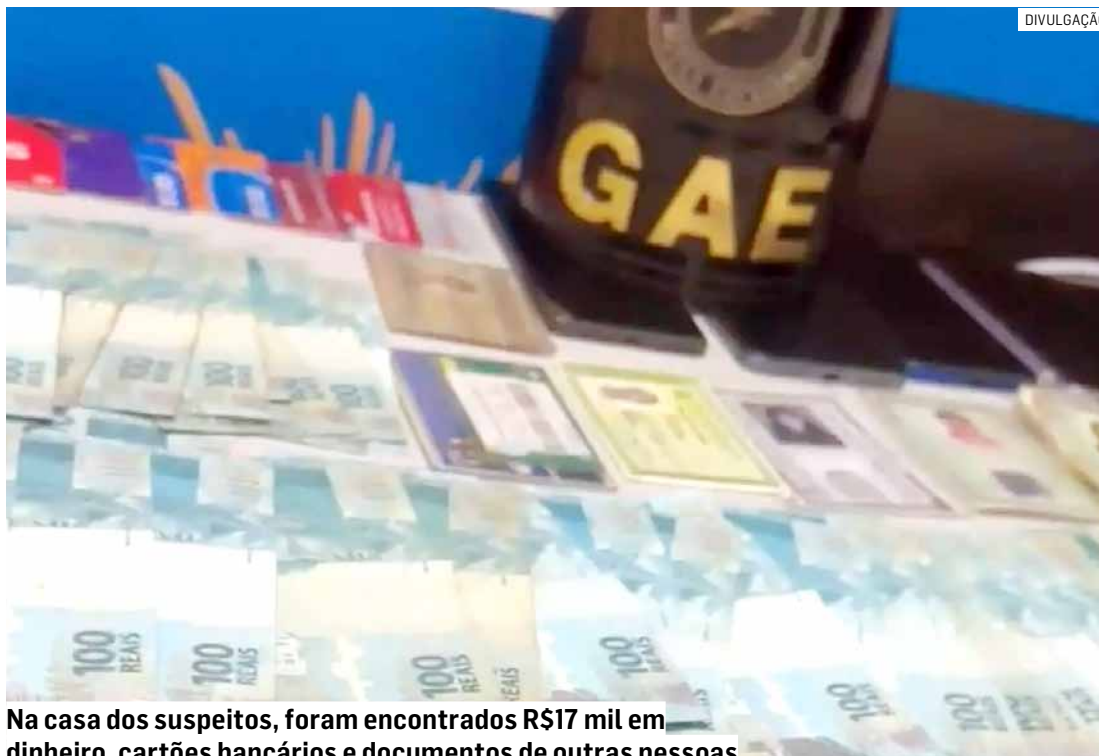
Na casa dos suspeitos, foram encontrados R$17 mil em dinheiro, cartões bancários e documentos de outras pessoas

A suspeita também confessou que ela e o marido