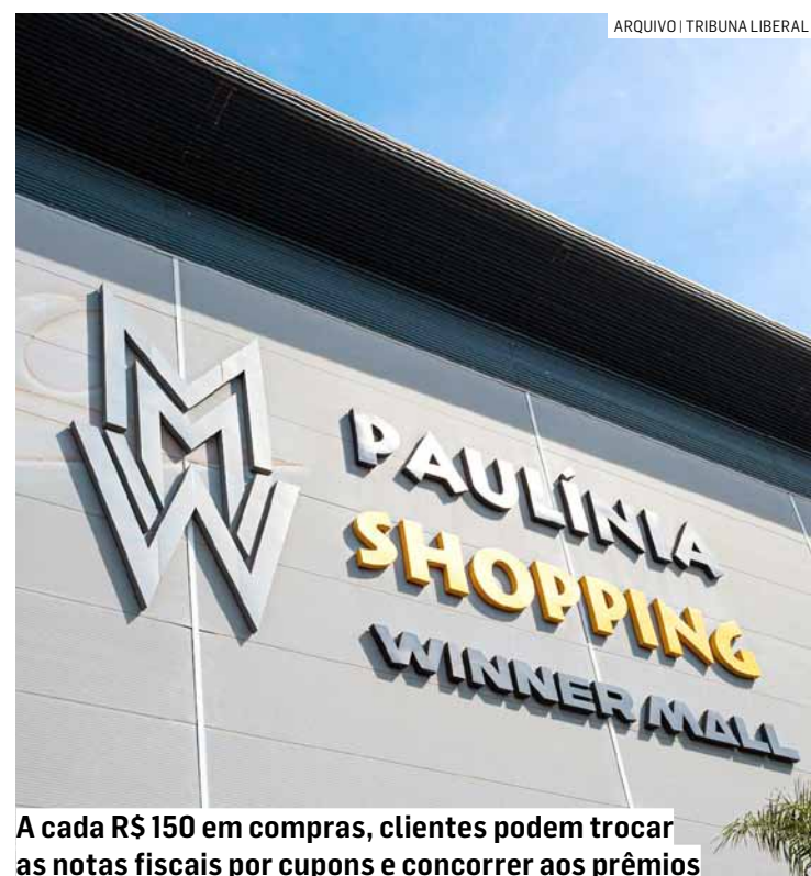
A cada R$ 150 em compras, clientes podem trocar as notas fiscais por cupons e concorrer aos prêmios

Da Redação • PAULÍNIA tribunaliberal@tribunaliberal.com.br