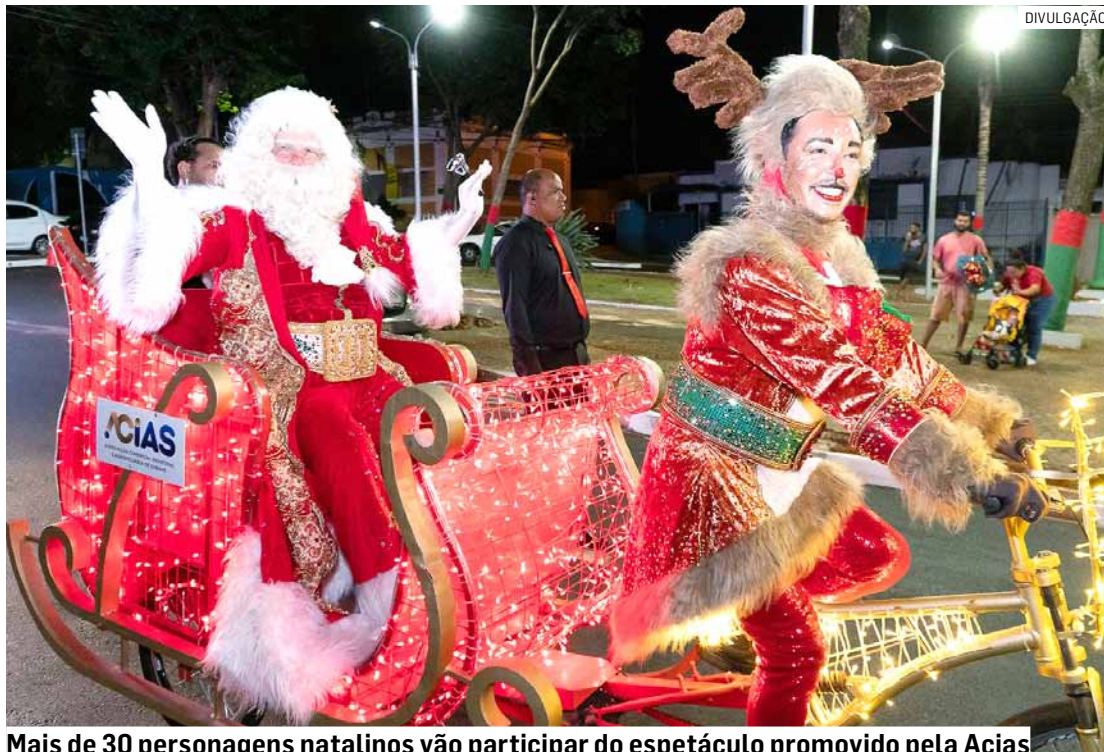
Mais de 30 personagens natalinos vão participar do espetáculo promovido pela Acias

O presidente da associação reforça que a intenção do espetáculo é levar aos moradores momentos de entretenimento e lazer,