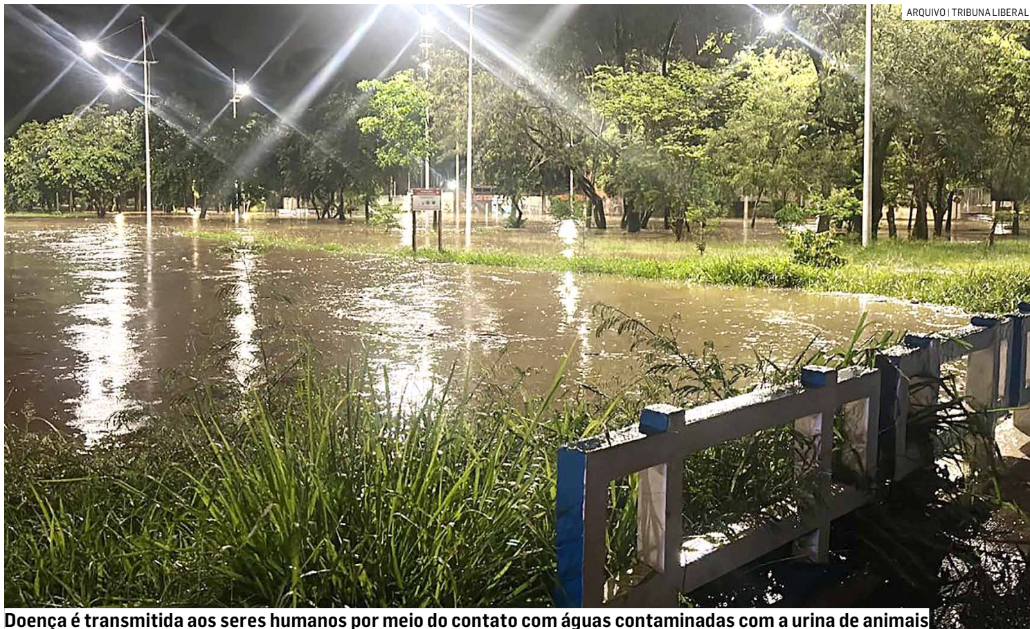
Doença é transmitida aos seres humanos por meio do contato com águas contaminadas com a urina de animais