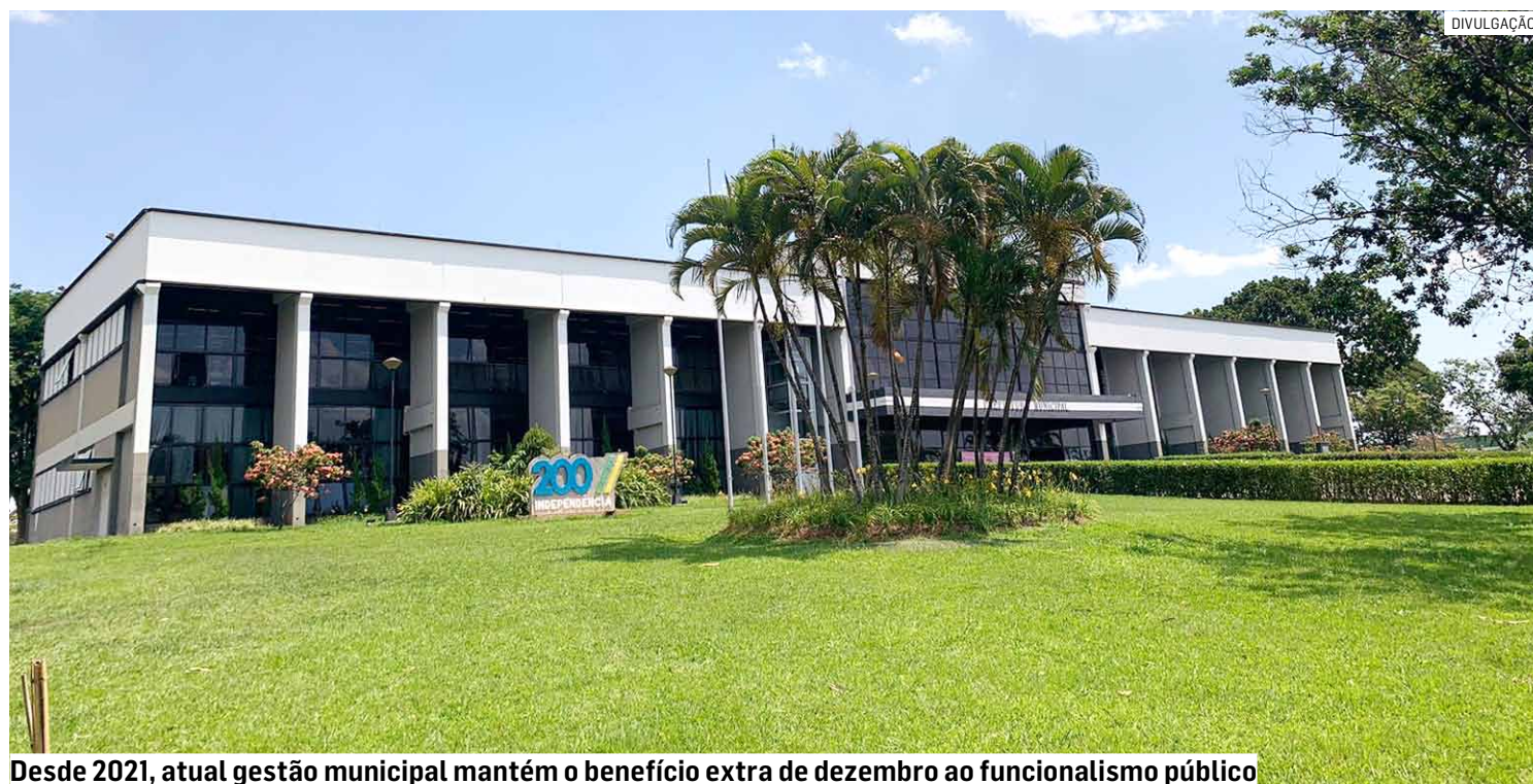
Desde 2021, atual gestão municipal mantém o benefício extra de dezembro ao funcionalismo público

O valor do benefício, de R$ 778,25, deve ser liberado pela administração municipal para utilização no cartão da cesta básica (mensal) até o dia 20