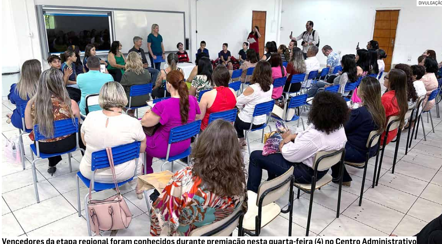
Vencedores da etapa regional foram conhecidos durante premiação nesta quarta-feira (4) no Centro Administrativo

O Prêmio MPT na Escola é destinado aos estudantes do quarto ao sétimo ano e aborda assuntos relacionados ao trabalho infantil e à aprendizagem profissional, visando despertar a consciência crítica e cidadã desde a idade escolar. Participaram da competição os estudantes de escolas públicas de 10 municípios do interior paulista, por meio da apresentação de trabalhos culturais com enfoque no combate ao trabalho infantil e à aprendizagem profissional.