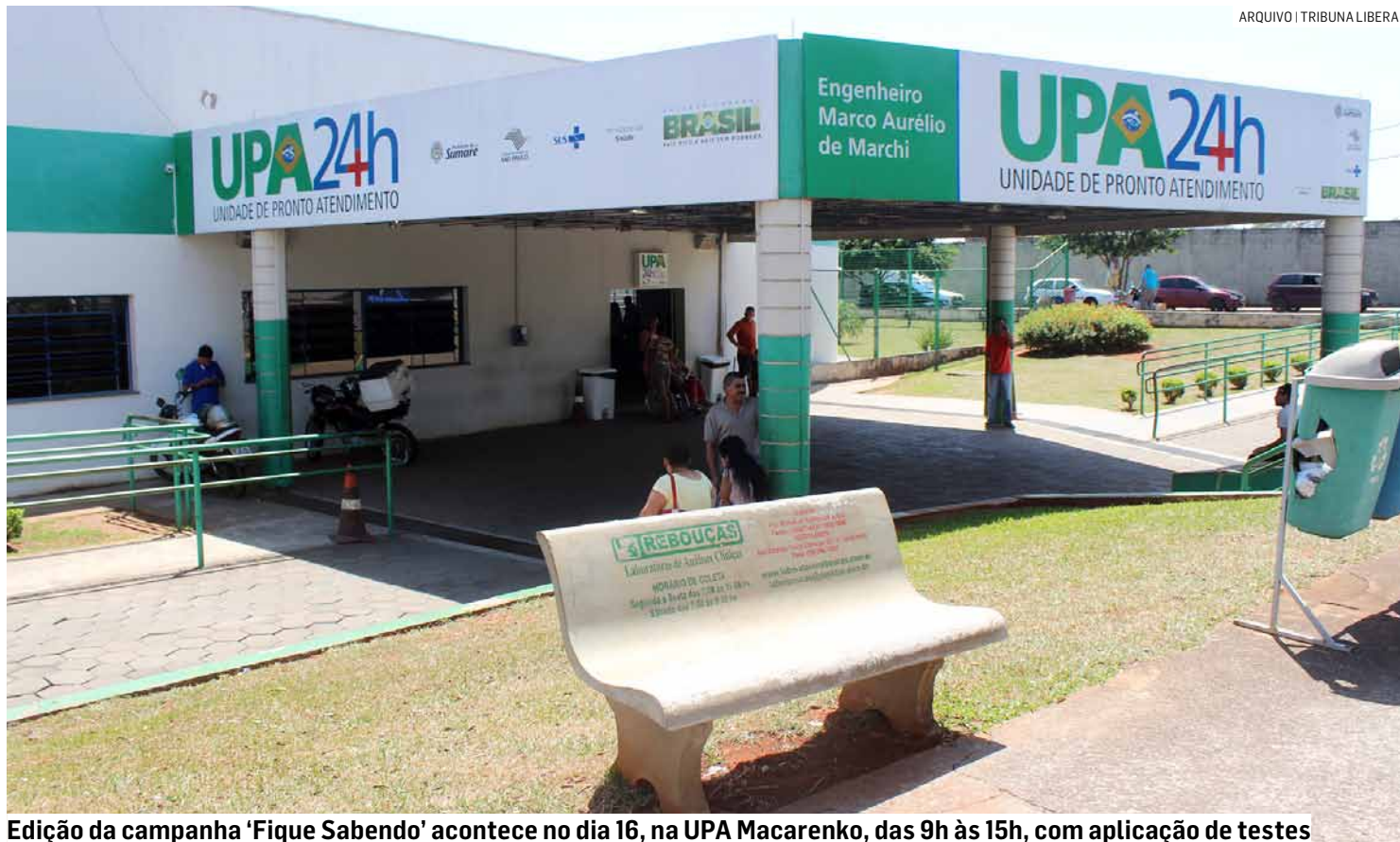
Edição da campanha 'Fique Sabendo' acontece no dia 16, na UPA Macarenko, das 9h às 15h, com aplicação de testes

Neste ano, o Cresser ofereceu treinamentos de testagem rápida para a rede de saúde e alunos de enfermagem da Faculdade Anhanguera, para uma aplicação