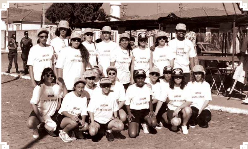
Registro de 01 de maio de 1994 mostrando a equipe vencedora da gincana anual que se realizou naquela data. Tratava-se do grupo denominado "Escola Vista Alegre". Nesse dia, infelizmente, aconteceu o acidente que tirou a vida do piloto Ayrton Senna.