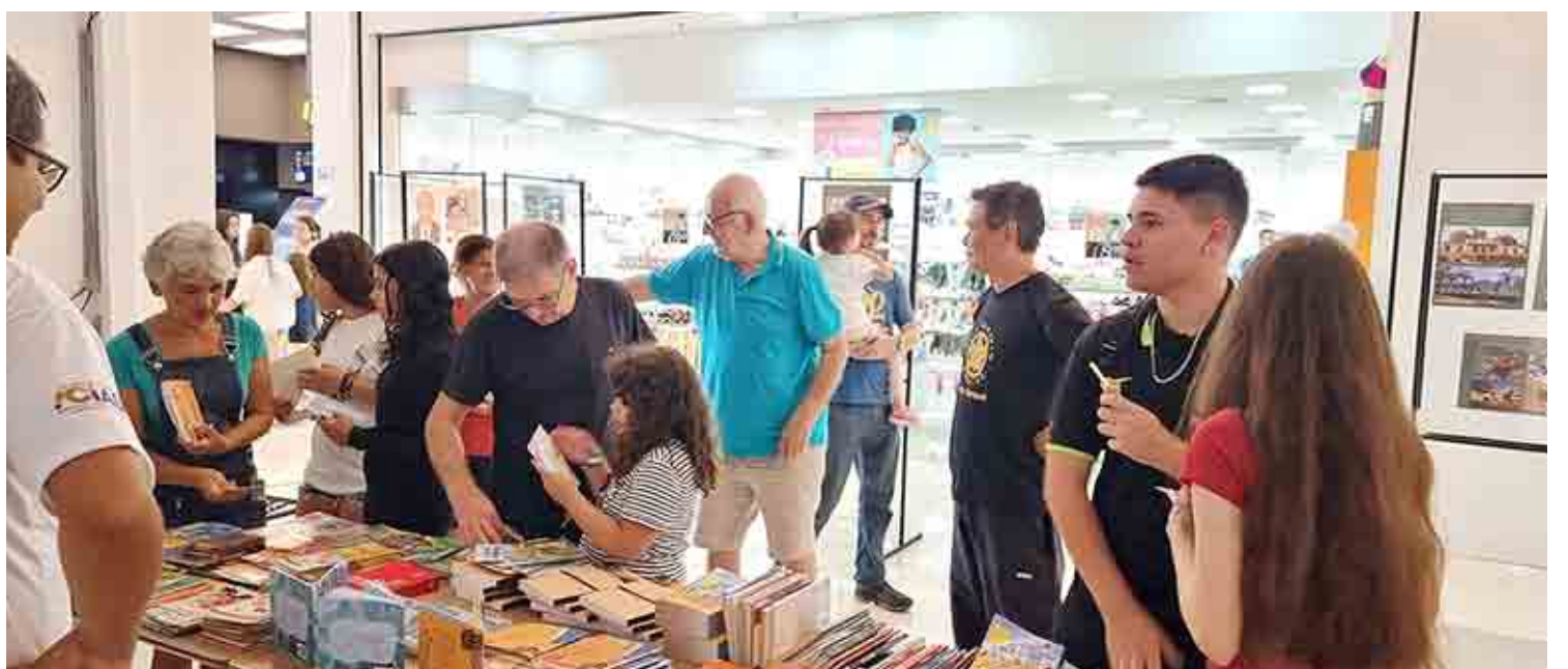
Distribuição de livros dos Amigos da Biblioteca no Dia da Memória

to de visitação, no Shopping ParkCity Sumaré, onde foram expostas as imagens fotográficas da parte fixa da exposição, com os patrimônios culturais reconhecidos ou em processo de reconhecimento da cidade de Sumaré e, também, as referências culturais das regiões administrativas de Nova Veneza, e do Matão, dando a oportu-