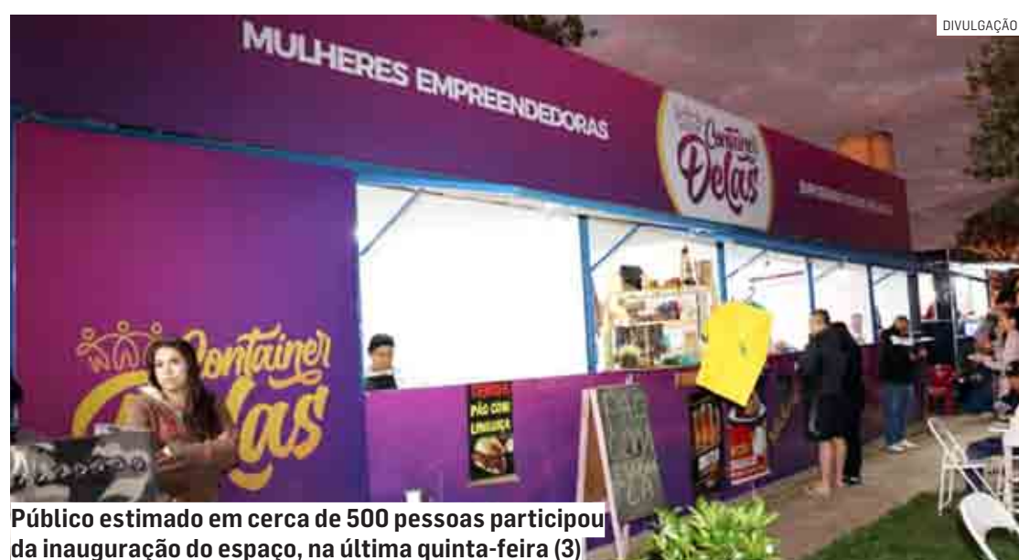
Público estimado em cerca de 500 pessoas participou da inauguração do espaço, na última quinta-feira (3)