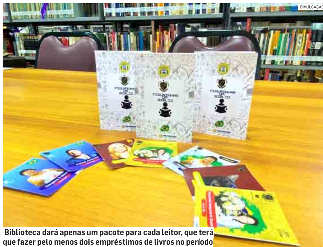
Biblioteca dará apenas um pacote para cada leitor, que terá que fazer pelo menos dois empréstimos de livros no período

A biblioteca municipal continua com a troca de figurinhas do álbum da Copa. O público pode trocar cromos com a própria biblioteca e outras pessoas. No caso de trocas com terceiros, a biblioteca não se responsabiliza nem faz a mediação das trocas. A biblioteca salienta ainda que não faz venda nem compra de álbum e de figurinhas. A biblioteca orienta para que as crianças venham acompanhadas de pai, mãe, responsável ou de algum adulto.