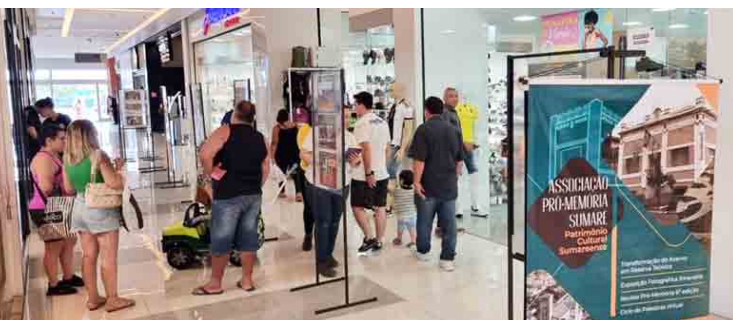
Exposição do Dia da Memória no Shopping ParkCity

■ Obs.: O Dia da Memória contou com a colaboração do Shopping ParkCity, da Secretaria Municipal de Cultura, da Associação Comercial e Industrial de Sumaré, da Têxtil Omborgo, Rotary Club de Sumaré, I.C. Transportes e Granja Satoshi.