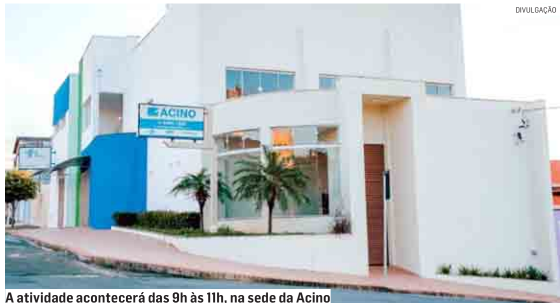
A atividade acontecerá das 9h às 11h, na sede da Acino

Da Redação | NOVA ODESSA tribunaliberal@tribunaliberal.com.br