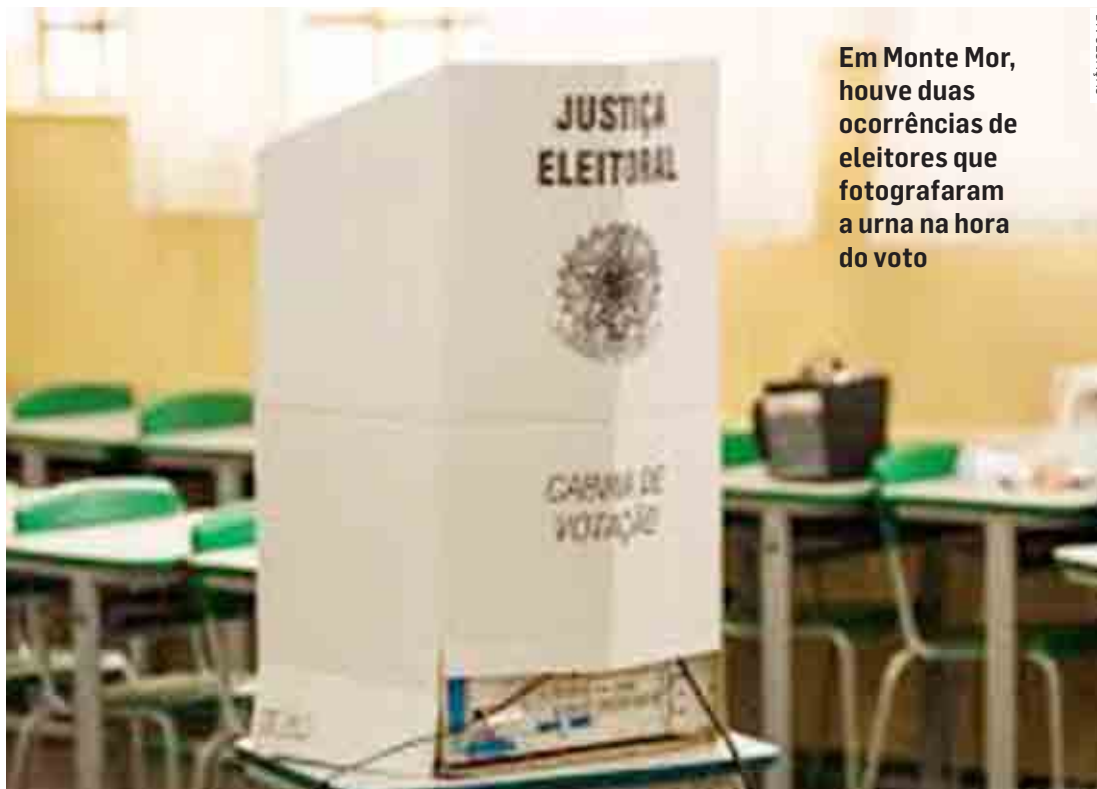
Em Monte Mor, houve duas ocorrências de eleitores que fotografaram a urna na hora do voto

A vedação do acesso de celulares e demais equipamentos de gravação ou transmissão na cabina eleitoral é prevista desde 1997 na Lei das Eleições (Lei nº 9.504/97). Diz o parágrafo único do artigo 91-A: “Fica vedado portar aparelho de telefonia celular, máquinas fotográficas e filmadoras, dentro