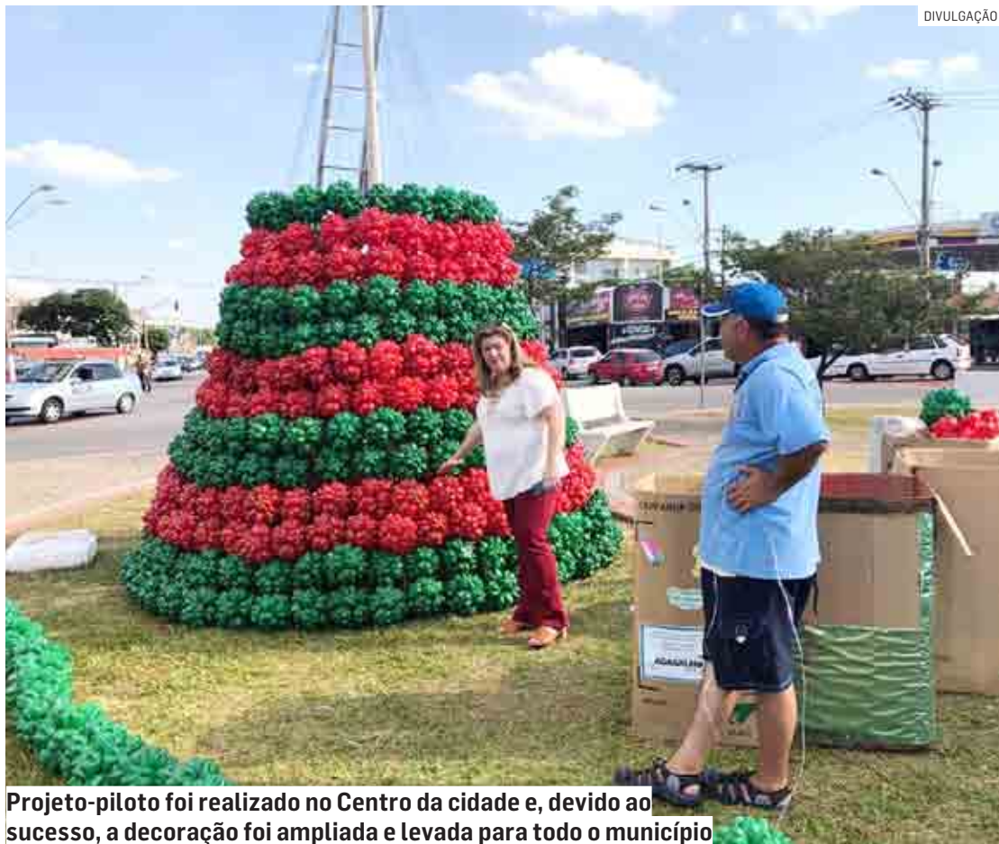
Projeto-piloto foi realizado no Centro da cidade e, devido ao sucesso, a decoração foi ampliada e levada para todo o município

“Iniciamos o projeto do Natal do Bem com decoração totalmente sustentável em 2017, e, desde então, atentos às necessidades do meio ambiente, ampliamos a cada ano os enfeites e adereços, proporcionando locais acolhedores e resgatando a alegria do Natal. Todo ano nossa população nos ajuda com a doação de garrafas pet e nossas dezenas de voluntários se juntam para transformar os itens em belíssimos enfeites natalinos. Nosso objetivo é decorar toda a cidade com enfeites bonitos, simples e sustentáveis, aquecendo o coração de nossas famílias e deixando a cidade mais acolhedora e alegre, além de promover a consciência ambiental. Este é o espírito que queremos para as festas de fim de ano em Sumaré: de união de