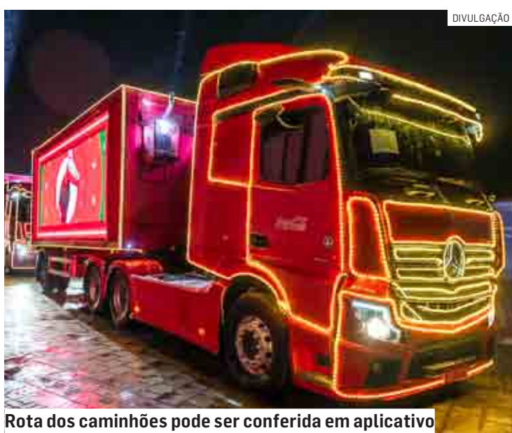
Rota dos caminhões pode ser conferida em aplicativo