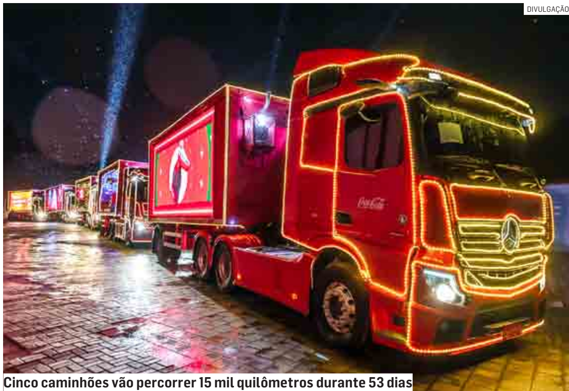
Cinco caminhões vão percorrer 15 mil quilômetros durante 53 dias

Com o conceito "O Natal Sempre Encontra o Caminho", a iniciativa pretende resgatar a essência natalina, reforçando as relações humanas e o cuidado socioambiental; rota pode ser conferida no app Natal Coca-Cola