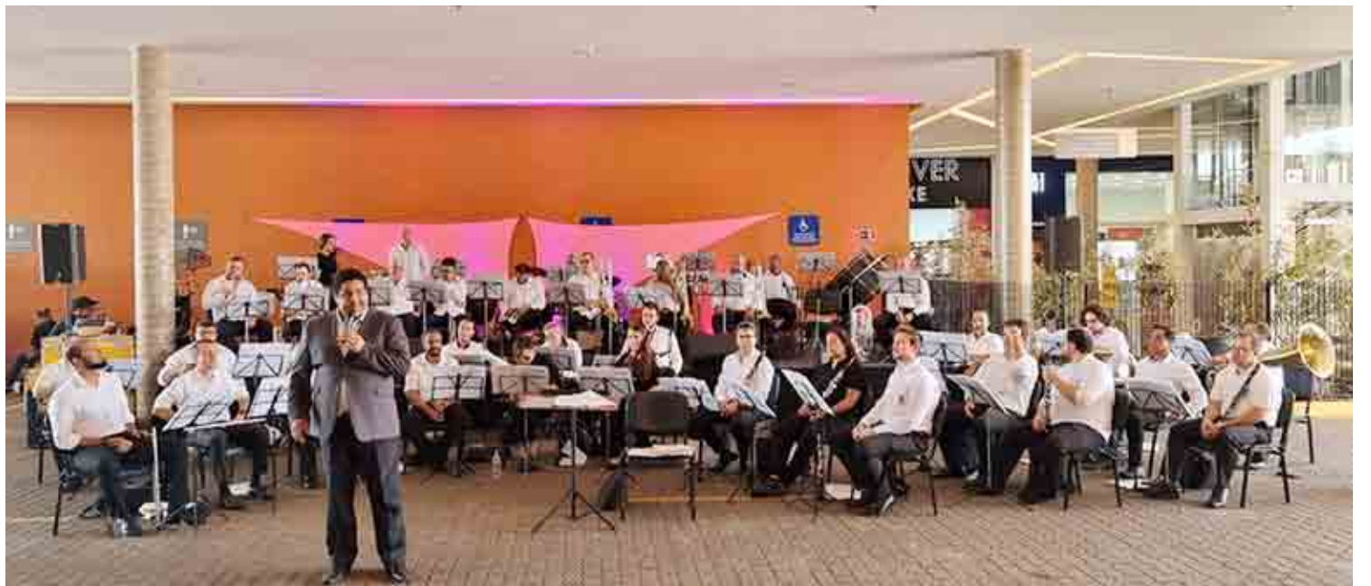
Banda Sinfônica Municipal Dorival Gomes Barroca no Dia da Memória