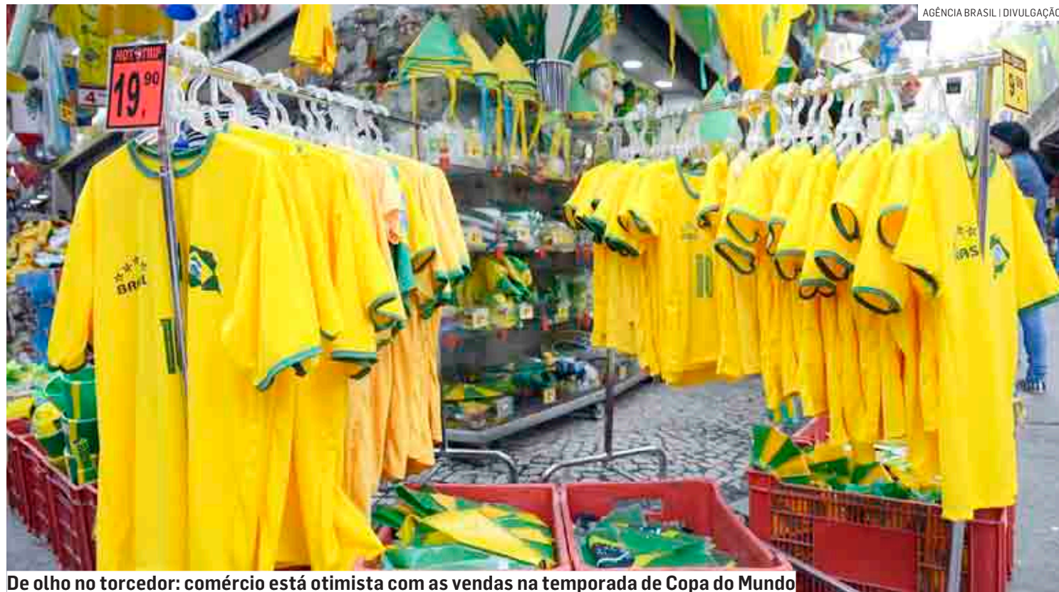
De olho no torcedor: comércio está otimista com as vendas na temporada de Copa do Mundo

Dados divulgados pela Acic apontam crescimento nas vendas de materiais esportivos e aparelhos de televisão por causa do campeonato mundial de futebol, que começa no próximo dia 20, no Catar