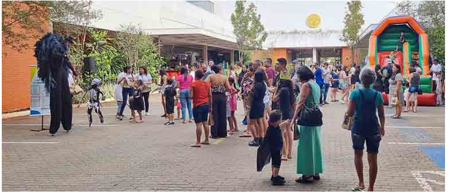
Atividades do Dia da Memória

Assim, no Dia da Memória, houve a iniciativa de incluir mais um pon-