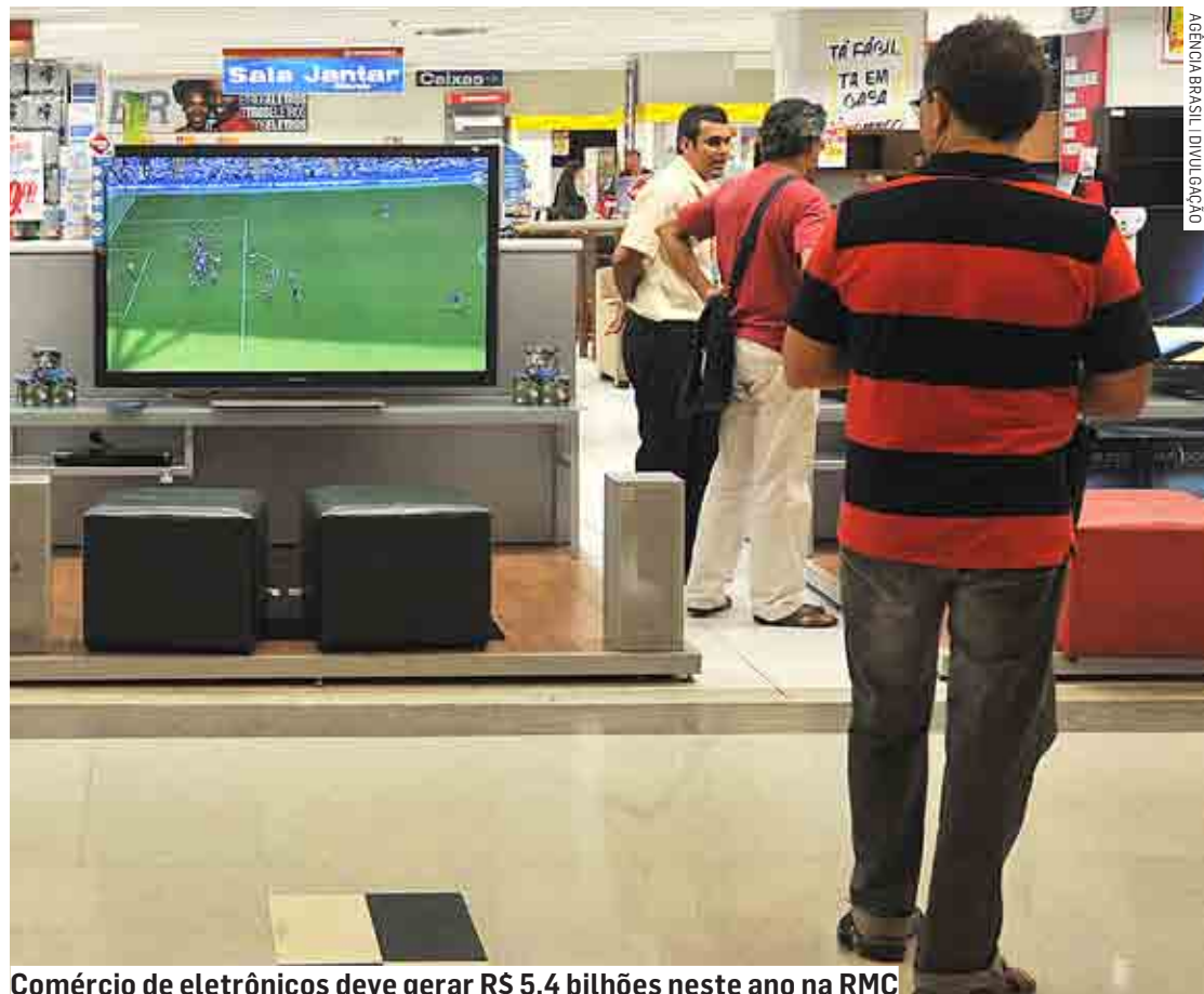
Comércio de eletrônicos deve gerar R$ 5,4 bilhões neste ano na RMC

O comércio de eletrônicos deve gerar R$ 5,4 bilhões neste ano na RMC (Região Metropolitana de Campinas), segundo informações divulgadas pela Acic (Associação Comercial e Industrial de Campinas). A previsão de faturamento é 8,10% a mais do que o valor contabilizado em 2021, quando o setor vendeu R$ 5 bilhões na região, segundo a Associação.