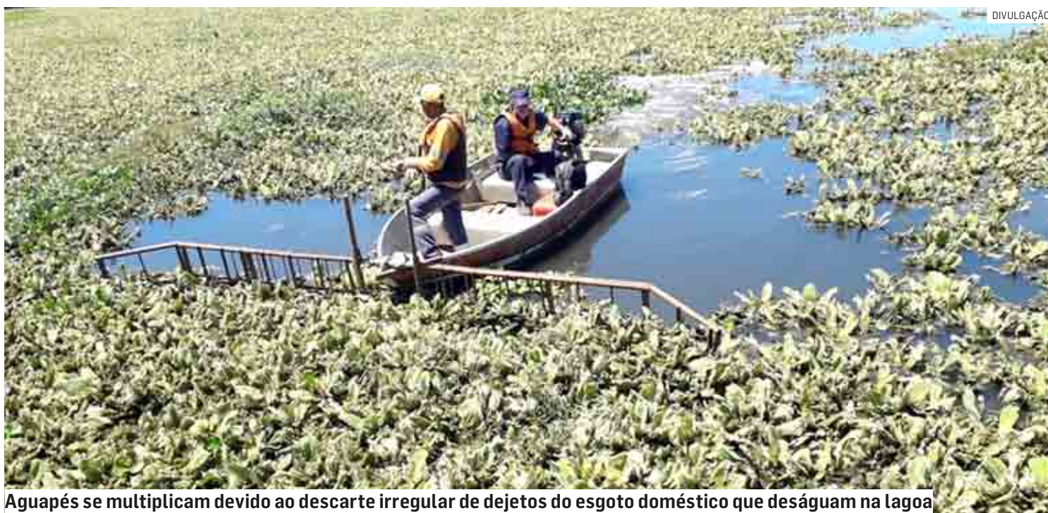
Aguapés se multiplicam devido ao descarte irregular de dejetos do esgoto doméstico que deságuam na lagoa

Ação retira plantas aguapés da lagoa e faz a zeladoria de limpeza e varrição no entorno da área de lazer para receber os visitantes