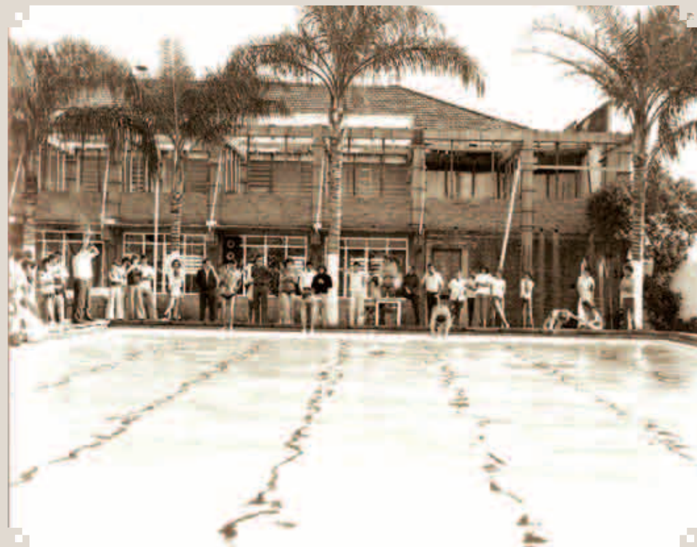
O dia Primeiro de Maio era comemorado condignamente em Sumaré. Tinha desfile, concurso de Miss e olimpíada esportiva entre as empresas. Nesta foto dos anos 1960 vemos a competição de natação que tradicionalmente acontecia no Clube União Cultural XVI de Dezembro.