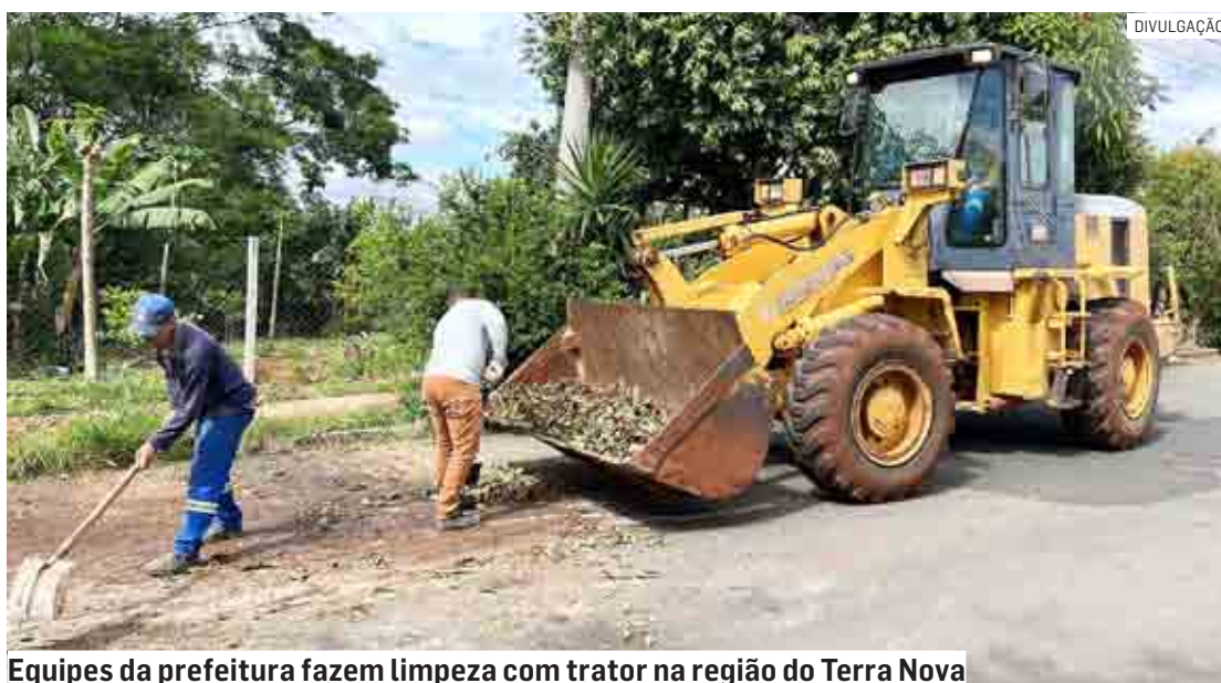
Equipes da prefeitura fazem limpeza com trator na região do Terra Nova

Pelos números apresentados pela Diretoria de Serviços Urbanos, foram retiradas mais de