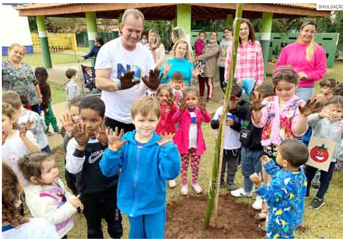
Neste ano, estão sendo atendidas 1.134 crianças de 4 e 5 anos em turmas da Educação Infantil

A Educação Infantil é dividida em duas fases. Nas turmas da fase 1, em 2023, vão estudar as crianças que completam 4 anos até o dia 31/03/2023. Já nas turmas da fase 2 vão ser atendidas as crianças que completam 5 anos até 31/03/2023. As crianças que completam 4 anos após 1º/04/2023 devem tentar uma vaga em creche (neste caso, nas turmas de maternal 2, cuja frequência não é obrigatória).