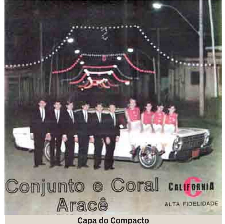
Conjunto e Coral Aracê ALTA FIDELIDADE Capa do Compacto