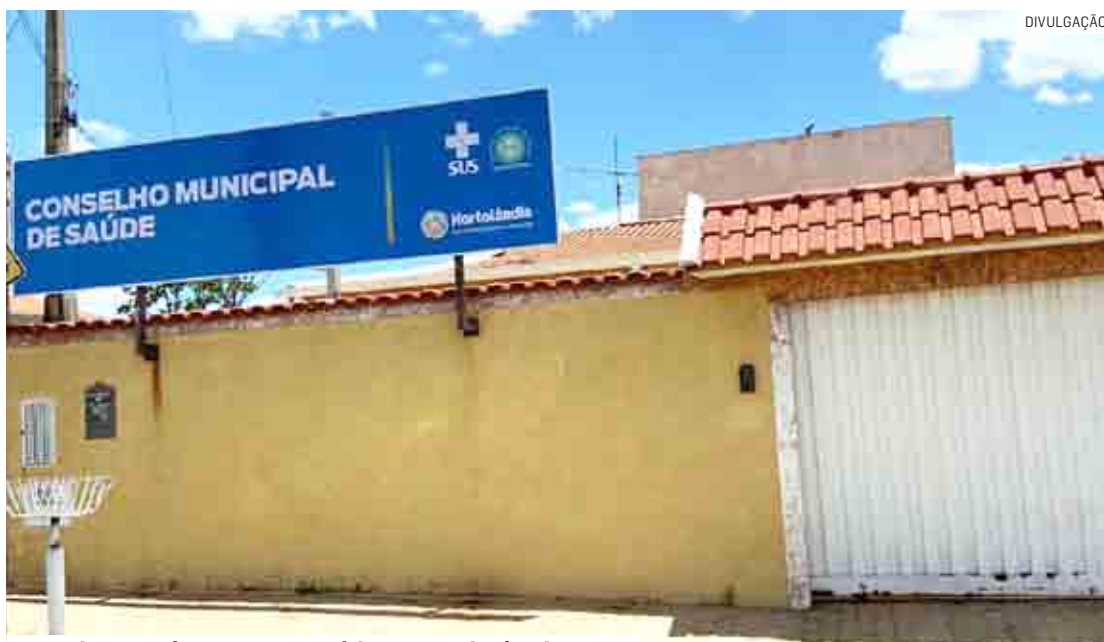
Atendimento às mulheres vítimas de violência passa a ser realizado em um novo prédio no Pq. dos Pinheiros

“Em julho a nossa sede do CRAM vem passan-