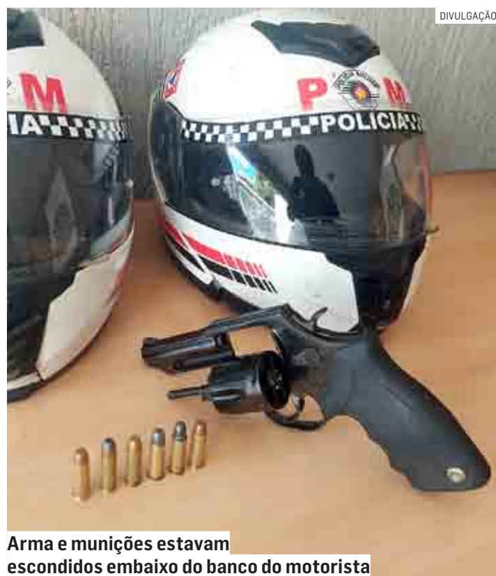
Arma e munições estavam escondidos embaixo do banco do motorista

Os policiais perguntaram ao abordado sobre o fato e ele declarou