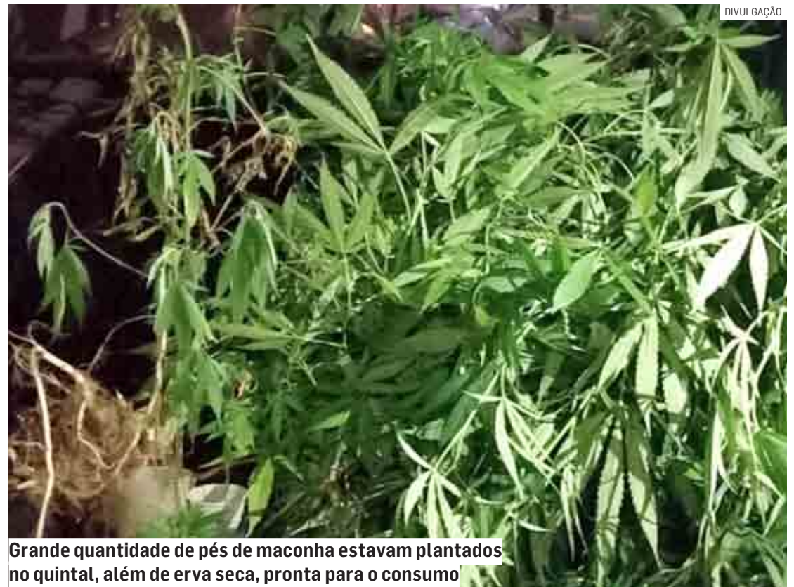
Grande quantidade de pés de maconha estavam plantados no quintal, além de erva seca, pronta para o consumo

Os PMs conversaram com a mulher, que informou residir na casa, e que após a discussão o marido mandou que ela se retirasse e ela disse que não iria embora, mas, em seguida saiu da casa. Ela disse ainda que o companheiro a perseguiu, mas que acabou conseguindo fugir do local.