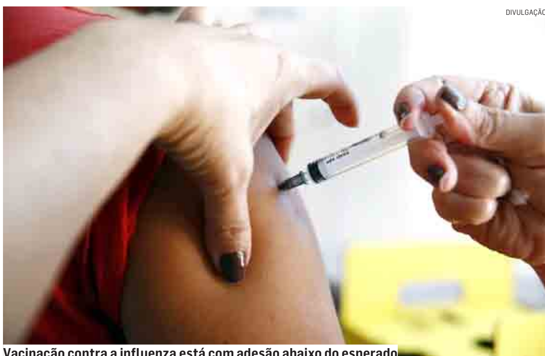
Vacinação contra a influenza está com adesão abaixo do esperado