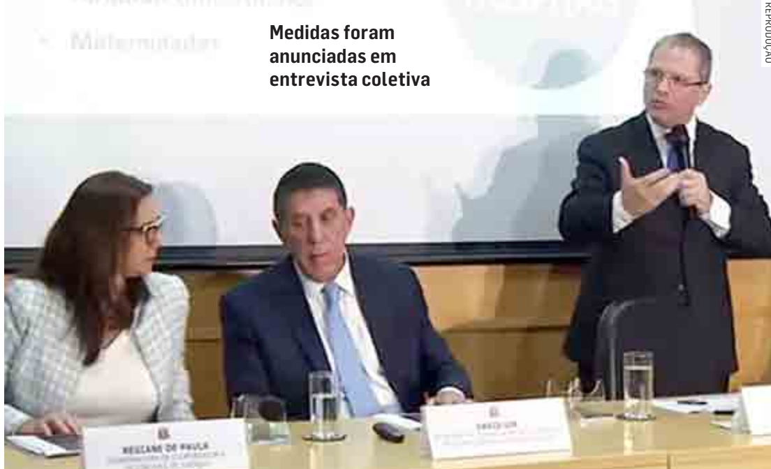
Medidas foram anunciadas em entrevista coletiva

Os hospitais de referência darão retaguarda para os casos mais graves com necessidade de internação de pacientes em leitos de isolamento ou Unidades de Terapia Intensiva (UTI). Além do Instituto de Infectologia Emílio Ribas, maior centro de tratamento de