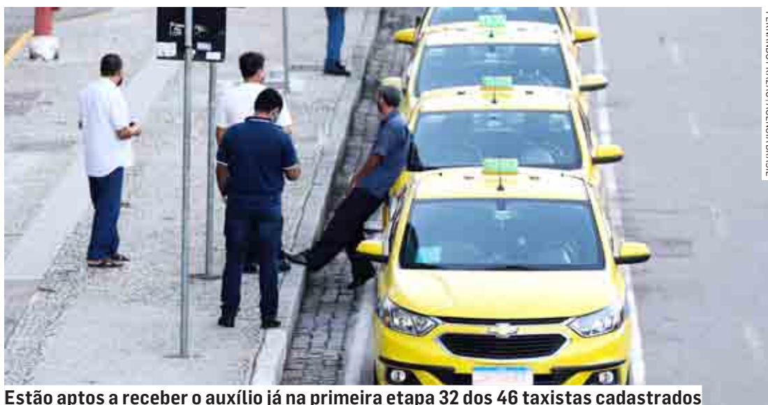
Estão aptos a receber o auxílio já na primeira etapa 32 dos 46 taxistas cadastrados

A Secretaria de Mobilidade Urbana e Rural de Sumaré iniciou o cadastramento junto ao governo federal dos profissionais de transporte individual aptos a receberem o Benefício Taxista, auxílio emergencial para motoristas da categoria para minimizar os impactos sociais do reajuste dos preços dos combustíveis e derivados de petróleo.