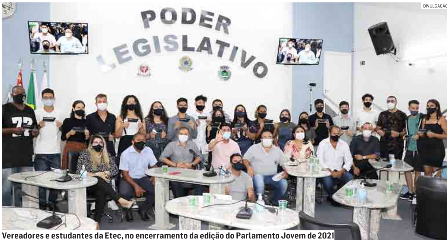
Vereadores e estudantes da Etec, no encerramento da edição do Parlamento Jovem de 2021

Da Redação | MONTE MOR tribunaliberal@tribunaliberal.com.br