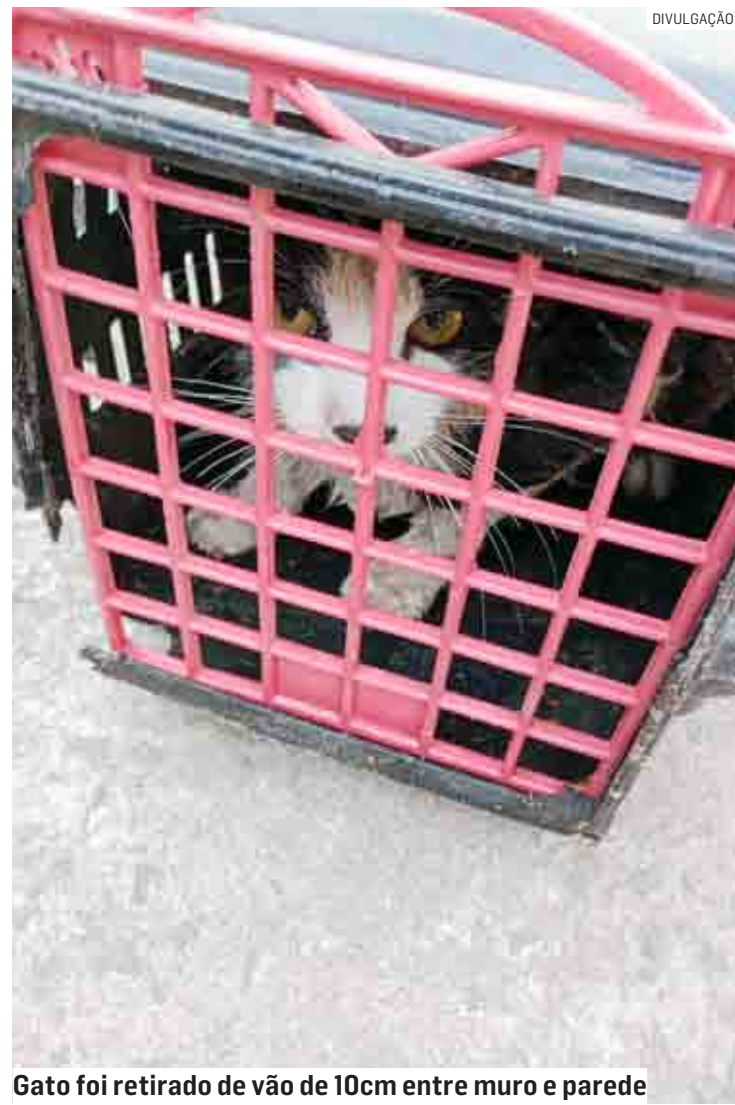
Gato foi retirado de vão de 10cm entre muro e parede

No local, os bombeiros identificaram o animal preso em um vão de aproximadamente 10 centímetros entre um muro e uma parede. Com a autorização do proprietário do imóvel, os socorristas fizeram buracos no muro de tijolos para conseguir resgatar o felino, que foi entregue ao responsável.