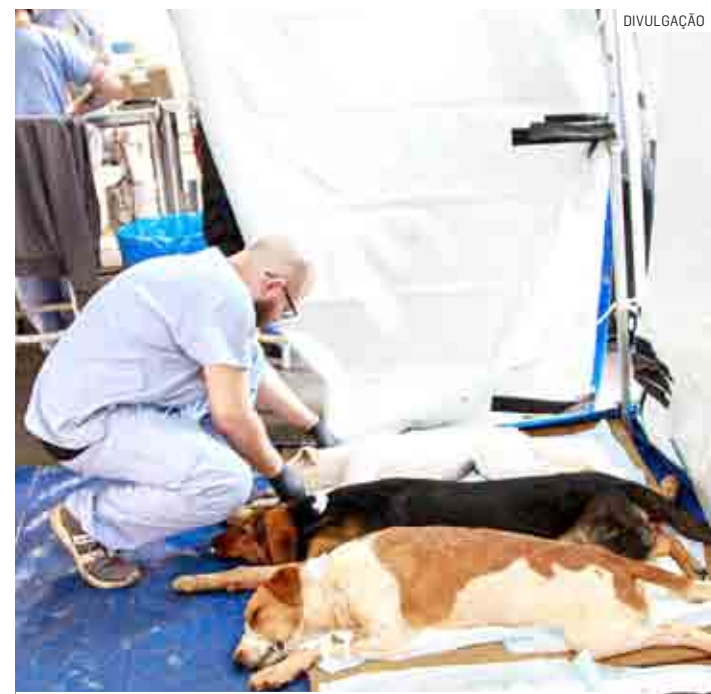
Programa atende animais entre 2 meses e 7 anos

A próxima etapa ocorrerá nos dias 01 e 02 de setembro. O local está sendo definido pela Secretaria de Meio Ambiente.