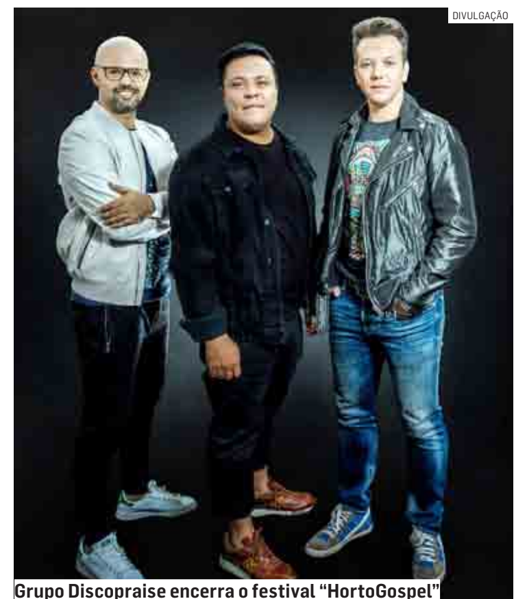
Grupo Discopraise encerra o festival “HortoGospel”

ra celebrar a cultura gospel da cidade. Uma oportunidade para as famílias celebrarem e refletirem”, salienta o secretário.