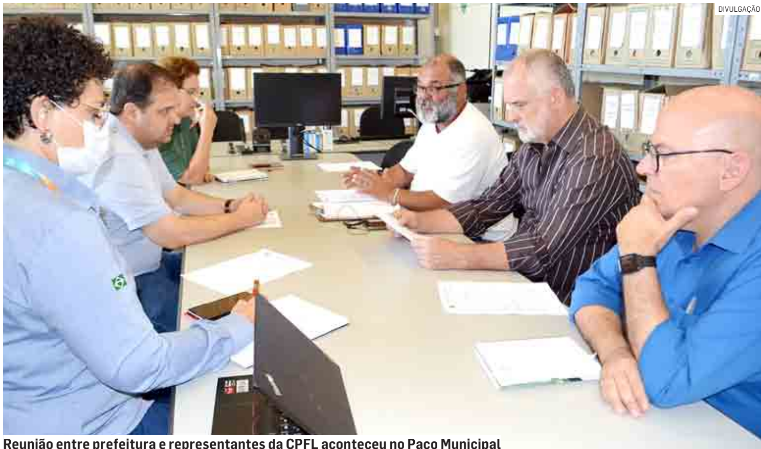
Reunião entre prefeitura e representantes da CPFL aconteceu no Paço Municipal