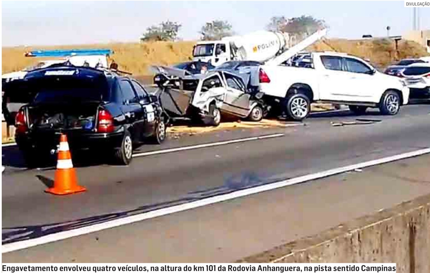
Engavetamento envolveu quatro veículos, na altura do km 101 da Rodovia Anhanguera, na pista sentido Campinas

A Polícia Militar Rodoviária compareceu ao local, onde registrou a ocorrência e submeteu os condutores ao teste do etilômetro, que não constatou que os motoristas estavam alcoolizados.