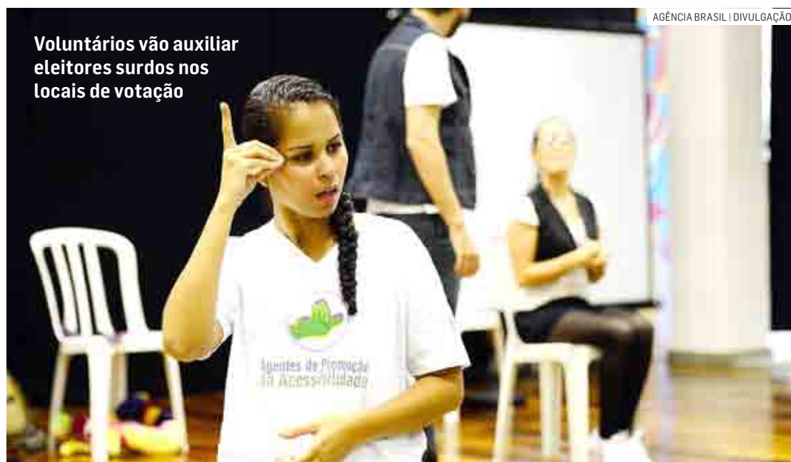
Voluntários vão auxiliar eleitores surdos nos locais de votação