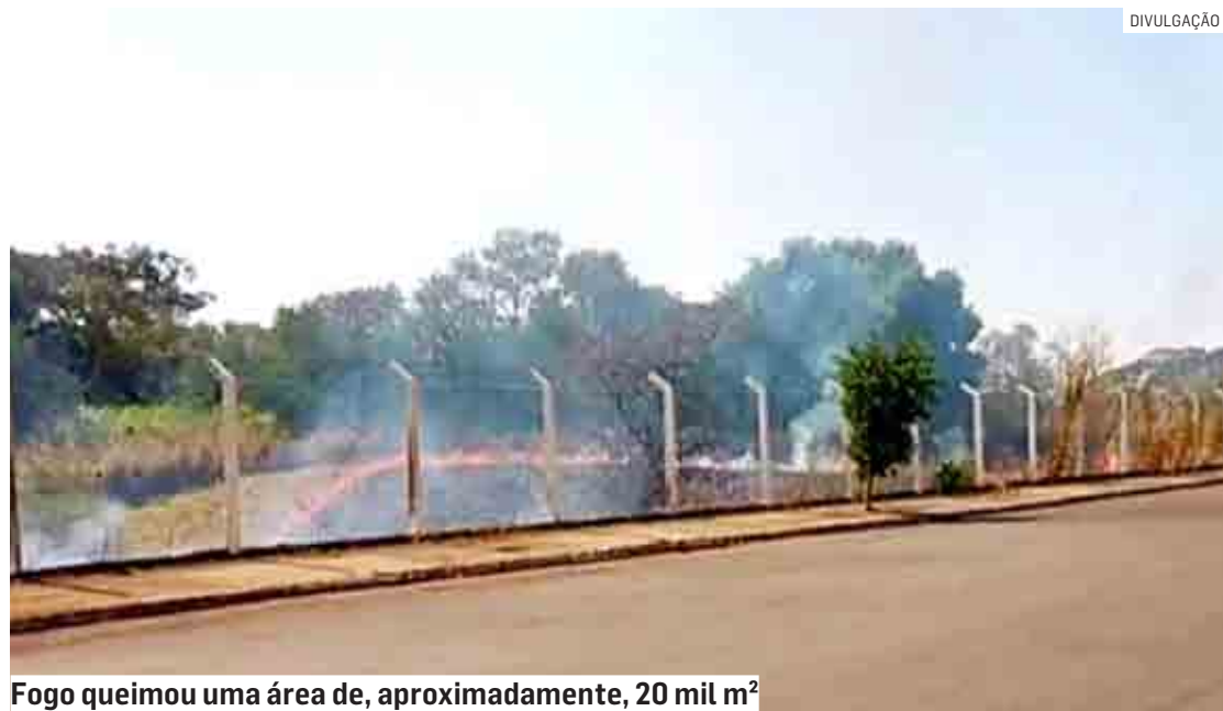
Fogo queimou uma área de, aproximadamente, 20 mil m 2

Cézar Oliveira | NOVA ODESSA tribunaliberal@tribunaliberal.com.br