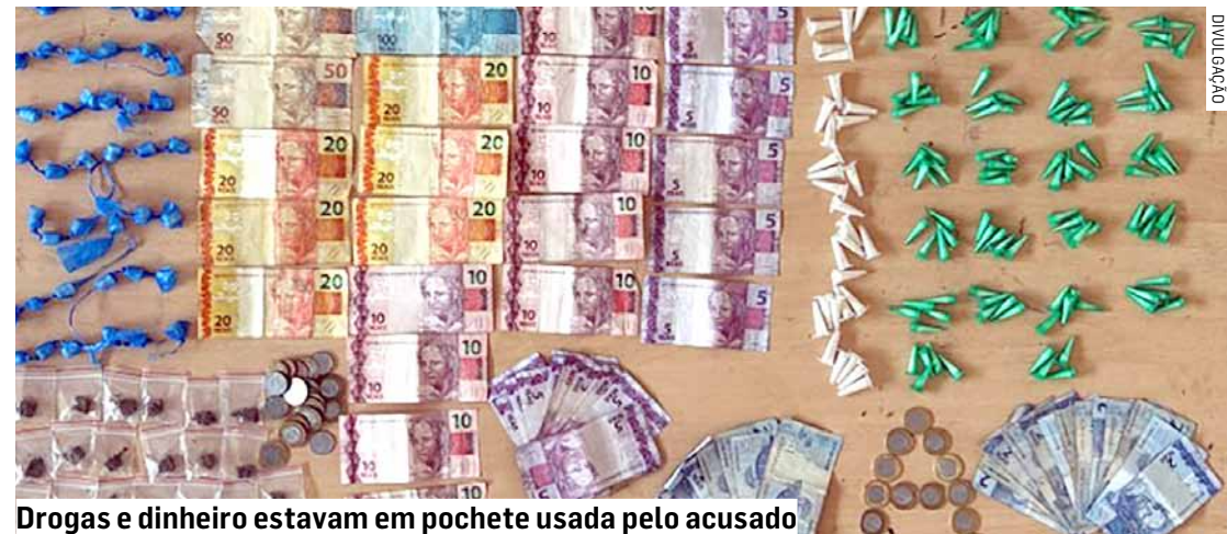
Drogas e dinheiro estavam em pochete usada pelo acusado

Cézar Oliveira • SUMARÉ tribunaliberal@tribunaliberal.com.br