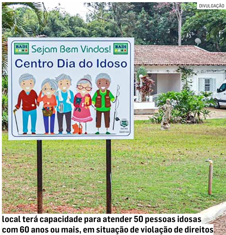
Local terá capacidade para atender 50 pessoas idosas com 60 anos ou mais, em situação de violação de direitos