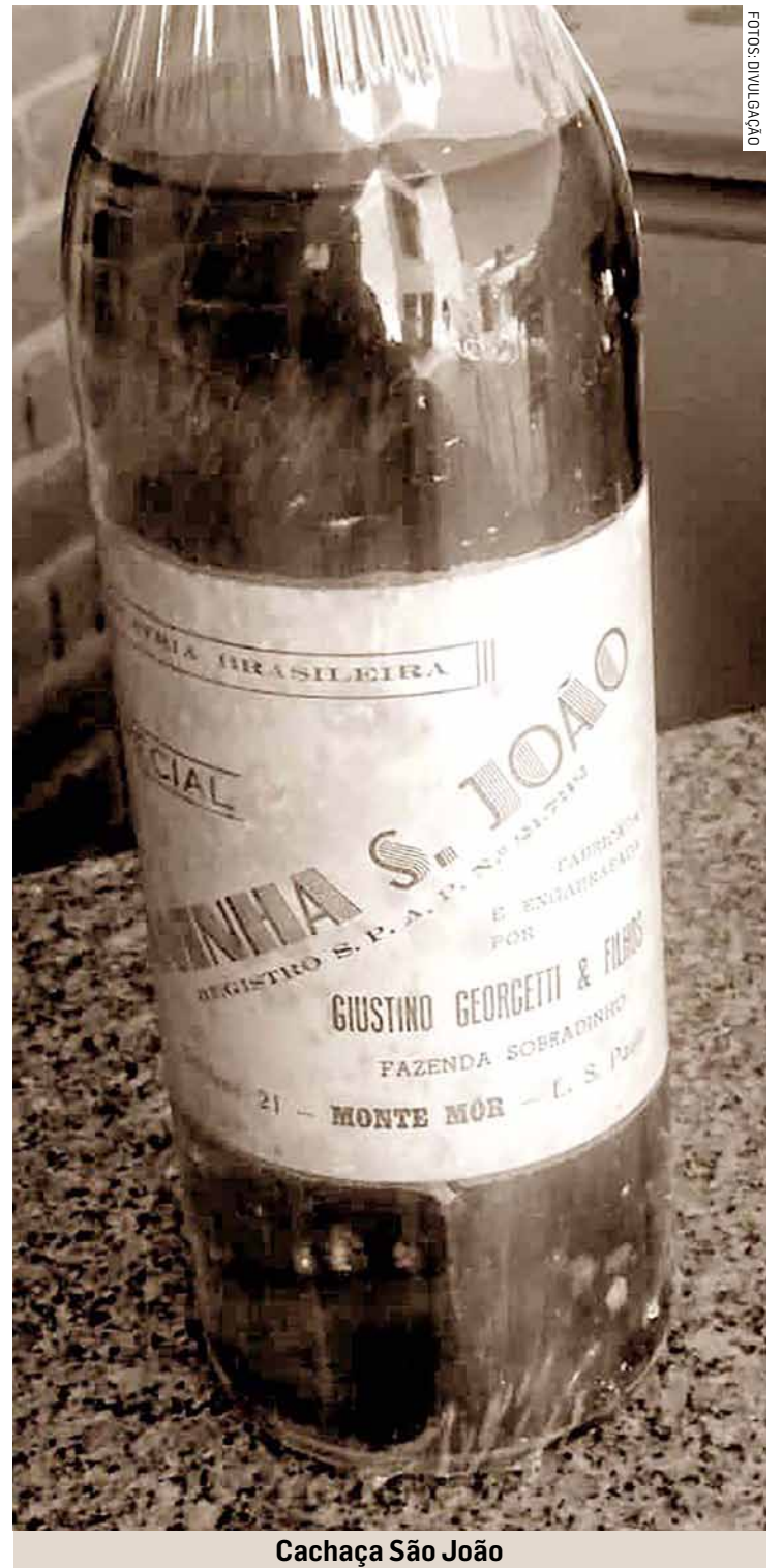
Cachaça São João