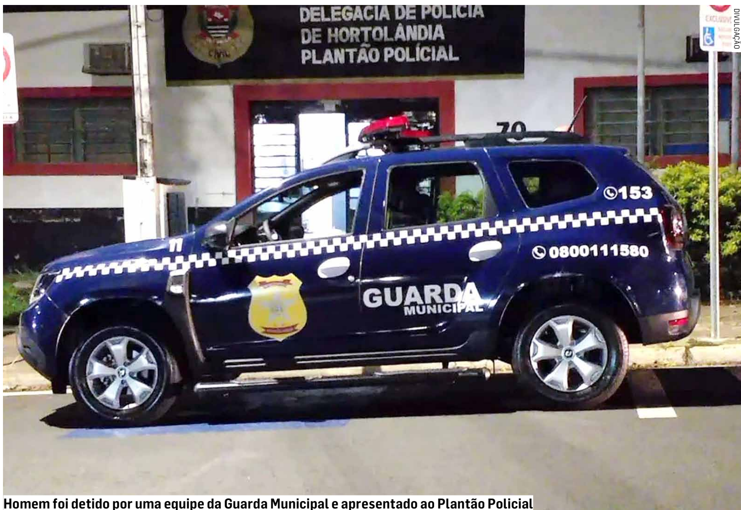
Homem foi detido por uma equipe da Guarda Municipal e apresentado ao Plantão Policial

As vítimas e o suspeito foram encaminhados para a UPA (Unidade de Pronto Atendimento) Jardim Amanda e posteriormente até a delegacia para averiguação dos fatos. No Plantão Policial foi decretada a prisão em flagrante do homem por tentativa de roubo.