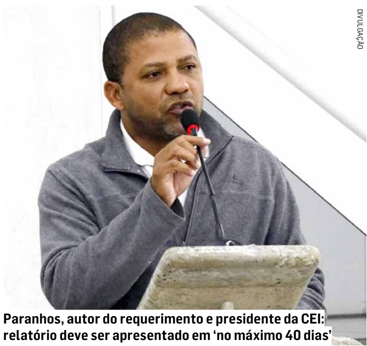
Paranhos, autor do requerimento e presidente da CEI: relatório deve ser apresentado em 'no máximo 40 dias'

Da Redação • MONTE MOR tribunaliberal@tribunaliberal.com.br