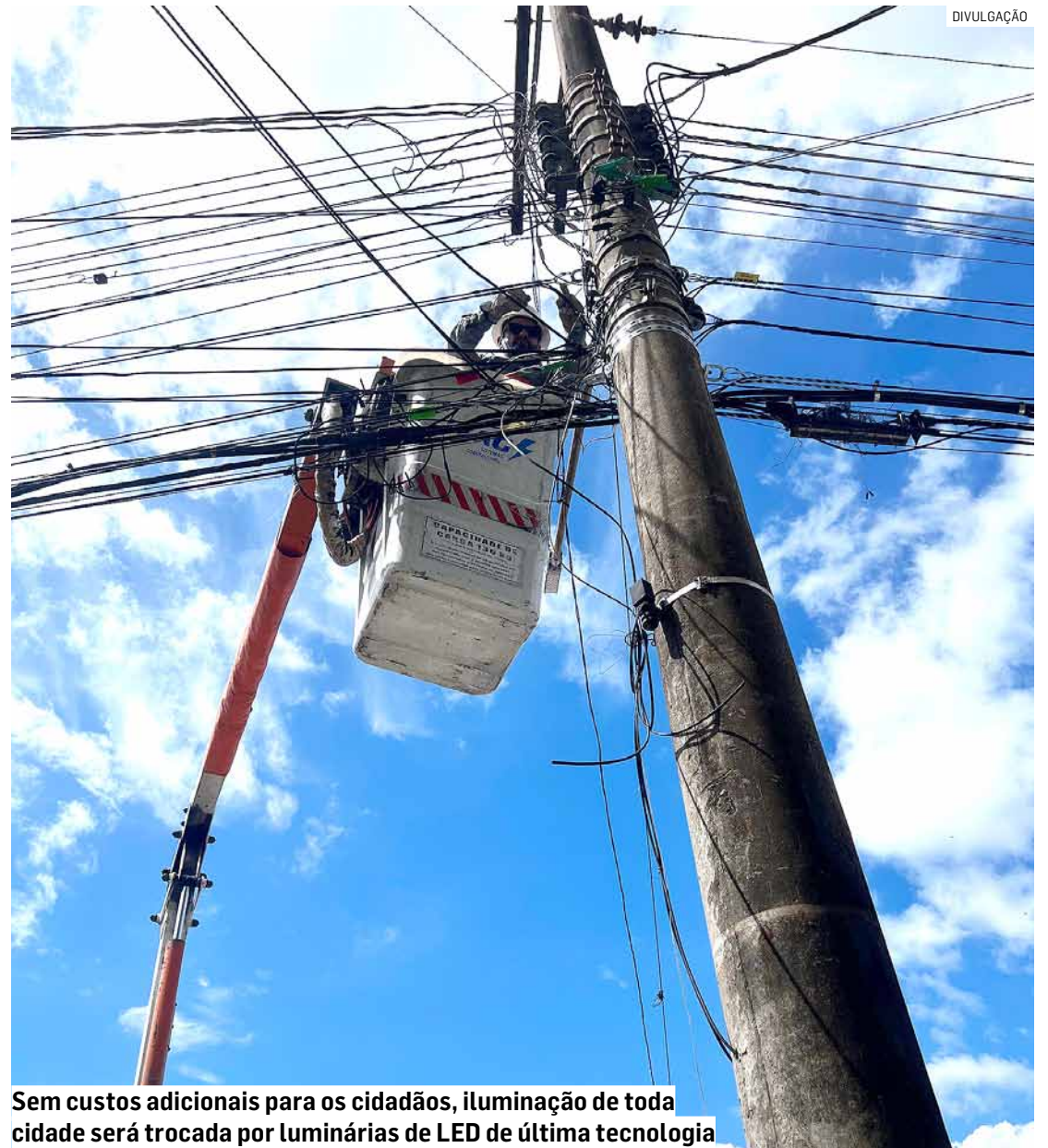
Sem custos adicionais para os cidadãos, iluminação de toda cidade será trocada por luminárias de LED de última tecnologia

Em seguida, serão atendidos os interiores dos bairros de Nova Odessa.