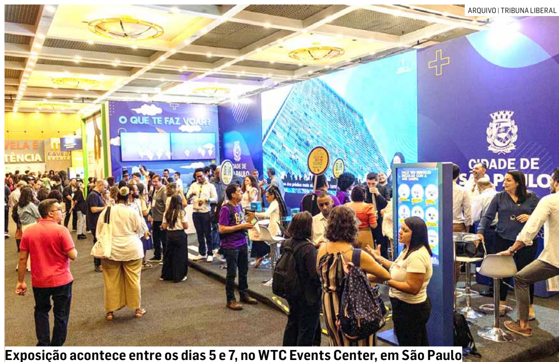
Exposição acontece entre os dias 5 e 7, no WTC Events Center, em São Paulo

Da Redação • HORTOLÂNDIA tribunaliberal@tribunaliberal.com.br