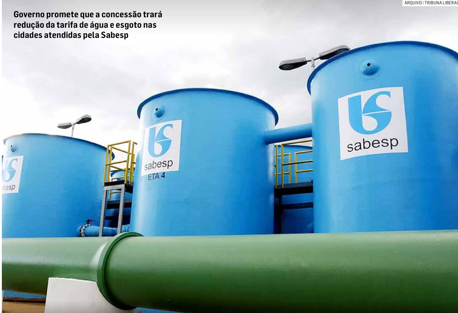
Governo promete que a concessão trará redução da tarifa de água e esgoto nas cidades atendidas pela Sabesp

Para a nova governança corporativa, o CDPED aprovou o acordo de investimentos, que deverá ser assinado pelo investidor de referência selecionado na oferta pública e terá validade inicial até dezembro de 2034.