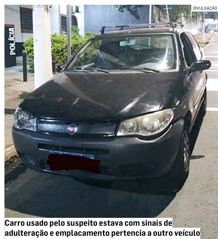
Carro usado pelo suspeito estava com sinais de adulteração e emplacamento pertencia a outro veículo

O suspeito foi conduzido ao Plantão Policial de Hortolândia e o um boletim de ocorrência foi registrado. O homem permaneceu preso.