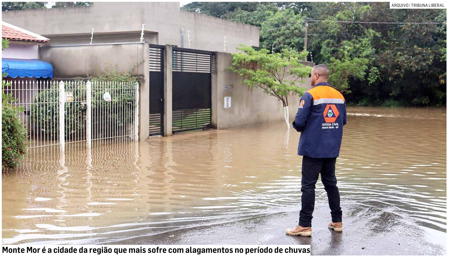
Monte Mor é a cidade da região que mais sofre com alagamentos no período de chuvas

O monitoramento de novas ocupações por meio de fiscalização é outra ação importante apontada pelo Estado. Isso ajudará a prevenir construções irregulares em áreas de risco, garantindo que o planejamento urbano considere a segurança e a