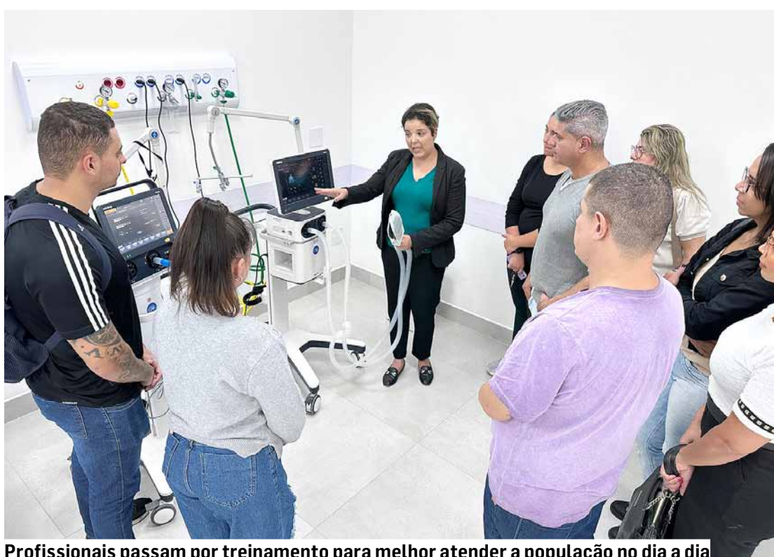
Profissionais passam por treinamento para melhor atender a população no dia a dia

A UTI vai contar inicialmente com cinco leitos, sendo quatro leitos gerais