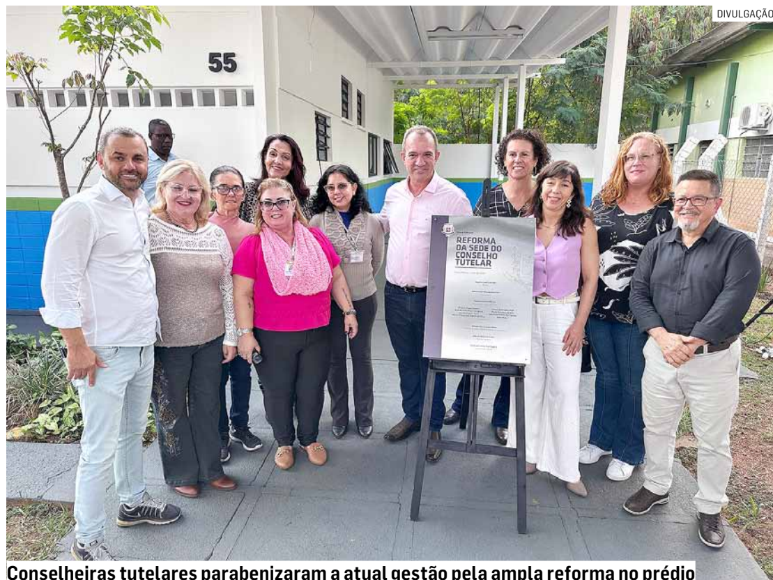
Conselheiras tutelares parabenizaram a atual gestão pela ampla reforma no prédio

“Sou conselheira no quarto mandato, e há anos a gente tentava uma melhora no prédio, e graças a Deus agora aconteceu. Melhorou bastante, a gente tem condições agora de receber as pessoas com mais dignidade, num espaço melhor. Porque quem nos procura já tem os seus problemas, e não podemos atendê-los num espaço cheio de problemas. Só