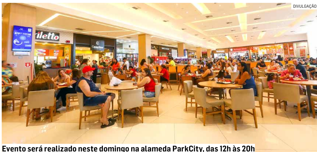
Evento será realizado neste domingo na alameda ParkCity, das 12h às 20h

Na Feira de Discos do Shopping ParkCity Sumaré, os clientes também poderão apreciar outras coleções igualmente apaixon-