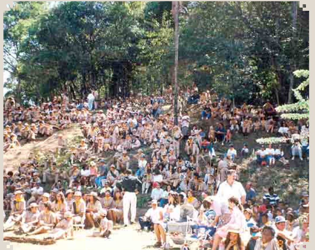
Foto de uma das primeiras edições da festa popular chamada Demolikar, realizada no Horto Florestal de Sumaré. Nos dias atuais essa competição seria proibida nesse local, em nome do meio-ambiente. Registro da década de 1980.