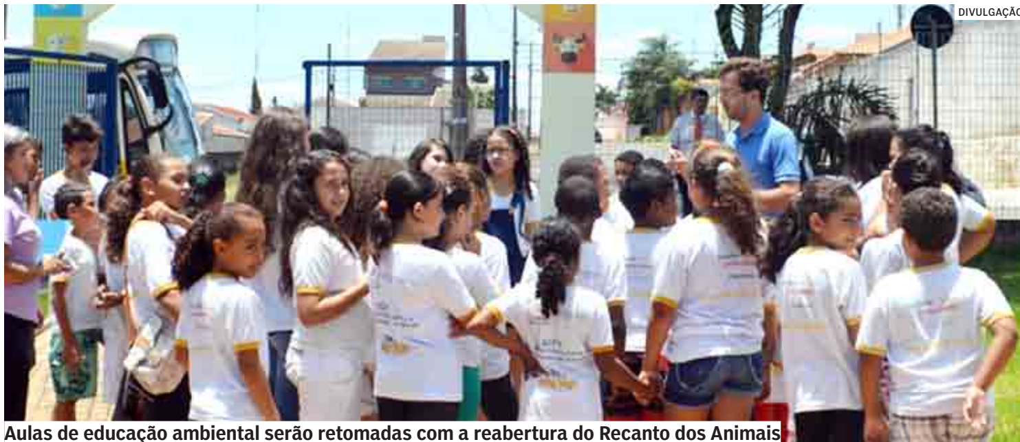
Aulas de educação ambiental serão retomadas com a reabertura do Recanto dos Animais

do executados com mão de obra própria. As benfeitorias incluem o cercamento dos recintos dos animais criados no espaço; troca das tampas existentes no chão e pintura em geral. Itens de segurança também serão instalados no local. O atrativo do espaço é a criação de bodes, cabras, ovelhas, mini-bois, patos, coelhos e gansos, que chamavam