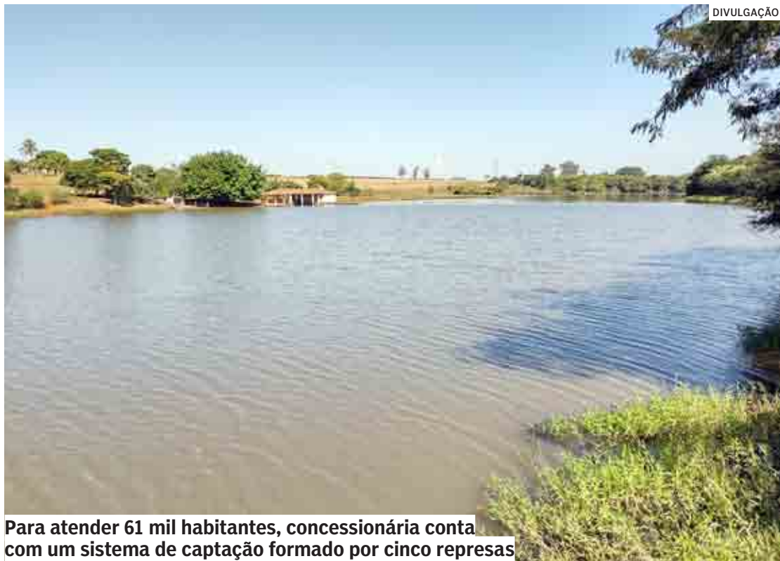
Para atender 61 mil habitantes, concessionária conta com um sistema de captação formado por cinco represas

Medição realizada na sexta-feira (3) apontou que o nível dos reservatórios de Nova Odessa está em 80,22%, acima dos dois últimos anos