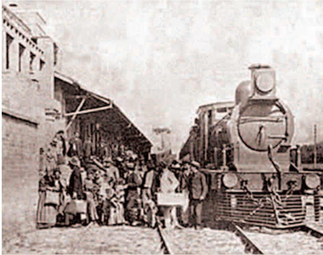
Hospedaria dos Imigrantes: chegada dos imigrantes em São Paulo

A Itália era uma nação pobre no final do século XIX. A maior parcela de sua população vivia no campo, baseada em latifúndios, principalmente na Sicília, no Vale do Rio Pó e no sul do país. O país vivia um período instável; as forças locais se concentravam no movimento de unificação e consolidação política da península. A produção agrícola diminuía e esse fato provocava um êxodo em direção a outros países. O instável governo