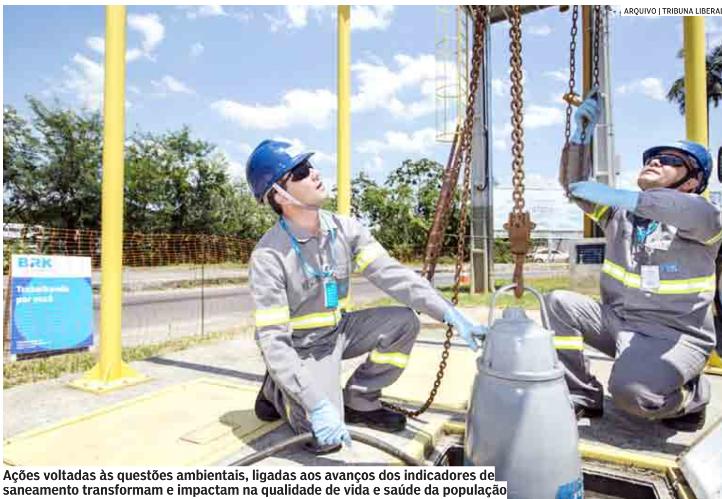
Ações voltadas às questões ambientais, ligadas aos avanços dos indicadores de saneamento transformam e impactam na qualidade de vida e saúde da população

A preservação ambiental é fundamental para a sobrevivência das futuras gerações e a BRK, concessionária responsável pelos serviços de água e esgoto em Sumaré destaca a importância de ações voltadas às ques-