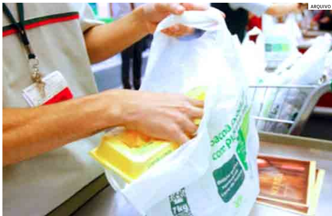
Poluição plástica: sacolinhas de supermercado são citadas como vilãs do meio ambiente porque viram micropásticos, contaminam o solo, rios e mares

“O problema não é o plástico em si, ele é útil no nosso dia a dia. O proble-