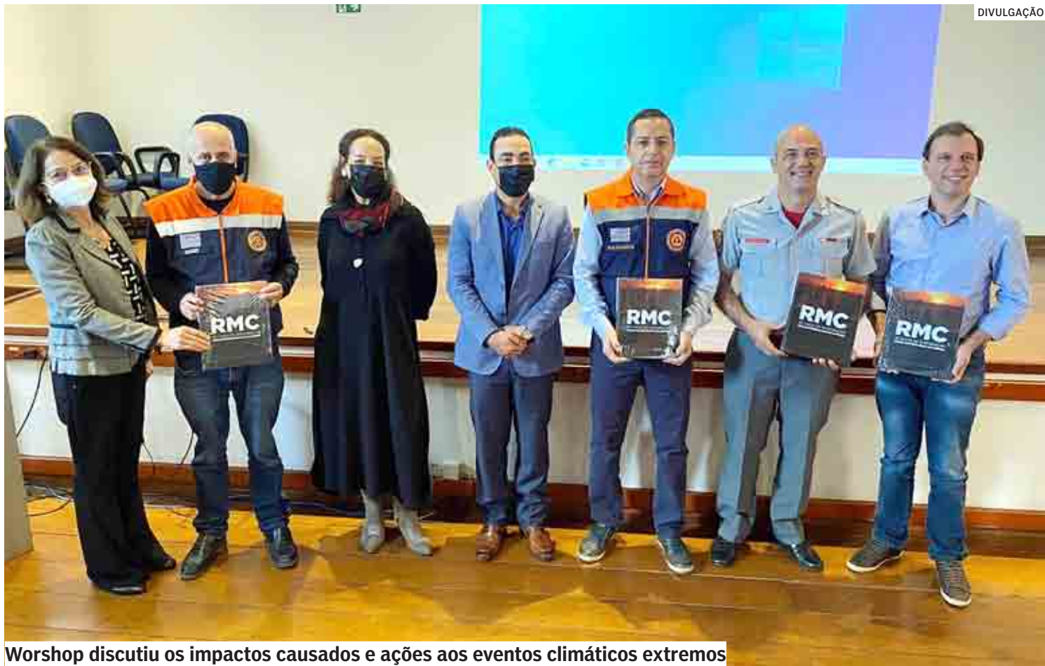
Workshop discutiu os impactos causados e ações aos eventos climáticos extremos

O IL (Instrumento de Liberação) já foi assinado entre as partes, o que permite à Unicamp iniciar o processo de licitação para a compra do radar.